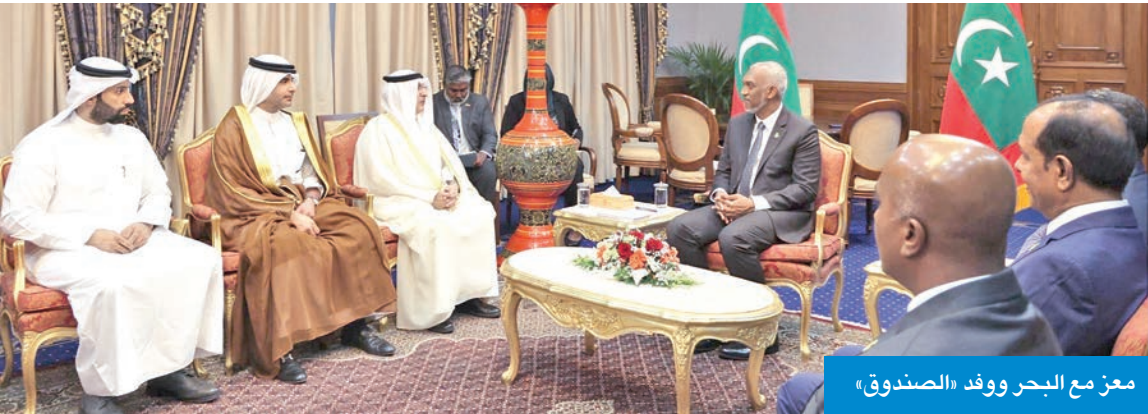
معز مع البحر ووفد «الصندوق»

الاحتفالات الجمهورية بذكرى استقلالها، وفي يوم يشهد كذلك افتتاح مشروع توسعة مطار فيلانا الدولي في العاصمة ماليه، برعاية وحضور الرئيس معز، وهو المشروع الذي يساهم الصندوق الكويتي للتنمية في تمويله ضمن جهوده لدعم قطاع النقل الحيوي في البلاد. وأعرب رئيس المالديف خلال اللقاء عن بالغ شكره وتقديره لدولة الكويت، مشيداً بالدور الريادي الذي يقوم به