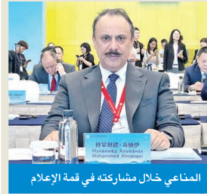
المناعي خلال مشاركته في قمة الإعلام

المناعي شارك في قمة الإعلام لدول منظمة شنغهاي للتعاون