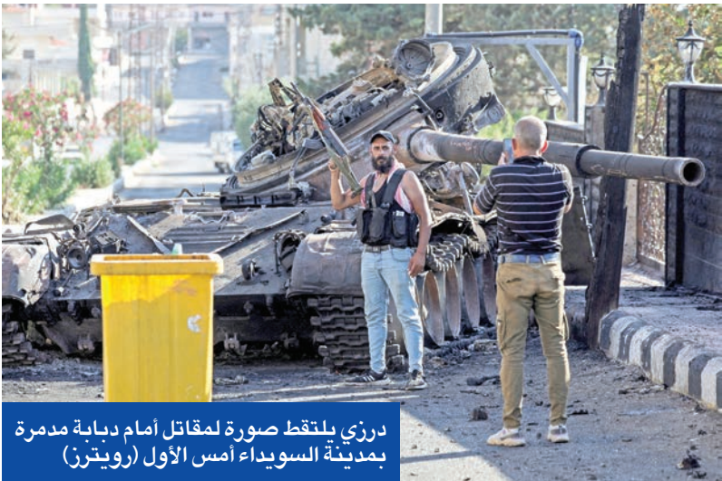
درزي يلتقط صورة لمقاتل أمام دبابة مدمرة بمدينة السويداء أمس الأول

بموازاة ذلك، كشف مصدر دبلوماسي أن اللقاء