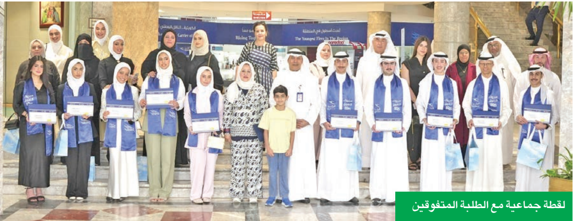
لقطة جماعية مع الطلبة المتفوقين

الطلوحهم وأحلامهم باعتبارهم أعلى الدرجات، حيث إن التميز الذي حققوه اليوم بفضل الله، ثم بفضل جهودهم ودورهم الحثيث في توفير وتهيئة كل وسائل الراحة لهم في أداء مهمتهم الدراسية، ففكرتهم اليوم هو إنجاز مستحق للجميع». واختتم كلمته: «(الكويتية) ليعلو بكمائة وطننا الغالي». وتابع الفقعان: «للا أسرة دور فعال وبارز فيما وصل إليه هؤلاء الطلبة المتميزون من تفان واجتهاد على مدار السنوات الماضية، حتى حققوا