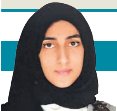
سارة صالح الراشد

تحية لهذا الدبلوماسي الراحل الذي سكن في عرويته وأخلص لمبادئه وأحب الكويت وأحبته، وتمنياتنا له بالتوفيق في مهامه المستقبلية.