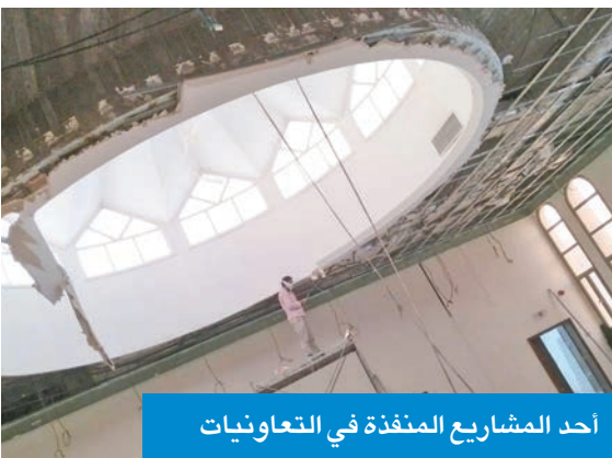
أحد المشاريع المنفذة في التعاونيات

وكشف مرزوق أن الإدارة تقوم بجولات تفتيشية ميدانية خلال الصيف والشتاء، تتضمن متابعة كفاءة التكيف والتلاجات وجاهزية العوازل لموسم الأمطار، مشيراً إلى أن الوزارة تملك الصلاحية لتحديد مشاريع دون الرجوع إلى الإدارة، أو عدم صيانة المباني والمنشآت، أو الامتناع عن الاستجابة للإبانات، أو عدم تزويد المفتشين بالمعلومات المطلوبة.