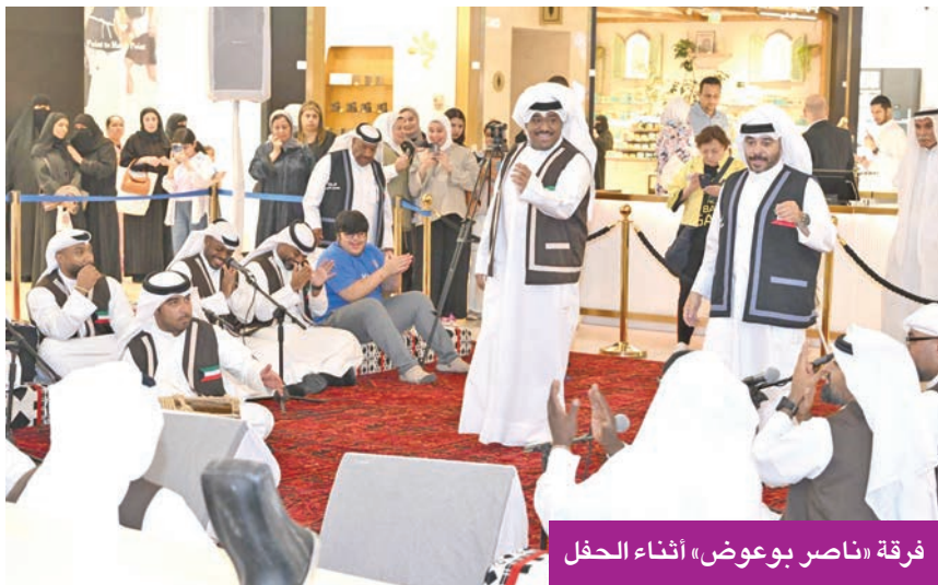
فرقة «ناصر بوعوض» أثناء الحفل

في إطار فعاليات مهرجان «صيفي ثقافي 17»، الذي ينظمه المجلس الوطني للثقافة والفنون والآداب، قدمت فرقة ناصر بوعوض للفنون الشعبية أمسية تراثية في مجمع ذا غيت مول، استقطبت حضوراً جماهيرياً من محبي الفنون الشعبية الكويتية. انطلقت الفعالية بعرض لافت في قلب المجمع، حيث انتشر أعضاء الفرقة بمعداتهم والأتهم الموسيقية، ليبدعوا في تقديم فقرات مزجت بين الغناء الحي والاستعراضات التراثية، في لوحة فنية تنبض بالأصالة، وتعكس ثراء الهوية الثقافية الكويتية، وعمق ارتباطها بالوجدان الشعبي.