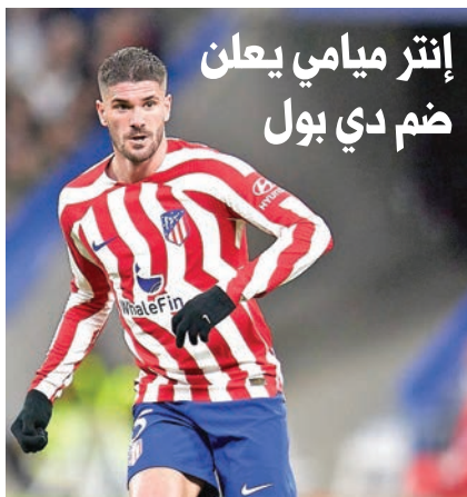
إنتر ميامي يعلن ضم دي بول

بات نابولي وغلطة سراي، بطلا الدوريين الإيطالي والتركي لكرة القدم توالياً، قريبين جداً من حسم صفقة حصول الأخير على خدمات المهاجم النيجيري فيكتور أوسيمهن نهائياً، حسبما أفادت التقارير الإعلامية. وتوج أوسيمهن الموسم الماضي بلقب الدوري التركي بالوان غلطة سراي، الذي انتقل إليه في سبتمبر على سبيل الإعارة من نابولي من دون خيار الشراء، بعدما دخل في صدام مع إدارة النادي الجنوبي لرغبته في عدم مواصلة اللعب معه. وانضم ابن الـ 26 عاماً لغلطة سراي بعدما وجد نفسه من دون بديل آخر، نتيجة إقفال باب الانتقالات الصيفية في أوروبا قبل التوصل إلى اتفاق مع أي فريق، وتالف في صفوفه بتسجيله 37 هدفاً مع 8 تمريرات حاسمة في 41 مباراة خاضها في كل المسابقات، بينها 26 في الدوري. ورغم الحديث عن رغبة أندية عدة في الحصول على خدمات النيجيري، بينها يوفنتوس