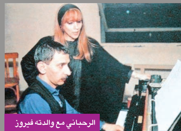
الرحباني مع والدته فيروز