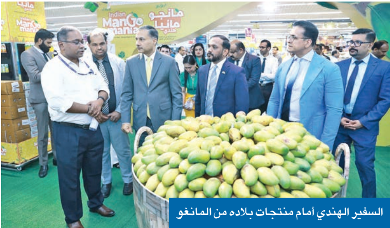
السفير الهندي أمام منتجات بلاده من المانجو

للغرفة، بهدف تعزيز فرص التعاون التجاري، وأشار سوايكا إلى أن الكويت تعد من بين أبرز 5 وجهات لصادرات المانجو الهندي، إذ بلغت قيمة واردات المانجو من الهند نحو 3 ملايين دولار العام الماضي. واختتمت الفعاليات بمهرجان مانجو مفتوح للجمهور، حضره عدد من المسؤولين