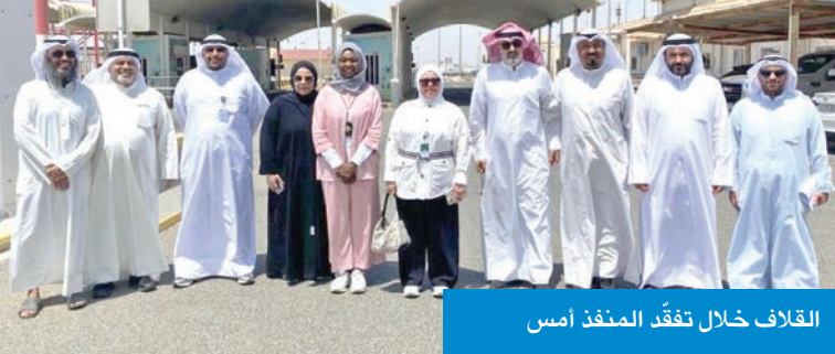
الغلاف خلال تفقد المنفذ أمس

الرقابة الميدانية، وتطوير بيئة العمل الجمركي، ورفع مستوى التنسيق مع الجهات ذات الصلة، لضمان تحقيق أعلى درجات الكفاءة والانضباط.