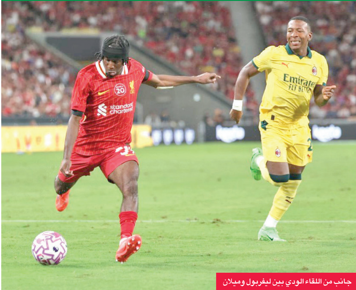
جانب من اللقاء الودي بين ليفربول وميلان

جيد في الموسم الماضي. والآن، أشعر أنني جاهز لاتخاذ خطوة أكبر واللعب في أعلى المستويات، وأن أطوّر نفسي، وأن أرى ما يمكنني فعله». وتابع: «لهذا السبب أعتقد أن هذا هو التوقيت المناسب واللحظة المثالية للانضمام للليفربول».