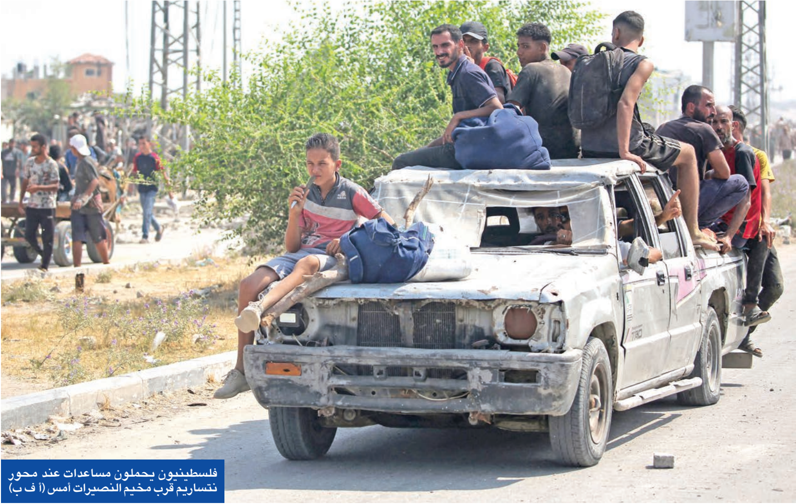
فلسطينيون يحملون مساعدات عند محور نتساريم قرب مخيم النصيرات أمس

واستبداله بسردية إنسانية عادلة تعترف بالحقوق، انطلاقاً من مبدأ الكرامة المتبادلة، وتدعو منصة المؤتمر المجتمع الدولي إلى الانتقال من خطاب الإدانة لخطاب الاعتراف، ومن مرحلة إدارة الأزمة إلى تنفيذ حل الدولتين خيار واقعي لضمان الأمن للجميع وعبر دعم السلطة الفلسطينية المتمركزة في رام الله بالصفه الغربية المحتلة.