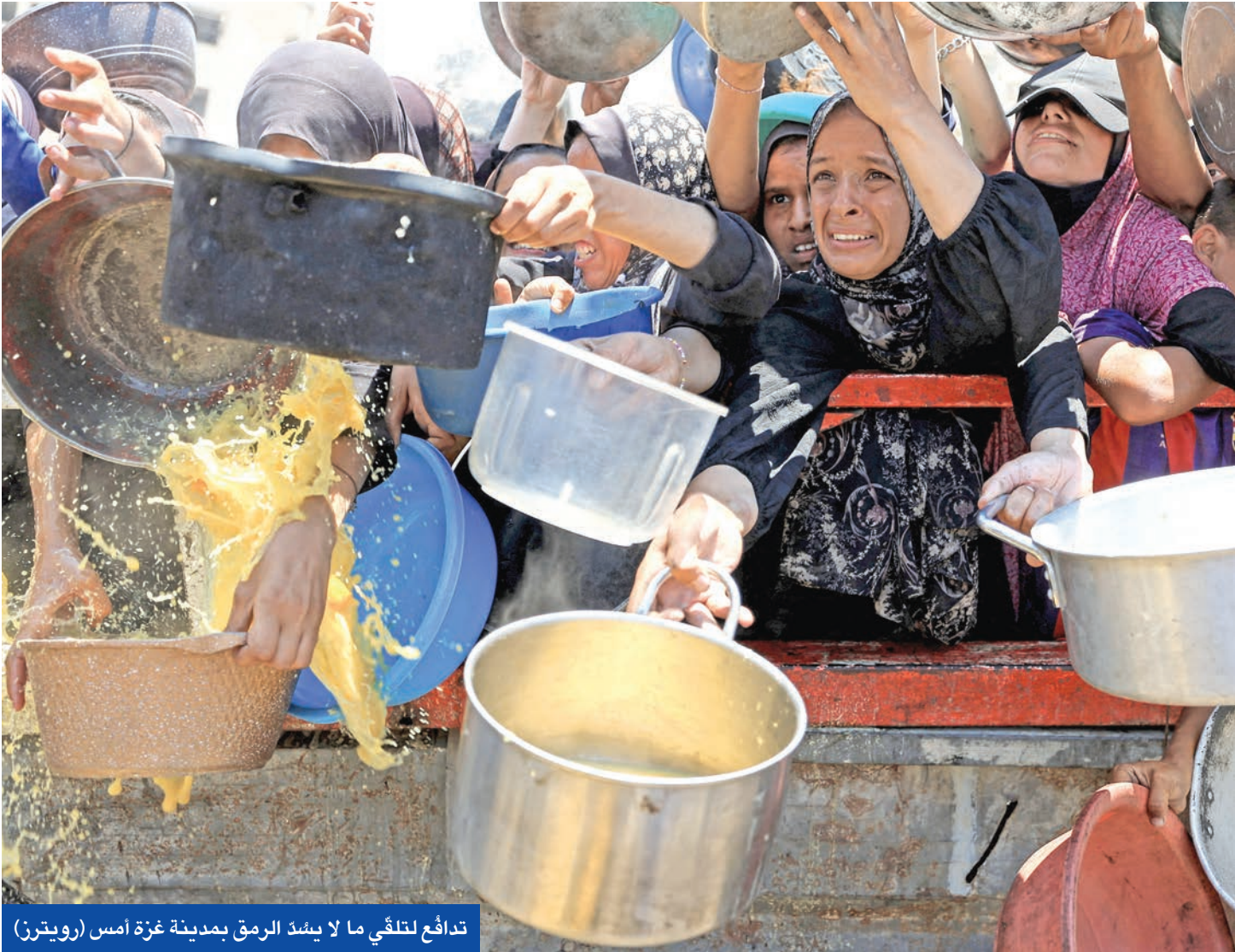
تدافع لتلقي ما لا ينشذ الرمي بمدينة غزة أمس

في السياق، لَوَّح الاتحاد الأوروبي برفض عقوبات على إسرائيل في حال لم تلتزم باتفاق تم التوصل إليه مع التكتل بشأن تحسين الوضع الإنساني في غزة. وقال المتحدث باسم المفوضية الأوروبية، إن الوضع الإنساني في القطاع «لا يزال خطيراً». وقالت المفوضية إن الاتحاد يقيم الوضع حالياً، وأن جميع الخيارات لا تزال متروحة إذا لم تلتزم إسرائيل باتفاق تحسين الوضع الإنساني في غزة. ووقع 60 نائباً في البرلمان الأوروبي رسالة طالبوا فيها بـ «تحرك فوري إزاء الوضع الإنساني الكارثي»، ودعوا لـ «تقديم حزمة عقوبات ضد إسرائيل لاعتمادها في مجلس الشؤون الخارجية للاتحاد» واقترحوا «فرض عقوبات على مؤسسة غزة الإنسانية وأفراد يعملون فيها». أكدوا أن «التاريخ لن يرحم صمت الاتحاد الأوروبي وتواطؤه في مواجهة المجاعة والإبادة، وترك الفلسطينيين للجوع والقتل».