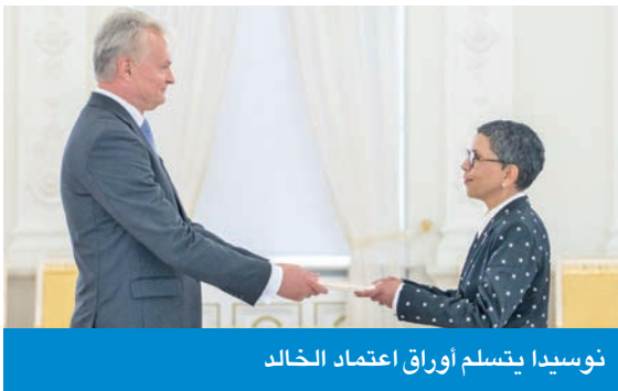
نوسيدا يتسلم أوراق اعتماد الخالد

قدمت سفيرة الكويت لدى ألمانيا ريم الخالد أوراق اعتمادها إلى رئيس جمهورية ليتوانيا غيتاناس نوسيدا سفيراً غير مقيم للكويت في العاصمة فيلنيوس. وقالت الخالد، لـ«كونا»، بعد إجراء مراسم تقديم أوراق الاعتماد في القصر الرئاسي، إنها «نقلت للرئيس نوسيدا تحيات سمو أمير البلاد الشيخ مشعل الأحمد، وتمنيات سموه الصادقة لجمهورية ليتوانيا وشعبها الصديق بدوام التقدم والازدهار». وأكدت حرص الكويت على تعزيز علاقاتها مع ليتوانيا، واستكشاف فرص التعاون بالمجالات ذات الاهتمام المشترك بما يسهم في دفع العلاقات بين البلدين نحو آفاق أوسع. وأوضحت أن الكويت تتطلع إلى تطوير شراكة بناءة مع ليتوانيا، تقوم على تعزيز التعاون السياسي والاقتصادي والثقافي بما يخدم المصالح المتبادلة ويرسخ علاقات الصداقة بين البلدين.