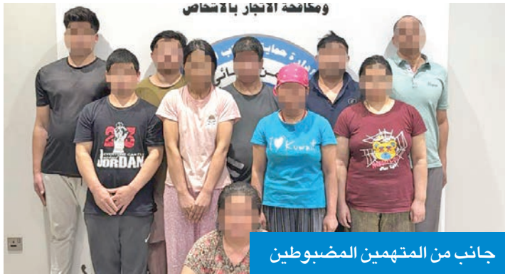
جانب من المتهمين المضبوطين

المتورطون 30 متهماً من الذكور و22 من الإناث ينتمون لجنسيتين أسيويتين