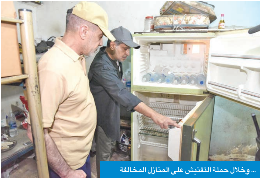
...وخلال حملة التفتيش على المنازل المخالفة