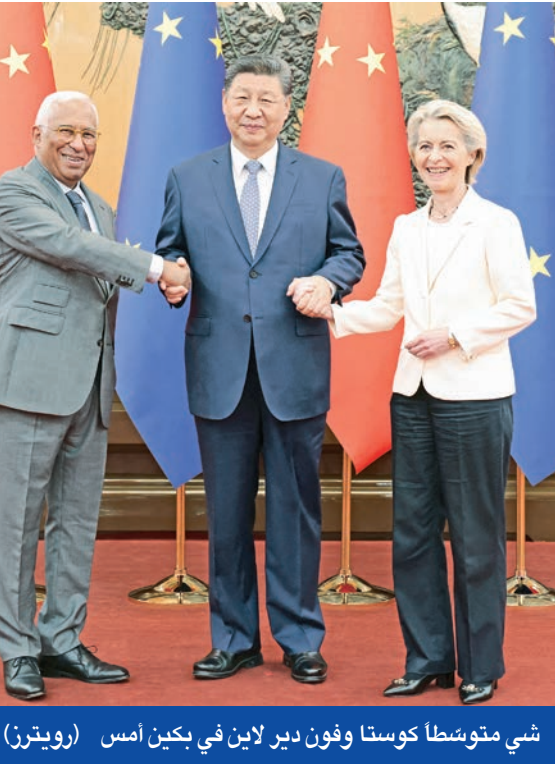
شي متوسطاً كوستا وفون دير لاين في بكين أمس

أكد الرئيس الصيني شي جين بينغ، خلال لقائه رئيس المجلس الأوروبي أنطونيو كوستا، ورئيسة المفوضية الأوروبية أورسولا فون دير لاين، في بكين، ضرورة التمسك بالانفتاح والتعاون بين الصين والاتحاد الأوروبي، وإدارة الخلافات بشكل مناسب، بما يسهم في تعزيز الاستقرار العالمي، وسط تحديات دولية متصاعدة. وشدد شي على أن «الاعتماد المتبادل ليس مخاطرة، وتلاقي المصالح لا يشكل تهديداً»، محذراً من أن سياسات «فك الارتباط» وقطع سلاسل الإمداد لن تؤدي إلا إلى العزلة. وأكد أن تقليل الاعتماد لا يجب أن يقلل من مستوى التعاون، داعياً إلى تعزيز الشراكة الخضراء والرقمية، وزيادة الاستثمارات المتبادلة، وتهيئة بيئة أعمال منفتحة للشركات الصينية في أوروبا. وتزامناً مع الذكرى الـ 50 لإقامة العلاقات الدبلوماسية بين الجانبين، قال شي إن العلاقات الصينية -الأوروبية تقف عند مفترق طرق تاريخي، داعياً إلى قرارات استراتيجية تحقق تطعات الشعوب وتصدد أمام اختيارات الزمن. وفي سياق منفصل، أعلن المتحدث باسم وزارة الخارجية الصينية أن رئيس مجلس الدولة لي تشيانغ سيحضر ويليقي كلمة في افتتاح مؤتمر الذكاء الاصطناعي العالمي 2025، والاجتماع رفيع المستوى حول الحوكمة العالمية للذكاء الاصطناعي، والمقرر عقدهما في 26 يوليو في مدينة شنغهاي.