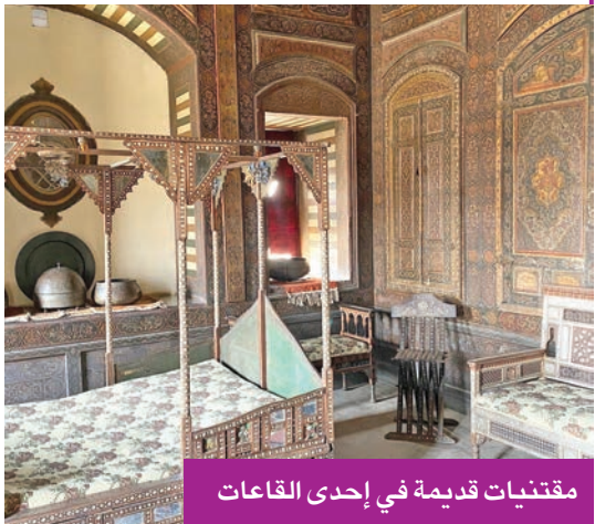
مقتنيات قديمة في إحدى القاعات