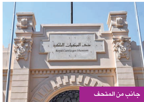
جانب من المتحف