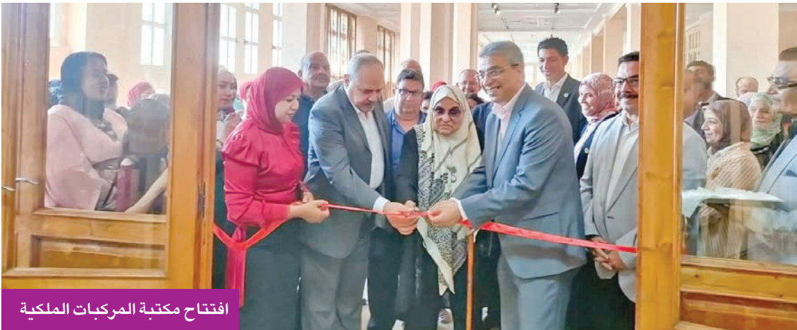
افتتاح مكتبة المركبات الملكية

اللغات، لافتة إلى التعاون مع ذوي الهمم لإثراء المكتبة بكتب برايل، كما تُعلن مشروع قاعدة بيانات إلكترونية لتوثيق المحتوى، مع رموز تعريفية تخلّد ذكرى الأسرة العلوية.