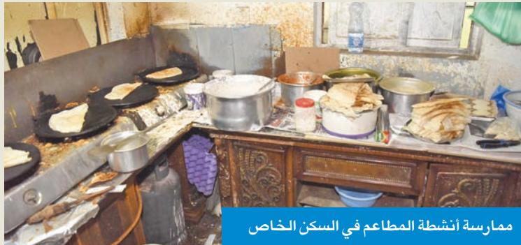
ممارسة أنشطة المطاعم في السكن الخاص

خصوصا أن القائمين على إدارة هذه المواقع هدفهم الأول هو الربح المادي، غير مباليين بالمخاطر الجمة التي تحيط بقاطني هذه العشوائيات، وتأثيرها السلبى على كل الخدمات المقدمة من قبل الدولة.