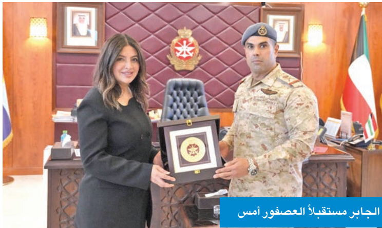
الجابر مستقبلاً العصفور أمس

استقبل نائب رئيس الأركان العامة للجيش، اللواء الركن الطيار صباح الجابر، في مكتبه صباح أمس، مديرة بلدية الكويت بالتكليف المهندسة مثال العصفور. وجرى خلال اللقاء مناقشة أهم الأمور والمواضيع ضمن محور الزيارة وبحث سبل التعاون المشترك بين الجيش والبلدية.