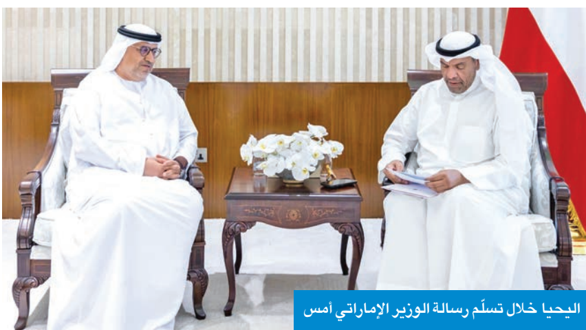
اليحيا خلال تسلم رسالة الوزير الإماراتي أمس

تسلم وزير الخارجية، عبدالله اليحيا، رسالة خطية من وزير الدولة لشؤون الشباب نائب رئيس مركز الشباب العربي في دولة الإمارات العربية المتحدة، الدكتور سلطان النيادي، تتصل بتهنئة البيئة المناسبة لتطوير القيادات الدبلوماسية العربية الشابة في مختلف الميادين التنموية. جاء ذلك خلال استقبال اليحيا سفير دولة الإمارات العربية المتحدة لدى الكويت، الدكتور مطر النيادي، أمس، في ديوان عام الوزارة.