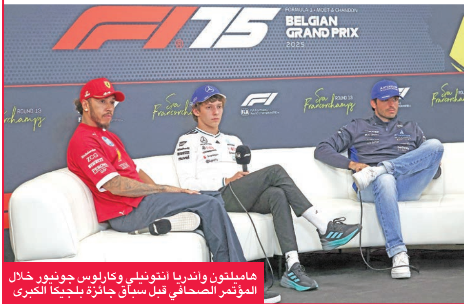
هاميلتون وأندريا انتونيلي وكارلوس جونور خلال المؤتمر الصحافي قبل سباق جائزة بلجيكا الكبرى

فيراري الحالي الصعود على المنصة للمرة الأولى مع فريقه الجديد الذي يخوض سباق بلجيكا بعد تطوير سيارته. حل هاميلتون (40 عاماً) رابعاً على أرضه وراء الألماني نيكو هولكنبرغ الذي صعد إلى المنصة للمرة الأولى بعد 239 محاولة، ليعزّز زخم فريق ساوبر قبل أن يتحول إلى أودي العام العام المقبل. (أ ف ب)