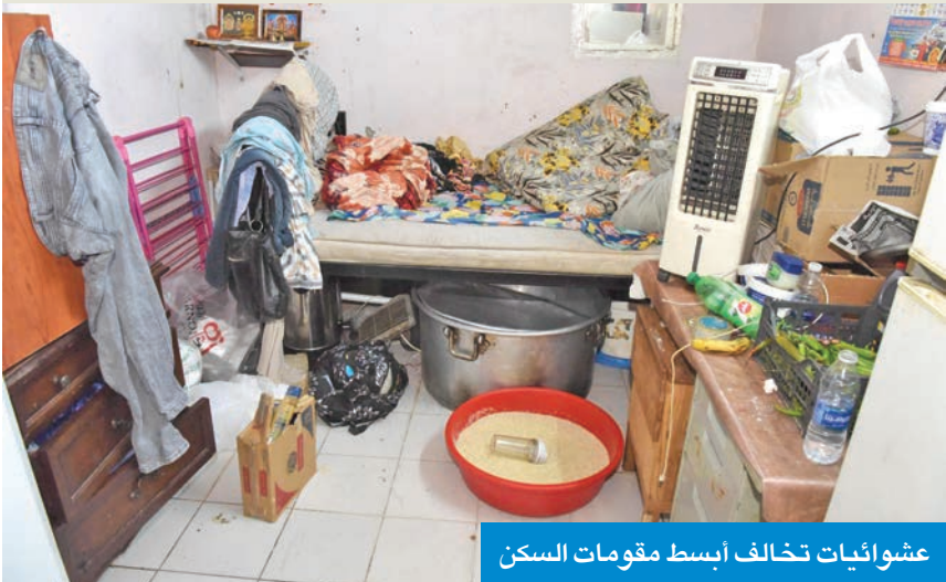
عشوائيات تخالف أبسط مقومات السكن