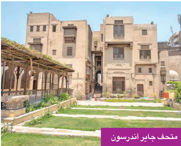
متحف جاير أندرسون