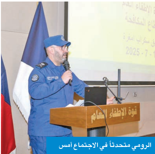
الرومي متحدتاً في الاجتماع أمس

«الإطفاء العام» إلى تعزيز القدرات الفنية، ورفع كفاءة الأداء الميداني من خلال مراجعة التجارب الميدانية، وتطوير خطط الإدارة الإستراتيجية، ووضع خطة للإطفاء استقبل طلبات الراغبين في الالتحاق بأول دورة لضباط الاختصاص من حملة الشهادة الجامعية، موضحة أن التسجيل يبدأ الثلاثاء المقبل، حتى الخميس الموافق 7 أغسطس المقبل، في التخصصات التالية: هندسة مدنية، هندسة كهربائية، إدارة موارد بشرية، إعلام وعلاقات عامة، هندسة كمبيوتر، إدارة، حقوق، رياضيات، تمويل ومحاسبة.