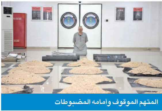
المتهم الموقوف وأمامه المضبوطات

وصولها إلى البلاد. وأشادت وزارة الداخلية بالتعاون والتنسيق المثمر بين الأجهزة المشاركة في هذه الضبطة النوعية، كما أكدت مواصلة حملاتها وجهودها المكثفة لملاحقة مهربي وتجار المخدرات، مشددة على أنها لن تتهاون مع كل من تسول له نفسه تهديد أمن الوطن وسلامة أبنائه.