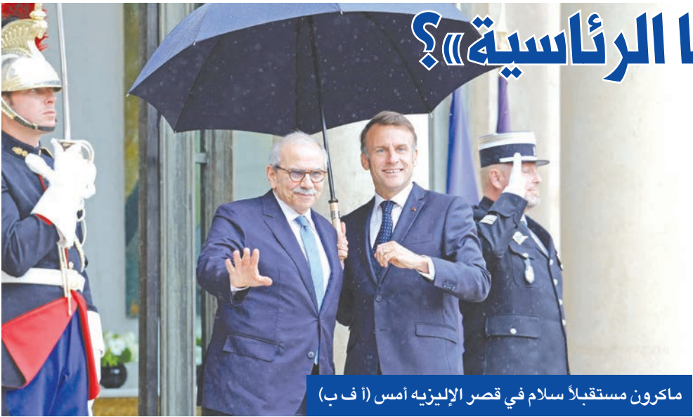
ماكرون مستقبلاً سلام في قصر الإليزيه امس