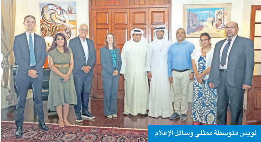
لويس متوسطة ممثلي وسائل الإعلام

حكومة المملكة المتحدة، والتي تزامنت مع الذكرى السبعين لتأسيس الهيئة العامة للاستثمار، حيث شهد توقيع شراكة استثمارية استراتيجية. وأشارت إلى أن سمو الأمير قام بـ 5 زيارات للمملكة المتحدة خلال فترة عملها، في حين استقبلت الكويت 4 وزراء من الحكومة البريطانية، من بينهم وزير الخارجية الحالي ديفيد رامي، إلى جانب عدد من الوزراء وكبار المسؤولين ودوق إدنبرة. وأعربت لويس عن فخرها بأن خليفة، ديسي رشيد، والذي من المقرر أن يصل في سبتمبر المقبل، سيستمتع بأقامته في الكويت.