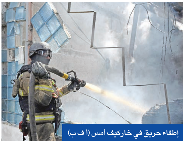
إطفاء حريق في خاركييف أمس

محادثات إسطنبول لا تثمر إلا تبادل أسرى... وواشنطن تمر صفقة أسلحة لكيف