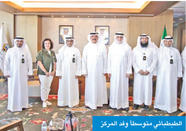
الطببطائي متوسطاً وفد المركز

وأعلنت «التربية»، في بيان، أن هذا اللقاء يأتي في سياق الجهود الرامية إلى توسيع آفاق التعاون مع المؤسسات الخليجية ذات العلاقة، بما يساهم في تطوير العملية