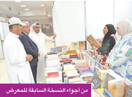
من أجواء النسخة السابقة للمعرض