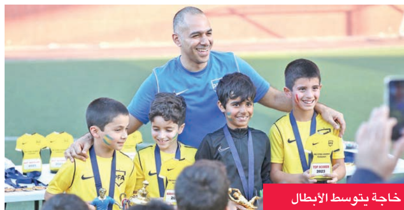
خاجة ينوسط الأبطال

تحت 12 سنة سطرأ مشرفاً في تاريخ الكرة الكويتية، حيث تصدر مجموعته وتأهل لدور الـ16 من أصل 168 فريقاً، ليصبح بذلك أول فريق كويتي يصل إلى هذا المستوى ضمن أفضل عشرة فرق بالبطولة، في إنجاز غير مسبوق على صعيد الأندية، أما فريق تحت