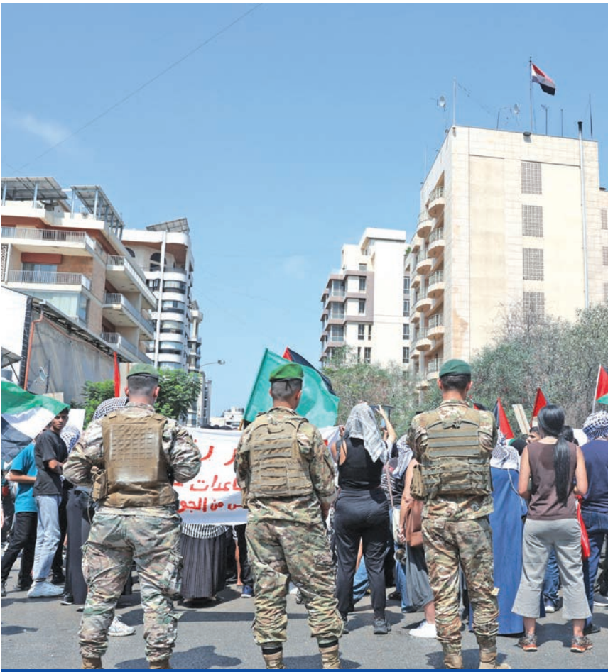
الجيش اللبناني يؤن احتجاجات في بيروت أمس على أزمة الجوع في غزة