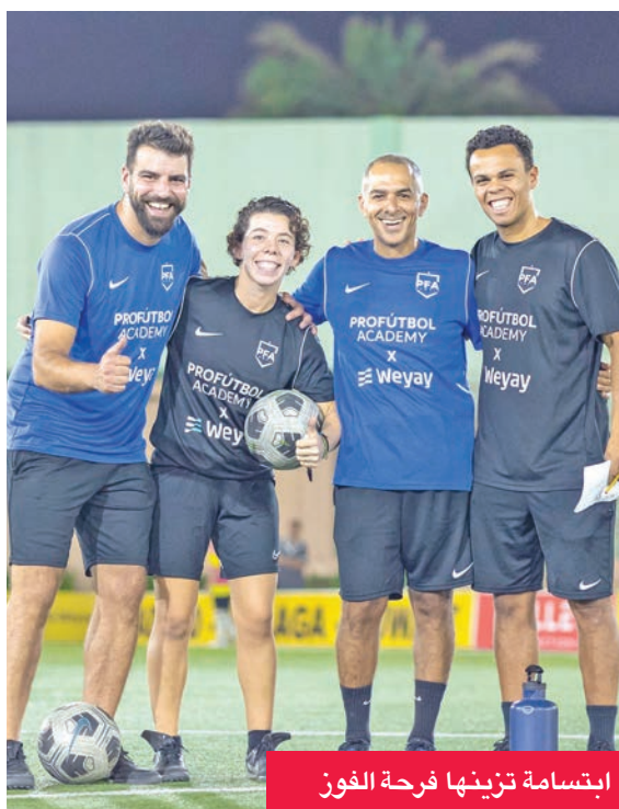
ابتسامة تزيّن فرحة الفوز