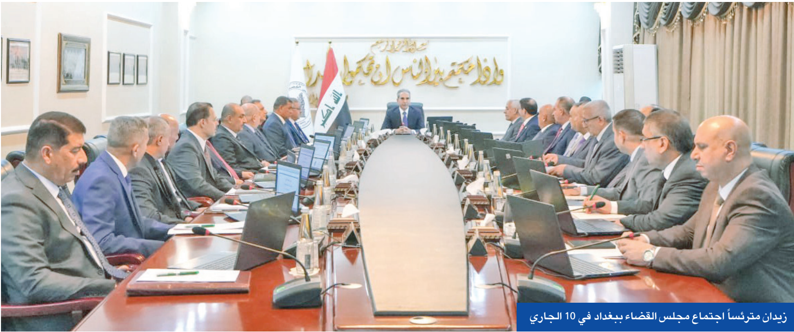
زيدان مترئساً اجتماع مجلس القضاء ببغداد في 10 الجاري

«الاتحادية» تجاوزت صلاحياتها وسعيها لإنهاء معاهدة 2012 سينسف 400 اتفاقية دولية القضاة وسَّعوا اختصاصهم بنص داخلي خالف القواعد واستحوذوا على أدوات محصورة بالتمييز المحكمة ردت الطعن بثبوت شرعية الاتفاق وألغت حكماً قطعياً وأحدثت اضطراباً دبلوماسياً تعاملات الدول محمية بتقييد صارم يضمن الاستقرار ويمنع أي سلطة من التذرع بمفاهيم الإصلاح أو التطور