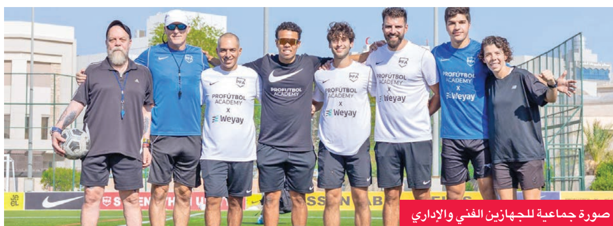
صورة جماعية للجهازين الفني والإداري

وتتمثل رؤية الأكاديمية في بناء قاعدة قوية من اللاعبين القادرين على المنافسة محلياً ودولياً، مع التركيز على تطوير المهارات الفردية والجماعية والتأسيس الفني المستدام. وتشمل خططها المستقبلية: توسيع البرامج التدريبية، وتنظيم بطولات محلية ودولية في الكويت، والمشاركة في البطولات الخارجية، وتعزيز التعاون مع مدارس كرة القدم الأوروبية، بهدف إثراء تجربة اللاعبين والمدربين.