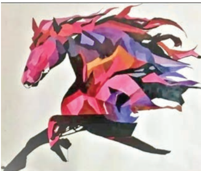
لوحة «قوة التفاؤل» للفنانة الورد المطوع

عملين فنيين يحملان رسائل إنسانية وطاقت تعبيرية عميقة.