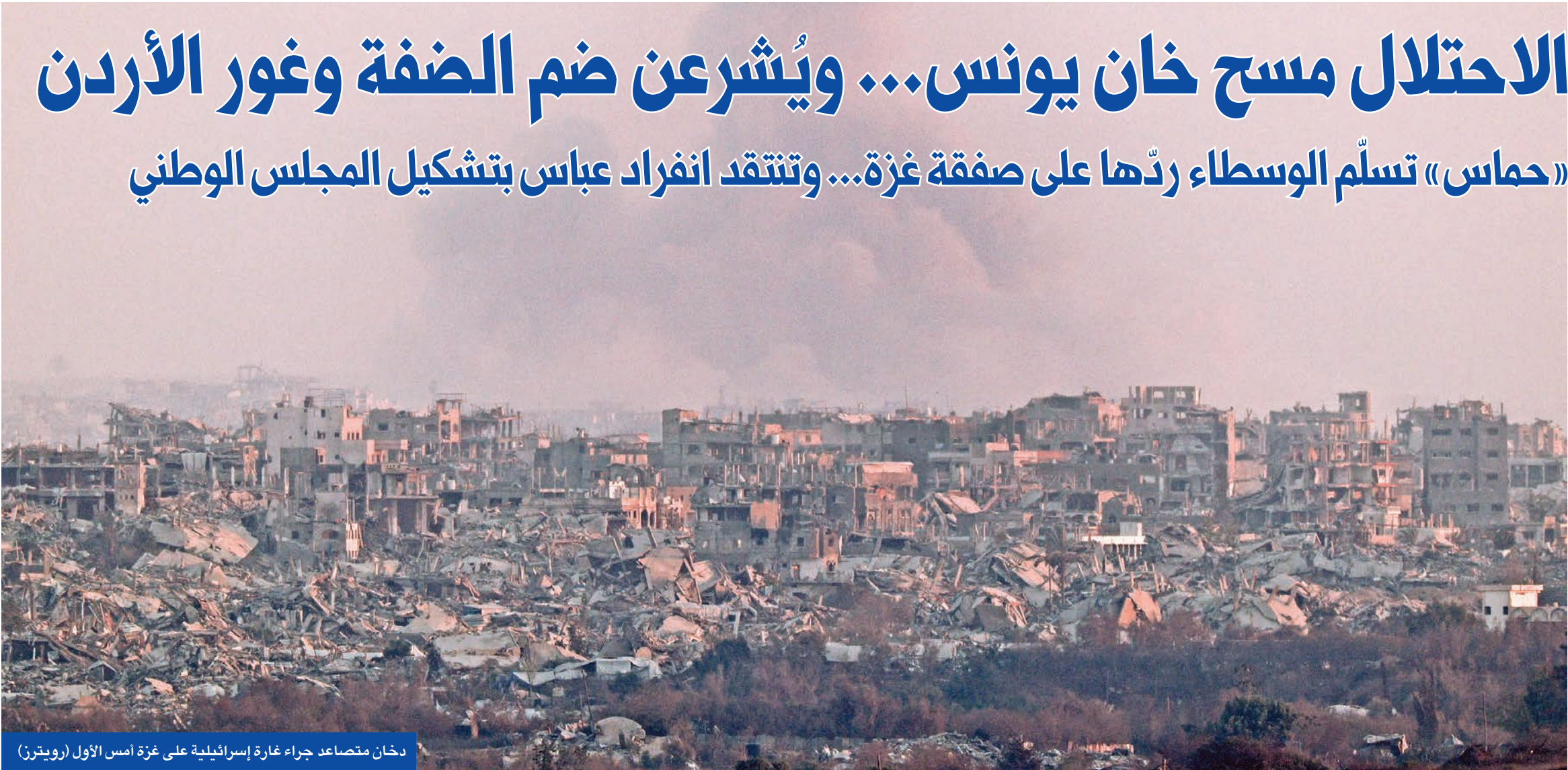
دخان متصاعد جراء غارة إسرائيلية على غزة أمس الأول