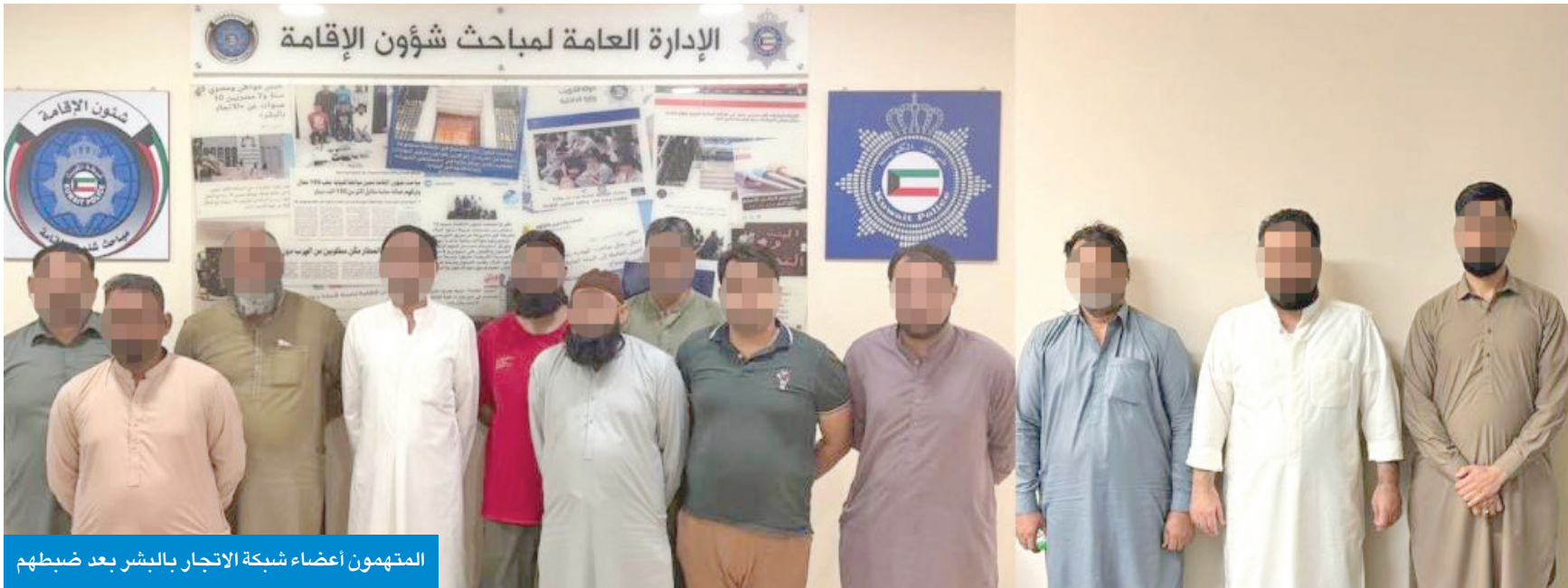
المتهمون أعضاء شبكة الاتجار بالبشر بعد ضبطهم

تمهيدا لاتخاذ الإجراءات القانونية والإدارية بحق جميع من ثبتت تورطه في هذه الشبكة.