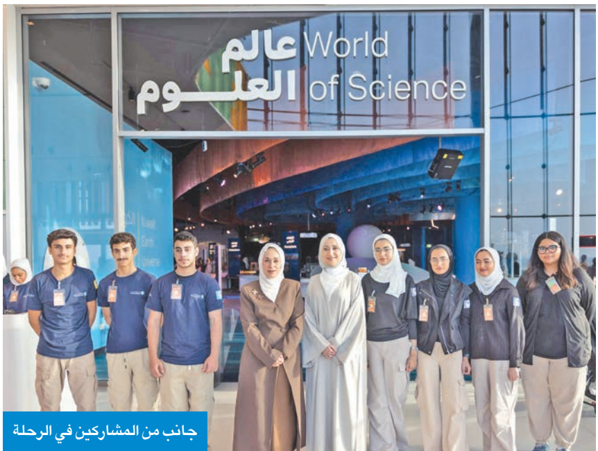
جانب من المشاركين في الرحلة

حريصة على تنويع الأنشطة والبرامج المقدمة لأبنائنا، بما يحقق التوازن بين الجانبين المعرفي والترفيهي، مشيرة إلى أن «هذه الزيارة تأتي في إطار خططنا لتعزيز التجارب التعليمية الحية التي تترك أثراً إيجابياً مستداماً».