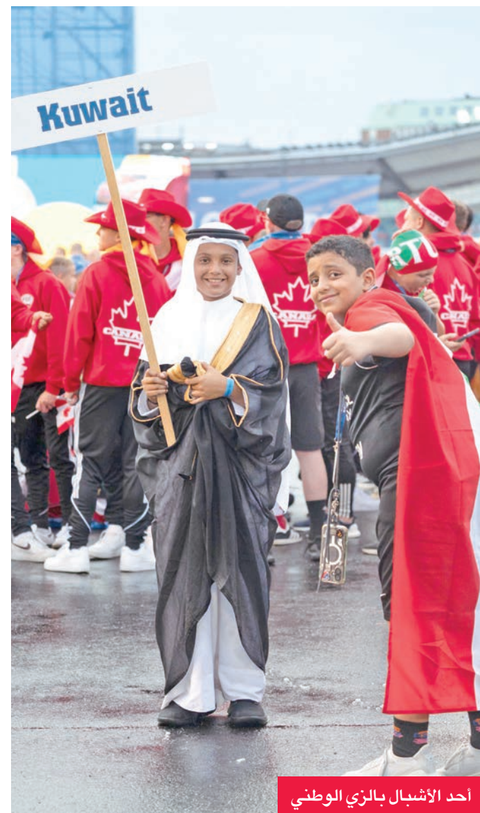
أحد الأندية بالزي الوطني