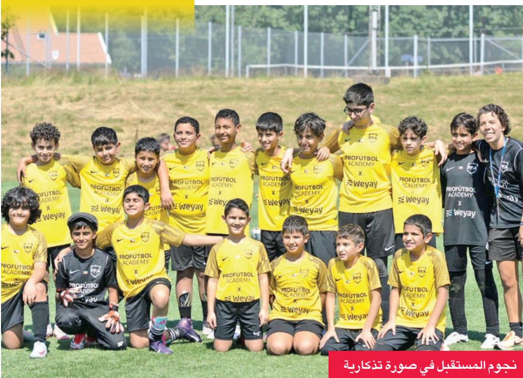
نجوم المستقبل في صورة تذكارية