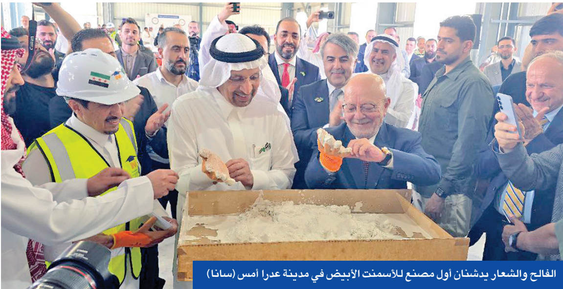
الفالح والشعار يشنان أول مصنع للأسمت الأبيض في مدينة عدرا امس (سانا)

الشيخ سليمان الهوارين، المجموعات المسلحة التابعة للرئيس الروحي لطائفة الموحدين الدروز، الشيخ حكمت الهجري، المسؤولية وقال: «ما حصل بحق أبناء عشائر البدو في السويداء، ريفاً ومدينة، هو جريمة حرب بكل المقاييس على يد عصابات تابعة للهجري الذي دمر كل السلم الأهلي الذي حافظنا عليه منذ أجيال، ما ذنب عائلات مدنية قُتل في منازلها ومزارعها؟ ذنبهم الوحيد أنهم من أبناء العشائر والعرب، لقد قتل في مدينة شهبيا 16 شخصاً بينهم 6 من عائلتي واختطاف 10 أشخاص لا نعلم مصيرهم، وليس ذلك فقط، بل قتل 40 شخصاً أغلبهم نساء وأطفال وهم عمال زراعيون من محافظات دير الزور والحسكة وريف دمشق يعملون في الزراعة.»