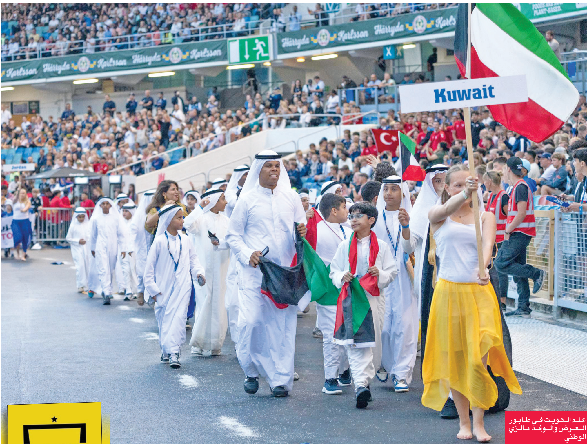
علم الكويت في طابور العرض والوفد بالزي الوطني

في خطوة مشرفة تعكس تطور الأكاديميات الرياضية الكويتية، شاركت أكاديمية Profutbol في بطولة قوتيا العالمية، المقامة في السويد، ممثلة للكويت رياضياً وثقافياً، ومحقة إنجازاً غير مسبوق على مستوى الأندية، وسط حضور جماهيري عالمي تجاوز 70 ألف متفرج.