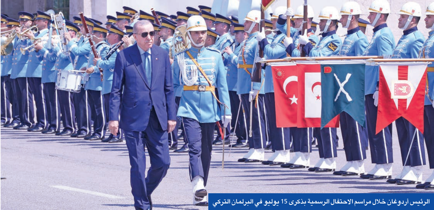
الرئيس أردوغان خلال مراسم الاحتفال الرسمية بذكرى 15 يوليو في البرلمان التركي

15 يوليو 2016 لم تكن ليلة عادية في حياة الشعب التركي، بل أصبحت حدثاً تاريخياً في مسيرة الدولة، وسيظل يوماً محفوراً في ذاكرة الأتراك ومستقبل الأجيال القادمة، قاد فيه الشعب اختباراً صعباً ومعاركة حاسمة انتصرت فيها الإرادة الشعبية على من أراد أن يخطف حريته وديمقراطيته.