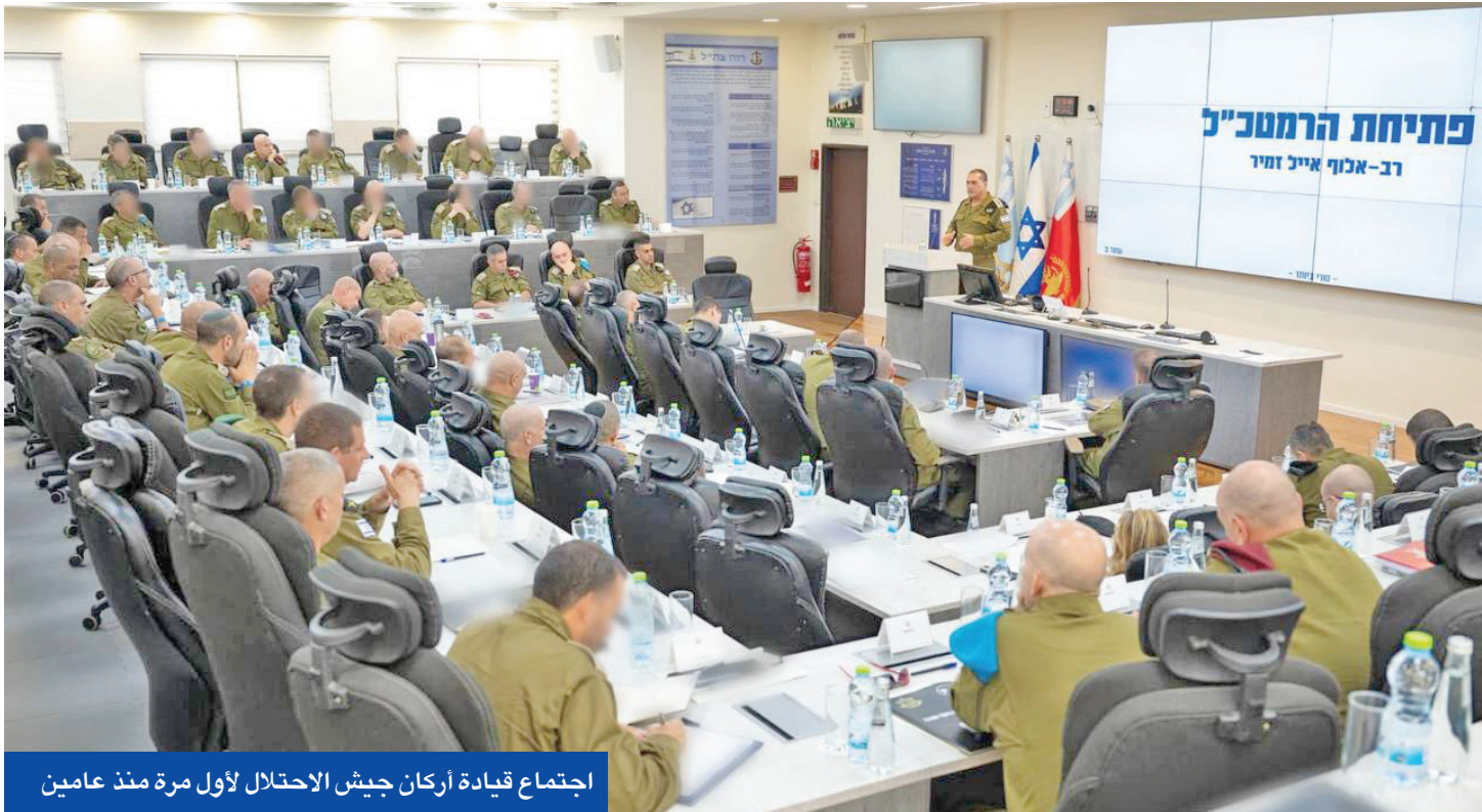
اجتماع قيادة أركان جيش الاحتلال لأول مرة منذ عامين

وستتدخل بشكل مباشر إذا حدثت مثل هذه المحاولة. من جهتها، جدت واشنطن امتعاضها من التصعيد الإسرائيلي في سورية. وقالت المتحدة باسم البيت الأبيض للرئيس دونالد ترامب «فوجئ بالغايات على دمشق والسويداء»، وسارع للاتصال بنتنياهو وسامح لدم سورية الموحدة المستقرة، في وقت تواصل المشاورات السياسية بين عمان ودمشق لتثبيت وقف إطلاق النار وضمان عودة النازحين.