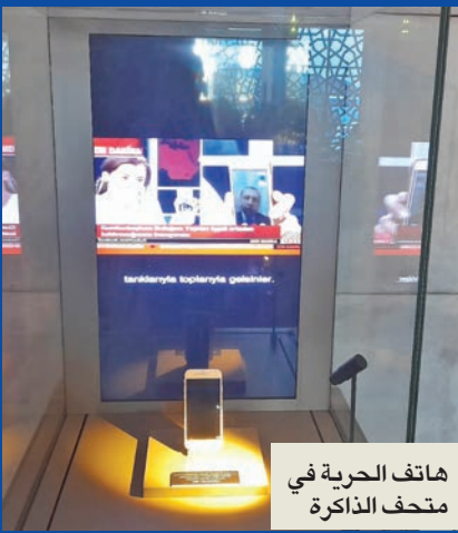
هاتف الحرية في متحف الذاكرة

هاندا فرات، التي أجرت الحوار الشهير مع الرئيس رجب طيب أردوغان ليلة الانقلاب، عبر تطبيق FaceTime، والذي دعا فيه الشعب إلى النزول للشوارع والساحات لحماية الديمقراطية، وكانت بمنزلة نقطة تحول أدت إلى مواجهة الانقلابيين وكسر الانقلاب.