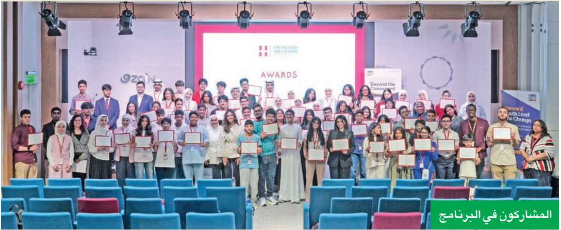
المشاركون في البرنامج

منصة تمكين للياfecين أبناء الموظفين لخوض رحلة تعليمية