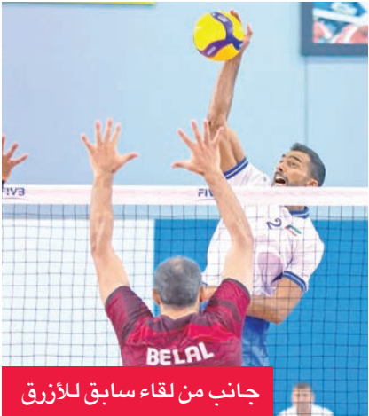
جانب من لقاء سابق للأزرق