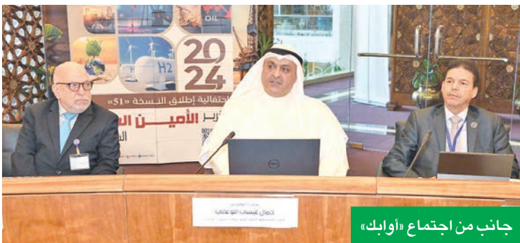
جانب من اجتماع «أوابك»

على الوجود متأثرا بزيادة مبيعات المركبات الكهربائية، وضعف بيانات التصنيع في أوروبا. وذكر أن النشاط فوق المتوسط للأعاصير ساهم بشكل كبير في تعطيل البنية التحتية للطاقة في الولايات المتحدة الأميركية، وبالنسبة للغاز الطبيعي، أكد اللوغاني أن احتياطيات الدول الأعضاء منه بلغت نحو 55.7 تريليون متر مكعب، مشكلة حصة 26 بالمئة من الإجمالي العالمي الذي بلغ 213.8 تريليون متر مكعب.