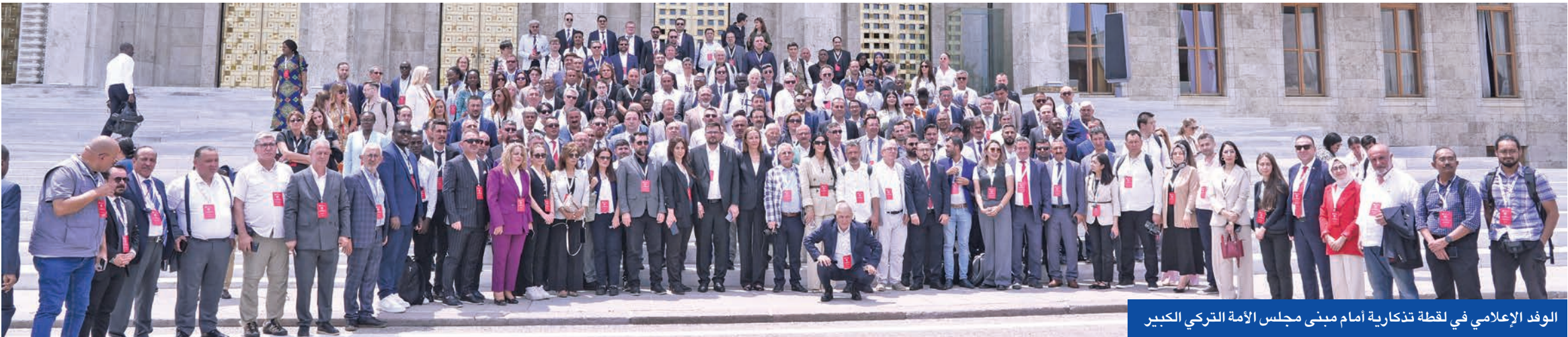
الوفد الإعلامي في لحظة تذكارية أمام مبنى مجلس الأمة التركي الكبير