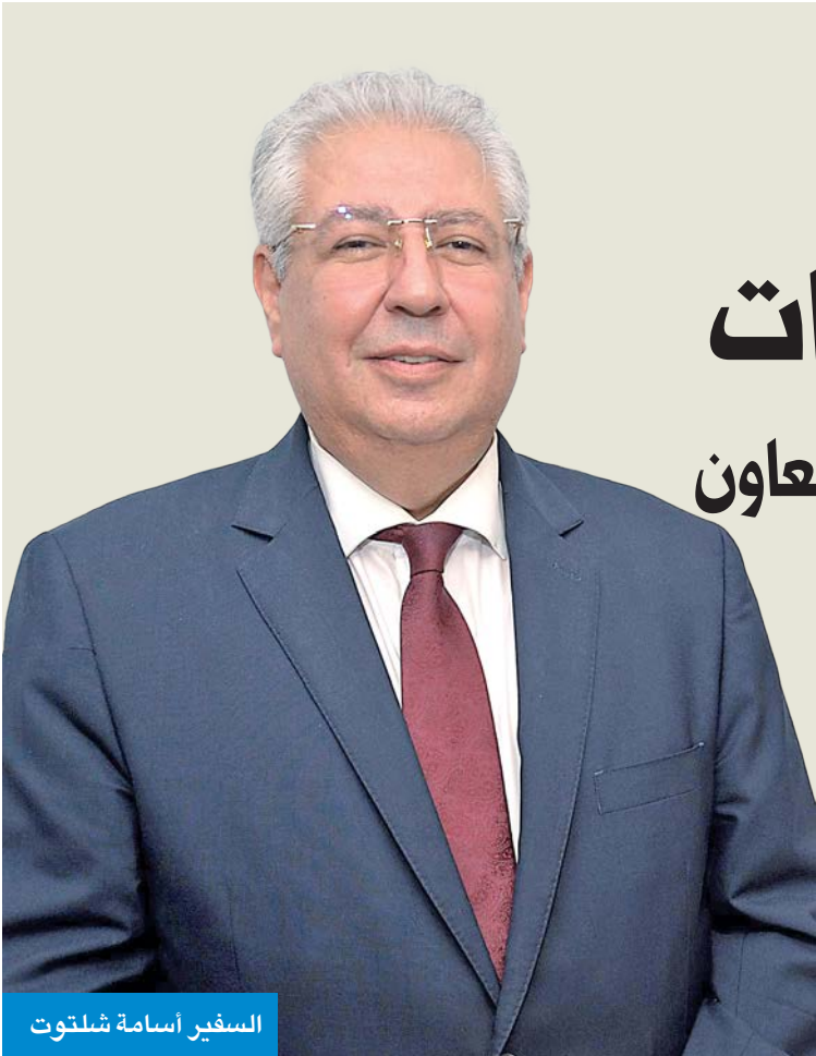
السفير أسامة شلتوت

ووصولاً إلى التنسيق الوثيق في المحافل والمنظمات الدولية، فقد كانت هناك تبادلات منتظمة للسيارات والحوارات بين قيادات البلدين وعلى مستوى وزيرى الخارجية، مما عزز التفاهم المشترك وولد رؤية موحدة حول القضايا الإقليمية والدولية. هذا التنسيق كان له أثر بالغ في تبني مواقف مشتركة بالأمم المتحدة، وجامعة الدول العربية، ومنظمة التعاون الإسلامي، حيث عمل البلدان جنباً إلى جنب لدعم قضايا الأمن والاستقرار في المنطقة، ومحاربة الإرهاب والتطرف، إضافة إلى تعزيز التعاون العربي المشترك. لكن لم تخل هذه الفترة من تحديات، أبرزها التحديات السريعة على الصعيد الإقليمي وتأثيراتها على السياسات الداخلية والخارجية لكلا البلدين. كان علينا مواجهة بعض الأزمات التي تطلبت درجة عالية من المرونة والبقطة في التعاطي مع المستجدات، وهو ما تم بفضل التنسيق الوثيق والحوارات المستمرة بين الوزارات والمسؤولين. أما الفرص فقد كانت عديدة ومتنوعة، خاصة مع تزايد الرغبة في تطوير العلاقات الثنائية لتشمل مجالات أوسع من التعاون الاقتصادي والاستثماري والثقافي. هناك إمكانية حقيقية لتعزيز هذا التعاون بما يخدم مصالح الشعبين، ويمكن البلدين من لعب دور أكبر في تحقيق الأمن والاستقرار بالمنطقة. باختصار، تجربتي أكدت لي أن العلاقة السياسية بين مصر والكويت ليست مجرد تحالف رسمي، بل شراكة استراتيجية مبنية على الثقة والتفاهم العميق، وهذه الشراكة تتطلب استمرار الجهود لتعزيزها وتطويرها في مواجهة تحديات العصر.