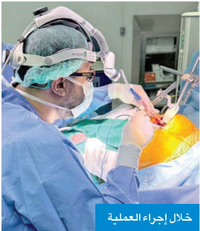
خلال إجراء العملية

العالمية، وبعد خطوة مهمة نحو تطوير منظومة الرعاية الصحية في البلاد. وأعرب العيار عن شكره وتقديره لوزارة الصحة على دعمها المستمر في توفير أحدث التقنيات الطبية العالمية لخدمة المرضى في الكويت. كما توجه بالشكر إلى إدارة مستشفى الصدي بقيادة د. جمال الفضلي المدير الطبي للمستشفى على الدعم المستمر للكوادر الطبية فيه.