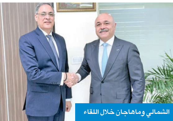
الشمالي وماهاجان خلال اللقاء

ستعود بالفائدة المأمولة لكلا البلدين والشعبين الصديقين.