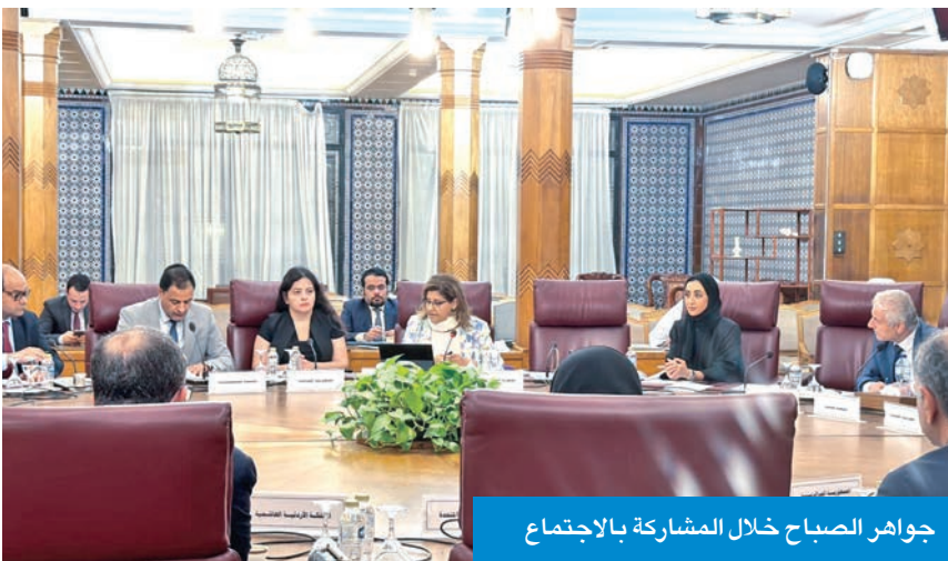
جواهر الصباح خلال المشاركة بالاجتماع

جواهر الصباح: الدفع بالعمل العربي المشترك لمزيد من التطور والنماء