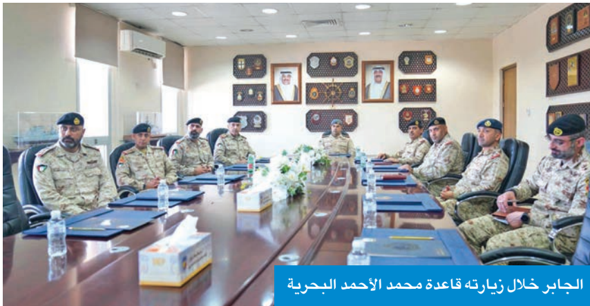
الجابر خلال زيارته قاعدة محمد الأحمد البحرية

شامل تضمن عرضاً لأبرز المهام والواجبات المنوطة بالقوة البحرية ومجالات عملها في حماية وتأمين المياه الإقليمية، إضافة إلى أبرز المشاريع التطويرية التي تهدف إلى رفع الكفاءة العملية وتعزيز القدرة على الاستجابة البحرية السريعة. وأضافت الأركان أن الزيارة شملت جولة على معهد القوة البحرية، للاطلاع على برامج التدريب والمناهج المعتمدة وما يقوم به المعهد في إعداد وتأهيل الضباط وضباط الصف بمختلف التخصصات، كما تم عرض أبرز المشاريع المستقبلية للمعهد، ومنها مركز التدريب البحري للمشبهات، حيث يتميز بإمكانات وقدرات متقدمة لتدريب المنتسبين بشكل احترافي. واطلع في ختام الزيارة على القارب المسيّر الذي يعتبر هدفاً متحركاً لأغراض التدريب. وكان في استقبال نائب رئيس الأركان العامة لدى وصوله أمر القوة البحرية، اللواء الركن البحري سيف الهملان، وعدد من ضباط القاعدة.