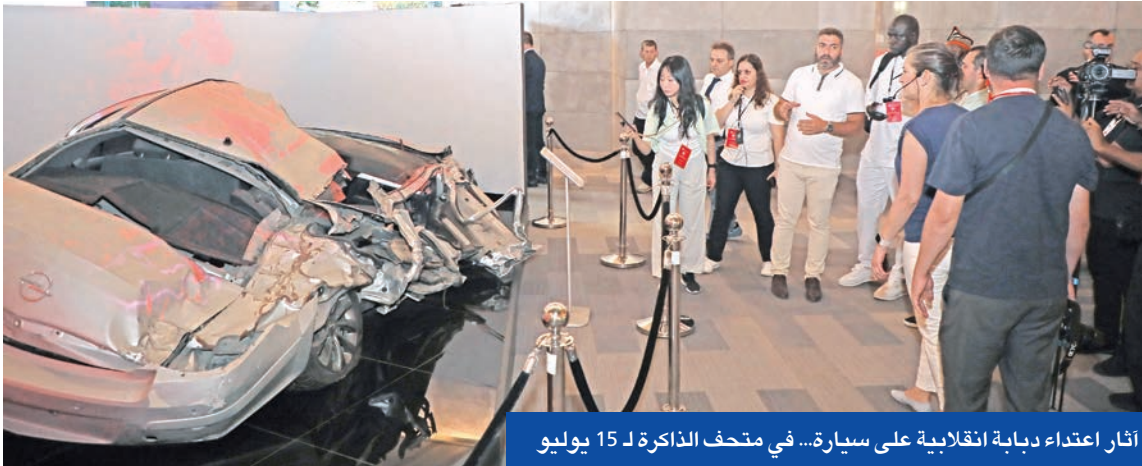
أثار اعتداء دبابة انقلابية على سيارة... في متحف الذاكرة لـ 15 يوليو

وأضاف غول أن «مشكلة تنظيم غولن الإرهابي ليست في بلادنا فحسب بل في دول العالم أجمع عن طريق سميات وفعاليات مختلفة»، واصفاً التنظيم بأنه «مرض خبيث مازال منتشراً، وعندما تحين له الفرصة سوف يعود مرة أخرى ويبيع الوطن، لذا نحن له بالمرصاد والمواجهة».