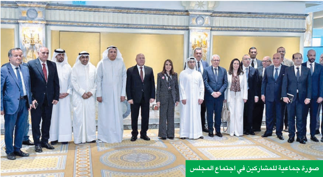
صورة جماعية للمشاركين في اجتماع المجلس