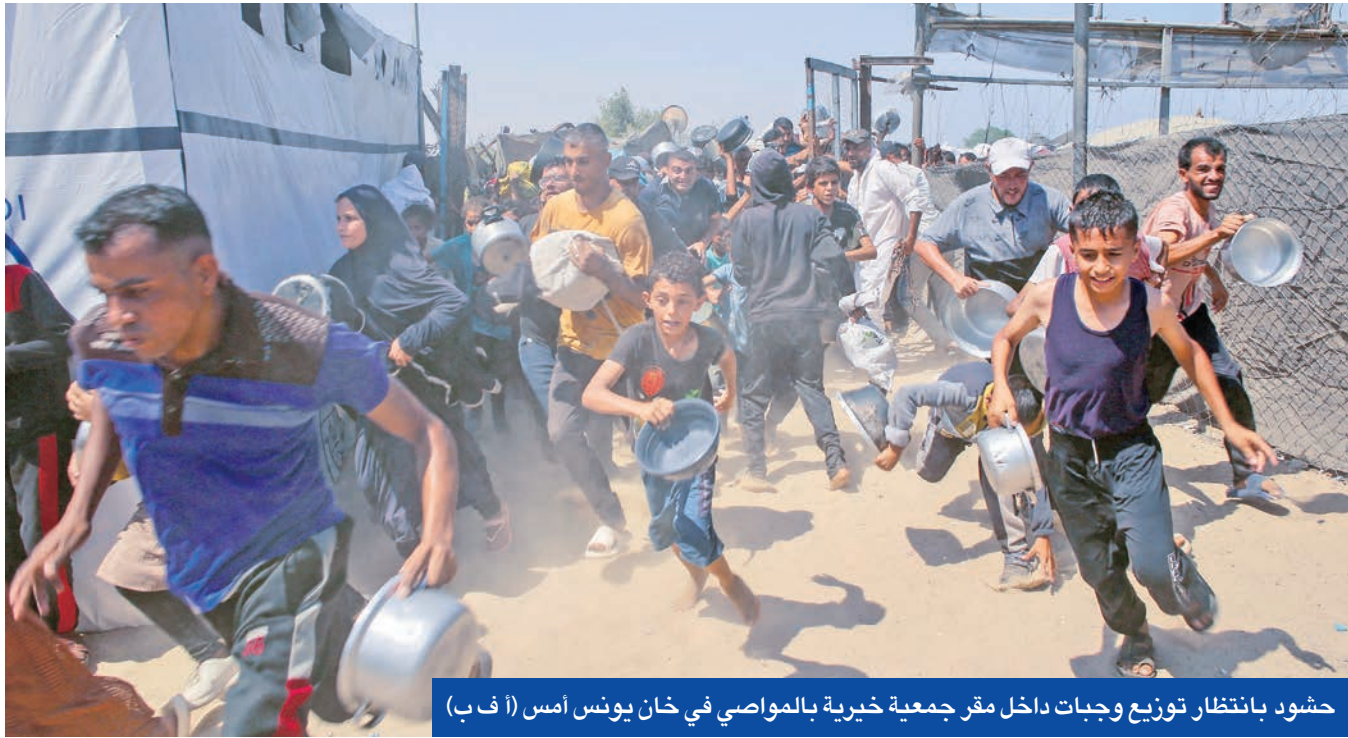
حشود بانتظار توزيع وجبات داخل مقر جمعية خيرية بالمواصي في خان يونس أمس

انقطاع الاتصال مع «حماس» يبطئ المفاوضات... وصبر البيت الأبيض نفد