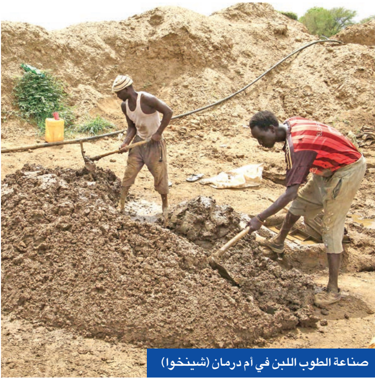
صناعة الطوب اللين في أم درمان (شينخوا)

رفض الرئيس الجزائري عبد المجيد تبون وجود مرتزقة «فاغنر» على الحدود مع مالي، مؤكداً أنه تم إبلاغ روسيا أنه لن يتساهل مع أي محاولة اقتراب من أراضيه. وقال تبون، للتللفزيون الرسمي، مساء أمس الأول: «إن التهديد الإرهابي موجود في الساحل، والجزائر أبدت استعدادها لمساعدة دول المنطقة لمكافحة، معتبراً أن الجزائر «أكبر جارة للخطر والتجربة مكافحة الإرهاب بالنظر للخبرة والتجربة الرائدة التي تتمتع بها أسلاكها الأمنية بعد أزمة الغشيرة السوداء التي عاشتها بداية تسعينيات القرن الماضي». وأوضح أنه «يملك جيشاً قوياً قادراً على حماية حدوده من أي تهديد إرهابي، سواء من الساحل أو من جهة أخرى، كما سبق لبلاده أن عبرت عن رفض وجود مرتزقة فاغنر على حدودها». وتطرق إلى الأزمة مع مالي، قائلاً: «مالي دولة جارة وشقيقة وصديقة والجزائر تساعدنا، وفي كل مرة بفشل الانقلابيون في تحقيق توافق بين الشمال والجنوب، مما يتسبب باندلاع مواجهات مسلحة وعنيفة لا تزال مستمرة حتى الآن». وأعاد التذكير باتفاق السلم والمصالحة الموقع من طرف جميع