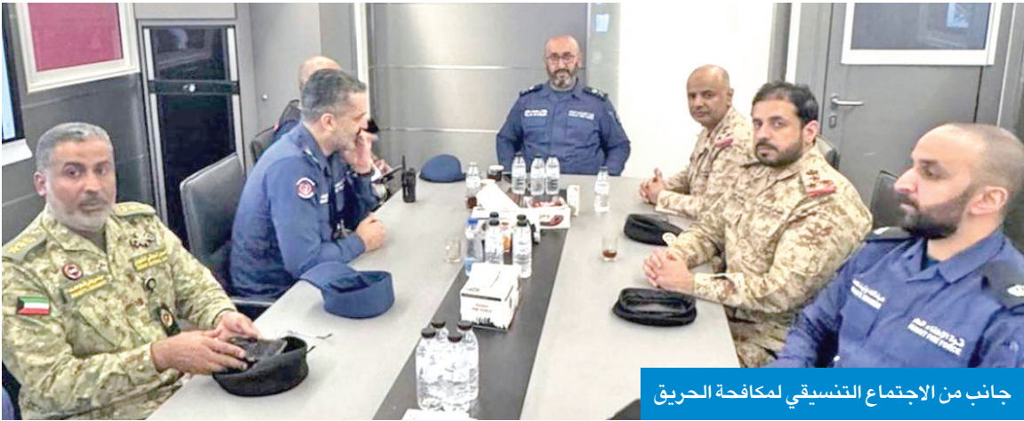
جانب من الاجتماع التنسيقي لمكافحة الحريق

التوجيه المعنوي والعلاقات العامة بوزارة الدفاع، العميد محمد أبل، إن الجيش الكويتي، ممثلاً بقيادة الإطفاء، قدّم الدعم والإسناد لقوة الإطفاء العام خلال جهودها في مكافحة الحريق. وأضاف أبل أن هذه المشاركة تأتي في إطار جهود الجيش بمساندة الجهات المعنية في التعامل مع حالات الطوارئ، وتعزيز التعاون والتكامل المشترك في الاستجابة السريعة والفعالة لمختلف الحوادث.