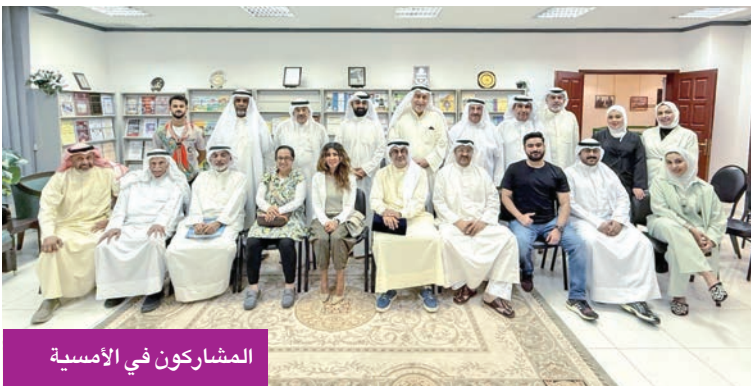
المشاركون في الأمسية

ثم أشار إلى «سنة الهيلك» عام 1868، التي جسدت دور الكويتيين في التكافل والإحسان، حيث واجه الناس ظروفًا قاسية، وكان للمحسنين دور بارز في دعم المحتاجين والتخفيف من آثار الأزمة.