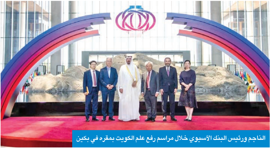
الناجم ورئيس البنك الآسيوي خلال مراسم رفع علم الكويت بمقره في بكين

في خطوة ترمز إلى التزام الكويت بدعم المشاريع التنموية في آسيا، لا سيما في مجالات البنية التحتية والطاقة والمشاريع البيئية، بما يعزز أهداف الحياد الكربوني ومكافحة التغير المناخي في منطقة الخليج. وفي كلمته خلال المناسبة، أعرب ليكون عن ترحيبه بانضمام الكويت، مشبهاً إلى دورها المرتقب في دفع جهود التنمية المستدامة ومساندة مشاريع البنية التحتية الذكية والطاقة المتجددة.