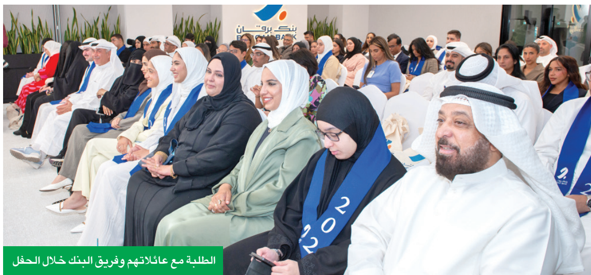
الطلبة مع عائلاتهم وفريق البنك خلال الحفل