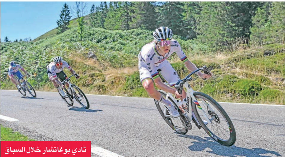
تادي بوغاتشار خلال السباق

عزز السلوفاكي تادي بوغاتشار، الساعي إلى لقبه الثاني توالياً والرابع في مسيرته، صدارته للترتيب العام المؤقت في النسخة الـ 112 لطواف فرنسا للدرّاجات الهوائية، بفوزه بالمرحلة الـ 13