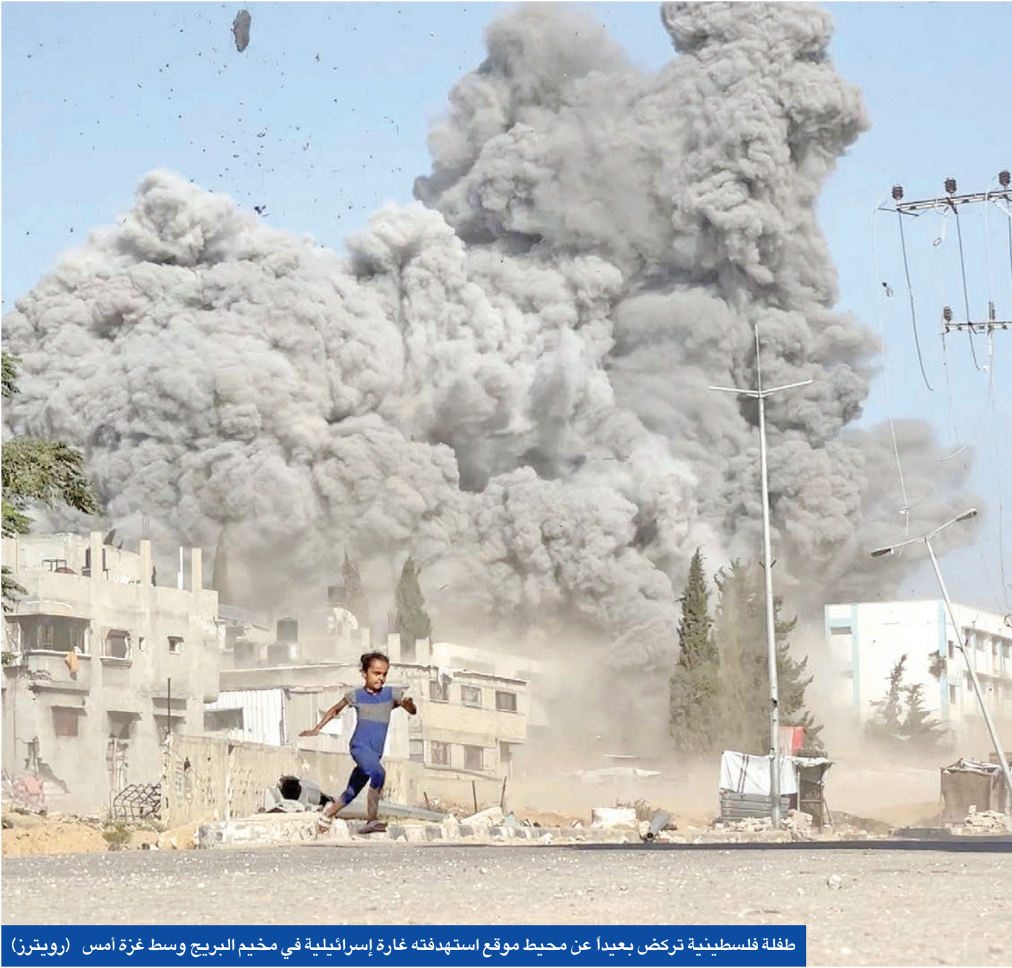
طفلة فلسطينية تركض بعيداً عن محيط موقع استهدفته غارة إسرائيلية في مخيم البريج وسط غزة أمس

ترامب يتوقع إطلاق 10 أسرى... و«حماس» تحشد العالم ضد التجويع