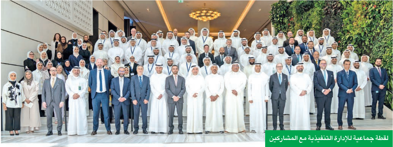
لقطة جماعية للإدارة التنفيذية مع المشاركين