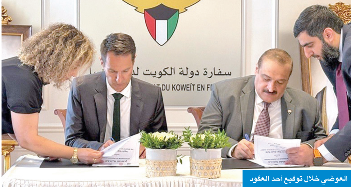
العوضي خلال توقيع أحد العقود

من جانبه، صرح سفير الكويت لدى فرنسا، عبدالله الشاهين، بأن توقيع مذكرات التفاهم بين وزارة الصحة الكويتية وخمس من أبرز المؤسسات الطبية الفرنسية الراسخة بين الكويت وفرنسا، ويعكس الحرص المتبادل على تطوير التعاون في المجالات الطبية، وعلى رأسها القطاع الصحي، مؤكداً أن هذه المذكرات تمثل «ثمرة مباشرة»