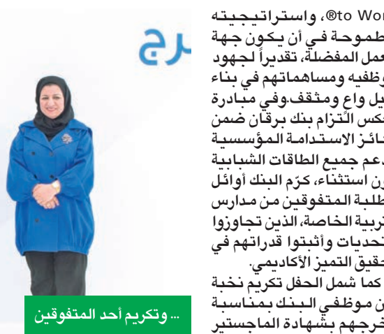
... وتكريم أحد المتفوقين