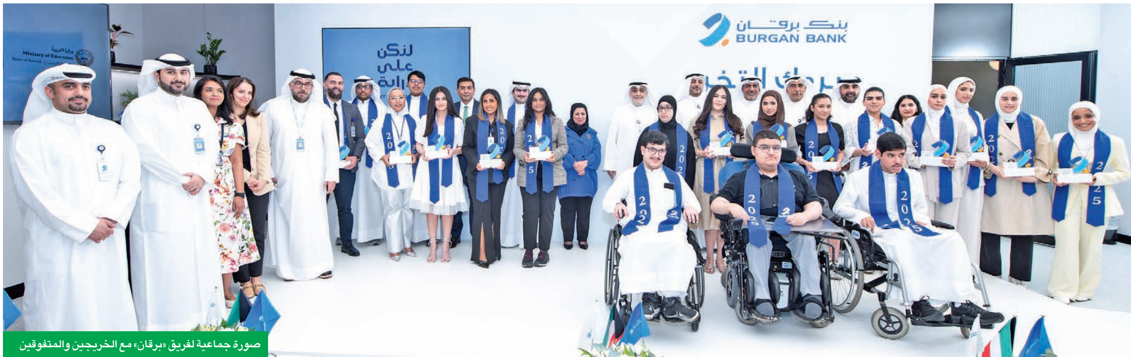
صورة جماعية لفريق «برقان» مع الخريجين والمتفوقين