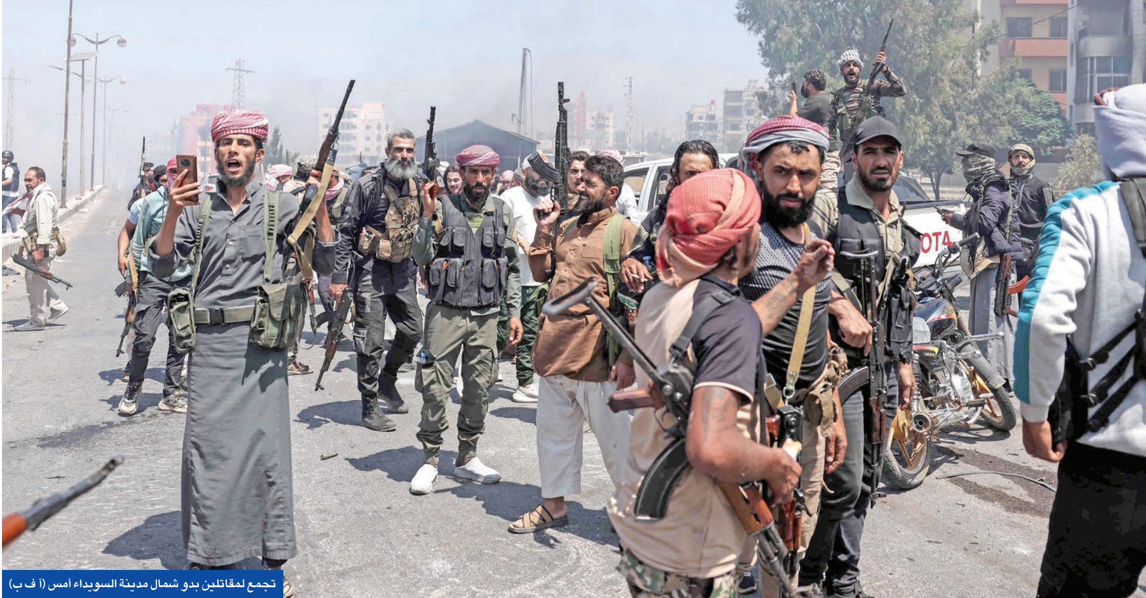
تجمع لمقاتلين بدو شمال مدينة السويدياء أمس (ا ف ب)

● دمشق تتهم إسرائيل بمحاولة دفعها للهاوية... ومنتيا هو يوافق على تهدئة شاملة برعاية دولية ● 940 قتيلاً في أسبوع... والعشائر توقف الزحف والقيادة الروحية تدعم وقف النار