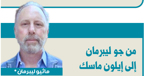
مانيو ليبرمان *

هذا المقال كتبته بتصرّف من مقالات سابقة عن أهمية اللحمة الوطنية وخرية التعبير. ودمتم سالمين