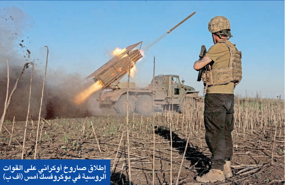
إطلاق صاروخ أوكراني على القوات الروسية في بوكوفسك أمس (اف ب)

الغت روسيا فعاليات منتدى الجيش التي تنظمها تقليدياً في شهر أغسطس لاستعراض قوتها العسكرية، التي تشمل أيضاً العرض المعتاد للأسلحة. في وقت قال الرئيس الأوكراني فولوديمير زيلينسكي إن القوات الروسية شنت أكثر من 300 هجوم جوي. وذكرت وكالة الأنباء الروسية الرسمية (تاس)، نقلاً عن المنطمين، أن المنتدى العسكري التقني الدولي (الجيش 2025)، سيتم تأجيله إلى موعد لاحق، دون الإشارة إلى أسباب ذلك. وكان من المقرر إقامة معرض العتاد العسكري، الذي يشمل أيضاً تطورات عسكرية جديدة مثل الطائرات المسيرة، في الفترة من 11 إلى 14 أغسطس داخل منتزه باتريوت العسكري، بالقرب من موسكو، ولم يتم الإعلان عن موعد جديد. ووفق الموقع الإلكتروني للمنتدى، كان متوقعاً مشاركة أكثر من 1500 جهة،