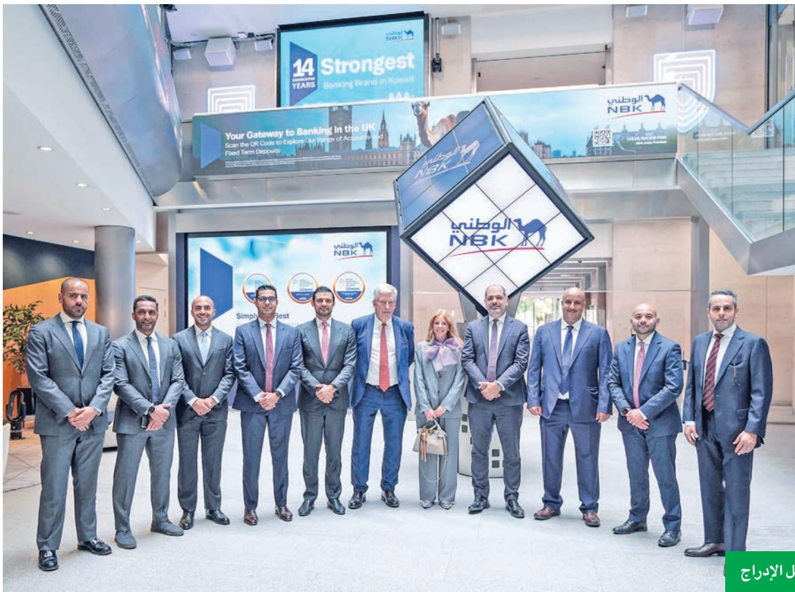
جانب من حفل الإدراج

أكبر إصدار للبنك ضمن الشريحة الأولى الإضافية لرأس المال