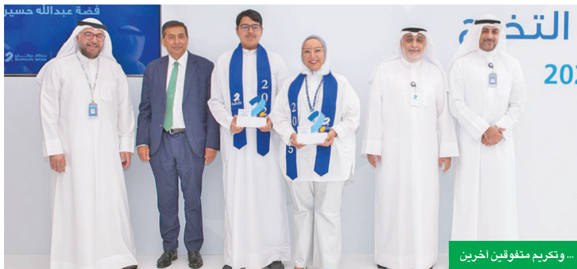
... وتكريم متفوقين آخرين