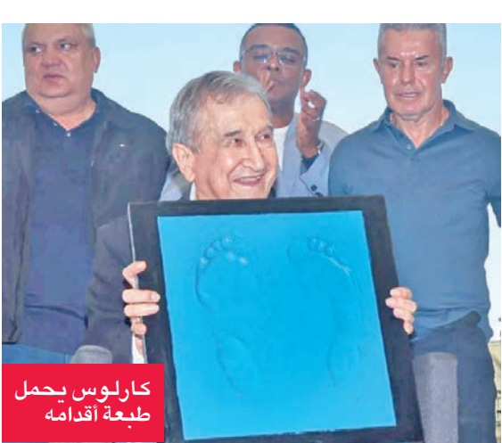
كارلوس يحمل طبعته أقدامه

تم تخليد المدرب البرازيلي السابق كارلوس ألبرتو باريرا، الذي قاد المنتخب البرازيلي للفوز بلقبه العالمي الرابع في عام 1994، أمس الأول الجمعة، في «ممر الشهرة» بملعب ماراكانا، حيث طبعت آثار قدميه. وأصبح باريرا، البالغ 82 عاماً، أول مدرب ليست له مسيرة كروية يحصل على هذا التكريم، من بين ما يقرب من مائة لاعب كرة قدم طبعت آثار أقدامهم في الملعب القائم بريدو دي جانيرو. وحضر التكريم، الذي أقيم بعد يوم واحد من الاحتفال بالذكرى الحادية والثلاثين لفوز البرازيل بكأس العالم 1994 في الولايات المتحدة، لاعبون من الفريق الذي رفع اللقب تحت قيادته، مثل بيتيتو وبرانكو وزينيو وبريكاردو جوميز. وترن باريرا، الذي شارك في تسعة نهائيات لكأس العالم،