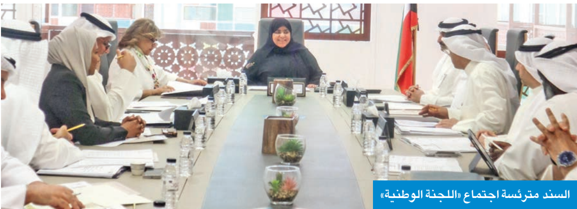
السند مترنجة اجتماع «اللجنة الوطنية»

نحو القضاء عليها، عبر تطبيق أحكام القانون رقم 91 لسنة 2013 بشأن منع الاتجار بالأشخاص وتهريب المهاجرين، ومساعدتهم، والعمل على تفعيل سبل التعاون الوطني والإقليمي والدولي لمنع تلك الجرائم.