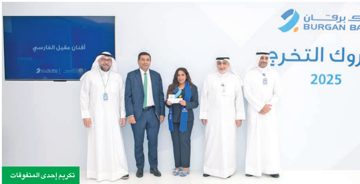
تكريم إحدى المتفوقات