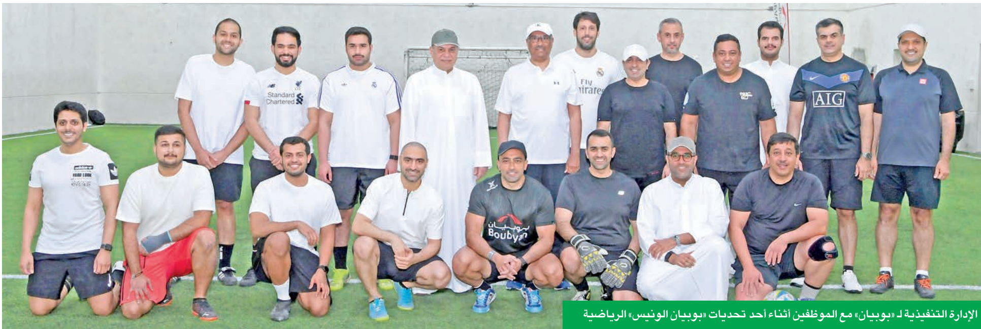
الإدارة التنفيذية لـ «بوبيان» مع الموظفين أثناء أحد تحديات «بوبيان الونيس» الرياضية