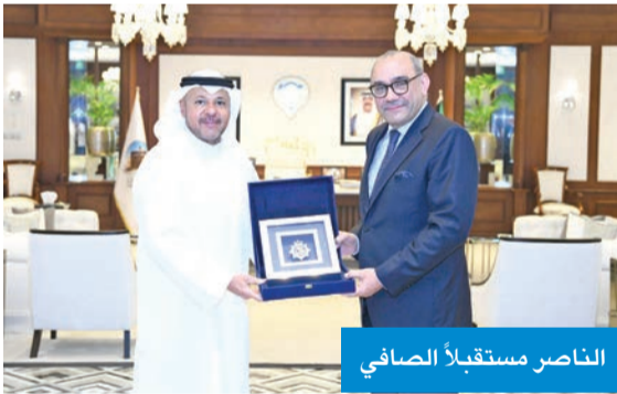
الناصر مستقبلاً الصافي

استقبل محافظ الفروانية الشيخ عذبي الناصر، في مكتبه بالمحافظة صباح أمس، سفير العراق لدى الكويت المنهل الصافي. ورحب الناصر بالسفير الصافي، وأشاد بعمق العلاقات الأخوية الطبية التي تربط البلدين والشعبين الصديقين، ونتم خلال اللقاء مناقشة الموضوعات ذات الاهتمام