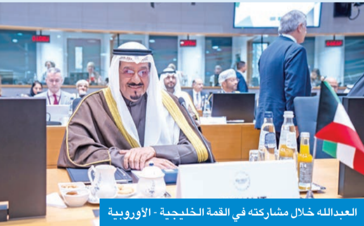
العبدالله خلال مشاركته في القمة الخليجية - الأوروبية

في كلمة دولة الكويت أمام القمة الخليجية - الأوروبية الأولى في بروكسل التي عقدت أكتوبر الماضي، دعا ممثل سمو أمير البلاد الشيخ مشعل الأحمد، رئيس مجلس الوزراء، سمو الشيخ أحمد العبدالله، العراق إلى ضرورة اتخاذ إجراءات ملموسة لمعالجة جميع الملفات العالقة بين البلدين، وفي مقدمتها ترسيم الحدود البحرية لما بعد النقطة 162، وفقاً للقوانين والمواثيق الدولية، مع الانتهاء من ملف الأسرى والمفقودين والممتلكات الكويتية، بما في ذلك الأرشييف الوطني في نطاق متابعة الأمم المتحدة.