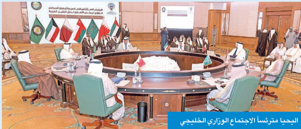
البحيا مقررثاً الاجتماع الوزاري الخليجي

ودعا المجلس، في بيانه الختامي، إلى استكمال ترسيم الحدود البحرية بين الكويت والعراق لما بعد العلامة البحرية 162، وفقاً لنقواعد ومبادئ القانون الدولي، واتفاقية الأمم المتحدة لقانون البحار لعام 1982، مطالباً الحكومة العراقية بالالتزام باتفاقية تنظيم الملاحة البحرية في خور عبدالله الموقعة بين البلدين بتاريخ 29 أبريل 2012.