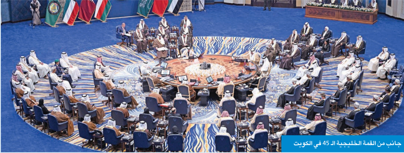
جانب من القمة الخليجية الـ 45 في الكويت

أو أعمال أحادية الجانب تقوم بها جمهورية العراق المتعلّقة باتفاقية خور عبدالله باطلة وملغاة، بالإضافة إلى رفضه للإجراء العراقي أحادي الجانب بإلغاء العمل ببروتوكول المبادلة الأمني الموقع عام 2008م وخارطته المعتمدة في الخطة المشتركة، لضمان سلامة الملاحة في الحدود البحرية بين الجانبين بتاريخ 28 ديسمبر 2014م واللّتين تضمنتا آلية واضحة ومحددة للتعديل والإلغاء.