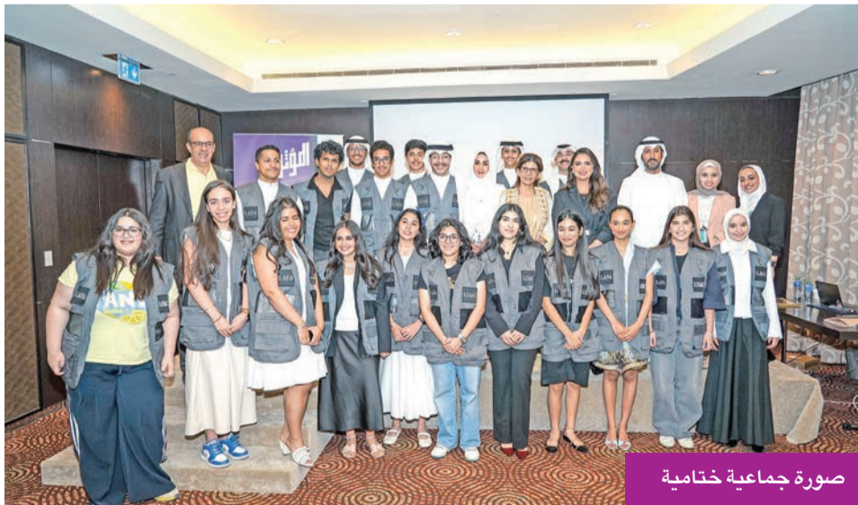
صورة جماعية ختامية