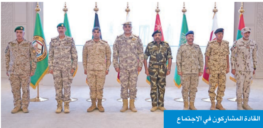
القادة المشاركون في الاجتماع

مستوى الجاهزية القتالية، والذي يترجم في الوقت ذاته الأهداف السامية التي يتطلع إليها قادة دول مجلس التعاون.