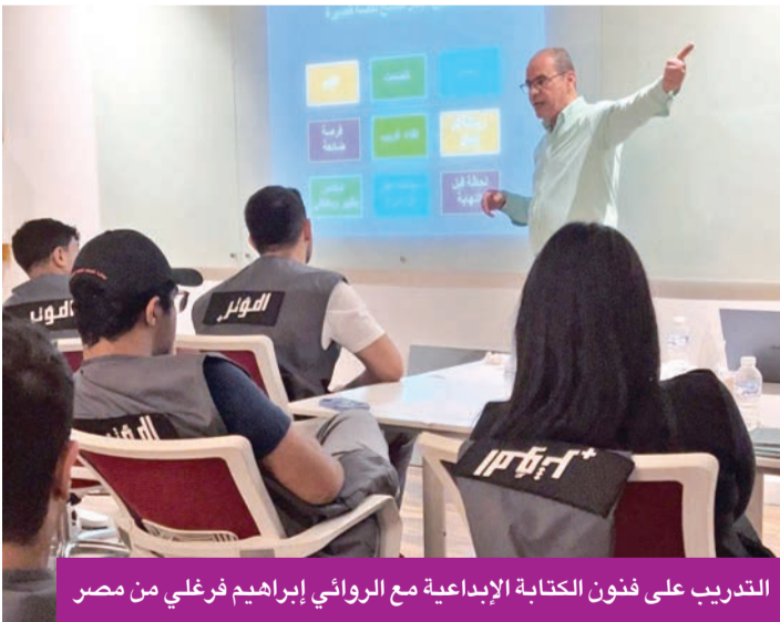
التدريب على فنون الكتابة الإبداعية مع الروائي إبراهيم فرغلي من مصر

فريق «سوالفنا 2» فاز بالمركز الأول من خلال بودكاست قدّمه المتدربون ناقشوا فيه أحلام الشباب وتحدياتهم