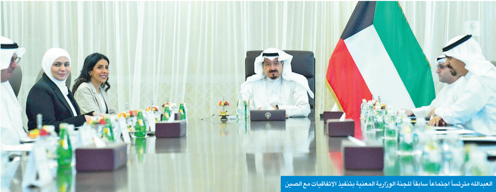
العبدالله مترأساً اجتماعاً سابقاً للجنة الوزارية المعنية بتنفيذ الاتفاقيات مع الصين

قطار تنفيذ المشروع المرتبط بالخور ركب السكة... والعبدالله يحمل لواءه