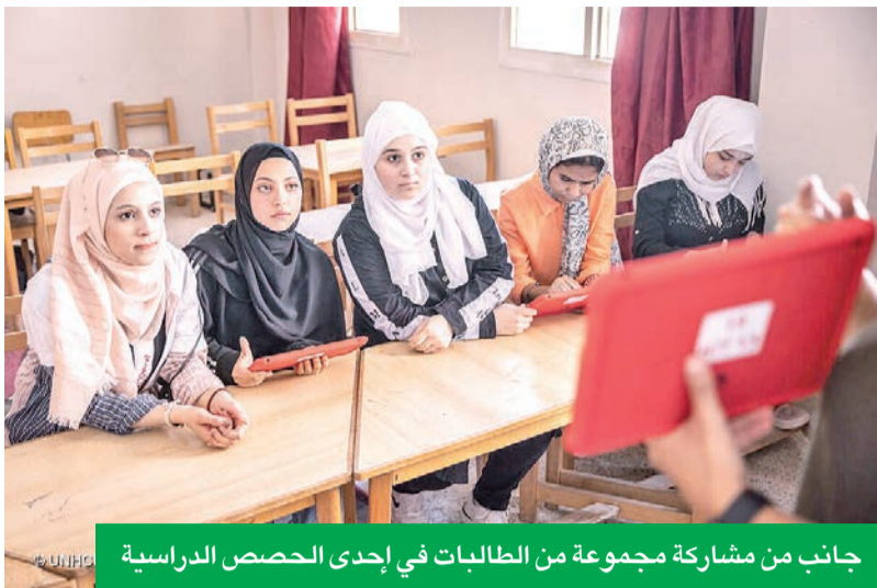
جانب من مشاركة مجموعة من الطالبات في إحدى الحصص الدراسية

لتمكين أكثر من 2000 طالب لاجئ في مصر من الحصول على التعليم خلال 2025-2026