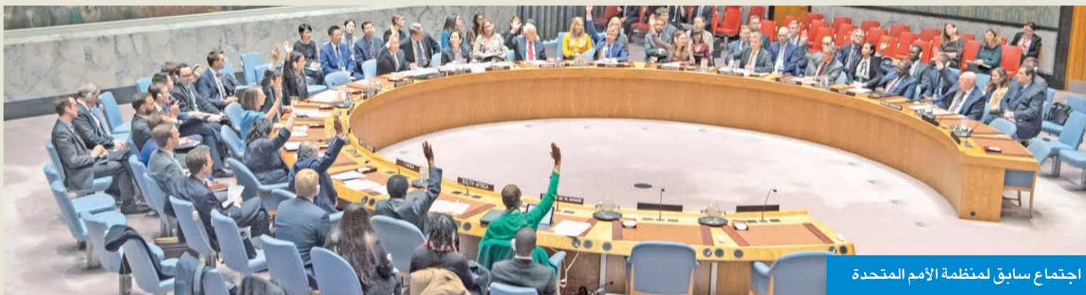
اجتماع سابق لمنظمة الأمم المتحدة

ومُلزمة للطرفين بموجب قواعد القانون الدولي وميثاق الأمم المتحدة. وتستند الكويت في موقفها إلى أساس قانوني متين، يتضمّن: • شرعية دولية مُعترف بها بموجب قرارات مجلس الأمن. • اتفاقية ثنائية صُودق عليها، وأودعت أممياً. • استقرار قضائي سابق صادر عن أعلى سلطة قضائية عراقية. • وبذلك، فإن أي محاولة عراقية للانسحاب من الاتفاقية أو التنصّل منها استناداً إلى حكم داخلي، تظل مخالفة للقانون الدولي، ولا تؤثر على الوضع القانوني القائم، ما لم يتم تعديل الاتفاقية بمرارة متبادلة، وهو ما لم يحدث حتى الآن. وتظل دولة الكويت ملتزمة بالاتفاقية، حريصة على حسن الجوار، وتستند إلى القانون الدولي في حماية حقوقها وسيادتها في خور عبدالله.