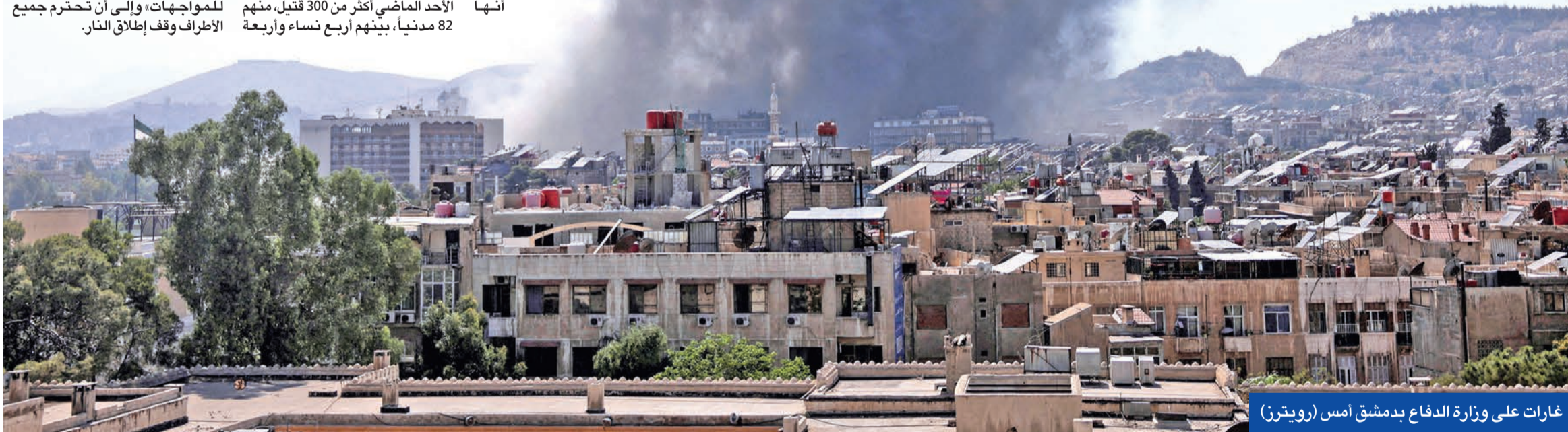
غارات على وزارة الدفاع بدمشق أمس

أعربت الكويت عن إدانتها واستنكارها الشديدين للاعتداءات الإسرائيلية السافرة على أراضي سورية، مشيرة إلى أن هذه الاعتداءات تمثل استمراراً لسلسلة الانتهاكات المتكررة للقانون الدولي وميثاق الأمم المتحدة. وطالبت الكويت المجتمع الدولي ومجلس الأمن بالاضطلاع بمسؤولياتهما لردع تلك الانتهاكات ووضع حد لها، حفاظاً على أمن واستقرار المنطقة. وأكدت وزارة الخارجية موقف الكويت الثابت والداعم لسورية الشقيقة، ووقوفها إلى جانبها للحفاظ على أمنها واستقرارها. ورحبت وزارة الخارجية بإعلان الحكومة السورية وقف إطلاق النار بمدينة السويداء، مؤكدة ضرورة تهدئة الأوضاع، واتخاذ كل ما من شأنه حقن دماء الشعب السوري الشقيق.