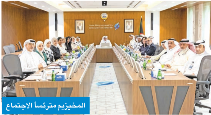
المخيزيم مترأساً الاجتماع

وزير الكهرباء ترأس اجتماعاً لمتابعة مستجدات التحول الطاقى