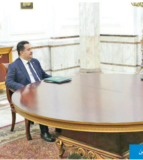
اجتماع الرؤساء الثلاثة بقصر بغداد، الذي تقرر فيه سحب الطعنين

من جانبه، ذكر رئيس مركز سدره للدراسات ومؤلف كتاب «آراء كويتية في المسألة