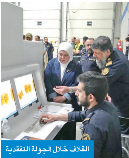
القلاف خلال الجولة التفقدية

المستودع الجمركي، التابع لشركة الشراع، ومن ثم التوجه إلى مستودع أمغرة (SWB)، وأطلعت على آخر ما تم إنجازه من تطورات في أنظمة العمل، والتحديثات المتعلقة بالأجهزة المساندة للفحص والتفتيش. واستمعت القلاف، خلال الجولة، إلى ملاحظات ومطالب المفتشين الميدانيين، مؤكدة دعم الإدارة لبيئة العمل للجمارك المتواصل لتحسين بيئة العمل وتوفير كل ما من شأنه تسهيل المهام اليومية وتعزيز كفاءة الأداء. وأعلنت «الجمارك» أن الجولة تأتي ضمن نهج الإدارة لضمان جودة العمل وتحقيق أعلى مستويات الجاهزية الامنية والرقابية.