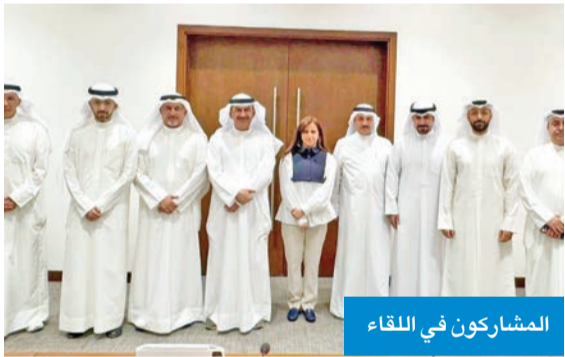
المشاركون في اللقاء

التقى محافظ الجهراء حمد الحبشي، صباح أمس، رئيس «لجنة الجهراء» في المجلس البلدي عبدالله العنزي، بحضور كل من الأعضاء منيرة الأمير، خالد المطيري، إسمايل بهبهاني، عبداللطيف الدعي. وخلال اللقاء تمّ التباحث في عدد من القضايا المتعلقة بتطوير المحافظة، وسبل تعزيز الخدمات المقدمة للمواطنين، بما يسهم في تحقيق التنمية المستدامة والارتقاء بالبنية التحتية في مختلف مناطق المحافظة. وأكد المحافظ أهمية التنسيق المستمر بين المحافظة والمجلس البلدي، مشيدا بالدور الفاعل الذي يقوم به الأعضاء في نقل احتياجات المواطنين ومتابعة تنفيذ المشاريع الحيوية.