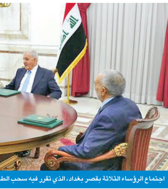
اجتماع الرؤساء الثلاثة بقصر بغداد، الذي تقرر فيه سحب الطعنين

الدبلوماسية الشعبية مهمة في تعزيز موقف الكويت من الاتفاقية الثيان