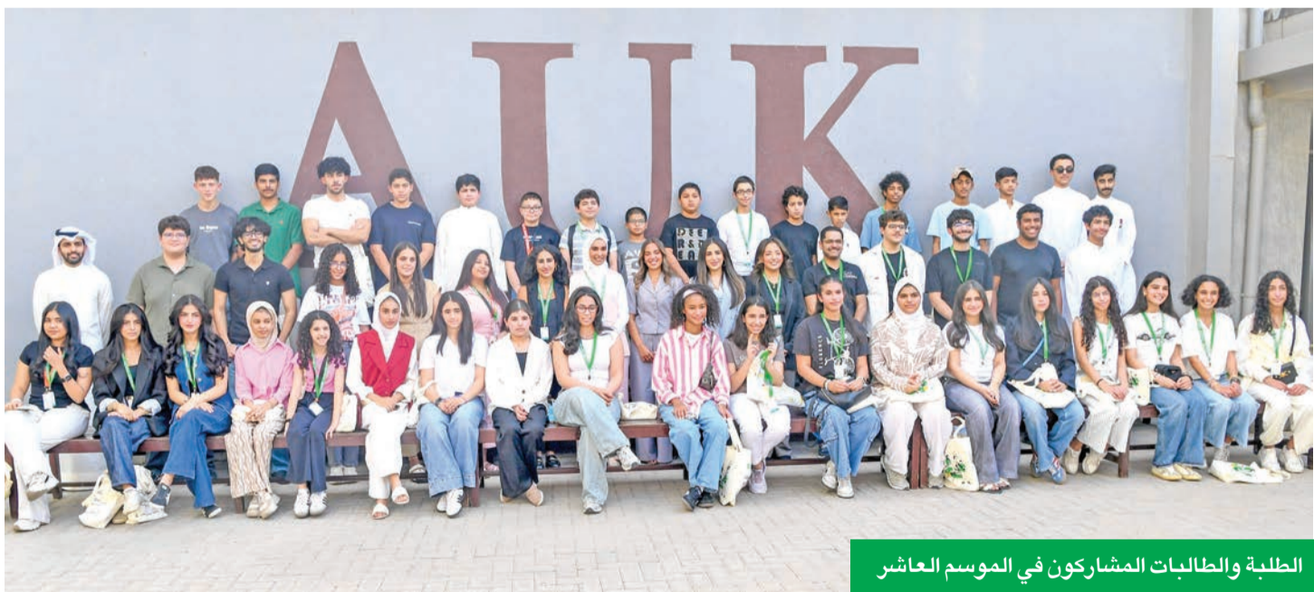
الطلبة والطالبات المشاركون في الموسم العاشر

«زين» على دعمها سنوياً، لما لها من أثر ملموس في صقل مهارات المشاركين من عمر 12 إلى 16 عاماً، عبر ورش عمل تفاعلية، وجلسات تدريب وتوجيه، وزيارات ميدانية، تغرس من خلالها مفاهيم الإدارة والتفكير النقدي والعمل الجماعي