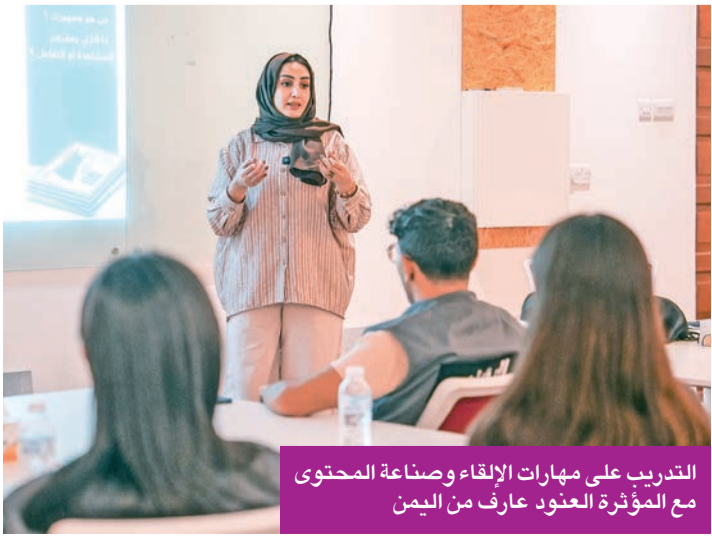
التدريب على مهارات الإلقاء وصناعة المحتوى مع المؤثرة العنود عارف من اليمن