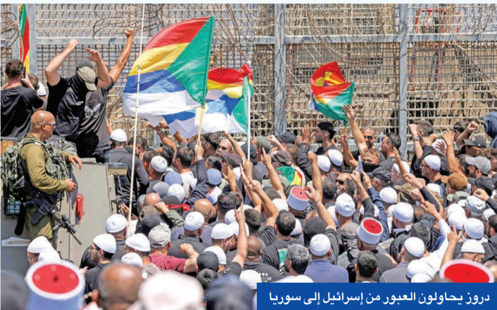
دروز يحاولون العبور من إسرائيل إلى سوريا

«تتابع الانتهاكات المؤسفة» في السويداء، وشددت على أن «حقوق أبناء المحافظة مصونة، ولن نسمح لأي طرف بالبعث بآمنهم»، متعهدة بفتح تحقيق شامل ومحاسبة المخورطين، مؤكدة أولوية الدولة في بسط النظام والاستقرار. وبعد انهيار اتفاق وقف النار الأول، قالت وزارة الداخلية السورية، إن «قوى الأمن الداخلي بالتعاون مع وحدات من وزارة الدفاع تمكنت من طرد المجموعات الخارجة عن القانون من مركز مدينة السويداء»، وإعادة مظاهر الاستقرار إلى شوارعها، مشيرة إلى تنفيذ نقاط أمنية في المدينة بعد اجتماع موسعة مع وجهاء وأعيان المنطقة. وأضافت أن بعض الفصائل المسلحة نقضت التفاهات وعادت للهجوم على عناصر الشرطة، متهمة إسرائيل بتنفيذ غارات دعماً لتلك المجموعات، أدت إلى مقتل عدد من عناصر الجيش والأمن، فيما وصفته بـ «العدوان السافر على السيادة السورية». وأكدت وزارة الدفاع السورية، من جهتها، أن قوات الجيش ترد على مصادر النيران بدقة، مع مراعاة قواعد الاشتباك، مطالبة المدنيين بالتزام حظر التجوال المعلن «حفاظاً على سلامتهم» في المقابل، قال الشيخ حكمت الهجري الذي يقود المعارضة الدروزية لسلطات دمشق الجديدة، إن قوات الأمن انتهكت وقف النار ودخلت مع المسلحين وشكلت لهم غطاء لارتكاب انتهاكات كبيرة. وحسب المرصد السوري، بلغت حصيلة القتلى منذ بدء الاشتباكات الأحد الماضي أكثر من 300 قتيل، منهم 82 مدنياً، بينهم أربع نساء وأربعة