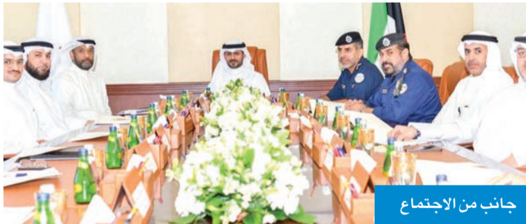
جانب من الاجتماع

فعال ينسجم مع توجيهات سمو أمير البلاد الشيخ مشعل الأحمد لتحقيق أهداف رؤية الكويت 2035 (كويت جديدة) كمنهج استراتيجي للتنمية المستدامة. واختتمت الجلسة بتأكيد أهمية إعداد تقارير منتظمة تعكس نتائج أعمال المجلس وتوصيات لجانه، وتسهم في دفع عجلة التطوير والارتقاء بالخدمات في محافظة مبارك الكبير.