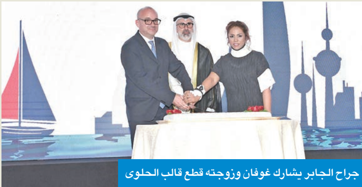
جراح الجابر يشارك غوفان وزوجته قطع قالب الحلوى

وفي إطار التعاون الثقافي والبحثي، أشار السفير إلى أن المركز الفرنسي للأبحاث في شبه الجزيرة العربية، ومقره الكويت، يلعب دوراً محورياً في دعم الدراسات التراثية والأثرية. وأعرب عن فخره بزيارة جزيرة فيلكا أخيراً، برفقة