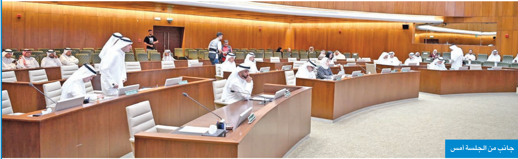
جانب من الجلسة أمس