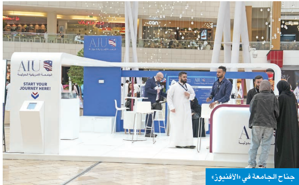
جناح الجامعة في «الأفنيوز»

اختتمت مشاركتها بـ «الأفنيوز» وتستعد للتواجد في «الخيران مول»