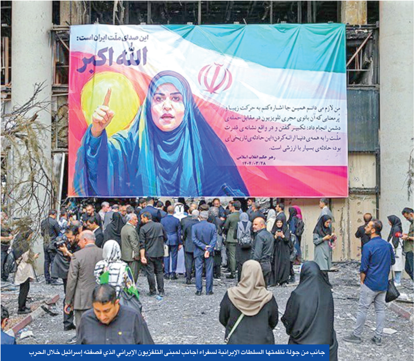
جانب من جولة نظمته السلطات الإيرانية لسفراء أجانب لمبنى التلفزيون الإيراني الذي قصفته إسرائيل خلال الحرب

المتعلقة بالمشاريع الدفاعية الخاصة. وأشار إلى أن المشروع يُلزم المنظمة أيضاً بدفع 100 في المئة من الحصص السنوية، التي أقرها المجلس الأعلى للأمن القومي لتعزيز القدرات الدفاعية، ويُلزم البنك المركزي الإيراني بتقديم تسهيلات مالية لهيئة الأركان من موارد الأموال المحررة وغيرها، لتنفيذ المشاريع الدفاعية الطارئة. وحسب تقرير سابق لشبكة «إيران إنترناشيونال» المعارضة، نُشر في مارس الماضي، فإن مشروع موازنة العام الإيراني (2025-2026) يعكس تمييزاً ملحوظاً في توزيع الموارد، حيث حصل الحرس الثوري على حصة أكبر بكثير من حصة الجيش النظامي.