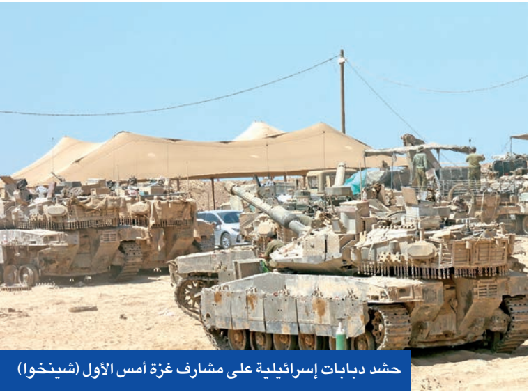
حشد دبابات إسرائيلية على مشارف غزة أمس الأول

وكشف موقع أكسيوس أن ترامب أبلغ نظيره الفرنسي إيمانويل ماكرون، في تعليقه على المحادثة، أن بوتين يريد، على ما يبدو، «الاستيلاء على كل شيء». وعبّر ترامب في الأيام الأخيرة عن غضبه وخيبة أمله من بوتين. وقال أمس الأول في قاعدة أندروز الجوية الأميركية أثناء عودته من مشاهدة نهائي كأس العالم للأندية لكرة القدم في نيوجيرسي، «فاجأ بوتين الكثيرين. يتحدث بلطف، ثم يقصف الجميع في المساء». وأفاد موقع أكسيوس، نقلاً عن مصدرين مطلعين، بأن الخطة التي اقترحها زيلينسكي خلال قمة «ناتو»، قبل أسبوعين «ستشمل صواريخ بعيدة المدى قادرة على الوصول إلى عمق روسيا». وقال ترامب أمس الأول: «سنرسل إليهم منظومات باتريوت، فهم في أمس الحاجة إليها، لكن من دون أن يحدد عددها. أوضح: «سنرسل لهم في الأساس قطعاً متنوعة من المعدات العسكرية المتطورة، لكنهم سيدفعون لنا مقابلها 100 بالمئة». وأضاف: «سيكون ذلك بالنسبة إلينا بمنزلة صفقة». وتشير التقارير إلى أن أوروبا ستدفع الجزء الأكبر من ثمن هذه الأسلحة. وقال السيناتور الجمهوري، ليندسي