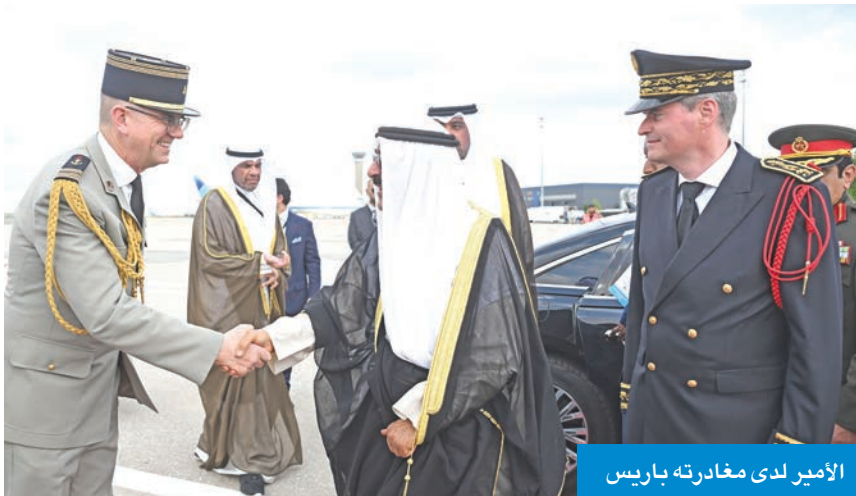
الامير لدى مغادرته باريس

مباحثات الأمير وماكرون تطرقت إلى التشاور والتنسيق حول آخر المستجدات