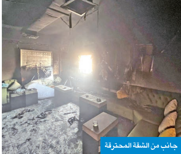
جانب من الشقة المحترقة

تعاملت قوة الإطفاء العام مع حريق شقة في عمارة بالمهبولة، واستطاعت إخماده من دون إصابات. وأشارت إدارة العلاقات العامة والإعلام إلى أن مركزي إطفاء المنقف والفحيحيل تعاملًا مساء أمس الأول، مع حريق شقة في عمارة بمنطقة المهبولة، وتم إخلاء البناية من السكان ومكافحة الحريق والسيطرة عليه، مضيئة أن الحادث لم يسفر عن وقوع أية إصابات، وتم تسليم الموقع للجهات المختصة. في مجال آخر، اختتمت قوة الإطفاء العام، صباح أمس، في مجمع 360 دورة «أساسيات الوقاية والمكافحة»، التي أقيمت لموظفي مجموعة شركات تمدن، بمشاركة 182 متدرباً. وقالت «الإطفاء» إن هدف الدورة هو رفع كفاءة المشاركين في الجوانب النظرية والعملية المتعلقة بمتطلبات السلامة وطرق الوقاية من المخاطر وأساليب التعامل الأولى مع الحرائق. وبيّنت أن هذه الدورة تأتي ضمن جهود التعاون بين «الإطفاء» والقطاع الخاص لتعزيز ثقافة الوقاية والسلامة، بما يساهم في حماية الأرواح والممتلكات.