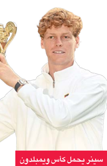
سينر يحمل كأس ويمبلدون

ثار الإيطالي يانيك سينر، المصنف الأول عالمياً، من الإسباني كارلوس الكاراس، الثاني وبطل النسختين الماضيتين، وتوج بلقب بطولة ويمبلدون، ثالثة البطولات الأربع الكبرى في كرة المضرب، للمرة الأولى، بفوزه عليه أمس الأول (الأحد) في النهائي 6-4 و4-6 و4-6 و6-4. وبعد سلسلة من خمس هزائم متتالية أمام الإسباني الذي يصغره بعام، أحرهما الشهر الماضي في النهائي التاريخي لبطولة رولان غاروس حين فاز عليه بخمس مجموعات في 5 ساعات و29 دقيقة، تمكن الإيطالي (23 عاماً) من رد