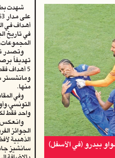
دوناروما (في المنتصف) في شجار مع جواو بيدرو (في الأسفل) بعد المباراة النهائية

دافع القطري ناصر الخليفي، رئيس باريس سان جرمان، عن مدرب الفريق لوييس إنريكي، بعد اشتباكه مع لاعب تشلسي، البرازيلي جواو بيدرو، عقب خسارة الفريق الفرنسي نهائي مونديال الأندية بثلاثية نظيفة أمام «البلوز».