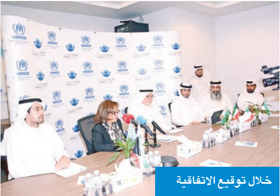
خلال توقيع الاتفاقية

ربيعان: منجّ نقدية لـ 705 أسر من النازحين داخلياً