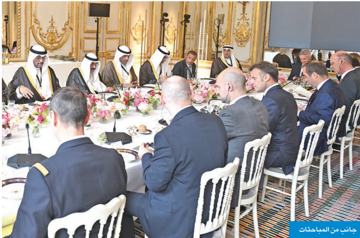
جانب من المباحثات