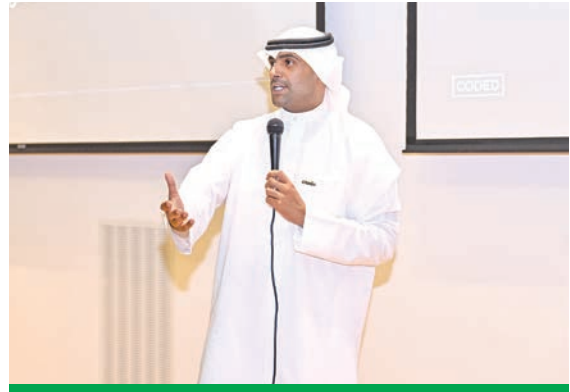
المصباح مخاطباً الدفعة الثانية من الطلاب والطالبات

المؤسسية، التي تضع تمكين الشباب على بناء القدرات المرجعية للطلاب بطريقة مبسطة واحترافية، ضمن بيئة تعليمية تفاعلية، ويحتوي تدريبي عصري يواكب تطورات القطاع التقني، كما تهدف المبادرة إلى تأهيل 1000 طالب وطالبة خلال العام الحالي في مجالات تقنية متنوعة تشمل تطوير التطبيقات، وتصميم المواقع، والأمن السيبراني، والذكاء الاصطناعي. وتأتي مشاركة زين في هذه المبادرة كجزء من استراتيجيتها للاستدامة