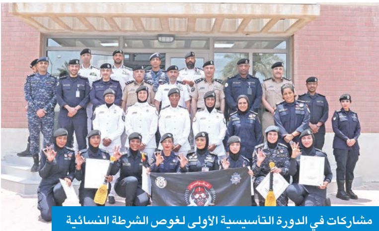
مشاركات في الدورة التأسيسية الأولى لغوص الشرطة النسائية

تعد الأولى من نوعها على مستوى الكويت والمؤسسات العسكرية «تعكس توجه وزارة الداخلية نحو تمكين المرأة وحضورها في مجالات العمل الأمني البحري». وأفاد بأن الدورة جاءت في إطار جهود وزارة الداخلية الرامية إلى دعم دور المرأة في العمل الميداني، لما لذلك من أهمية في تعزيز الجاهزية الأمنية وتنمية القدرات البشرية بمختلف الظروف والمهام. وشهدت الدورة، التي أقيمت في الفترة بين 18 مايو الماضي و10 الجاري، مشاركة 17 متدربة تلقين تدريباً نظرياً وعملياً مكثفاً على مهارات وفنون الغوص.