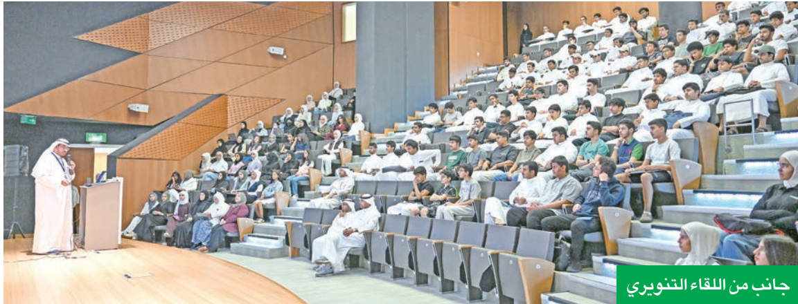
جانب من اللقاء التثويري

البرنامج يقدم مسارين تدريبيين في الأمن السيبراني ولغة البايثون باستخدام الذكاء الاصطناعي