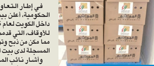
جانب من عبوات الأضاحي قبيل التوزيع