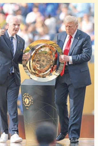
ترامب وإنفانتينو يحلمان كأس العالم

اعتبر الرئيس الأميركي دونالد ترامب أن الأسطورة البرازيلي الراحل بيليه هو أفضل لاعب كرة قدم على مر العصور،