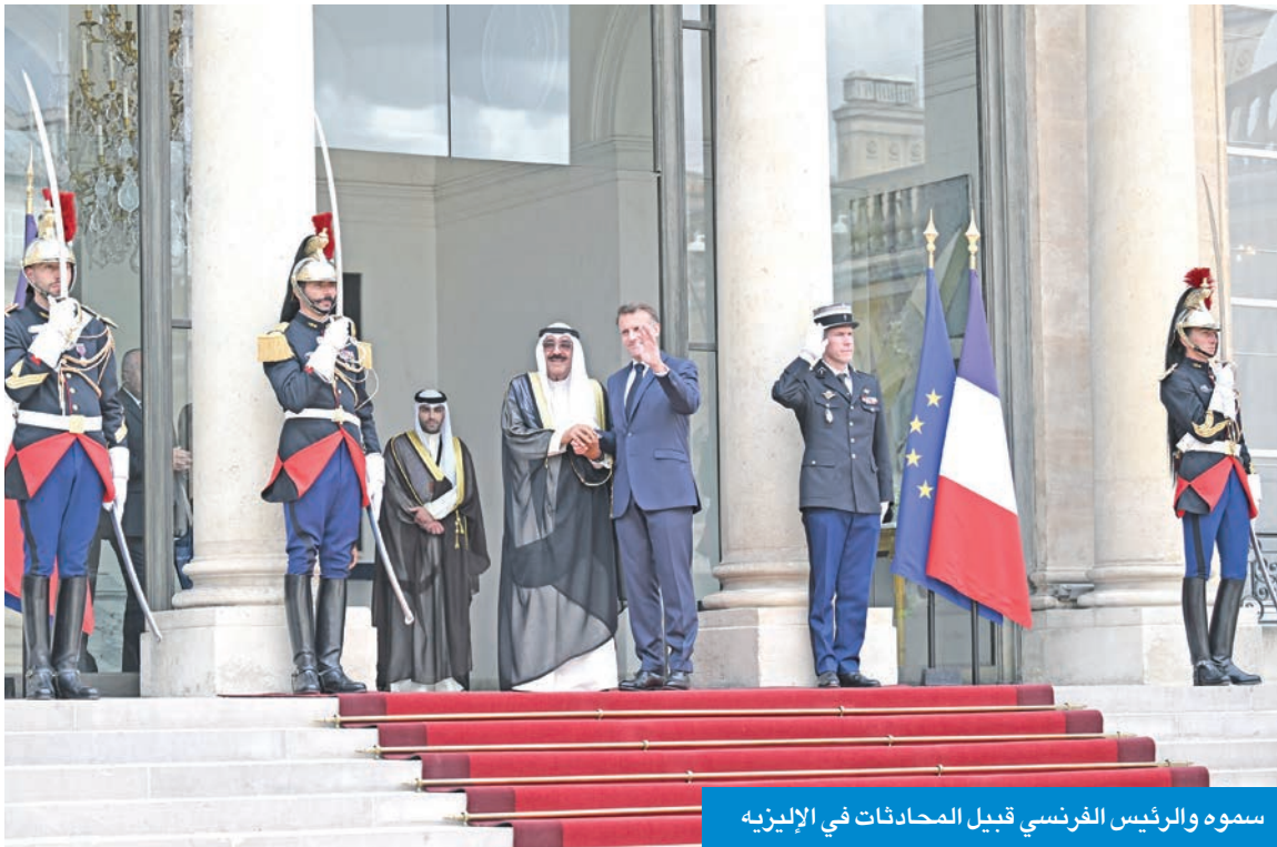
سموه والرئيس الفرنسي قبيل المحادثات في الإليزيه