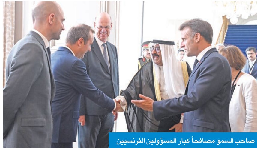
صاحب السمو مصافحاً كبار المسؤولين الفرنسيين