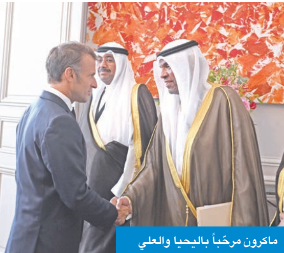
ماكرون مرحباً بالبعثا والعلي