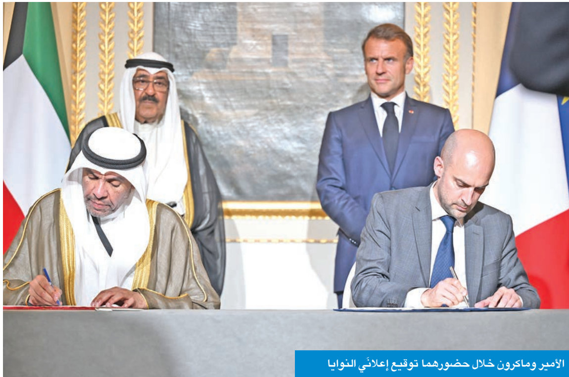
الأمير وماكرون خلال حضورهما توقيع إعلاني النوايا