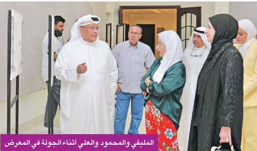
المليفي والمحمود والعلي أثناء الجولة في المعرض

المعرض يؤكد انفتاح مجلة العربي على كل المبدعين العرب المليفي