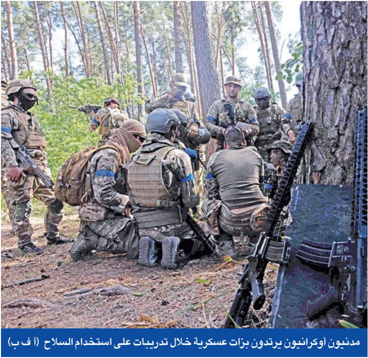
مديون أوكرانيون يرتدون بزات عسكرية خلال تدريباً على استخدام السلاح

وشراء الأسلحة بالتعاون مع أوروبا». في المقابل، قال مبعوث الرئيس الروسي فلاديمير بوتين للاستثمار، كيريل دميترييف، إن الحوار البناء مع الولايات المتحدة سيستمر، رغم محاولات إفشاله. وأشار عضو مجلس «الدوما» الروسي، ميخائيل شيريميت، إلى أن انزعاج الرئيس الأميركي، في أعقاب مكالمته الهاتفية مع بوتين، يعود إلى أنه أدرك خلال الاتصال أنه يواجه دولة قوية تتمسك بمصالحها الوطنية، ولا تخضع للضغوط الخارجية. وكان مساعد الرئيس الروسي، يوري أوشاكوف، قد أشار في وقت سابق إلى أن بوتين أبلغ ترامب خلال الاتصال الأخير، بأن روسيا ستمضي في تحقيق أهدافها بالنزاع الأوكراني، والعمل على إزالة الأسباب التي أدت إلى التوتر القائم. لكن الكرملين، حذر في وقت سابق من أن إرسال الأسلحة إلى أوكرانيا لن يؤدي سوى إلى إطالة أمد الصراع.