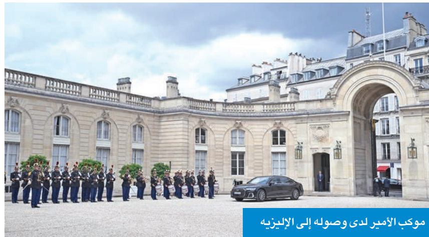
موكب الأمير لدى وصوله إلى الإليزيه