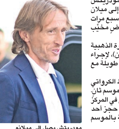
مودريتش يصل إلى ميلانو

يستعد الكرواتي المخضرم لوكا مودريتش (39 عاماً) لمغامرة جديدة، بالانتقال إلى ميلان الإيطالي، سعياً لمساعدة بطل أوروبا سيع مرات في استعادة أمجاده بعد موسم ماض مخيب للأصل. ومد مودريتش، الفائز بجائزة الكرة الذهبية لعام 2018، إلى إيطاليا أمس (الاثنين)، لإجراء الفحص الطبي مع ميلان، بعد مسيرة طويلة مع ريال مدريد استمرت 13 عاماً. ومن المنتظر أن يوقع لاعب الوسط الكرواتي على تعاقد لمدة عام مع خيار التمديد لموسم ثانٍ. أما ميلان، فقد أنهى الموسم الماضي في المركز الثامن بالدوري الإيطالي، وفشل في حجز أحد المقاعد المؤهلة للبطولات الأوروبية بالموسم الجديد.