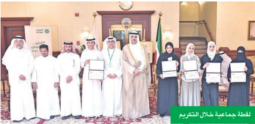
لقطة جماعية خلال التكريم

البنك لهذه الفعالية، التي لاقت استحساناً كبيراً من الطلبة المكرّمين وذويهم، تأتي ترسيخاً لمفهوم المسؤولية الاجتماعية الشاملة ضمن إطار البرنامج الذي دشّنه «التجاري»، منذ عدة سنوات لرعاية ومساندة الأنشطة والفعاليات المجتمعية والتربوية.