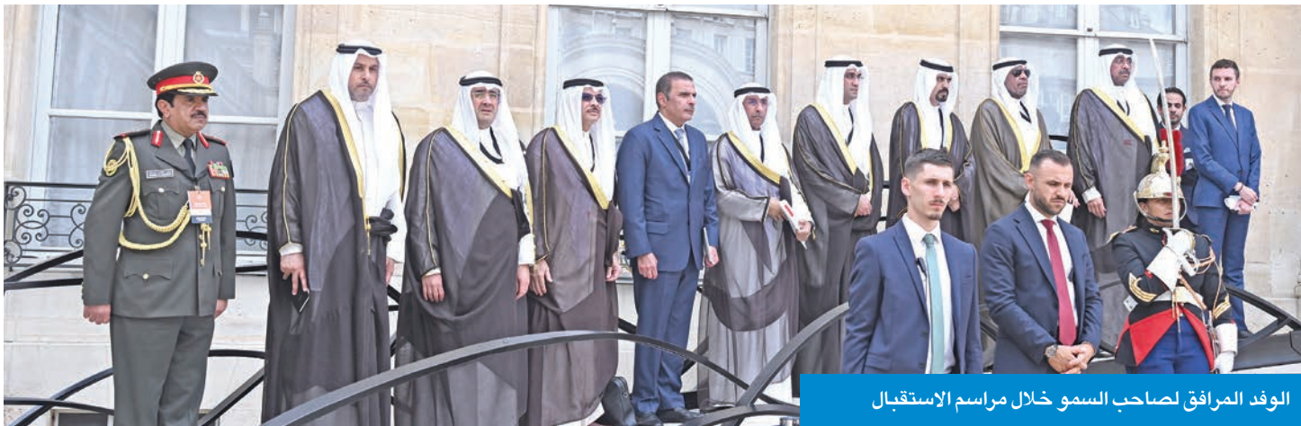
الوفد المرافق لصاحب السمو خلال مراسم الاستقبال