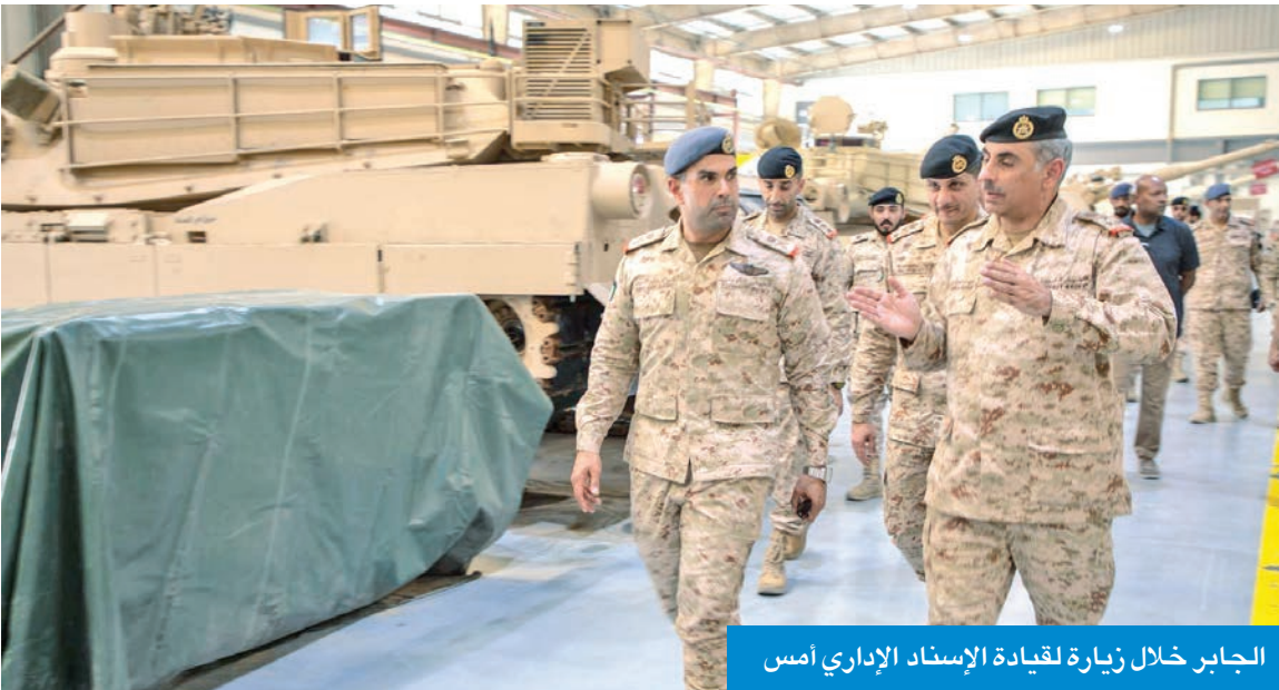
الجابر خلال زيارة لقيادة الإسناد الإداري أمس

حرص القيادة العسكرية على العمل المتبعة، وخطط الصيانة الدورية وبرامج التدريب والتأهيل الفني، التي تسهم في تعزيز الكفاءة التشغيلية ورفع الجاهزية القتالية. وفي الختام أعرب الجابر عن بالغ شكره وتقديره لجميع منتسبي قيادة الإسناد الإداري على تفانيهم وإخلاصهم في أداء واجباتهم. وتأتي هذه الزيارة في إطار