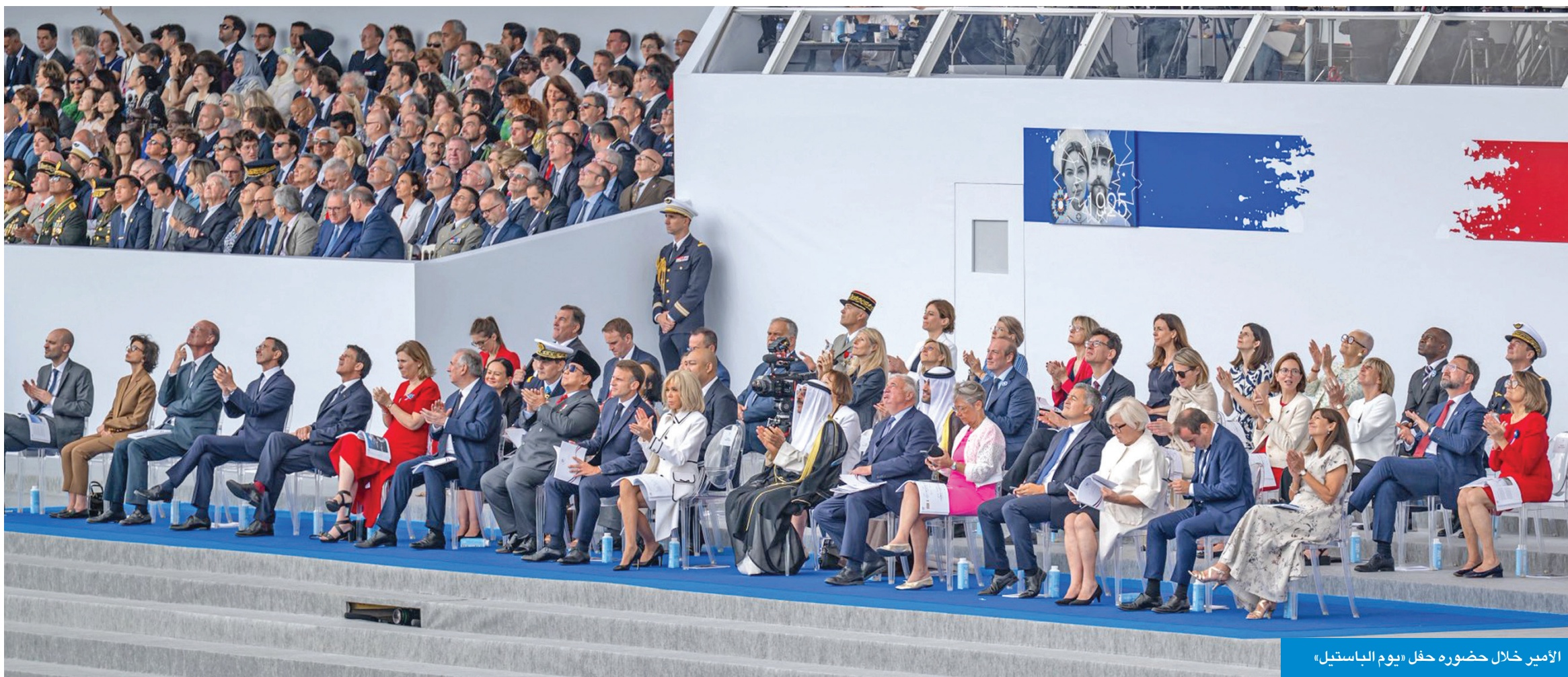
الأمير خلال حضوره حفل «يوم الباستيل»

سموه أعرب عن أمله بنجاحات متواصلة للتعاون وفق أسس راسخة من الثقة والاحترام المتبادل