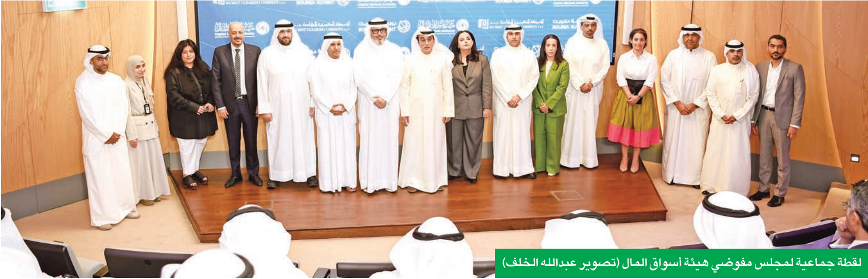
لقطة جماعية لمجلس مفوضي هيئة أسواق المال