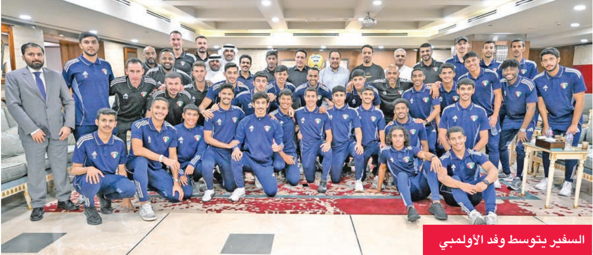
السفير يتوسط وفد الأولمبي

التي قدّمتها السفارة، مؤكدين أثرها الإيجابي على نجاح المعسكر. وقدّم الوفد للسفير الغانم درعاً تذكارية وقيمى الأزرق، عرفاناً بهذه المبادرة الكريمة التي تجسد روح التشجيع والدعم الرسمي للرياضة الكويتية.