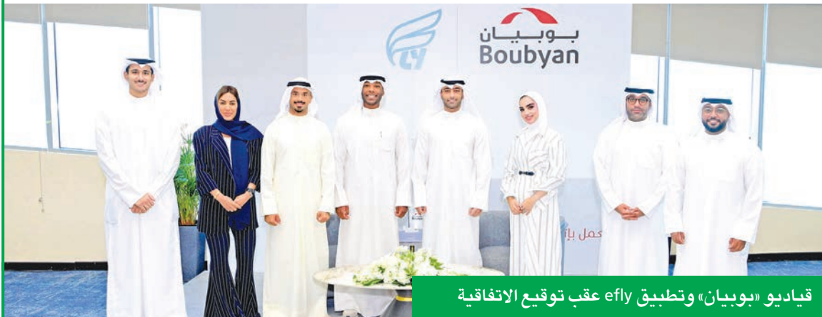
قياديو «بويان» وتطبيق efly عقب توقيع الاتفاقية