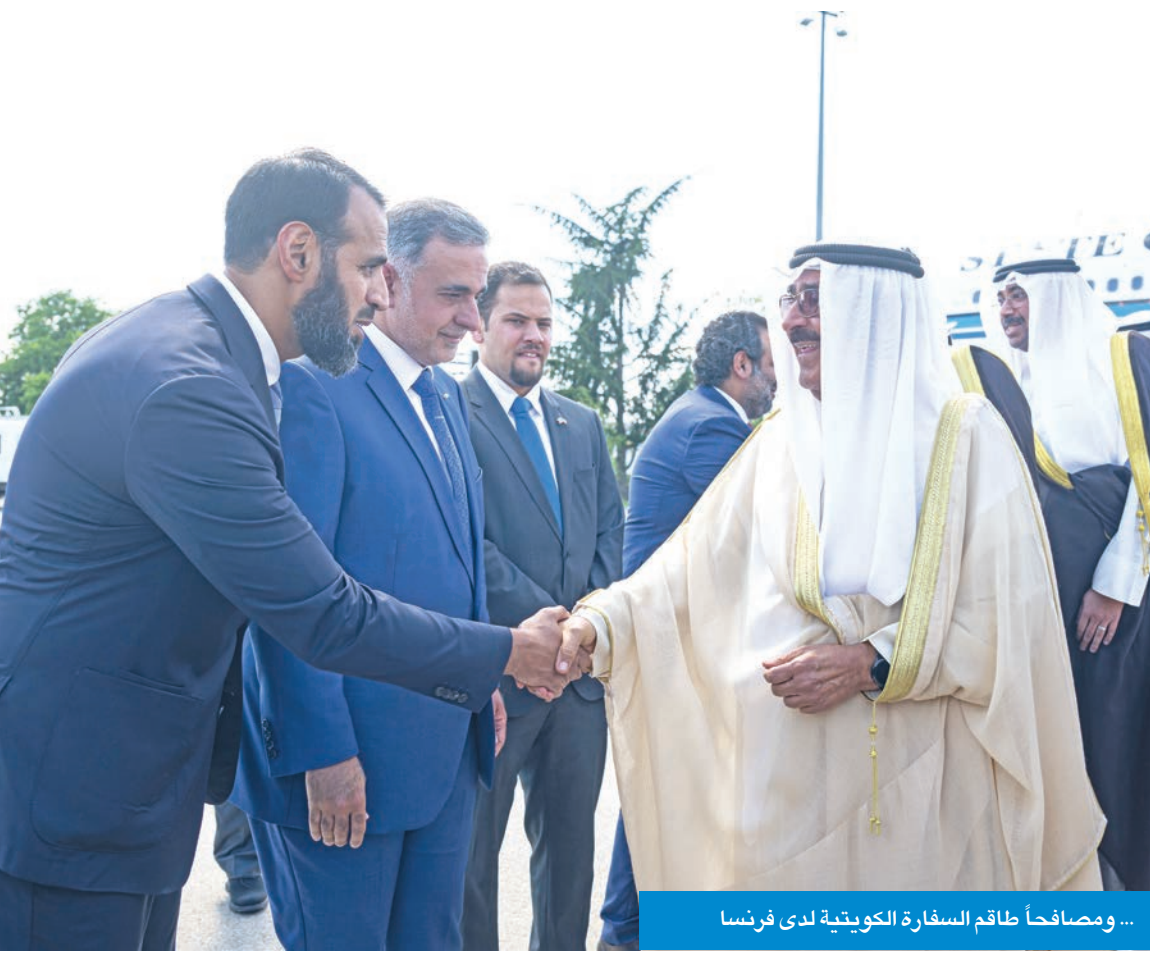
... ومصافحاً طاقم السفارة الكويتية لدى فرنسا

● «الإليزيه»: رغبة مشتركة في تكثيف الحوار والتنسيق الثنائي في مواجهة الأزمات الإقليمية الكبرى