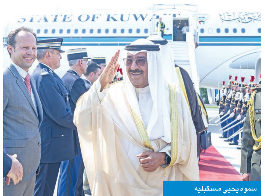
سموه يحيي مستقبليه

في أول زيارة له إلى فرنسا بعد توليه مقاليد الحكم في البلاد، وصل سمو أمير البلاد الشيخ مشعل الأحمد والوفد الرسمي المرافق لسموه، ظهر أمس، إلى الجمهورية الفرنسية الصديقة، وذلك في زيارة رسمية. وكان في استقبال سموه على أرض المطار، وزير الصحة الدكتور أحمد العوضي، وسفير دولة الكويت لدى الجمهورية الفرنسية عبدالله الشاهين، ومدير أمن مطارات باريس ستيفان داغوين، والملحق العسكري في السفارة الفرنسية لدى دولة الكويت العقيد فرانسوا ديكس، وأعضاء سفارة دولة الكويت، ورؤساء المكاتب الملحق والفنية المعتمدة في العاصمة الفرنسية باريس. وكان في وداع سموه على أرض المطار، لدى مغادرته