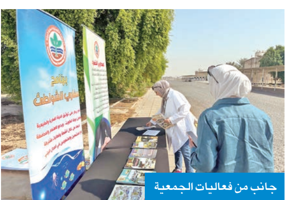
جانب من فعاليات الجمعية