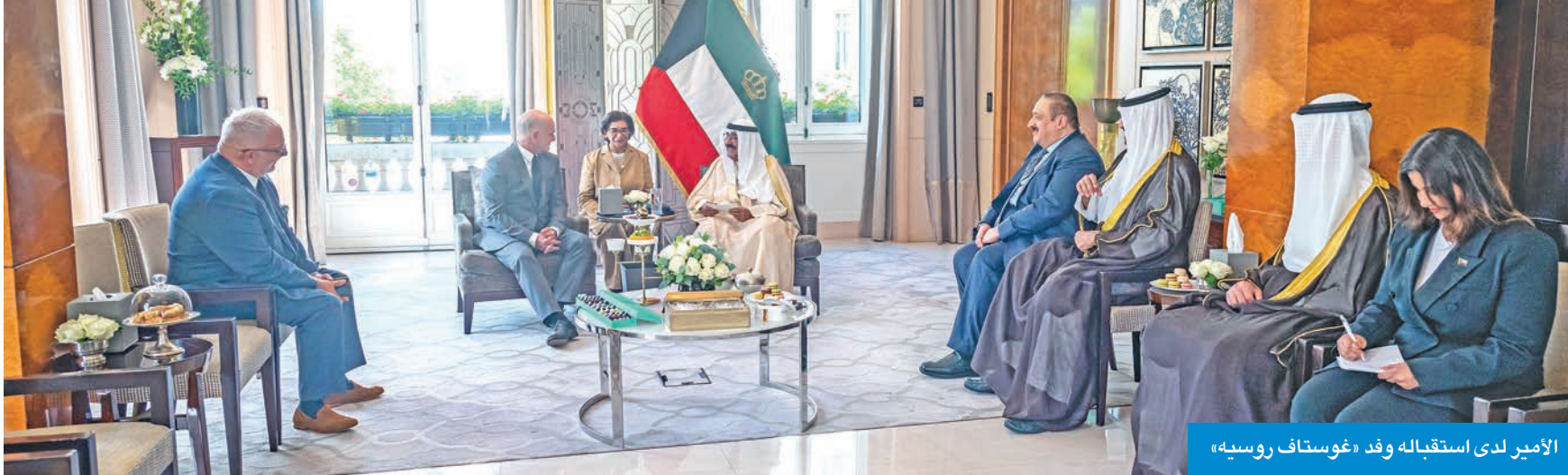
الأمير لدى استقباله وفد «غوستاف روسيه»

سموه التقى رئيس مستشفى غوستاف روسيه وأكد تعزيز الشراكة لتطوير الرعاية الصحية