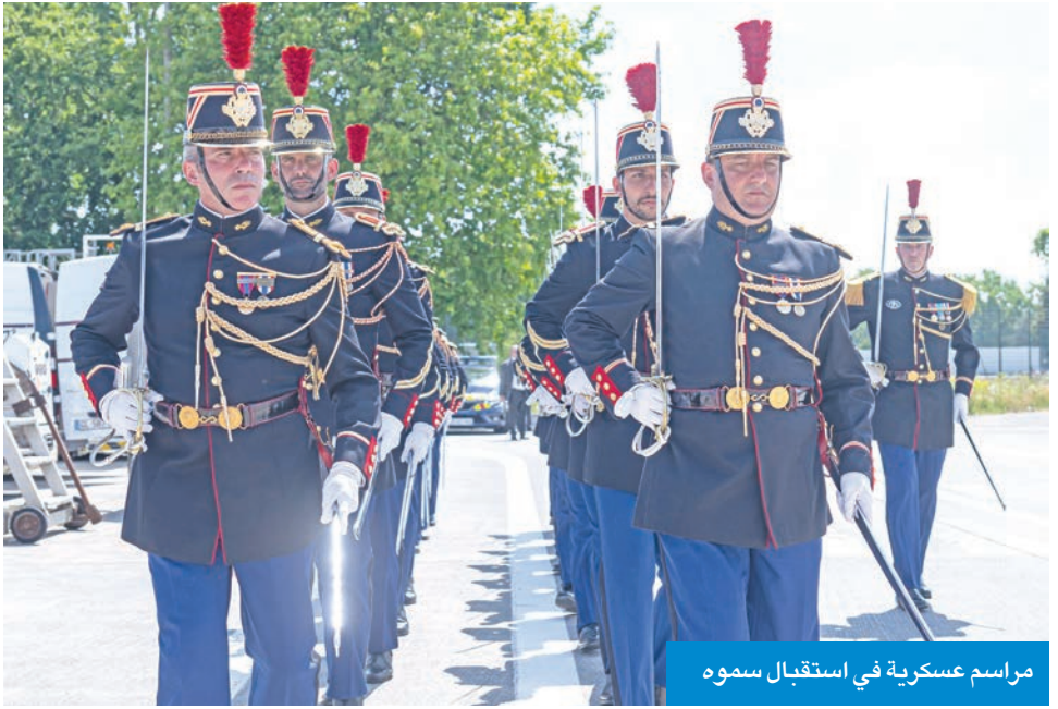
مراسم عسكرية في استقبال سموه

ويحرص البلدان على تعزيز هذه العلاقة عبر لقاءات رفيعة المستوى وتعاون مستمر في المحافل الدولية، حيث تتطابق وجهات النظر في العديد من القضايا، لا سيما احترام القانون الدولي ودعم جهود الوساطة والحوار لحل النزاعات سلمياً.