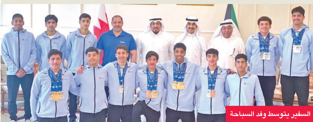
السفير يتوسط وفد السباحة