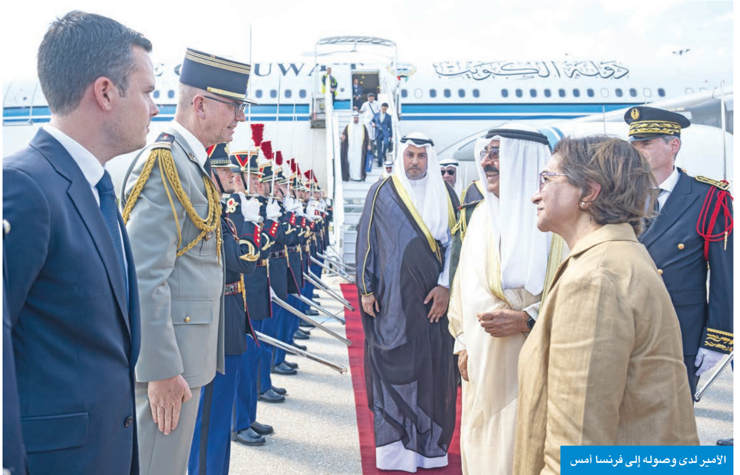
الأمير لدى وصوله إلى فرنسا أمس