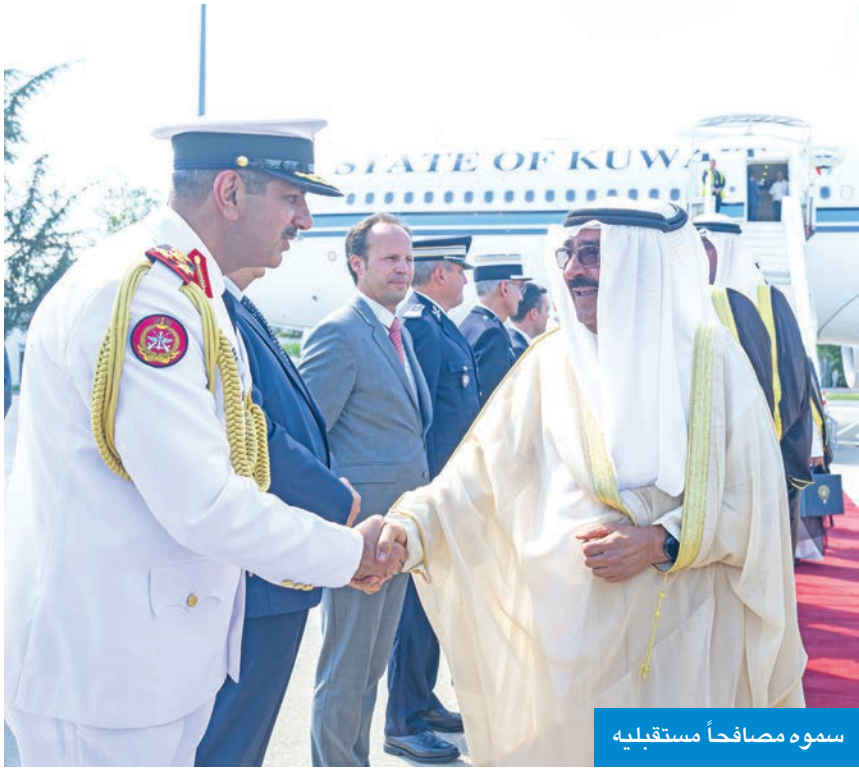
سموه مصافحاً مستقبليه

الاقتصادية بين البلدين تسجل نموا ملموسا؛ سواء من حيث التبادل التجاري أو الاستثمارات المشتركة في ضوء الحرص المتبادل على توسيع آفاق التعاون في مجالات الطاقة المتجددة والتكنولوجيا والاقتصاد الأخضر، بما يتماشى مع رؤية الكويت التنموية 2035. وفي الجانب الثقافي، أكد