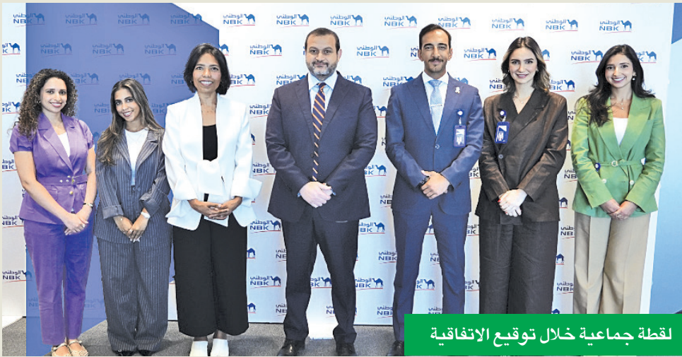
لقطة جماعية خلال توقيع الاتفاقية

وتأسس مجلس الكويت للمباني الخضراء بشكل رسمي ككيان غير ربحي وغير حكومي في عام 2017، ويهدف كمنظمة قائمة على عضوية الجهات والأطراف المعنية إلى تشجيع ودعم التنمية العمرانية والحضرية المستدامة في الكويت، ويتنصب مجلس الكويت للمباني الخضراء إلى شبكة عالمية تضم أكثر من 75 مجلساً للمباني الخضراء تعمل تحت مظلة المجلس