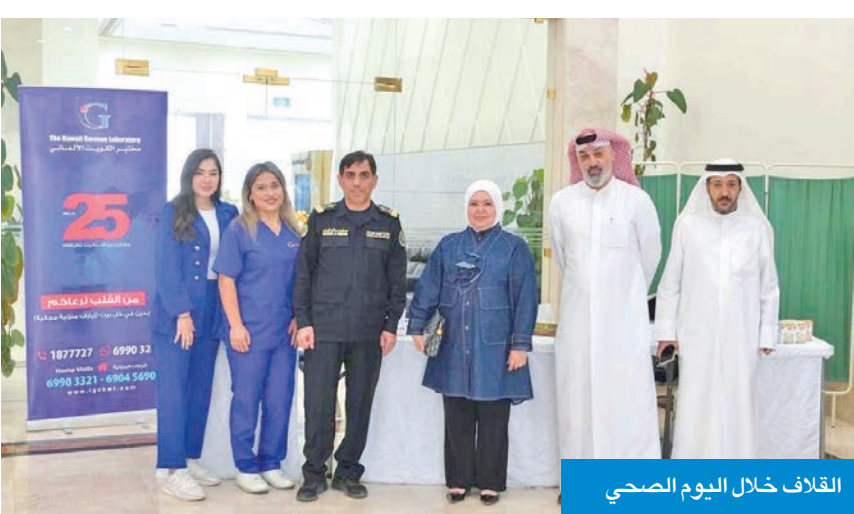
القلاف خلال اليوم الصحي