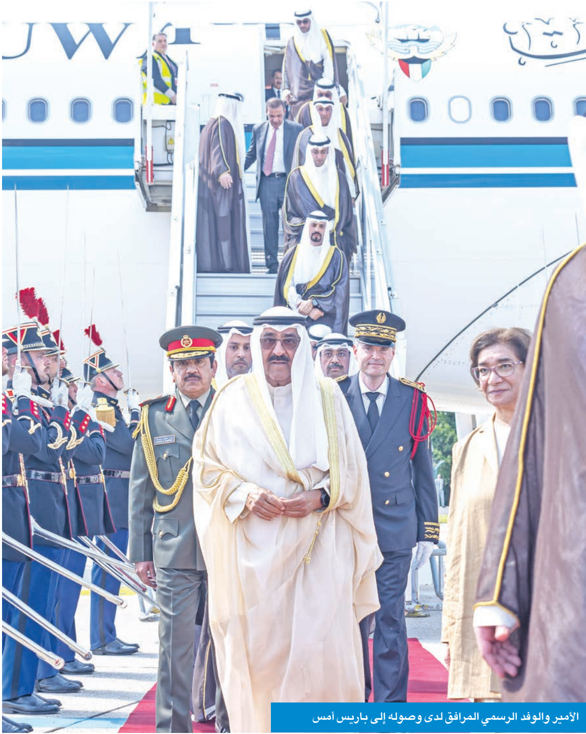
الأمير والوفد الرسمي المرافق لدى وصوله إلى باريس أمس