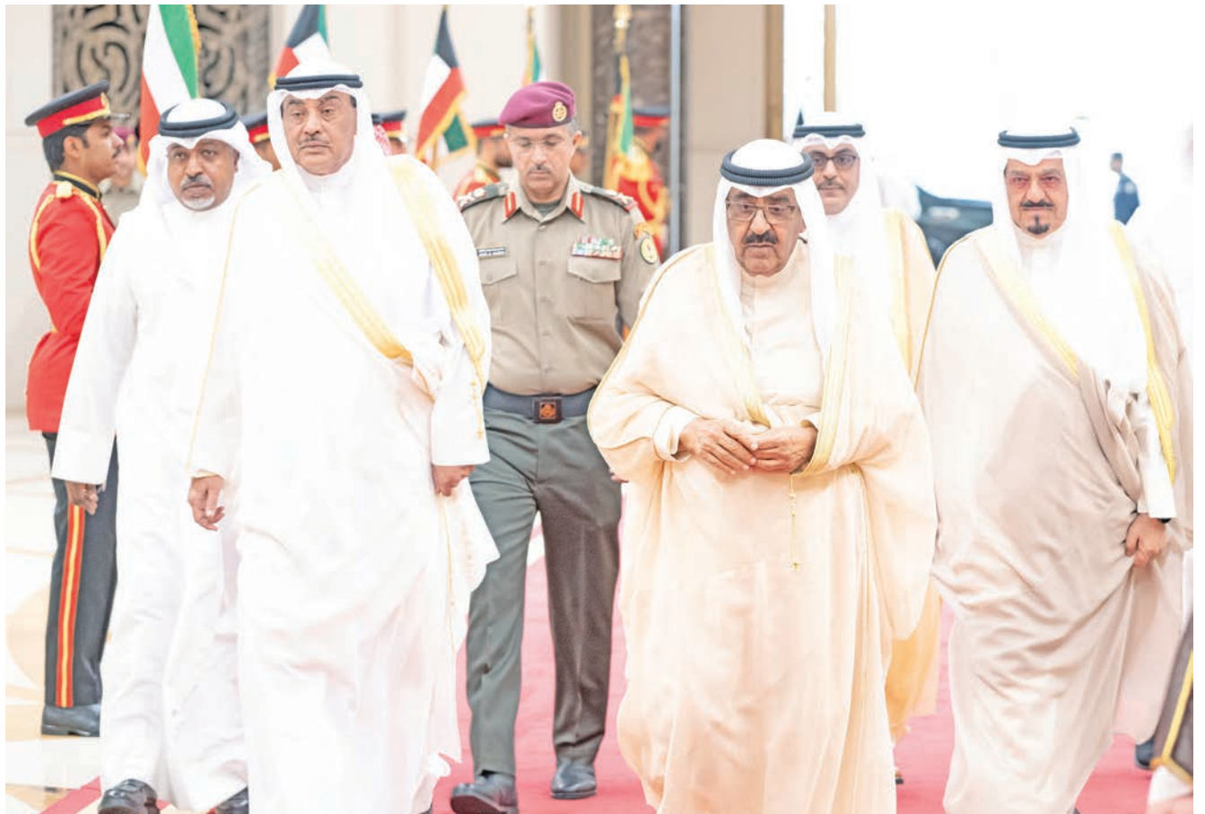
صاحب السمو لدى مغادرته إلى فرنسا وفي وداعه نائب الأمير ولي العهد ورئيس الوزراء

الشيخ عبدالله العلي، ووزير الخارجية عبد الله الجحيا، ومدير عام هيئة تشجيع الاستثمار المباشر الشيخ د. مشعل الجابر، فضلاً عن عدد من كبار المسؤولين بالدولة.