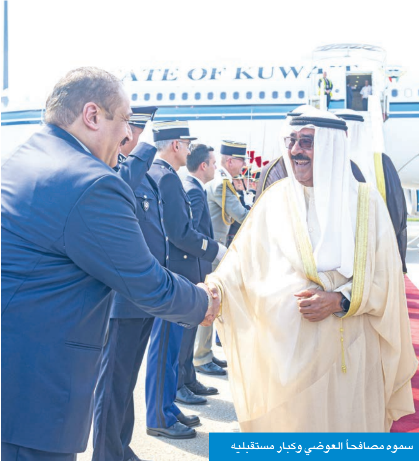
سموه مصافحاً العوضي وكبار مستقبليه

سموه وصل إلى باريس والتقى سان مارتين وغرفة التجارة الفرنسية ومسؤولي مستشفى غوستاف روسيه ● الرئاسة الفرنسية: زيارة سموه تعزيز للشراكة الشاملة في الدبلوماسية والدفاع والاقتصاد والصحة