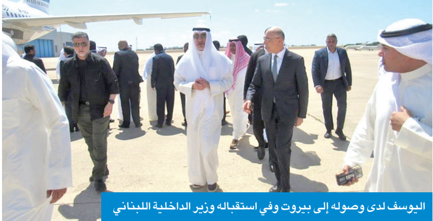
اليوسف لدى وصوله إلى بيروت وفي استقباله وزير الداخلية اللبناني

لدى وصوله إلى مطار رفيق الحريري الدولي، وزير الداخلية، الشيخ فهد اليوسف، إلى العاصمة اللبنانية بيروت، أمس، في زيارة رسمية يلتقي خلالها كبار المسؤولين. وكان في استقبال اليوسف والوفد المرافق له