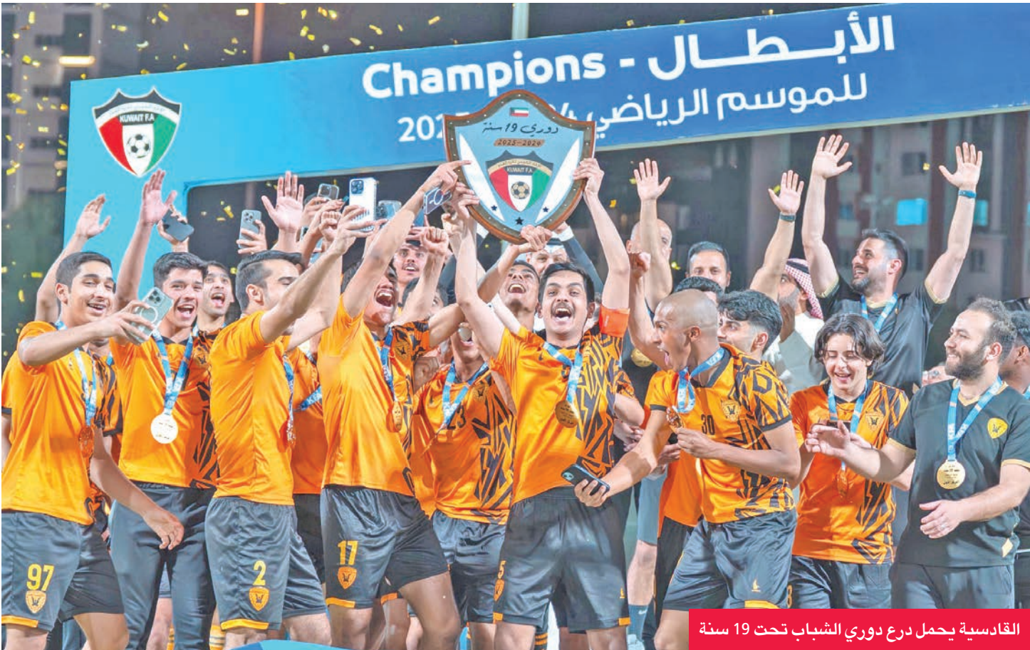
القادسية يحمل درع دوري الشباب تحت 19 سنة

على ملعب فاروق إبراهيم بالنادي، بسبب إخضاع استاد محمد الحمد لأعمال الصيانة، الذي يستسلمه النادي في الثاني من شهر سبتمبر المقبل.