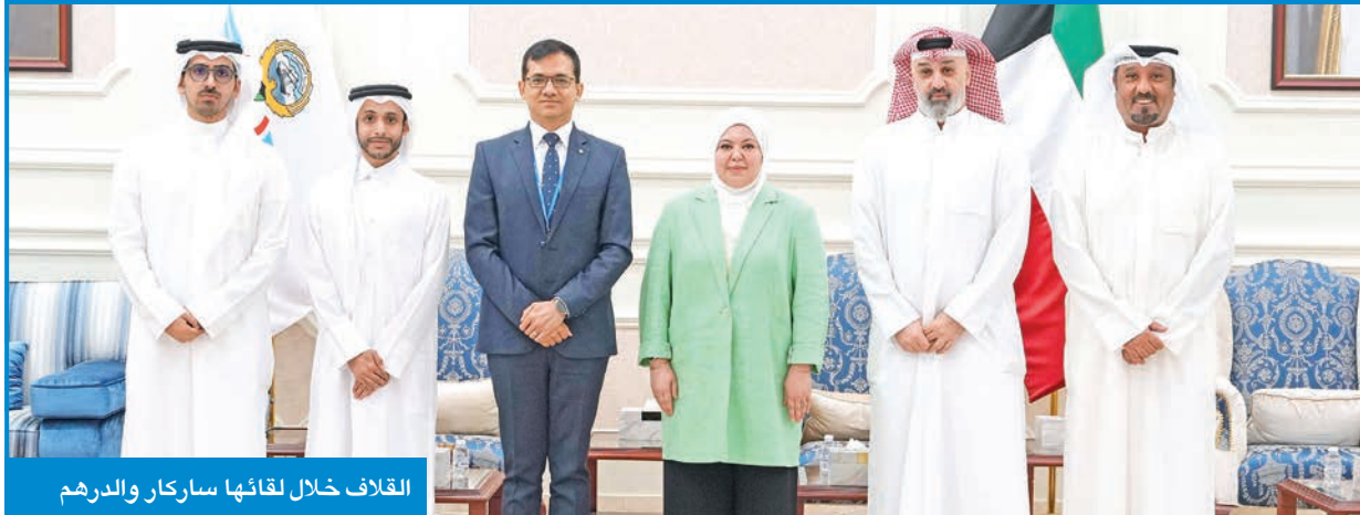
الغلاف خلال لقائهما ساركار والدرهم

الإدارة في هذا السياق، علاوة على تبادل وجهات النظر بشأن أفضل الممارسات الدولية، وفرص تعزيز التعاون المشترك بين الجهات المعنية محلياً ودولياً.