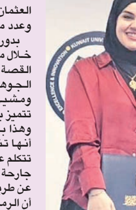
الشعبي مكرمة المشاركات في الندوة

وأضافت أن حضور المرأة في الأدب يمتلك شقين؛ أولهما أن تكون المرأة هي الكاتبة وصاحبة النص، مستعضة نماذج بارزة من الأدبيات الكويتية في هذا السياق، حيث كانت الأدبية العثمان من أوائل من اقتحموا مجال القصة القصيرة،