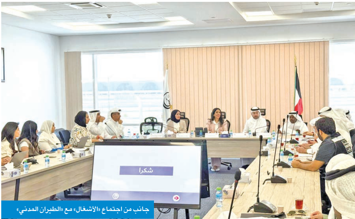
جانب من اجتماع «الأشغال» مع «الطيران المدني»

العمل، والانتهاه من المشروع وفق البرنامج الزمني المعتمد، بما يسهم في تعزيز البنية التحتية لقطاع النقل الجوي وإزالة المعوقات، ورفع كفاءة الخدمات المقدمة في مطار الكويت الدولي.