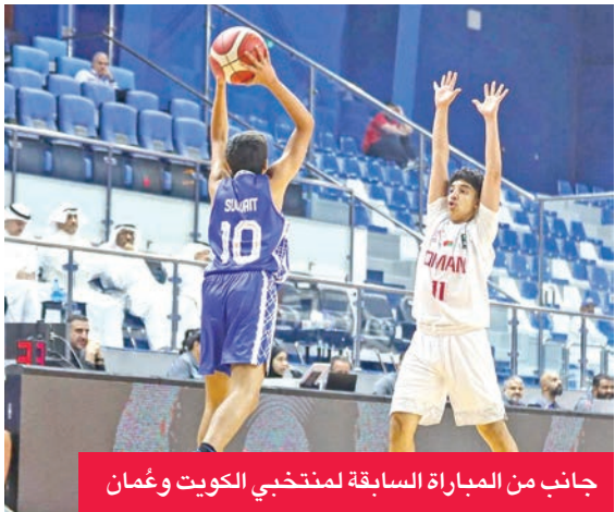
جانب من المباراة السابقة لمنتخبي الكويت وعمان

في المنافسة على حجز إحدى بطاقتي التذاكر لنهائيات كأس آسيا، التي يصعد إليها المنتخبان الأول والثاني في البطولة الخليجية، عبر بوابة المنتخب السعودي، والطامح كذلك في إيقاف تقدم «الأزرق» وانزاع المركز الثاني، وبالتالي تأمين مقعد في نهائيات آسيا المقبلة، في مباراة من المتوقع أن تكون صعبة على الطرفين.