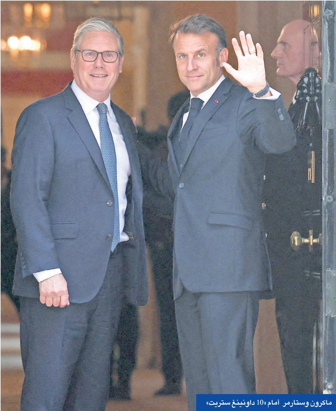
ماكرون وستارمر أمام «10 داوونينغ ستريت»

أس الأول الأربعاء، في داوونينغ ستريت، اتفقا على تحقيق «تقدم ملموس» في مكافحة الهجرة غير النظامية. وتشكل هذه القضية الشائكة مصدرا للتوتر بين البلدين، إذ تُتهم فرنسا بالتقصير في بذل الجهود الكافية للحد من الهجرة غير النظامية، بينما تريد المملكة المتحدة، من جهتها، أن تبذل فرنسا المزيد من الجهود لمنع القوارب من مغادرة سواحلها، في حين ذكر تقرير برلماني بريطاني أن لندن قدمت أكثر من 750 مليون يورو منذ عام 2018 لتمويل تأمين الحدود.