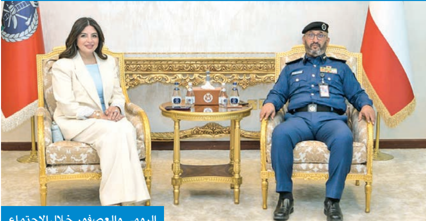
الرومي والعصفور خلال الاجتماع