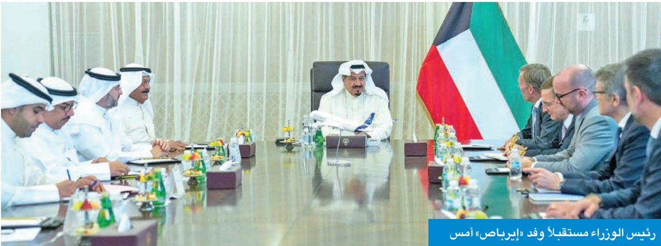
رئيس الوزراء مستقبلاً وفد «إيرباص» أمس

حضر الاجتماع رئيس ديوان رئيس مجلس الوزراء عبدالعزیز الدخيل، ورئيس الإدارة العامة للطيران المدني الشيخ حمود المبارك.