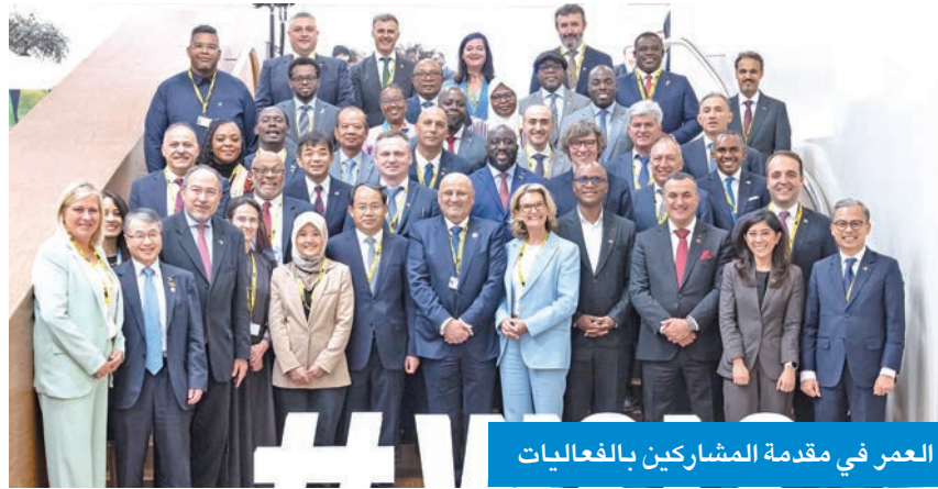
العمر في مقدمة المشاركين بالفعاليات

كذلك خلال الاجتماعات التي حضرها المندوب الدائم لدولة الكويت لدى الأمم المتحدة والمنظمات الدولية الأخرى في جنيف السفير ناصر الهين، سبل تعزيز مجالات التعاون المشترك مع منظمة التعاون الرقمي. وبدأت «القمة العالمية لمجتمع المعلومات 2025»، أعمالها الاثنين الماضي في جنيف بمشاركة الكويت ممثلة بالوزير العمر على رأس وفد رفيع المستوى.