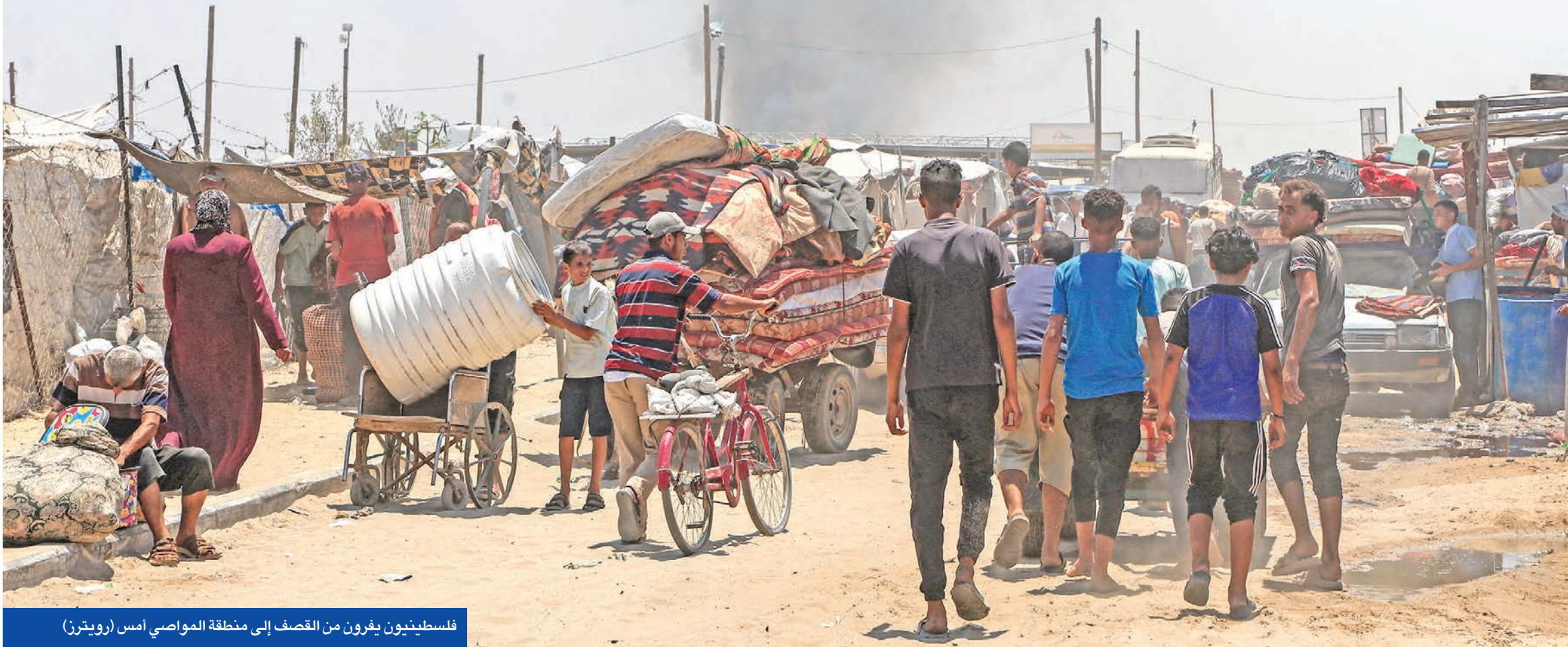
فلسطينيون يفرون من القصف إلى منطقة المواصي

اتفاق إسرائيلي - أوروبي لإدخال المساعدات... ومجموعة تضم قطر لإعادة الإعمار