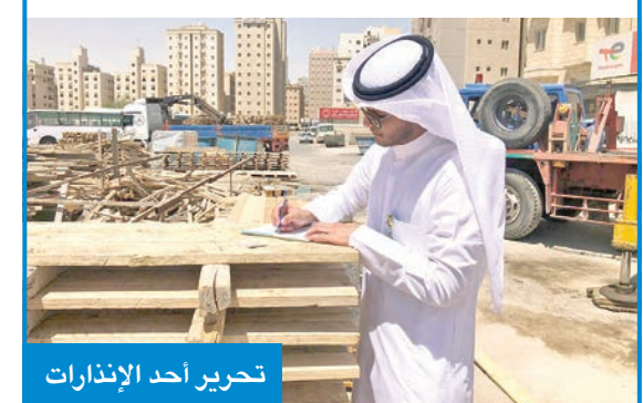
تحرير أحد الإنذارات

أعلنت إدارة العلاقات العامة انطلاق ثاني حملات التفتيش للفرق الرقابية في إدارات السلامة في نطاق المحافظات الست على الأعمال الإنشائية، وتوفير وسائل الأمن والسلامة ورصد المخالفات في مواقع الإنشاء والترميم.