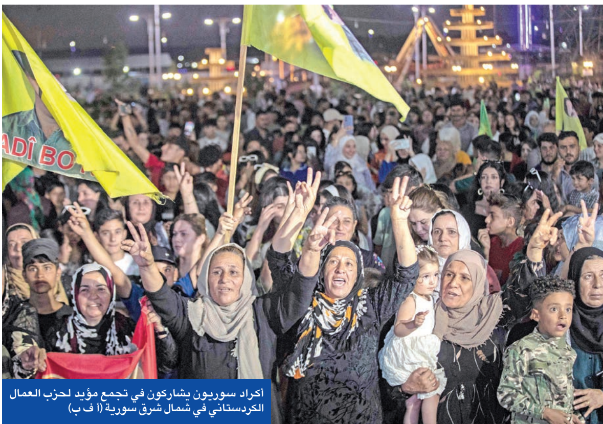
اكراد سوريون يشاركون في تجمع مؤيد لحزب العمال الكردستاني في شمال شرق سورية

الجيش السوري وفق الأطر الدستورية، مؤكدة أن المكون الكردي جزء أصيل من النسيج الوطني السوري، وأن الحقوق تُصان ضمن الدولة، لا خارجها.