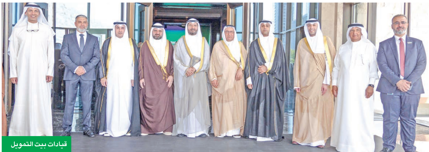
قيادات بيت التمويل

«بيت التمويل» ترسخت مكانته ليصبح أكبر بنك في الكويت من حيث القيمة السوقية