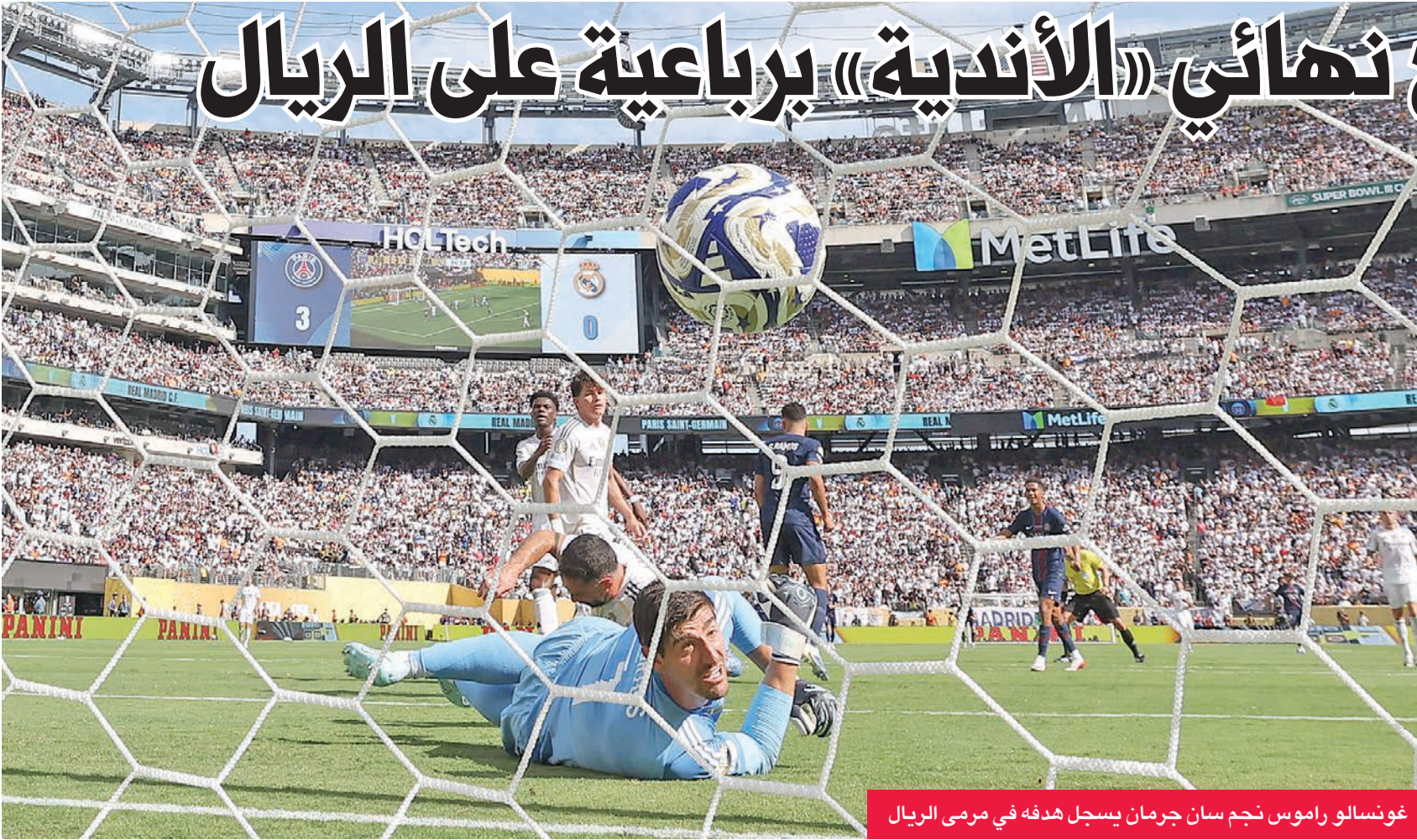
غونسالو راموس نجم سان جرمان يسجل هدفه في مرمى الريال

لحق باريس سان جرمان الفرنسي، بطل أوروبا، بتشلسي الإنكليزي، بطل كؤفرنس ليغ، إلى المباراة النهائية لمونديال الأندية لكرة القدم، بعدما لقي ريال مدريد الإسباني درسا في فنون اللعبة، وهزمه برعاية نظيفة أمس الأول الأربعاء، على ملعب ميتلايف ستادיום في نيويورك، في ختام نصف النهائي.