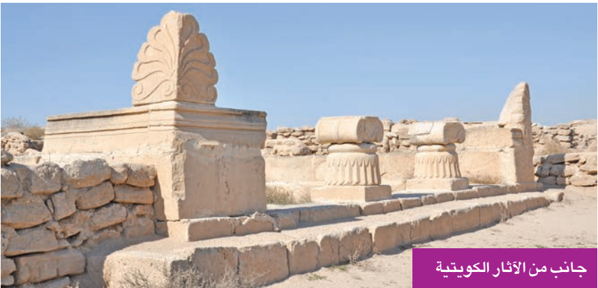
جانب من الآثار الكويتية

عبر مجموعتها الشهيرة «المرأة والقنديل»، الصادرة عام 1971، تلتهها الأدبية أنيسة الرفاعي بمجموعتها القصصية «بين زمنين»، التي شكّلت انطلاقتها الأدبية. وأشادت النشوان بالفوز الأخير للذكورة نجمة إدريس بجائزة الملتقى للقصة القصيرة العربية، معتبرة أن هذا الفوز يمثل إنجازاً مهماً للمرأة الكويتية الكاتبة، ويعكس فاعليتها وتأثيرها في المشهد الأدبي.