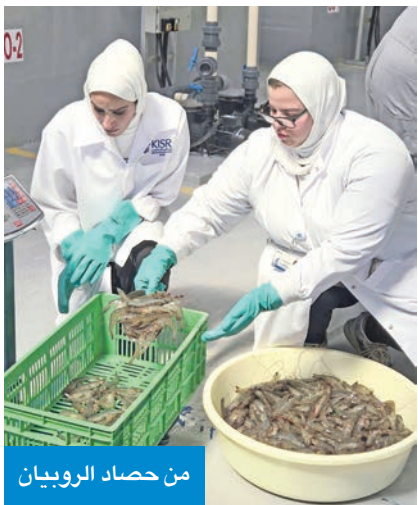
من حصاد الروبيان