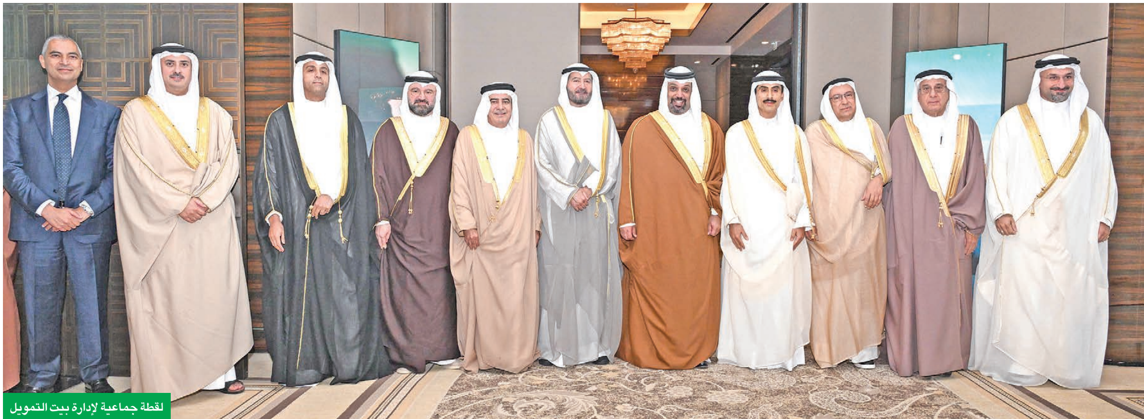
لقطة جماعية لإدارة بيت التمويل

تغيير اسمه رسمياً إلى «بيت التمويل الكويتي - البحرين» تحت مظلة المجموعة