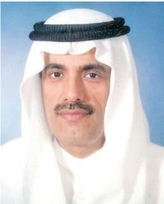
عبدالكريم سعود البابطين

وقد قام بهذا العمل الجليل رجل فذ افتقده الكويت والأمة العربية بتاريخ 21 رمضان 1446هـ الموافق 21 مارس 2025، بعد أن وضع نفسه وإمكاناته لخدمة وطنه وأمتة، وأنجز خلال حياته ما قرّ كثرة كان منها هذه المكتبة القمتة التي حرص على جمعها من مصادرهما المختلفة، وأهداها إلى مكتبة البابطين المركزية للشعر العربي، ومن ضمنها آلاف من كتب النوادر التي تحفل في سبيل العثور عليها معاجم كبيرة، وأسفاراً كثيرة في مختلف بقاع الأرض، واتصالات لا تهْدأ، وبحثاً لا يكل عن أماكن وجودها. هذا الرجل هو الراحل عبدالكريم سعود البابطين رحمه الله- الذي قدم