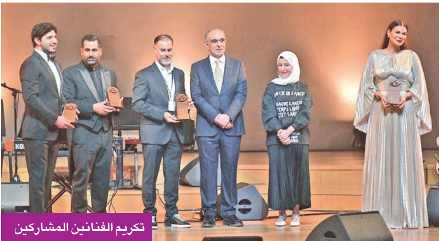
تكريم الفنانين المشاركين

للثقافة» عبدالرحمن المطيري، إن المجلس الوطني دأب منذ تأسيسه على أن يكون راعياً وداعماً لكل ما ينهض بالعلم، ويثيري الروح، ويعزز حضور الثقافة في تفاصيل الحياة اليومية، وهذا المهرجان يمثل تجسيدا عملياً لهذا التوجه، إذ يحمل في طياته برنامجاً متنوعاً وشاملاً يلامس اهتمامات كل الفئات العمرية، ويمنح منصات حيوية لصوت الفكر والإبداع. وأكد د. الجسار أن «الوطني