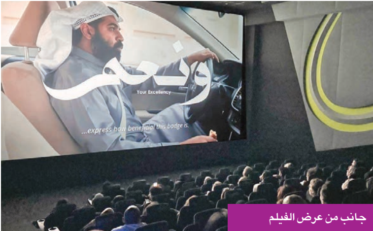
جانب من عرض الفيلم

وتصدرت النجمة لبنى عبدالعزيز الملصق الدعائي للعمل، والذي نشرته منصة «شاهد» عبر صفحاتها على «إنستغرام»، حيث ظهرت منفردة ممسكة بكلايتك التصوير. في لقطة رمزية تعكس تصدرها للمشاهد الدرامي بكل قوة وحضور.