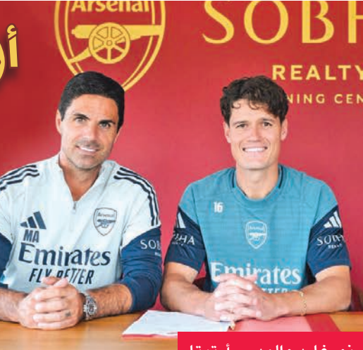
نورغارد والمدرّب أرتيتا

ووصل اللاعب الدنماركي إلى صفوف «المدفعية» بموجب صفقة تشمل 10 ملايين قيمة