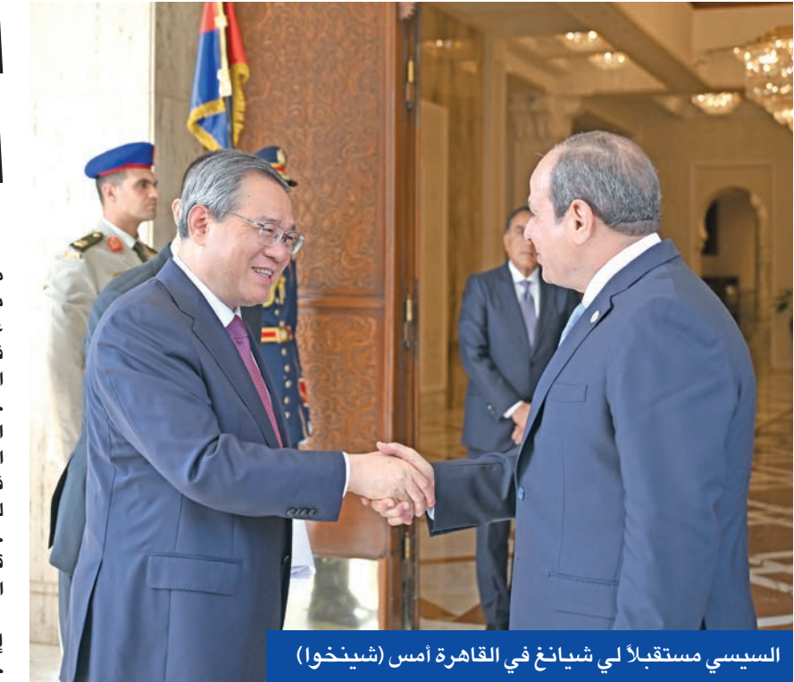
السيسي مستقبلا لي شيانغ في القاهرة أمس

وسط إشارات متزايدة إلى ميلان في ميزان السياسة الخارجية المصرية باتجاه الشرق، أكد الرئيس المصري عبدالفتاح السيسي، خلال استقباله في القاهرة، أمس، رئيس مجلس الدولة الصيني (رئيس الحكومة) لي شيانغ، حرص بلاده على تعزيز التعاون مع الصين، والعمل على تفعيل الشراكة الاستراتيجية الشاملة بين البلدين، فيما عبر لي عن استعداد الصين للعمل مع مصر على ممارسة تعددية حقيقية، وتعزيز عالم متعدد الأقطاب قائم على المساواة والنظام، وعولمة اقتصادية شاملة ومفيدة عالميا. وقال المتحدث الرئاسي المصري إن السيسي أشاد خلال اللقاء، الذي حضره رئيس الحكومة المصرية