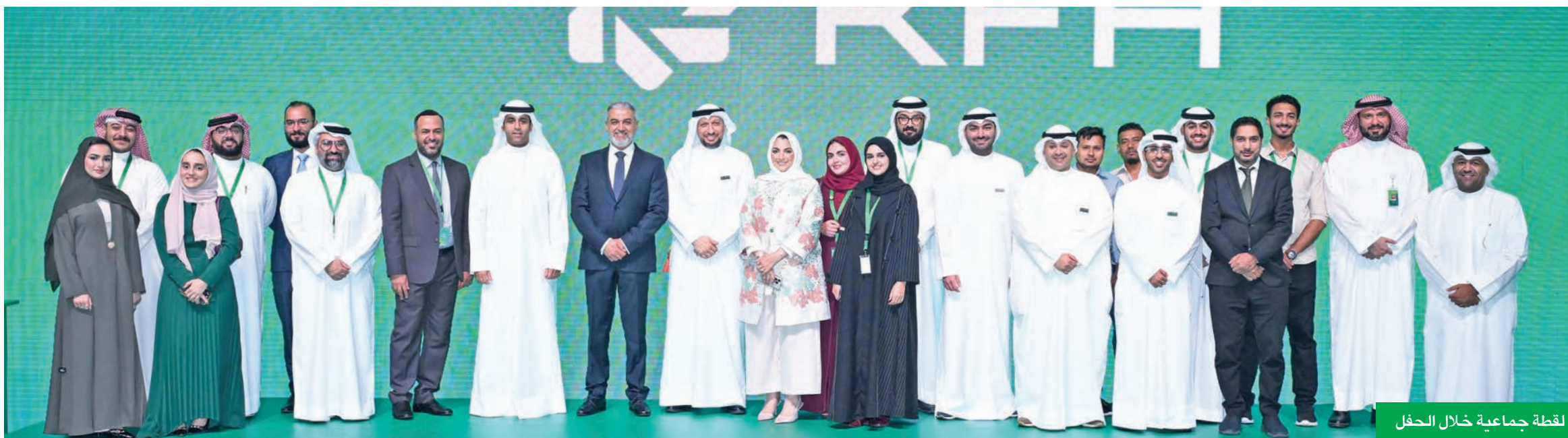
لقطة جماعية خلال الحفل