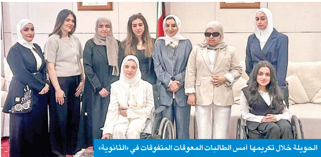
الحويلة خلال تكريمها أمس الطالبات المعوقات المتفوقات في «الثانوية»

ووعدت الحويلة أولياء أمور ذوي الإعاقات الشديدة، لاسيما «السريية» منها، بالتواصل مع مسؤولي اتحاد المصارف لحل أي إشكالية، وتذليل العقبات التي تقف حائلاً أمام أبنائهم، والخاصة بإنجاز المعاملات البنكية، لافتة إلى أن «كود البناء» الخاص بسهولة وصول ذوي الإعاقة يطبق حالياً على جميع المباني الحديثة أو قيد الإنشاء، كما أن هناك فرقاً ميدانية مكلفة بمهام زيارة الأساكين العامة والمجمعات التجارية لإزالة أي معوقات أمام سهولة وصول المعاقين. وكشفت أن «هناك مطالبات أممية بشمولية تشخيص حالات الإعاقة، لتتضمن، إلى جانب الحالة الصحية وتحديد نوع ودرجة الإعاقة، الحالة الاجتماعية والبيئة المعيشية أيضاً، إذ تسعى إلى بلوغ ذلك بالتعاون الواسع الذي يتم حالياً من الجهات الحكومية المعنية، وأعادة بالتنسيق مع وزير التعليم العالي د. نادر الجلال، لتوفير معلمي لغة إشارة داخل محاضرات الطلبة، ليتسنى استفادة أصحاب الإعاقات السمعية، مؤكدة توجه الدولة للراهن نحو التوسع في التحول الرقمي، والاستفادة القصوى من التكنولوجيا الحديثة في إنجاز المعاملات دون أدنى معاناة.