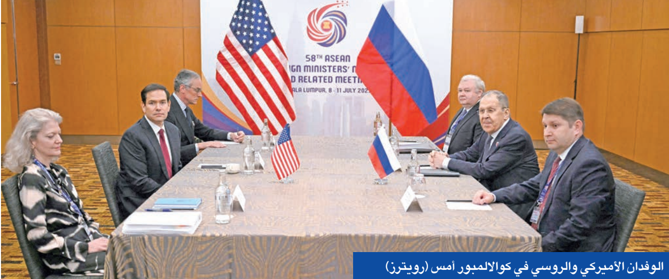
الوفدان الأميركي والروسي في كوالالمبور أمس

باستخدام مسدس مزود بكام للصوت، وبينما لم تُعرف بعد الجهة المنفذة، اعتبر مراقبون روس أن العملية «رسالة موجية للعمق الأوكراني».