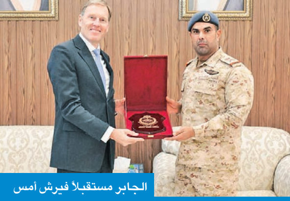
الجابر مستقبلاً فيرش أمس

استقبل نائب رئيس الأركان العامة للجيش اللواء الركن طيار صباح الجابر أمس، نائب الرئيس التنفيذي الدولي عضو اللجنة التنفيذية لشركة إيرباص فوتر فان فيرش والوفد المرافق له. وتمت خلال اللقاء مناقشة أهم الأمور والمواضيع ضمن محور الزيارة. حضر اللقاء رئيس هيئة التسليح والتجهيز العميد الركن خليفة الدعيج، وأمر القوة الجوية العميد الركن طيار محمد الحمدان.