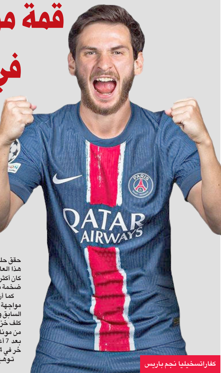
كفاراتسخيليا نجم باريس