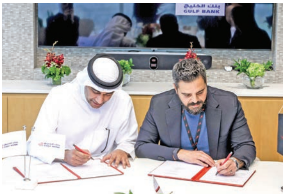
خلال توقيع مذكرة التفاهم