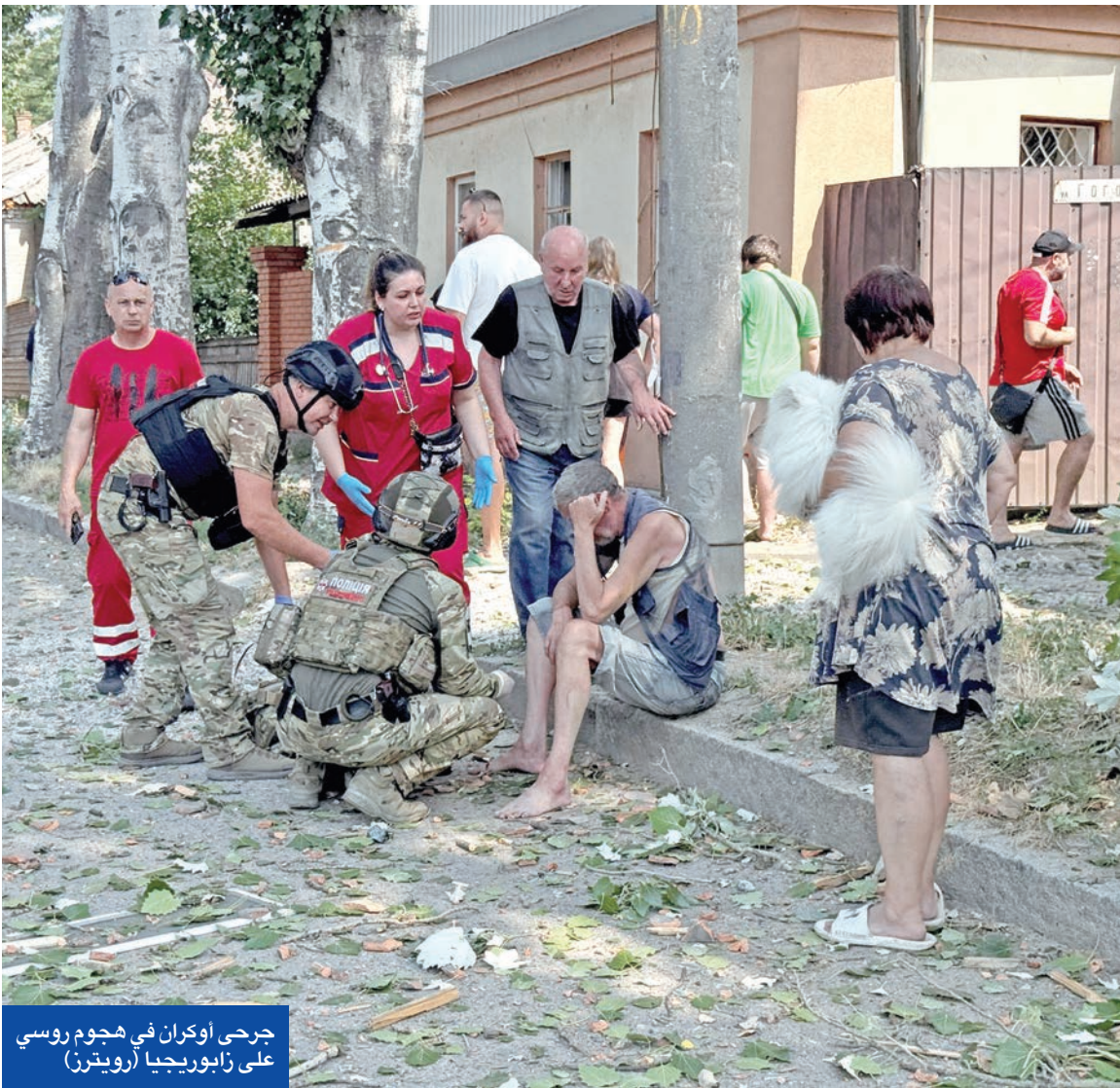
جرى أوكران في هجوم روسي على زابوريجيا