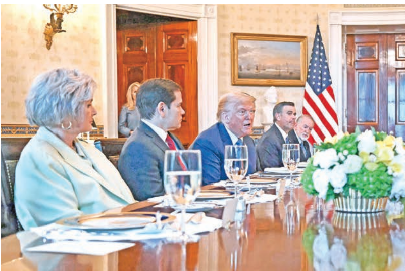
استقبال ترامب لنتنياهو بالغرفة الزرقاء في البيت الأبيض أمس الأول (أ ف ب)

الأخرى». وفي حين شدد البيت الأبيض على أن «الأولوية القصوى» لإنهاء العدوان وتحرير الرهائن المحتجزين لدى «حماس»، نقلت صحيفة إسرائيل هيوم، عن مصادر أميركية، أن ترامب عرض إمكانية التوصل إلى