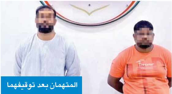
المتهمان بعد توقيفهما