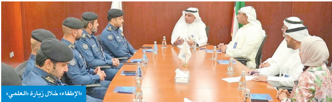
«الإطفاء» خلال زيارة «العلمي»

نظمت محاضرة توعية للبرنامج الصيفي في جامعة الكويت