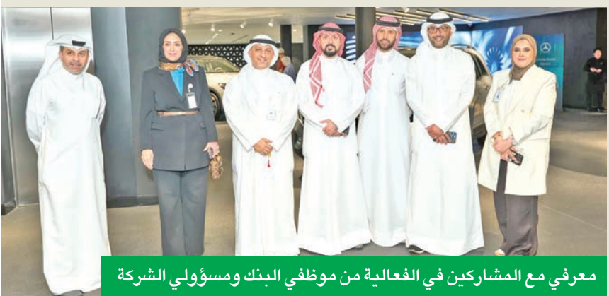
معرفي مع المشاركين في الفعالية من موظفي البنك ومسؤولي الشركة