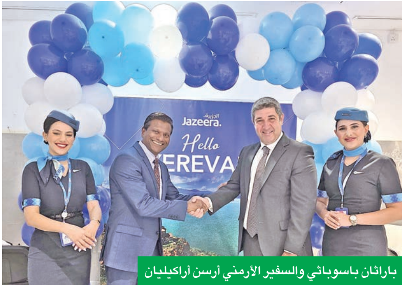
باراثان باسوبياني والسفير الأرمني أرسن أراكيليان

دشنت شركة طيران الجزيرة، أمس، رسمياً خط رحلاتها المباشرة بين الكويت ويريفان في أرمينيا، لتوفر وجهة جديدة للسياحة والتبادل التجاري والثقافي.