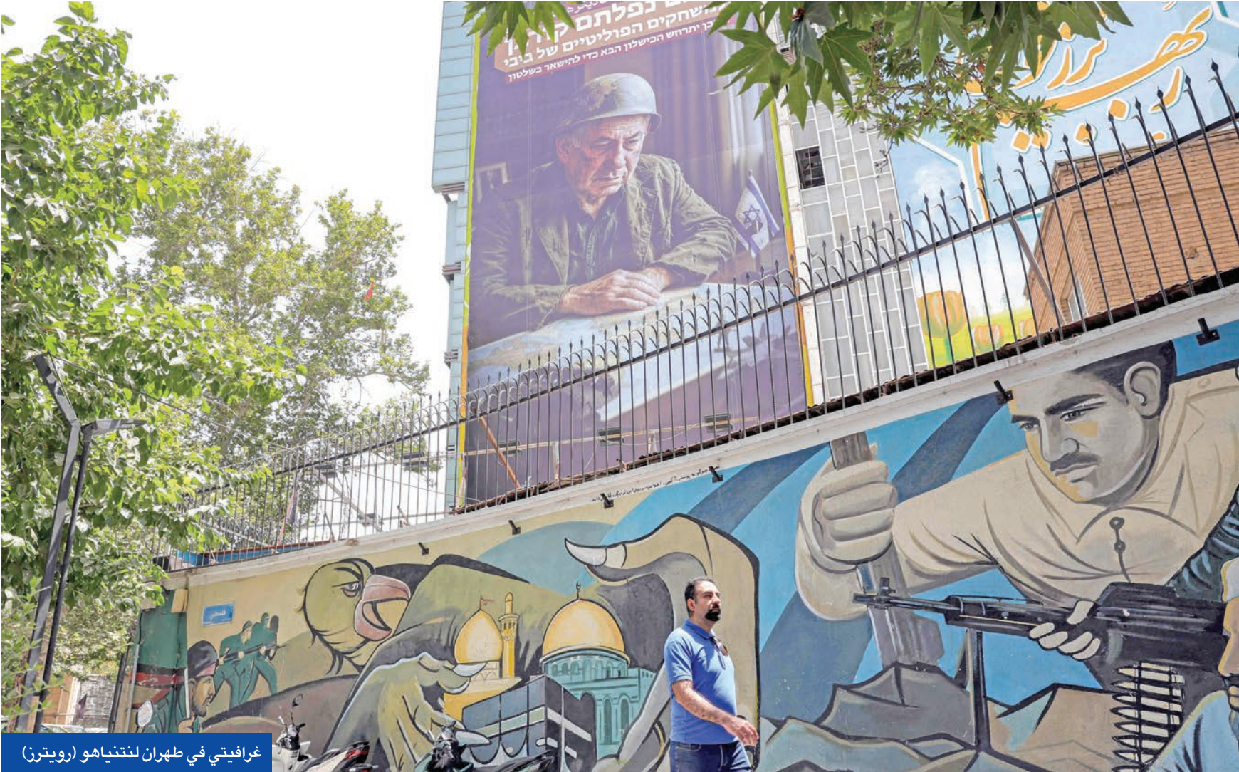
غرافيتي في طهران لنتنياهوو