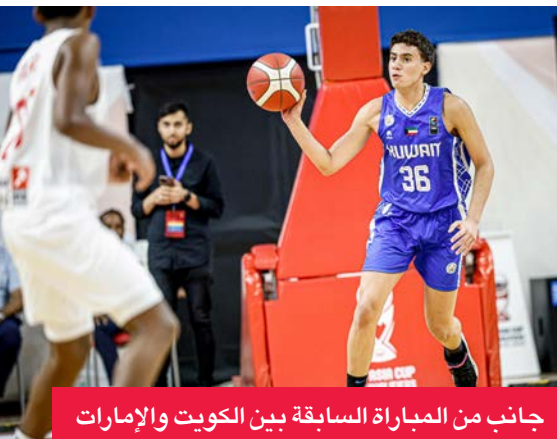
جانب من المباراة السابقة بين الكويت والإمارات

منهما، في حين يملك كل من الإمارات وعمان نقطة واحدة. الطموح إلى انتصار ثان وبإمّال المنتخب الكويتي مواصلة النتائج الإيجابية، وتحقيق فوزه الثاني تواليًا،