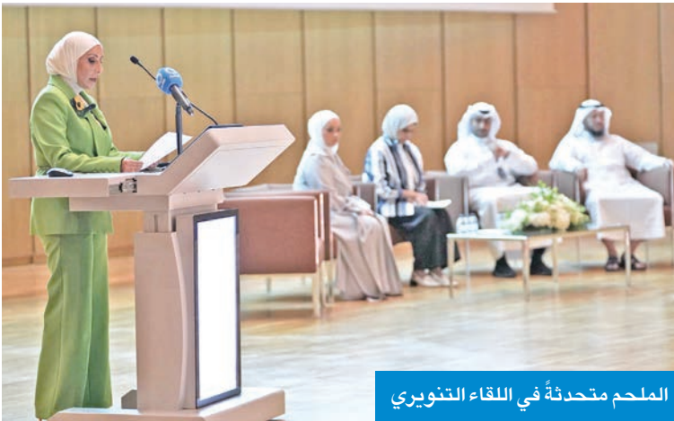
الملحم متحدثّة في اللقاء التنويري

وقالت الملحم إن اللقاء الإرشادي للطلبة المبتعثين يأتي ضمن المرحلة الثالثة والأخيرة من الحملة، التي أطلقتها الوزارة لتكون دليلاً شاملاً في رحلة الطالب من التوجيه وحتى الاستعداد للسفر، وحققت هذه الحملة أثراً إيجابياً واسعاً في توعية الطلبة وأولياء أمورهم، ومساعدتهم على اتخاذ قرارات أكاديمية مدروسة وواعية، وهذا ما تم لمسه من خلال نتائج خطة البعثات الخارجية واختيارات المتقدمين التي تتماشى مع خطة التنمية. وذكرت «أنه انطلاقاً من تنفيذ توجيهات القيادة الرشيدة للاستثمار في رأس المال البشري، ورفع كفاءات مواردها البشرية،