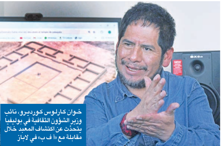
خوان كارلوس كورديرو، نائب وزير الشؤون الثقافية في بوليفيا يتحدث عن اكتشاف السكان المحليين

إلى ما قبل الحقبة الإسبانية أثناء أعمال توسيع الطريق القريب، ثم أجريت أبحاث خلصت، باستخدام صور الأقمار الاصطناعية، إلى أنها عائدة لحضارة تيواناكو.