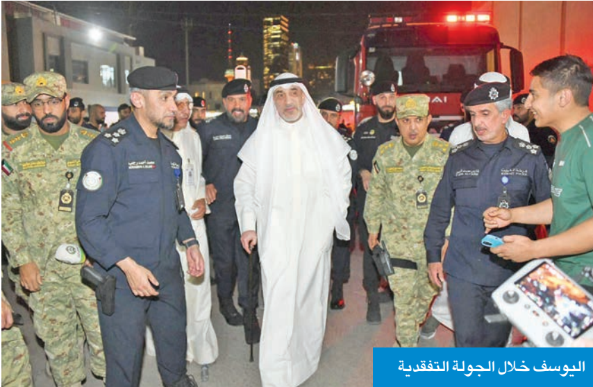
اليوسف خلال الجولة التفقدية

بروح المسؤولية والإخلاص. وذكر أن «كلمات الشكر لا تفي الحرس الوطني حقّه»، معتبراً