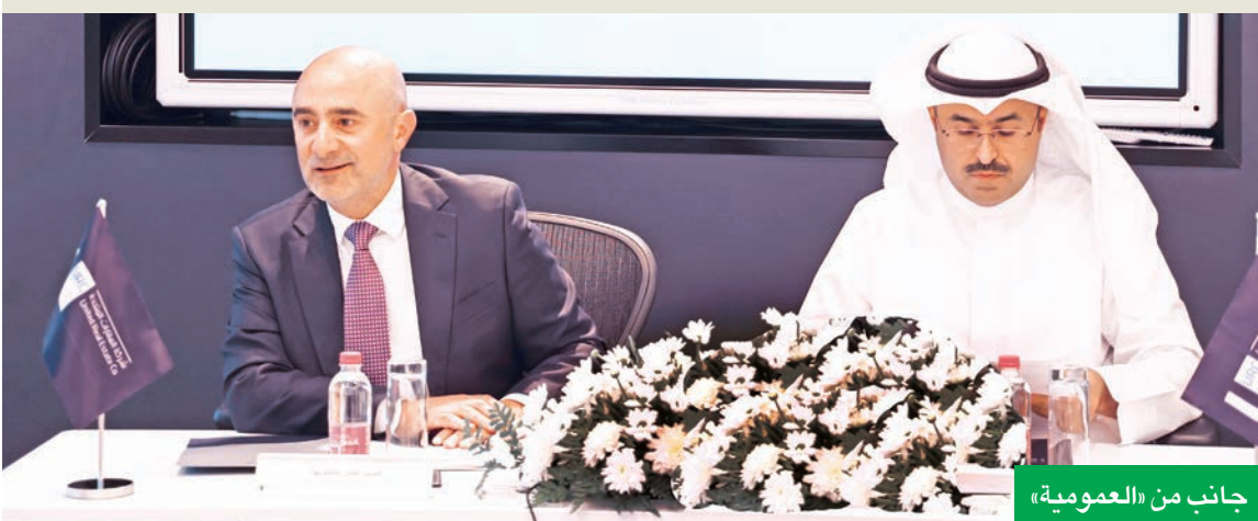
جانب من «العمومية»

بالتوفيق خلال الفترة المقبلة، مؤكداً ثقته بقدرتهم على دعم جهود الشركة وخلق قيمة مضافة تعزز التزام «العقارات المتحدة» بتنفيذ استراتيجيتها.