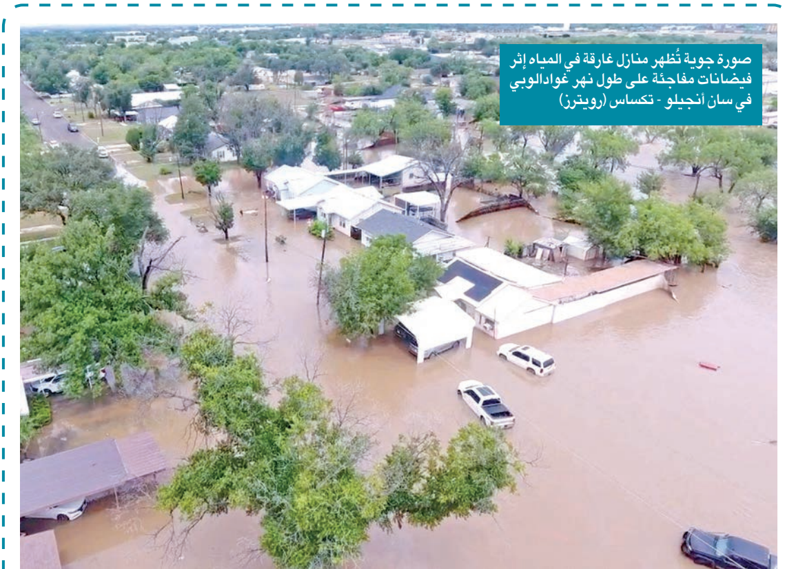
صورة جوية تظهر منازل غارقة في المياه إثر فيضانات مفاجئة على طول نهر غوادلوبي في سان أنجيلو - تكساس

وقد تمخّضت هذه الحرب وأوزارها في مصر عمّا يُعرف بقضية الأسلحة الفاسدة التي زوّد بها الجيش المصري، وكان يقود الجيش الأردني والعراقي جلوب باشا، الجنرال البريطاني الذي كان قائداً للجيش الأردني، في حين كانت الحصابات الصهيونية قد تمكّنت في فترة الانتداب البريطاني من بناء قوة عسكرية كبيرة، ومن إنشاء صناعات عسكرية في أرض فلسطين. ومع ذلك، وخلال أسبوع واحد من بدء القتال، حققت الجيوش العربية انتصارات كبيرة لم يتوقعها النظام العالمي الذي أنشأ إسرائيل بقرار التقسيم الصادر في نوفمبر 1947 لتكون مقلب فطر له وقاعدته العسكرية