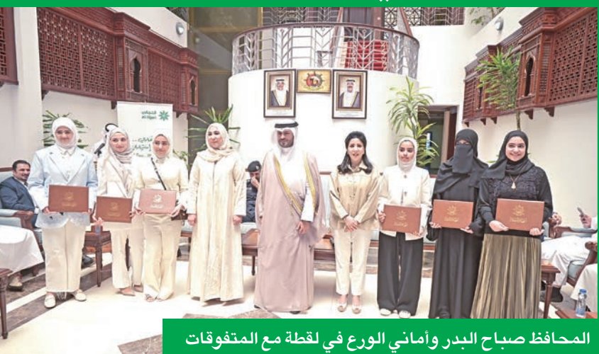
المحافظ صباح البدر وأمني الورع في لقطة مع المتفوقات

في إطار التزام البنك التجاري الكويتي بمسؤوليته الاجتماعية ومشاركته الفاعلة في دعم الفعاليات المجتمعية، التي ترعاها مؤسسات المجتمع المدني، بما في ذلك محافظات الكويت الـ 6، رعى البنك حفل تكريم الطلبة المتفوقين في المرحلة الثانوية على مستوى مدارس محافظة مبارك الكبير.