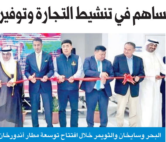
البحر وساخان والثويمر خلال افتتاح توسعة مطار أندورخان

منغوليا لتحقيق التنمية المستدامة بحلول عام 2050 ليعكس الالتزام المشترك بتعزيز البنية التحتية والتنمية الإقليمية. وأكد أن مشروع توسعة المطار سيحدث نقلة نوعية