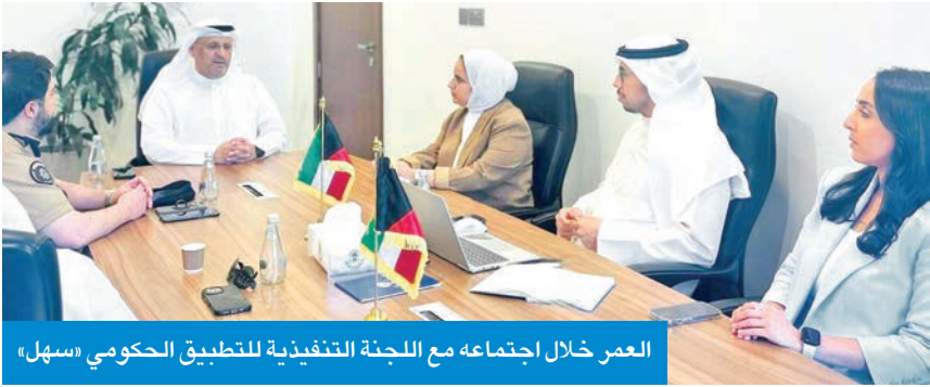
العمر خلال اجتماعه مع اللجنة التنفيذية للتطبيق الحكومي «سهل»

أشار إلى أن المرحلة المقبلة ستشهد تسارعاً في إطلاق خدمات جديدة على التطبيق، إضافة إلى التركيز على التكامل بين الجهات الحكومية، من خلال تبادل البيانات والربط التقني، بما يعزز من فعالية العمليات الحكومية، ويمنح المستخدم تجربة رقمية مترابطة وشاملة. وأضاف الوزير العمر: «نؤمن بأن الرقمنة ليست مجرد عملية تقنية بل هي تغيير شامل في أسلوب تقديم الخدمة يعكس التزاماً بالشفافية والعدالة في الوصول للخدمة ورفع كفاءة الإنفاق العام وتطبيق سهل هو التجسيد العملي لهذا التوجه». كما أكد أن المرحلة القادمة تتطلب كثيف العمل على تطوير تطبيق «سهل أعمال»، بما يعزز من قدرته على خدمة القطاع الخاص وتمكين رواد الأعمال والشركات من إنجاز معاملاتهم بسهولة وفعالية في إطار التوجه الوطني الشامل نحو رقمنة بيئة الأعمال في الكويت.