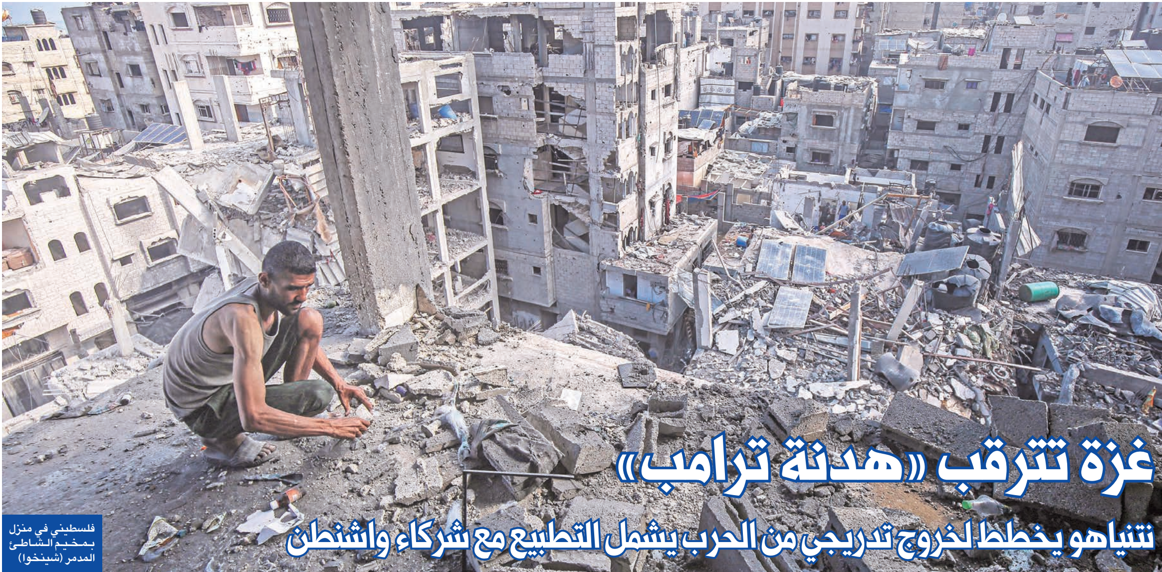
فلسطيني في منزل بمخيم الشاطئ المدمر

به. كما تؤكد أنه تحت «قيادة ترامب، سيلتزم الطرفان ببذل الجهود لضمان استمرار المفاوضات حتى التوصل إلى اتفاق نهائي»، فيما يتعهد الضامون بإجراء «مبادرات جادة حول الترتيبات اللازمة للتوصل إلى وقف إطلاق نار دائم». وعلى الأرض، واصل الاحتلال تصعيده الدامي، متسبباً في مقتل نحو 50 فلسطينياً وإصابة العشرات في غاراته المستمرة على غزة. وأعلن الرئيس التركي رجب طيب أردوغان أمس، أنه طلب من نظيره الأمريكي التدخل لوقف عمليات إطلاق النار على مخيمي اللاجئين، والتي تقول الأمم المتحدة إنها أسفرت عن مقتل أكثر من 500.