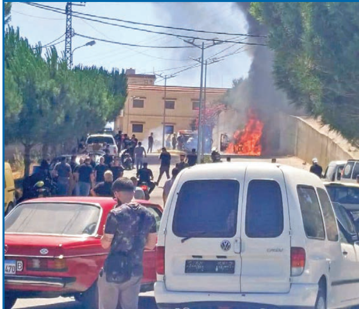
موقع غارة إسرائيلية على «بنت جبيل» جنوب لبنان أمس

العمل لعقد جلسة لمجلس الوزراء تقرر خطة قد تتضمن مهلة زمنية تصل إلى العام، من جهته، نفى «حزب الله» ما جرى عن استعداده لتسليم أسلحته الثقيلة، لا سيما الصواريخ الدقيقة أو البالسيتية والطائرات المسيّرة، في مقابل الاحتفاظ بالسلاح الخفيف، متمسكاً بموقفه من أنه لا حاجة إلى اتفاق جديد غير اتفاق وقف النار في الجنوب، وأن موضوع السلاح شمال نهر الليطاني هو شأن داخلي يُناقش فقط بعد انسحاب إسرائيل ووقف الاعتداءات ضد عناصره.