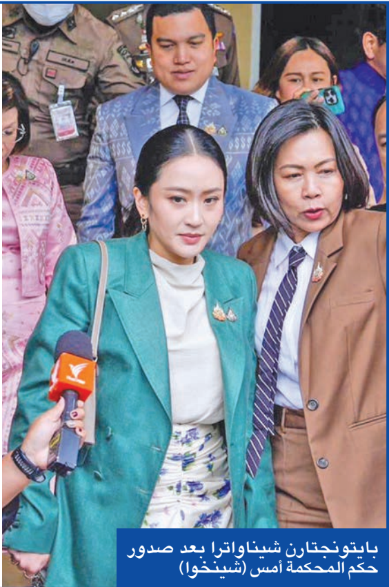
بايتونجتارن شيناواترا بعد صدور حكم المحكمة أمس

علّقت المحكمة الدستورية في تايلند مؤقتاً، أمس الثلاثاء، مهام رئيسة الوزراء بايتونجتارن شيناواترا، أصغر رئيسة وزراء في تاريخ البلاد «38 عاماً» في خطوة مثيرة قد تؤدي إلى أزمة سياسية في البلاد، بعد قبولها دعوى تتهمةا بانتهاك أخلاقي وخرق الدستور، على خلفية مكالمة هاتفية مسربة أجرتها مع الزعيم الكمبودي السابق هون سين خلال تصاعد التوترات الحدودية بين البلدين. وصوّت قضاة المحكمة بالإلجماع على قبول الالتماس المقدم من 36 عضواً في مجلس الشيوخ، الذي يحفل برئاسة الوزراء مسؤولية خيانة الثقة وخرق المعايير الأخلاقية الدستورية، فيما أقر قرار تعليق مهامها بأغلبية سبعة مقابل اثنين. ومنحت المحكمة بايتونجتارن مهلة 15 يوماً لتقديم ردها وأدلتها في القضية.