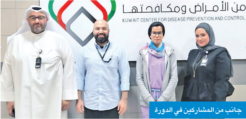
جانب من المشاركين في الدورة

أكدت حرصها على سلامة الأغذية وصحة المستهلك وبناء قدرات منتسبيها