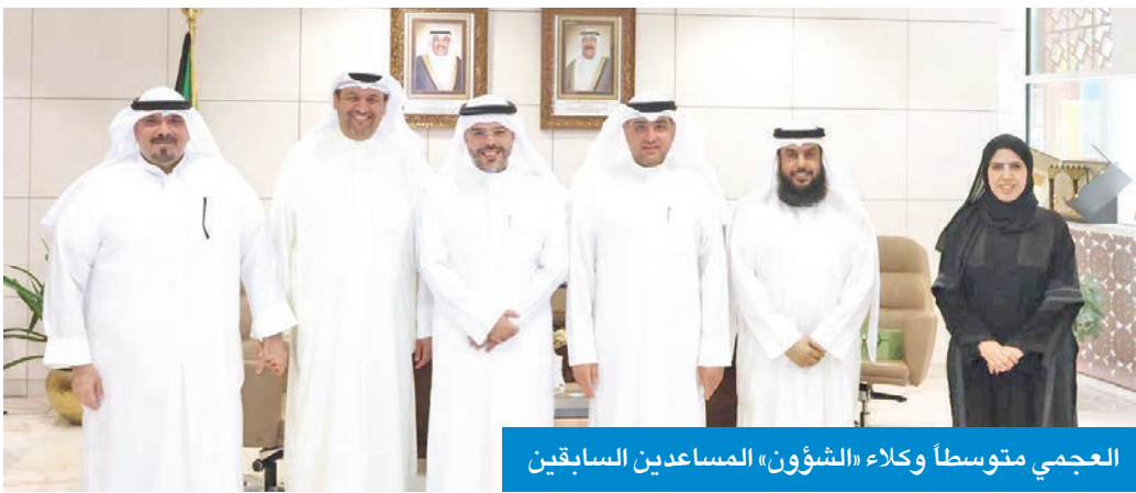
العجمي متوسطاً وكلاء «الشؤون» المساعدين السابقين

وأوضح أن انتهاء فترة التكليف الخاصة بالوكلاء المساعدين جاء تنفيذاً للهيكل التنظيمي الجديد للوزارة، مؤكداً استمرارهم في أداء مهامهم كمديري إدارات. وأكد العجمي حرص الوزارة بتوجيهات الحويلة، على تنفيذ خططها التطويرية بما يحقق الكفاءة والفاعلية، ويواكب التحديات والاحتياجات المجتمعية وفق رؤية واضحة ومنهج مؤسسي متكامل.