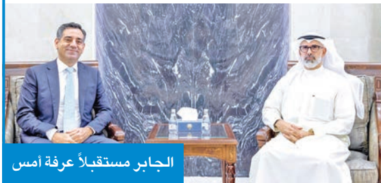
الجابر مستقبلاً عرفة أمس

استقبل نائب وزير الخارجية، السفير الشيخ جراح الجابر، أمس، القائم بأعمال سفارة لبنان أحمد عرفة، بمناسبة انتهاء فترة عمله في سفارة بلاده لدى الكويت.