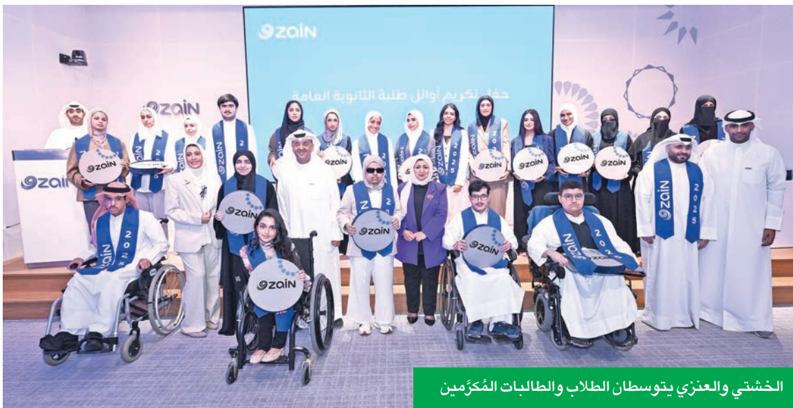
الخشتي والعززي يتوسلان الطلاب والطالبات المُكتمين

فالكويت تستحق منكم الأفضل دائماً، وباتي هذا الحفل ضمن استراتيجية «زين» للاستدامة والمسؤولية الاجتماعية، والتي تضع التعليم بمقدمة أولوياتها، وتحرص الشركة على التعاون المستمر مع وزارة التربية والجهات الأكاديمية المختلفة لدعم الجهود الوطنية الرامية إلى تمكين جيل المستقبل من قيادة مرحلة التحول والتنمية في الكويت.