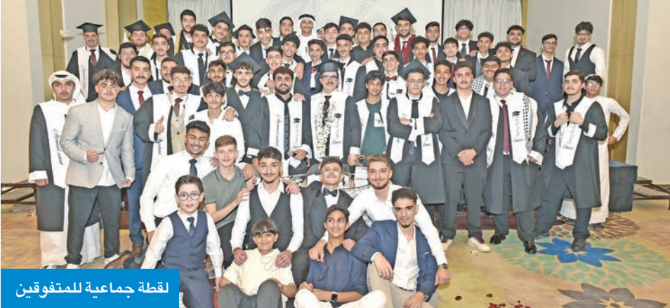
لقطة جماعية للمتفوقين