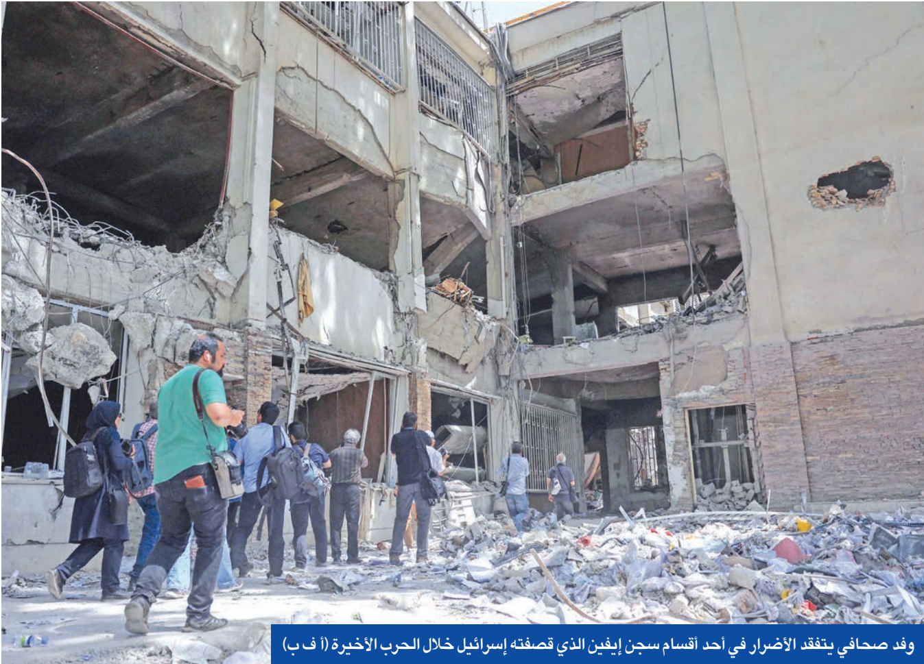
وفد صحافي يتفقد الأضرار في أحد أقسام سجن إيفين الذي قصفته إسرائيل خلال الحرب الأخيرة

في هذه الأثناء وسّع الجيش الإسرائيلي نطاق عملياته العسكرية في غزة، ورفع وتيرة القصف، في استراتيجية تهدف إلى إجبار حركة حماس على قبول شروطه لوقف العدوان،