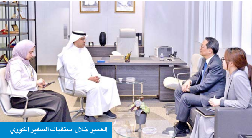
العمير خلال استقبلته السفير الكوري

وأشارت الإدارة، في بيان صحفي، إلى أنه «يسمح لطلبة المركز من دفعة 2024 بالتناقص على شواغر الكليات الطبية في ضوء نتائج السنة التمهيديّة»، مشيراً إلى أن أبرز شروط التحويل من كليتي الصيدلة وطب الأسنان إلى كلية الطب، هي: «اجتياز السنة التمهيديّة في الكليات المذكورة بمعدل عام لا يقل عن 3.80، وفي حال قبول الطالب لا يسمح له بالتحويل إلى أية كلية أخرى داخل الجامعة».