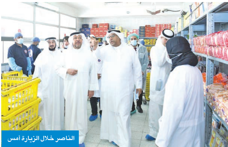
الناصر خلال الزيارة أمس

مثمناً دوره المهم، وحرصه على الارتقاء بالخدمات في القطاعات الحيوية بالمحافظة.