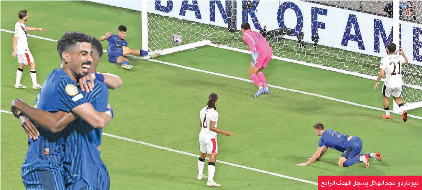
ليوناردو نجم الهلال يسجل الهدف الرابع

هناً المستشار تركي آل الشيخ، رئيس الهيئة العامة للترفيه، نادي الهلال السعودي، بعد بلوغه دور الثمانية ببطولة كأس العالم للأندية لكرة القدم، عقب الفوز التاريخي والمثير على مانشستر سيتي الإنكليزي بنتيجة 4-3. وكتب تركي آل الشيخ عبر صفحته الشخصية بـ «فيسبوك»: «هذا الهلال وصيف العالم وزعيم نصف الأرض. تحدثوا كثيراً عن مشروع الدوري السعودي والفائدة منه، لن أعلق، ولكن في عامين وصيف العالم، وفي البطولة الحالية تعادل مع مدريد، وهزيمة بالاربعة للسبتي. حفظ الله الأمير محمد بن سلمان ودعمه للشباب. من جهته، هنأ الأمير عبدالعزيز بن تركي الفيصل، وزير الرياضة، ورئيس اللجنة الأولمبية والبارالمبية السعودية، والاتحاد العربي لكرة القدم، نادي الهلال بعد تأهله، وكتب عبر موقع إكس: «أبارك للممثل الوطن الهلال تأهله لربع نهائي كأس العالم للأندية، أداء متميز، وانتصار يعكس قوة الكرة السعودية، بفضل دعم قيادة وطننا الغالي- حفظها الله، كل التوفيق بمواصلة التالقي في الأدوار القادمة».