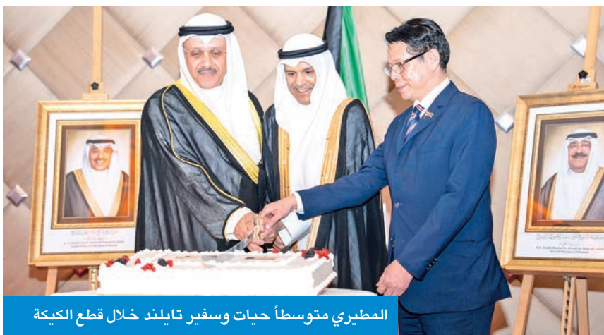
المطيري متوسطاً حيات وسفير تايلند خلال قطع الكعكة

بتحويل حوار التعاون الآسيوي إلى منظمة دولية، وهو المقترح الذي سبق طرحه خلال اجتماع كبار المسؤولين في بانكوك.