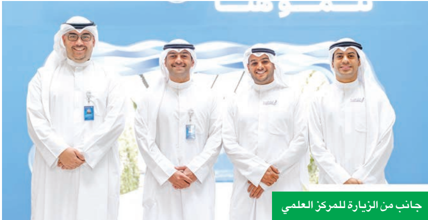
جانب من الزيارة للمركز العلمي

نؤمن بدورنا كمؤسسة رائدة في نشر الثقافة العلمية، ونعتبر الشراكات المجتمعية مثل هذه ركيزة أساسية في تحقيق رسالتنا. نشكر «وربة» على دعمه المتواصل، الذي يمكننا من توسيع نطاق برامجنا التعليمية والوصول إلى أكبر عدد من المستفيدين، مما يترك أثراً إيجابياً مستداماً في مسيرة المشاركين».