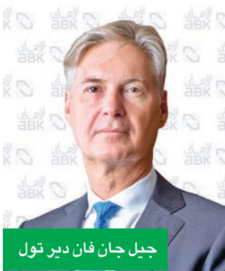
جيل جان فان دير تول

التوجه الاستراتيجي لمجموعة «الأهلي». وستواصل مجموعة «الأهلي» استراتيجيتها التي تركز على التحول الرقمي، والنمو الإقليمي، والتميز التشغيلي، مع التركيز بشكل كبير على تحسين تجربة العملاء، وتعزيز العروض والمنتجات، وتوفير بيئة عمل أكثر مرونة. وتحت قيادة فان دير تول، تلتزم المجموعة أيضاً بتطوير مبادرات الاستدامة، وتمكين المواهب، وتشجيع الابتكار لضمان مواكبة عملياتها للمستقبل، في ظل بيئة مالية عالمية متطورة.