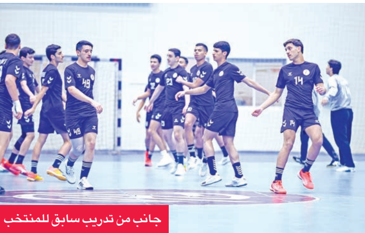
جانب من تدريب سابق للمنتخب

بقيادة الكرواتي إيفان، وبالتعاون مع لجنة التدريب والمنتخبات الوطنية، أعد برنامجاً تدريبياً من مرحلتين: الأولى بدأت بالتدريبات الفردية، لتطوير