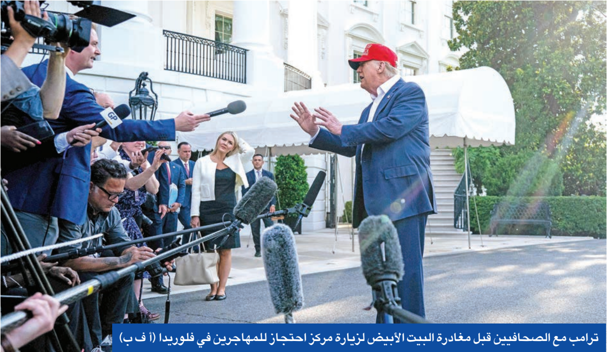
ترامب مع الصحفيين قبل مغادرة البيت الأبيض لزيارة مركز احتجاج للمهاجرين في فلوريدا

● الاحتلال يصعدّ في غزة... وتنسيق مصري - قطري لدفع الهدنة