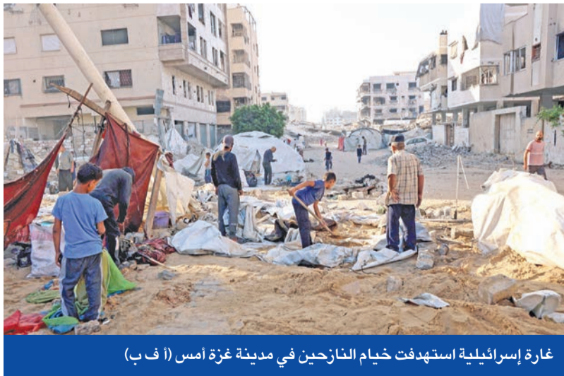
غارة إسرائيلية استهدفت خيام النازحين في مدينة غزة أمس (ا ف ب)

في ظل انحسار المواجهة مع إيران، تتجه إسرائيل بقوة إلى توقيع «اتفاقية سلام» مع سورية، قد تشمل وقف العدوان الدامي على غزة، الذي يضغط الرئيس الأميركي دونالد ترامب لإعلان نهايته خلال أسبوعين. ومع عودة الحراك لملف غزة، وتصاعد الضغوط الداخلية والخارجية لوقف النار، وإتمام صفقة تبادل الأسرى مع حركة حماس، أفادت قناة «آي 24» بأن إسرائيل وسورية ستوقعان «اتفاقية سلام» قبل نهاية عام 2025، ستتحول بموجبها مرتفعات الجولان المحتلة إلى «حديقة سلام». وقالت القناة عن مصدر سوري، إن الاتفاقية تشمل تطبيع العلاقات بين إسرائيل وسورية بشكل كامل، موضحاً أن إسرائيل ستسحب تدريجياً من جميع الأراضي السورية التي احتلتها بعد غزو المنطقة العازلة في 8 ديسمبر 2024، بما في ذلك قمة جبل الشيخ. وفي تأكيد على ارتياح رئيس الوزراء الإسرائيلي بنيامين نتنياهو للصفقة المحتملة مع الرئيس السوري أحمد الشرع، قال وزير الخارجية جديعون ساعر: «إذا توفرت فرصة لتوقيع اتفاق سلام أو تطبيع مع سورية، شرط