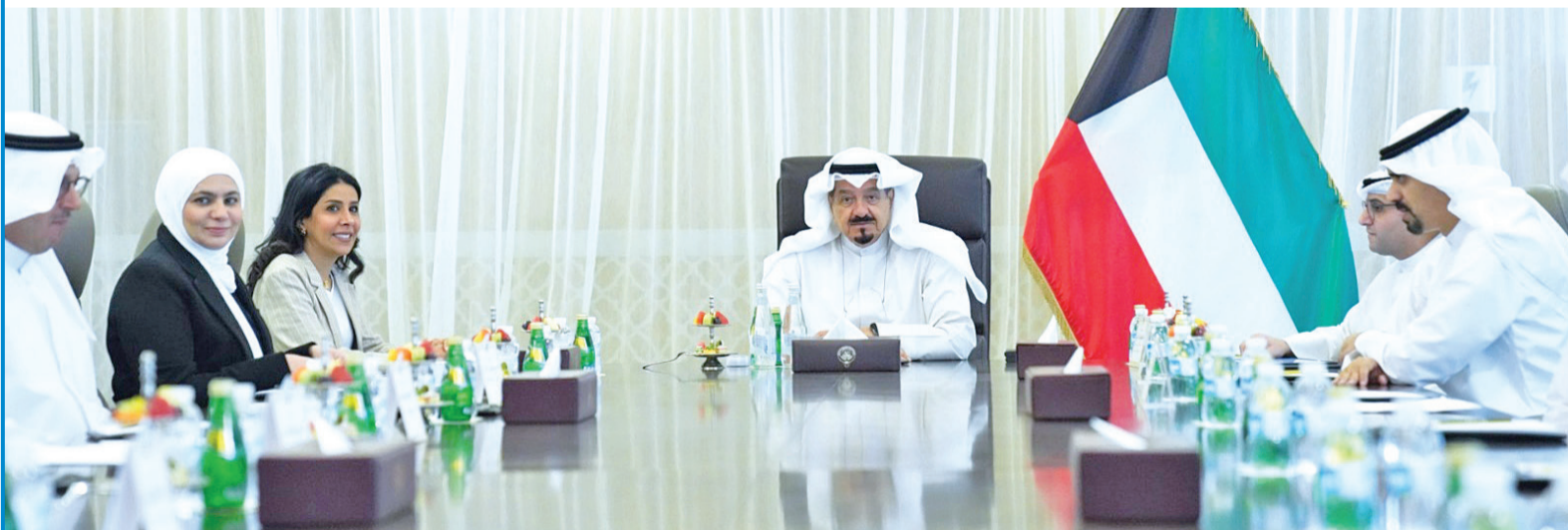
... ومرتسماً أحد اجتماعات اللجان الوزارية بعد عودته