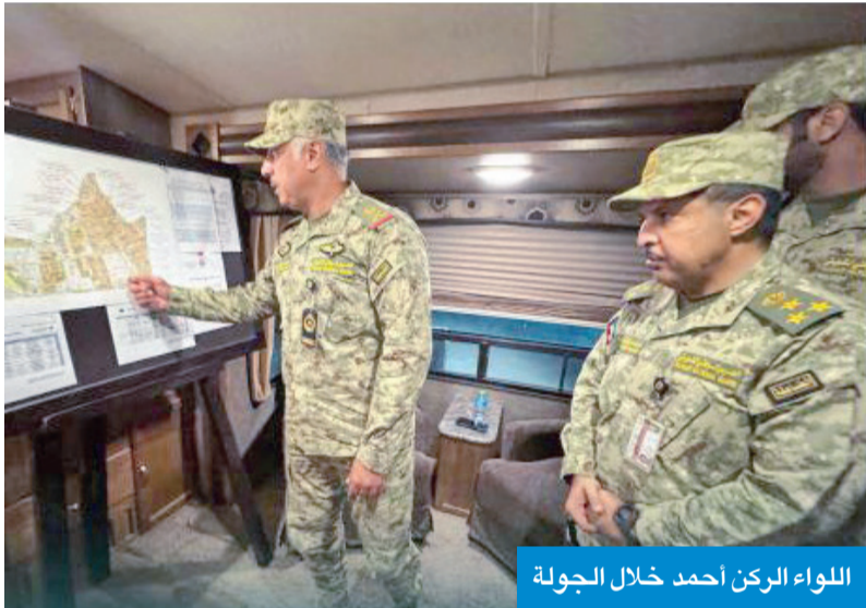
اللواء الركن أحمد خلال الجولة