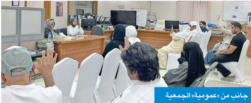
جانب من «عمومية» الجمعية