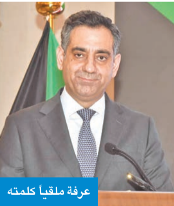
عرفة ملقياً كلمته

واختتم الحفل بتقديم درع تكريمي باسم مجلس الأعمال اللبناني، كعبرون تقدير وامتنان لمسيرته الدبلوماسية المشرفة، مع تمنيات الحضور له بالتوفيق في مهامه الجديدة.