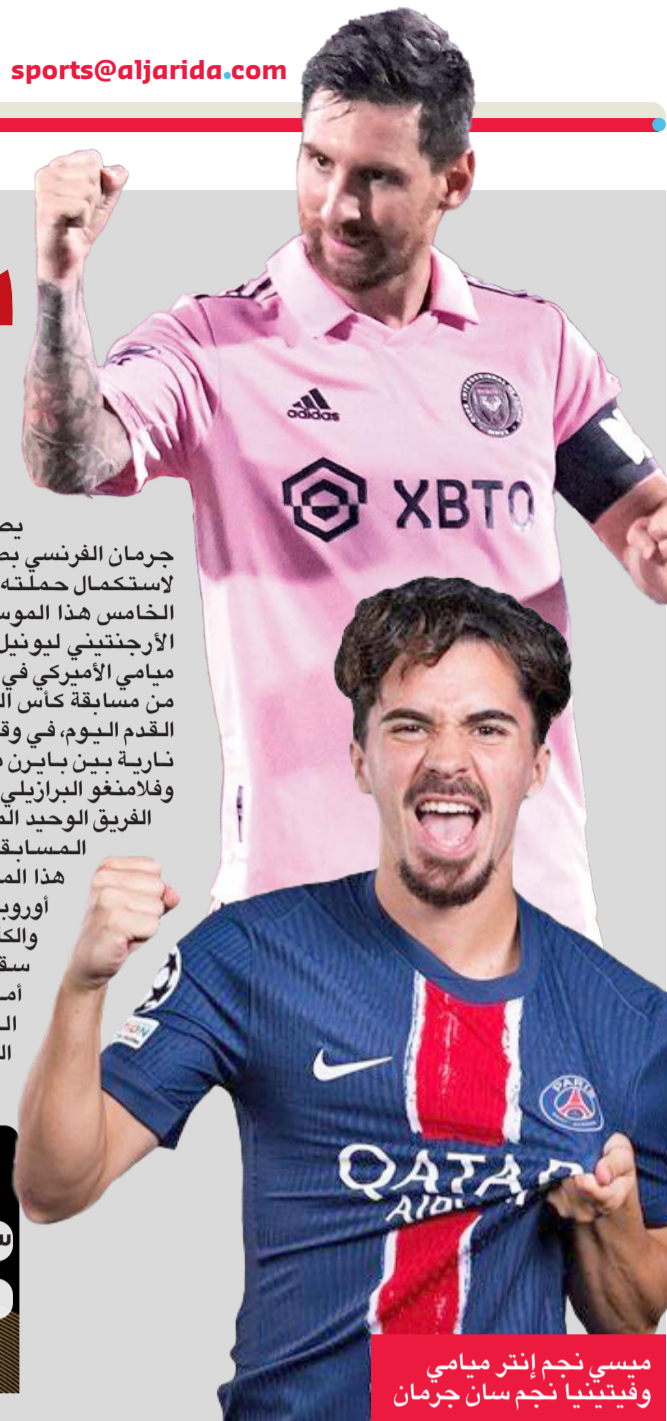
ميسي نجم إنتر ميامي وفيتينيا نجم سان جرمان

يصادم باريس سان جرمان الفرنسي بطل أوروبا الساعي لاستكمال حملته نحو إحراز لقبه الخامس هذا الموسم، بنجمه السابق الأرجنتيني ليونيل ميسي قائد إنتر ميامي الأمريكي في الدور ثمن النهائي من مسابقة كأس العالم للأندية بكرة القدم اليوم، في وقت تجمع مواجهة نارية بين بايرن ميونيخ الألماني وفلامنغو البرازيلي. الفريق الوحيد المنتوّج بجميع القاب المسابقات التي خاضها هذا الموسم (دوري أبطال أوروبا، والدوري المحلي والكأس وكأس الأبطال)، سقط بشكل مفاجئ أمام بونافوغو البرازيلي 1 - 0 في الجولة الثانية من