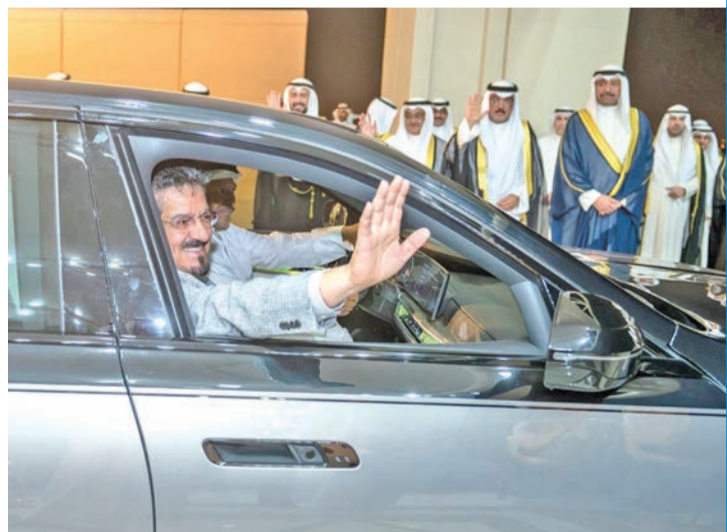
رئيس الوزراء لدى عودته إلى البلاد

توفير الخدمات الأساسية للمشروعات الإسكانية، ورغم استعراض التقدم المحقق، لا يمكن تجاهل التحديات القائمة في توفير الكهرباء والمياه والبنية التحتية، وسط تأكيدات من