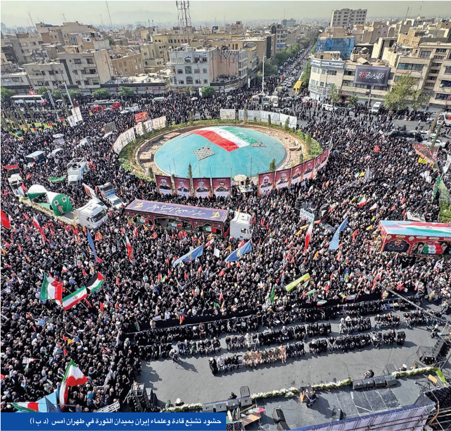
حشود تشيع قادة وعلماء إيران بميدان الثورة في طهران أمس

كل المحافل لخفض التصعيد، ودعت إلى حل الملف النووي عبر السياسة. لكنه أضاف: «ورغم ذلك، جاء الاستهداف الإيراني لسيادة قطر الشقيقة، وهو اعتداء يطلانا جميعاً». وكانت إيران قد قصفت قاعدة العبد في قطر، معتبرة ذلك رداً على الولايات المتحدة. ودانت دول الخليج الهجوم، وأكدت رغبتها في استمرار العلاقات الجيدة مع طهران. وقد لعبت قطر دوراً في وقف إطلاق النار الذي أنهى الحرب.