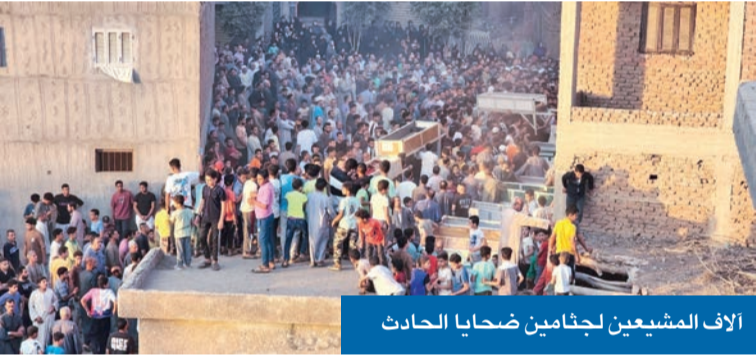
الآف المشيعين لجناامين ضحايا الحادث

الأمنية بوزارة الداخلية المصرية القبض على السائق المتهم المتسبب في حادث الطريق الإقليمي، وذلك بعد هروبه من مكان الواقعة.