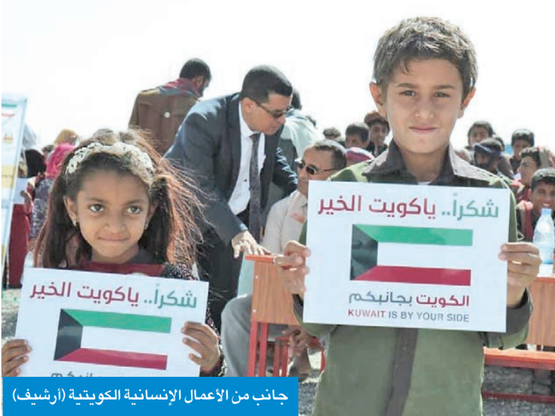
جانب من الأعمال الإنسانية الكويتية (أرشيف)

التميز الإنساني خالد الصبيحي فقال إن «هذا القرار لا يعد مجرد خطوة إدارية إنما تأكيد راسخ على استمرار الكويت في دورها الريادي كمركز للعمل الإنساني، واستئناف