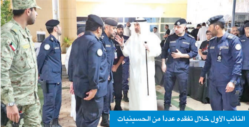
النائب الأول خلال تفقده عدداً من الحسينيات

وأشاد بالانضباط العالي والجهود المبذولة من رجال الأمن في تنفيذ المهام الميدانية، مشيراً إلى أهمية الاستمرار بنفس مستوى الجدية والكفاءة، بما يعكس جاهزية «الداخلية»، وقدرتها على تأمين الشعائر الدينية.