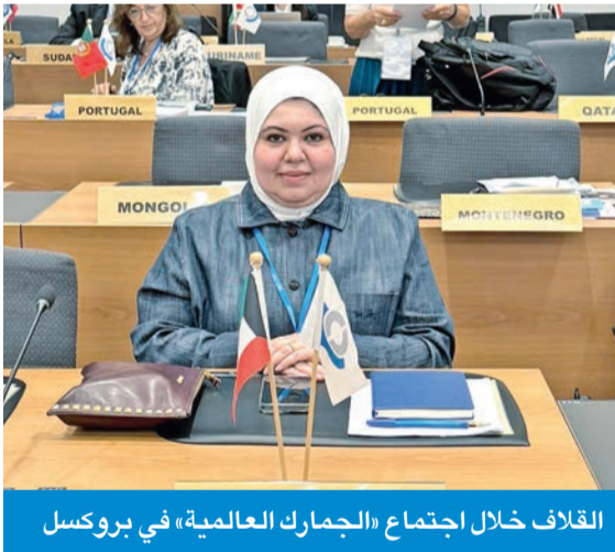
القالف خلال اجتماع «الجمارك العالمية» في بروكسل

أعلنت الإدارة العامة للجمارك، أمس، استمثار عضوية الكويت في لجنة التدقيق بمنظمة الجمارك العالمية سنة إضافية حتى يوليو 2026 من خلال التصويت؛ تقديراً لجهود الإدارة في مجالات التحول الرقمي وتعزيز الشفافية والحوكمة الجمركية. جاء ذلك خلال مشاركة الكويت ممثلة بـ «الجمارك»، في الاجتماع المشترك رقم (145/146) لمجلس منظمة الجمارك العالمية، الذي عقد في العاصمة البلجيكية بروكسل في الفترة بين 26 و28 يونيو الجاري.