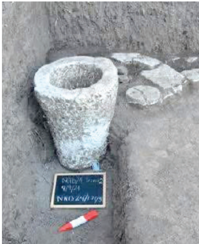
آثار المدينة المكتشفة وبعض القطع الأثرية

يعود إلى عصر الأسرة السادسة والعشرين، وهو تحفة فنية تظهر براعة المصري القديم في نحت التفاصيل بدقة متناهية. كما وجدت لوحة حجرية نادرة تصوّر الإله حورس واقفاً على تمساحين وهو يحمل الأقاعي، وتعلوها صورة للإله «بس» رب المرح والفرح في الميثولوجيا المصرية.