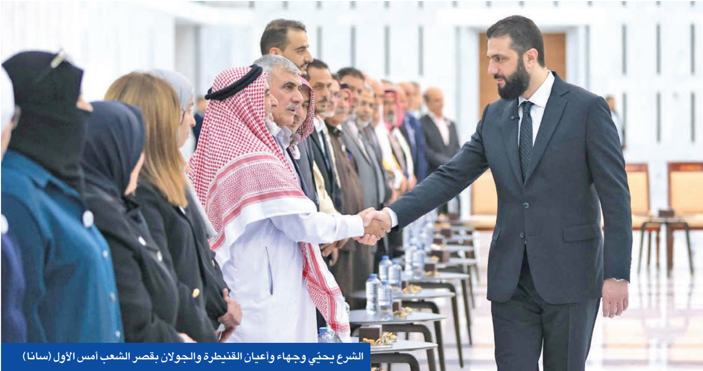
الشرع يحثي وجهاء واعيان القنيطرة والجولان بقصر الشعب امس الاول (سانا)

• ويتكوف: دول لن تخاطر على البال ستطبع مع إسرائيل • براك: سنحمي نظام الشرع من وكلاء إيران