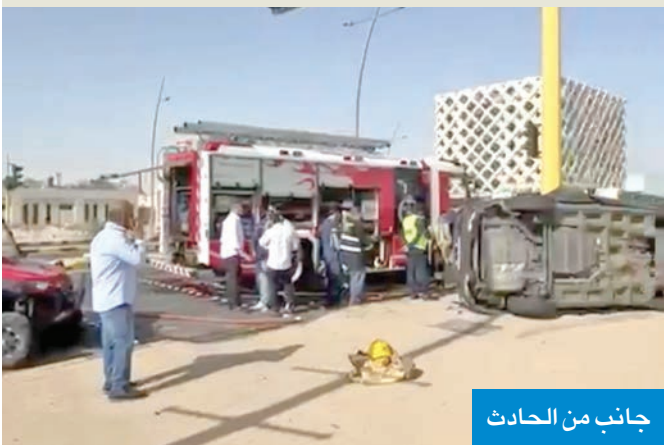
جانب من الحادث

كاميرات المراقبة رصدت الحادث بكل تفاصيله