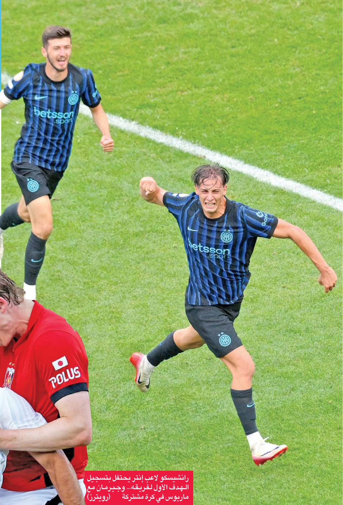
رانشيسكو لاعب إنتر يحتفل بتسجيل الهدف الأول لفريقه... وجيرمان مع ماريوس في كرة مشتركة (رويترز)

جئب تصدر المجموعتين الخامسة والسادسة فريقي إنتر ميلان الإيطالي وبوروسيا دورتموند الألماني المواجهة في دور ثمن النهائي لكأس العالم للأندية.