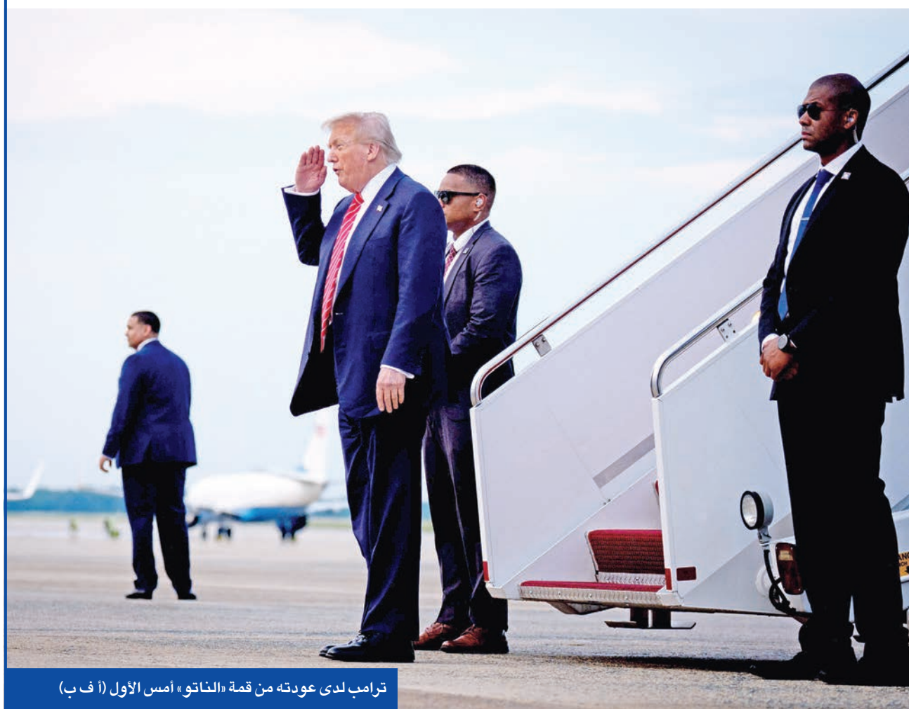
ترامب لدى عودته من قمة «الناتو» أمس الأول

الرئيس الجمهوري يهاجم ممداني ويريد قتل «صوت أميركا»... ويتعهد بإنقاذ نتيهاهو