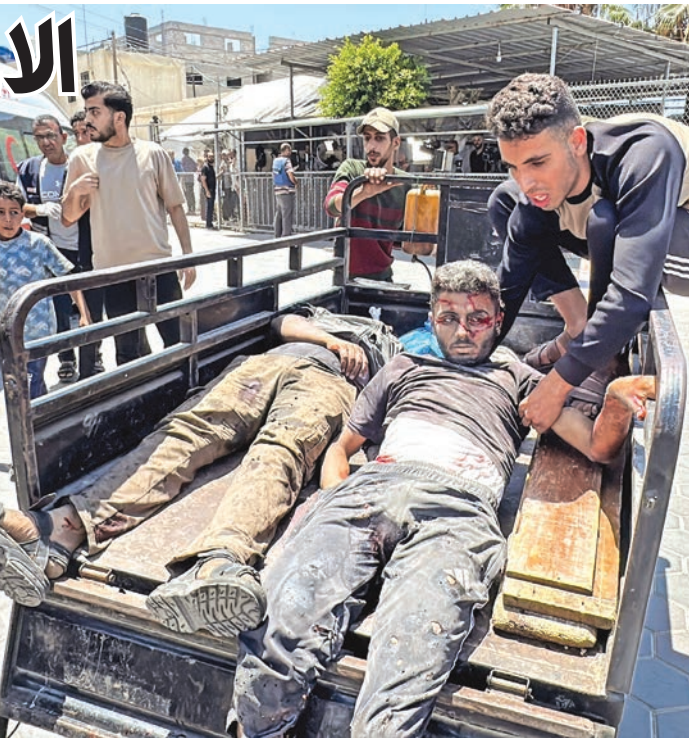
نُقل مصابين لمستشفى شهداء الأقصى بدير البلح أمس

وأكد مسؤول أمني إيراني رفيع، إلى جانب مسؤولين آخرين مطلعين على الملف الأمني، أن السلطات في طهران تركّز جهودها حالياً على منع أي اضطرابات داخلية محتملة، مع توجيه اهتمام