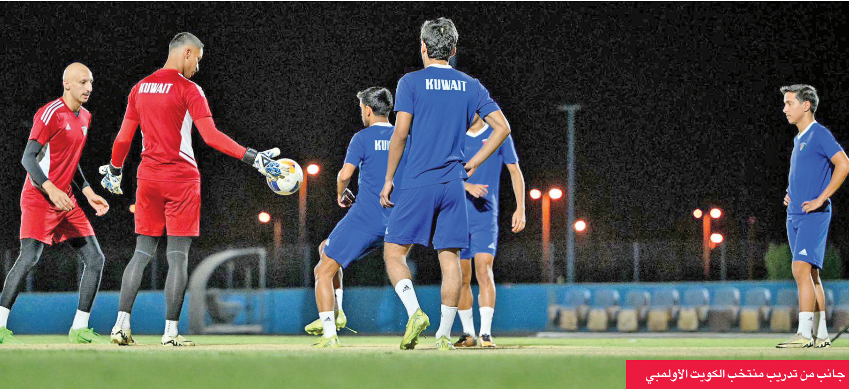
جانب من تدريب منتخب الكويت الأولمبي