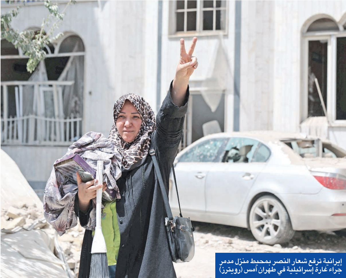
إيرانية ترفع شعار النصر بحيط منزل مدمر جراء غارة إسرائيلية في طهران أمس

وبينما تداولت منصات عبرية فيديو زعم أنه التقط بواسطة عملاء، ويظهر دماراً واسعاً لأجهزة طرد مركزي داخل منشأة تحت الأرض، أشاد رئيس «الموساد» دافيد بارنياع بعملية إسرائيل «التاريخية» ضد إيران، معلناً تحييد التهديد الإيراني القائم منذ عقود بشكل كبير بفضل الحملة الجوية التي استمرت 12 يوماً، ووجه الشكر إلى وكالة الاستخبارات المركزية الأميركية «CIA»، التي ساهم تعاونها في إنجاح العملية. كما زعم رئيس أركان الجيش الإسرائيلي إيلان زامير، ليل الأربعاء، أن العملية العسكرية ضد إيران حققت كامل أهدافها الاستراتيجية، وعلى رأسها توجية ضربة قاسية للبرنامج النووي الإيراني، وإزالة تهديد وجودي ضد دولة إسرائيل. في موازاة ذلك، ذكر متحدث باسم حكومة بنيامين نتنياهو أن الإنجاز الذي تحقق جراء ضرب المواقع النووية الإيرانية يمكن أن يستمر طويلاً إذا لم تحصل الجمهورية الإسلامية على مواد نووية جديدة، وزعم أن معدل اعتراض الصواريخ الإيرانية بلغ 90%، مشيراً إلى أن الضربات تسببت في مقتل 28 إسرائيليًا وجرح 1450.