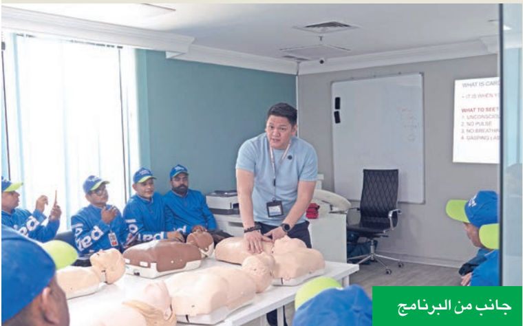
جانب من البرنامج

لتمكين الفرق الميدانية بمهارات الاستجابة للطوارئ