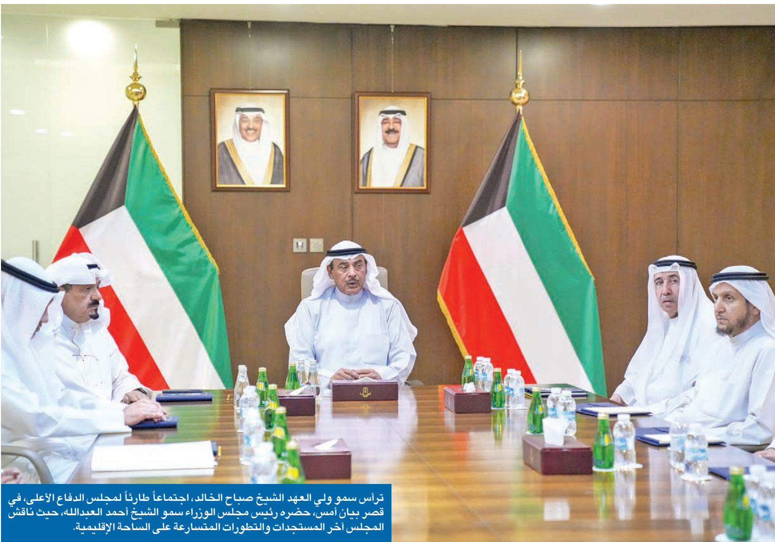
ترأس سمو ولي العهد الشيخ صباح الخالد، اجتماعاً طارئاً لمجلس الدفاع الأعلى، في قصر بيان أمس، حضره رئيس مجلس الوزراء سمو الشيخ أحمد العبدالله، حيث ناقش المجلس آخر المستجدات والتطورات المتسارعة على الساحة الإقليمية.

اليوسف: المرحلة الراهنة تتطلب الجاهزية القصوى محمد الشرهان شدد النائب الأول لرئيس مجلس الوزراء وزير الداخلية الشيخ فهد اليوسف على أهمية التحلي بالجاهزية القصوى والعمل بروح الفريق الواحد، مؤكداً أن المرحلة الراهنة تتطلب تكاتف الجهود الوطنية وتعزيز التنسيق الميداني والمعلوماتي بين جميع الجهات ذات العلاقة. واعتبر اليوسف، خلال ترؤسه اجتماع لجنة الدفاع المدني أمس في مقر إدارة الأزمات والكوارث بمبنى نواف الأحمد، أن أمن الكويت وسلامة مواطنيها أولوية قصوى تتطلب التخطيط الاستباقي والتحديث المستمر للخطة والالتزام بما يتوافق مع أفضل الممارسات العالمية في إدارة الأزمات. وناقش الاجتماع، الذي حضره ممثلون عن 32 جهة حكومية، رفع الجاهزية الوطنية لمواجهة الأزمات والكوارث، بما يعزز أمن المجتمع وسلامته، إلى جانب الية دور عمل فرق الإخلاء والإيواء الميدانية المتخصصة، والتأكيد على أهمية تعزيز التواصل الفعال بين الجهات المعنية، وتوحيد الجهود ضمن منظومة متكاملة تضمن سرعة الاستجابة، وتحقيق أعلى مستويات التنسيق في إدارة الأزمات والطوارئ، مع التركيز على أهمية تفعيل نظم الإنذار المبكر، ومراكز التحكم الموحدة لتسريع اتخاذ القرار وتوزيع الموارد بما يرسخ الجاهزية الوطنية ويحقق أعلى مستويات الأمان والاستقرار.