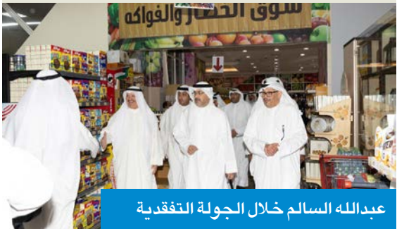
عبدالله السالم خلال الجولة التفقدية

قام محافظ العاصمة الشيخ عبدالله السالم، مساء أمس الأول، بجولة تفقدية شملت جمعيتي الشامية والعديلية والتعاونيتين، حيث رافقه خلال الجولة ممثل وزارة الشؤون الاجتماعية رئيس فريق العاصمة خليفة الشمري، إلى جانب عدد من المسؤولين. واطلع المحافظ، خلال الجولة، على جاهزية المخزون الغذائي، وتوافر السلع الاستهلاكية الأساسية في الأسواق، إلى