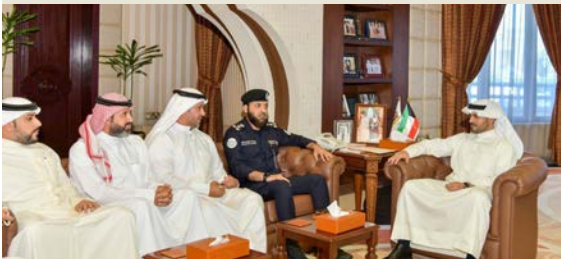
صباح البدر مستقبلاً العميد المطيري وعدداً من التعاونيين

أكد محافظ مبارك الكبير الشيخ صباح البدر، أهمية دعم الجمعيات التعاونية في أداء دورها الخدمي والمجتمعي، وتقليل أي عقبات قد تواجهها؛ بما يعزز كفاءة العمل التعاوني. جاء ذلك خلال استقباله في مكتبه بديوان عام المحافظة، صباح أمس، مسؤولين من وزارة الشؤون والجمعيات التعاونية بالمحافظة، وتم خلال اللقاء، بحث المخزون الاستراتيجي وجاهزية خطة الطوارئ للجمعيات التعاونية وسط التطورات الإقليمية، كما اطمأن على خطة الجمعيات التعاونية عن المخزون الاستراتيجي ووفرة ومثانة المواد الغذائية والسلع الأساسية وتلبية الاحتياجات اللازمة للمواطنين والمقيمين في الأسواق المركزية.