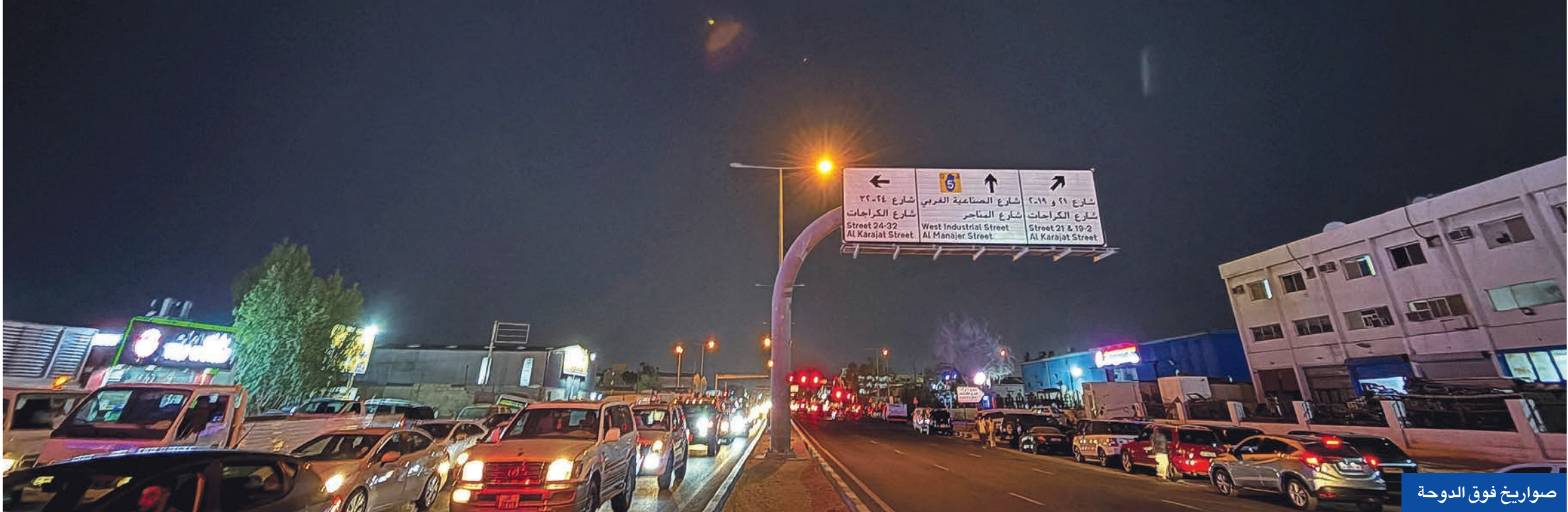
صواريخ فوق الدوحة

الإقليمي والعالمي»، لافتة إلى أن «ترامب لا يزال يرغب في إرساء السلام بالشرق الأوسط لكن تحقيق ذلك يتطلب أحياناً استخدام القوة». وأوضحت أن الإدارة الأميركية تراقب عن كثب التطورات في مضيق هرمز الاستراتيجي بالخليج، مشددة على أن أي خطوة من إيران لإغلاق الممر الملاحي الجوي لإمدادات النفط العالمية ستكون «لعياً بالنار ومن الغباء»، وستواجه عواقب كبيرة. وجاء ذلك في وقت أثار قرار ترامب التاريخي باستخدام القوة العسكرية ضد المنشأة النووية في إيران، وتحويل التعاون مع إسرائيل من سياسي إلى تنسيقي عسكري غير مسبوق، الكثير من الجدل، داخل الولايات المتحدة، حيث انقسم الرأي العام بشأن الخطوة التي تخاطر بانخراط اميركي في حرب جديدة، وسط استياء متزايد من أعضاء «الكونغرس» بسبب تجاهل الرئيس الجمهوري للمؤسسة التشريعية.