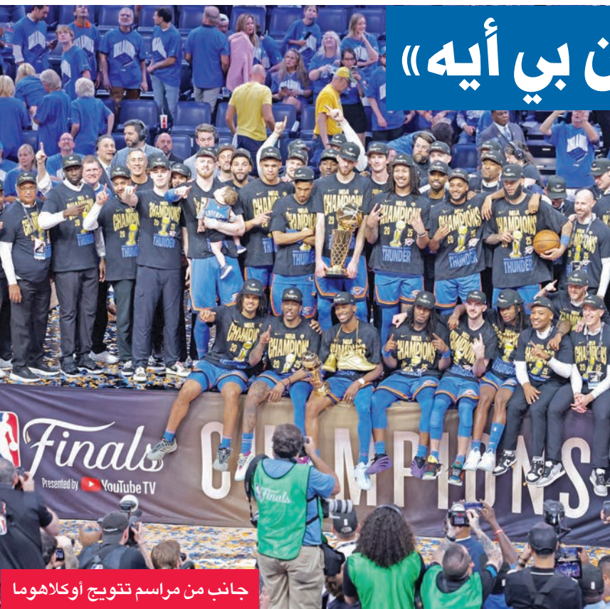
جانب من مراسم تتويج أوكلاهوما

أكد الإنكليزي جود بيلينغهام، لاعب وسط ريال مدريد الإسباني، أمس الأول الأحد، أنه سيخضع لجراحة في كتفه المصابة منذ فترة طويلة، بعد انتهاء مشاركة فريقه في كأس العالم للأندية لكرة القدم. ويعاني الإنكليزي الدولي من أوجاع بعد تعرضه لخلع الكتف في مباراة ضمن الدوري الإسباني في نوفمبر 2023، وهو يلعب مرتدياً دعامة تحت قميصه منذ ذلك الوقت. ورغبة منه في إحراز لقب البطولة المجزية مالبا، قرر النادي الملكي إرجاء جراحة بيلينغهام حتى نهايتها، ما يعني غيابه عن انطلاق بطولة الدوري الإسباني (لا ليغا) للموسم المقبل. وقال بيلينغهام: «وصلت إلى مرحلة... ضقت ذرعا بالدعامة، واضطراري لشدها، وقيام لاعبين (آخرين) بشدها، وإعادة ترتيبها طوال الوقت»، وتابع: «لدي جراحة مبرمجة بعد البطولة، اعتقد أنها بعد أيام قليلة من موعد النهائي... أنا سعيد حيال هذا الأمر، منذ فترة وأنا أنتظره. اعتقد أن صبري قد نفذ من الدعامة». وقد يتطلب تعافي بيلينغهام نحو 12 أسبوعاً حسب تقارير صحافية، ما يعني أنه قد يغيب أيضاً عن مبارياتي إنكلترا ضمن تصفيات كأس العالم 2026 ضد أندورا وصربيا.