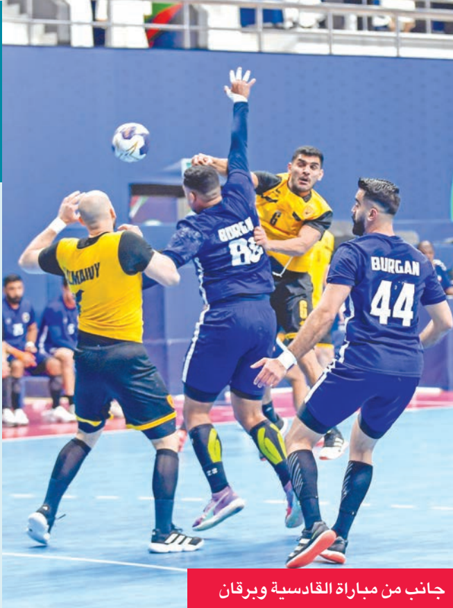
جانب من مباراة القادسية وبرقان

قدّم القادسية عرضاً مميزاً منذ بداية اللقاء، مستنداً إلى تنظيم