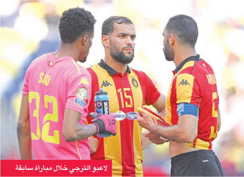
لاعبو الترجي خلال مباراة سابقة

على الموعد، وأن يسجل لأول مرة بمسيرته في مرمى البايرن، فيما يسعى في المقابل الجناح الفرنسي للنادي البافاري ميكايل أوليسيه أن يسجل للمباراة السابعة توالياً في مختلف المسابقات. وعلى ملعب جيوديس بارك في ناشفيل، يعلم بوكا جونيورز أن تحقيقه الفوز قد يكون سهلاً، لكن التأهل ليس بين يديه، إذ يحتاج إلى