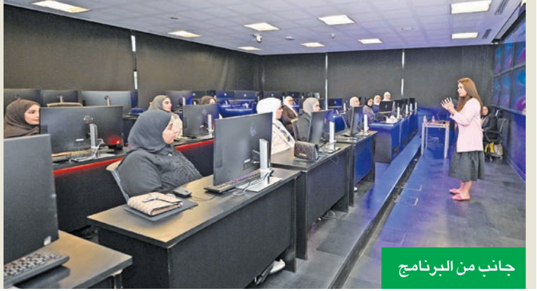
جانب من البرنامج

وأعلنت «زين» شراكتها الاستراتيجية مع برنامج CyberSHE التدريبي العملي، الذي أطلقته رابطة نساء الشرق الأوسط للأمن السيبراني (WICSM) في كلية الكويت للعلوم والتكنولوجيا (KCST)، بهدف تمكين المرأة وسد الفجوة بين الجنسين في مجالات الأمن السيبراني، من خلال تزويد الشباب بالمهارات والثقة اللازمة للتميّز في هذا المجال المتسارع النمو. وتندرج هذه الشراكة تحت مظلة مبادرة «المرأة في التكنولوجيا» التي أطلقتها «زين» لتطوير الكفاءات النسائية في مجالات العلوم والتكنولوجيا والهندسة والرياضيات (STEM)، والتي تُعد إحدى الركائز الأساسية في استراتيجية الشركة للاستدامة المؤسسية، وامتداداً لجهودها الرامية إلى دعم التنوع والشمول وتمكين الطاقات الوطنية الشابة في التكنولوجيا والمهارات الرقمية.