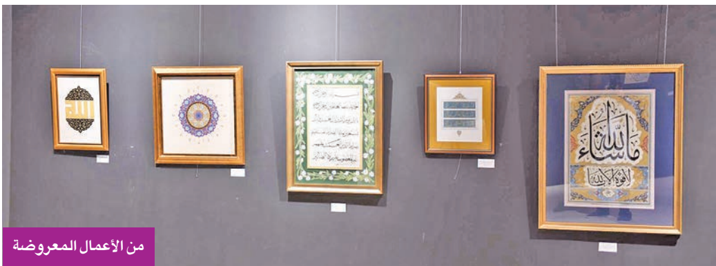
من الأعمال المعروضة

وعند سؤالها عما إذا كان الخطاط يجب أن يكون فناناً تشكلياً، أجابت بأن الخط العربي لا يتطلب أن يكون