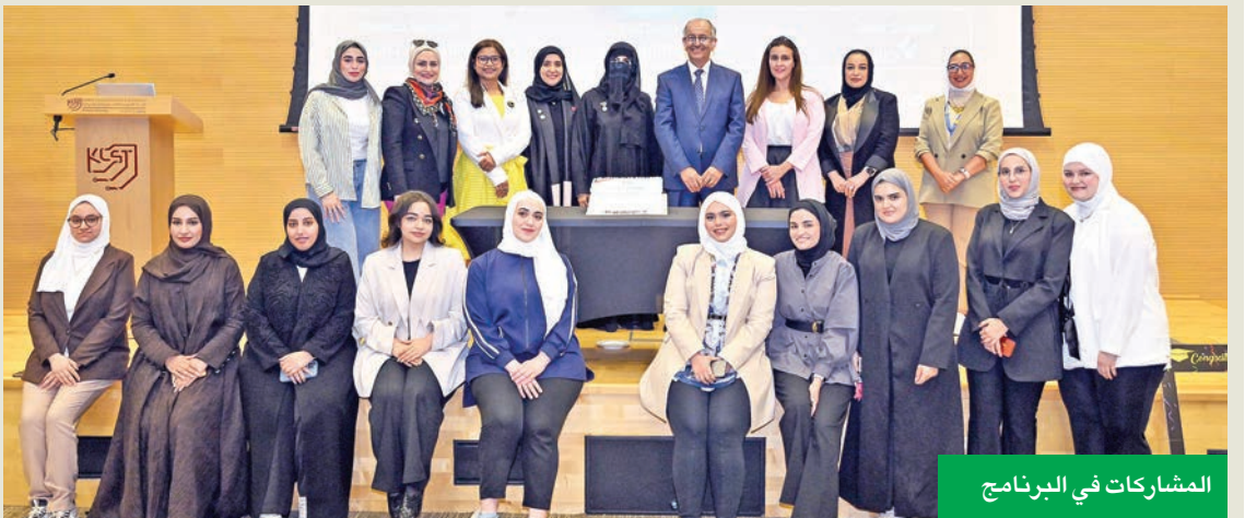
المشاركات في البرنامج

بالتعاون مع رابطة نساء الشرق الأوسط للأمن السيبراني