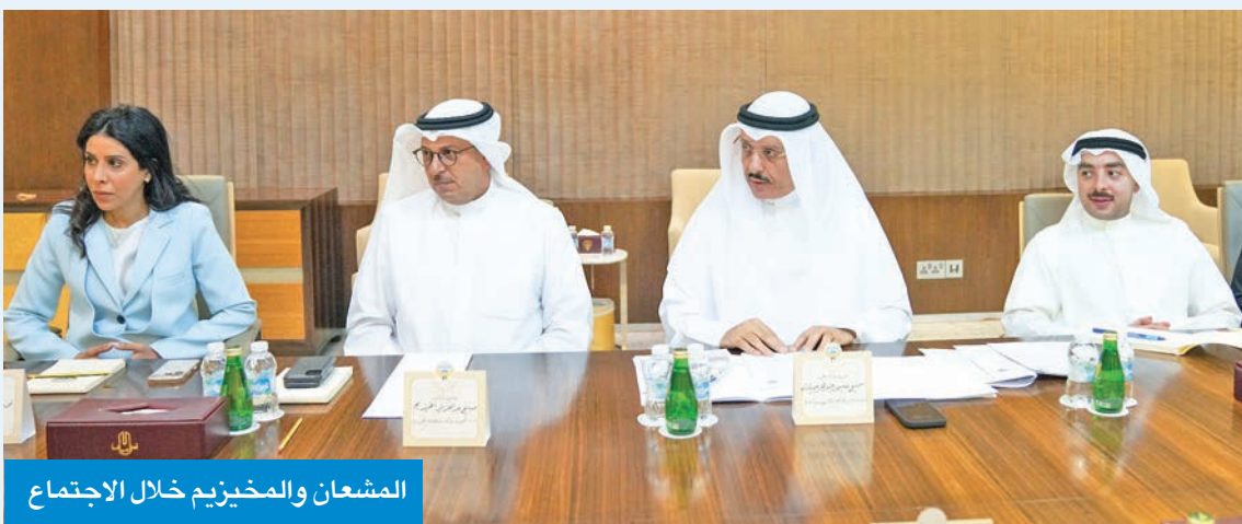
المشعان والمخيزيم خلال الاجتماع