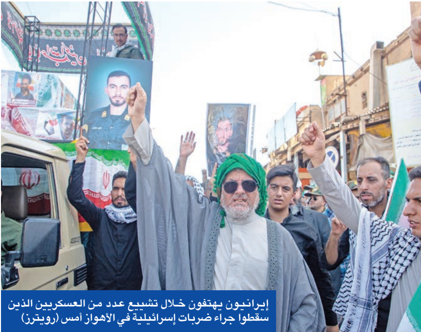
إيرانيون يهتفون خلال تشييع عدد من العسكريين الذين سقطوا جراء ضربات إسرائيلية في الأهواز أمس