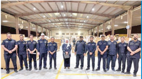
القلاف خلال الجولة