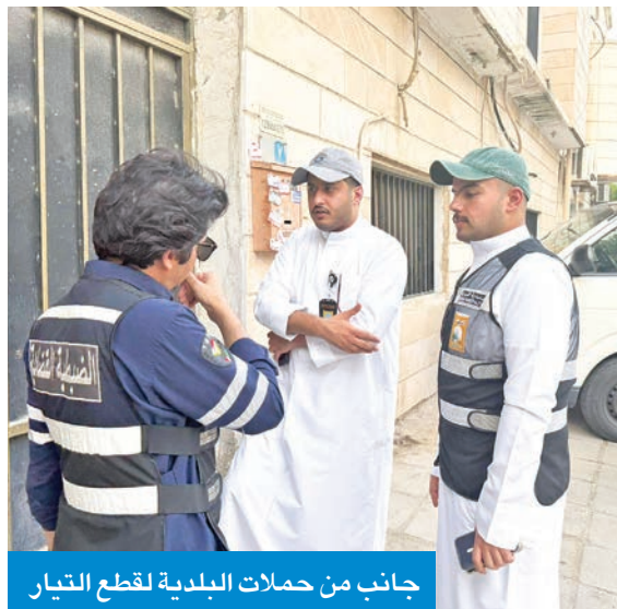
جانب من حملات البلدية لقطع التيار

يذكر أن البلدية أعلنت في وقت سابق عن وجود مشروع قانون قيد الدراسة، يهدف إلى حظر سكن العزّاب في مناطق السكن الخاص والنموذجي بشكل أكثر صرامة، ومنح البلدية صلاحية إخلاء العقارات المخالفة.