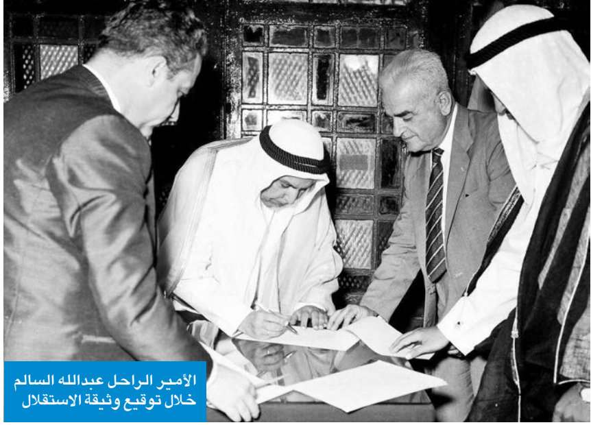
الأمير الراحل عبدالله السالم خلال توقيع وثيقة الاستقلال

واتسم دستور الكويت بروح التطور التي تقدم للشعب الكويتي الحلول الديمقراطية للانطلاق في درب النهضة والتقدم والأزدهار، الذي مكن البلاد من انتهاز حياة