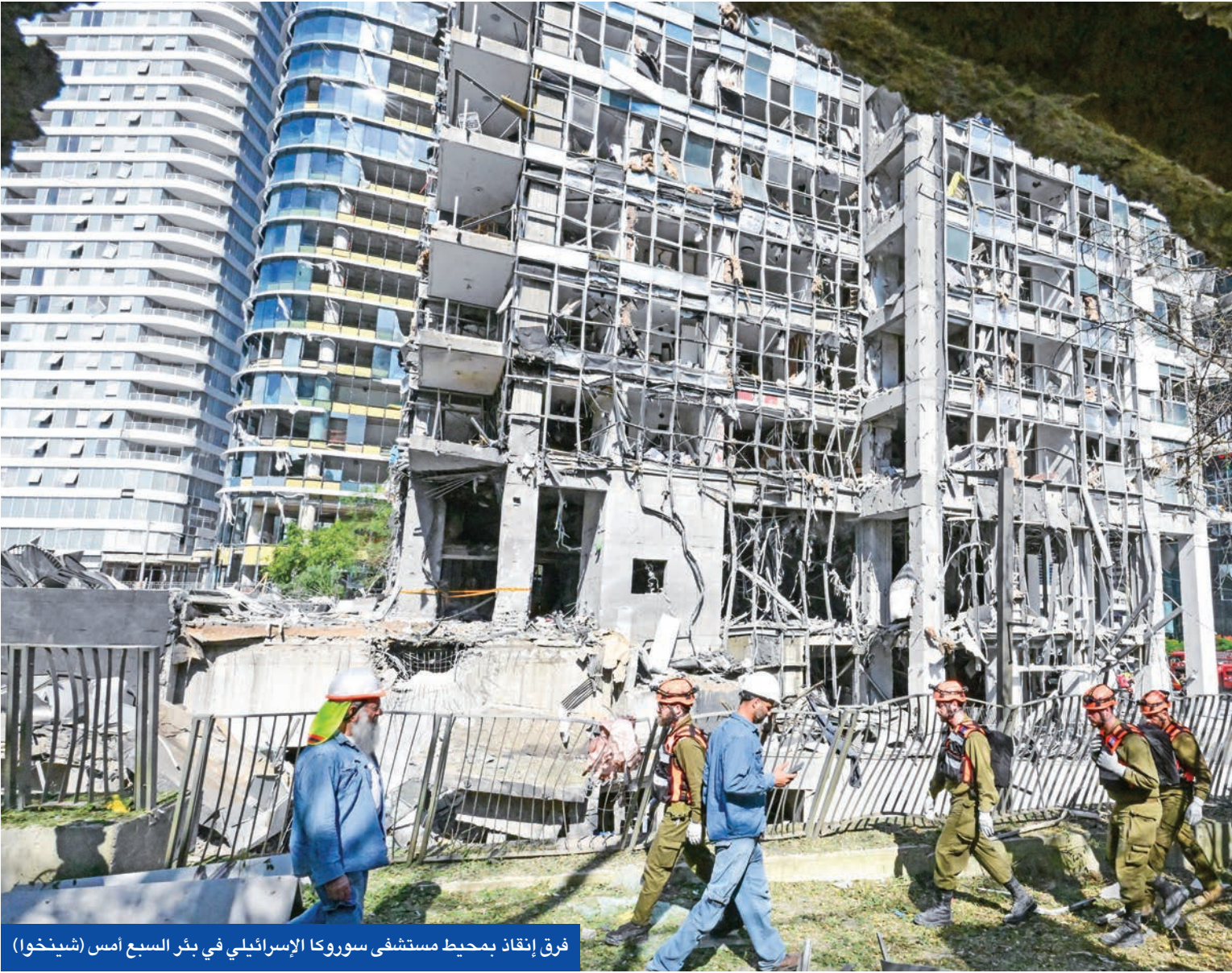
فرق إنقاذ بمحيط مستشفى سوروكا الإسرائيلي في بئر السبع أمس

وفي تطور لافت، ذكرت مصادر عسكرية إسرائيلية، أن أحد الصواريخ التي أطلقت من إيران ويعتقد أنه «خرمشهر» كان يحتوي على «راس حربي عنقودي»، مما أدى إلى سقوط عدة أجزاء متفجرة في المدن الواقعة بمحيط تل أبيب، بينها يافا وأور يهودا ومدينة سافيتون. وأشارت إلى «خرمشهر» بشبه صاروخ «سارمات» الروسي الذي يحمل رؤساً حربية يحمل عدة صواريخ يصل عددها إلى نحو 80. وفي تطور لافت، ذكرت مصادر عسكرية إسرائيلية، أن أحد الصواريخ التي أطلقت من إيران ويعتقد أنه «خرمشهر» كان يحتوي على «راس حربي عنقودي»، مما أدى إلى سقوط عدة أجزاء متفجرة في المدن الواقعة بمحيط تل أبيب، بينها يافا وأور يهودا ومدينة سافيتون. وأشارت إلى «خرمشهر» بشبه صاروخ «سارمات» الروسي الذي يحمل رؤساً حربية يحمل عدة صواريخ يصل عددها إلى نحو 80. وفي تطور لافت، ذكرت مصادر عسكرية إسرائيلية، أن أحد الصواريخ التي أطلقت من إيران ويعتقد أنه «خرمشهر» كان يحتوي على «راس حربي عنقودي»، مما أدى إلى سقوط عدة أجزاء متفجرة في المدن الواقعة بمحيط تل أبيب، بينها يافا وأور يهودا ومدينة سافيتون. وأشارت إلى «خرمشهر» بشبه صاروخ «سارمات» الروسي الذي يحمل رؤساً حربية يحمل عدة صواريخ يصل عددها إلى نحو 80.