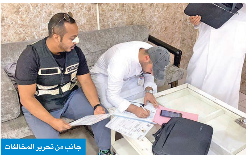
جانب من تحرير المخالفات

بالكشف على تراخيص المحال والإعلانات، إضافة إلى التراخيص الصحية، واتخاذ الإجراءات الرقابية بحق المخالفين، والتأكد من مدى الالتزام باللوائح والنظم، والتأكد من مطابقة المحال للشروط الجديدة في اللائحة المقررة مؤخراً.