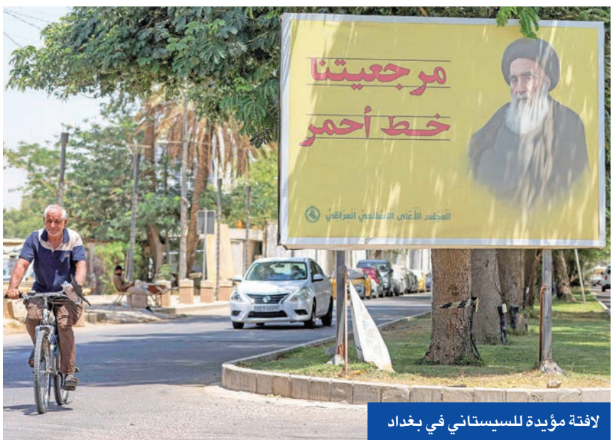
لافتة مؤيدة للسيستاني في بغداد