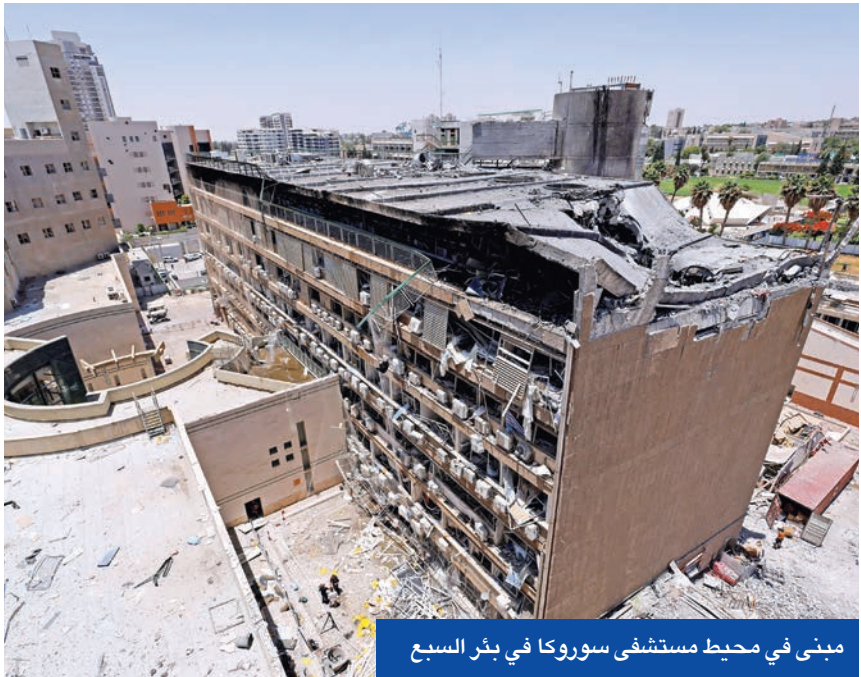
مبنى في محيط مستشفى سوروكا في بئر السبع

من ناحية، هاجم أكرم الكعبي قائد ميليشيا النجباء ترامب بسبب تلويحه باغتيال خامنئي الذي وصفه بأنه «ولي الأمة»، مهدداً في حال المتسوا شعرة من علي الخامنئي، بملاحقة الأميركيين وحلفائهم بـ«النيران في كل المنطقة الإسلامية» وباستهداف «الجنود والدبلوماسيين وكل من يحمل الجنسية الأميركية»، ويضرب كل «المصالح الأميركية المباشرة وغير المباشرة». واتهم الكعبي الأميركيين بـ«خيانة السيد المسيح»، والخضوع لـ«أعدائه ومن حاربه وأذاه من المتطرفين اليهود».