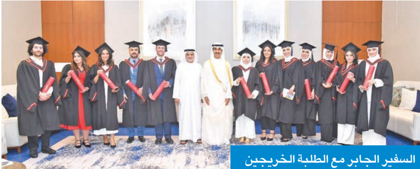
السفير الجابر مع الطلبة الخريجين

الخريجون خلال مشوارهم الدراسي بأنهم على قدر عالٍ من المسؤولية، وأثنى على دور المؤسسات التعليمية بالجرحين في تذليل الصعوبات وتسخير الجهود والإمكانات لتلبية احتياجات طلبة الكويت. وشهد الحفل تخرُّج 17 طالباً وطالبة طب بشري، حيث تم تكريمهم وتسليمهم شهادات التخرج.