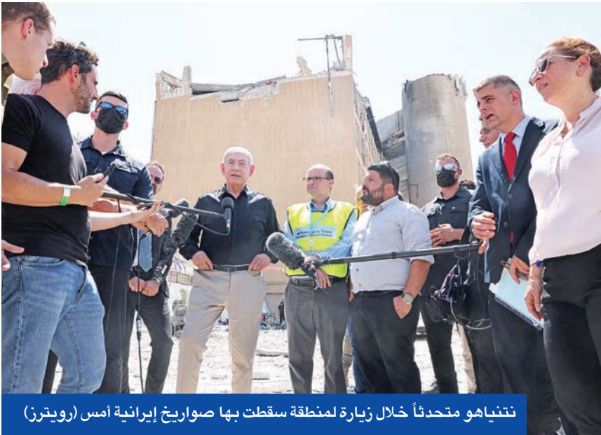
ننياهو متحدثاً خلال زيارة لمنطقة سقطت بها صواريخ إيرانية أمس

محطة بوشهر الكهروذرية الواقعة جنوب إيران والتي تبعد نحو 250 كيلومترا عن سواحل الكويت وتعمل محطة بوشهر النووية تحت الرقابة الكاملة للوكالة الدولية للطاقة الذرية. ومنذ بدء العمل في بوشهر تؤمن روسيا اليورانيوم المخصص لتشغيل المحطة، كما تتولى نقل الوقود شديد التلف إلى أراضيها، حيث تقوم بمعالجته بعد أن «يبرد» لمدة 10 سنوات في بوشهر، بموجب اتفاق خاص بين البلدين. واعلنت الوكالة الدولية للطاقة الذرية أن محطة بوشهر النووية، الواقعة جنوب إيران على سواحل الخليج، لم تتعرض لأي ضربات إسرائيلية على عكس مواقع أخرى، مثل نطنز واصفهان النووي وفي كرج وطهران. وأشارت تقارير إلى أن وجود الروس في بوشهر، وقرب المسافة بين المحطة ودول الخليج العربية، وخطر تلوث مياه الخليج التي تعتمد عليها دول مجلس التعاون لتحلية المياه، قد تجعل من بوشهر خطاً أحمر، وتضع قيوداً على إمكانية أن تستهدفها إسرائيل. وحذر المدير العام لمؤسسة روساتوم الحكومية الروسية للطاقة الذرية اليكسي ليخاتشوف في سان بطرسبرغ من استهداف بوشهر، وقال إن الهجوم على المحطة يمكن أن يتسبب في وقوع حادث مماثل لكارثة تشيرنوبل عام 1986. وأضاف ليخاتشوف أنه لا يوجد سبب لنقل الخبراء الروس في بوشهر إلى مكان آمن، ولكن تم رحيل بعضهم من إيران، ودعا السلطات الإسرائيلية إلى «تجنب أي تلميح أو عمل قد يؤدي إلى ضرب المحطة». وأكد نائب المدير العام للوكالة الدولية للطاقة الذرية، ميخائيل تشوداكوف، في وقت سابق، أن ضرب المحطات الذرية الإيرانية قد يتسبب في تلوث إشعاعي أقوى من أثر انفجار نووي.