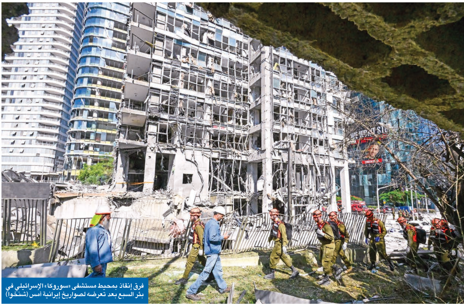
فرق إنقاذ بمحيط مستشفى «سوروكا» الإسرائيلي في بئر السبع بعد تعرضه لصواريخ إيرانية أمس (شخّوا)

• تل أبيب تقصف موقعا نووياً... وموسكو تحذر من «تشرنوبل» جديدة في «بوشهر»