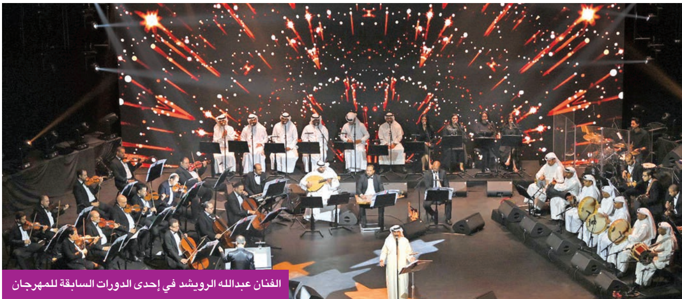
الفنان عبدالله الرويشد في إحدى الدورات السابقة للمهرجان

في حفل لأغنيات فضل شاكر بمركز جابر الأحمد الثقافي