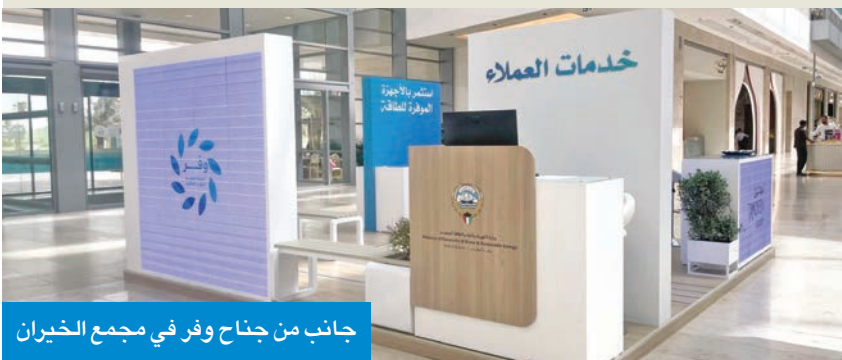
جانب من جناح وفر في مجمع الخبران

حيات: جناح «وفر» يعزز الوعي المجتمعي بترشيد الاستهلاك