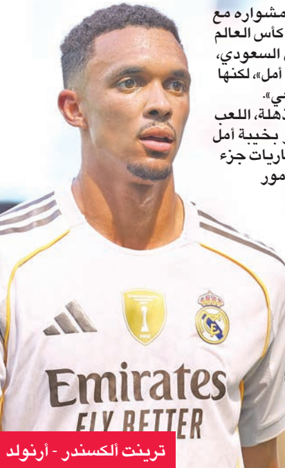
ترينت ألكسندر - أرنولد

استهل الإنكليزي ترينت ألكسندر - أرنولد مشواره مع ريال مدريد في أولى مباريات الفريق الملكي في كأس العالم للأندية، التي انتهت بالتعادل 1 - 1 أمام الهلال السعودي، النتيجة التي قال إنها أصابته مع زملائه بـ «خيبة أمل، لكنها لم تطغ على فرحة مشاركته الأولى مع «الميريغي»». وصرح ترينت بأن مشاركته الأولى كانت «مذهلة، اللعب لريال مدريد حلم يراود الجميع، مع أننا نشعر بخيبة أمل أيضاً لعدم قدرتنا على الفوز. الفوز بجميع المباريات جزء من عقلية ريال مدريد. كانت هناك العديد من الأمور الإيجابية، خصوصاً في الشوط الثاني». وفي ظل الثقة التي أودعها فيه تشابي ألونسو منذ البداية، شغل ألكسندر-أرنولد مركز الظهير الأيمن للريال، تاركاً لوكاس فاسكينز على مقاعد البدلاء، دون منافسة من داني كارباخال، الذي يحتاج إلى استعادة لياقته بعد غياب طويل بسبب إصابة في الركبة. وعلى الصعيد الهجومي، شوهد الإنكليزي يتحرك إلى الوسط ويلعب بالقرب من أوريليان تشواميني.