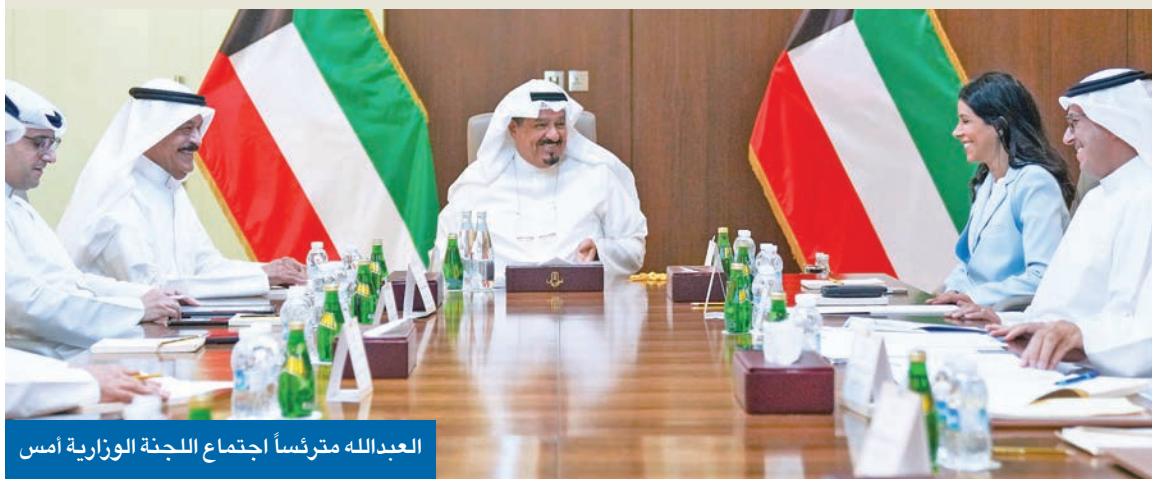
العبدالله مترأساً اجتماع اللجنة الوزارية أمس

سموه ترأس الاجتماع الـ 15 للجنة الوزارية لمتابعة تنفيذ الاتفاقيات بين الكويت والصين