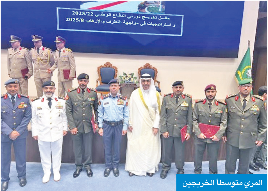
المرى متوسطا الخريجين

القوات المسلحة والأجهزة الأمنية الأردنية، إضافة إلى ضباط من دول عربية وأجنبية.