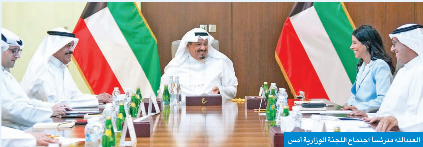
العدالله مترأساً اجتماع اللجنة الوزارية أمس

وقد أشاد رئيس الوزراء بجهود الكوادر الوطنية الدؤوبة في المؤسسة وسعيهم إلى الاستثمار في التكنولوجيا والعلوم ومواكبة التطور والابتكار في سبيل إبراز الوجه الحضاري لدولة الكويت.