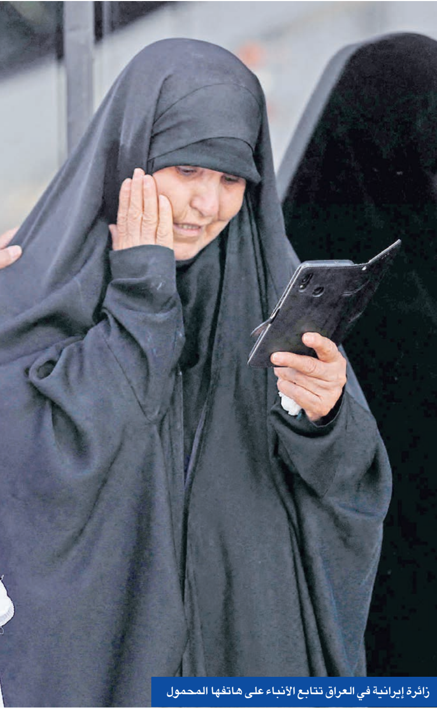
زائرة إيرانية في العراق تتابع الأنباء على هاتفها المحمول