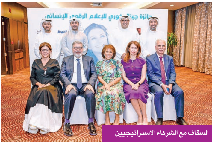
السقاف مع الشركاء الاستراتيجيين

قدمتها ضمن برنامج الجوهري. كما قدمت فرقة لوبا للرقص الاستعراضى عرضاً أدائياً بعنوان «حيث تموت الكلمات» من إخراج الدكتورة تينا زابوفيتش - رئيس فرقة لوبا للرقص - شارك فيه عدد من الفنانين بآداء استعراض مستلهم من فكرة القيود على حرية الصحافة والتعبير في فلسطين المحتلة. وفي ختام الحفل كرمت السقاف الشركاء والرعاة، بعد أن قدمت إليهم الشكر قائلة: «أشكر شركائنا الذين بفضل شراكتهم ودعمهم المتواصل استطعنا أن نحول برنامج الجوهري إلى أكاديمية في الإعلام التطبيقي تقدم برامجها في شتى المجالات الإعلامية، واتاحت لنا أن نشجع الشباب العربي على الرصد الإعلامي لكل انتهاك لحقوق الإنسان يمارس عليهم. شكرنا من القلب شركائنا الاستراتيجيين شركة المركز المالي الكويتي (المركز)، فندق فوربوينتس شيراتون، وجريدة الجريدة، كما أتقدم بخالص الشكر لشركة الصناعات الهندسية الثقيلة وبناء السفن «هيسكو» على رعايتها السنوية الكريمة».