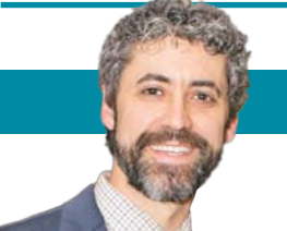
أنثرو هاتر* ر

بالقلم الأحمر: المدينة التي لا تنام يجب أن تنام باكراً، حتى لا تزيد من معذلات الجريمة والتسكّع في الشوارع فجراً، وترتفع معذلات الحوادث، ويرتفع معدل نسبة الغياب بسبب السُهر.