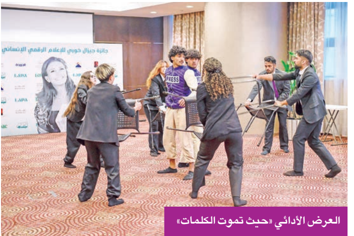
العرض الإدائي «حيث تموت الكلمات»

الكويتيين تؤكد تضامنهم مع القضية الفلسطينية