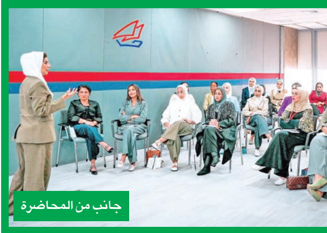
جانب من المحاضرة

استمراراً لدعمه المتواصل لحملة «لنكن على دراية»، التي أطلقها بنك الكويت المركزي، بالتعاون مع اتحاد مصارف الكويت، بواصل بنك بوبيان جهوده التوعوية مع اقتراب موسم الصيف وارتفاع وتيرة السفر، مؤكداً أهمية رفع مستوى الوعي لدى عملائه لمواجهة مخاطر الاحتيال المالي التي قد تزداد خلال فترات السفر لضمان تجربة سفر آمنة خالية من المخاطر المالية. وأوضح البنك أن الاستعداد للسفر لا يقتصر فقط على ترتيبات الإقامة والتنقل، بل يشمل تأمين الجوانب المالية واتخاذ بعض التدابير الاحترازية والإرشادات العملية لحماية البيانات والمعلومات المصرفية، خاصة في ظل استهداف المحتالين للمسافرين خلال تنقلهم خارج البلاد. ودعا بوبيان عملاءه إلى التواصل مع البنك مسبقاً وإبلاغه بخطة السفر، وهو ما يساهم في تعزيز فعالية أنظمة مراقبة الاحتيال عند استخدام البطاقات المصرفية خارج الكويت، مشدداً على أهمية تنويع وسائل الدفع أثناء السفر، من خلال استخدام أكثر من بطاقة سواء بطاقات الائتمان أو السفر المسبقة الدفع، مع الحرص على تقليل حمل المبالغ النقدية واستخدام قدر الإمكان. وأكد البنك أن استخدام القنوات الرقمية الأمنة يمثل ركيزة أساسية للحفاظ على سلامة المعاملات المصرفية خلال السفر، مشيراً إلى ضرورة تجنب استخدام شبكات Wi-Fi العامة عند