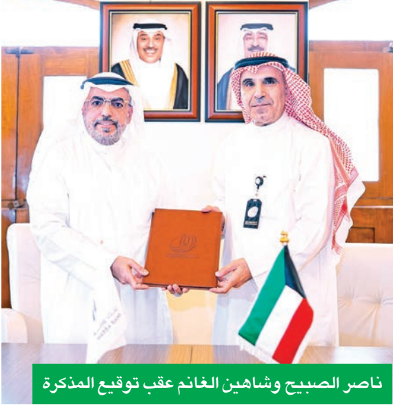
ناصر الصباح وشاهين الغانم عقب توقيع المذكرة

والدولي»، مضيفاً: «نؤمن في بنك وربة بأن الاستثمار الحقيقي هو الاستثمار في الإنسان، ولهذا نضع تنمية القدرات الوطنية في صميم استراتيجيتنا، فدعمنا المتواصل للبرامج والمبادرات التعليمية والمهنية والعلمية والثقافية والتوعوية هو تجسيد للالتزام الراسخ بالمساهمة في بناء مجتمع كويتي أكثر تمكناً ونمواً يرفع راية الكويت عالياً على مستوى العالم في شتى المجالات». واختتمت مراسم التوقيع بالتأكيد على أن هذه الخطوة تمثل محطة متقدمة في مسار التعاون المثمر بين الجهات الحكومية والمؤسسات المالية الوطنية، ونموذجاً يحثي به في الشراكات الاستراتيجية التي تستهدف بناء القدرات، ورفع كفاءة الأداء الحكومي، ضمن إطار مؤسسي مستدام يدعم التنمية الشاملة في الكويت.