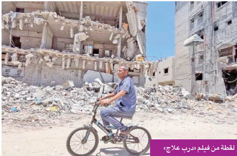
لقطة من فيلم «درب علاج»