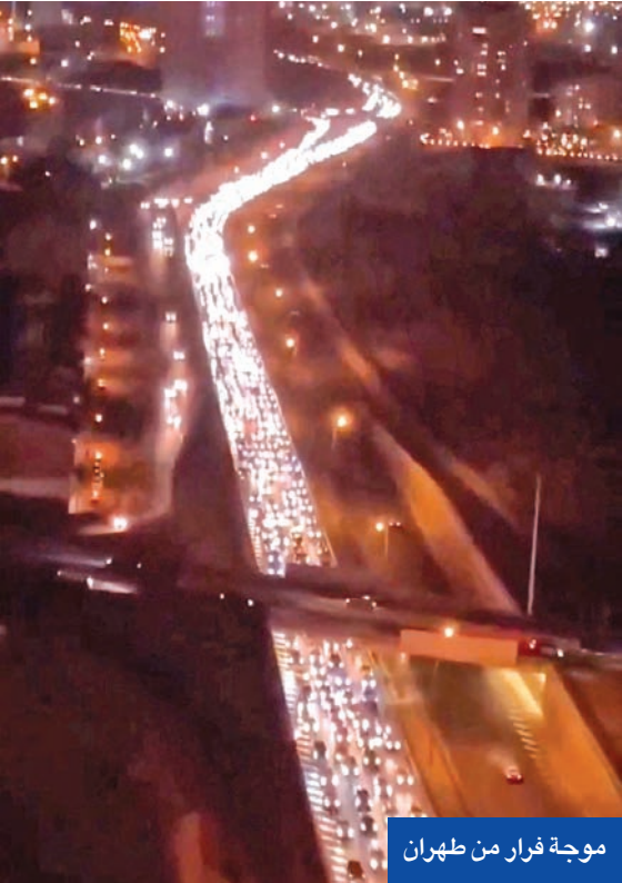
موجة فرار من طهران

بحرج 5 إسرائيليين، لكنها اعتبرت أقل بكثير من تهديدات أطلقها القيادة الإيرانية، وعلى رأسها خامنئي، عصر أمس الأول بتنفيذ ضربة هي الأكبر بالتاريخ ضد تل أبيب. من جانب آخر، كشف مسؤول أذربيجاني، أن أكثر من 600 أجنبي فروا من إيران برا باتجاه أذربيجان، في ظل استمرار إغلاق الأجواء الإيرانية أمام الرحلات الداخلية والخارجية، فيما دعت عدة دول من بينها الصين وروسيا رعاياها إلى مغادرة الجمهورية الإسلامية فوراً.