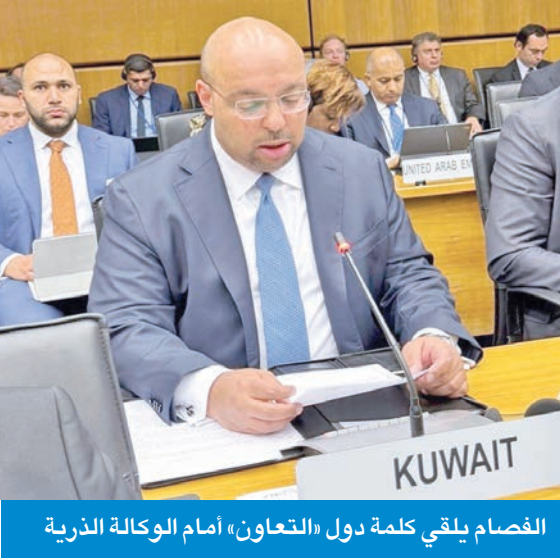
الفصام يلقي كلمة دول «التعاون» أمام الوكالة الذرية

الفصام: أمن الخليج لا يتحقق بالتصعيد بل بالحوار والدبلوماسية وحسن الجوار