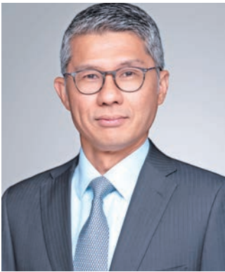
نعم أزاد الدين