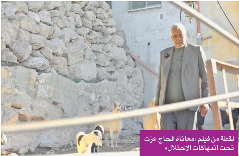
لقطة من فيلم «معاناة الحاج عزت تحت انتهاكات الاحتلال»