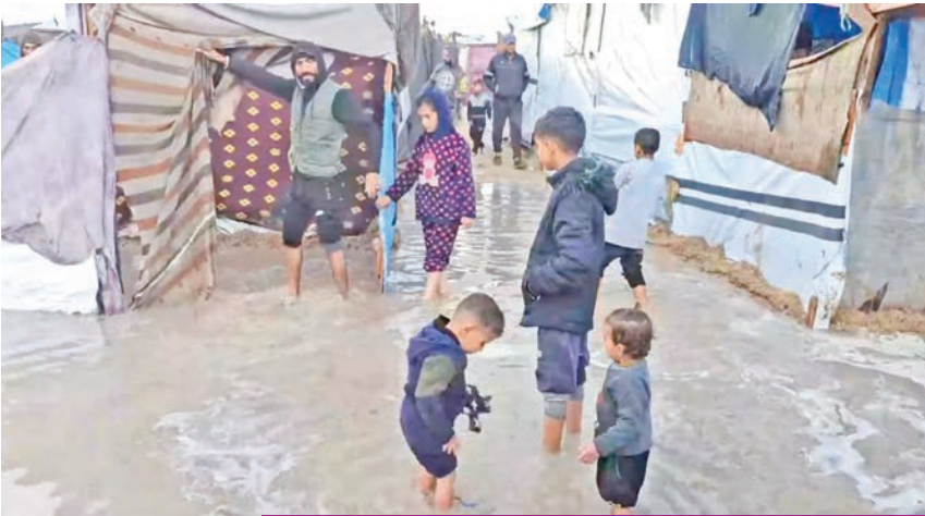
جانب من الفيلم الفائز بالمركز الأول «انتهاك العدوان الإسرائيلي ...»