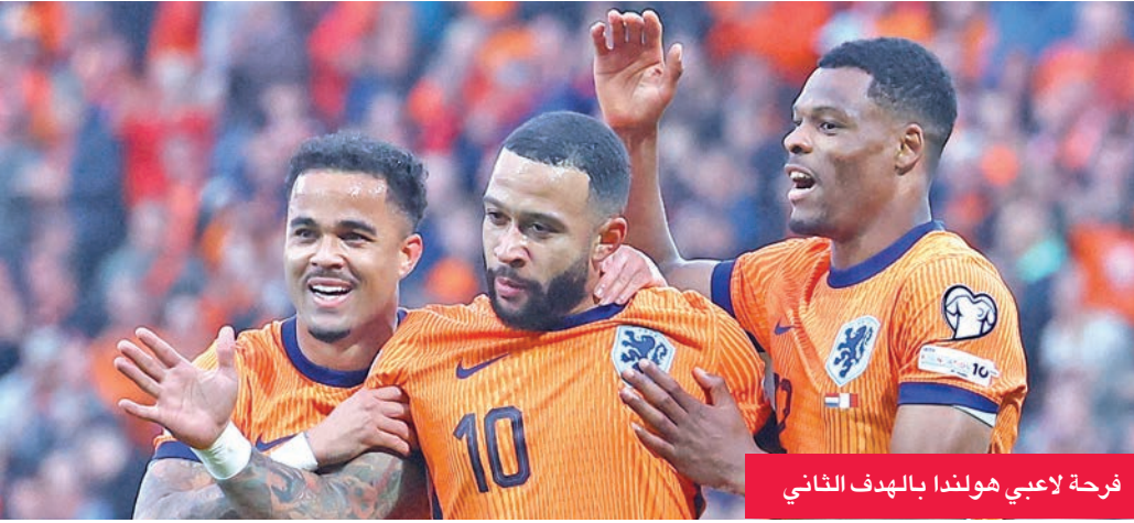
فرحة لاعبي هولندا بالهدف الثاني

وبتلاتية من أهداف الهلال السعودي الكسندر ميتروفيتش (12 و24 و53)، حققت صربيا فوزها الأول في ثاني مباراة لها ضمن المجموعة الحادية عشرة، التي تنصدها إنكلترا بتسع نقاط، وجاء على حساب ضيفتها المتواضعة أندورا 3-0. فرفعت رصيدها إلى 4 نقاط، بفارق نقطة خلف البانيا الثانية المتعادلة مع لاتفيا (4 نقاط) بنتيجة 1-1.