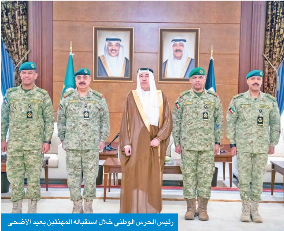
رئيس الحرس الوطني خلال استقباله المهنئين بعيد الأضحي

وأضاف البيان أن رئيس الحرس دعا المولى عز وجل أن يديم على الكويت الأمن والاستقرار في ظل القيادة الحكيمة لسمو أمير البلاد الشيخ مشعل الأحمد، القائد الأعلى للقوات المسلحة، وسمو ولي عهده الأمين الشيخ صباح الخالد.