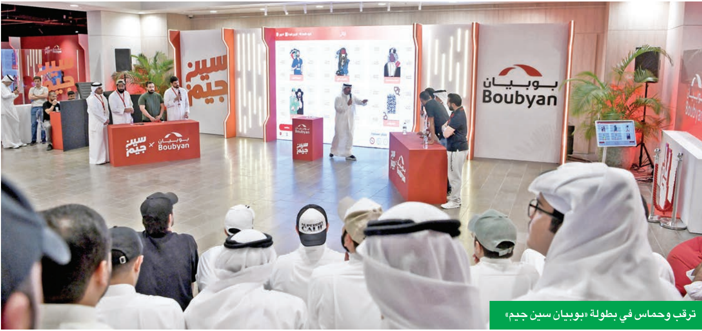
ترقب وحماس في بطولة «بوبيان سين جيم»