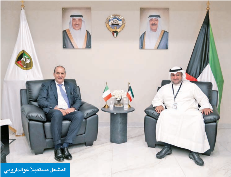
المشعل مستقبلاً غوالداروني

وأعلنت «الدفاع» في بيان صحافي، أن ذلك جاء خلال استقبال المشعل للمدير العام المشارك لأعمال شركة ليوناردو الإيطالية والوفد المرافق له، بمناسبة زيارته للبلاد، حيث تم خلال اللقاء استعراض مجالات التعاون المشتركة.