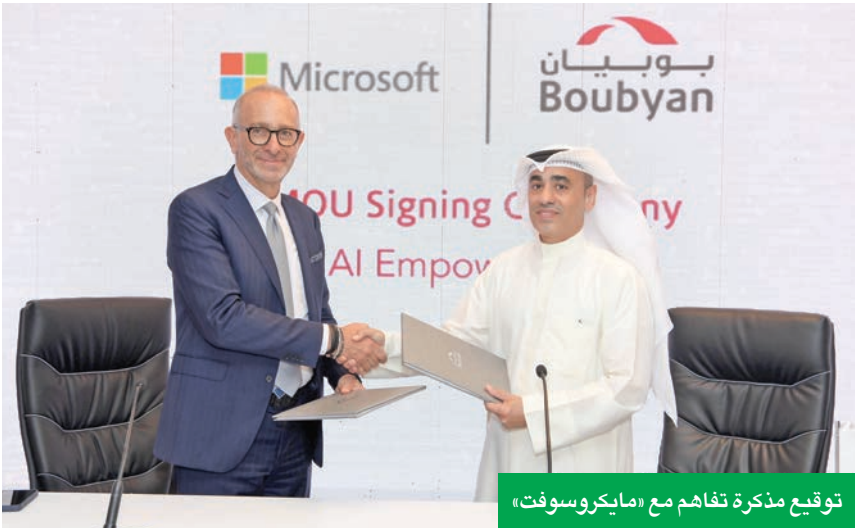
توقيع مذكرة تفاهم مع «مايكروسوفت»

وشهدت البطولة أسبوعاً كاملاً من التفاعل والمنافسة بين مختلف الفئات المشاركة، مع إضافة فئة جديدة مخصصة للعائلات، في تأكيد واضح على