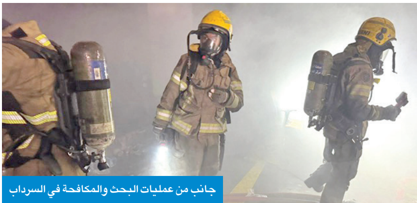
جانب من عمليات البحث والمكافحة في السرداب