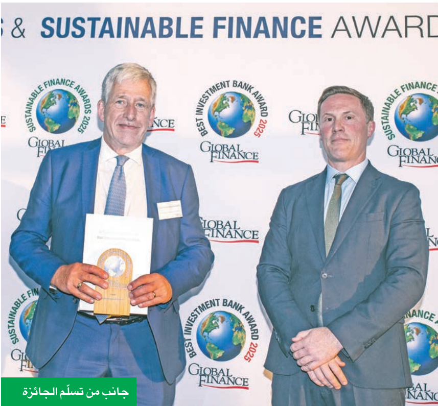
جانب من تسلّم الجائزة

يذكر أن مجلة غلوبل فاينانس العالمية التي أسست العام 1987 وتتخذ من نيويورك مقراً لها تعد من أعرق المجالات المتخصصة في قطاعي التمويل والاقتصاد ويبلغ عدد قرائها أكثر من 50 ألفاً من المديرين التنفيذيين ومسؤولي القرارات الاستثمارية والاستراتيجية