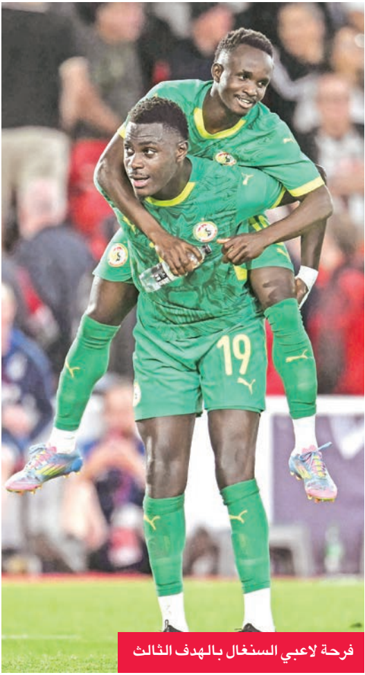
فرحة لاعبي السنغال بالهدف الثالث