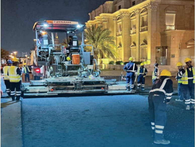
جانب من أعمال الصيانة في العديلية