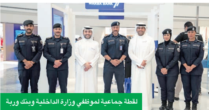
نقطة جماعية لموظفي وزارة الداخلية وبنك وربة

دعم المبادرات الحكومية والمشاركة في نشر الوعي المجتمعي، كما تهدف إلى تسليط الضوء على أهمية الالتزام بالقوانين المرورية الجديدة لضمان سلامة الجميع. وأشرف ضباط وزارة الداخلية على شرح كل التعديلات التي تم إدخالها على القانون، وتقديم المعلومات بشكل مبسط وفعال للزوار من مختلف الأعمار، بما يساهم في إيصال الرسالة بشكل مباشر وفعلي.