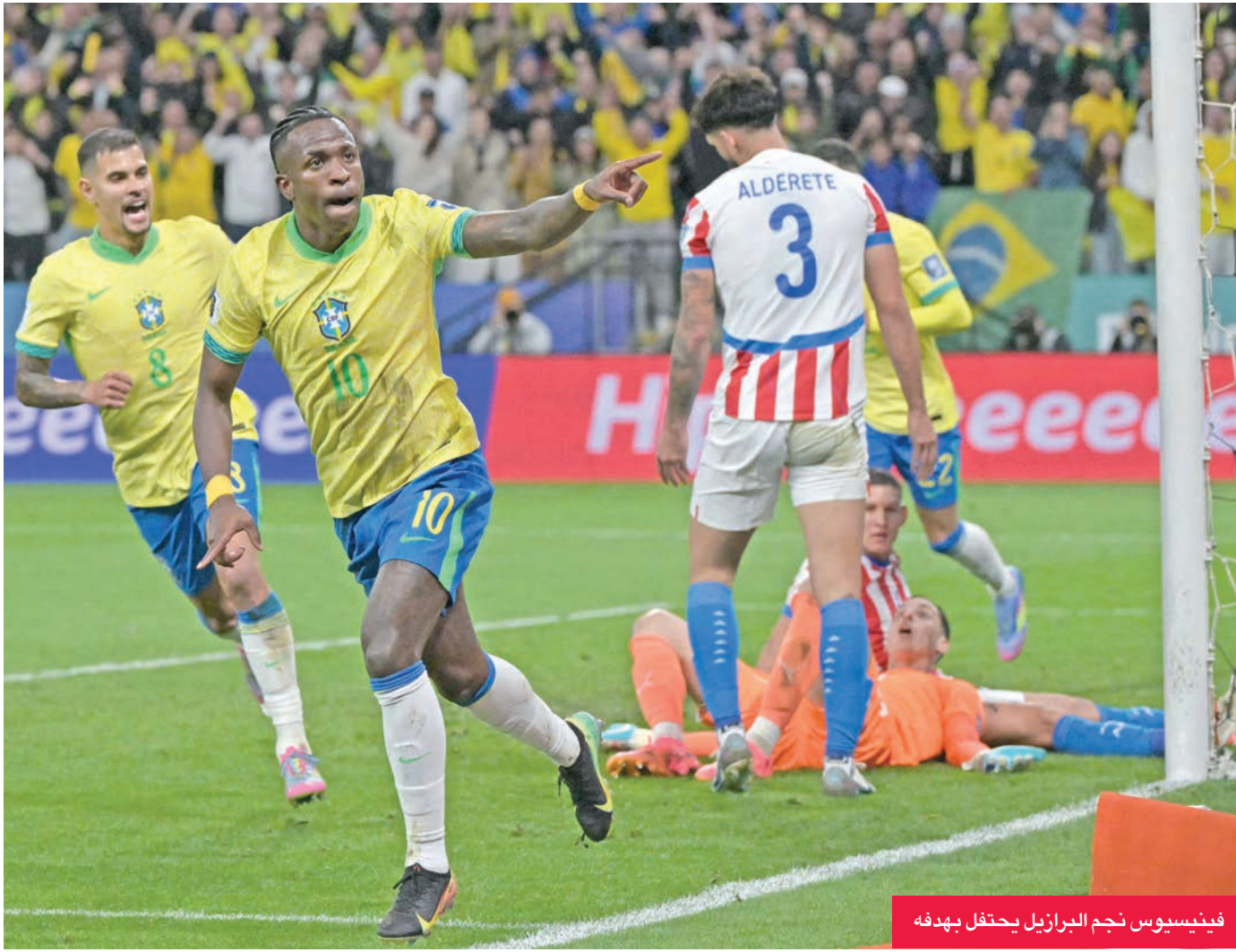
فينيسوس نجم البرازيل يحتفل بهدفه

حجزت البرازيل مكاناً لها برفقة الإكوادور في نهائيات كأس العالم 2026 لكرة القدم، أمس الأول الثلاثاء، بفوزها الهزيل على الباراغواي 1-0 في ساو باولو، وهو الأول تحت قيادة المدرب الإيطالي كارلو أنشيلوتي. ويدين بطل العالم خمس مرات بحسمه بطاقة التأهل إلى هدف فينيسوس جونيور نجم ريال مدريد الإسباني (44)، الذي جاء من مسافة قريبة قبل دقيقة من نهاية الشوط الأول، إثر كرة عرضية من الوافد الجديد إلى مانشستر يونايتد الإنكليزي، ماتئوس كونا. وكان الفوز بمنزلة الهدية المثالية لأنشيلوتي في عيد ميلاده 66، بعد أن تعادل «السليساو» أمام الإكوادور من دون أهداف الأسبوع الماضي في مباراته الأولى، وأشاد مدرب الريال السابق أنشيلوتي بـ «التزام» فريقه «وسلوكة»، مضيفاً: «كانت مباراة جيدة مع شوط أول جيد جداً، على الرغم من أننا عانينا قليلاً لأن الباراغواي خصم صلب جداً ولقد تباطأنا قليلاً في الثاني». وعزز فوز الأوروغواي على فنزويلا 2-0 في مونتيفيديو من فرص التأهل بالنسبة للبرازيل أو الباراغواي عندما التقيا على ملعب كورنثيانز. وكانت الباراغواي بحاجة إلى نقطة واحدة من أجل التأهل، فيما البرازيل احتاجت للفوز من أجل العبور. وتقدمت البرازيل إلى المركز الثالث في ترتيب أميركا الجنوبية برصيد 25 نقطة من 16 مباراة، لتضمن احتلالها أحد المراكز