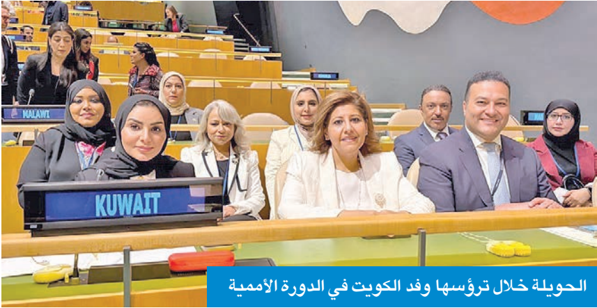
الحويلة خلال ترؤسها وفد الكويت في الدورة الأممية

استعداد الكويت لمواصلة التعاون مع المنظمات الأممية لتحقيق مجتمع أكثر شمولاً واستدامة، مجددة حرص البلاد على تعزيز التعاون لتنفيذ القرارات والاتفاقيات الدولية ذات الصلة بحقوق الأشخاص ذوي الإعاقة، ودعم سياسات الدمج والتكئين على المستويين الوطني والدولي.