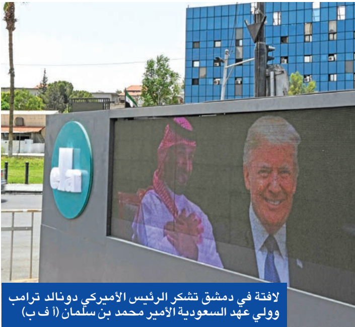
لافتة في دمشق تشكر الرئيس الأميركي دونالد ترامب وولي عهد السعودية الأمير محمد بن سلمان

وذكر مور وكوبر أنهما يعتقدان أن الشرع قادر بشكل فريد على وضع أجندة صنع السلام. وقال مور «الرئيس السوري