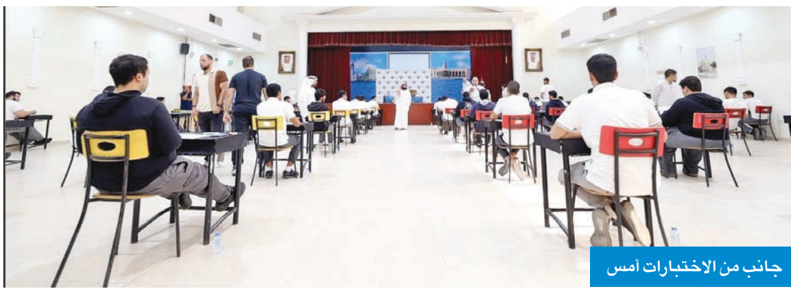
جانب من الاختبارات أمس

تم الاستعداد مبكراً للاختبارات، من خلال اختيار أعضاء اللجان من مراقبين وملاحظين يتمتعون بالكفاءة والقدرة على التعامل المن مع الطلبة خلال فترة الاختبارات. وأشار إلى أنه تم توزيع اللوحات الإرشادية والتحفيزية