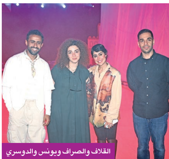
القلاب والصراف ويونس والدوسري