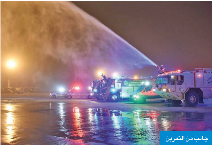
جانب من التمرين

العامة للطيران المدني، وذلك في إطار التنسيق المشترك وتعزيز الجاهزية الشاملة لمواجهة مختلف حالات الطوارئ.