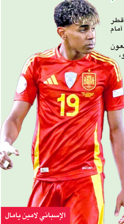
الإسباني لامين يامال

بلوغها نهائي مونديال قطر 2022، حيث خسرت بصعوبة أمام الأرجنتين بركلات الترجيح. ويغيب عن فرنسا المدافعون الأساسيون دابو أوباميكانو، وليام ساليبا، جول كوندية، إلى جانب لاعب الوسط إدواردو كامافينغا، فيما خاض ستة لاعبين من المنتخب النهائي دوري أبطال أوروبا السبت الماضي الذي هيمن عليه باريس سان جيرمان الفرنسي أمام إنتر الإيطالي (0-5).