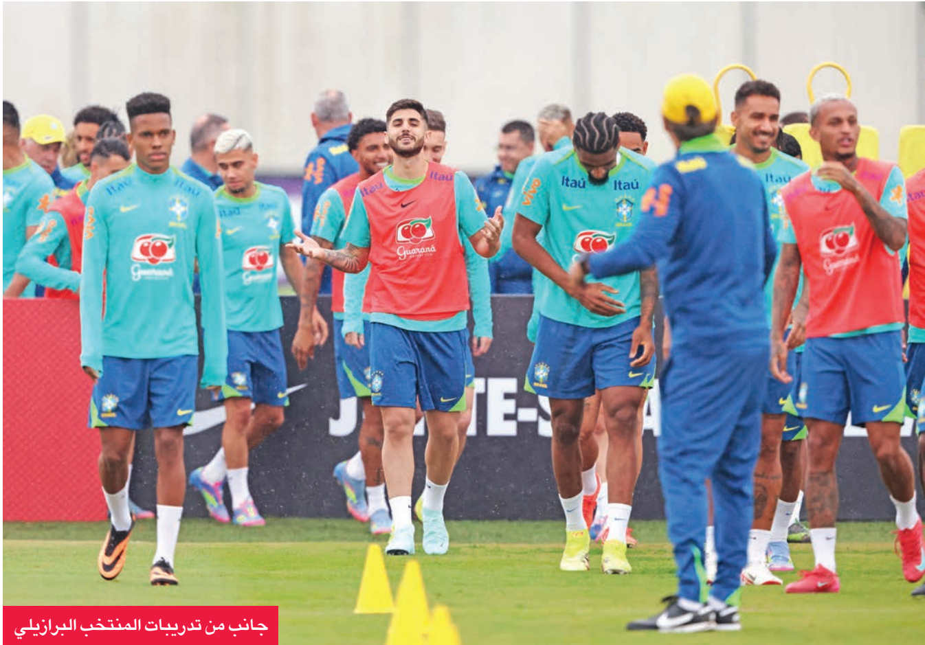
جانب من تدريبات المنتخب البرازيلي

وتبرز المواجهة بين الباراغوي والأوروغواي في أسونسيون، حيث يملك المنتخبان 21 نقطة في المركزين الخامس والثالث توالياً، وبينهما البرازيل بالرصيد ذاته. وتلعب أيضاً كولومبيا السادسة (20 نقطة) مع بيرو قبل الأخيرة (10 نقاط).