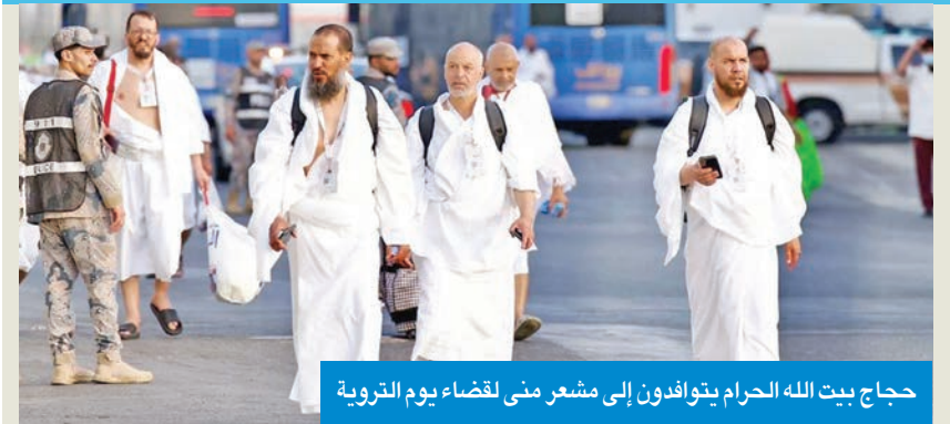
حجاج بيت الله الحرام يتوافدون إلى مشعر منى لقضاء يوم التروية

منى لقضاء يوم التروية، ستذهب صباح اليوم إلى عرفة، مبيناً أن الحملات التي لم تذهب إلى منى توجهت الساعة 11 مساءً أمس إلى عرفة. ودعا إلى التقيد بخطة أداء المناسك وضرورة لبس هوية «نسل»، في التنقلات كافة بين المناسك، معرباً عن أمله أن يتم التفويج هذا العام بكل سهولة ويسر.