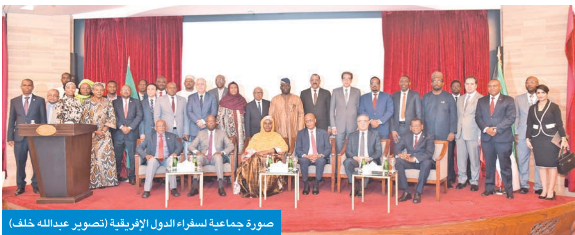
صورة جماعية لسفراء الدول الإفريقية

كان هناك إعفاء للكويتيين من «شغن الإفريقي»، قال بن عيسى إن «الكويتي لا يحتاج إلى تأشيرة لعدد من الدول الإفريقية، في حين لا تزال هناك بعض الدول التي يجب على الكويتي الحصول على تأشيرة لدخولها، وهذا الأمر يتم بكل سهولة، وبالتالي، لا يمكننا أن نتحدث عن صيغة شغن حالياً، لأننا لم نصل إلى هذه المرحلة بعد في القارة، رغم وجود عزيمة وإرادة سياسية من الدول الإفريقية للمضي قدماً، وصولاً إلى اندماج اقتصادي».