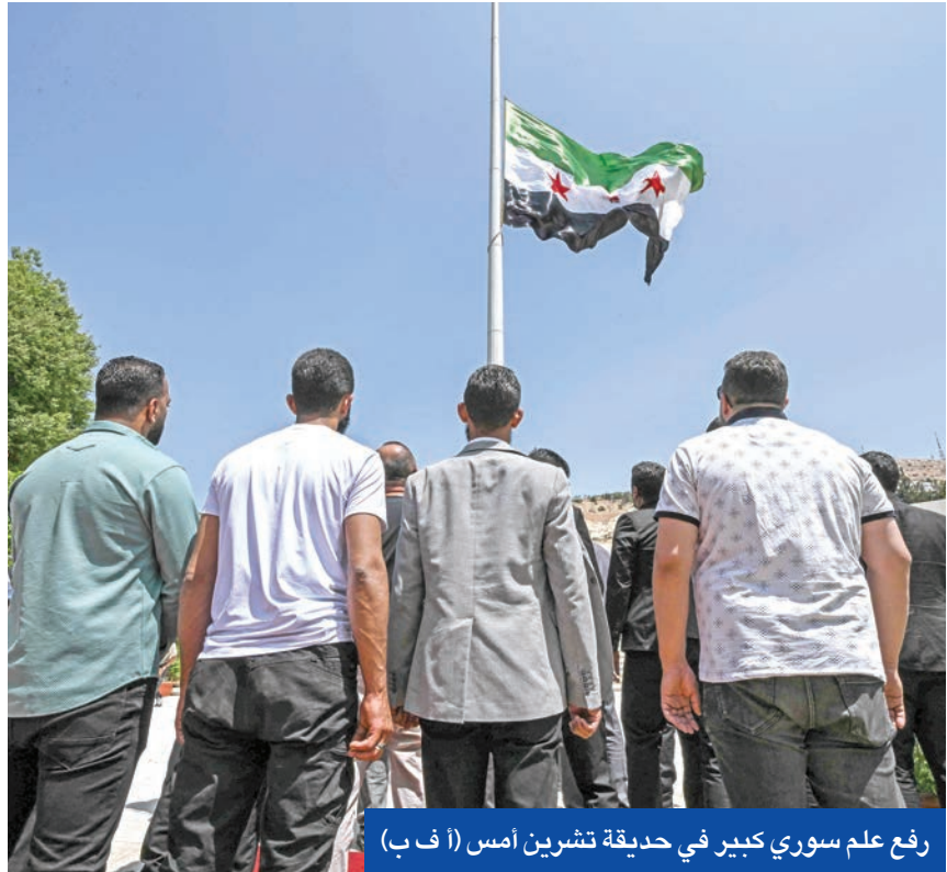
رفع علم سوري كبير في حديقة تشرين أمس

وحمل وزير الدفاع الإسرائيلي بسرائيل كاتس الشرع «المسؤولية المباشرة» عن إطلاق الصاروخين اللذين سقطا في منطقتين مفتوحتين جنوب الجولان، وعن «أي تهديد وإطلاق نار تجاه إسرائيل». واتهمت الخارجية السورية «أطرافاً عديدة بالسعي لزعزعة استقرار المنطقة لتحقيق مصالحها الخاصة»، مؤكدة أن دمشق «لم ولن تشكل تهديداً لأي طرف». واعتبرت الوزارة أن «التصعيد يمثل انتهاكاً صارخاً للسيادة السورية، ويزيد