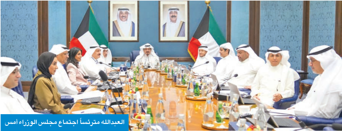
العبدالله مترئسا اجتماع مجلس الوزراء أمس

وافق مجلس الوزراء أمس على مرسوم بتعديل قانون الرسوم القضائية يتضمن إقرار زيادات على تلك الرسوم والنسب التي تفرض على الدعاوى المحددة بالقيمة المطالب بها أو غير المحددة. ونص القانون على تقرير نسبة تقدر بـ 5% إذا كانت قيمة المطالبة حتى 30 ألف دينار، وتفرض نسبة 3.5% إذا كانت الدعاوى المطالب بها تزيد على 30 ألفاً حتى 150 ألفاً، وتكون النسبة 2.5% إذا تراوحت القيمة بين 150 و500 ألف دينار، وتكون النسبة 1.5% إذا تراوحت المطالبة بين 500 ألف وخمسة ملايين، وتكون النسبة 1% إذا زادت المطالبة على خمسة ملايين. وتضمن القانون رفع رسوم الأوامر على العرائض والطلبات من 5 دنانير إلى 10 دنانير، إضافة إلى 50 ديناراً على الدعاوى المستعجلة وإشكالات التنفيذ بدلاً من 3 دنانير. وقيمة رسوم الدعاوى أمام المحاكم بقيمة 100 دينار ومنها دعوى نذب الخير، و150 ديناراً كرسوم لإشكالات التنفيذ. بعدما كانت 30. و100 دينار رسوماً لطلبات رد القاضي والخير والمحكم و500 عن طلب إحالة عقار إلى قاضي البيوع. كما تضمن القانون رفع رسوم الإنذارات لكل طرف بقيمة 5 دنانير. بعدما كانت نصف دينار. وقيمة الطلوع إلى دينار بعدما كانت بنصف فقط. كما نص على أن طلبات التعجيل للدعاوى من الوقف والشطب يستحق معه رسوم قيمتها 5 دنانير.