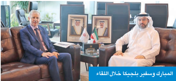
المبارك وسفير بلجيكا خلال اللقاء

على دعم المبادرات التي تساهم في تعزيز الربط الجوي وتسهيل حركة النقل الجوي بين البلدين خصوصاً في مجالي الشحن الجوي ونقل الركاب.