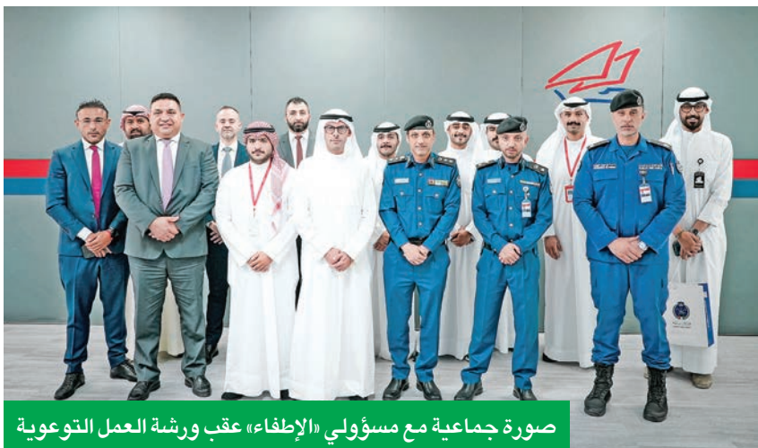
صورة جماعية مع مسؤولي «الإطفاء» عقب ورشة العمل التوعوية

جهود بنك الخليج المستمرة لتعزيز بيئة عمل آمنة وصحية، ورفع مستوى الوعي لدى الموظفين بكيفية التصرف في حالات الطوارئ، بالتعاون مع الجهات الرسمية المعنية. وفي ختام الورشة قدم بنك الخليج درعا تذكارية لمسؤولي قوة الإطفاء العام، تقديراً لدورهم في حماية المجتمع ودورهم البطولي في مواجهة على قدرات الوطن وسلامة المواطنين والمقيمين.