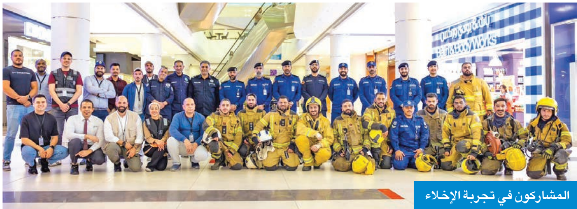
المشاركون في تجربة الإخلاء

وأكد الحرس على بذل الجهود والأنشطة الرامية إلى تعزيز الاستدامة البيئية داخل المجمعات وتعزيز الوعي بالقضايا الصحية وتوفير بيئة أكثر صحة وتحسين خلال الحياة والصحة العامة، من خلال تشجيع السلوكيات الصحية، وتوفير بيئات معززة للصحة، منوها بحصول «البروميناد» على الاعتماد الذهبي لمبادرة المجمعات التجارية المعززة للصحة.