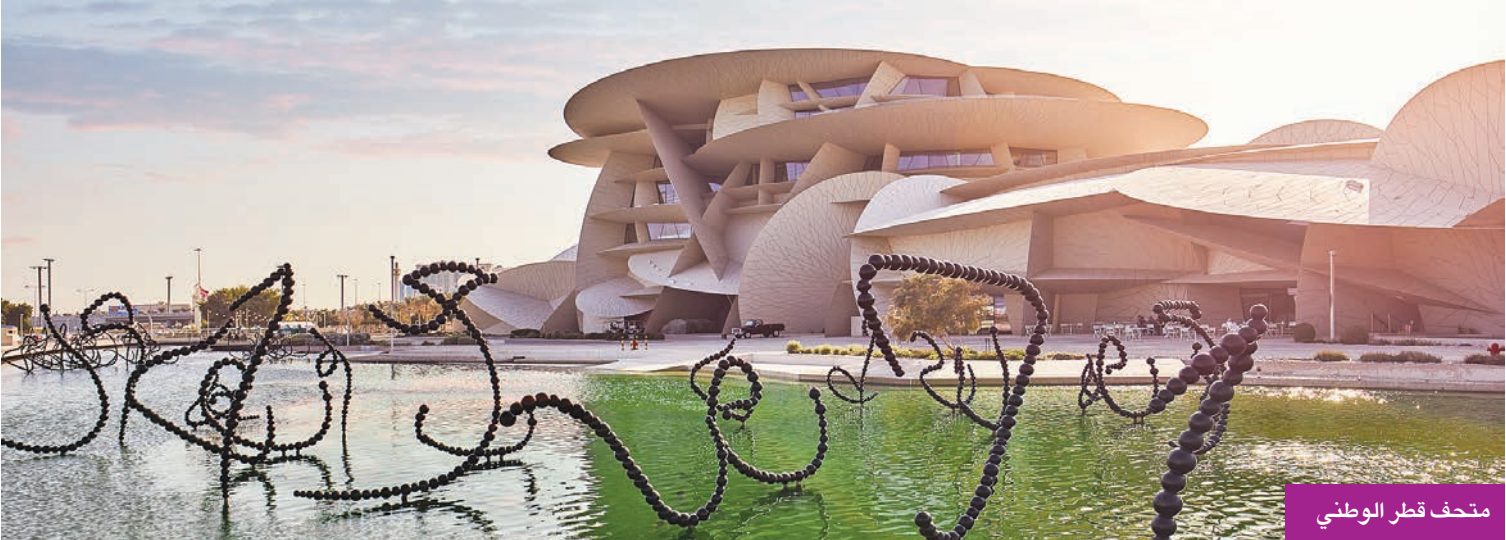
متحف قطر الوطني

وتمثل قطر، التي تحيطها المياه من جوانب ثلاثة، وتحظى بشمس ساطعة على مدار العام، وجهة مثالية لممارسة شتى أنواع الرياضات المائية، وتشجع الشواطئ والمقننزهات المائية والمراسي الصافية الجميع على خوض تجارب جديدة، حيث تتوفر بها أفضل تجارب التزلج بالطائرة الورقية، وذلك في منتجع فويرط الشاطئي على طول بحيرة طبيعية على الساحل الشمالي.