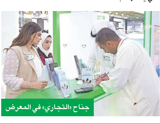
جناح «التجاري» في المعرض

كما حرص البنك خلال المعرض على دعم جهود التوعية المصرفية، من خلال حملة «لنكن على دراية»، عبر تقديم المناصيح والإرشادات حول حماية البيانات المصرفية والتعامل الآمن مع الخدمات البنكية.