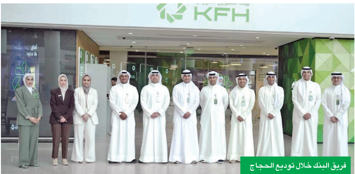
فريق البنك خلال توديع الحجاج

شارك بيت التمويل الكويتي في توديع حجاج بيت الله الحرام عبر مطار الكويت الدولي بالتعاون مع الإدارة العامة للطيران المدني.