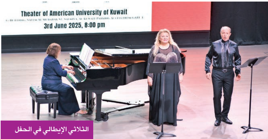
الثلاثي الإيطالي في الحفل