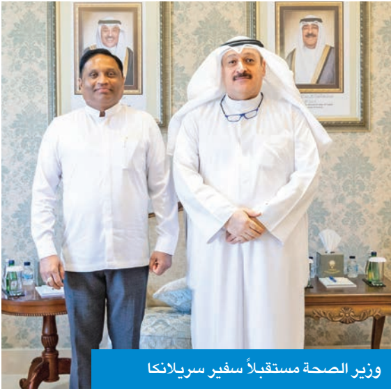
وزير الصحة مستقبلاً سفير سريلانكا

وأضافت أنه تم الإعلان عن قبول عضوية الكويت رسمياً في البرنامج، خلال اجتماع اللجنة الإدارية للبرنامج بمدينة مدريد في إسبانيا، مما يعزز كفاءة وفعالية الرقابة الدوائية والتزام البلاد بدورها كشريك دولي فاعل ومسؤول في تطوير النظم الصحية والدوائية.