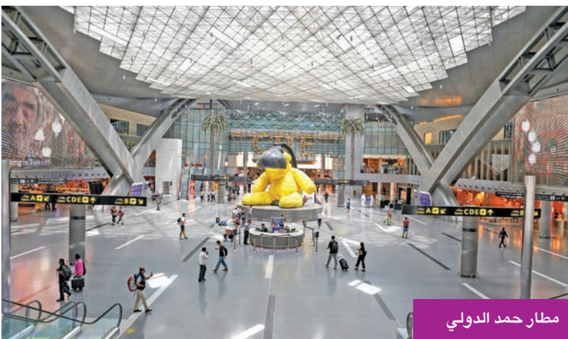
متحف حمد الدولي

الابتكار والتراث، كما تسرد متاحف مشيرب قصة تحول دولة قطر من خلال 4 بيوت تراثية تم ترميمها بعناية. كما يمكن للزوار استكشاف شارع الكهراء وحي الدوحة للتصميم، اللذين يقدمان أحدث الابتكارات في عالم التصميم والإبداع.