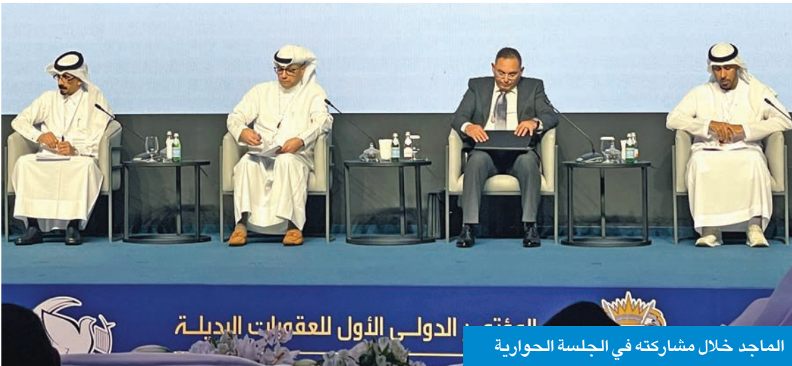
الماجد خلال مشاركته في الجلسة الحوارية

2021 صدرت قواعد العفو الأميري السامي، متضمنة إقرار نظام المراقبة الإلكترونية عن طريق السوار الإلكتروني بعقوبة بديلة لما يحققه هذا النظام من مزايا متعددة، مشيرا إلى أنه تم التوسع في النظام تدريجيا بموجب القواعد اللاحقة للعفو، حيث أصبح يطبق على العقوبات السالبة للحرية التي لا تزيد على ثلاث سنوات للذكور وخمس سنوات للإناث. ولفت إلى أنه تم شمول جرائم إصدار الشيك بدون رصيد والنصب وخيانة الأمانة، على أن يقضي المحكوم عليه نصف مدة العقوبة السالبة للحرية المقضي بها، مبينا أنه صدر قانون الحماية من العنف الأسري متضمنا النص على العقوبة البديلة، حيث أجاز للمحكمة أن تصدر عقوبة بديلة تلزم المعتدي بالقيام بعمل غير مدفوع الأجر لخدمة المجتمع، وقد صدرت اللائحة التنفيذية للقانون عام 2023. كما صدر قانون المرور عام 2025 الذي أجاز أيضا للمحكمة