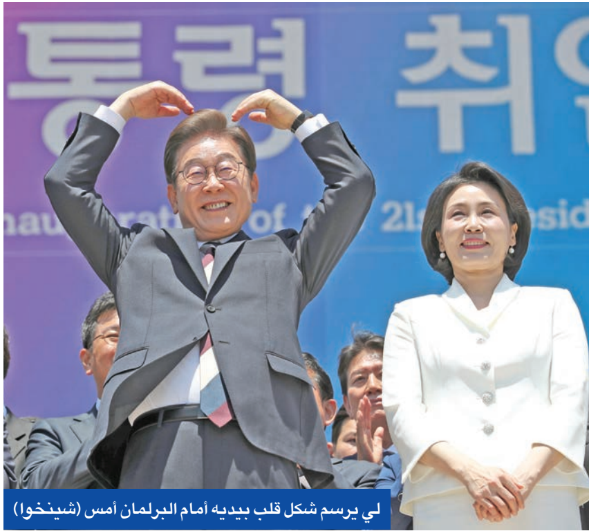
لي يرسم شكل قلب بيديه أمام البرلمان أمس

سنة أشهر، نجمت عن محاولة الرئيس السابق المحافظ يون سوك يول فرض الأحكام العرفية في البلاد. وقبل ستة أشهر فقط، اضطر لي إلى القفز فوق جدار الصين، وإصفا السياسات الحمائية التي يعتمدها الرئيس الأميركي دونالد ترامب بأنها «خطر وجودي» على الدول التي تعتمد على التصدير، مثل كوريا الجنوبية، رابع أكبر اقتصاد في العالم. وفي وقت سابق، أعلنت لجنة الانتخابات في كوريا الجنوبية رسمياً انتخاب لي، الذي ينتمي للحزب الديمقراطي الليبرالي، رئيساً للبلاد بعد فوزه في الانتخابات المبكرة التي أجريت، أمس الأول، في ختام فوضى سياسية استمرت