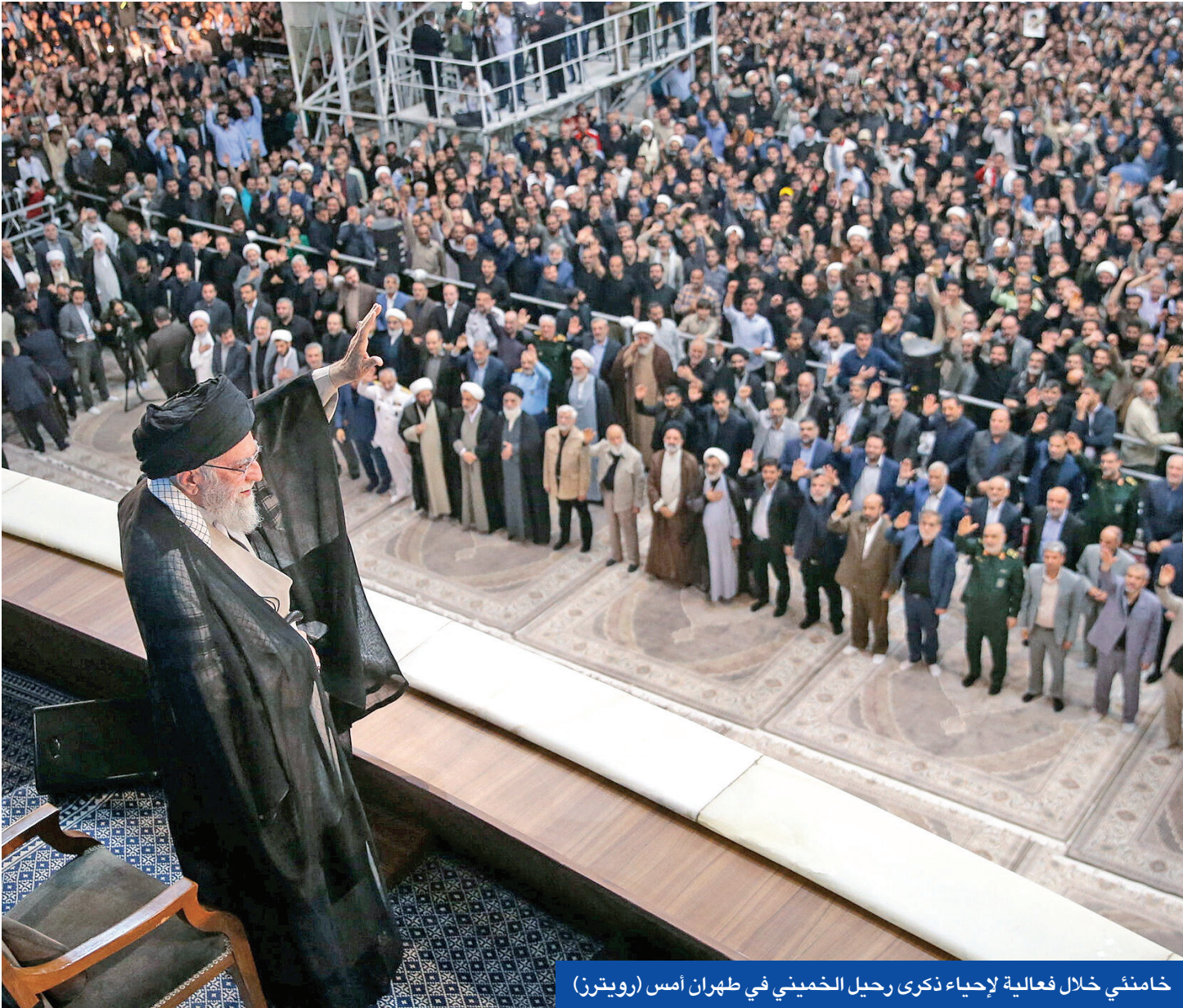
خامنئي خلال فعالية لإحياء ذكرى رحيل الخميني في طهران أمس

نتنياهو هو ضربة استباقية ضد مواقع نووية إيرانية، حتى إذا تم التوصل إلى اتفاق بين واشنطن وطهران. وأعربت «الخارجية» الروسية، أمس، عن قلقها إزاء «تصاعد التوتر بشأن إيران وخطر انزلاق الأوضاع إلى مواجهة شاملة»، مشيرة إلى استعداد موسكو للبحث عن حلول بشأن القضية النووية الإيرانية.