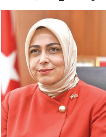
طوبى ثور سونمز

أمينة أردوغان، وقد أصبحت هذه المبادرة حركة وطنية شاملة، غيرت طريقة تعاظمي الأفراد والمؤسسات والصناعات مع إدارة النفايات، وهي تركز على أهمية تقليل النفايات من المصدر، وتشجيع إعادة التدوير، وتعزيز مفهوم الاقتصاد الدائري، وقد لاقَت هذه المبادرة صدى واسعاً خارج حدود تركيا، واعتمدتها الأمم المتحدة كمبادرة عالمية، مما يعكس كيف يمكن للعمل المحلي أن يكون مصدر إلهام عالمياً. ورداً على سؤال عما إذا كانت هناك دعوة محددة تود توجيهها من خلال هذه المبادرة، ذكرت: «نعم، نوجه دعوة حارة إلى جميع المواطنين الأتراك وأصدقاء تركيا المقيمين في الكويت للانضمام إلينا في 7 يوليو المقبل، لدعم هذه المبادرة البيئية المهمة، فكل مساهمة، مهما كانت صغيرة، تلعب دوراً في بناء عالم أكثر استدامة، ومن خلال مشاركتنا لا ندعم المجتمع المحلي فحسب بل نؤكد أيضاً التزامنا المشترك بحماية كوكب الأرض من