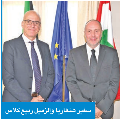
سفير هنغاريا والرئيس ربيع كلاس

وصف سفير هنغاريا لدى البلاد، أندراش سابو، انطلاق أول رحلة مباشرة من الكويت إلى عاصمة بلاده بودابست بأنها «لحظة تاريخية»، مشيراً إلى أن استئناف هذا الخط الجوي يأتي بعد انقطاع 40 عاماً منذ عام 1989. وفي لقاء خاص مع «الجريدة»، قال سابو إن تحقيق هذا الإنجاز جاء بعد «جهود دبلوماسية مكثفة» منذ وصوله إلى البلاد، وأضاف: «تشرفت بأن أكون السفير الذي نجح في إحياء هذا الخط الجوي، بدعم من شركة طيران الجزيرة، وهيئة الترويج السياحي الهنغارية، التي ترى في دول الخليج سوقاً مهماً، وتسعى إلى جذب السياح الكويتيين تحديداً».