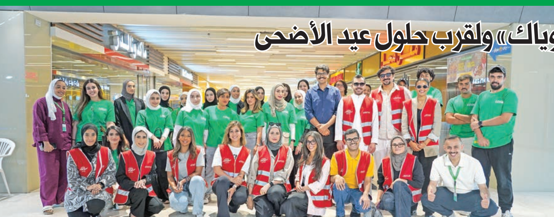
صورة جماعية لفريق سواعد الخليج ولويك وسيتي هايبر ماركات

وذكروا أن البنك يواصل التزامه القوي ببرامج المسؤولية الاجتماعية، على كل المستويات، من خلال إطلاق العديد من المبادرات التي يتم انقائها بعناية لتعود بالنفع على البنك والمجتمع، بما يتوافق مع أهداف الأمم المتحدة للتنمية المستدامة ورؤية الكويت 2035.