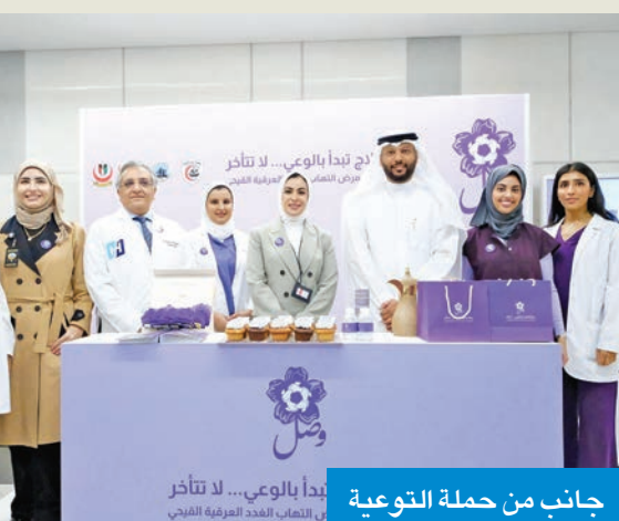
جانب من حملة التوعية

نظمت رابطة أطباء الجلد، التابعة للجمعية الطبية الكويتية، حملة توعية تثقيفية حول مرض التهاب الغدد العرقي القيحي تحت شعار «رحلة العلاج تبدأ بالوعي... لا تتأخر».