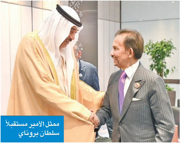
ممثل الأمير مستقبلاً سلطان بروناي

وزير الاستثمار الماليزي: الآفاق الاقتصادية مع «الخليج» واعدة وصف وزير الاستثمار والتجارة والصناعة الماليزي تنكو زفرول عبدالعزیز الآفاق الاقتصادية للتعاون بين بلاده ومجلس التعاون لدول الخليج العربية بأنها «واعدة». وقال عبدالعزیز، في تصريح للصحافيين، عقب التوقيع على بيان إطلاق مفاوضات اتفاقية للتجارة الحرة، إن مجلس التعاون يتمتع باحتياطات طاقة هائلة وقوة استثمارية ضخمة ورغبة متنامية في الدخول في شراكات تكنولوجية متقدمة. وأكد أن هذه هي المرة الأولى التي تتعامل فيها ماليزيا مع مجلس التعاون بوصفه تكتلاً اقتصادياً موحداً، مضيفاً: «نرى في ذلك تطوراً إيجابياً، ففي السابق وقعنا وأتمننا اتفاقية شراكة اقتصادية شاملة مع الإمارات، أما هذه المرة فإننا نتعامل مع الدول الست الأعضاء في مجلس التعاون الخليجي كجتمعة». وأضاف أن الاتفاقية ستساعد ماليزيا على منح شركاتها وصولاً أفضل إلى سوق مجلس التعاون، لافتاً إلى أن المفاوضات ستشمل عدداً من القطاعات الرئيسية من بينها الكهرباء والإلكترونيات وأشباه الموصلات والمنتجات الحلال وزيت النخيل والمواد الكيميائية.