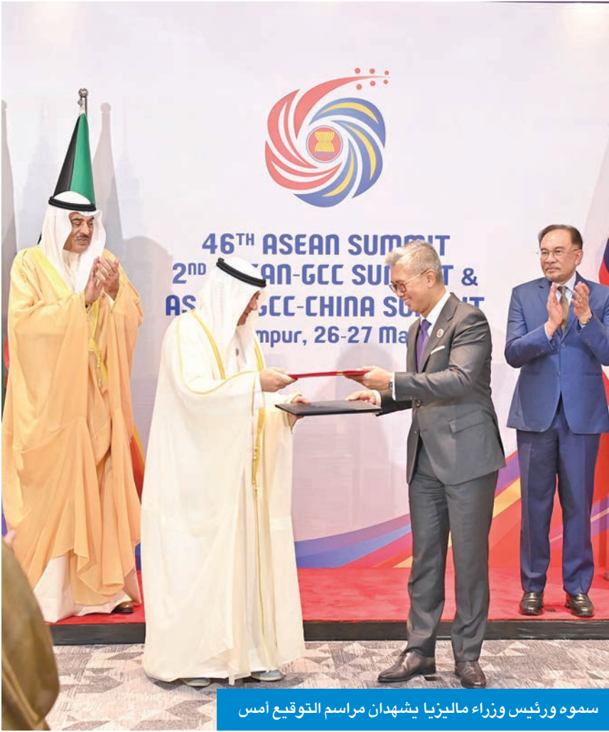
سموه ورئيس وزراء ماليزيا يشهدان مراسم التوقيع امس