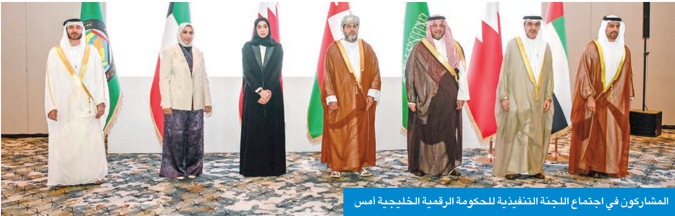
المشاركون في اجتماع اللجنة التنفيذية للحكومة الرقمية الخليجية أمس

خلال اجتماع اللجنة التنفيذية للحكومة الرقمية لدول مجلس التعاون