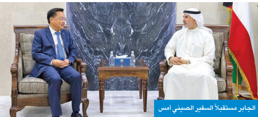
الجابر مستقبلاً السفير الصيني أمس

استقبل نائب وزير الخارجية، السفير الشيخ جراح الجابر، أمس، السفير الصيني تشانغ جيانوي، بمناسبة انتهاء فترة عمله سفيراً لبلاده لدى دولة الكويت.