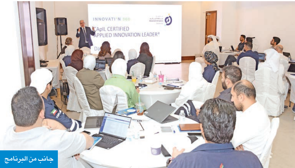
جانب من البرنامج

الضوء على أهمية الثقافة المؤسسية، والابتكار المتوازن، وتأهيل الجيل القادم من القادة المبتكرين، من خلال جلسات تدريبية وورش عمل يقودها خبراء دوليون من مجموعة «Innovation 360» العالمية.