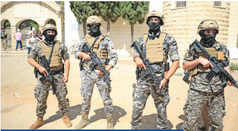
جنود يؤمنون الانتخابات البلدية بالنبطية السبت الماضي

وأضاف بزشكيان الذي يستعد لبدء زيارة إلى مسقط اليوم للقاء السلطان هيثم بن طارق: «ليس لنا وكنا سنموت جوعاً إذا رفضوا التفاوض معنا أو فرضوا علينا عقوبات، سنجد طريقة للحياة». ورداً على سؤال بشأن قبول «المقترح الوسطي»، الذي نصل على تصعيد التخصيب لمدة 3 سنوات مقابل رفع جزئي للعقوبات، قال الناطق باسم «الخارجية» إسمايل بقائي: «هذه المعلومة من نسج الخيال، وهي عارية تماماً عن الصحة». واتهم إسرائيل بأنها وراء «كل الشائعات المزيفة» لتخريب المفاوضات مع واشنطن. وشدد بقائي على أن إيران لا تضيع الوقت، بل تسعى بحدية إلى التوصل إلى اتفاق «عادل ومنصف وواقعي» يحفظ حقوقها