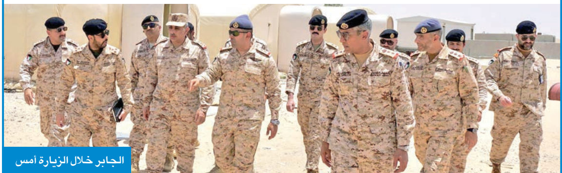
الجابر خلال الزيارة أمس

الأفراد والمعدات لمواجهة مختلف التحديات الميدانية.