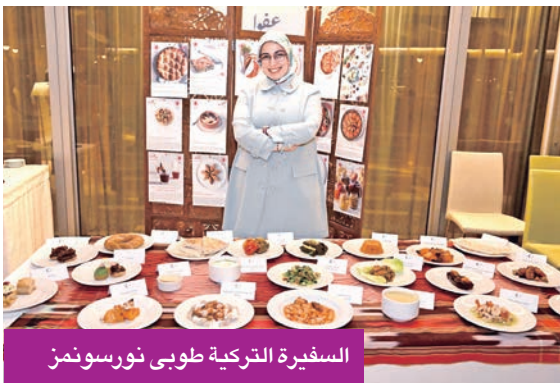
السفيرة التركية طوبى نورسونمن

وفي كلمتها الافتتاحية، أكدت السفيرة التركية طوبى نور سونمن المكانة الفريدة التي يحتلها المطبخ التركي بين المطابخ العالمية، مشيرة إلى تاريخه العريق، واهتمامه بالصحة، وخصائصه المستدامة،