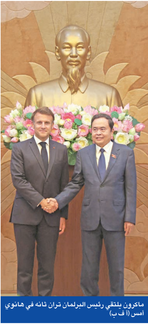
ماكرون يلتقي رئيس البرلمان تران ثانه في هانوي (مس أ ف ب)

ترامب بنسبة 46 في المئة قبل تعليقها. وتمثل الولايات المتحدة نحو ثلث صادرات فيتنام. وأصبحت «استراتيجية منطقة المحيطين الهندي والهادئ» التي أعلنها ماكرون عام 2018 والتي روج لها خلال زيارته للهند والمحيطين الهندي والهندي، أصبحت أكثر أهمية الآن بحسب باريس، منذ عودة ترامب إلى البيت الأبيض وتهديداته التجارية. ويتعين على ماكرون توجيه رسالة غير مباشرة للجميع أن على ترامب أن يدافع عن «قواعد التجارة الدولية» بدلاً من «قانون الغاب»، بحسب أحد مستشاريه. كما دعا قبل بدء جولته، نظيره الصيني شي جينبينغ إلى ضمان «ظروف تنافسية عادلة»، مؤكداً أن فرنسا شريك «موثوق» يحترم «سيادة» دول المنطقة. وبالنسبة إلى الرئيس الروسي فلاديمير بوتين، أكد ماكرون أنه بات «بزعزع استقرار آسيا» وليس أوروبا فحسب، خصوصاً بعد انضمام كوريا الشمالية إليه في حربه ضد أوكرانيا. وفي فيتنام قد تجد استراتيجية «توازن القوى» صدق، فالدولة الآسيوية حريصة على تحقيق التوازن في علاقاتها مع الصين والولايات المتحدة، من أجل رعاية مصالحها التجارية قدر المستطاع، بما يتماشى مع سياستها السمتاة «دبلوماسية الخيزران».