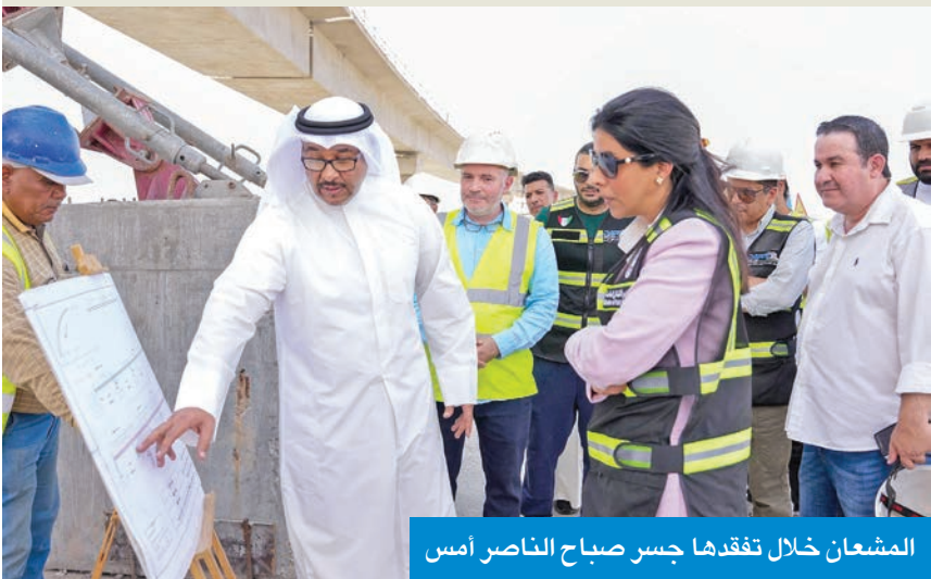
المشعان خلال تفقدها جسر صباح الناصر أمس

تفقدت جسر صباح الناصر وأكدت أهميته في تخفيف الازدحام