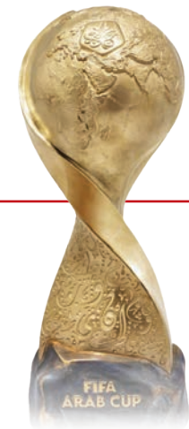
قرعة مجموعات كأس العرب 2025

وكانت مراسم قرعة كأس العرب قد أجريت في العاصمة القطرية الدوحة،