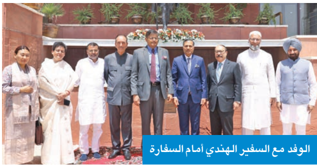
الوفد مع السفير الهندي أمام السفارة

إضافة إلى لقاءات مع شخصيات بارزة في المجتمع المدني، ومراكز الفكر، والمؤثرين، وممثلي وسائل الإعلام، كما سيتفاعل أعضاء الوفد مع شرائح مختلفة من أبناء الجالية الهندية المقيمة في الكويت. وأكد البيان أن هذه الزيارة تمثل خطوة مهمة نحو تعميق التفاهم المشترك بين الهند والكويت، وترسيخ أواصر الشراكة في المجالات السياسية والاجتماعية والثقافية، فضلاً عن تعزيز القيم المشتركة في مواجهة التحديات الإقليمية والدولية الراهنة.