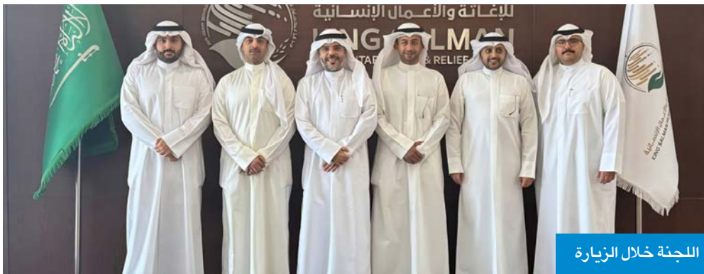
اللجنة خلال الزيارة