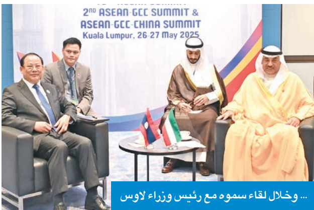
... وخلال لقاء سموه مع رئيس وزراء لاوس

وقال البديوي إن التوقيع على البيان المشترك وإطلاق مفاوضات تجارة حرة مع ماليزيا يأتي تنفيذاً لتوجيهات قادة دول المجلس بتعزيز علاقات دول المجلس مع شركائها الدوليين، وإن إطلاق مفاوضات اتفاقية التجارة الحرة مع ماليزيا يمثل خطوة استراتيجية في هذا السياق من جانب، وترسيخ الشراكة