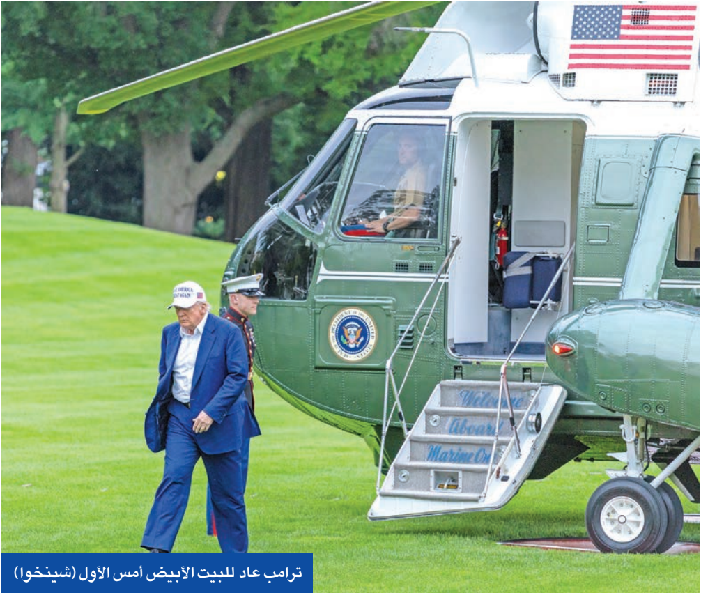
ترامب عاد للبيت الأبيض أمس الأول

وانتشر عناصر الشرطة الإسرائيلية في أنحاء القدس الشرقية المحتلة وجول أسوار البلدة القديمة، استعداداً لمسيرة «الأعلام» التي يتصدهرها القوميون المتطرفون، وسط تحذيرات من وقوع اشتباكات داخل الأحياء العربية التي تمر بها. وذكر بن غفير أن الصلاة اليهودية في أماكن عامة، بما في ذلك المسجد الأقصى، ممنوعة. وأضاف أن قوات الأمن ستقوم بحملات أمنية واسعة النطاق في جميع أنحاء القدس الشرقية.