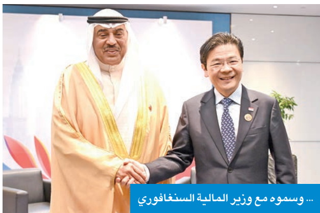
... وسموه مع وزير المالية السنغافوري

إطلاق المفاوضات خطوة استراتيجية لترسيخ الشراكة بين الجانبين