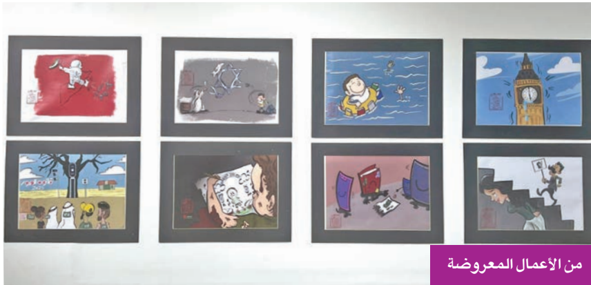
من الأعمال المعروضة