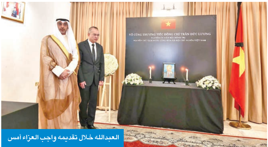
البدالله خلال تقديمه واجب العزاء أمس

عزاء في وفاة لونغ حيث قدم عدد كبير من سفراء الدول تعازيهم. وعبر السفير الفيتنامي نغيون دوك ثانغ في كلمته التي دونها بسجل العزاء عن احترامه وتقديره الكبيرين للرئيس الراحل، مشيداً بإسهاماته الجليلة في مسيرة تجديد بلاده، لا سيما في توسيع العلاقات الخارجية وتعزيز الاندماج الدولي لفيتنام.