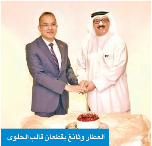
العطار وناثغ يقطعان قالب الحلوى

المصانع والشركات المرتبطة بتطبيق رسوم مكافحة الإغراق، مع تأكيده سعي الوزارة لتذليل العقبات أمامهم لضمان تلبية احتياجات السوق الحالية والمستقبلية.