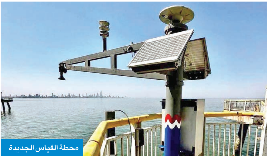
محطة القياس الجديدة

توجه لتوسيع شبكة الرصد الساحلي لتشمل عدة مواقع إضافية»