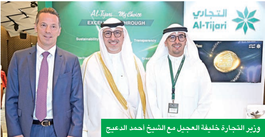
وزير التجارة خليفة العجيل مع الشيخ أحمد الديعج

خلال مشاركته في مؤتمر «استراتيجية الكويت الاقتصادية الجديدة 2025»