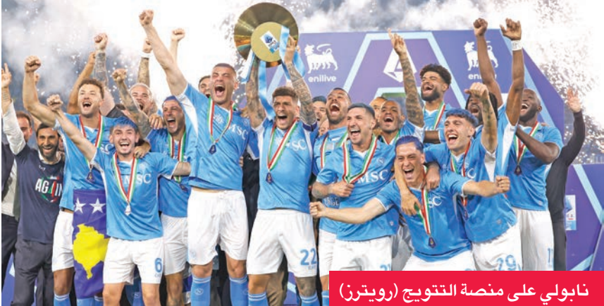
نابولي على منصة التتويج

وكانت المرة الأولى التي فاز فيها دي لورينتسو باللقب عندما توج نابولي بالدوري لأول مرة منذ 33 عاماً وتحديداً منذ فوز مارادونا به للمرة الأخيرة. وكان الظهير الإيطالي حاسماً هذا الموسم وسجل ثلاثة أهداف وصنع اثنين، وشارك في جميع المباريات باستثناء مواجهة واحدة للإيقاف.