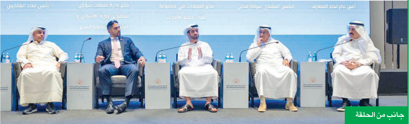
جانب من الحلقة

الاتحاد شارك قيادات عقارية ومصرفية بحلقة نقاشية حول الشراكة