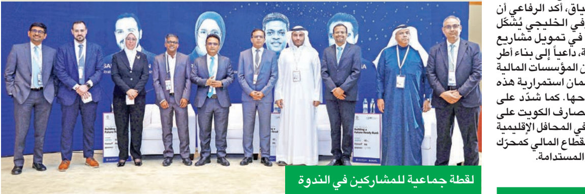
لقطة جماعية للمشاركين في الندوة

مرونة واضحة تضمن تحقيق التوازن وتحفز بيئة استثمارية مستقرة. وقد أجمع المشاركون على أهمية تعزيز التنسيق المؤسسي وتكامل الأدوار بين القطاعين، بما يدفع عجلة التنمية المستدامة ويعزز من جودة الحياة في دول الخليج. وفي هذا السياق، أكد الرفاعي أن القطاع المصرفي الخليجي يشكّل ركيزة أساسية في تمويل مشاريع الشراكة التنموية، داعياً إلى بناء أطر تعاون متينة بين المؤسسات المالية والحكومية، لضمان استمرارية هذه الشراكات ونجاحها. كما شدد على حرص اتحاد مصارف الكويت على الحضور الفاعل في المحافل الإقليمية التي تُعزّز دور القطاع المالي كمحرك رئيسي للتنمية المستدامة.