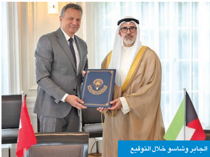
الجابر وشاسو خلال التوقيع

المعرفة للاستفادة من تجارب وموارد وخبرات كل طرف، وقد تشمل المجالات المحتملة ذات الاهتمام المشترك معلومات عن العمليات وبرامج المساعدة التقنية المتعلقة بالقضاء على الفقر، وتعزيز التنمية الاجتماعية