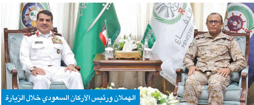
الهملان ورئيس الأركان السعودي خلال الزيارة

وتسري هذه المذكرة لفترة 5 سنوات قابلة للتجديد، ومن المؤمل أن ينصب تعاون الأطراف على عدد من الأنشطة