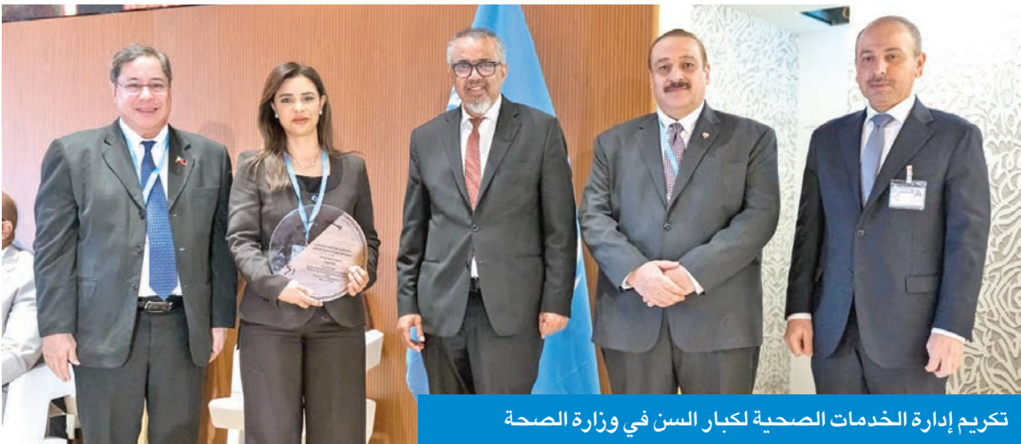
تكريم إدارة الخدمات الصحية لكبار السن في وزارة الصحة

بالمسؤولية الطبية كعنصر أساسي في تحسين جودة الرعاية وسلامة المرضى، مشيدة بتجربة الكويت في هذا المجال. وأكدت بلخي أن تجربة الكويت «مثال متقدم» على مستوى المنطقة في تأسيس نظام مسؤولية طبية متكامل وشفاف يستحق التقدير والتعميم. في السياق، قال الخبير في منظمة الصحة العالمية جيل كامبل خلال الفعالية، إن «هذه التجربة الرائدة يجب توسيع نطاقها لتشمل بلدان الجوار ولتكون نواة لتعاون إقليمي يعزز مبادئ الجودة والمسؤولية في تقديم الرعاية الصحية».