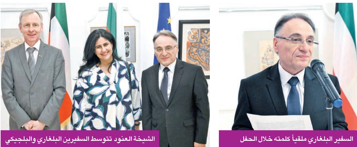
السفير البلغاري ملقياً كلمته خلال الحفل