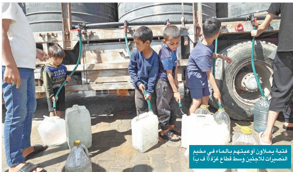
فتية يملأون أوعيتهن بالماء في مخيم النصيرات للاجئين وسط قطاع غزة