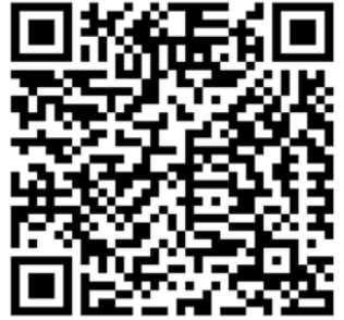
بيان إخلاء المسؤولية

لا يقتصر تحديد المخاطر على كونه مجرد مطلب رقابي، بل يعتبر عنصراً أساسياً في إدارة الثروات الشخصية بفعالية. فمن خلال تجاوز المقاييس السطحية والتعمق في فهم كيفية مرور العملاء بتجاربهم واستجاباتهم للمخاطر، يمكن لمستشار الاستثمار تصميم محافظ استثمارية يلتزم بها العملاء طوال دورات السوق المتقلبة. ويتيح الفهم المفصل لمستوى تحمل المخاطر، المرتبط بالأبعاد المالية والعاطفية والسلوكية، تقديم مشورة مستدامة وصحيحة تلبي احتياجات العملاء بشكل دائم.