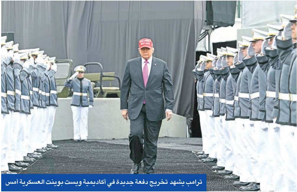
ترامب يشهد تخريج دفعة جديدة في أكاديمية ويست بوينت العسكرية أمس

إلى مقترح بلده حول إنشاء هيئة إقليمية مشتركة لتخصيب اليورانيوم بمشاركة دول المنطقة، رغم سحب إحدى الدول قبولها المشاركة في هذا المشروع. ونصح المسؤول الإيراني المبعوث الأمريكي بالبحث عن صيغة سياسية لحل الموضوع وتفادي إدخال المنطقة في كارثة لا تحمد عقباها، لأنه في حال مواجهة بلده لقضية وجودية، فإنها ستعمل على قاعدة «على وعلى أعدائي». ولفت المصدر إلى أن ويتكوف قرر مغادرة الاجتماع قبل أنهاء مدته المقررة بنحو 20 دقيقة، وطلب من مساعديه بحث سبل التوصل إلى صيغة توافقية، فيما عرضت الوساطة المعانة تدوين صيغة تفاهم وسطية بشأن قضية التخصيب من أجل إيجاد مخرج يبعد المنطقة عن حافة المواجهة العسكرية المدمرة.