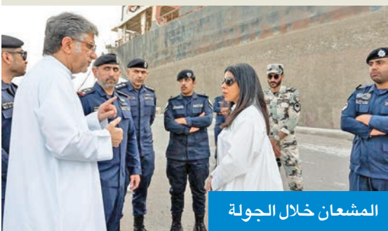
المشعان خلال الجولة

المشعان تفقدت ميناء الشعبية وتحديات العمل