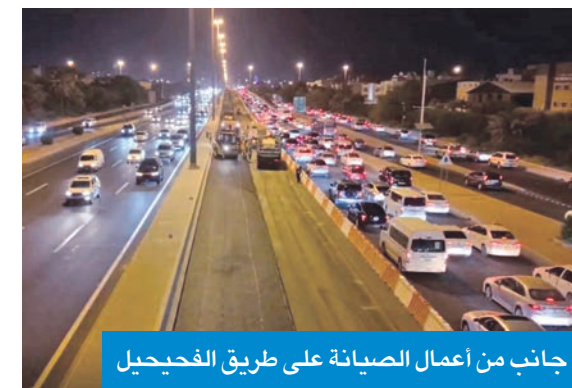
جانب من أعمال الصيانة على طريق الفحيحيل

أعلن الوزير العوضي، أمس الأول، أن فوز الكويت بـ «جائزة صباح الأحمد العالمية لتعزيز صحة كبار السن» يؤكد مكانتها الصحية والتزامها بالنهج الإنساني النبيل. جاء ذلك في كلمة القاها الوزير العوضي خلال قيامه بتسليم الجائزة ضمن فعاليات الدورة الـ 78 لجمعية الصحة العالمية التي انعقدت في