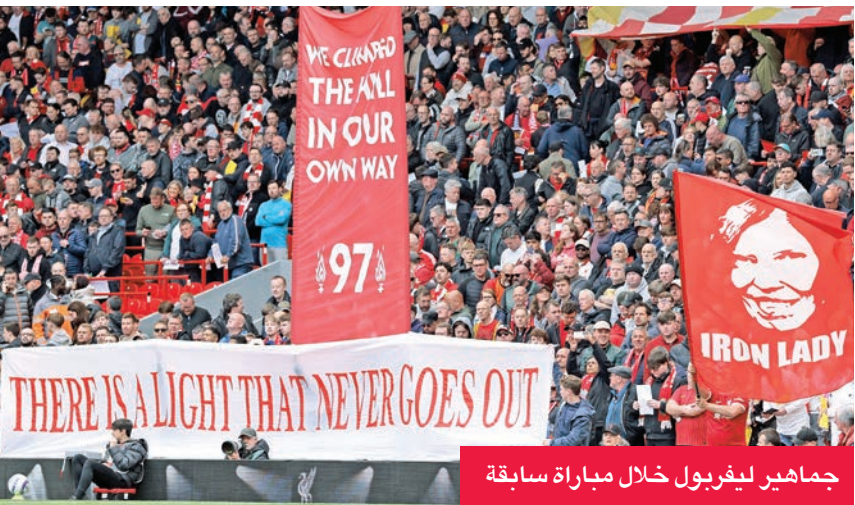
جماهير ليفربول خلال مباراة سابقة

بعد أربع سنوات من هيمنة مانشستر سيتي على اللقب، سيحظى لاعبو ليفربول بفرضة الاحتفال بالتتويج أمام جماهيرهم، ضد حامل لقب الكأس كريستال بالاس، اليوم، في الجولة الأخيرة من الدوري الإنجليزي لكرة القدم. وأحرز ليفربول عام 2020 لقبه الأول في الدوري خلال ثلاثين سنة، لكنه اضطر إلى الاحتفال وراء أبواب موصدة بسبب قيود جائحة كوفيد. ويتوقع أن يكون الاحتفال كبيراً لفريق النجم المصري محمد صلاح، الذي ضمن اللقب الشهر الماضي بفوز كبير على توتنهام 1-5. وترتكز الأنظار حول كيفية تعامل جماهير الفريق مع الظهير ترنت الكسندر-أرنولد، الذي يبدو في طريقة للانتقال إلى ريال مدريد الإسباني، وأغضبهم جراء هذه الخطوة التي أعلنها مطلع الشهر. وتعرض اللاعب الدولي للصفارات خلال الأسبوع الماضي أمام أرسنال 2-2، ولم يلعب في الخسارة التالية ضد برايتون 3-2. وقال سلوت مدرب ليفربول: «منذ 35 سنة والناس تنتظر هذه اللحظة».