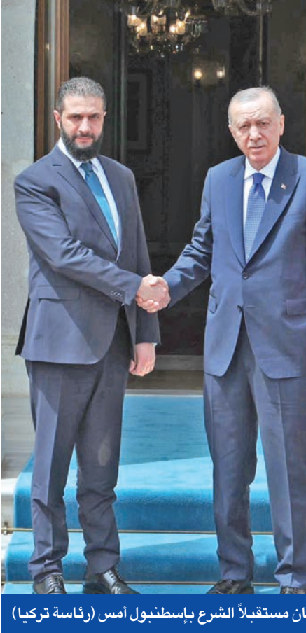
أردوغان مستقبلاً الشرع بإسطنبول أمس

وجاء التقرير الذي يسلط الضوء على الانتهاكات المتعاطلة للاحتلال في وقت تتصاعد نيران الحرب بموازاة ارتفاع وتيرة الانتقادات الداخلية التي تواجه رئيس الوزراء الإسرائيلي بنيامين نتنياهو الذي يجد نفسه محاصراً على جبهتين: خارجية تندر بمزيد من العزلة الدولية، وداخلية تتجه نحو صدام قد لا يكون قابلاً للاحتواء. وأمس، اتهم وزير الخارجية الفرنسي جان