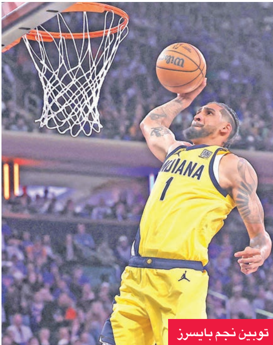
تويين نجم بايسرز

على ملعب ماديسون سكوير غاردن في نيويورك، سيطر نيكس، الذي كان يخوض أول نهائي له منذ 25 عاماً، على المباراة، ووسّع الفارق إلى 14 نقطة قبل النهاية بنحو 3 دقائق، لكن إنديانا ضرب بقوة بتسجيله 6 رميات ثلاثية بينها 5 لأرون نيسميت، علماً أنه سجل 20 نقطة من أصل 30 في المباراة بالربع الأخير. وشبّه انصار إنديانا