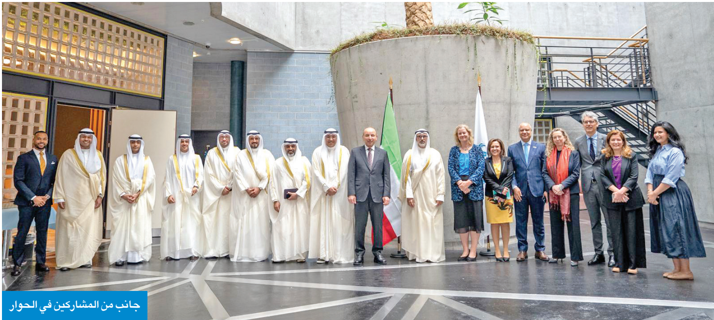
جانب من المشاركين في الحوار

دور مهم للكويت في دعم جهود الاستجابة لتحديات النزوح القسري كليمنتس