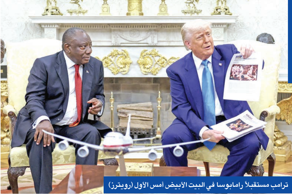
ترامب مستقبلاً رامابوسا في البيت الأبيض أمس الأول

وأظهر الموقف مجدداً استعداد ترامب الواضح لاستخدام المكتب البيضاوي، الذي كان تاريخياً