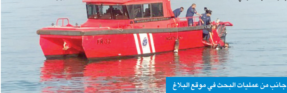
جانب من عمليات البحث في موقع البلاغ

واشتملت المحاضرة على شرح نظري لكيفية الإخلاء في حالات الطوارئ، وطريقة استخدام مطفاة الحريق، وأهمية كاشف الدخان، والحمل الزائد والتماس الكهربائي، وتسرب الغاز، وكيفية استخدام بطانية الحريق.