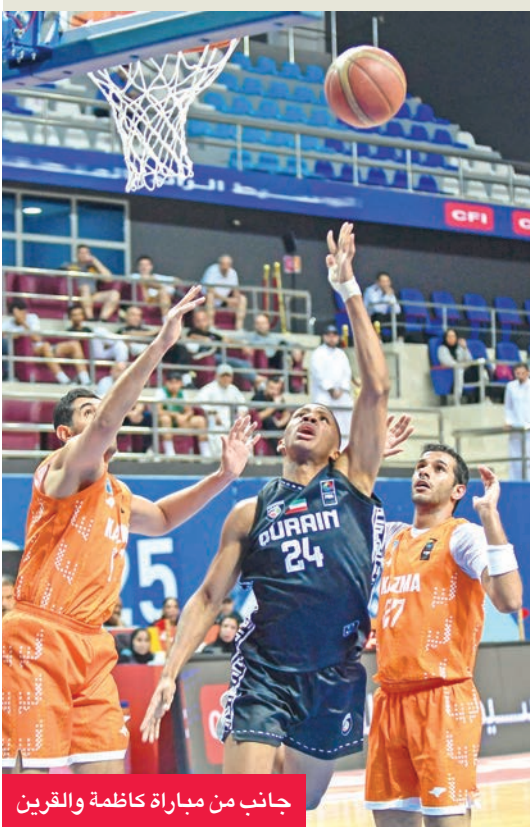
جانب من مباراة كاظمة والقرين