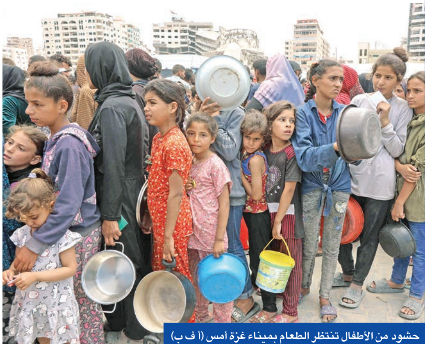
حشود من الأطفال تنتظر الطعام بميناء غزة أمس

الاحتلال يوسع عملياته في 14 منطقة... والجوع يقضي على 29 فلسطينياً في ساعات