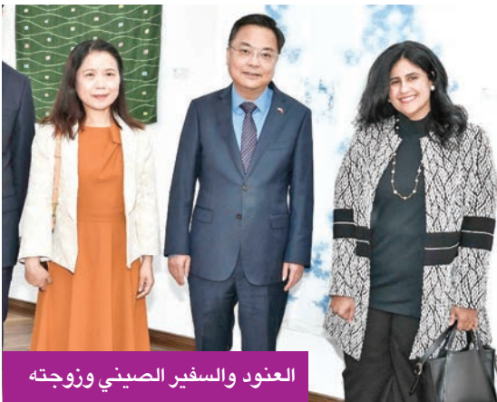
العنود والسفير الصيني وزوجته

أكد السفير الصيني لدى البلاد تشانغ جيانوي أن الثقافة تفتح الأبواب بين الشعوب، وأن التبادل الإنساني بين الصين والكويت شهد تطوراً لافتاً من خلال المركز الثقافي الصيني في الكويت، الذي أصبح منصة رئيسية لتعزيز التفاهم والتواصل الحضاري بين البلدين، حيث إنه أول مركز من نوعه في منطقة الخليج، وقد أصبح نافذة حيوية لتعلم اللغة الصينية والتعرف على الثقافة الصينية التقليدية والمعاصرة. وخلال حفل افتتاح فعالية «تجربة التراث الصيني غير المادي»، يعنوان الشاي مدعاة للوئام - الصبح باللون النيلي وفن تحضير الشاي»، في المركز الثقافي الصيني، قال تشانغ إن «التبادلات الثقافية من شأنها تعزيز العلاقات الحقيقية، والتعلم المتبادل يصنع الأصدقاء». ثقافتنا، الصينية والكويتية، تلتهجان في تقدير التقاليد والسعي لحياة جميلة».