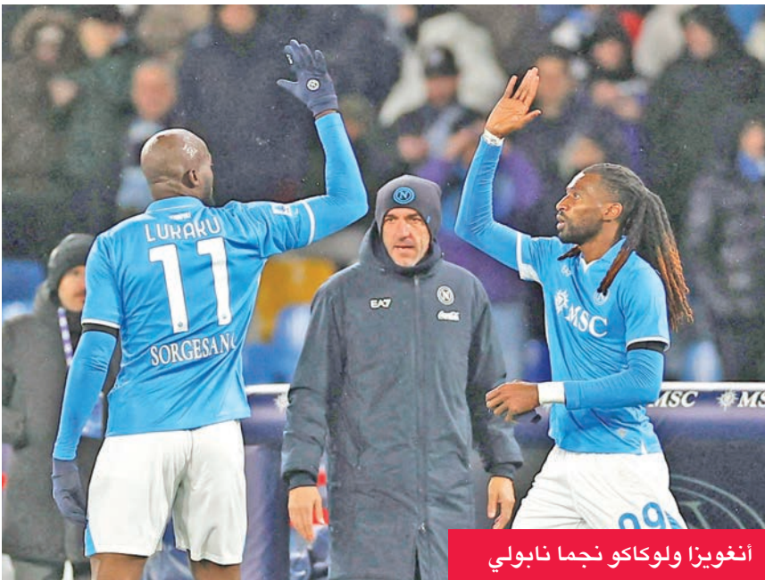
انغويزا ولوكاكو نجما نابولي

وبرمجت رابطة الدوري مباراتي نابولي وإنتر الجمعة بدلاً من الأحد، لمنح الأخير الوقت الكافي للاستعداد للمباراة النهائية لمسابقة دوري أبطال أوروبا بمواجهة باريس سان جرمان الفرنسي في 31 الجاري، علماً بأنه في حال تساوى الفريقان في النقاط، بخسارة نابولي وتعادل إنتر، فسيتم حسم اللقب عبر مباراة فاصلة، الاثنين. ومن أجل إقامة المباراة الفاصلة الحاسمة، يجب أن يخسر نابولي، الذي يملك مصيره بينه، الجمعة، وهو أمر غير مرجح ضد كالياري صاحب المركز الرابع عشر، الذي لم يعد لديه أي شيء يخسره، بعدما ضمن البقاء بين أندية الخبة، وأن يتعادل إنتر أمام كومو.