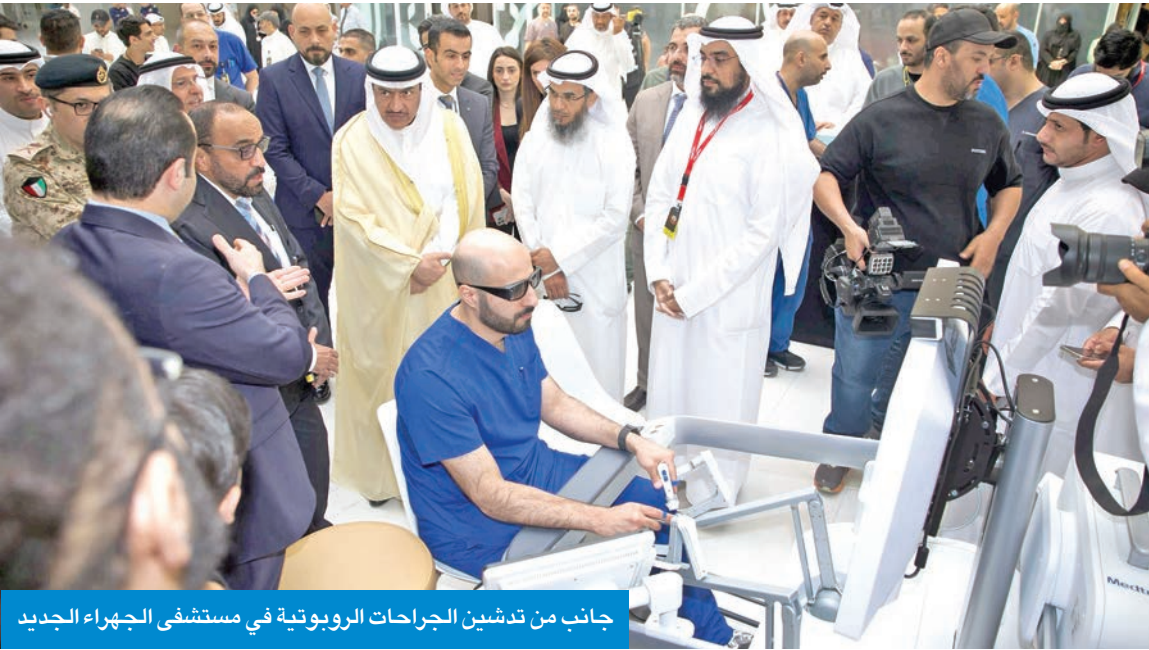
جانب من تدشين الجراحات الروبوتية في مستشفى الجهراء الجديد

دشنت وزارة الصحة، أمس، تقنية الجراحات الروبوتية المتطورة ضمن قسم الجراحة في مستشفى الجهراء الجديد باستخدام أحدث الأنظمة العالمية بهذا المجال، في إطار السعي لتعزيز جودة الرعاية الصحية، والارتقاء بالخدمات الطبية في مختلف مناطق البلاد.