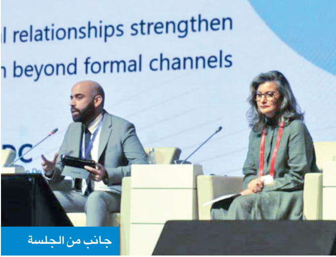
جانب من الجلسة

الثلاثاء وتستمر إلى اليوم الجمعة، بوفد برأسه نائب رئيس الهيئة المستشار نواف المهمل، إلى جانب ممثل عن وزارة الخارجية الوزير المفوض مهدي العجمي، وعدد من خبراء إدارة التعاون الدولي في «نزاهة». وخلال المشاركة جددت «نزاهة» التأكيد على التزام الكويت بتعزيز التعاون الدولي في مكافحة الفساد، لاسيما في مواجهة الجرائم العابرة للحدود في إطار سياساتها القائمة على الشفافية والمساءلة كمبادئ أساسية في العمل المؤسسي.