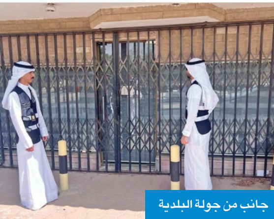
جانب من جولة البلدية

أعلنت إدارة العلاقات العامة في بلدية الكويت التزام أصحاب اللجان الخيرية بالمناطق السكنية بالإزالة في محافظة مبارك الكبير.