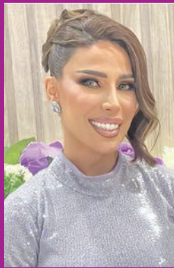
منال الجار الله

بدأت الفنانة منال الجارالله رحلة العلاج للشفاء من السرطان، حيث أعلنت قبل أيام تأكيد إصابتها بالمرض، لتبدأ على الفور الخضوع للعلاج بالطب النووي في مستشفى جابر الأحمد. وحرصت الجارالله على مشاركة جمهورها خطوات العلاج لحظة بلحظة، حيث نشرت عبر حسابها في «انستغرام»، أمس، أنها تخضع للعلاج حالياً، وللأيوم الثاني على التوالي، للتعامل السريع مع المرض والسيطرة عليه في مرحلة مبكرة. وتفاعل الجمهور وزملاء الجارالله بالوسط الفني مع خبر إصابتها، وجاءت مئات التعليقات التي تساندتها وتدعو لها بالشفاء العاجل، وفي