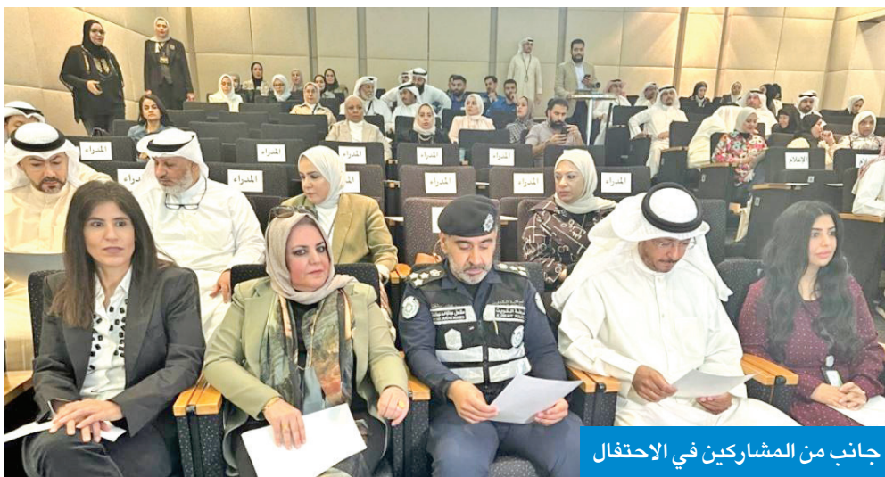
جانب من المشاركين في الاحتفال

الوعي المجتمعي بأهمية التنوع البيولوجي، وتحديث الاستراتيجيات الوطنية للتنوع البيولوجي وتشجيع المبادرات التوعوية التي تهتم بحماية البيئة، بما يساهم في الحفاظ على مواردها الطبيعية وضمان استدامتها للأجيال القادمة».