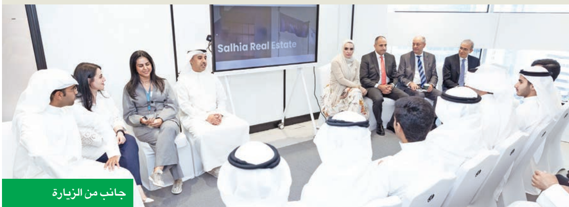
جانب من الزيارة

خطوة إيجابية نحو تنمية المهارات العملية لدى الطلبة وتشجيعهم على الانخراط في مجالات الاستثمار العقاري الواعد بدولة الكويت.