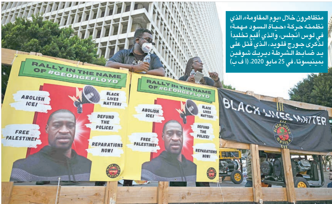
متظاهرون خلال «يوم المقاومة»، الذي نظّمته حركة «حياة السود مهمة» في لوس أنجلِس، والذي أقيم تخليداً لذكرى جورج فلويد، الذي قتل على يد ضابط شرطة دبيريك شومين بمينيسوتا، في 25 مايو 2020.

إن من بديع خلق الله، تزاحم هذه العوالم في أصغر كوكب، جمع عالم البحار والأنهار، والسماء وما فيها من غيوم ورباح وأمطار، والأرض بطققاتها وصخورها وجبالها، وعالم النبات والمعادن، وعالم الطيور والأسماك والوحوش والأنعام، وعالم الزواحف والدواب والحشرات، حتى البعوضة فما فوقها. « وما مِنْ دَآبَّةٍ فِي الْأَرْضِ وَلاَ طَائِرٍ يَطِيرُ بِجَنَاحَيْهِ إِلاَّ أَمَمٌ أَتَمُّ لَكُمُوعاً، وما زال الإنسان يتطور ويتعلم ويكتشف أسراراً جديدة في هذه الدنيا، ويكتشف عالم البكتيريا والفطريات، وعالم البروتونات والنيوترونات والذرة، إلى جانب عالم متشعب من الخلابا بانواعها يعيش داخلنا.