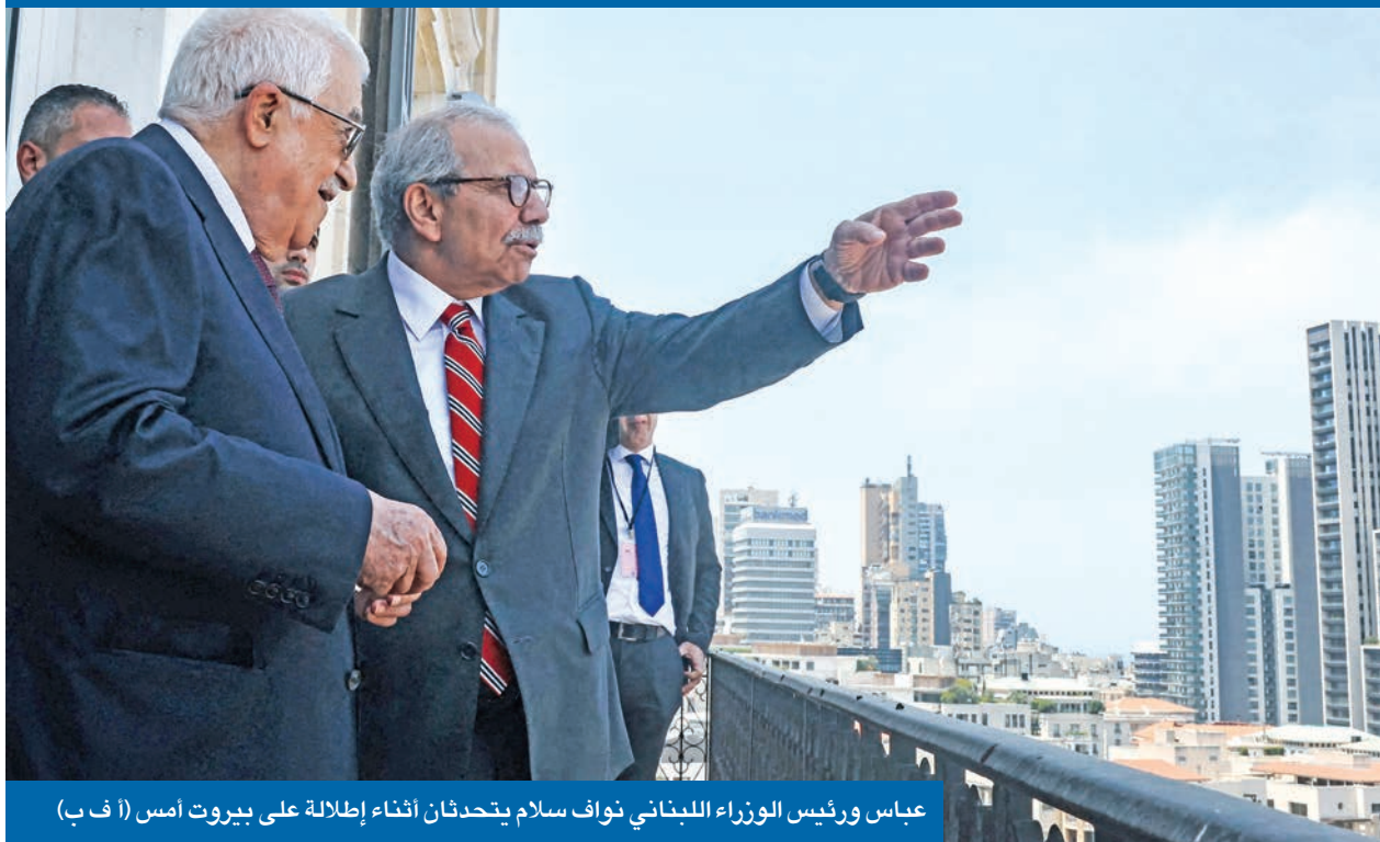
عباس ورئيس الوزراء اللبناني نواف سلام يتحدثان أثناء إطلالة على بيروت أمس