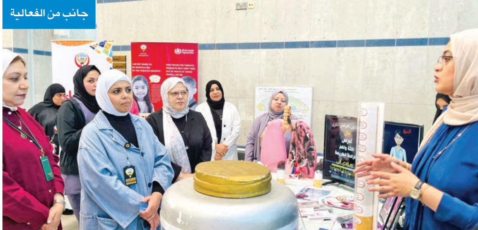
جانب من الفعالية

وأوضح الغملاس أن الورشة تهدف إلى عرض التغيرات والإضافات الجديدة على اللائحة التنظيمية للكشف الطبي على الوافدين القادمين إلى دول مجلس التعاون بغرض العمل أو الإقامة، بما يواكب المستجدات الصحية الإقليمية والدولية. وذكر أنها تتضمن كذلك تدريب أعضاء اللجان الفنية