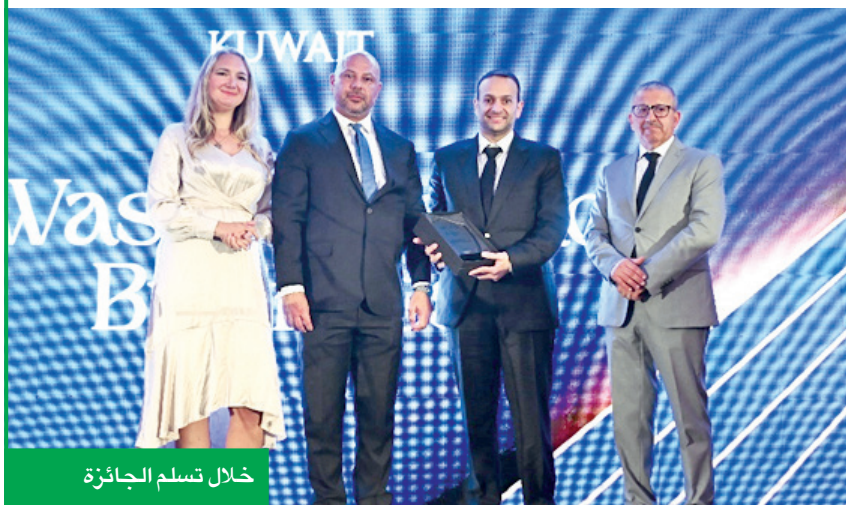
خلال تسلم الجائزة

وجميع الزملاء بتقديم أداء متميز ومستدام، ويمثل هذا التكريم توتيجاً لجهود الشركة المستمرة في تطوير خدمات الوساطة المالية، وتعزيز الشفافية والكفاءة، وتقديم حلول مبتكرة تلبي تطلعات المستثمرين في الكويت والمنطقة، ويأتي هذا الإنجاز بالتزامن مع حصول الشركة على اعتماد «الوسيط المؤهل»، الذي يُنتظر دخوله حيز التنفيذ خلال الفترة المقبلة. وأضاف أبل: «نحن فخورون بهذا الإنجاز المتواصل، وملتمزمون بمواصلة التوسع والابتكار بما يتماشى مع تطورات القطاع المالي واحتياجات عملائنا».