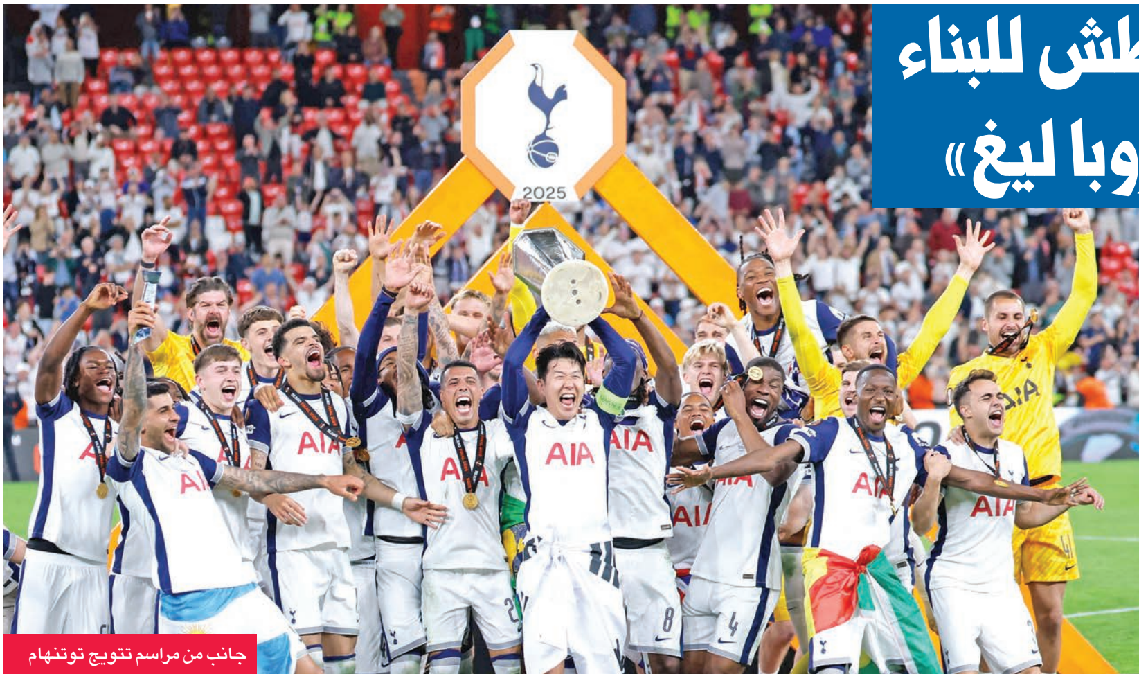
جانب من مراسم تتويج توتنهام