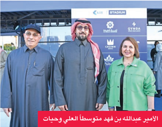
الأمير عبدالله بن فهد متوسطاً العلي وحيات

الرياضي المخضرم، مسعود جوهري حيات، العلي بمناسبة ثقة مجلس الاتحاد العربي الكويتي للفروسية برئاسة السبيعي (البحرين)، وفوزي صحرأوي (الجزائر)، وهنا مجلس إدارة الاتحاد الكويتي للفروسية برئاسة