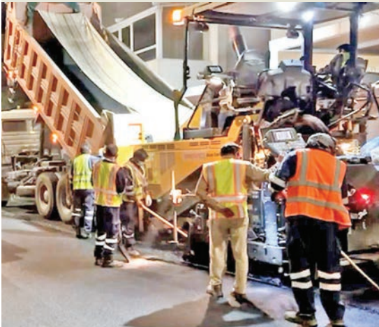
جانب من أعمال فرش الأسفلت في بيان

أعلنت وزيرة الأشغال العامة، د. نورة المشعان، أمس، بدء أعمال الصيانة الجذرية في منطقة بيان، بقطعتي 7 و8، ضمن العقود الجديدة المخصصة لصيانة الطرق السريعة والداخلية. وقالت المشعان، في تصريح، إن هذه الأعمال تنفذ ضمن 18 ممارسة كبرى تشمل صيانة شاملة للطرق في المحافظات الست، بهدف رفع كفاءة البنية التحتية وتعزيز مستويات السلامة، بما يتماشى مع المعايير الهندسية العالمية. وأشارت إلى أن أعمال الصيانة الجذرية والدورية تساهم في إطالة العمر الافتراضي للطرق، وتقلل الحاجة إلى إعادة الإنشاء الكلي، مما يساهم في خفض التكاليف المستقبلية، وتحقيق الاستدامة في قطاع الطرق.