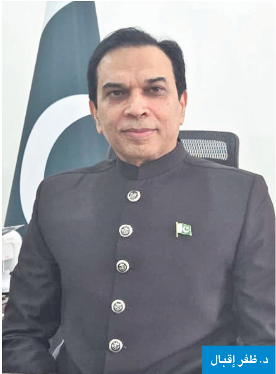
د. ظفر إقبال

الكويتي، حيث يعمل الكثير من أبائنا في قطاعات التعليم والصحة، ويساهمون بشكل فعال في بناء المجتمع الكويتي. وشدد على حرص باكستان على تعزيز التبادل الاقتصادي والتجاري مع الكويت، وتوسيع آفاق التعاون المشترك في مجالات حيوية: مثل الأمن الغذائي، والزراعة، والبنية التحتية، مشيراً إلى أهمية توقيع مذكرة تفاهم جديدة في مجال العمل بين البلدين.