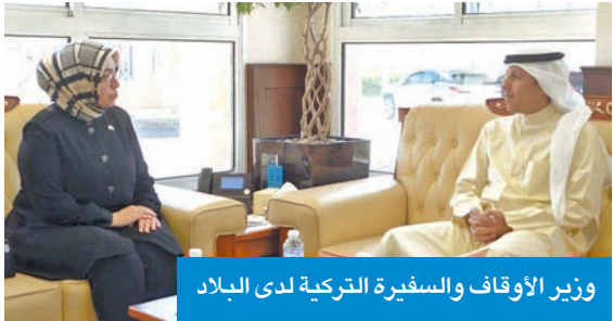
وزير الأوقاف والسفيرة التركية لدى البلاد

بحث وزير الأوقاف والشؤون الإسلامية د. محمد الوسمي مع السفارة التركية لدى البلاد طوبى نور سونمز تعزيز التعاون المشترك بين البلدين. وذكّرت وزارة الشؤون الإسلامية، في بيان أمس، أنه تم خلال اللقاء بحث أوجه التعاون بين الكويت وتركيا، وسبل تعزيز التعاون في العلاقات وتبادل الخبرات في المجالات ذات الاهتمام المشترك الخاصة بتطوير العمل الوقفي بالشؤون الإسلامية. ونقل البيان عن الوزير الوسمي تأكيد حرص الكويت