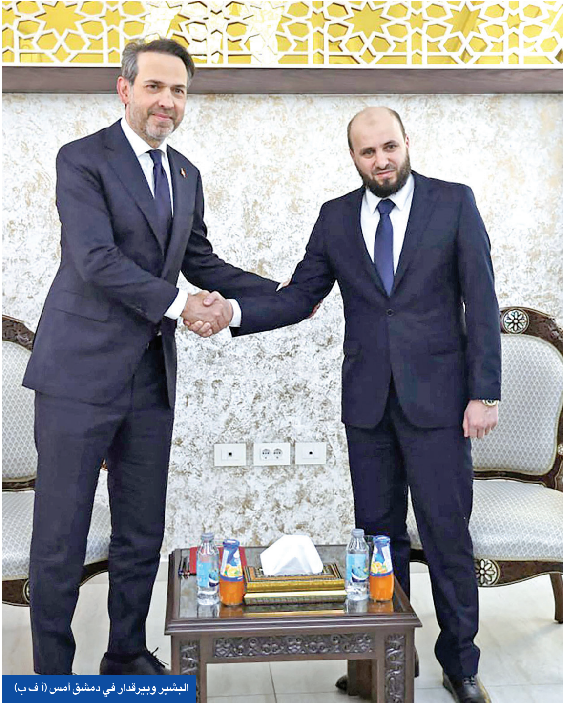
البشير وبيرقدار في دمشق أمس

الكهرباء لها، مشيراً إلى أن سوريا تعمل منذ ديسمبر على إعادة البناء في كل المجالات وتركز الجهود على قطاع الطاقة. وأعلن ببيرقدار أن شركات خاصة وعامة تركية مهمة بالاستثمار في سورية، وتستكشف الموارد الطبيعية لدعم جهود إعادة الإعمار. في غضون ذلك، كشف رئيس مجموعة «تاير» وليد الزعبي عن اعترافه بتطوير فكرة بناء برج الرئيس الأميري دونالد ترامب في دمشق بتكلفة قد تصل إلى