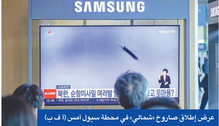
عرض إطلاق صاروخ «شمالي» في محطة سيول أمس

في واقعة اعتبرها زعيم كوريا الشمالية كيم جونج-اون «عملاً إجرامياً»، وقع «حادث خطير» في مدينة تشونغجين الساحلية،