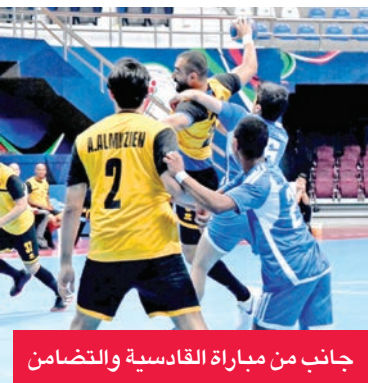
جانب من مباراة القادسية والتضامن

تنتقل اليوم منافسات الجولة العاشرة من دوري الدرجة الأولى لكرة اليد، بإقامة مباراتين، حيث يلتقي في الخامسة مساءً الفحيحيل (الخامس بـ 20 نقطة) فريق القرين (الثالث بـ 24 نقطة). وفي السادسة والنصف مساءً يلعب اليرموك (السادس بـ 6 نقاط) مع الساحل (الأخير من دون رصيد). وثقّام السبت مباراتان ضمن الجولة ذاتها، ففي الخامسة مساءً يلعب النصر (الثاني بـ 27 نقطة) مع التضامن (السابع