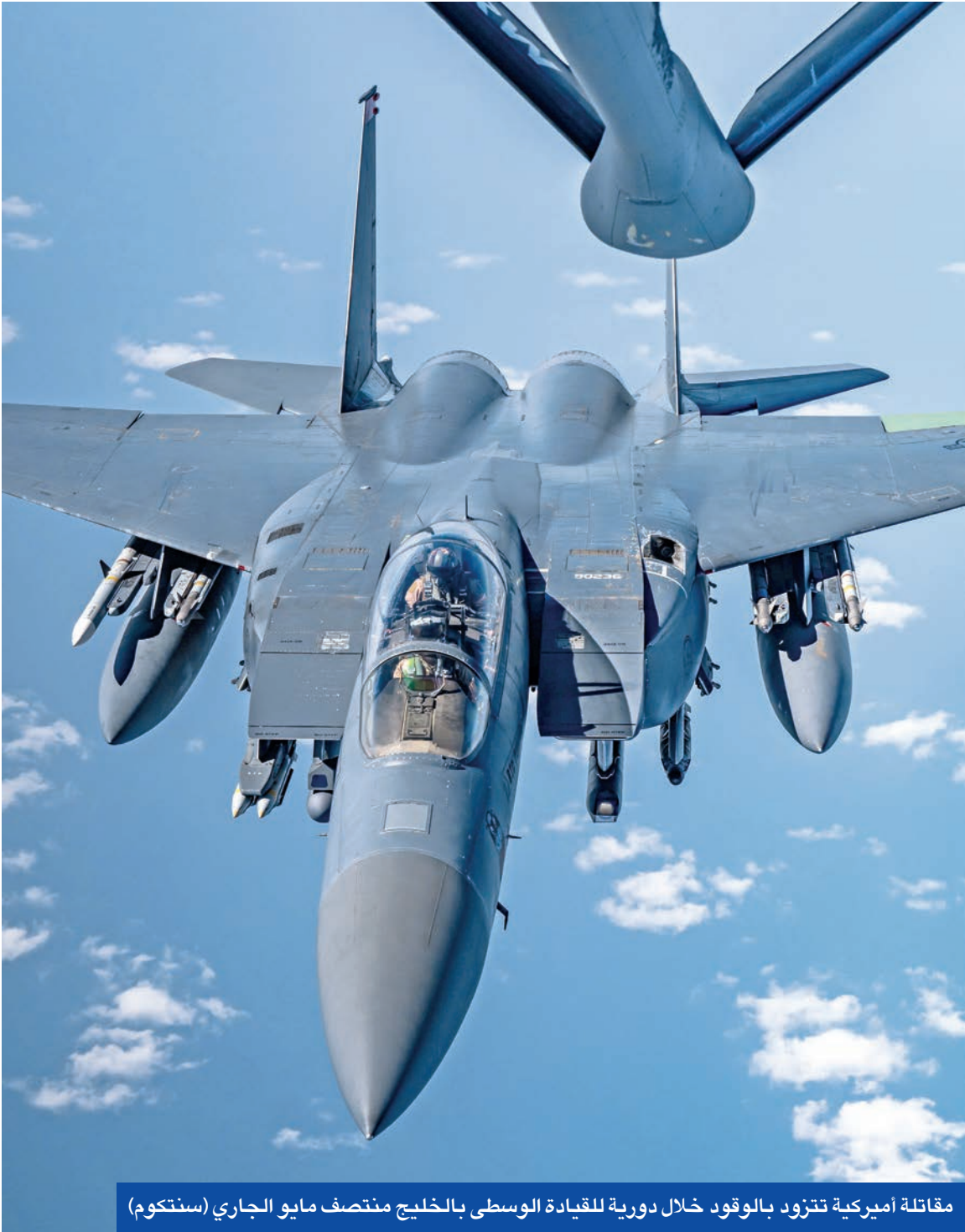
مقاتلة أميركية تتزود بالوقود خلال دورية للقيادة الوسطى بالخليج منتصف مايو الجاري