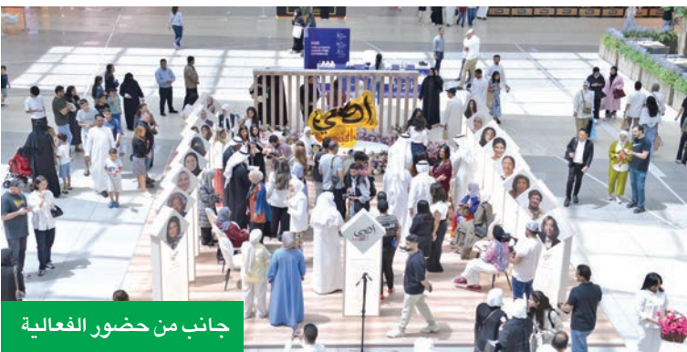
جانب من حضور الفعالية

ويعمل هذا الرالي الأول الذي يستخدم فيه فريق تويوتا جازو للسباقات إطارات هانوكو الجديدة للطرقات الإسفلتية ذات