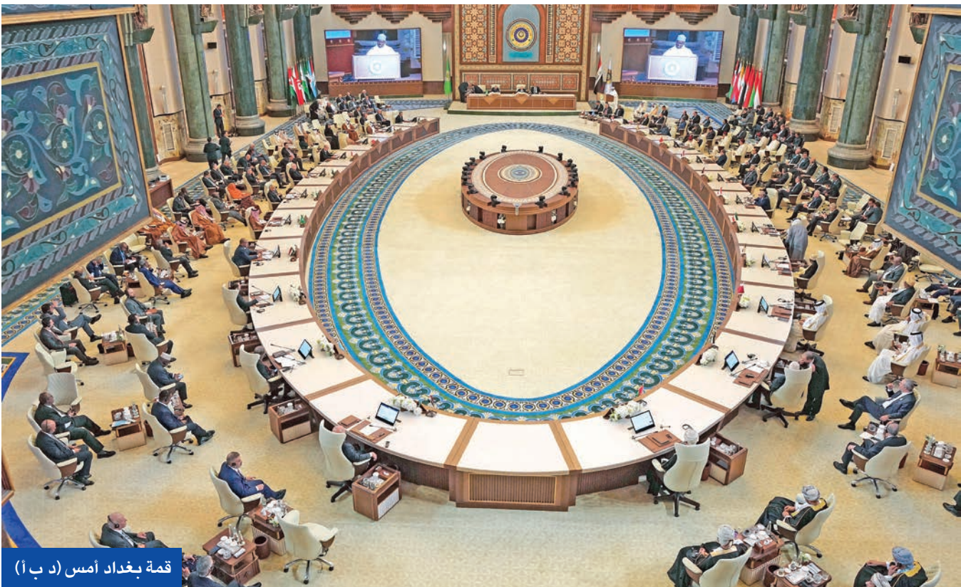
قمة بغداد أمس