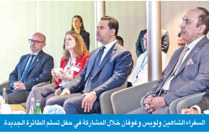
السفراء الشاهين ولويس وغوفان خلال المشاركة في حفل تسلم الطائرة الجديدة

«التعاون بين فرنسا والكويت لا يقتصر على الجانب السياسي فقط، بل يشمل أيضاً المجالات الثقافية والاقتصادية والعسكرية».