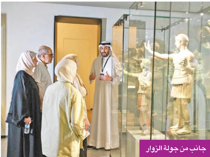
جانب من جولة الزوار