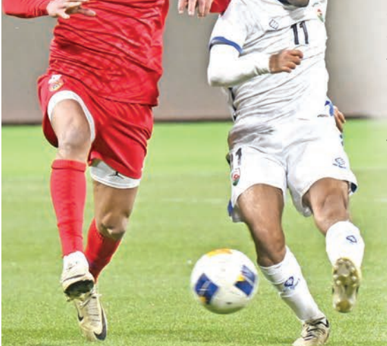
مواجهة سابقة بين الجهراء والصليبيخات

وفي وقت يسعى الصليبيخات إلى تحقيق الفوز لضمان التأهل للدوري الممتاز، فإن مهمته تبدو صعبة، لكنها ليست مستحيلة، بينما يحتفل الجهراء بتتويجه بلقب دوري الدرجة الأولى وتأمله لـ «الممتاز» ويأمل تحقيق الفوز لتفادي تأثير الخسارة على أجواء الاحتفالات.