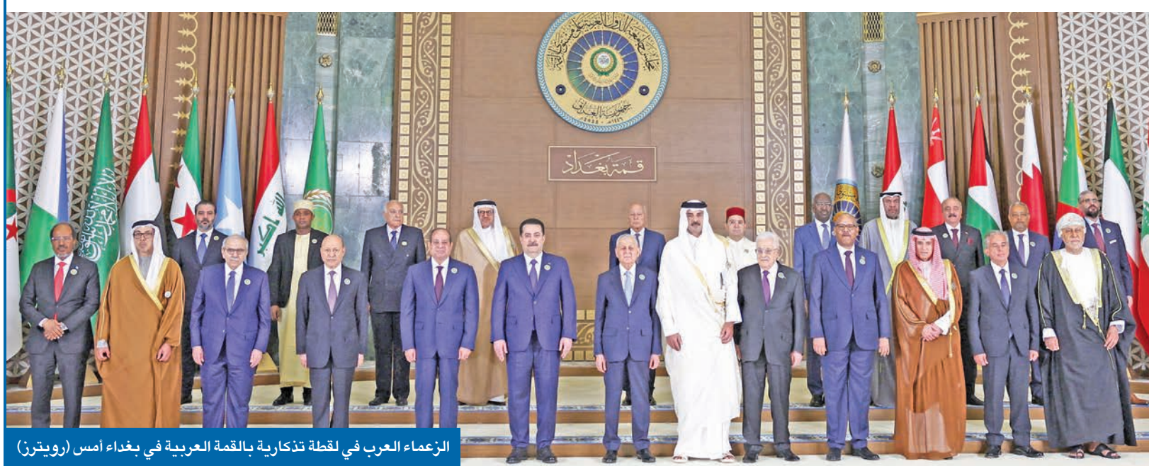
الزعماء العرب في لقطة تذكارية بالقمة العربية في بغداد أمس

تمثيل خليجي وعربي منخفض بسبب «ملاحظات سياسية وأمنية»