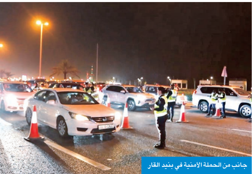
جانب من الحملة الأمنية في بنيد القار

نفذت وزارة الداخلية حملة أمنية ومرورية موسعة في منطقة بنيد القار، الخميس الماضي، أسفرت عن تحرير 474 مخالفة مرور متنوعة، وضبط 19 مخالفاً ومطلوباً. وذكرت الإدارة العامة للعلاقات والإعلام الأمني، في بيان أمس، أن الحملة جاءت بمشاركة من قطاع شؤون المرور والعمليات، ممثلاً في الإدارة العامة للمرور، والإدارة العامة لشرطة النجدة، والإدارة العامة المركزية للعمليات، إضافة إلى الشرطة النسائية. وبيئت أن الحملة أسفرت عن تحرير 474 مخالفة مرور متنوعة، وضبط 5