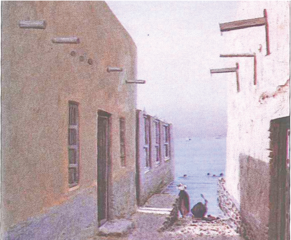
نقعة معرفي كانت أحب مكان للكاتب في صباه في أواخر الأربعينيات حيث كان هو وأقرانه من ذلك الجيل يستمتعون بالسباحة والنقع إلى البحر من أعلى عمود في تلك الساحة الجميلة