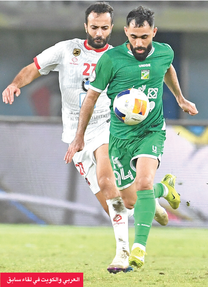
العربي والكويت في لقاء سابق

إذا كان القادسية خسر بسبعة أمام الفحيحيل في فضيحة تاريخية بلا صوت ولا موقف، فإن «الاتحاد» خسر هيئته بنفس النتيجة، ولكن في ملعب القرارات، فكل طرف يلعب بطريقته، لكن جمهور الكرة هو الوحيد اللي يتفرج ويقول: «هذي نهاية مسلسل الانضباط... بس ما أحد قال لنا إنه دراما رمضانبة تُعرض الموسم المقبل!، يا جماعة الخير، لا نحتاج لجنة انضباط... بل لجنة إنقاذ!