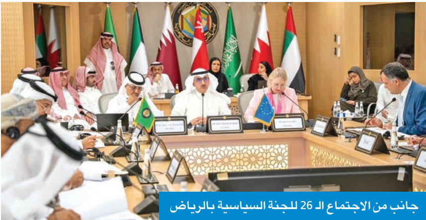
جانب من الاجتماع الـ 26 للجنة السياسية بالرياض

الكويت تستضيف اجتماعاً بين مجلس التعاون والاتحاد الأوروبي في أكتوبر