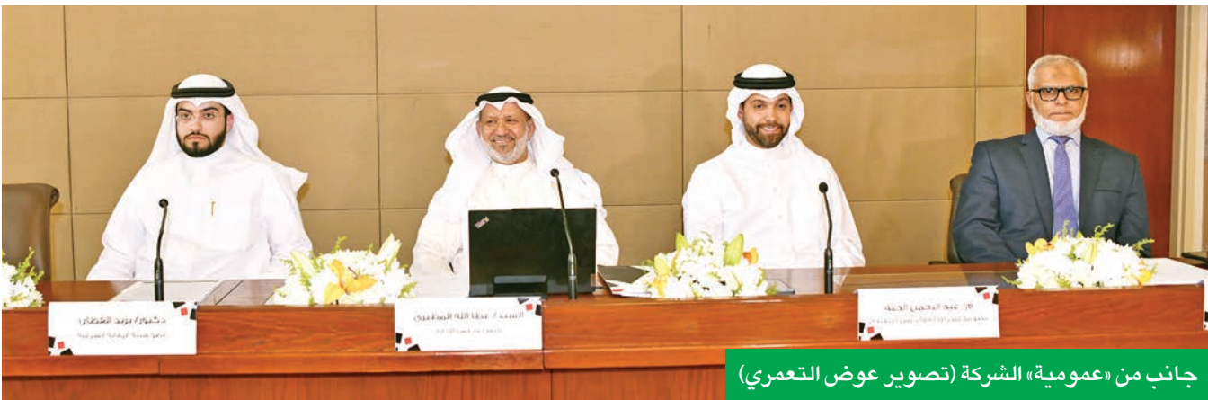
جانب من «عمومية» الشركة

في سياق متصل قال الخنة: «الرؤية المستقبلية لمجموعة البيوت ترتكز على تعزيز أسس تكوين المجموعة تشغيلياً، بحيث تغطي نشاطات مختلفة محلياً وإقليمياً وعالمياً، تحقق الأهداف الطموحة لمساهمينها، ونستطيع المنافسة بها، مع ضمان تحقيق عوائد مجزية سنوياً من أرباح الأذرع التابعة التي نؤهلها ونستثمر فيها». وأردف: «إن نجاحنا ونمونا المستمر يعكسان التزامنا الراسخ بتقديم قيمة مضافة مستدامة لمساهميننا وتعزيز مكانتنا كشريك استراتيجي موثوق لدى عملائنا، الذين نعزز بشراكتهم ونقتهم في خدماتنا وتوافقنا معهم على أن النجاح هو طريق مستمر وليس محطة وصول، ونحن ملتزمون بمساعدتنا لكل عملائنا عبر تقديم أعلى درجات الجودة في الخدمات والحلول المبتكرة». وعن توقعات المرحلة المقبلة أوضح: «نتطلع إلى المستقبل بثقة وتفاؤل، استناداً إلى الأرضية الصلبة التي نقف عليها، والممثلة في سلسلة العقود التي حصلت عليها المجموعة والمستمرة بين 3 و5 سنوات، حيث إن العام الحالي 2025 سيشهد تحولات جديدة وإيجابية في مسيرة أنشطة وعقود الشركة عبر شركاتها التابعة، والتي تمثل أزرعها المتخصصة في الأنشطة التشغيلية، سواء في قطاع خدمات الموارد البشرية التي تنفرد وتتميز فيها الشركة على صعيد الخدمات أو العقود مع كبرى الجهات الحكومية والكيانات الخاصة ما بين جهات محلية وأخرى إقليمية وعالمية، أو الأنشطة العقارية الأخرى». وشدد على «الالتزام بتحقيق أعلى معايير الجودة والتميز، والسعي دائماً إلى استكشاف فرص جديدة، وتطوير أعمالنا، وتعزيز مكانتنا كشركة رائدة في مجالنا المختلفة التي نستثمر فيها، ومع استمرارنا في هذه الرحلة، فإننا على ثقة بأن المستقبل يحمل المزيد من الفرص والنجاحات».