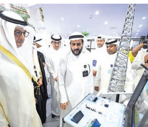
... ويطلع على حلول «زين» المستخدمة في جناحها بالمعرض المصاحب

البنية التحتية للطاقة بالكويت، ومهد الطريق لتبني المزيد من الحلول الذكية والمستدامة على مستوى الدولة. وتستثمر الشركة في دعم المبادرات والمشاريع التي تعزز مستقبل الطاقة النظيفة، وتسهم في بناء منظومة وطنية متكاملة للاستدامة، مؤكدة أن التعاون بين القطاعين العام والخاص هو السبيل الأمثل لتحقيق التنمية المستدامة المنشودة. وقامت «زين» بوضع أهداف استراتيجية لتخفيض بصمتها الكربونية، وتهدف الشركة إلى الوصول للحياة الكربوني بحلول عام 2050 لتقليل أثارها على البيئة، ولهذا تستمر الشركة في البحث عن تقنيات الثورية الحديثة مثل تقنية 5G.5G الذكاء الاصطناعي والطاقة المتجددة لتسهم في تقليل البصمة البيئية الناتجة عن قطاع الاتصالات وتكنولوجيا المعلومات. وضمن جهودها لتفعيل استراتيجيتها للاستدامة المؤسسية، قامت «زين» مؤخراً باستبدال المظلات الخارجية بمواقيف السيارات في مقرها الرئيسي بالواح الطاقة الشمسية، وهو ما يعزز من استخدام الطاقة النظيفة من أجل المساهمة في تشغيل مباني الشركة وتخفيض انبعاثاتها الكربونية.