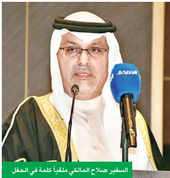
السفير صلاح المالكي ملقياً كلمة في الحفل

يساهم في دفع عجلة النجاح والتميز للبحرين». حضر الحفل مجموعة من السفراء والدبلوماسيين المعتمدين لدى البلاد وعدد كبير من وكلاء طيران الخليج المحليين.