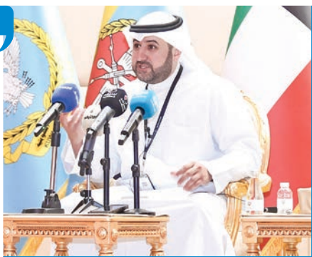
المشعل متحدثاً خلال المؤتمر الصحفي

عملي، حيث تسعى إلى تعزيز مكانة وحضور «الدفاع» إقليمياً ودولياً، من خلال الشراكات المؤسسية والتعاون الأمني والعسكري، وإيجاد مصادر دخل بديلة من خلال خلق «أذرع استثمارية» بعيدة عن الاعتماد الكلي على الموارد النفطية، إضافة إلى ترسيخ مبدأ الشفافية وحوكمة الأداء، والعمل على ترشيد الإنفاق العام. وأشار المشعل إلى أن الخطة الاستراتيجية تركز على التحول الرقمي الشامل في الوزارة، مع إعطاء أولوية قصوى لتعزيز الأمن السيبراني، إلى جانب