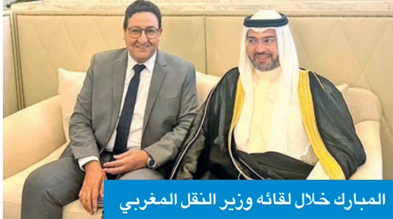
المبارك خلال لقائه وزير النقل المغربي

بحث رئيس الإدارة العامة للطيران المدني الشيخ حمود المبارك ووزير النقل واللوجستك المغربي عبدالصمد قيوح سبل تعزيز التعاون الثنائي في قطاع النقل الجوي، بما يخدم مصالح البلدين، ويعزز أواصر التكامل في قطاع النقل الجوي. وقال المبارك لـ «كونا»، إن ذلك جاء خلال لقاء عقده مع الوزير المغربي، أمس الأول، على هامش انعقاد اجتماع المجلس التنفيذي للمنظمة العربية للطيران المدني في دورته الـ 72 المقامة حالياً بالعاصمة المغربية الرباط. وأضاف أنه جرى خلال اللقاء تبادل الحديث حول الأسس المشتركة للتعاون وتطوير مجالات التدريب وتبادل الخبرات بما يخدم مصالح البلدين، ويعزز التكامل في قطاع الطيران المدني، وتعزيز الرحلات الجوية المباشرة بين البلدين الشقيقين نظراً للإقبال الكبير على هذا الخط الجوي.