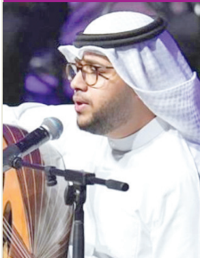
عبد العزيز المسباح

أغنية «وعدتني» لسفير الأغنية الخليجية عبدالله الرويشد، و«روحي تحبك» لأمبر الطرب عبدالمجيد عبدالله، و«تصقب ولا أخفلك» لغارس الأغنية السعودية طلال مداح، فضلاً عن أغنيات «بودع» للمطرب حسين الجسني، و«اطمن» للمطرب حمود ناصر، و«أقف على بابكم» للمطرب فرج عبد الكريم، واختتم الحفل بأغنية، من التراث العماني بعنوان «يا صولي»، والتي غناها المطرب سالم بن علي وحسين الجسني وآخرون. وتجولت كاميرا «الجريدة» بين صفوف الجمهور، ورصدت تفاعلهم الكبير مع أجواء الحفل، وفي نهاية الأمسية أعرب عدد من الجمهور عن سعادتهم بالأجواء الطربية المميزة لحفل «خليجيات» والتنظيم الرائع بمركز اليرموك الثقافي.