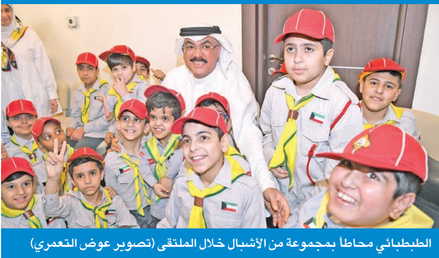
الطبيبائي محاضراً بمجموعة من الأشبال خلال الملتنقى

والجامعات»، مستدركة أهمية تثقيف المجتمع والعمل على نشر ثقافة لغة الإشارة في هذا المجتمع.