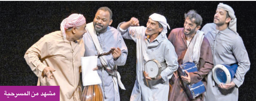
مشهد من المسرحية

تمثل فرصة نعتزّ بها. الكويت هي عاصمة الثقافة والفكر بالخليج، ومنها تعلّمنا وتفنّنا فنياً، وما زالت إلى اليوم هي مركز الفكر منذ أيام مجلة العربي، وسلسلة المسرح العالمي».