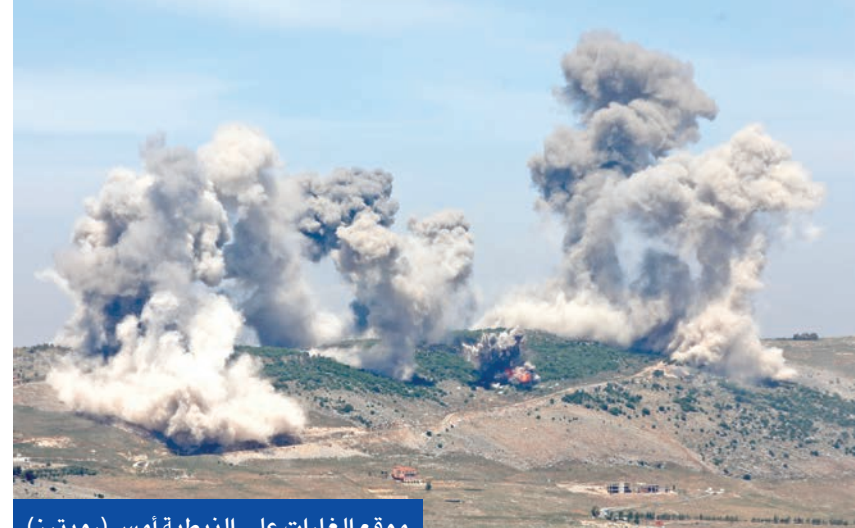
موقع الغارات على النبطية امس

شنت إسرائيل، أمس، غارات جوية في جنوب لبنان وصفت بأنها بين الأعنف منذ سريان وقف النار في نوفمبر الماضي، مع الدول الخليجية يواكب الإصلاحات الأمنية والاقتصادية التي قامت بها حكومتها التي تسعى للاستفادة من موسم الصيف السياحي لتنشيط الحركة الاقتصادية. وأفادت الوكالة الوطنية للإعلام الرسمية بأن إسرائيل نفذت «عدواناً جويًا واسعاً على منطقة النبطية» في جنوب لبنان، عبر «سلسلة غارات عنيفة وعلى دفعتين» استهدفت «الأودية والمرتفعات والأجراج الممتدة بين بلدات كفر تبنت، النبطية الفوقا، كفرمان»، وأوردت وزارة الصحة اللبنانية أن «غارات العدو الإسرائيلي على النبطية أدت في حصيلة أولية إلى سقوط شهيد وإصابة ثمانية أشخاص بجروح من جهة»، أعلن الجرح الإسرائيلي أنه قصف موقع بنية تحتية يستخدمه حزب الله... في إدارة منظومته لإطلاق النار والدفاع».