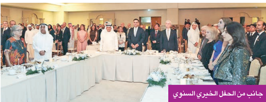
جانب من الحفل الخيري السنوي

وفي سياق كلمته، استشهد فخامته بكلمات لقداسة البابا الراحل فرنسيس، قائلاً: «كم من مرّة، بجانب سرير شخص مريض تتعلم الرّجاء؟ وكَم من مرّة بالقرب من شخص يتالم، نتعلّم الإيمان؟ وكَم من مرّة، ننحني لمساعدة شخص محتاج، فنكتشف المحبّة؟ حينها ندرك أننا ملائكة رجاء ومرسلون من الله لبعضنا البعض».