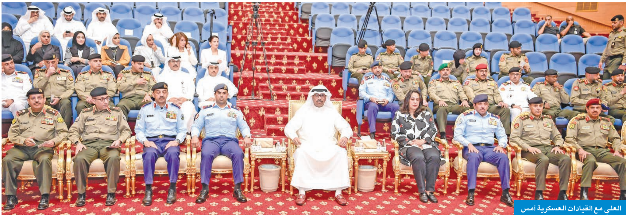
العلي مع القيادات العسكرية أمس

دشن الخطة الاستراتيجية للوزارة 2025 - 2030 بحضور كبار قيادات الجيش الخطة ترجمة للتوجيهات السامية ونقطة تحوّل محورية في مسار تطوير الأداء والقدرات