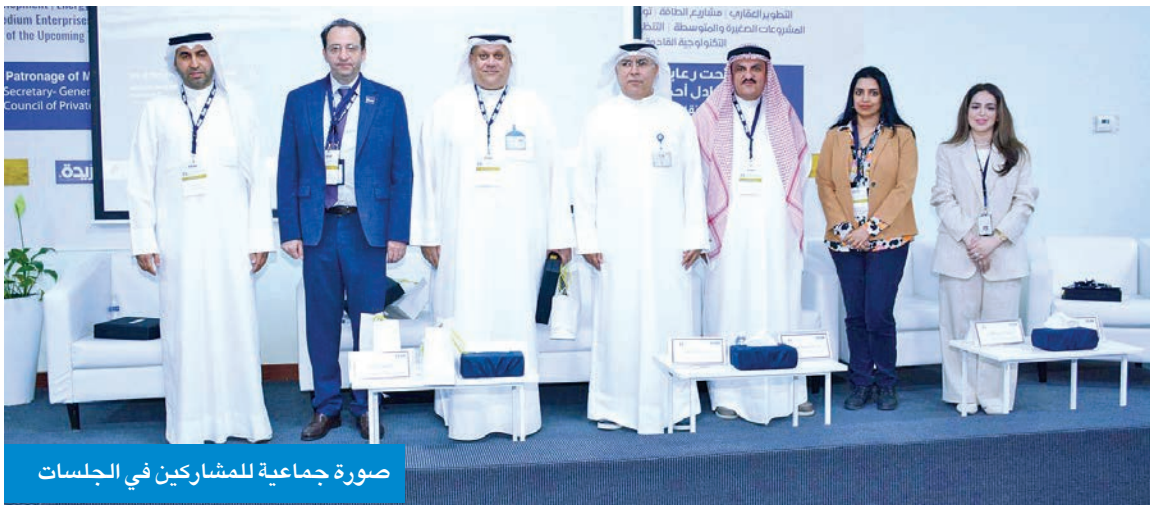
صورة جماعية للمشاركين في الجلسات