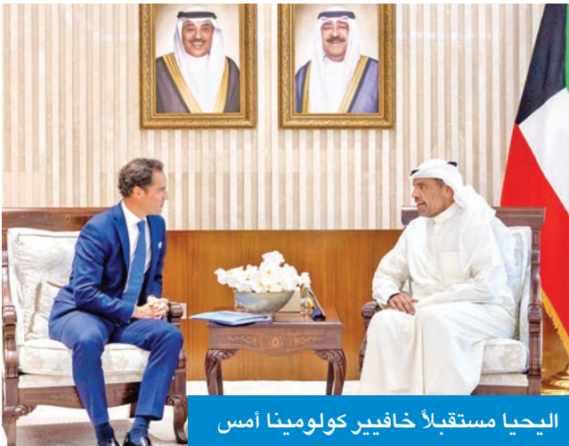
اليحيا مستقبلاً خافيير كولومينا أمس

تم بدوان وزارة الخارجية. ونقلت «الخارجية»، في بيان لها، تمنيات الوزير اليحيا للسفير الجديد بالتوفيق في مهام عمله وللعلاقات الثنائية الوثيقة التي تجمع البلدين الصديقين المزيد من التقدم والأزدهار. على صعيد متصل، استقبل نائب وزير الخارجية السفير الشيخ جراح الجابر، أمس، الممثل الخاص للأمين العام لحلف شمال الأطلسي (الناتو) لدول الجوار الجنوبي خافيير كولومينا، حيث تم بحث أوجه التعاون الثنائي بين الكويت والحلف، بالإضافة إلى أوجه التعاون الممكنة في إطار استضافة الكويت لمركز «الناتو» الإقليمي لدول مبادرة إسطنبول للتعاون.