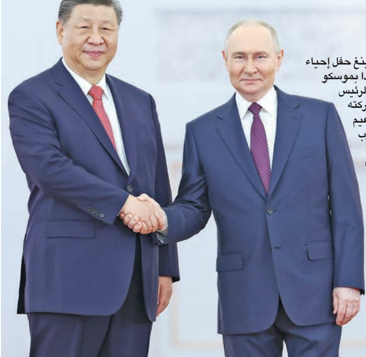
بوتين مصافحاً جينينغ عقب توقيع اتفاقيات تعاون في موسكو امس

وفي وقت يمثل حضور جينينغ حفل إحياء ذكرى النصر التي تقام اليوم وغداً بموسكو دعماً كبيراً للعاصمة الروسية، شكر الرئيس الروسي نظيره الصيني، على مشاركته في «الاحتفال المقدس»، على الزعيم الألماني النازي أدولف هتلر في الحرب العالمية الثانية. وأضاف بوتين مخاطباً شي: «النصر على الفاشية الذي تحقق بعد تضحيات هائلة، له أهمية كبرى وياقبة. مع أصدقائنا الصينيين، نقف بحزم لحراسة تلك الحقيقة التاريخية وحماية ذكرى أحداث سنوات الحرب ومواجهة المظاهر الحديثة للنازية الجديدة والنزعة العسكرية». في إشارة إلى أوكرانيا التي يصور بوتين حربه معها منذ بدايتها على أنها كفاح في مواجهة «نازية العصر الحديث».