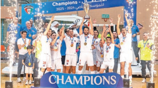
الكويت يتوج بلقب كأس الصالات المغلقة لكرة القدم