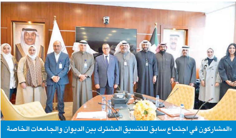
«المشاركون في اجتماع سابق للتنسيق المشترك بين الديوان والجامعات الخاصة

لبحث سبل الارتقاء بالخدمات المقدمة للموظفين