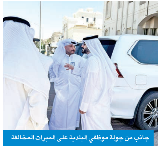
جانب من جولة موظفي البلدية على المبرات المخالفة

والمبرات المخالفة، مثمناً تعاون العديد من الجمعيات، التي بادرت بإزالة الفورية بعد توجيه الإنذارات بمحافظه الأحمدى.