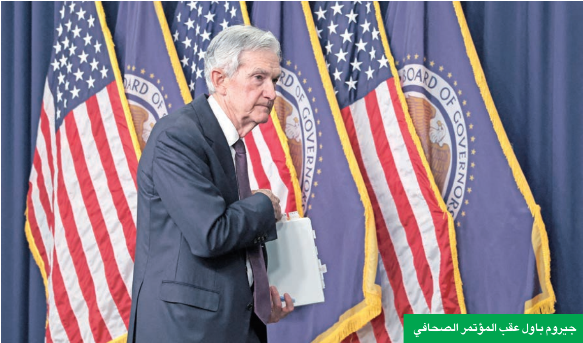
جيروم باول عقب المؤتمر الصحفي

ارتفعت الأسهم الأميركية في ختام تعاملات الأربعاء، بعد انخفاضها فترة وجيزة. عقب تحذير «الفدرالي» من تزايد مخاطر التضخم والبطالة، ووسط تفاؤل المستثمرين تجاه آفاق العلاقات التجارية مع بكين.