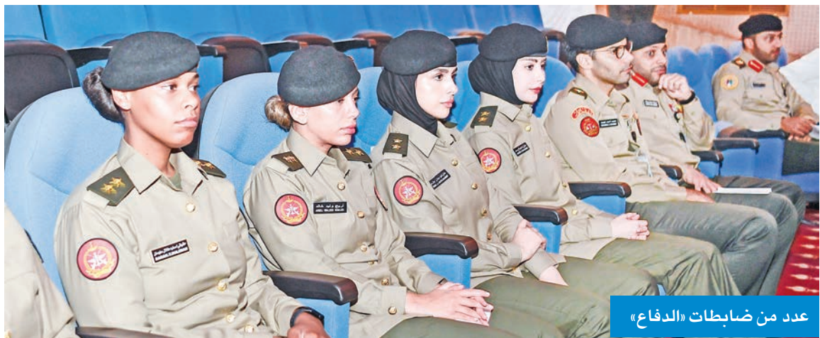
عدد من ضابطات «الدفاع»

دعم كامل من القيادة السياسية للمؤسسة العسكرية لتعزيز قدراتها عبدالله العلي