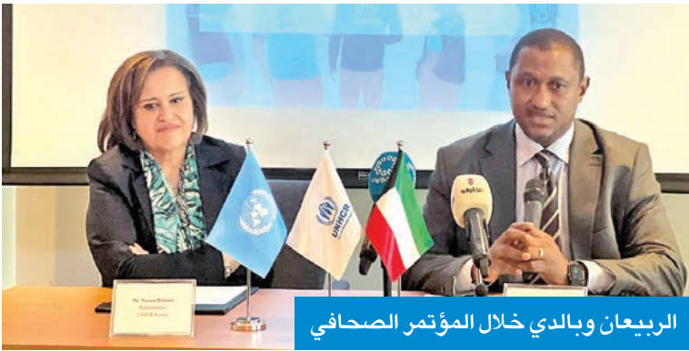
الريبعان وبالدي خلال المؤتمر الصحفي

وشهدت زيارة بالدي لقاءات رفيعة المستوى مع عدد من المسؤولين، من بينهم مساهم وزير الخارجية لشؤون التنمية والتعاون الدولي حمد المشعان، ومساعد وزير الخارجية لشؤون المنظمات الدولية عبدالعزيز الجارالله، إضافة إلى ممثلين عن الصندوق الكويتي للتنمية الاقتصادية العربية.