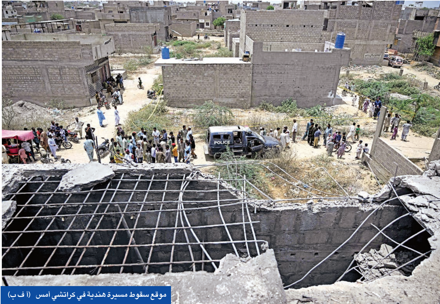
موقع سقوط مسيرة هندية في كراتشي امس

مصادر أخرى تفيد بأن إسلام آباد تدرس شراء مسيرات «شاهد-136» الإيرانية بشكل عاجل. في غضون ذلك، أعلن رئيس الوزراء الباكستاني، شهباز شريف، أمس، أنه تحدث مع الرئيس التركي رجب طيب أردوغان، ووصفه بـ«الأخ العزيز»، شاكرًا تضامنه ودعمه لباكستان في هذا الوقت الحرج. وكتب شريف على منصة إكس أنه أطلع أردوغان على «الجهود الشجاعة» التي يبذلها الجيش الباكستاني، وللمرة الثانية، دعا الاتحاد الأوروبي الهند وباكستان إلى ضرورة ضبط النفس، والانخراط في حوار مباشر، والوفاء بالتزاماتهما بموجب القانون الدولي، واتخاذ كل الإجراءات الممكنة لحماية المدنيين.