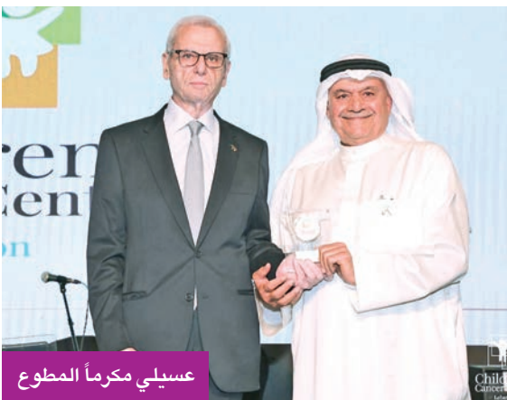
عسيلي مكرمًا المطوع

أمسية أمل وإنسانية شارك فيها 320 شخصية بارزة من البلدين دعماً لمرضى السرطان