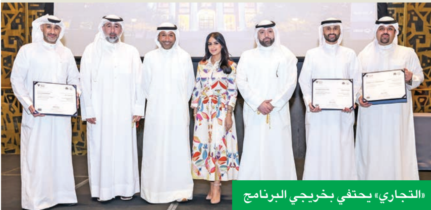
«التجاري» يحتفي بخريجي البرنامج

... و«التجاري» بخريجي «تطوير القيادات التنفيذية» بالتعاون «هارفارد»