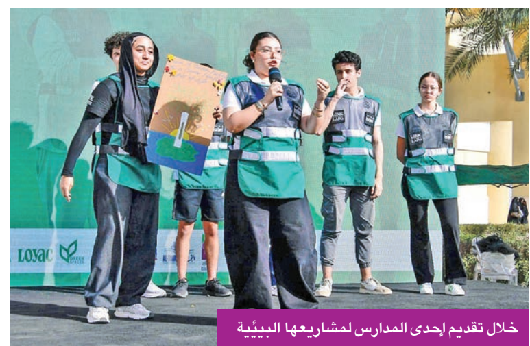
خلال تقديم إحدى المدارس لمشاريعها البيئية