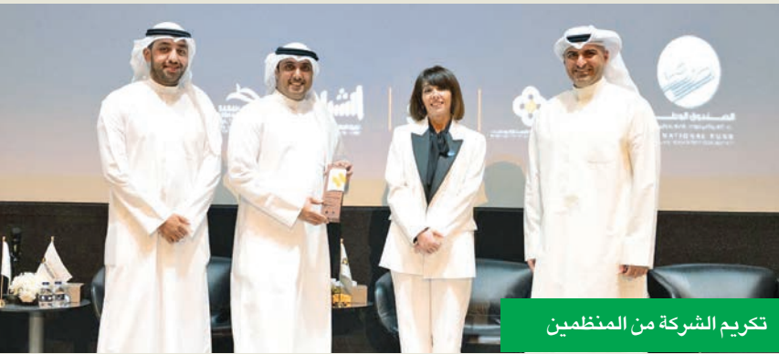
تكريم الشركة من المنظمين

رعت شركة الاتصالات الكويتية stc منتدى «مُبادر +» الذي أطلقه الصندوق الوطني لدعم المشاريع الصغيرة والمتوسطة في الكويت. كما شاركت stc في المنتدى الذي أقيم تحت رعاية وزير التجارة والصناعة خليفة العجيل، تماشياً مع رؤية «كويت 2035»، وتدرج المشاركة في المنتدى ضمن إطار أجندتها في مجال مسؤوليتها المجتمعية، حيث يعد دعم مجتمع ريادة الأعمال في الكويت إحدى ركائزها الأساسية.