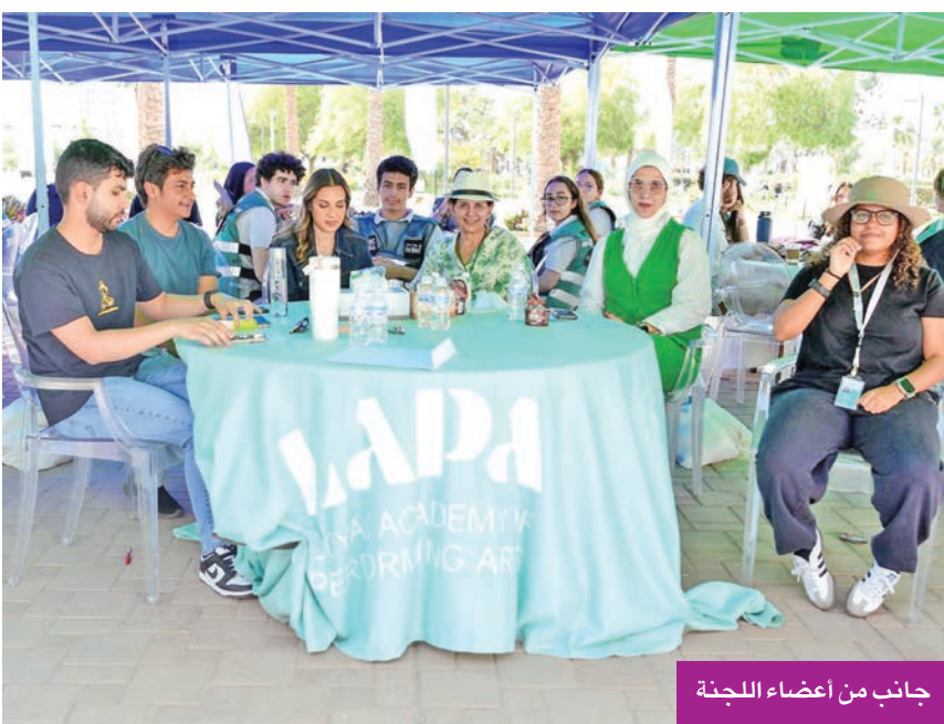
جانب من أعضاء اللجنة