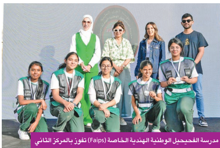
مدرسة الفحيحيل الوطنية الهندية الخاصة (Faips) تفوز بالمركز الثاني