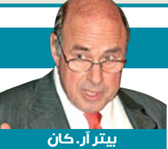
يئثر آر. كان

تنمّني في المعرض التشكيلي الثالث للسجناء رؤية فنانِي الكويت المعروفين وهم من بين المدعويين والمساهمين في الحفل.