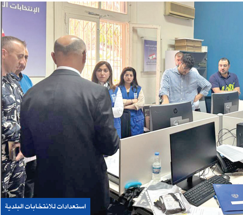
استعدادات للانتخابات البلدية

وفق المصادر، فإن الدولة اللبنانية ترفض ذلك، وتقول إن المملتين بنفصلان عن بعضهما البعض، ولا يمكن ربط السلاح الفلسطيني بسلاح الحزب، وأن العمل يجب أن يستمر لمعالجة السلاحين في الوقت نفسه.