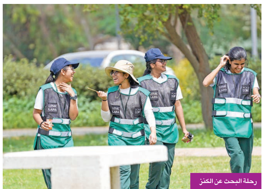
رحلة البحث عن الكنز