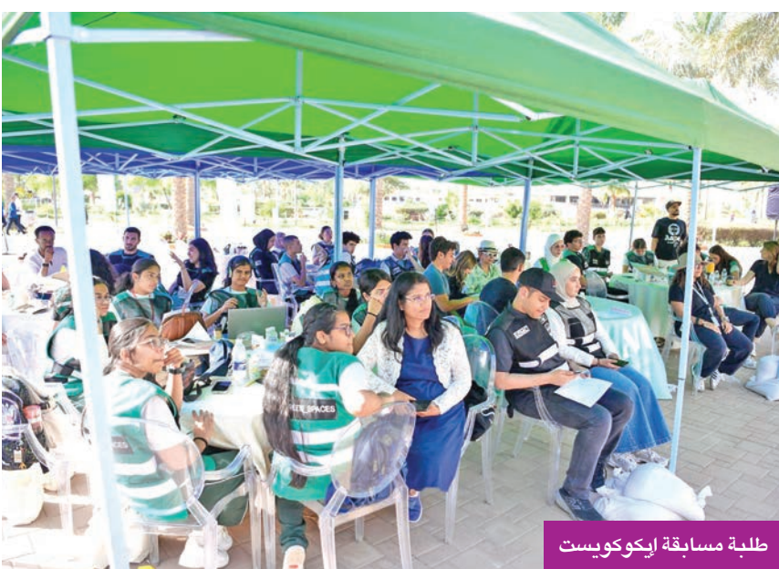
طلبة مسابقة إيكوكويست