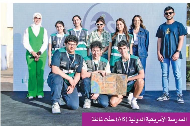
المدرسة الأمريكية الدولية (AIS) حلت ثالثة

وارتكز مشروع أعمدة الكربون على تصميم أعمدة زجاجية تحتوي على الماء والطحالب الدقيقة، حيث تعمل هذه الأعمدة الحية على تنقية الهواء، وإنتاج الطاقة الخضراء. يدخل الهواء المحبّل ثاني أكسيد الكربون إلى العمود من الأعلى، وتقوم الطحالب الدقيقة، بفضل ضوء الشمس، بعملية التمثيل الضوئي، وتحول ثاني أكسيد الكربون إلى أكسجين يُطلق مرة أخرى في الهواء. أما الطحالب التي لم تعد تتعرّض للضوء، فيتم إعادة