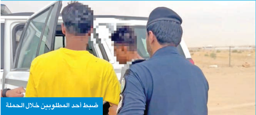
ضبط أحد المطلوبين خلال الحملة

إزالة التبعديات على أملاك الدولة. وذكرت أن «الداخلية» أكدت استمرار تنفيذ الحملات الأمنية المشتركة ضمن خططها الاستراتيجية الهادفة إلى مواجهة جميع أشكال المخالفات، والحفاظ على أمن وسلامة المجتمع، مشيرة إلى أن هذه الحملة تأتي ضمن الجهود الأمنية المستمرة لفرض هيبة القانون وتعزيز الأمن والنظام العام. أمس، إن الحملة أسفرت عن ضبط 21 شخصاً مخالفاً لقانون الإقامة والعمل، تمت إحالتهم إلى جهة الاختصاص لاتخاذ الإجراءات القانونية بحقهم، كما تم ضبط 6 أسلحة نارية و100 طلقة. وأضافت الإدارة أن رجال الأمن تمكنوا خلال الحملة من ضبط مواد مسكرة، مشيرة إلى أن فرق بلدية الكويت عملت على إزالة عدد من الجواخير المخالفة للقوانين، إلى جانب