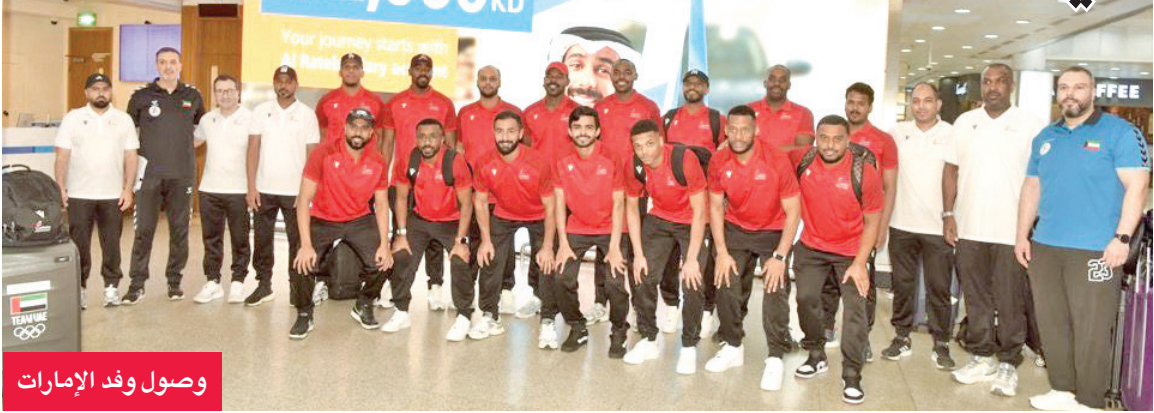
وصول وفد الإمارات

للبطولة، مطالبا اللاعبين ببذل أقصى ما لديهم لتمثيل اليد الكويتية بصورة مشرفة.