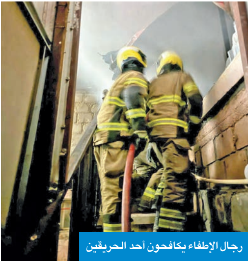
رجال الإطفاء يكافحون أحد الحريقين

الحريق والسيطرة عليه، وقد أسفر عن 4 إصابات تم تسليمها إلى الطوارئ الطبية. وفي تفاصيل الحادث الثاني، قالت الإدارة إن فرق إطفاء مركزي الجهراء الحرفي والتحرير سيطرت على حريق قسبية بمنطقة اسطبلات الجهراء حيث تمت مكافحة الحريق والسيطرة عليه، وأسفر الحادث عن إصابة شخص بحالة اختناق. وأضافت الإدارة، أن فرق الإطفاء والإنقاذ البحري تعاملت مع حادث غرق طفلة في شاليهات صباح الأحمد البحرية، وتم إنقاذ الطفلة وتسليمها للجهات المختصة.