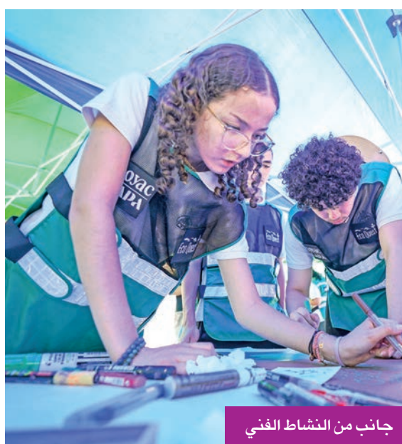
جانب من النشاط الفني