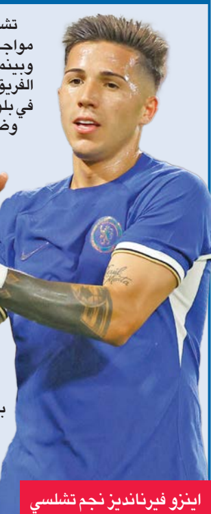
إنزو فيرنانديز نجم تشلسي

ويطمح صلاح في تعزيز صدارته لقائمة هدافي الدوري الإنكليزي هذا الموسم، حيث أحرز 28 هدفاً حتى الآن، بفارق 6 أهداف أمام أقرب ملاحقيه السعودي اليكسندر إيزاك، وجاء الهدف الذي أحرزه صلاح خلال فوز ليفربول الكاسح 1-5 على ضيفه توتنهام هوتسبير على ملعب أنفيلد في المرحلة الماضية، يكسر بذلك صيامه التعبد الذي استمر في مباريات الفريق الأربع السابقة بالمسابقة. وفي باقي مباريات المرحلة، يلتقي وست هام يونايتد مع ضيفه توتنهام، وبرينفورد مع مانستر يونايتد، ويحل نيوكاسل يونايتد ضيفاً على برايتون.