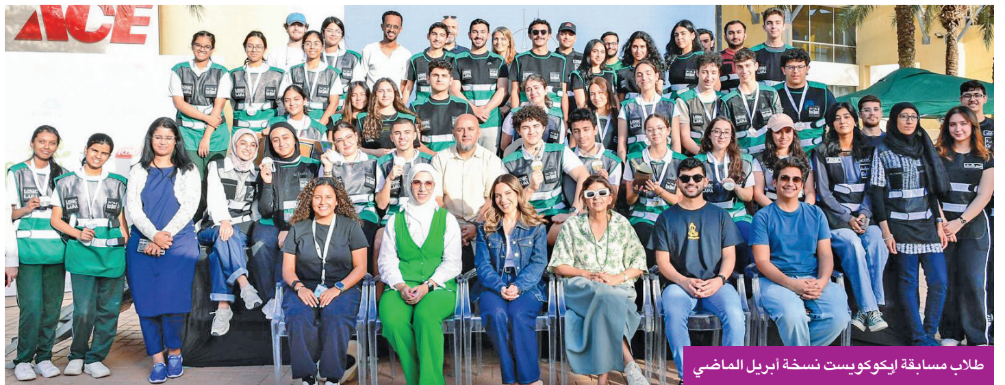
طلاب مسابقة إيكوكويست نسخة أبريل الماضي