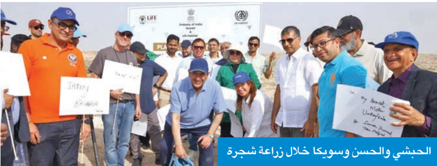
الحبشي والحسن وسويكا خلال زراعة شجرة

الدولية في مجال الاستدامة والعمل المناخي، أكد سفير الهند لدى البلاد أدارش سويكا التزام الجالية الهندية المستمر بالمسؤولية البيئية، من خلال العمل جنباً إلى جنب مع الشركاء الكويتيين لبناء مستقبل أكثر اخضراراً واستدامة للأجيال القادمة. وأوضح سويكا أن الفعالية تهدف إلى رفع مستوى الوعي البيئي، وتسليط الضوء على أهمية التشجير، إضافة إلى غرس الأشجار تكريماً للأمهات.