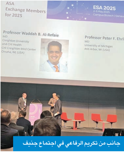
جانب من تكريم الرفاعي في اجتماع جنيف

أعلنت الجمعية الأميركية للجراحة، اختيار رئيس قسم الجراحة في جامعة كريتون الأميركية الطبيب الكويتي د. وضاح الرفاعي، للمشاركة في برنامج التبادل العلمي لعام 2025 مع الجمعية الأوروبية للجراحة، ليصبح بذلك أول جراح كويتي وخليجي وعربي ينال هذا الشرف المرموق. وأعرب الرفاعي، لـ«كونا»، عن بالغ فخره واعتزازه بهذا التكريم، الذي حظي به خلال الاجتماع السنوي الـ31 للجمعية الأوروبية للجراحة المنعقد في مدينة جنيف السويسرية. وأكد الرفاعي أن هذا الإنجاز هو ثمرة من ثمار الدعم المستمر الذي يحظى به القطاع الطبي من سمو أمير البلاد الشيخ مشعل الأحمد، وسمو ولي العهد الشيخ صباح الخالد، ورئيس مجلس الوزراء سمو الشيخ أحمد العبدالله. وأضاف أن هذا الاختبار يمثل تنويعاً لجهود الكفاءات الوطنية في المحافل الدولية، كما يعكس المكانة المرموقة التي تحتلها بها الكويت في المجال الطبي على المستوى العالمي. وقال إن مسيرته الطبية ستظل مكرسة لخدمة الكويت والإنسانية جمعاء، مشدداً على أهمية تعزيز التعاون العلمي وتبادل الخبرات مع المؤسسات الطبية العالمية، بما يسهم في تطوير القطاع الصحي في البلاد. وفي هذا السياق، أعرب الرفاعي عن شكره وتقديره للجمعية الأميركية للجراحة على هذا التكريم، مؤكداً تطلعه إلى المشاركة الفاعلة في فعاليات البرنامج، بما يعزز مكانة الكويت على الساحة الطبية العالمية.