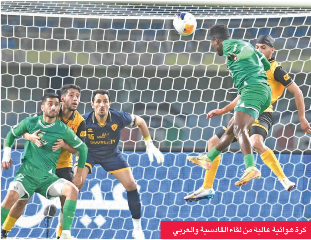
كرة هوائية عالية من لقاء القادسية والعربي