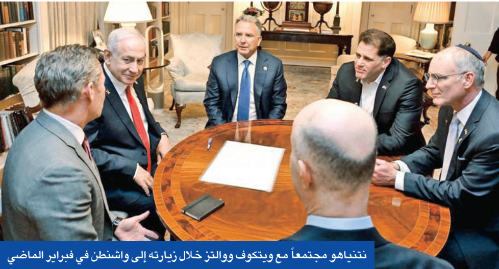
نتنياهو مجتمعاً مع ويتكوف والتز خلال زيارته إلى واشنطن في فبراير الماضي

إقالة والتز قد تكون مرتبطة بتأييده ننتياهو في ضرب طهران