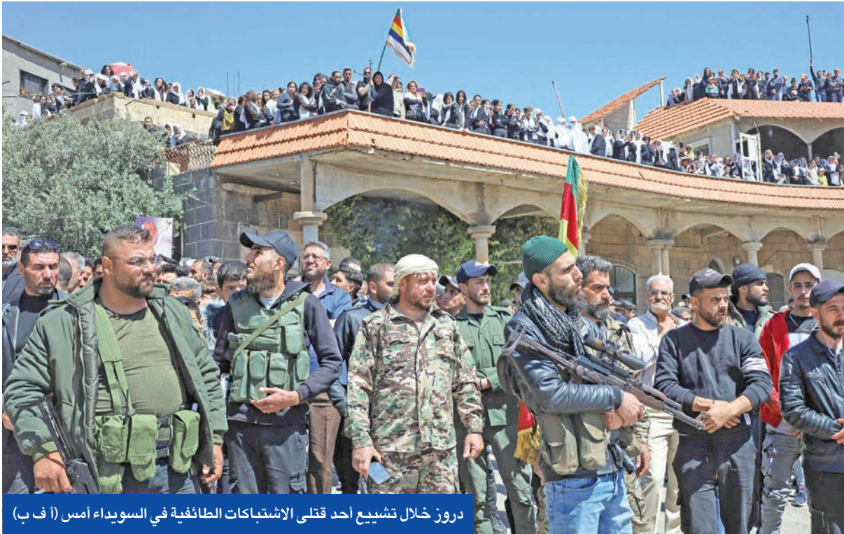
دروز خلال تشييع أحد قتلى الاشتباكات الطائفية في السويداء أمس

أوسع غارات منذ سقوط الأسد وإدانة عربية لاستهداف القصر الرئاسي