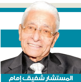
المستشار شفيق إمام

لسنوات طويلة، أحياناً دون دعم كبير من الولايات المتحدة. لم تمتلك قضية موحدة تحفز شعبها، كما فعل الشماليون الشيوعيون، ولم يكن العداء للشيوعية أو حُبّ الرأسمالية كافياً لإلهام الجماهير. الرئيس نغوين فان ثيو لم يكن قائداً كاريزماتياً، بل كان ضابطاً عسكرياً منعزلاً ماهرًا في ألعاب السياسة الداخلية. دون أن يتمكّن من توحيد شعبه. ومع ذلك، لم يكن ثيو أقل شأنًا من كثير من الزنالات الذين حكموا بلداناً نامية حول العالم. كانت فيتنام الجنوبية مجتمعاً متفككاً، ديموقراطيتها شكلية، وفسادها مستشرياً على مستويات مختلفة. لكن، مقارنة بدول أخرى في جنوب شرق آسيا، لم تكن حالها استثنائية من حيث الفساد أو التفاوت الطبقي. وحتى مع النخبة المترفة والمنعزلة، كان هناك كثير من