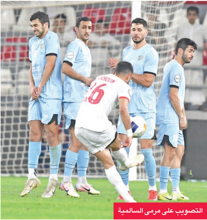
التصويب على مرمى السالمية