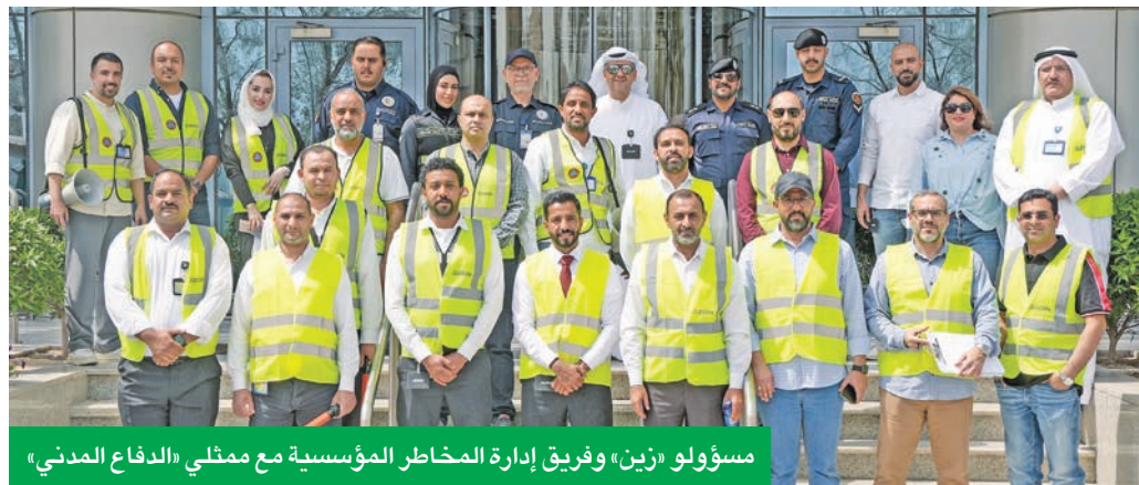
مسؤولو «زين» وفريق إدارة المخاطر المؤسسية مع ممثلي «الدفاع المدني»

لموظفيها، حيث تحرص على إخراج التواصل معهم داخل وخارج إطار العمل في مختلف الجوانب، فالشركة تعتبر موظفيها العامل الأساسي في نجاحها، مبينة أن الجهود التي يقومون بها هي العامل الرئيسي في كونها شركة التكنولوجيا الرائدة على مستوى الكويت.