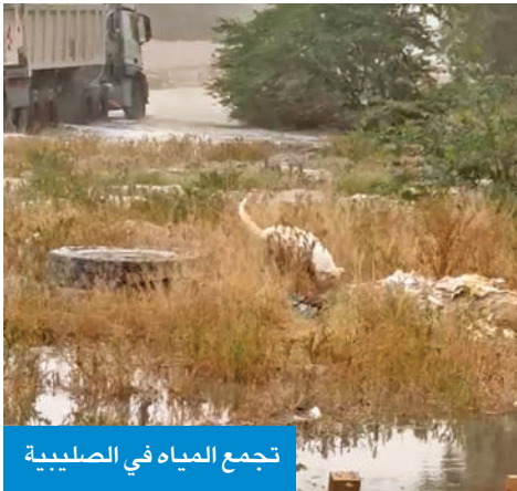
تجمع المياه في الصليبية

منطقة الصليبية الزراعية تواجه إهمالاً من الجهات المعنية أدى إلى تهالك الطرق وانفجار المياه الغذائية للمنطقة. وتابع الأحمد: «لا يخفى على الجميع دور اتحاد منتجي الألبان في تأمين مشتقات الألبان الطازجة يومياً، والذي يمثل أمناً غذائياً من خلال مزارع الأبقار»، مؤكداً أن «إهمال سحب المياه تسبب في ظهور الأمراض، عبر تكاثر الباعوض والكلاب الضالة، مع العلم أنه تمت مخاطبة الوزارة المعنية عدة مرات لكن دون جدوى أو استجابة لمطالب الاتحاد».