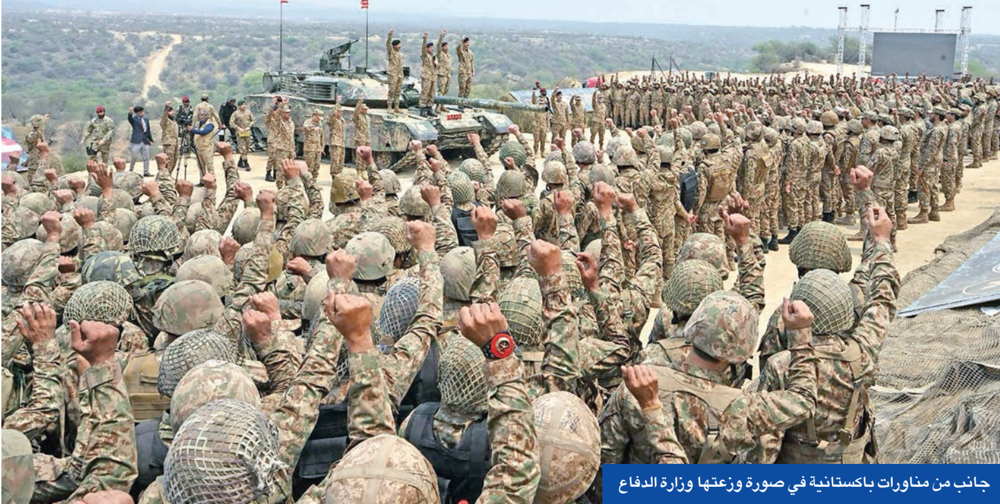
جانب من مناورات باكستانية في صورة وزعتها وزارة الدفاع

الإقليمية الأكبر والأقوى والأغنى. وتعتقد هيئات بحثية أن باكستان تمتلك 170 رأساً نووية، في حين تمتلك الهند رأساً 172 رأساً. ورغم العقود من العداء والشكوك، فإن الهند وباكستان وقعتا اتفاقاً بمنعهما من مهاجمة المنشآت النووية لكل منهما، ويتبادل الجانبان قوائم بمنشأتهما ومرافقهما النووية كل يناير، وذلك مدة 34 عاماً على التوالي.