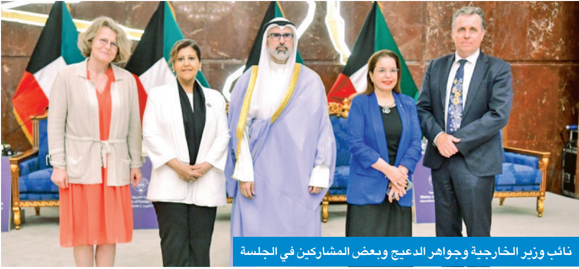
نائب وزير الخارجية وجواهر الدعيج وبعض المشاركين في الجلسة