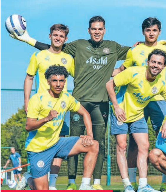
لاعبو مانشستر سيتي خلال التدريبات

إصابة في كاحل القدم، حيث أظهرت صور من حصة تدريبية مفتوحة للفريق عودته إلى التدريبات مع الفريق، الذي غاب عنه منذ مارس الماضي. ولن تكون مهمة مانشستر سيتي سهلة أمام وولفرهامبتون، الذي فاز في مباراته الست الأخيرة بالبطولة، حيث لم يعرف الفريق، الملقب بـ «الذئاب»، سوى لغة الفوز منذ تعادله 1-1 مع ضيفه إيفرتون في 8 مارس الماضي، بالمرحلة 28 للمسابقة. أرسنال يواجه بورنموث ويرغب أرسنال في استعادة نغمة الانتصارات، التي فقدتها في المرحلة الماضية، بتعادله مع كريستال بالاس، حينما يستضيف بورنموث،