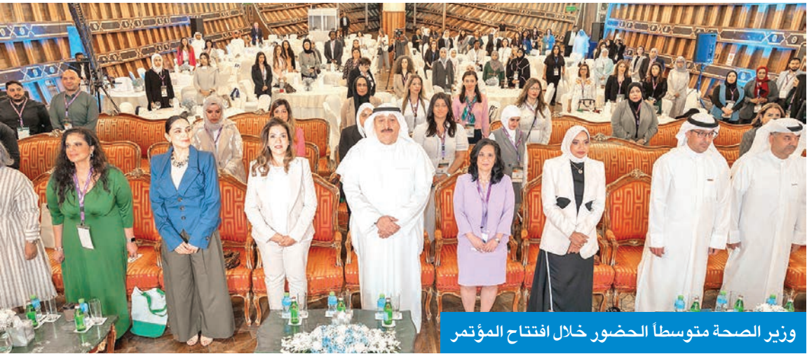
وزير الصحة متوسط الحضور خلال افتتاح المؤتمر

افتتح المؤتمر السنوي الـ8 لجمعية علم النفس في الشرق الأوسط