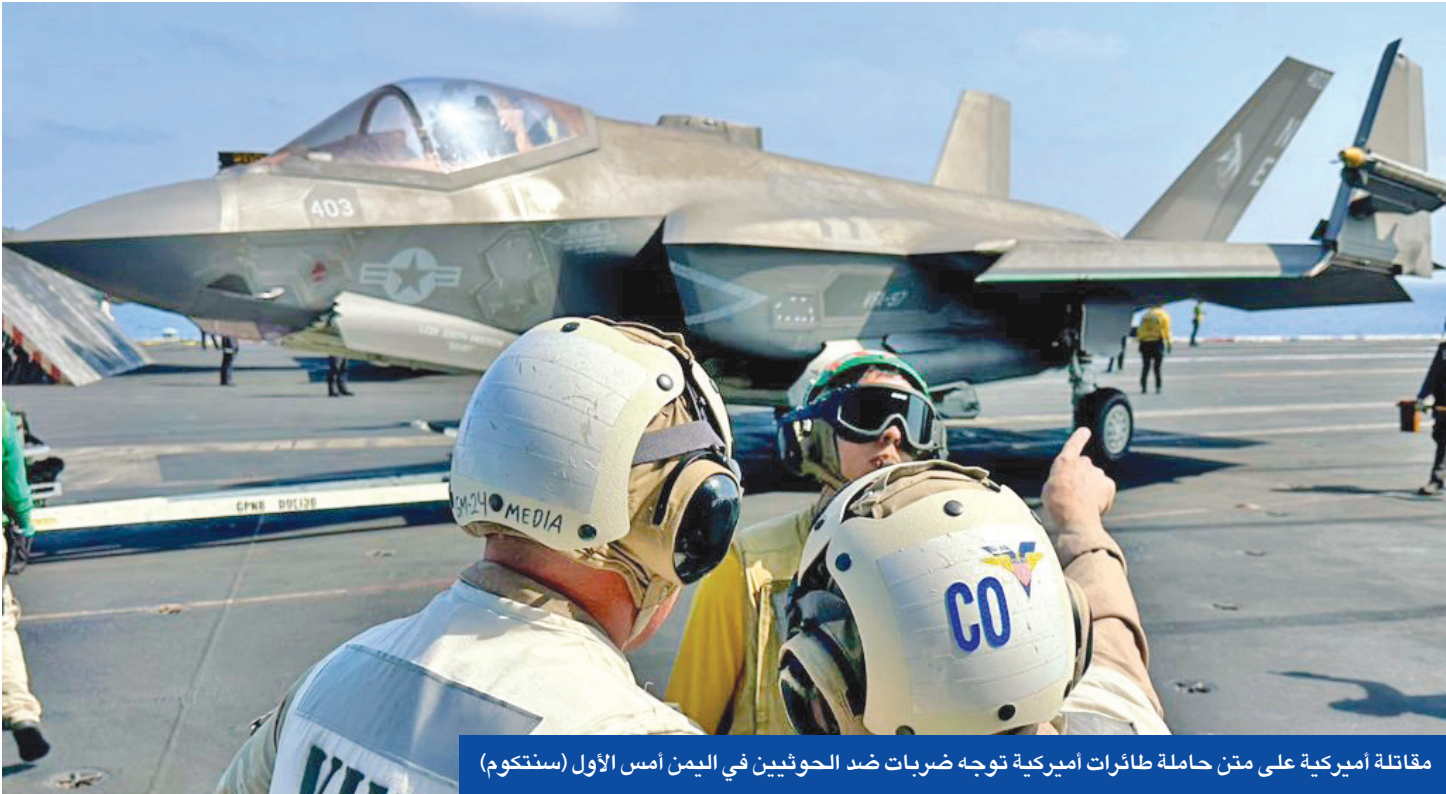
مقاتلة أميركية على متن حاملة طائرات أميركية توجه ضربات ضد الحوثيين في اليمن أمس الأول (سنتكوم)