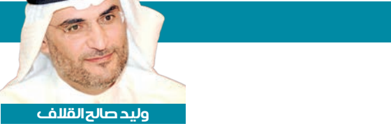
وليد صالح القلاف

فيما الكوادر التعليمية بمدارس أخرى دون حاجة فعلية، بسبب البات توزيع غير شفافة تخضع أحياناً للعلاقات الشخصية أو الضغوط غير الموضوعية. اليوم، وبفضل هذا النظام الإلكتروني،