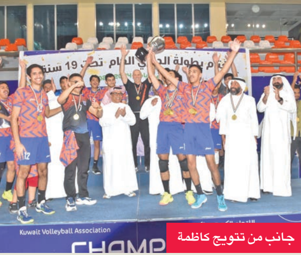
جانب من تتويج كاظمة