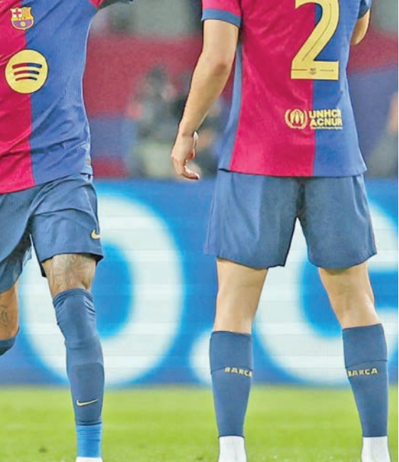
لاعبو برشلونة خلال المباراة السابقة بدوري الأبطال

يحل برشلونة ضيفاً على بلد الوليد، السبت، ضمن المرحلة الرابعة والثلاثين من الدوري الإسباني لكرة القدم.