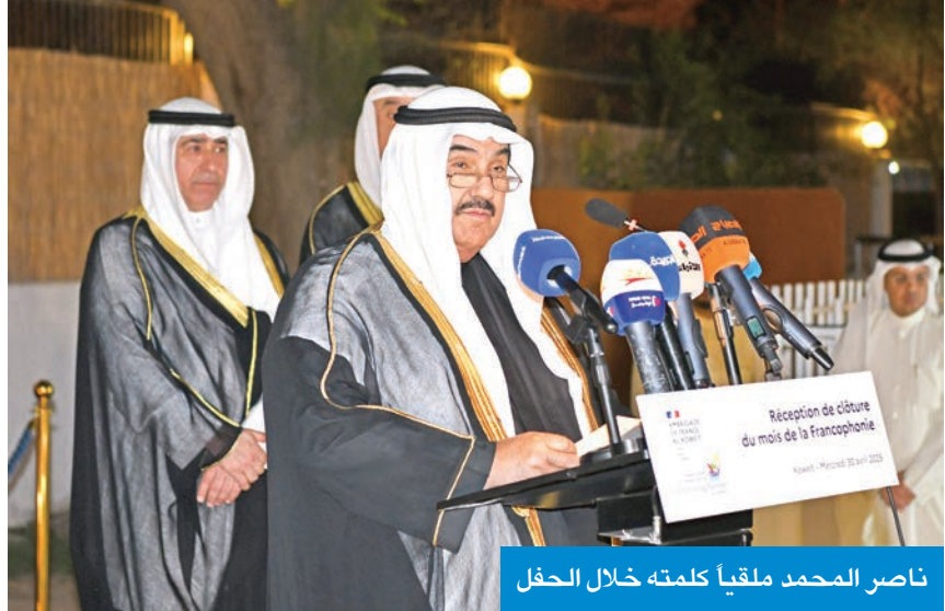
ناصر المحمد ملقياً كلمته خلال الحفل

بلد فرانكوفوني، بل هي أيضاً بلد فرانكوفيلي، أي بلد محب ومعجب بالثقافة الفرنسية، ويعود الفضل في ذلك إلى كل من تعلقوا باللغة الفرانكوفونية كثيراً، ودعموها طويلاً بالطبع، وتقدم بجزيل الشكر إلى سمو الشيخ ناصر المحمد على دعمه المتواصل، قائلاً: «اعتقد أن هذه هي المرة العاشرة أو الثانية عشرة التي يحضر فيها هذا الحفل، وهذا الدعم الذي لا يتوقف، بل يمتد إلى ما بعد هذه الأمسية، وعلى مدار العام من خلال جهوده في تعزيز اللغة الفرنسية ودعمها، وإن المحمد أبو الفرانكوفونية في الكويت، وصاحب المبادرات الأولى في دعمها في ثمانينيات القرن الماضي، ولذلك اختار مجلس تعزيز اللغات الفرانكوفونية في الكويت بالإجماع رئيساً فخرياً له».