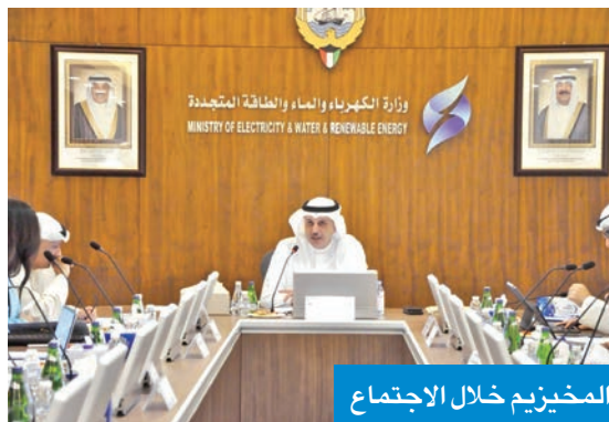
المخيزيم خلال الاجتماع

وشهد الاجتماع عرضاً لأعمال اللجان الفنية المنبثقة عن اللجنة العليا للطاقة في دوراتها السابقة، إضافة إلى مصادر نظيفة، بما يتماشى مع التزامات دولة الكويت الدولية تجاه تحقيق الحياد الكربوني.