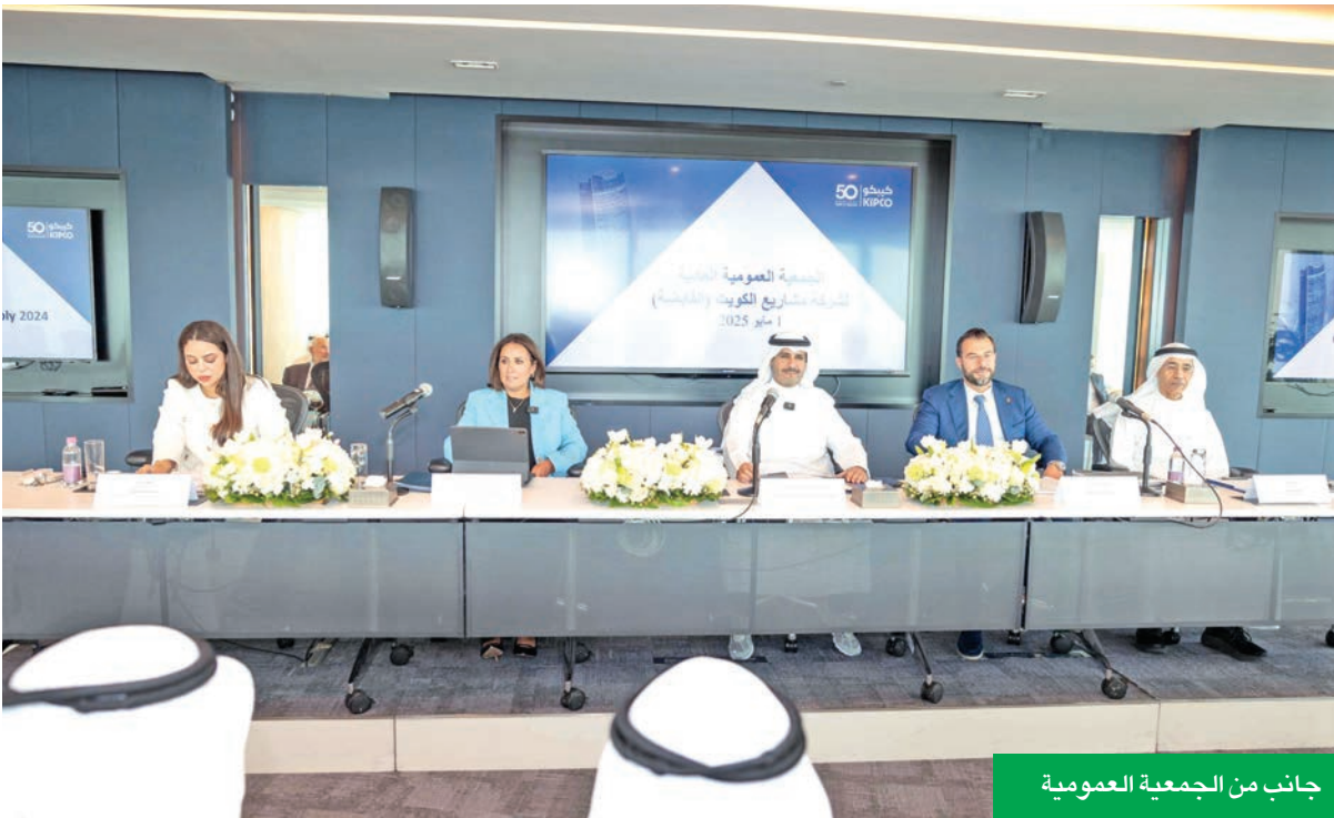
جانب من الجمعية العمومية

وفي الختام، تحدثت الصباح عن تركيز شركة المشاريع في السنوات المقبلة على مسيرة النمو، وقالت: «هدفنا الأساسي في السنوات المقبلة سيظل تعزيز خلق القيمة لمساهميننا من خلال 3 مسارات تركيز: أولها خفض الالتزامات المالية والتخارج الانتقائي من بعض الأصول، وثانيها تعزيز الأداء المالي والتشغيلي لاستثماراتنا للوصول إلى إيرادات وأرباح صافية برقم مزدوج في شركاتنا الرئيسية، وأخيراً سنواصل السعي لتحقيق تدفقات نقدية مستقرة وإيجابية النمو من توزيعات أرباح مستقبلية مستدامة ومن نمو أعمالنا الرئيسية».