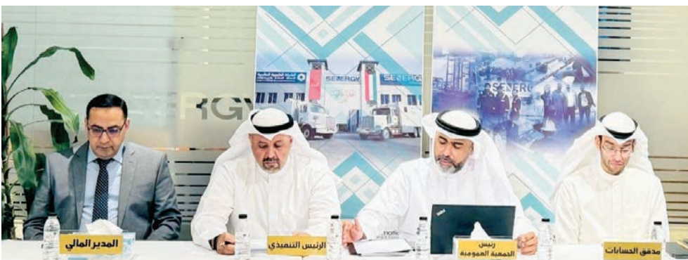
جانب من «العمومية»

الكويت، وتقوم بتوريد المواد ذات الصلة بأعمال حفر الآبار، كما نجحت الشركة في إضافة وكالة جديدة مع شركة جيسكو المتخصصة في توريد الأنابيب. فيما تواصل شركتها التابعة، الشرقية الدولية لخدمات فحص الآبار، أعمالها بمجال فحص الآبار النفطية في باكستان التي تقدم خدماتها لمجموعة من العملاء هناك.