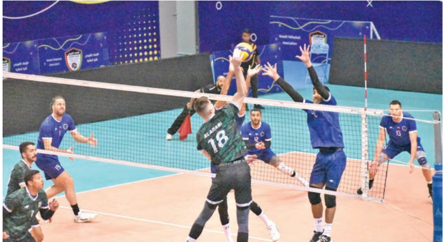
جانب من لقاء سابق بين برقان والعربي