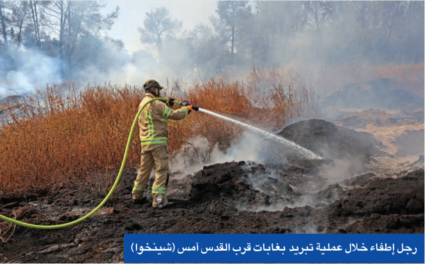
رجل إطفاء خلال عملية تبريد بغابات قرب القدس أمس

في مواجهة ضغوط خارجية ومطالبات داخلية تحته على ضرورة التوصل إلى صفقة لتحرير المحتجزين الإسرائيليين بغزة، ولو مقابل وقف الحرب التي يشنها منذ عام ونصف العام ضد القطاع الفلسطيني، شدد رئيس وزراء إسرائيل بنيامين نتنياهو على أن «الهدف الاسمي» من حرب غزة هو النصر، لا عودة الرهائن. وخلال لقاء مع طابإ إسرائيليين، قال نتنياهو: «نريد استعادة الأسرى الأحياء والقتلى، هذا هدف بالغ الأهمية»، لكنه استدرك بالقول: «للحرب هدف اسمي، وهو تحقيق النصر على أعدائنا، وهذا ما سنحققه. لدينا أهداف حربية عديدة، ونريد استعادة جميع رهائننا».