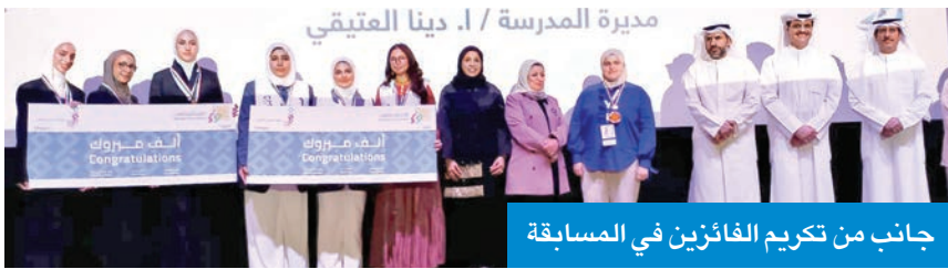
جانب من تكريم الفائزين في المسابقة

الوسمي رعى تكريم الفائزين في الدورة الأولى للمسابقة