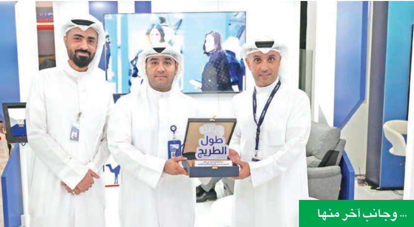
... وجانب آخر منها