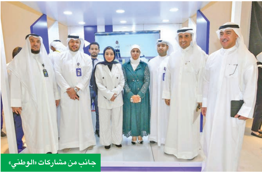
جانب من مشاركات «الوطني»

معروض كلية الكويت التقنية «K-Tech» حرصه الدائم على دعم الشباب الكويتيين وسعيه لاستقطاب أفضل الكفاءات والمواهب الرقمية وتوفير فرص العمل المناسبة لهم في قطاع مهم مثل القطاع المصرفي والمالي، لاسيما مع تزايد الطلب على المواهب الشابة المتخصصة في التكنولوجيا المالية والأمن السيبراني والتحول الرقمي.