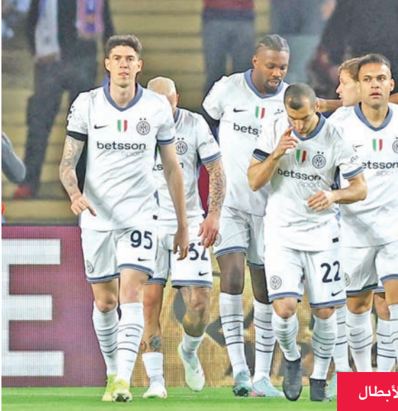
لاعبو الإنتر خلال مباراتهم السابقة بدوري الأبطال

يدخل إنتر ميلان في مهمة جديدة من أجل استعادة صدارة ترتيب الدوري الإيطالي لكرة القدم، حينما يستضيف هيلاس فيرونا السبت، ضمن منافسات الجولة الـ 35 من المسابقة. وفقد إنتر ميلان صدارة ترتيب المسابقة في الجولة الماضية، إثر خسارته على أرضه وبين جماهيره صفر - 1 أمام روما، فيما جاء فوز منافسه نابولي على تورينو بثلاثية سكوت ماستوميني، لينتزع منه الصدارة ويصبح خطر فقدان اللقب قريباً مع تبقي أربع جولات فقط. ويبتعد إنتر ميلان، صاحب المركز الثاني، بفارق ثلاث نقاط خلف نابولي، وسيواجه هيلاس فيرونا، صاحب المركز الخامس عشر برصيد 32 نقطة، ويأمل تحقيق فوز يبقي على أماله في المنافسة. وجاء التعادل المثير مع برشلونة الإسباني 3 - 3 في ذهاب قبل نهائي دوري أبطال أوروبا، ليرفع من الروح المعنوية لفريق المدرب سيموني إنزاغي، والذي خسر آخر ثلاث