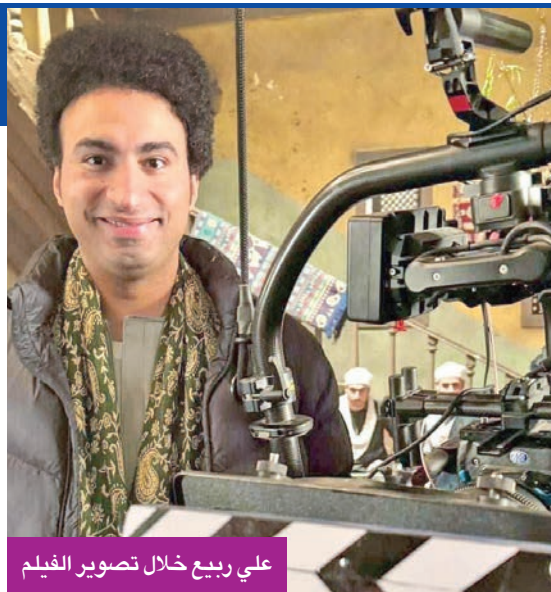
علي ربيع خلال تصوير الفيلم

قال الفنان علي ربيع، إن فيلمه «الصفاء الثانوية بنات»، الذي تم طرحه في موسم عيد الفطر السينمائي لعام 2025، حقق نجاحاً ملحوظاً واستطاع جذب جمهور متنوع، مشيراً إلى أن العمل حمل طابعاً كوميدياً مميزاً جعله مناسباً لجميع الفئات العمرية. وأعرب عن سعادته الكبيرة بالتفاعل الجماهيري، معتبراً أن الضحك الصادق، الذي ارتسم على وجوه المشاهدين، هو المكافأة الحقيقية لأي فنان يعمل. وأضاف أن الفيلم لم يكن مجرد تجربة كوميدية، بل سعى إلى تقديم محتوى