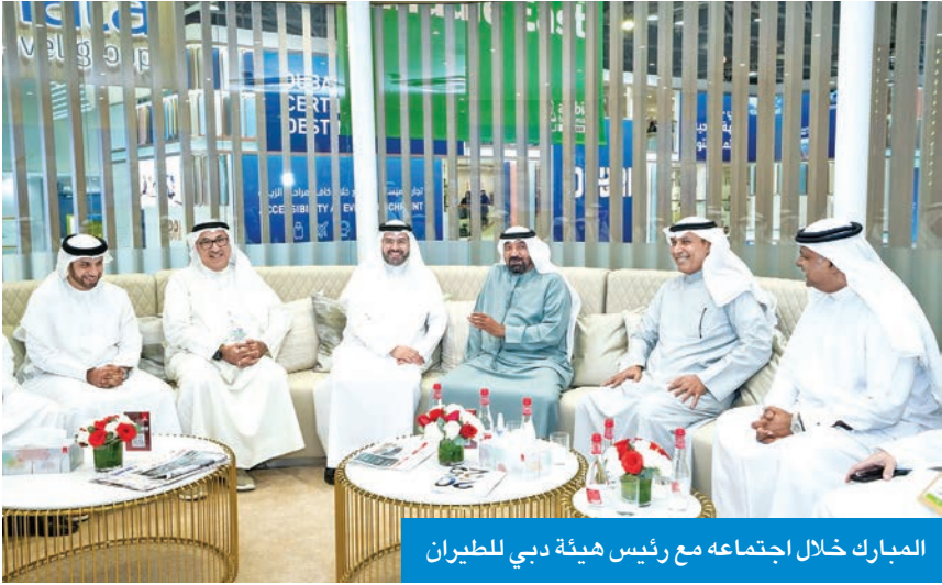
المبارك خلال اجتماعه مع رئيس هيئة دبي للطيران

المبارك شارك في معرض «سوق السفر العربي» بدبي