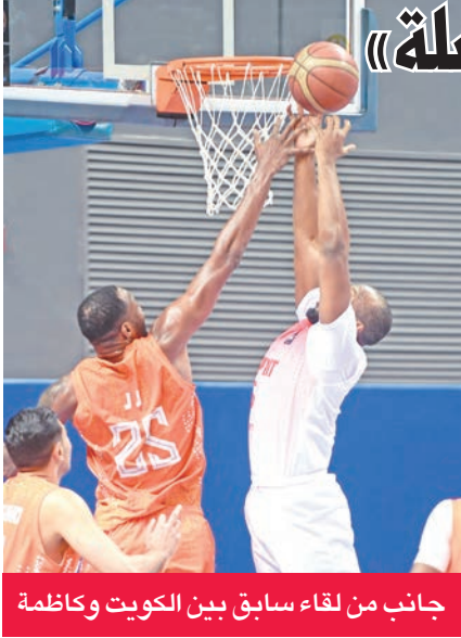
جانب من لقاء سابق بين الكويت وكاظمة