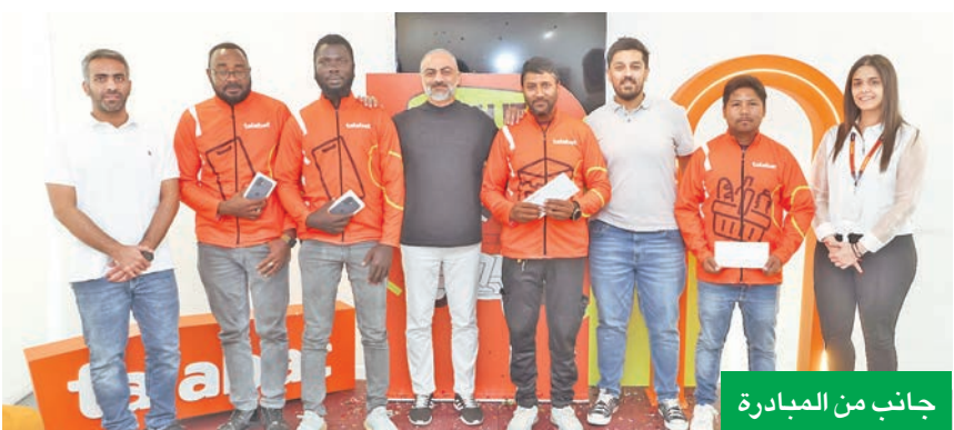
جانب من المبادرة

اختتمت منصة طلبات، بنجاح، النسخة الثانية من مبادرة السنوية «حقق أمنيته»، والتي تمكّنت من خلالها من تحقيق 8 من سائقيها. تمثل هذه المبادرة لـ «طلبات» لفئة إنسانية تعبّر فيها عن شكرها للجهود التي يبذلها السائقون لخدمة مستخدمي المنصة. هذا العام، تعاونت «طلبات» مع أحد المطاعم، التي تم اختيارها نظراً لموقعها