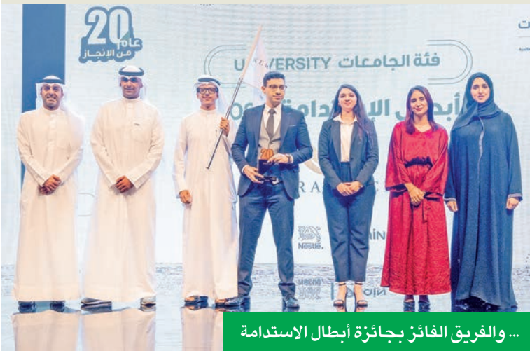
... والفريق الفائز بجائزة أبطال الاستدامة