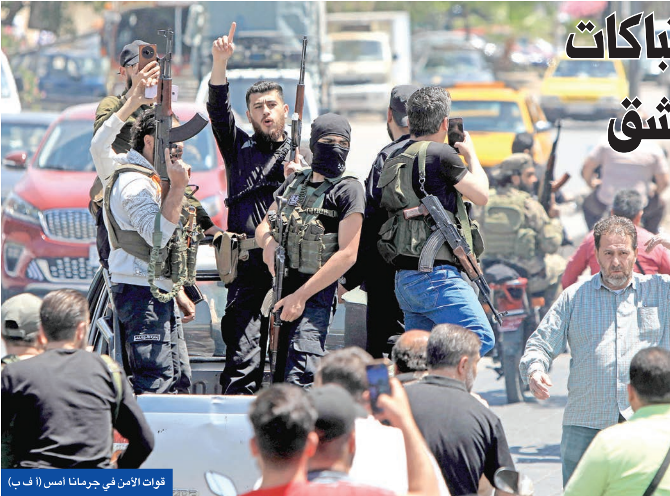
قوات الأمن في جرمانا أمس

إسرائيل، يحمل معظمهم الجنسية الإسرائيلية، بينما يقم 23 ألف درزي في الجزء الذي تحتله إسرائيل من هضبة الجولان.