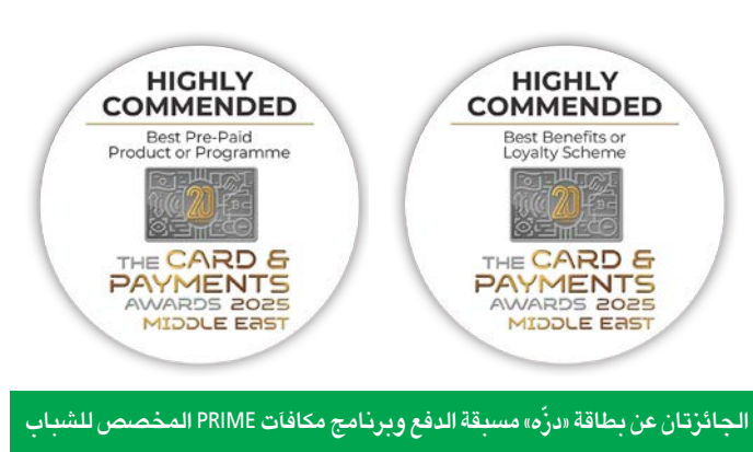
الجائزتان عن بطاقة «دُرّة» مسبقة الدفع وبرنامج مكافآت PRIME المخصص للشباب

ويواصل بنك بوبيان سعيه لتقديم حلول غير تقليدية تواكب المتغيرات وتلبي متطلبات السوق الكويتي بمعايير عالمية، لاسيما أن الريادة لا تتحقق إلا بالاستماع العميق للعملاء، وتقديم تجربة مصرفية تُبنى على الثقة والابتكار والمرونة.