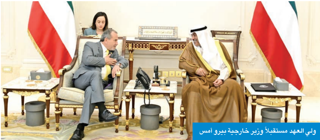
ولي العهد مستقبلاً وزير خارجية بيرو أمس

تتعلق بتطوير العلاقات بين البلدين والمستجدات الإقليمية والدولية