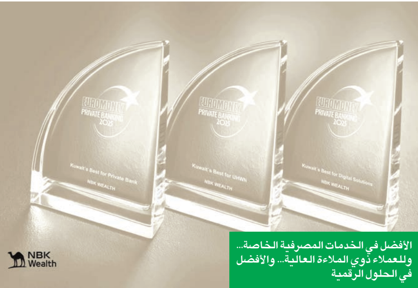
الأفضل في الخدمات المصرفية الخاصة... وللملاء ذوي الملاءة العالية... والأفضل في الحلول الرقمية

على تقديمه أفضل الخدمات المصرفية الخاصة وملاءة العملاء والحلول الرقمية لعام 2025