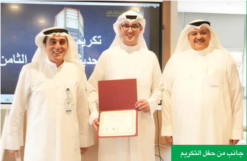
جانب من حفل التكريم