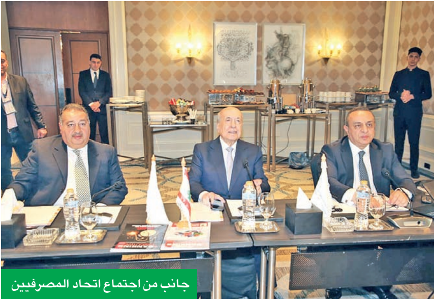
جانب من اجتماع اتحاد المصرفيين