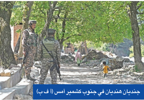
جنديان هنديان في جنوب كشمير أمس

أعلنت باكستان، أمس، أنها أسقطت طائرة استطلاع هندية مسيرة في كشمير، حيث تبادل جنود البلدين إطلاق النار مجدداً. وتفاقم التوتر قبل أسبوع بعد هجوم دام أسفر عن مقتل 26 مدنياً كانوا يقضون إجازة في منتجع باهلفام بإقليم كشمير الذي يتنازع البلدان السيادة عليه منذ استقلالهما عام 1947. وأفادت الإذاعة الباكستانية الحكومية بأن إسقاط المسيرة جرى في منطقة بيمبر الحدودية.