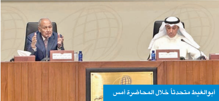
أبو الغيط متحدثاً خلال المحاضرة أمس

خصوصا القضية الفلسطينية، كما تم عقد عدد من اللقاءات مع وزير الخارجية الكويتي وبعض قيادات الوزارة. وتابع زكي أن الجهد حاليا يركز على وقف إطلاق النار في غزة، وهذا الجهد الذي نقوم به الآن، مضيفاً أن «الجهود المصرية، القطرية ستتصدى لهذا الموضوع».