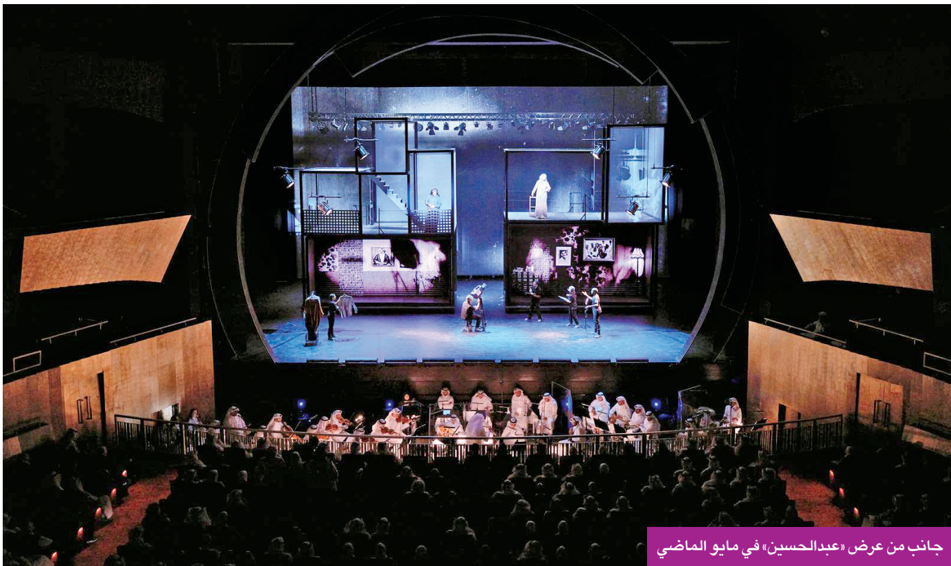
جانب من عرض «عبدالحسين» في مايو الماضي