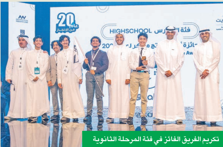
تكريم الفريق الفائز في فئة المرحلة الثانوية