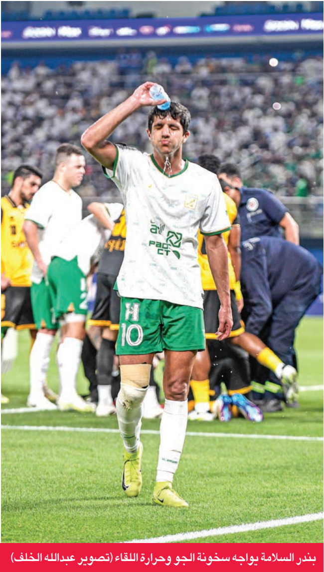
بندر السلامة يواجه سخونة الجو وحرارة اللقاء

أغلق مسؤولو العربي والقادسية صفحة فوز الأخضر على الأصفر في الدور نصف النهائي لبطولة كأس سمو ولي العهد، مع التركيز فقط على مباراته المقبلة في الدوري والمقرر لها بعد غد الجمعة.