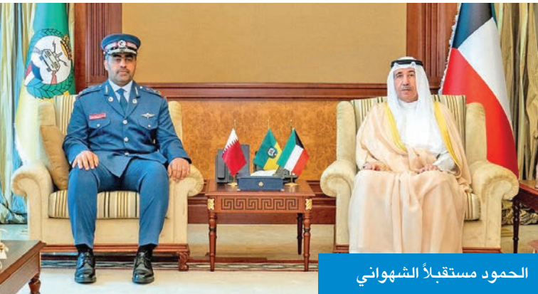
الحمود مستقبلاً الشهبواني

استقبل رئيس الحرس الوطني الشيخ مبارك الحمود، بحضور وكيل الحرس الفريق الركن هاشم الرفاعي، وفد قوة الأمن الداخلي «لخويا» بدولة قطر برئاسة نائب قائد القوة اللواء الركن محمد الشهبواني.