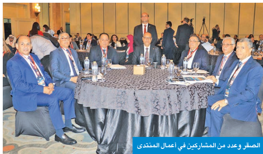
الصقر وعدد من المشاركين في أعمال المنتدى

تعزيز بيئة الأعمال والعلاقات بين البلدين وتوفير العمالة المدربة وزير العمل المصري