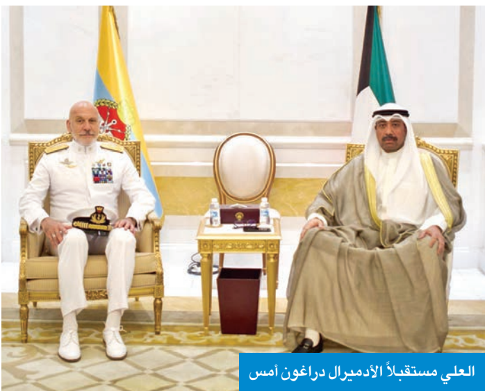
العلي مستقبلاً الأدميرال دراغون أمس

العلي بحث مع الأدميرال دراغون تعزيز التعاون العسكري المشترك