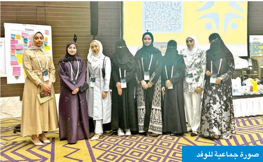
صورة جماعية للوفد

وشدد العواد على ضرورة الالتزام بالشروط الخاصة للجهات المعنية كوزارة الداخلية وقوة الإطفاء والهيئة العامة للبيئة.