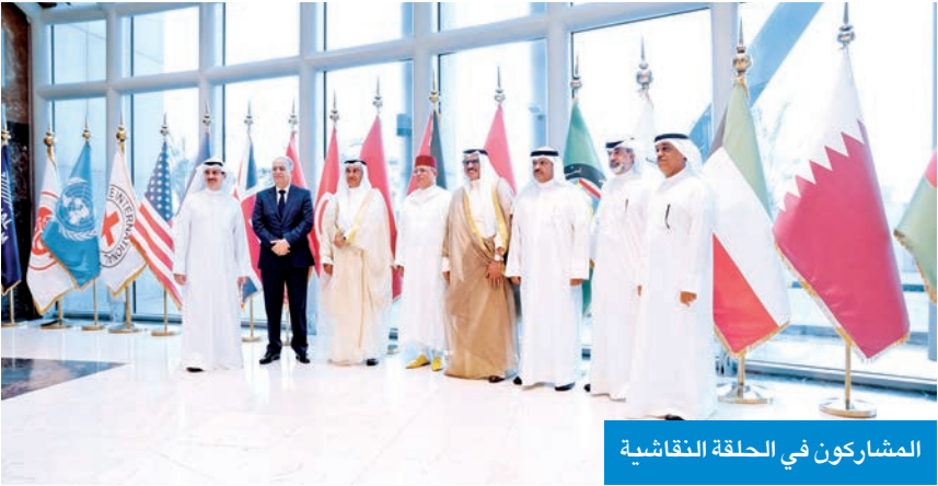
المشاركون في الحلقة النقاشية

الاتفاقية الدولية للامم المتحدة، مبنية أن الهدف الأساسي من توفير حماية للمبلغين هو وجود دافع للكشف عن جرائم الفساد دون إلحاق أي ضرر بهم. وقالت إن أكبر سبب يجعل الأشخاص تمتنع عن التبليغ هو النكاس والسبب الآخر هو أن المبلغ قد يجد نفسه في لحظة ضعف مفورطاً في إحدى جرائم الفساد مثل الرشوة واختلاس المال العام والكسب غير المشروع علاوة على الوساطة التي من الممكن أن تدخل في الفساد، مضيفاً أن المشرع وضع شروطاً لحماية المبلغ على رأسها الجديدة في تقديم البلاغ عبر دلائل ومستندات توضح وجود جريمة فساد. وذكرت أن المبلغ المتكاسل في جريمة جنائية لن يكون متهماً وفق التشريعات، أما إذا كانت جريمة فساد فسيُعتبر الممتنع مرتكباً لجريمة الامتناع عن الفساد وفق أحكام قانون مكافحة الفساد.