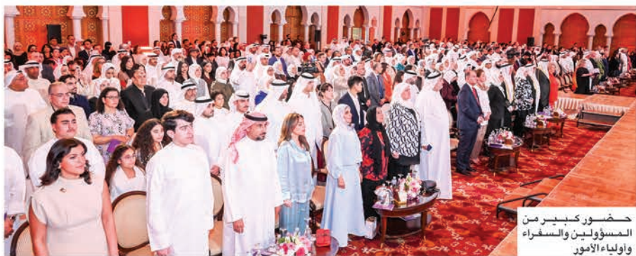
حضور كبير من المسؤولين والسفراء وأولياء الأمور

المستقبل، تذكروا أن الحياة تدور حول التوازن. اعملوا بجد، لكن لا تنسوا الاستمتاع. اسعوا للنجاح، لكن ليس على حساب اللطف. ابقوا على تواصل لكن ليس فقط من خلال الشاشات، بل من خلال المحادثات الحقيقية، والتجارب المشتركة، والعلاقات الهادفة».