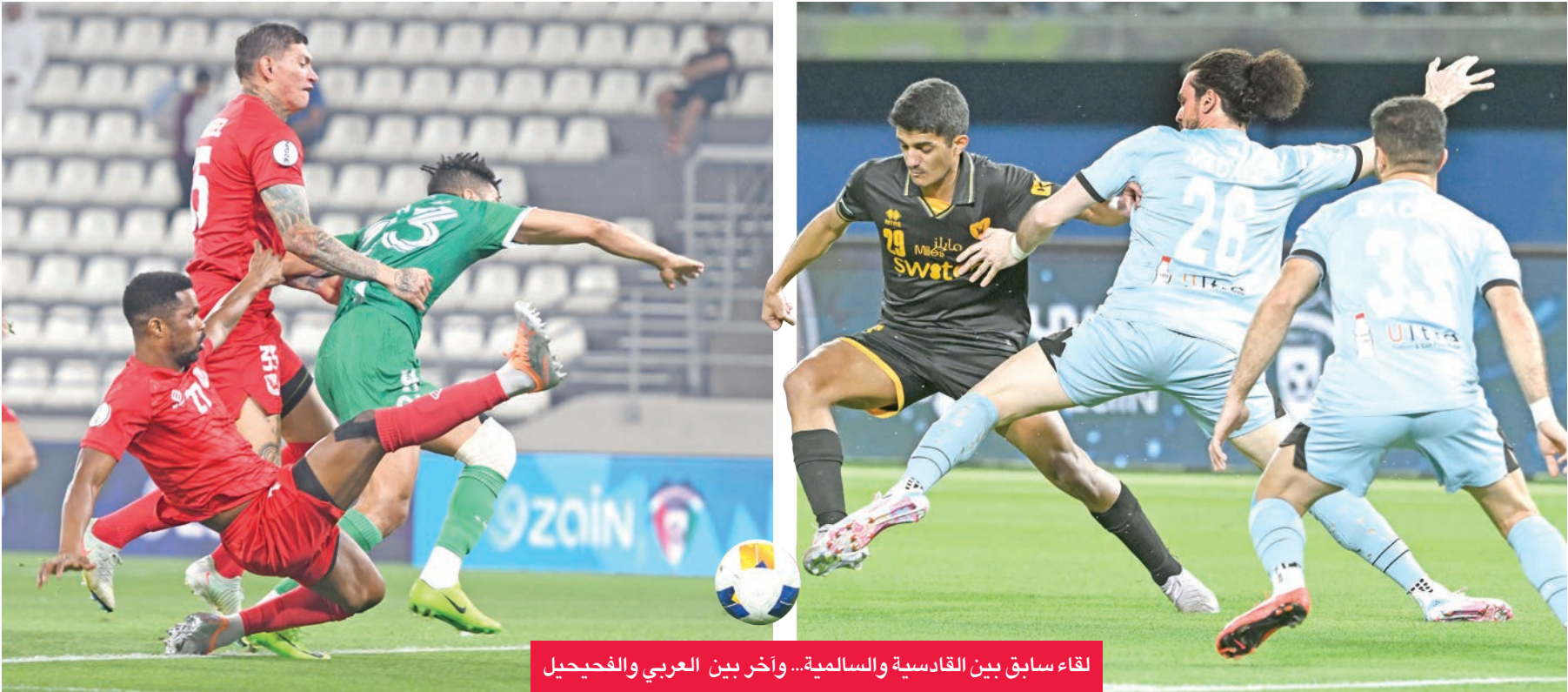
لقاء سابق بين القادسية والسالمية... وآخر بين العربي والفحجيل