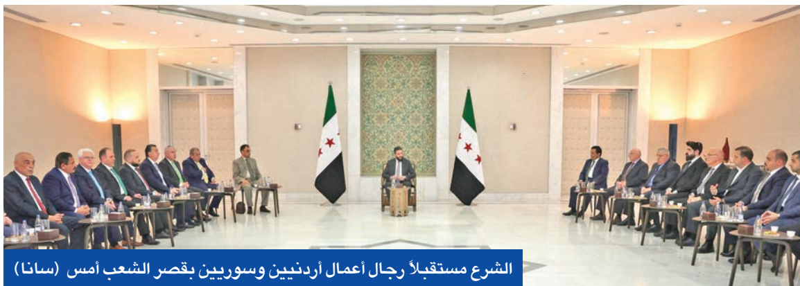
الشرع مستقبلاً رجال أعمال أردنيين وسوريين بقصر الشعب أمس (سانا)

على التزام حكومته بالحفاظ على السلام في الساحل، ومحاسبة المسؤولين عن الجرائم. وأشار إلى التحديات المرتبطة بإعادة بناء المؤسسة العسكرية، موضحاً أن بضعة أشهر ليست كافية لبناء جيش كفو لدولة بحجم سورية، ومؤكداً أن الأمر يشكل تحدياً هائلاً، وسيستغرق بعض الوقت.