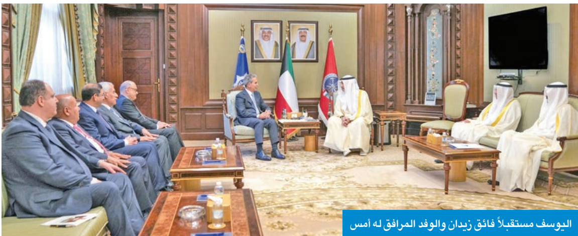
اليوسف مستقبلاً فائق زيدان والوفد المرافق له أمس

استقبل رئيس مجلس الوزراء بالإنابة الشيخ فهد اليوسف، بحضور رئيس المجلس الأعلى للقضاء رئيس محكمة التمييز المستشار، د. عادل بورسلي، في قصر بيان، أمس، رئيس مجلس القضاء الأعلى في جمهورية العراق