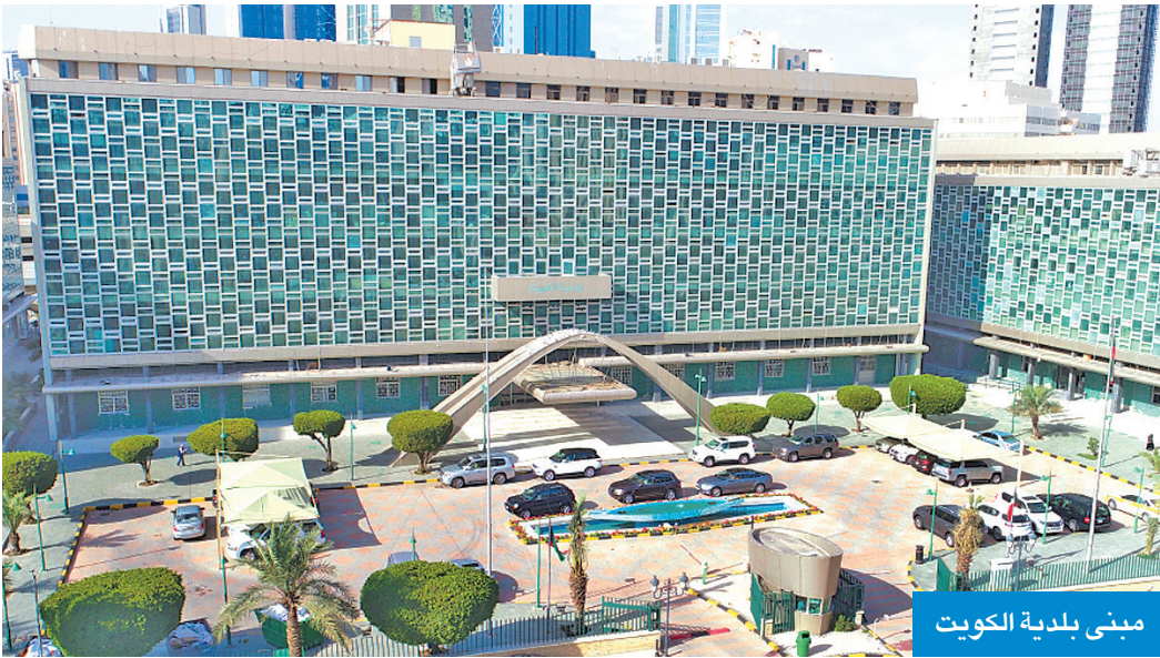
مبنى بلدية الكويت