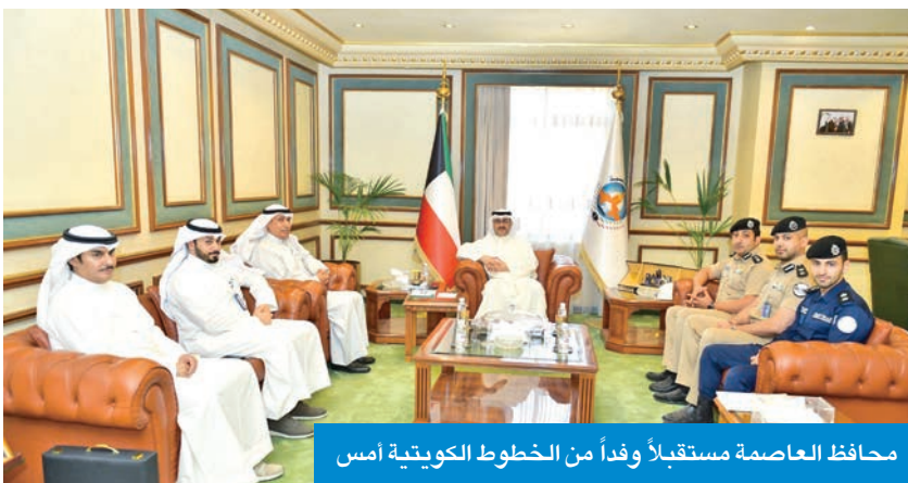
محافظ العاصمة مستقبلاً وفد من الخطوط الكويتية أمس

وتناول اللقاء مناقشة عدد من الموضوعات المتعلقة بتعزيز التعاون