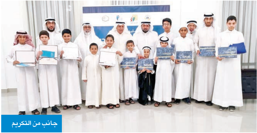
جانب من التكريم

كُرِّمت الأمانة العامة للأوقاف الفائزين في مسابقة «جائزة الجوائز» لحفظ القرآن الكريم، والتي تقام برعاية «الأمانة»، ووزارة الشؤون الإسلامية، وجمعية البرموك التعاونية، وجمعية التميز الإنساني.