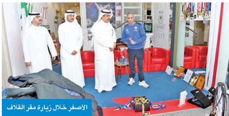
الأصفر خلال زيارة مقر القلاف

الخاص في دعم هذه الفئة من الرياضيين وتمكينهم لتحقيق طموحاتهم، متمنياً له دوام التقدم والنجاح في خدمة وطننا الغالي الكويت.