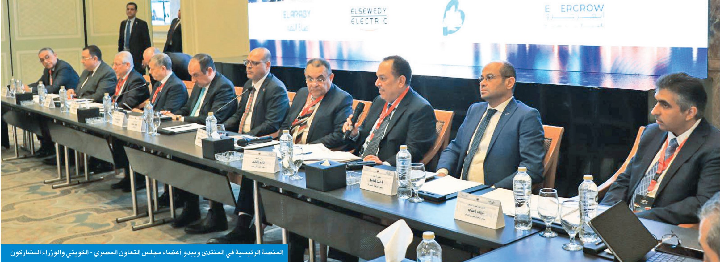
المنصة الرئيسية في المنتدى ويبدو أعضاء مجلس التعاون المصري - الكويتي والوزراء المشاركون

1500 شركة كويتية تستثمر بمصر... والكويت الخامسة بين الدول المستثمرة فيها والثالثة عربياً