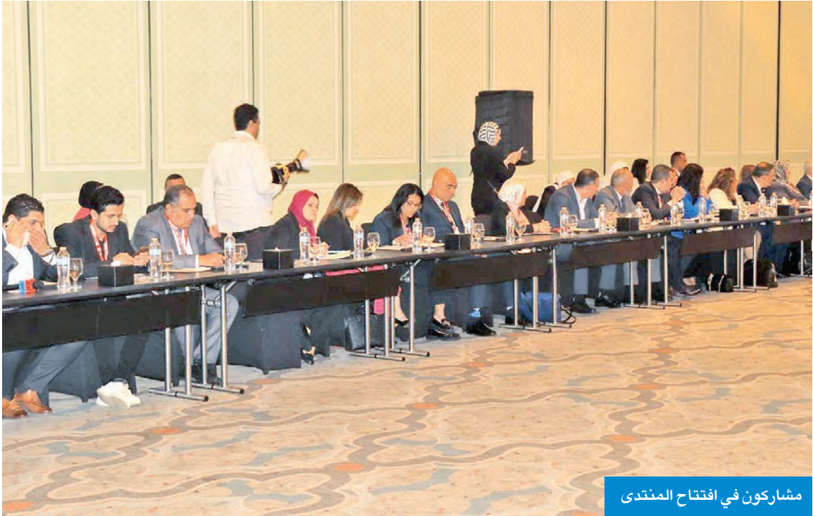
مشاركون في افتتاح المنتدى