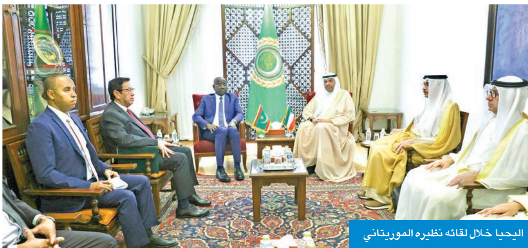
اليحيا خلال لقائه نظيره الموريتاني

التقى بالكوادر الكويتية في الجامعة العربية وثمن جهودهم في عمل المنظمة