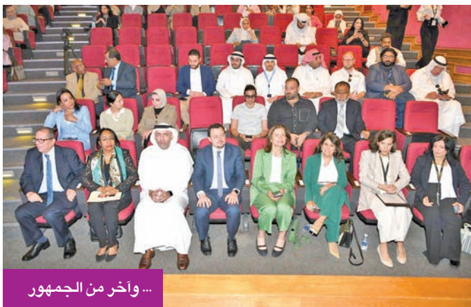
... وآخر من الجمهور

وقالت المنسقة المقيمة للأمم المتحدة غادة حاتم الطاهر مضاي إن «الحدث يعد تعبيراً حياً عن المبادئ المنصوص عليها في اتفاقية اليونسكو لعام 2005 بشأن حماية وتعزيز تنوع أشكال التعبير الثقافي. لا تعزز الصناعات الثقافية والإبداعية النمو الاقتصادي الشامل وتوفّر فرص العمل، لا سيما للشباب والنساء، فحسب، بل تمثل أيضاً روافد قوية للهوية والابتكار والاستدامة، وأضافت أنه «من خلال المشاركة في مشاريع تجمع بين الاستدامة والتراث