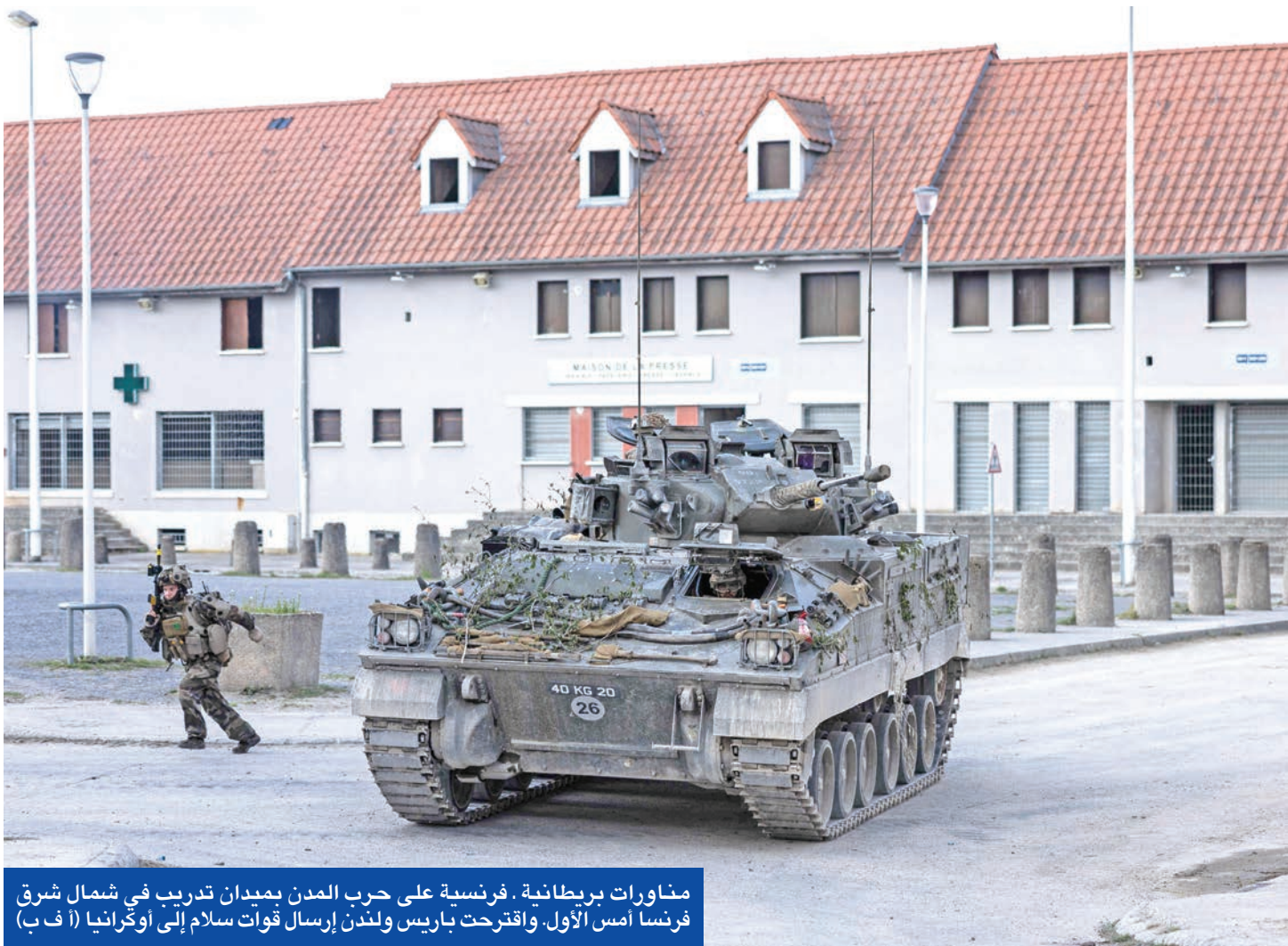
مناورات بريطانية. فرنسية على حرب المدن بمدينة تدريب في شمال شرق فرنسا أمس الأول. واقرحت باريس ولندن إرسال قوات سلام إلى أوكرانيا

ترامب صرح الأسبوع الماضي بأن المفاوضات «تصل إلى نقطة حاسمة»، مشيراً إلى أن بلاده قد «تستحب» إذا لم يتحرك أي من الطرفين نحو السلام، كما صرح وزير خارجيته الأسبوع الماضي بأن واشنطن «ستتخلى عن المحادثات ما لم يتم إحراز تقدم في غضون أيام». وفشلت هدنة توسطت فيها واشنطن في وقف الهجمات على منشآت الطاقة، كما فشلت هدنة أعلنها بوتين في عيد الفصح المسيحي في وقف القتال، في حين اقترحت كييف هدنة تشمل جميع المنشآت المدنية، وقالت موسكو إنها تدرس الاقتراح.