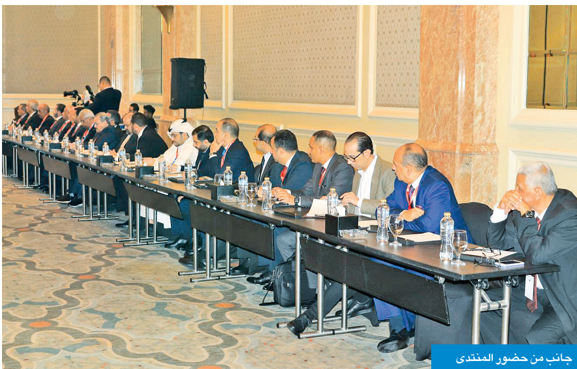
جانب من حضور المنتدى

واستعرضت أيضاً مجموعة من المشروعات المميزة، منها مشروع إنتاج «جنوط» السيارات بتكلفة متوقعة 150 مليون دولار، وإنشاء مصنع جديد لرفاقق الألومنيوم بتكلفة