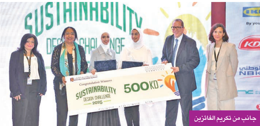
جانب من تكريم الفائزين