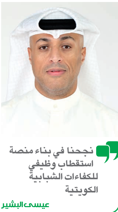
نجحنا في بناء منصة استقطاب وظيفي للكفاءات الشبابية الكويتية

● جلسات تعريفية بثقافة الشركة وقيمها. ● تدريبات فنية ومهنية حسب التخصص. ● ورش عمل لتعزيز المهارات القيادية والتواصلية. ● برامج إرشادية يشرف عليها قياديون من داخل الشركة. وتستعد Ooredoo لإطلاق مبادرات إضافية خلال النصف الثاني من العام الجاري، أبرزها: ● برنامج Ooredoo للخريجين الجدد. ● شراكات تدريبية مع الجامعات والمعاهد في الكويت. ● منصات تقييم ذكية للمرشحين تعتمد على الذكاء الاصطناعي.