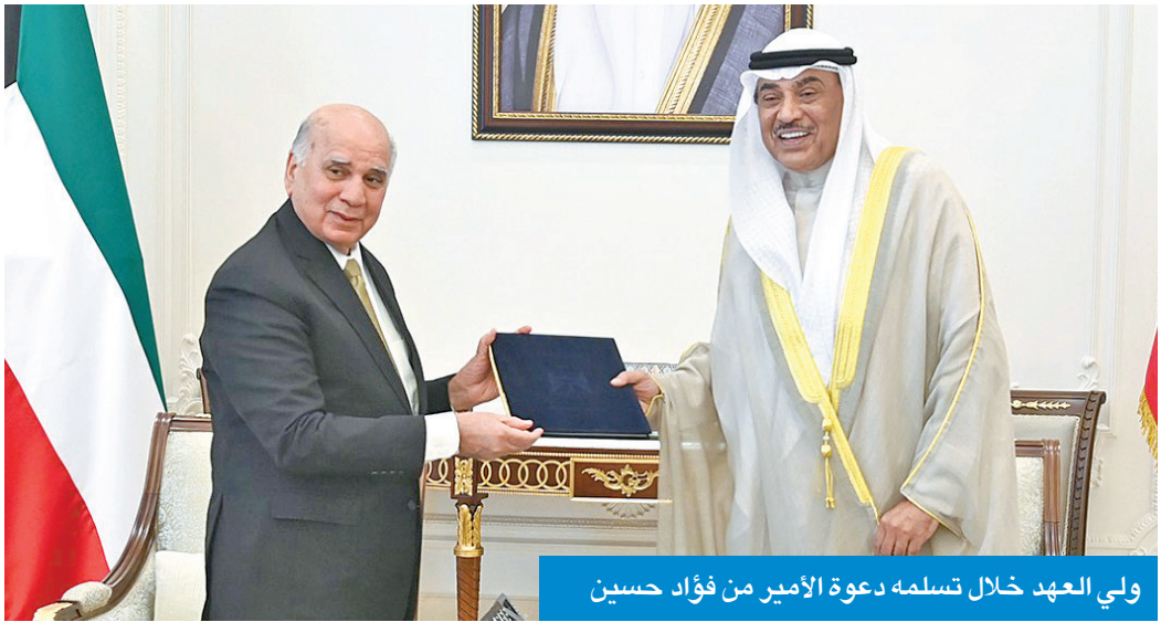
ولي العهد خلال تسلمه دعوة الأمير من فؤاد حسين

تسلم سمو ولي العهد الشيخ صباح الخالد، في قصر بيان، صباح أمس، الدعوة الموجهة إلى صاحب السمو أمير البلاد الشيخ مشعل الأحمد، من أخيه رئيس جمهورية العراق عبد اللطيف رشيد، لحضور سموه أعمال مؤتمر القمة العربية بدورتها العادية الـ34، ومؤتمر القمة العربية التنموية الاقتصادية والاجتماعية بدورتها الخامسة، والذين تستضيفهما العاصمة بغداد 17 مايو المقبل.