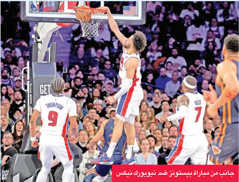
جانب من مباراة بيستونز ضد نيويورك نيكس

أوقف ديترويت بيستونز سلسلة هزائمه القياسية في الأدوار الإقصائية والبالغة 15 مباراة، بفوزه على مضيقة نيويورك نيكس 100 - 94 أمس الأول، فعادلة في سلسلة الدور الأول من «البلاي أوف» في دوري كرة السلة الأميركي للمحترفين.