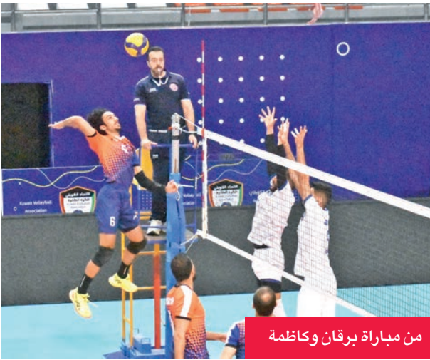
من مباراة برقان وكازمة

وقدّم برقان أداءً مميزاً، حيث فرض سيطرته منذ بداية اللقاء، بفضل دفاعه القوي عن المنطقة الخلفية، إضافة إلى الضربات الساحقة الفعالة من طرفي الشبكة ومن منتصفها.