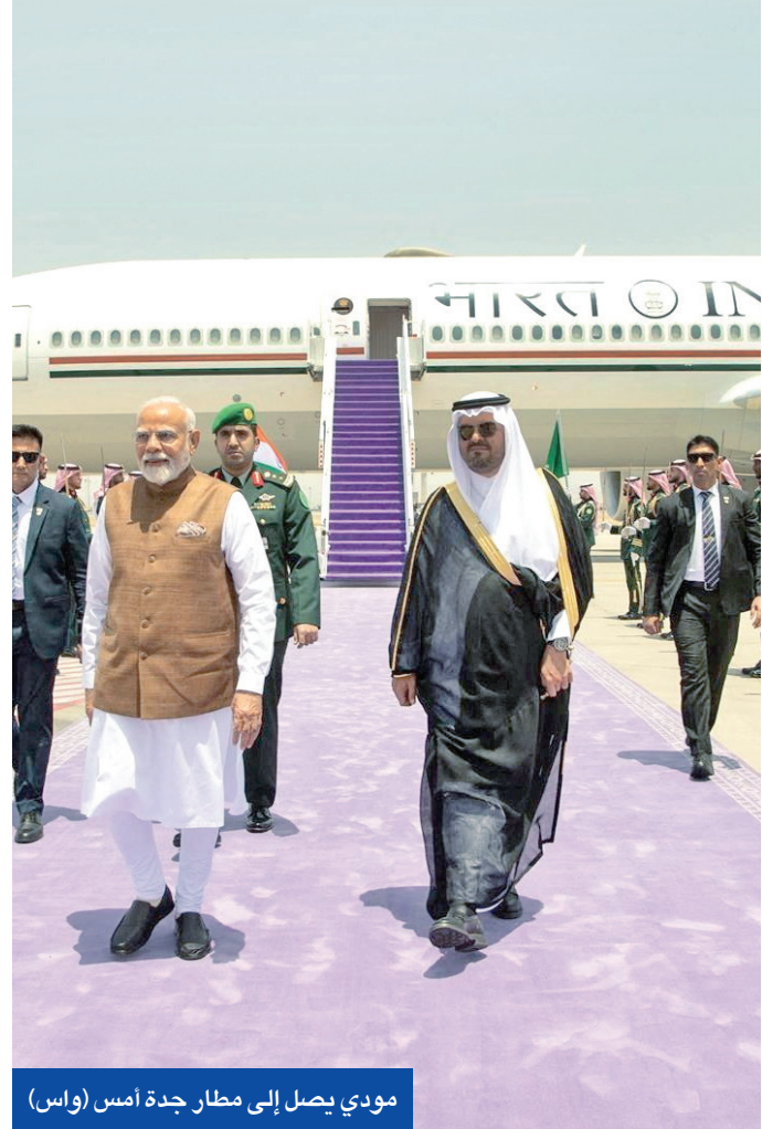
مودي يصل إلى مطار جدة أمس

أجرى رئيس الوزراء الهندي ناريندرا مودي، أمس، زيارة إلى مدينة جدة في المملكة العربية السعودية في إطار زيارة رسمية تستمر يومين، هي الثالثة له كرئيس وزراء، إلى المملكة، حيث سيسعى لتعزيز علاقات بلاده الاقتصادية والدفاعية مع الرياض. تأتي هذه الزيارة عادة إجراء مودي محادثات رفيعة المستوى مع نائب الرئيس الأميركي جاي دي فانس في الهند، حيث تسعى نيودلهي إلى إبرام اتفاقية تجارية مع واشنطن وتجنب فرض رسوم جمركية عقابية، وقبل زيارة الرئيس الأميركي دونالد ترامب المملكة منتصف الشهر المقبل في أول محطة خارجية له. وقال مودي الذي تجمعته علاقات مميزة مع ترامب في مقابلة مع صحيفة «عرب نيوز» السعودية الناطقة بالإنكليزية، إن الهند والسعودية تدرسان مشروعات مشتركة في المصافي والبتروكيماويات، مريحاً بـ «الاستثمارات السعودية في قطاع الصناعات التحولية الدفاعية في الهند الذي ظل مفتوحاً أمام الاستثمارات الخاصة»، ومشيراً إلى «العمل على دراسات الجدوى لربط شبكة الكهرباء بين الهند والسعودية والمنطقة على نطاق أوسع». ونشر مودي على حسابه على منصة «إكس» صوراً تظهر وصوله إلى مطار جدة حيث كان في استقباله نائب امير منطقة مكة الأمير سعود بن مشعل آل سعود وعدد من المسؤولين السعوديين. وأعلن مكتب مودي، في بيان نشر قبل الزيارة: «تقدر الهند بشدة علاقاتها الطويلة والتاريخية