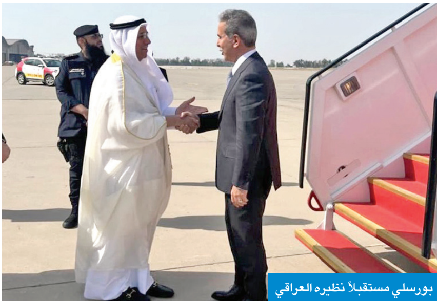
بورسلي مستقبلاً نظيره العراقي

استقبل رئيس المجلس الأعلى للقضاء المستشار د. عادل بورسلي، أمس، رئيس المجلس الأعلى للقضاء في جمهورية العراق د. فائق زيدان خلال زيارته للكويت.