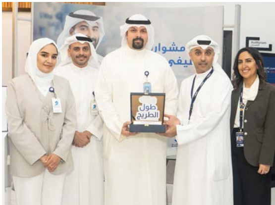
فريق البنك يتسلم درعاً تكريمية من الكلية

وإدارة الأعمال تتماشى مع الاحتياجات المتزايدة لدى «برقان» في استقطاب كفاءات مهنية وأعدة لديها المهارات اللازمة لدعم استراتيجيته المتطورة للتحوّل الرقمي، والتبني المبكر لأحدث التقنيات المالية والأطر التشغيلية وأنظمة الأمن. وأشار إلى أن نجاح «برقان» في الحفاظ على معدل نمو تنافسي ومواكبة أحدث التوجهات المصرفية