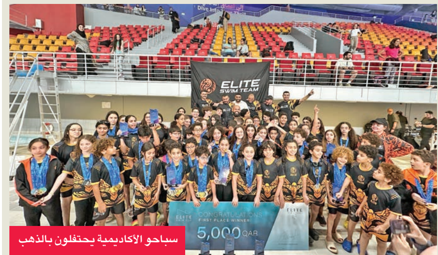
سباحو الأكاديمية يحتفلون بالذهب