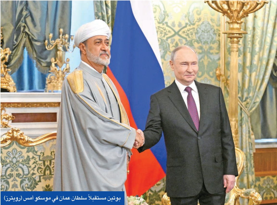
بوتين مستقبلاً سلطان عمان في موسكو أمس

وهنا بصر الأميركيون على ضرورة إرساله إلى خارج إيران، في حين تريد طهران الاحتفاظ به بإشراف الوكالة الدولية للطاقة الذرية التابعة للأمم المتحدة كضمانة ضد تهديدات إسرائيل واحتمالات عدم التزام واشنطن بتعهداتها برفع كل العقوبات. ويقول المصدر إن طهران تحفظت حتى الآن عن مقترح أميركي بأن يسلم اليورانيوم العالي التخصيب إلى روسيا مع ضمانات روسية لطهران تتعلق بالالتزام واشنطن بالاتفاق. ويتخوف بعض الإيرانيين من سيناريو أوكرانيا، التي سلمت كل أسلحتها النووية مقابل ضمانات أمنية من جانب واشنطن وموسكو فيما يعرف بـ «مذكرة بودابست» لكن عندما اختلف الأميركيون والروس دفعت كيف الثمن ولم تنفعها تلك الضمانات. ثالثاً - آلية تفتيش البرنامج النووي الإيراني، وإي منشآت من الممكن أن يشملها، وعدد جولات التفتيش ومهلة إبلاغ طهران مسبقاً. كما يصير