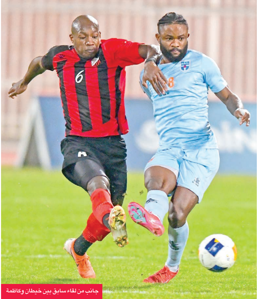
جانب من لقاء سابق بين خيطان وكازمة

اليرموك الأخيرة في انطلاق مجموعة الهبوط العديد من علامات الاستفهام على الفريق، خصوصاً أن الفريق لا يعاني أي ضغوط، بعد أن ضمن البقاء في البطولة، وهو أمر يسال عنه مدربه اليوسني روسمير سفيكو!