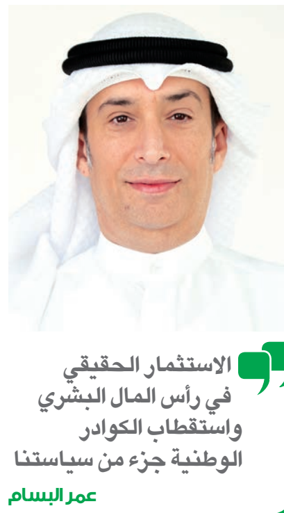
الاستثمار الحقيقي في رأس المال البشري واستقطاب الكوادر الوطنية جزء من سياستنا