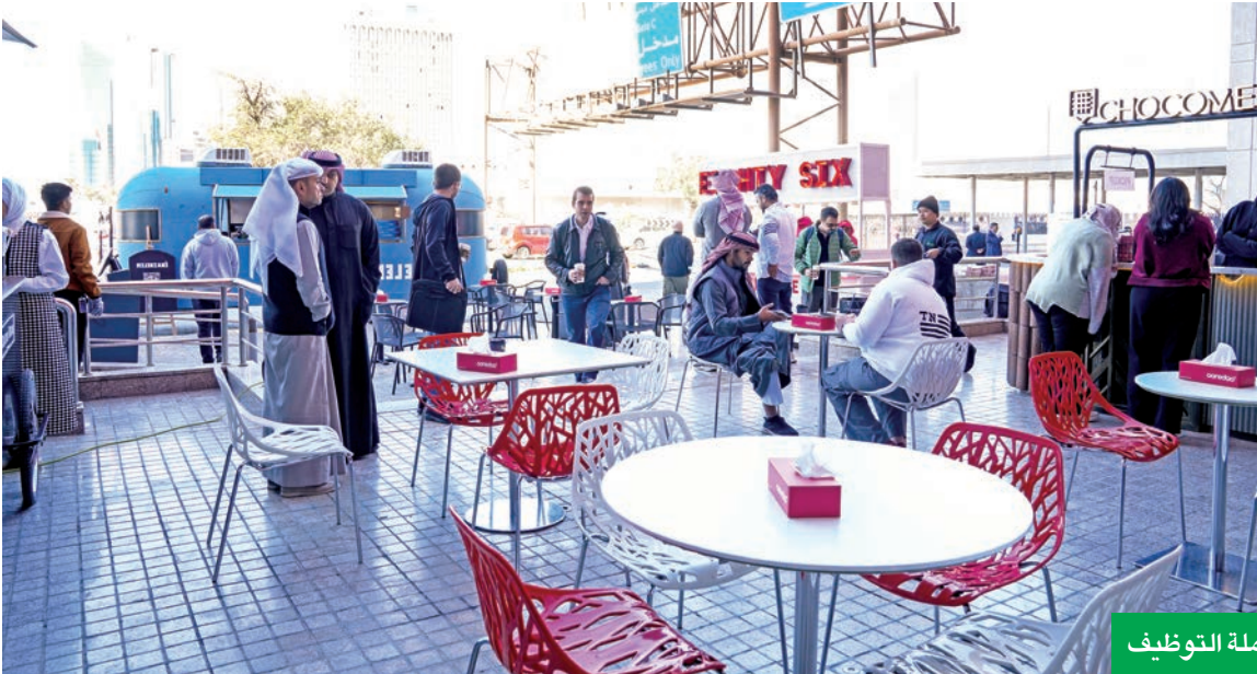
لقطات من حملة التوظيف

أطلقت حملة توظيف قابلت فيها أكثر من 300 شخص من أصل 1000 متقدم