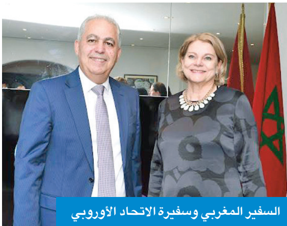
السفير المغربي وسفيرة الاتحاد الأوروبي