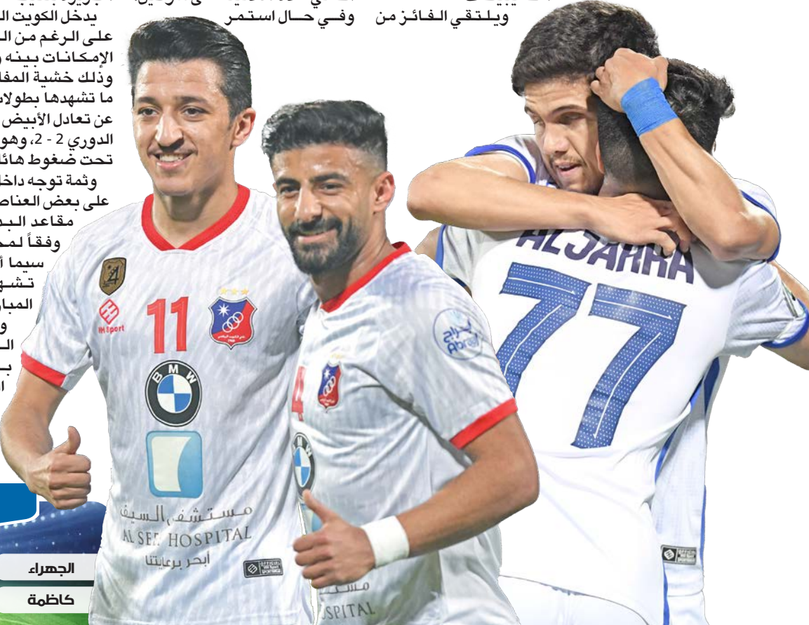
لاعب الجھراء ولاعبا الكويت يحتفلون في لقاء سابق

ومن المؤكد أن مباراة كازمة وخيطان خارج نطاق التوقعات تماماً، وقد تظل نتيجتها معلقة حتى صافرة الحكم الأخيرة. وتضع خسارة كازمة أمام