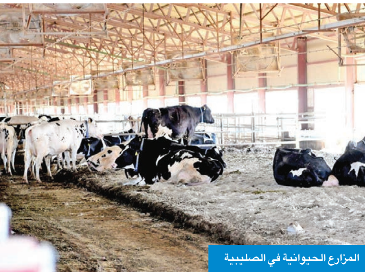
المزارع الحيوانية في الصليبية

● منع حركة الحيوانات من السوق وإليه حتى إشعار آخر