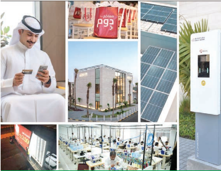
جانب من مبادرات البنك المتنوعة لترسيخ الاستدامة البيئية

ويؤكد بنك الخليج، من خلال تلك المبادرات وغيرها الكثير، أن الاستدامة ليست مجرد شعار، بل هي نهج راسخ ومتكامل يلتزم به في جميع أنشطته، سعياً منه نحو بناء مستقبل أفضل للأجيال القادمة.