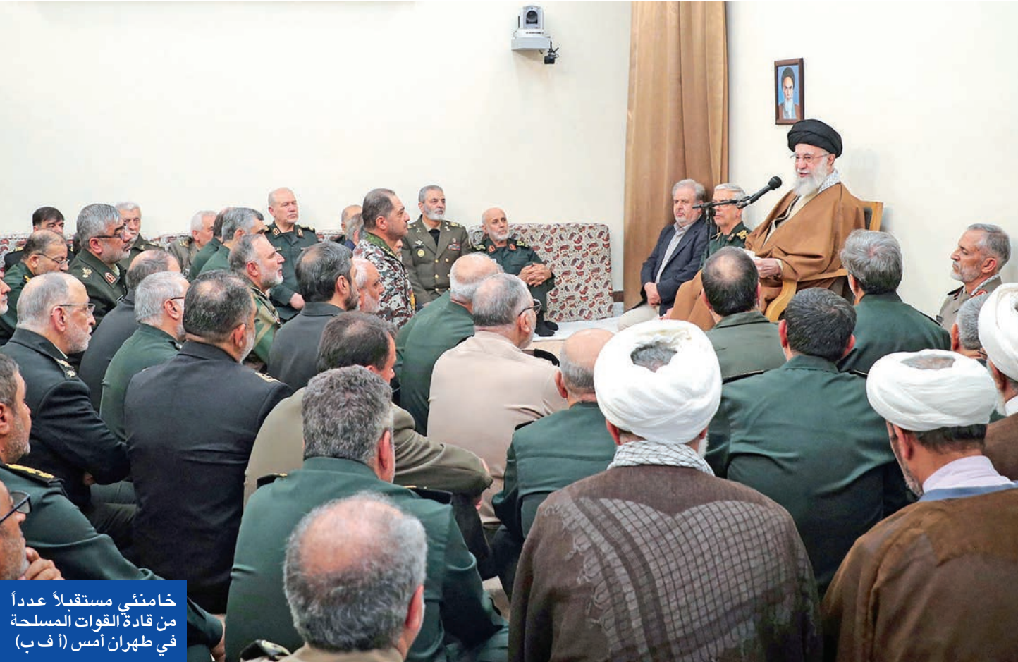
خامنئي مستقبلاً عدداً من قادة القوات المسلحة في طهران أمس (أ ف ب)

شيء يهم حتى ننتهي من المحادثات، لذلك لا أحبذ الحديث عنها. الوضع المتعلق بإيران جيد».