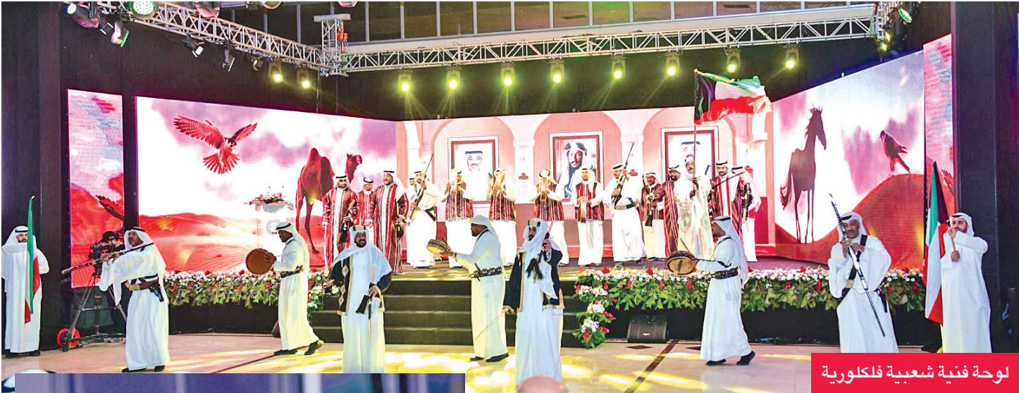
لوحة فنية شعبية فلكلورية