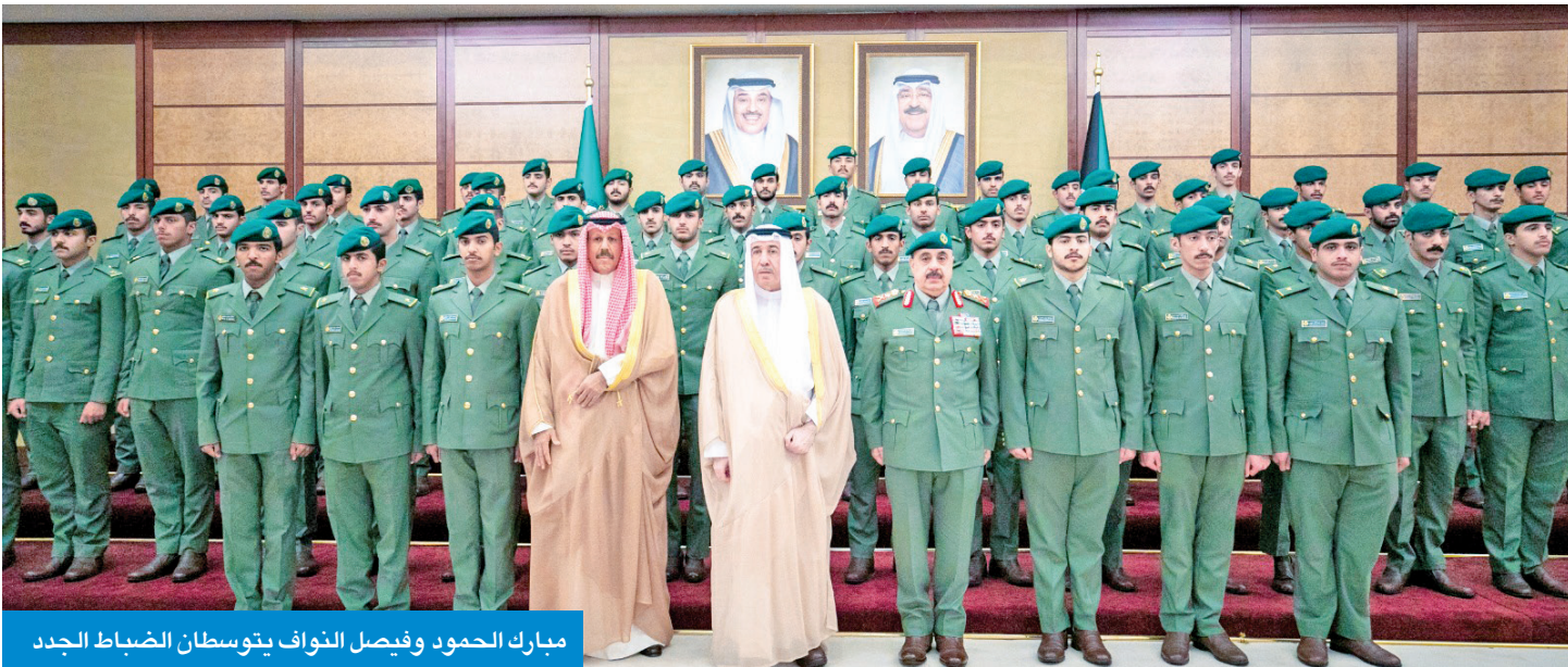
مبارك الحمود و فيصل النواف يتوسطن الضباط الجدد

احتفل الحرس الوطني بتولية 63 ضابطاً من خريجي كلية علي الصباح العسكرية وأكاديمية سعد العبدالله للعلوم الأمنية، تحت رعاية وحضور رئيس الحرس الشيخ مبارك الحمود ونائب رئيس الحرس الشيخ فيصل النواف، ووكيل الحرس الفريق الركن مهندس هاشم الرفاعي و كبار القادة والضباط.