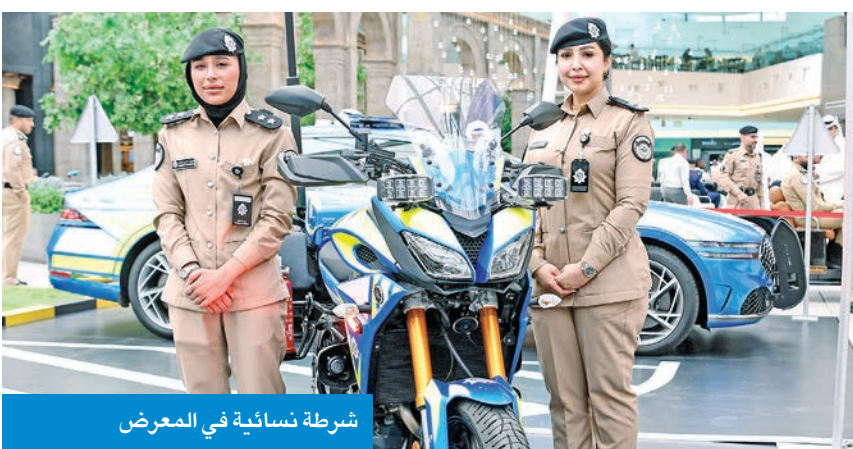
شرطة نسائية في المعرض

وقال: «اليوم نحن على اعتاب مرحلة جديدة تتمثل في تفعيل قانون المرور بتدريعاته الجديدة، والتي نطمح من خلالها إلى رفع مستوى الوعي لدى مستخدمي الطريق، وتقليل نسب الحوادث والإصابات والوفيات، وذلك باستخدام كل الوسائل التكنولوجية المتاحة والاستفادة من التطور الرقمي في جميع الخدمات والمجالات الميدانية، وتوجيه الفودري بالشكر لجميع العاملين في الإدارة العامة للمرور، واللجنة المنظمة لفعاليات أسبوع المرور الخليجي الموحد لدول مجلس التعاون تحت شعار قيادة بدون هاتف، وإلى الشركات المساهمة ووسائل الإعلام في إنجاح هذا الأسبوع على دعمها المستمر لهذه الفعالية طوال أيام العام.