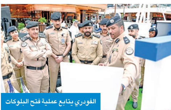
الفودري يتابع عملية فتح البلوكات

«قيادة.. بدون هاتف»، بهدف نشر الوعي المروري، وتعزيز ثقافة الالتزام بقواعد السير، وحماية للأرواح والممتلكات، وترسيخاً للسلوك المروري الآمن العام، والذي يُقام تحت شعار