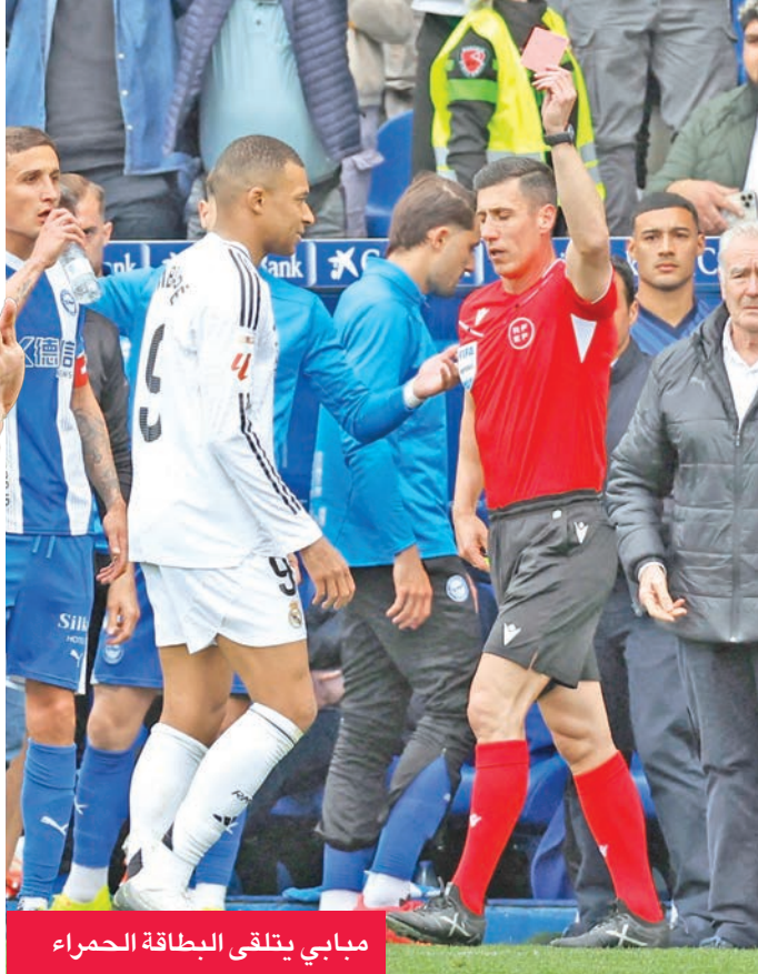
مبابي يتلقى البطاقة الحمراء

في المقابل تجمد رصيد الأفيس عند 30 نقطة في المركز 17.