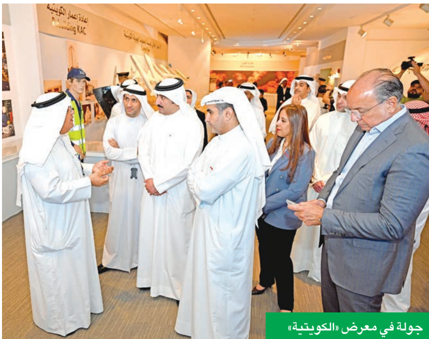
جولة في معرض «الكويتية»

أثبتنا قدرتنا على دمج التكنولوجيا بالإعلام لإنتاج نموذج وطني يُحتذى بالبابطين