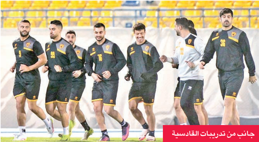
جانب من تدريبات القادسية