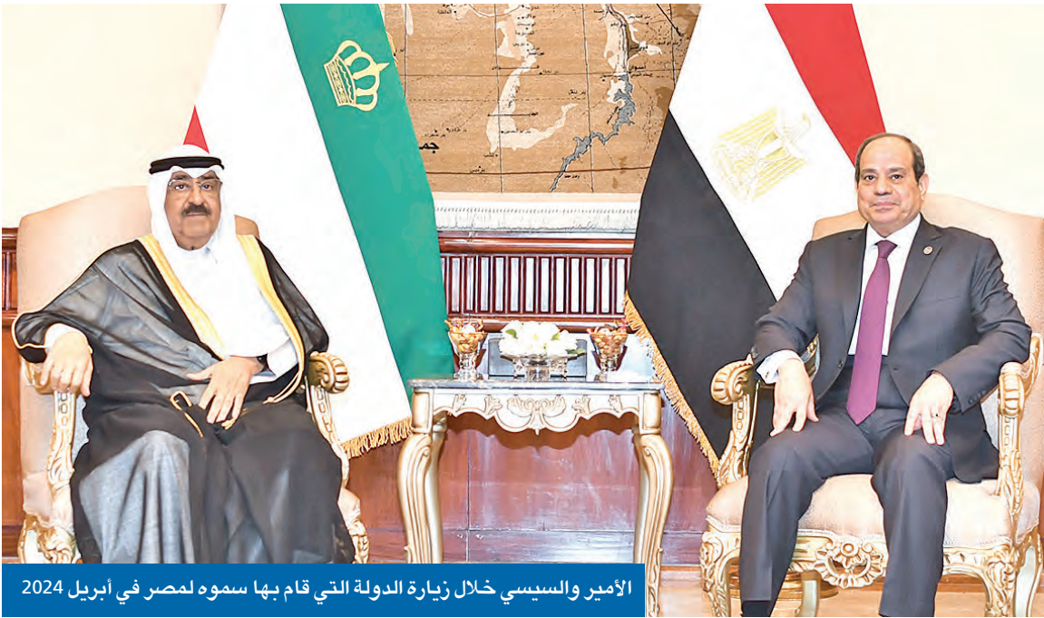
الأمير والسيسي خلال زيارة الدولة التي قام بها سموه لمصر في أبريل 2024

زيارة الأمير إلى مصر في أبريل الماضي رسخت مرحلة جديدة وتاريخية من العلاقات بين البلدين