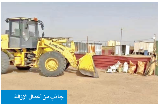
جانب من أعمال الإزالة

كشفت بلدية الكويت عن تلقي 895 شكوى وبلاغاً من جميع المحافظات خلال مارس الماضي في إحصائية لها حول نوع البلاغات والشكاوى إن أغليبتها تتعلق بوجود مخلفات قمامة، وأثاث مستعمل، وسكن عزاب، رمي دفان وانقاض، وسقوط أشجار وأعمدة، فضلاً عن مخلفات وتجمع كتيان رملية ومياه امطار وشكاوى عن