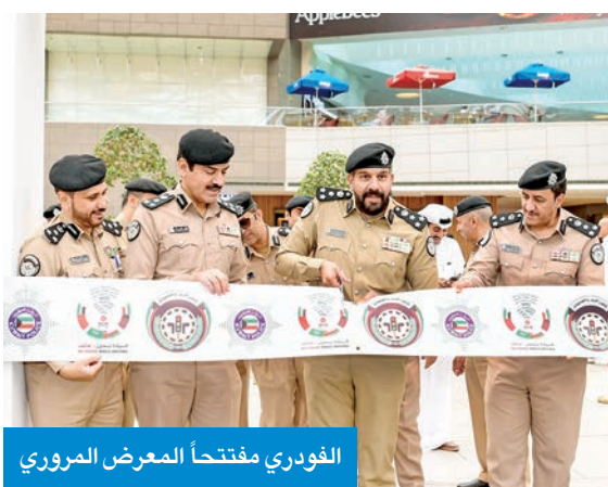
الفودري مفتتحاً المعرض المروري

وتتقدم النواف بالشكر والتقدير إلى جميع الجهات المشاركة والداعمة لهذه