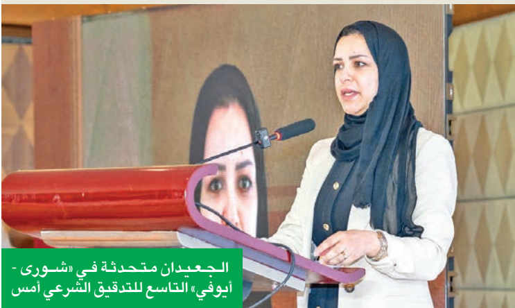
الجيّدان متحدثاً في «شورى - أيوفي» التاسع للتدقيق الشرعي أمس

«نولي اهتماماً بالغاً بتعزيز البيئة التنظيمية والرقابية للشركات العاملة بأحكام الشريعة»