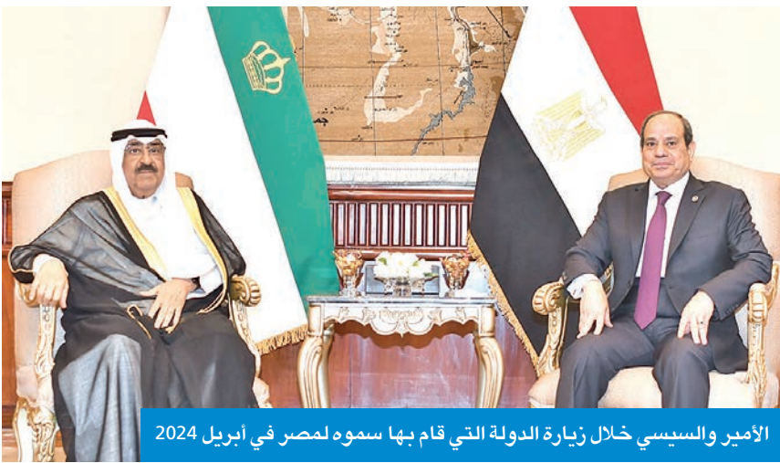
الأمير والسيسي خلال زيارة الدولة التي قام بها سموه لمصر في أبريل 2024

سياسة حكيمة وأشاد بالسياسة الحكيمة التي انتهجها حكام دولة الكويت