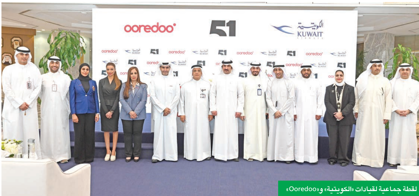
لقطة جماعية لقيادات «الكويتية» وOoredoo