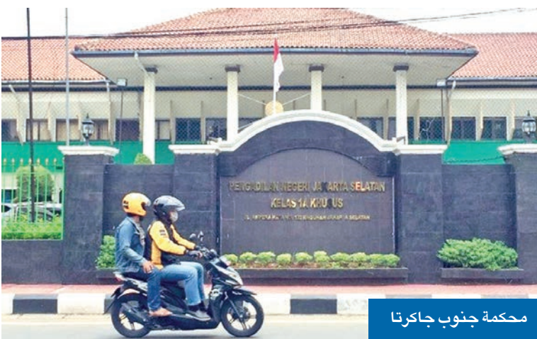
محكمة جنوب جاكرتا

وذكر بيان الادعاء العام أن اللجنة خلصت إلى أن «ويلمار»، ومجموعة