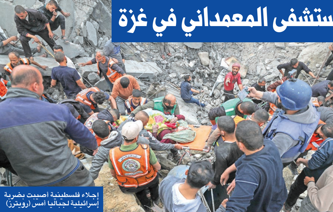
إجلاء فلسطينية أصيبت بضربة إسرائيلية لجبالا أمس

مع الحكومة مكة «تتعامل جاذبية مع قاعدة إنهاء المعادية» فخ تحوّل إلى «عملية» استئناف شأن بائير، الاحداث جوماً اثنى المانويل