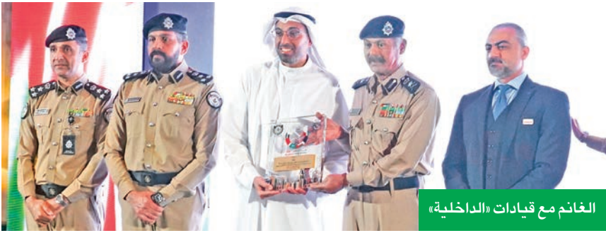
الغانم مع قيادات «الداخلية»

الأمنة، والالتزام بالقوانين المرورية، وتثقيف مستخدمي الطريق، في خطوة لتعزيز السلوكيات الإيجابية وتحسين التجربة المرورية بشكل عام.