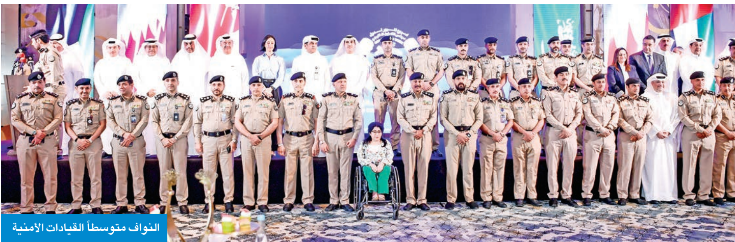
النواف متوسط القيادات الأمنية

الفودري: نطمح إلى رفع مستوى الوعي لدى مستخدمي الطريق وتقليل الحوادث والوفيات