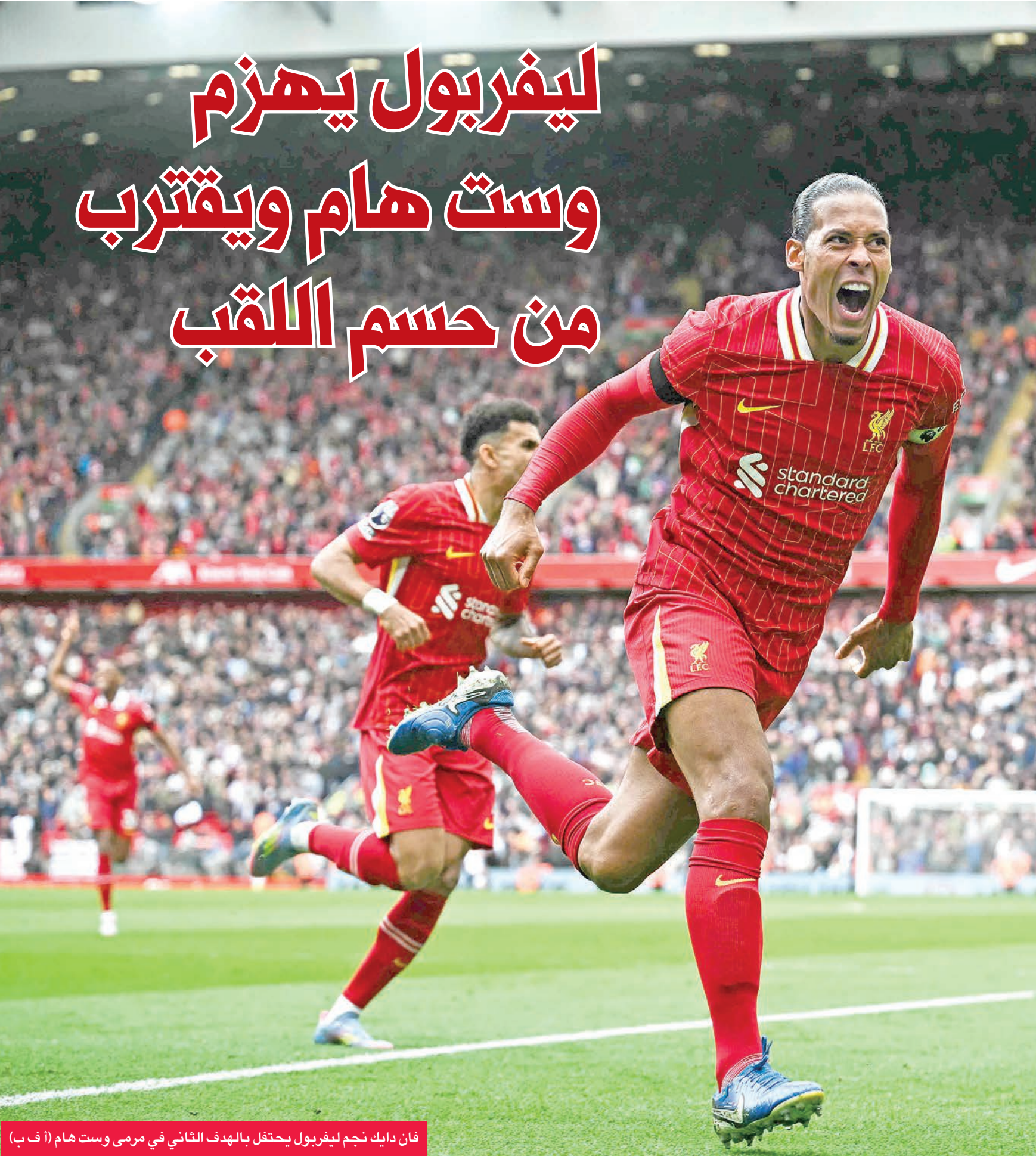
فان دايك نجم ليفربول يحتفل بالهدف الثاني في مرمى وست هام

وذكر إنزاعي: «سنخوض مواجهة بايرن ميونخ بكثير من الثقة، واضعين في اعتبارنا أننا نواجه خصماً قوياً جداً. علينا أن نقدم مباراة كبيرة، وبتصميم كبير».