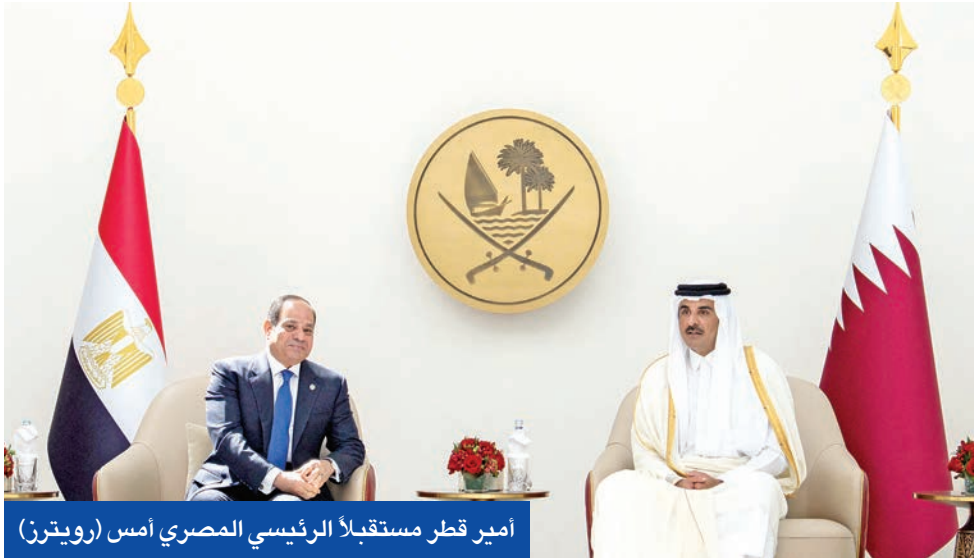
أمير قطر مستقبلاً الرئيس المصري أمس

في مسند الكويت، ام عبدالفتاح الشيخ تميم العلاقات الذ التطورات ا بالأوضاع ا وأفاد الشيخ تميم الرئيس الم المراقب لل الدولي في وقال ال الرئاسة ال في بيان،