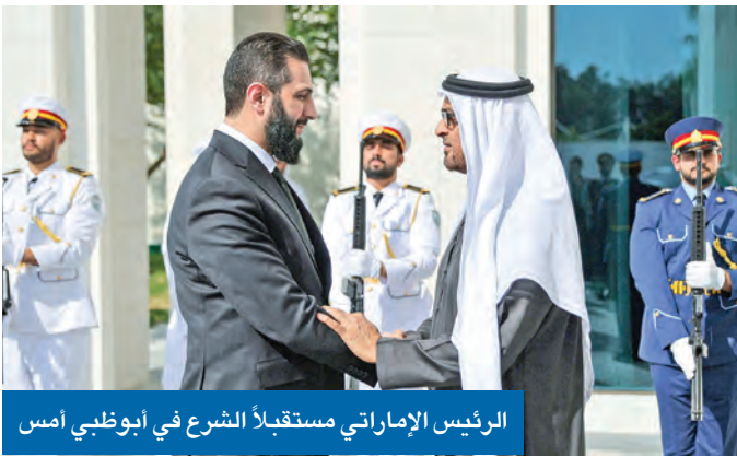
الرئيس الإماراتي مستقبلاً الشرع في أبوظبي أمس

رئيس الحكومة اللبنانية يزور دمشق اليوم لدفع الملفات العالقة