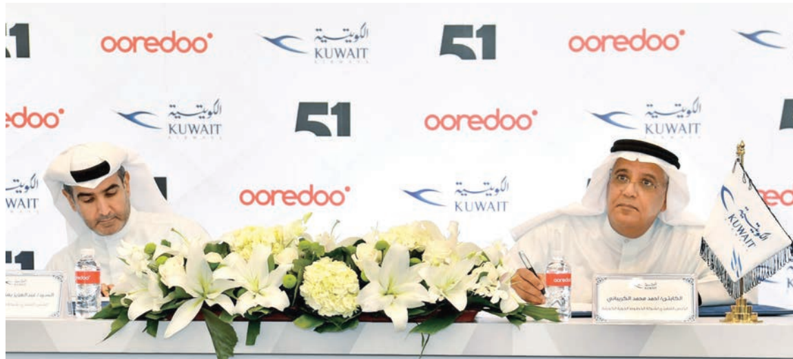
الكابتن أحمد الكريباتي وعبدالعزیز البابطين خلال توقيع الاتفاقية