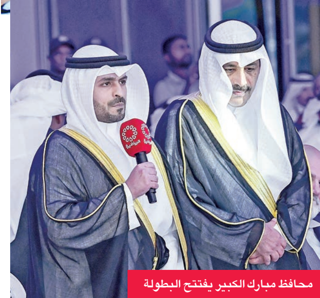
محافظ مبارك الكبير يفتتح البطولة

الإدارة بالنهوض برياضة الرماية في المنطقة عبر تنظيم اهم الملتقيات الدولية والقارية والإقليمية واستضافة الدورات الفنية المتخصصة للكوادر الفنية والتحكيمية والتنظيمية، متمنيا دوام التطور والازدهار لرياضة الرماية الكويتية. وتضمن حفل الافتتاح الذي شهد حضور ايضا عدد من المسؤولين الرياضيين وسفراء الدول المشاركة وأعضاء الوفود المشاركة ومجلس ادارة النادي استعراض طابور العرض للمنتخبات المشاركة اضافة الى تقديم فيلم قصير تناول تاريخ البطولة ودورها المهم في تطور رياضة الرماية الكويتية وتحقيق الإنجازات الكبيرة في ظل الرعاية الأميرية السامية لها كما تم تقديم لوحة فنية شعبية فلكلورية.