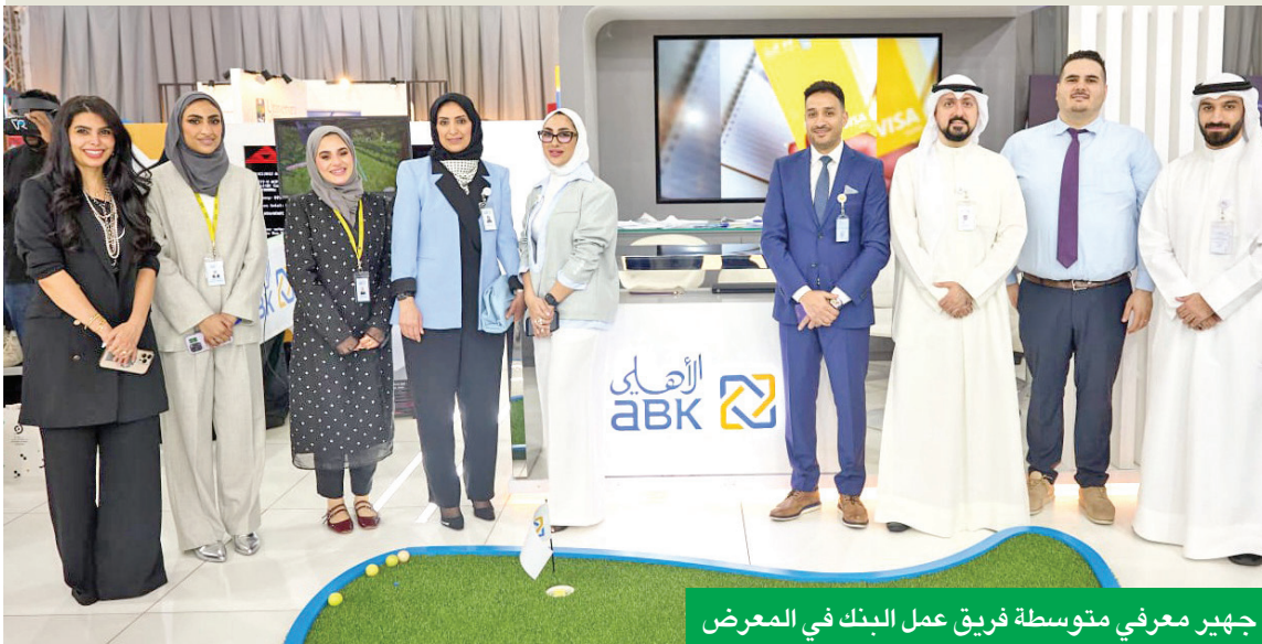
جهير معرفي متوسطة فريق عمل البنك في المعرض

مسبقة الدفع لمدة سنة مجاناً، فضلاً عن العديد من العروض الخاصة والخصومات بالتعاون مع العديد من المتاجر في دولة الكويت.