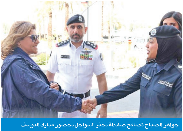
جواهر الصباح تصافح ضابطة بخفر السواحل بحضور مبارك اليوسف

وأوضحت الوزارة أن مساعدة وزير الخارجية اطلعت خلال الزيارة على عرض