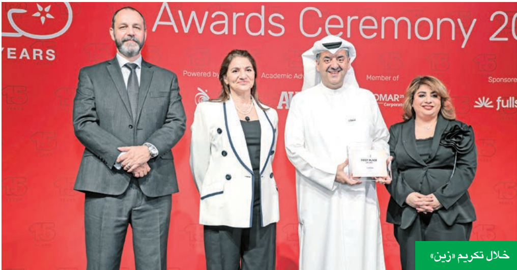
خلال تكريم «زين»

علماً بأن التوجه نحو الدّين العام كخيار استراتيجي يجب أن يراعي بعض المخاطر المحتملة، وأهمها الإتيان إلى إمكانية تراكم الدّين العام إذا لم يُدار بعناية وصفاة اقتصادية، مما قد يجعله عبئاً على الأجيال القادمة، خصوصاً في حال ارتفاع أسعار الفائدة العالمية. لذلك، فإن التوجه نحو الدّين العام يجب أن يكون مدروساً بعناية، بحيث يُستخدم كأداة لتعزيز اليات دعم النمو الاقتصادي. وخاماً، فإن دولة الكويت لا تحتاج أن تستخدم الدّين العام لسد عجز فوري، لكنه قد يكون أداة مفيدة لتعزيز الاستدامة المالية للاقتصاد الكويتي، وتمويل مشاريع تنموية ضخمة، وتقليل الاعتماد على النفط. كما أنّ الاستخدام الحكيم للدّين العام يمكن أن يخلق تحدياً سقفاً واضحاً للالتزامات المالية وخطة تنمية طموحة تشتمل على مشاريع مدرة للدخل وتحسين مستوى الكفاءة الإنتاجية للقطاعات الاقتصادية، حيث يمكن أن تساهم المشاريع المقترحة في دعم الاقتصاد دون مخاطر كبيرة.