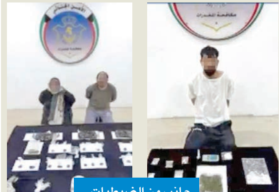
جانب من الضبطيات