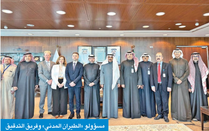
مسؤولو «الطيران المدني» وفريق التدقيق