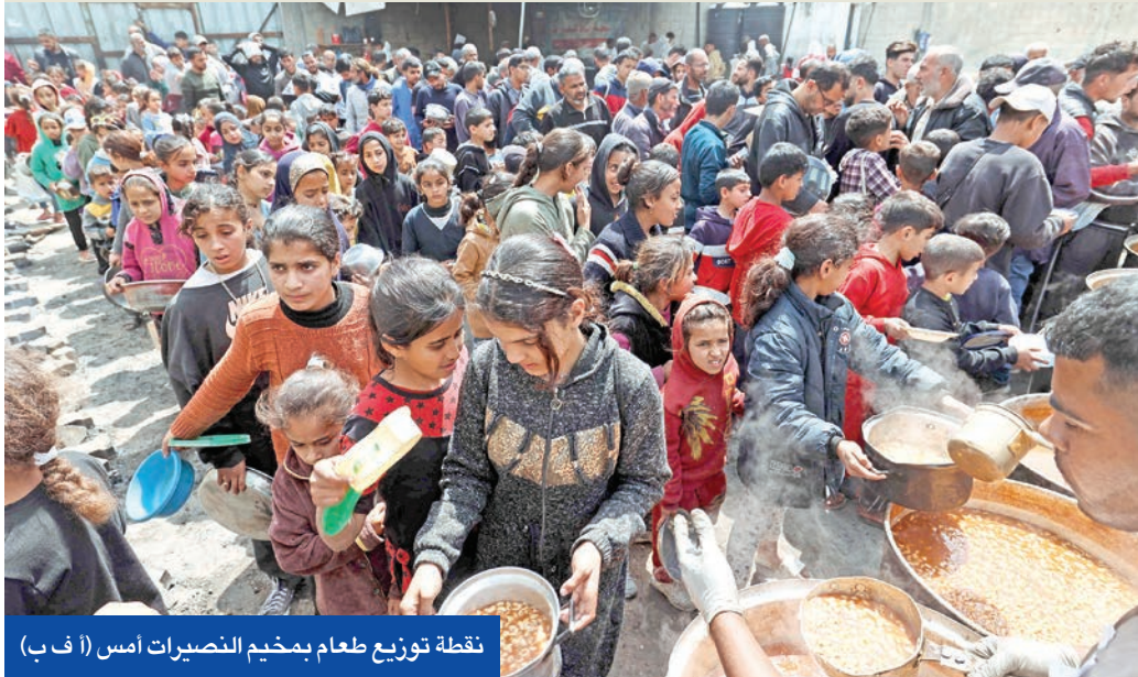
نقطة توزيع طعام بمخيم النصيرات أمس (أ ف ب)

وصل إلى أسوأ مراحله منذ عقود، وحل الدولتين المفقول دولياً تم تجاهله رغم مناقشات استمرت عقوداً بين الأطراف، وعدم تسجيل تقدم نحو تنفيذه يعزز جميع أنواع التطرف والعنف وتكرار نشوب الحرب. وقال البيان: «ندعو لوقف فوري الحرب والإفراج عن المحتجزين، وتوحيد قطاع غزة مع الضفة بما فيها القدس الشرقية تحت حكم السلطة الفلسطينية».