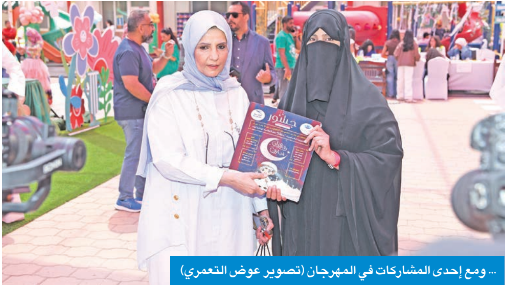
... ومع إحدى المشاركات في المهرجان

• أريج الغانم: نختار سنوياً جهة مختلفة لدعمها... والإعداد والتنظيم بجهود طابقتنا بشكل كبير