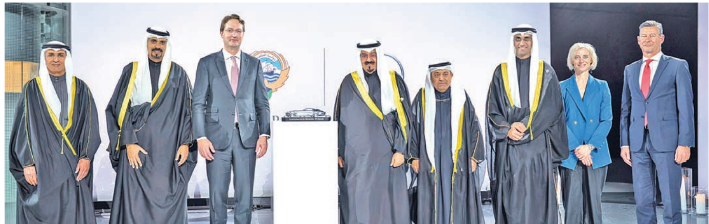
العبدالله وكالينيوس يتوسطان الحضور

الاستثمارية، وحجم التبادل التجاري بين البلدين. بدوره، أعرب رئيس مجلس الإدارة، الرئيس التنفيذي لمجموعة «مرسيدس بنز»، أولا كالينيوس، عن سعادته باستمرار الشراكة بين الكويت ممثلة بالهيئة العامة للاستثمار ومجموعة «مرسيدس بنز» AG، مؤكداً أن المجموعة حققت الكثير من الأهداف الناجحة على مدى السنوات الماضية، وتمتلك طموحاً عالياً في البحث عن الفرص الاستثمارية في المستقبل.