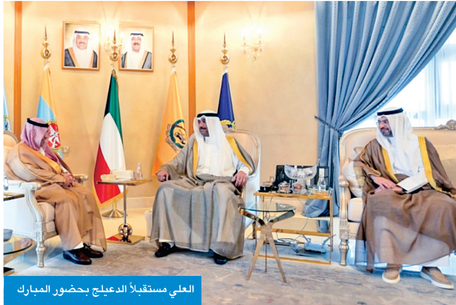
العلي مستقبلاً الدعليج بحضور المبارك

بحث وزير الدفاع وزير الداخلية بالإنابة، الشيخ عبدالله العلي، مع رئيس الهيئة العامة للطيران المدني في السعودية، عبدالعزيز الدعليج، تطوير التعاون الثنائي، وتبادل الخبرات في مجالات الطيران المدني، بما يعكس عمق العلاقات الأخوية بين البلدين الشقيقين. وأعلنت وزارة الدفاع، في بيان لها، أن ذلك جاء خلال استقبال العلي في مكتبه الدعليج، ورئيس الإدارة العامة للطيران المدني الكويتية، الشيخ حمود المبارك، وسفير خادم الحرمين لدى البلاد، الأمير سلطان بن سعد، بمناسبة الزيارة الرسمية لوفد الهيئة العامة للطيران المدني السعودي إلى الكويت. وذكرت أنه تمت أثناء اللقاء مناقشة تطوير التعاون الثنائي وتبادل الخبرات في مجالات الطيران المدني، بما يعكس عمق العلاقات الأخوية التي تجمع بين دولة الكويت والمملكة العربية السعودية، وسبل تعزيز التنسيق المشترك.