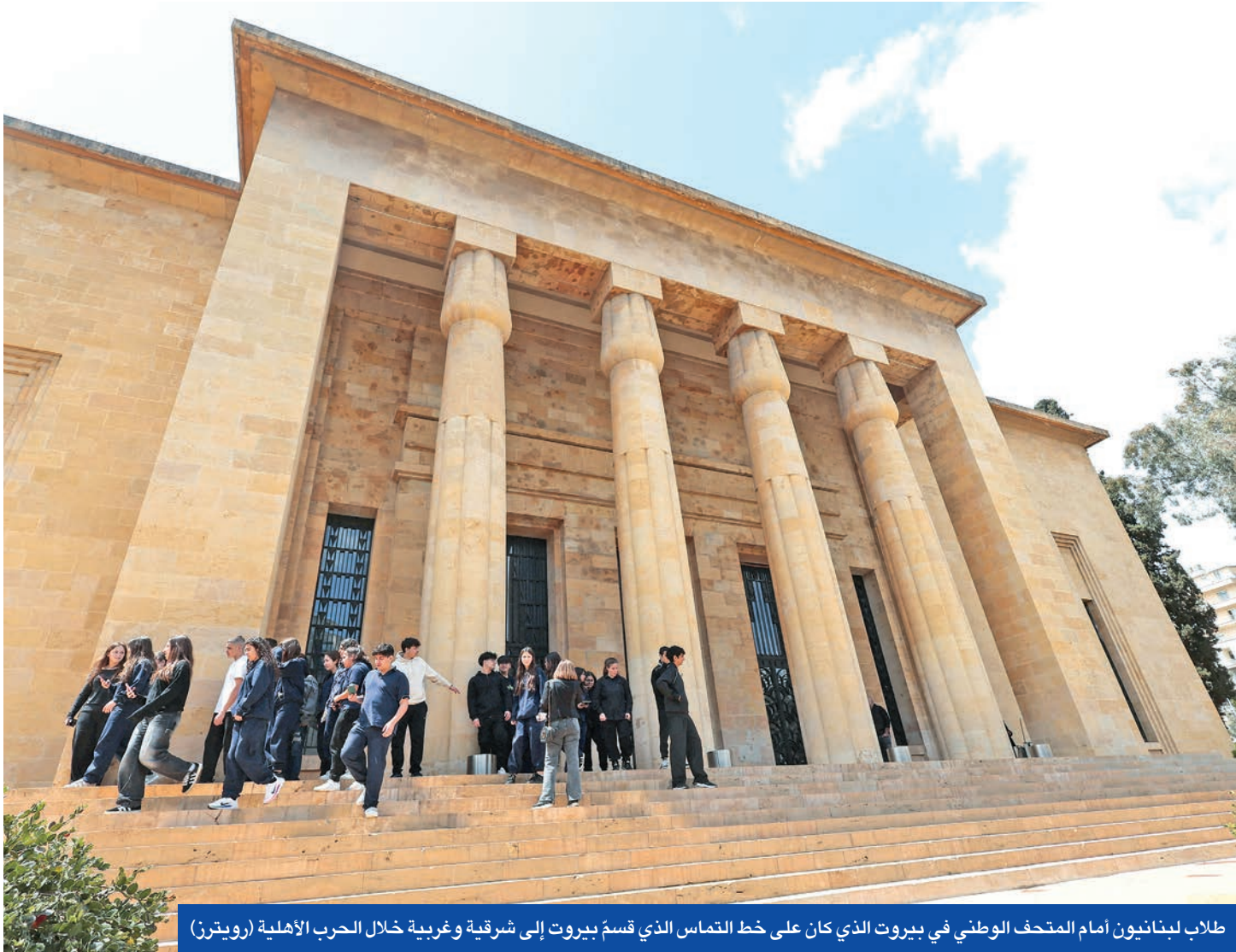
طلاب لبنانيون أمام المتحف الوطني في بيروت الذي كان على خط التماس الذي قسم بيروت إلى شرقية وغربية خلال الحرب الأهلية

يحتفل لبنان اليوم حربيه الأهلية بعد مرور 50 عاماً على اندلاعها في 13 أبريل 1975. لكن الذكرى هذا العام تبدو مختلفة، مع انطلاقة العهد الجديد للرئيس جوزيف عون والمسار الذي تسلكه حكومة نواف سلام، حيث تلوح في الأفق فرصة تاريخية، للمرة الأولى منذ ذلك اليوم المشؤوم، لأن يتعافى لبنان، من وباء الميليشيات المسلحة والصعوبات الخارجية، ويستعيد دوره الحضاري المميز في المنطقة العربية. في هذا السياق، يتواصل عمل الحكومة التي اتخذت لنفسها عنوان «حكومة الإنقاذ والإصلاح» على محورين أساسيين: المحور الأول، يتعلق بمواصلة الإجراءات التي يقوم بها الجيش اللبناني لحصر السلاح بيد الدولة وبسط سلطتها كاملة على أراضيها بقواها الذاتية، بما يعني تخلي حزب الله عن سلاحه واستكمال نزح السلاح في المخيمات والمحور الثاني، مرتبط