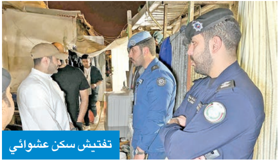
تفتيش سكن عشوائي