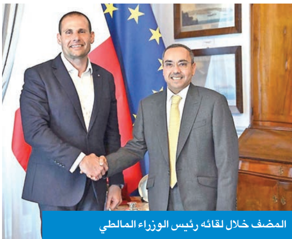
المصف خلال لقائه رئيس الوزراء المالطي

بحث سفير الكويت لدى فالباتا، د. مشعل المصطفى، مع رئيس الوزراء المالطي، د. روبرت أبلان، سبل تعزيز العلاقات الثنائية بين البلدين الصديقين. وذكرت سفارة الكويت لدى مالطا في بيان تلقته «كونا»، أمس الأول، أن السفير المصف التقى رئيس الوزراء المالطي في مقر الوزارة بالعاصمة فالباتا. وأضاف البيان أن اللقاء تناول سبل تعزيز العلاقات الثنائية بين البلدين الصديقين، والتأكيد على التعاون المشترك في مختلف المجالات، خصوصاً المجال السياسي، والاقتصادي، والاستثماري.