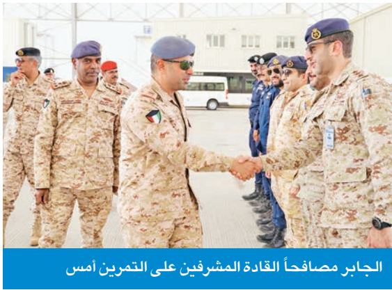
الجابر مصافحاً القادة المشرفين على التمرين أمس

تفقد نائب رئيس الأركان العامة للجيش، اللواء الركن طيار، صباح الجابر، أمس، موقع التمرين المشترك «الجابرية»، الذي سيقام برعاية وزير الدفاع وزير الداخلية بالإنابة الشيخ عبدالله العلي، وبإشراف الجيش الكويتي، بالتعاون مع عدد من الجهات الحكومية والعسكرية الخميس المقبل، في قاعدة عبدالله المبارك الجوية. وكان في استقبال الجابر ممثلون من جميع الجهات المشاركة في التمرين.