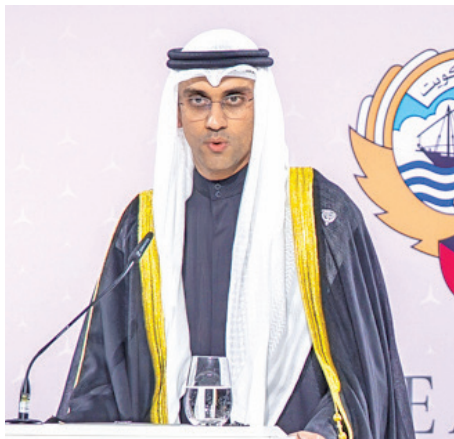
سعود الصباح يلقي كلمته في الحفل