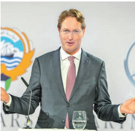
رئيس «مرسيدس بنز» أولا كالينيوس متحدثاً خلال الحفل

نرحب بالمبادرات التي تعزز حضور الشركة بالكويت عبر زيادة استثماراتها أو تطوير كوادرنّا