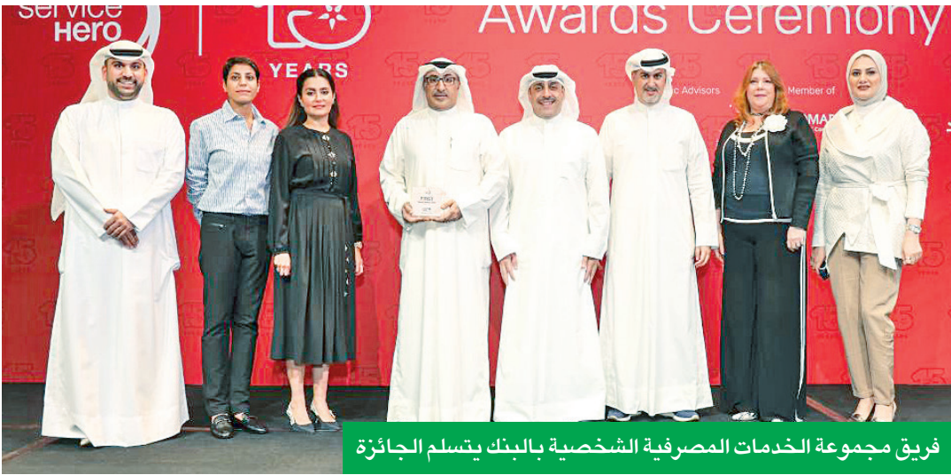
فريق مجموعة الخدمات المصرفية الشخصية بالبنك يتسلم الجائزة

المستهلكين، إضافة إلى التعليقات غير المحددة من جهتهم التي تمنح العلامات التجارية رؤية ثاقبة لإدارة عروض خدماتها بشكل أفضل.