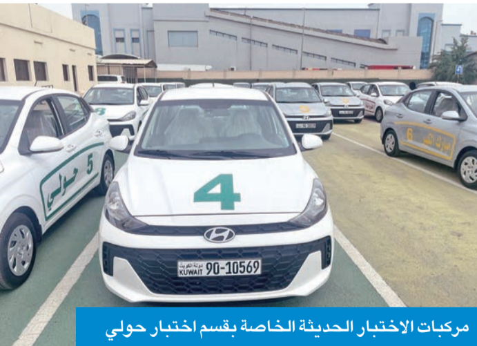
مركبات الاختبار الحديثة الخاصة بقسم اختبار حولي

ويوجه المختبر عن طريق جهاز اللاسلكي ويطلب منه أداء الاختبار المبدائي بكل متطلباته. وذكر أن التقنيات الحديثة المزودة بها المركبات ستعمل على تخفيف العبء عن مختبري القيادة الذين كانوا يوجدون في ساحة الاختبار في مختلف الظروف الجوية، وكانوا أيضاً عرضة للخطر، خصوصاً أن