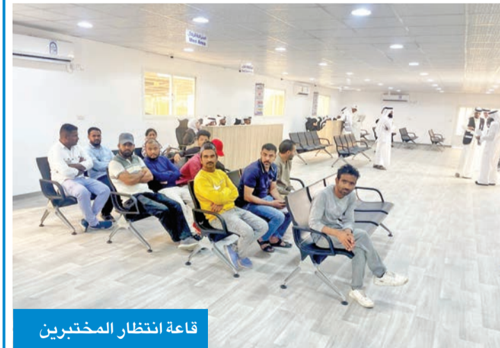
قاعة انتظار المختبرين

هناك أشخاصاً يجرون اختبار القيادة لأول مرة، لافتاً إلى أنه في السابق شهدت ساحات الاختبار فوضى وزحمة للحصول على سيارات الاختبار القديمة، التي كانت تتبع شركات تعليم القيادة، لافتاً إلى أن هذه الشركات حالياً لا