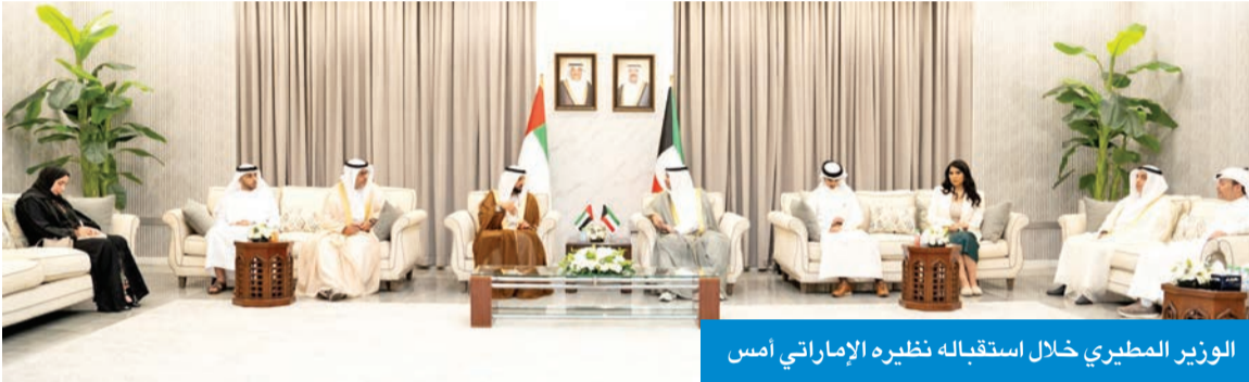
الوزير المطيري خلال استقباله نظيره الإماراتي أمس