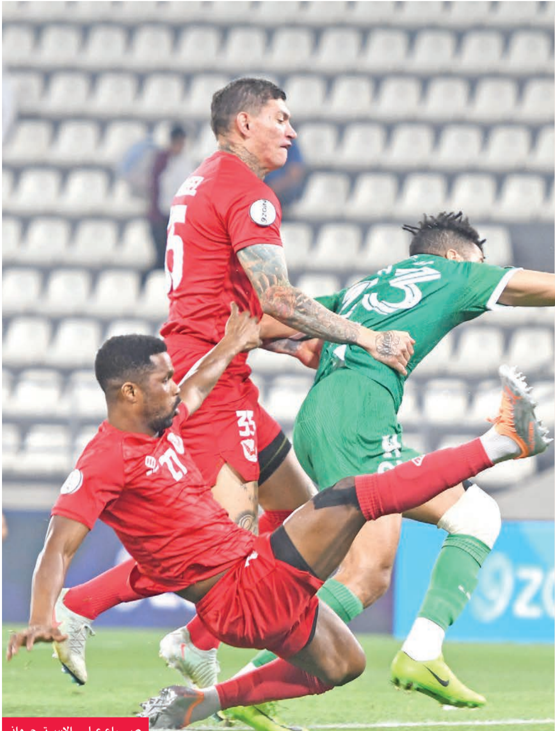
صراع على الاستحواذ في مباراة العربي والفحيحيل