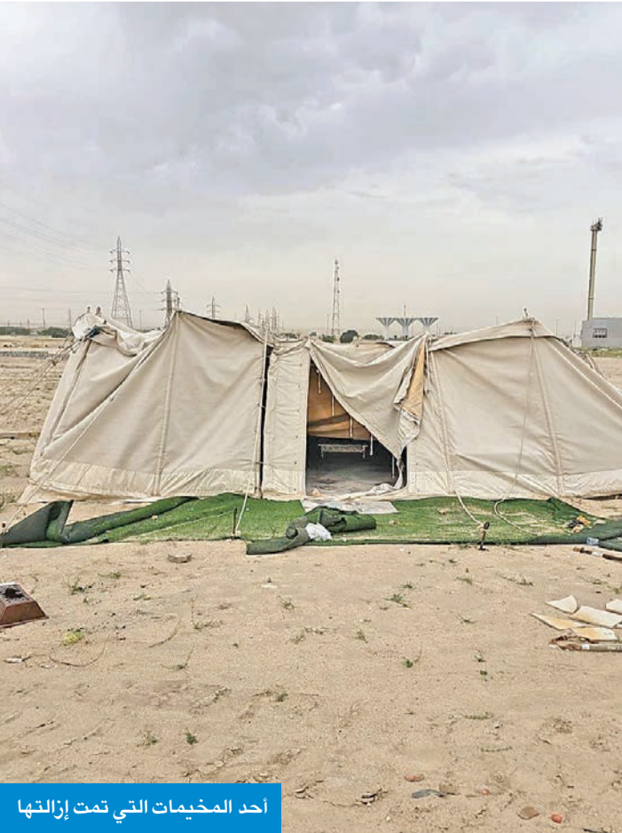
أحد المخيمات التي تمت إزالتها

مواقع إقامة المخيمات للتأكد من عدم وجود مخيمات غير ملتزمة بموسم التخييم واتخاذ الإجراءات اللازمة لتطبيق قرارات ولوائح بلدية الكويت. من جهة أخرى، أكدت البلدية تطبيق الجزاءات من جانب فرق النظافة ضد أصحاب قاعات الأفراح الذين يتركون مخلفات في الساحات العامة. وشددت على أنها لن تتهاون مع صاحب ترخيص قاعة أفراح مزالة في منطقة الرقة تداول مقطع فيديو في بعض مواقع التواصل الاجتماعي تركه مخلفات القاعة في المكان المخصص لإقامتها وعدم إعادته لوضعه نظيفاً كما كان، مينة أن كل الإجراءات ستطبق ضده ومنها مصادرة التأمين وقدره 500 دينار إلى جانب تحميله نفقة رفع تلك المخلفات.