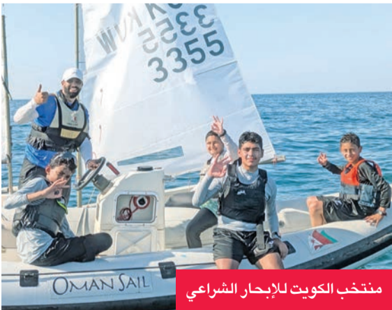
منتخب الكويت للإبحار الشراعي

الكويت 2 مع منتخب عمان 3، من خلال مباريات تُقام صباح اليوم على ملاعب شاطئ الحيل الشمالية. افتتحت الدورة امس الأول رسمياً في العاصمة مسقط، في حفل أقيم على مسرح البحيرة بحديقة القرم الطبيعية، برعاية صاحب السمو ملك بن شهاب آل سعيد، والشيخ فهد الناصر رئيس اللجنة الأولمبية الكويتية، وبمشاركة 330 رياضياً ورياضية من دول الخليج، بينهم 65 لاعبا ولاعبة يمثلون الكويت في البطولة.