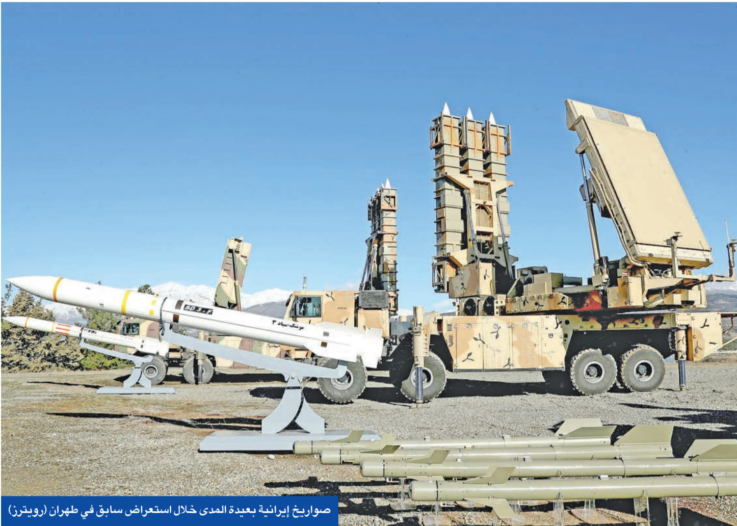
صواريخ إيرانية بعيدة المدى خلال استعراض سابق في طهران

خامنئي يعلن التأهب في صفوف القوات المسلحة