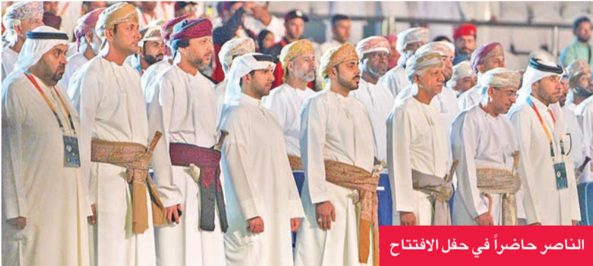
الناصر حاضراً في حفل الافتتاح