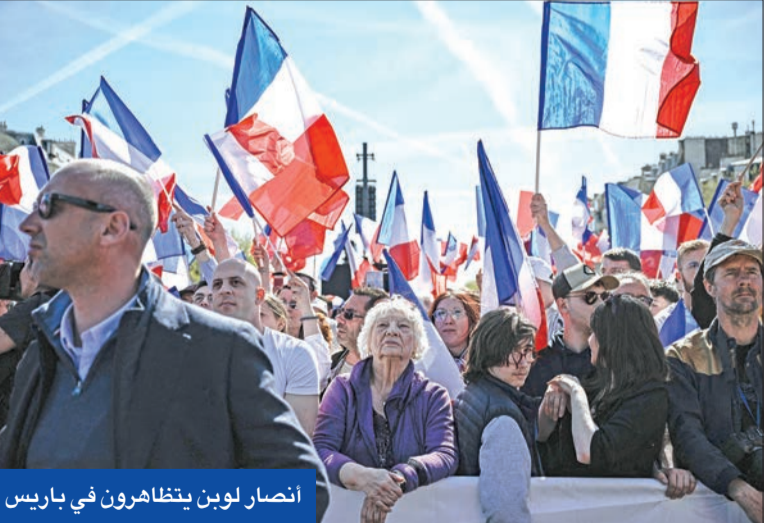
أنصار لوبن يتظاهرون في باريس

عززت التعاطف معه. وأعلنت لوبن في 3 أبريل الجاري، أن أكثر من 20 ألف عضو جديد انضموا إلى حزبها بعد النطق بالحكم، كما تجاوز عدد توقيعها العريضة الداعية لها نصف مليون. وتعيش فرنسا أزمة سياسية بعد أن فاز حزب لوبن بانتخابات البرلمان الأوروبي، الأمر الذي دفع ماكرون لإعلان انتخابات مبكرة أنتجت جمعية وطنية مقسمة بين الوسط وحزب لوبن وتحالف واسع لليسار.