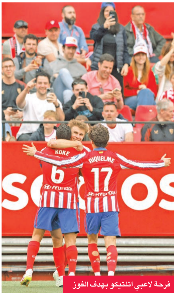
فرحة لاعبي اتليكو بهدف الفوز