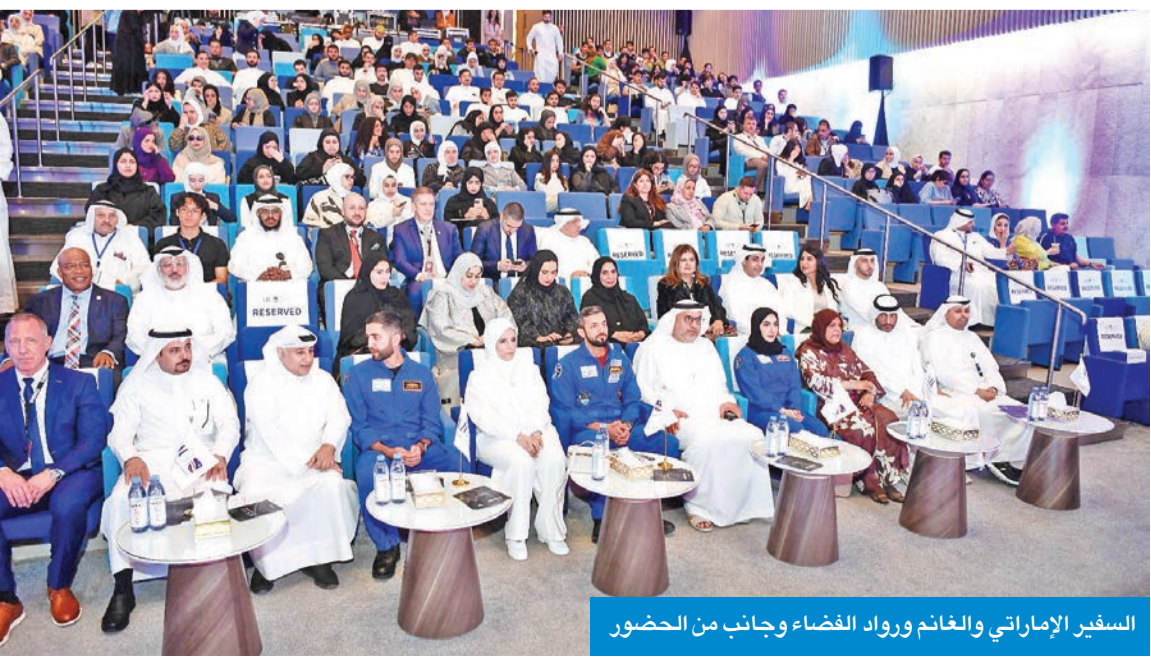
السفير الإماراتي والغانم ورواد الفضاء وجانب من الحضور

كما أعربت الغانم عن سعادتها بحضور الوزير ورائد الفضاء الإماراتي د. سلطان النباي، ورائد الفضاء محمد الملا، ورائدة الفضاء نورا المطروشي، التي تُعد من أوليات النساء في ريادة الفضاء بالوطن العربي والخليج. وأكدت الغانم أن الجامعة حريصة على تنظيم مثل هذه الفعاليات، التي تفتح آفاقاً جديدة للشباب والطلبة، مشيرة إلى أنهم يستكشفون مهارات جديدة لم تخطر على بالهم، ويجدون أنفسهم بها، والتي تعمل على تمهيد الطريق لهم في الوصول إلى أهدافهم وتحديد طموحاتهم.