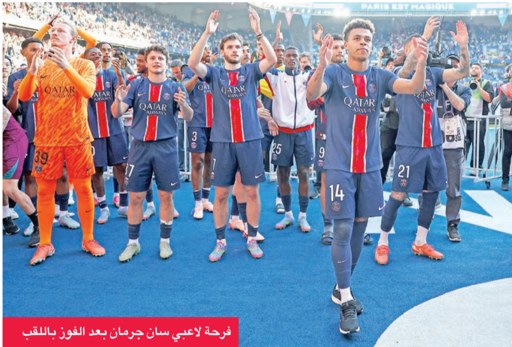
فرحة لاعبي سان جرمان بعد الفوز باللقب

أعرب رئيس باريس سان جرمان، ناصر الخليفي، عن سعادته الكبيرة بتتويج فريقه بلقب الدوري الفرنسي لكرة القدم للمرة الـ 13 في تاريخه.