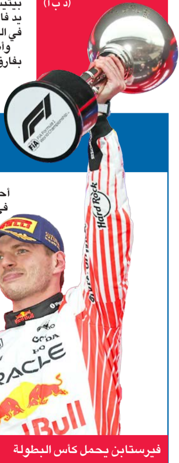
فيرستابن يحمل كأس البطولة

أحرز سائق ريد بول وبطل العالم في الأعوام الأربعة الأخيرة ماكس فيرستابن المركز الأول في سباق جائزة اليابان الكبرى، المرحلة الثالثة من بطولة العالم للفورمولا واحد، الأحد، على حلبة سوزوكا. وتقدم فيرستابن، الذي حقق فوزه الأول هذا الموسم، على فنائتي ماكلارين البريطاني لاندو نوريس بفارق 1.4 ثانية، والأسترالي أوسكار بياستري بفارق 2.1 ثانية. وهي المرة الرابعة تواليا التي يخلف فيها فيرستابن بسباق