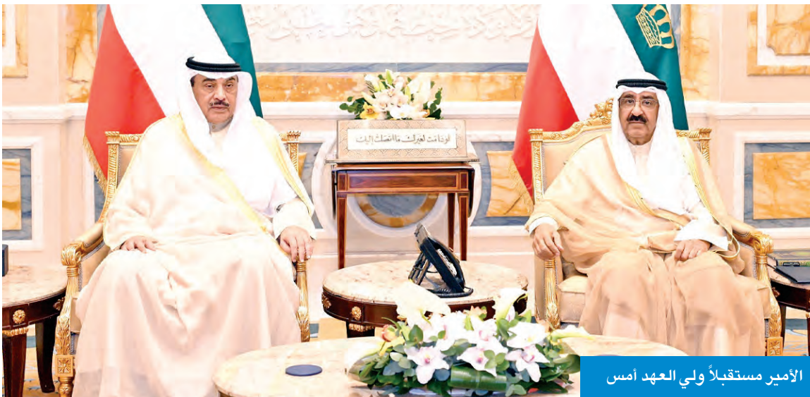
الأمير مستقبلاً ولي العهد أمس

استقبل سمو أمير البلاد، الشيخ مشعل الأحمد، بقصر بيان، صباح أمس، سمو ولي العهد الشيخ صباح الخالد.