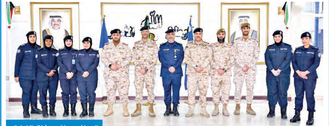
العماني وعاشور خلال الزيارة

وناقش الجانبان سبل تعزيز التعاون في مجال انخراط المرأة في السلك العسكري، كما شملت الزيارة جولة في مرافق المعهد.