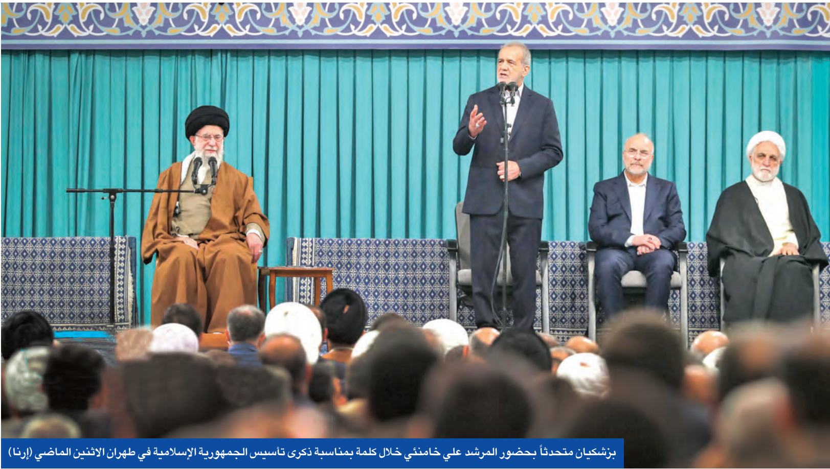
بزئشكان متحدثاً بحضور المرشد علي خامنئي خلال كلمة بمناسبة ذكرى تأسيس الجمهورية الإسلامية في طهران الاثنين الماضي (إرنا)

وبينما أعلن المدير العام للوكالة الدولية للطاقة الذرية رفائيل غروسبي أنه من المحتمل أن يزور طهران قبل نهاية أبريل الجاري لمناقشة الاتفاق النووي الإيراني، عقد الرئيس الفرنسي، إيمانويل ماكرون، اجتماعاً استثنائياً لمجلس الدفاع، بحضور الوزراء الرئيسيين والخبراء الأمنيين، لمناقشة وضع البرنامج النووي الإيراني والتوترات المتصاعدة بين طهران والولايات المتحدة. ونقل «رويترز» عن ثلاثة مصادر دبلوماسية باريس وحلفائها الأوروبيين بشأن احتمال شن هجوم جوي أميركي أو إسرائيلي على المنشآت النووية الإيرانية.