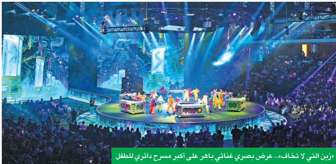
«زين التي لا تخاف»... عرض بصري غنائي باهر على أكبر مسرح دائري للطفل