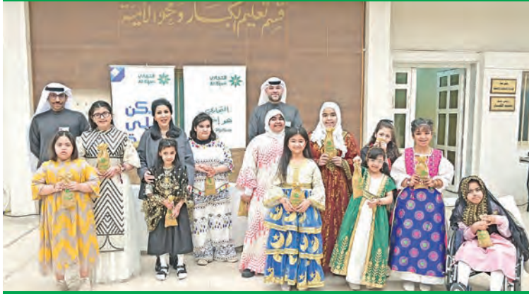
الورع وفريق البنك يشاركون في فرحة القرقيعان مع طلاب مدارس التربية الخاصة

اختتم البنك التجاري برنامج الرضائي الاجتماعي لعام 2025، الذي أطلقه مع بداية شهر رمضان المبارك، بهدف تعزيز روح التكافل والتواصل الاجتماعي بين البنك وأفراد المجتمع بمختلف شرائحه وقطاعاته.