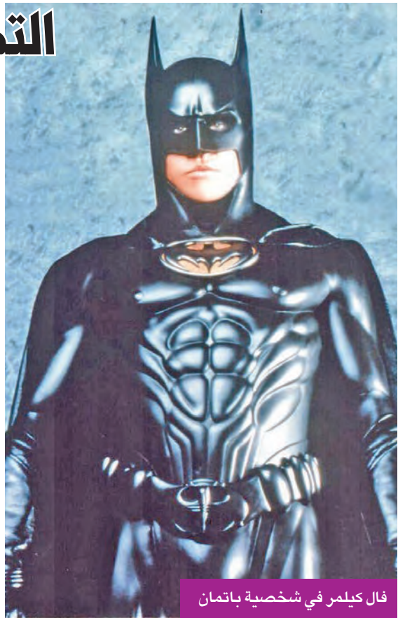
فال كيلمر في شخصية باتمان

في عام 2021، تناول الفيلم الوثائقي «فال»، الذي يستند بشكل رئيسي إلى أرشيفه الخاص، مسيرته في هوليوود. ثم تراجع قبل إصابته بهذا السرطان الذي حرّمه من صوته. وجرى التطرق إلى مرضه في حبكة فيلم «توب غن: مافريك» عام 2022 مع النجم توم كروز. فبعدما أصبح أميرالا في القوات الجوية الأميركية في هذا الجزء الثاني من سلسلة الأفلام، أصبح «إيسمان» الذي يؤدي دوره كيلمر شخصية رئيسية في أول جزء