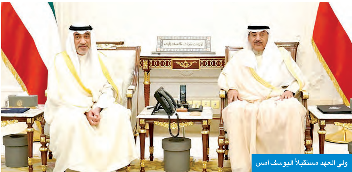
ولي العهد مستقبلاً اليوسف أمس

استقبل سمو ولي العهد الشيخ صباح الخالد بقصر بيان صباح أمس رئيس مجلس الوزراء بالإنباءة الشيخ فهد اليوسف.