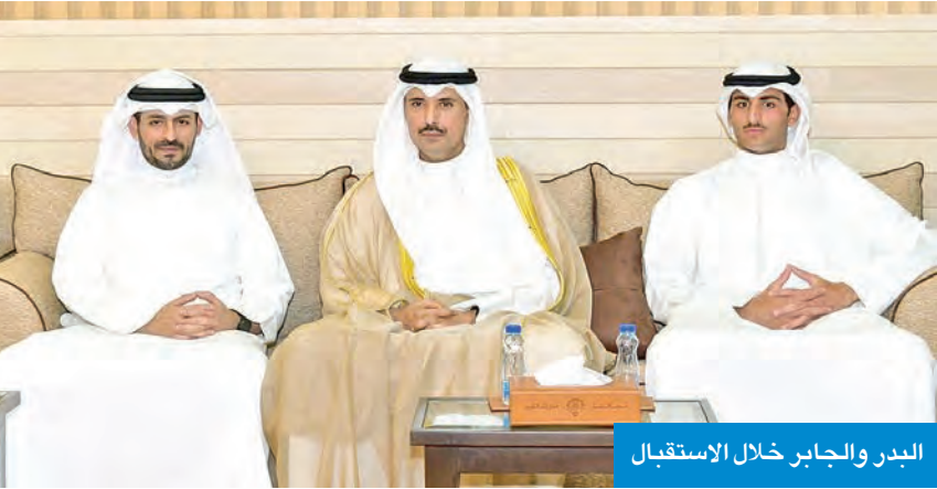
البدر والجابر خلال الاستقبال

استقبل محافظ مبارك الكبير، صباح البدر، في ديوان عام المحافظة، بحضور محافظ الأحمدى الشيخ حمود الجابر، جموع المهنيين بحلول عيد الفطر من المواطنين والمقيمين، ومن المديرين والمسؤولين في الإدارات الحكومية بالمحافظة. وتقدم البدر باسمى آيات التهاني والتبريكات إلى مقام