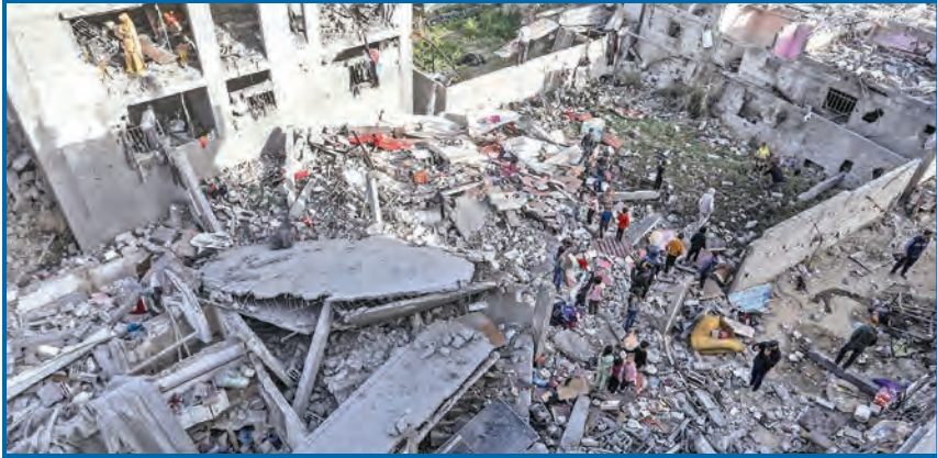
ضربة إسرائيلية دمرت مجمعا سكنيا في خان يونس