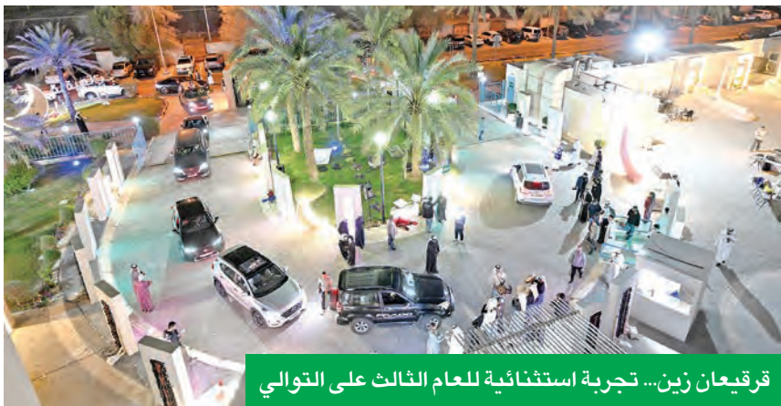
قرقيعان زين... تجربة استثمارية للعام الثالث على التوالي

«زين» أعادت تنظيم حفل «قرقيعان درايف ثرو» بالتعاون مع «وينكم»