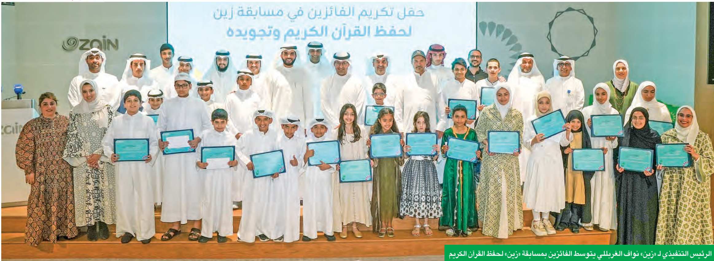
الرئيس التنفيذي لـ «زين» نواف الغربلي يتوسط الفائزين بمسابقة «زين» لحفظ القرآن الكريم

أكبر وأشمل حملة مجتمعية شاركت عبرها بركة رمضان مع كل أطراف المجتمع