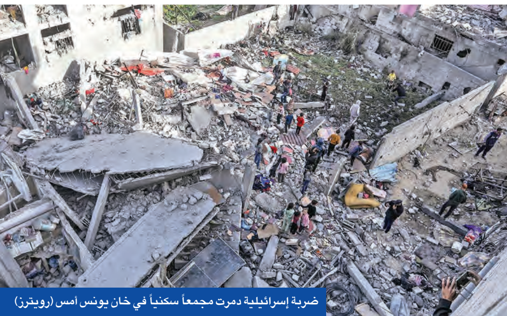
ضربة إسرائيلية دمرت مجمعا سكنياً في خان يونس أمس

وفي حين حذرت المتحدثة باسم الخارجية الأميركية، تامي بروس من أن «الولايات المتحدة عازمة على ضمان عدم حصول إيران على أي سلاح نووي، وأن البدائل ستكون سيئة جداً بالنسبة لإيران إذا لم يرغب نظامها في التوصل إلى اتفاق مع ترامب»، جدد وزير الخارجية الإيراني عباس عراقجي تأكيد بلاده أنها لن تسعى إلى البحث أو إنتاج أو امتلاك السلاح النووي تحت أي ظرف من الظروف. وبعد تلويح مستشار المرشد الإيراني علي لاريجاني بأن بلاده قد تلجأ إلى تطوير سلاح ذري في حال تعرضت منشاتها النووية إلى هجوم من قبل واشنطن أو حليفها إسرائيل، كتب عراقي على منصة «إكس»: «قد لا يكون الرئيس الأميركي مهتماً بالاتفاق النووي المبرم عام 2015، لكن هذا الاتفاق تضمن التزاماً أساسياً من جانب إيران لا يزال قائماً». وتابع عراقي: «لقد أثبت التفاعل الدبلوماسي فعاليتته في الماضي، ويمكن أن يظل فعالاً حتى الآن. ولكن يجب أن يكون