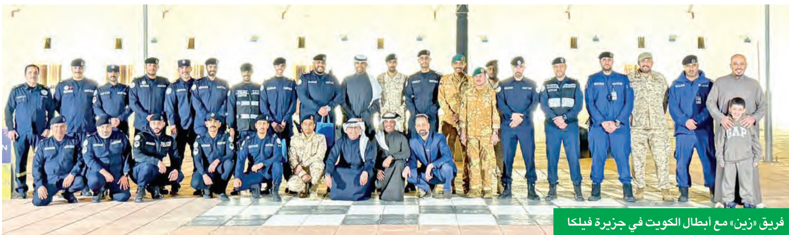
فريق «زين» مع أبطال الكويت في جزيرة فيلكا

في كل من مركز الخرافي لأنشطة الأطفال المعاقين وبأدي الطموح الرياضي للإعاقات الذهنية، اللذين تخللتهما العديد من الفقرات الترفيهية والترفيهية لإدخال الفرحة والبهجة على قلوب الأطفال من ذوي الاحتياجات الخاصة وعائلاتهم.