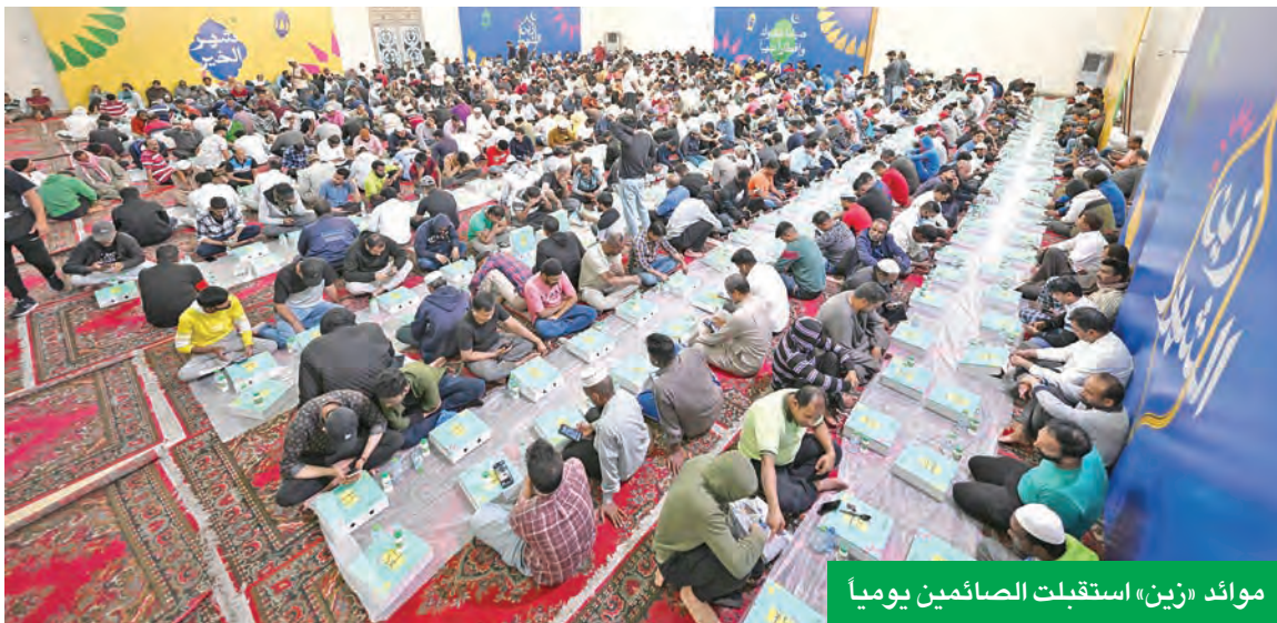
موائد «زين» استقبلت الصائمين يومياً