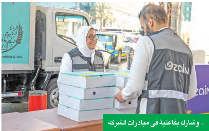
... وشارك بفاعلية في مبادرات الشركة