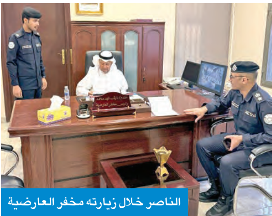
الناصر خلال زيارته مخفر العارضية

تمنّى محافظ الفروانية الشيخ عذبي الناصر جهود رجال الأمن وإخلاصهم في أداء عملهم لضبط الأمن في مناطق محافظة الفروانية. جاء ذلك خلال زيارة تفقدية لمخفر شرطة منطقة العارضية خلال عطلة عيد الفطر للاطلاع على سير العمل وبحث الجوانب الأمنية التنظيمية، كذلك لتهنئة رجال الأمن بالمناسبة المباركة. وتمنى الناصر أن يحفظ الله الكويت وأميرها وشعبها من كل مكروه وأي بدعٍ عليها نعمة الأمن والرخاء والازدهار، وأن يعيد عليها الأعياد بكل بركة وخير وعلى جميع الأمة الإسلامية.