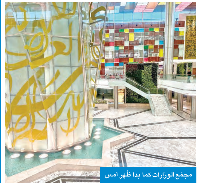
مجتمع الوزارات كما بدا ظهر أمس

أنه إذا حصل على الدرجة بالأقدمية أفضل من حصوله على الترقية خلال المدة المقررة قانوناً. الدرجة المالية الحالية، وشاغل الوظيفة الإشرافية الأعلى، إضافة إلى الأقدم بالوظيفة الإشرافية، الأعلى مؤهلاً، والأقدم بالتخرج، الأكبر سناً، كما يحق للموظف رفض الدرجة بالاختيار حال رأى