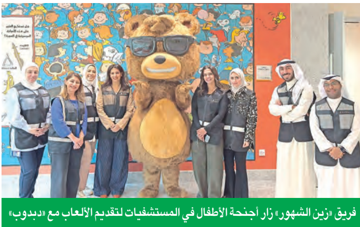
فريق «زين الشهور» زار أجنحة الأطفال في المستشفيات لتقديم الألعاب مع «دبوب»