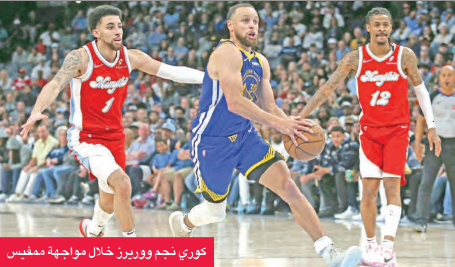
كوري نجم ووريبرز خلال مواجهة ممفيس

وتجاوز كوري عتبة الخمسين نقطة للمرة الثانية هذا الموسم وال 15 في مسيرته. وترافق ذلك مع