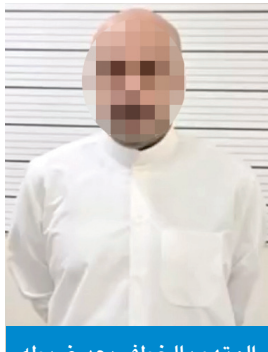
المتهم بالخطف بعد ضبطه

وأوضح أن رجال النجدة أحوالوا المتهم إلى إدارة البحث والمتابعة في محافظة الجهراء واعترف تفصيلياً بجريمته، وأرشد عن مكان الجثة والمركبة التي استخدمها بالجريمة، التي عثر عليها بجانب الجثة. وذكر المصدر أن النيابة العامة أمرت بحجز المواطن وانتقل فريق منها إلى مكان المجني عليها، وأمرت بنبذ