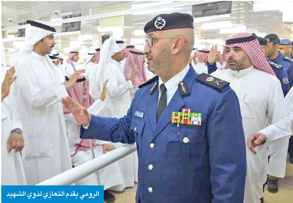
الرومي يقدم التعازي لذوي الشهيد

عز وجل أن يتغمد الفقيد بواسع رحمته ويسكنه فسيح جناته، ويلهم أهله وذويه الصبر والسلوان. وقد تقدم جموع المشيعين رئيس قوة الإطفاء وكبار القادة وجمع غفير من المواطنين والمقيمين. ونقل اللواء الرومي إلى أسرة شهيد الواجب تعازي اليوسف، مؤكداً أن الراحل قام بتأدية واجباته ومسؤولياته بكل إخلاص. وقال الرومي عقب انتهاء مراسم التشييع إن تراب الكويت احتضن شهيداً من خيرة أبنائها الذين ضحوا بالغالي وجاهدوا بالروح من أجل ترابها الطاهر، سائلاً الله العليّ القدير أن يرحم الشهيد بواسع رحمته، ويدخله فسيح جناته، ويلهم ذويه الصبر والسلوان.