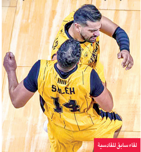
لقاء سابق للقادسية

يُذكر أن القادسية أعلن تعاقد مع المدرب الإسباني خافيير مونوز لتدريب الفريق الأول خلال الفترة المتبقية من الموسم الحالي، خلفاً للمدرب الأميركي أنطوني ستينينغ، الذي الصعود لنصف نهائي الدوري.