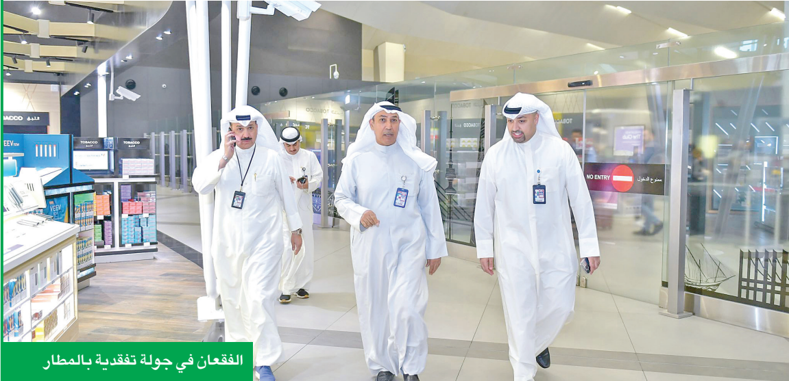
الفقعان في جولة تفقدية بالمطار

وتطوير المنظومة التشغيلية في الشركة، بما يتماشى مع أحدث ما توصل إليه قطاع النقل الجوي التجاري. وأعلنت الشركة مؤخراً جدول رحلاتها الصيفي، الذي يتضمن 12 وجهة صيفية جديدة لنصل عدد الوجهات إلى 58 وجهة تربط الكويت بالعالم.