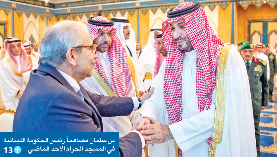
بن سلمان مصافحاً رئيس الحكومة اللبنانية في المسجد الحرام الأحد الماضي +13