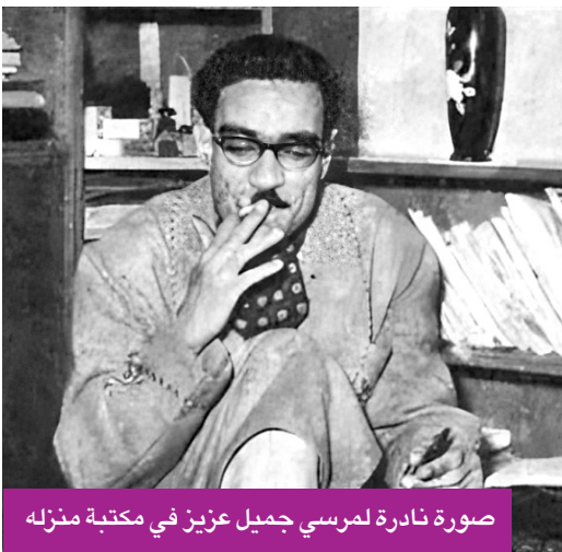
صورة نادرة لمرسي جميل عزيز في مكتبة منزله

وبلغت نحو 35 أغنية من أروع أغانيه، منها «مالك ومالي يا أبو قلب خالي»، و«نعم يا حبيبي»، و«بامر الحب»، و«يا خلي القلب»، و«بتلوموني ليه»، و«في يوم في شهر في سنة». والتقى «فكهاني الأغنية» مع الشحرة صباح، وغنت له «مال الهوى ياما»، و«زي العسل»، و«بستاني يا بستاني»، كما كتب للمطربة شادية «على عش الحب»، و«قطر الندى»، و«شباكتا ستايره حريز»، وتعد الأخيرة من الأغنيات الاستثنائية لعزيز، وكتبها بأسلوب السرد السينمائي، وغنى له المطرب محرم فؤاد «الحلوة داير شباكاها»، و«مرش عينه اللي جارحني»، من ألحان محمد الموجي.