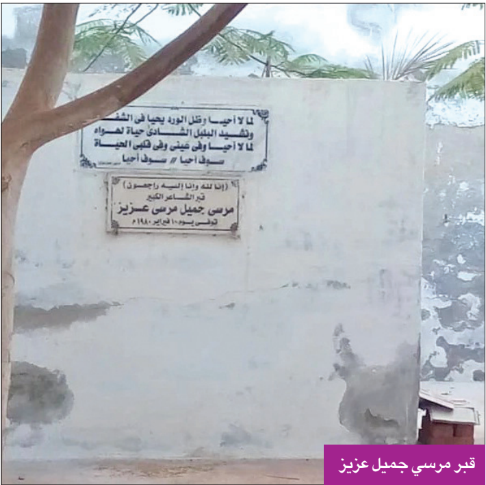
قبر مرسي جميل عزيز

الرئيس جمال عبدالناصر يمنح الشاعر الغنائي وسام الجمهورية