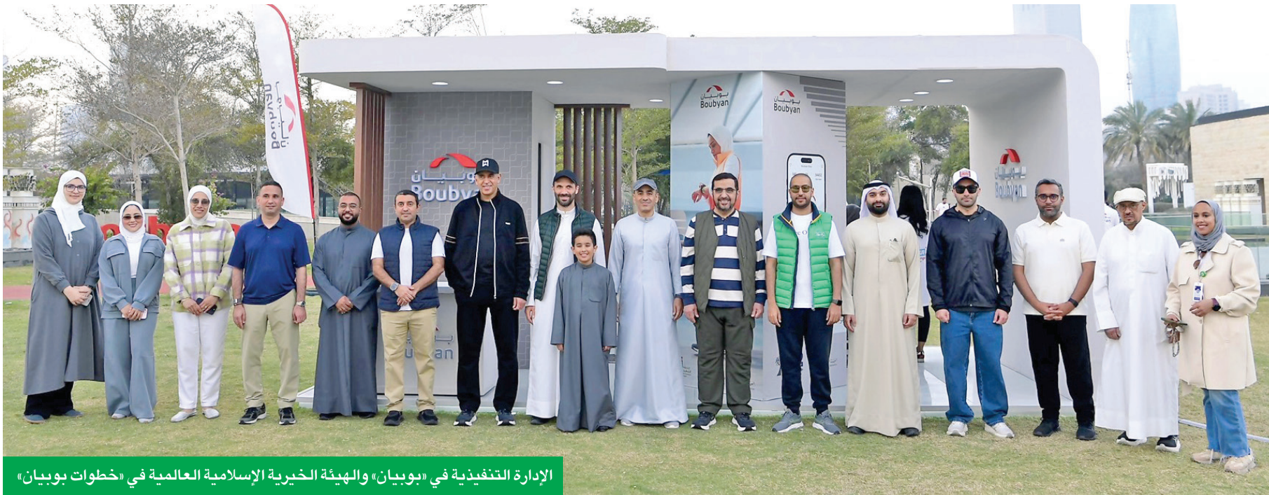
الإدارة التنفيذية في «بوبيان» والهيئة الخيرية الإسلامية العالمية في «خطوات بوبيان»

المجّم: البنك مستمر في مبادراته الأكثر استدامة بما يترجم رؤيته في صناعة الأثر الإيجابي بالمجتمع