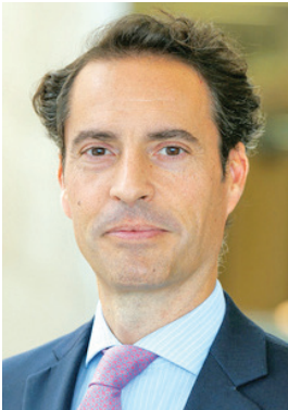
خافيير كولومينا الوساطة وتقريب وجهات النظر ولم الشمل في عدد من الأزمات الإقليمية والدولية.

(ناتو) جاء في الأول من أبريل العام 2004 في أعقاب زيارة الأمير الراحل الشيخ صباح الأحمد طيب الله ثراه للولايات المتحدة في سبتمبر العام 2003. وشكلت تلك الخطوة تعزيزاً للعلاقات الثنائية الوثيقة بين البلدين الصديقين وتوتجيا لعلاقات وثيقة تعود رسميا إلى العام 1951 عندما افتتحت الولايات المتحدة أول قنصلية لها في العاصمة الكويت. وأصبحت الكويت حليفاً استراتيجياً وشريكاً أساسياً للولايات المتحدة بفضل النضح الأميركي، وتفايدي الحرج في حال مشاركة شخصيات رسمية، وهو ما ردت عليه واشنطن بالمثل. وقال إن رئيس الجانب الإيراني المشارك في اللقاء أبلغ أمين «المجلس الأعلى للأمن» علي أكبر أحمديان أن الاجتماع كان إيجابياً جداً، قبل أن يقدم تقريراً مفصلاً بشأنه، لافتاً إلى أن مهمة الاجتماع انحصرت في وضع بنود أي مفاوضات مستقبلية مع التأكيد على ضرورة حصر تلك المفاوضات في المسألة النووية، وبالحصول على ضمانات مقنعة بعدم تكرار واشنطن لانسحابها من أي اتفاق محتمل.