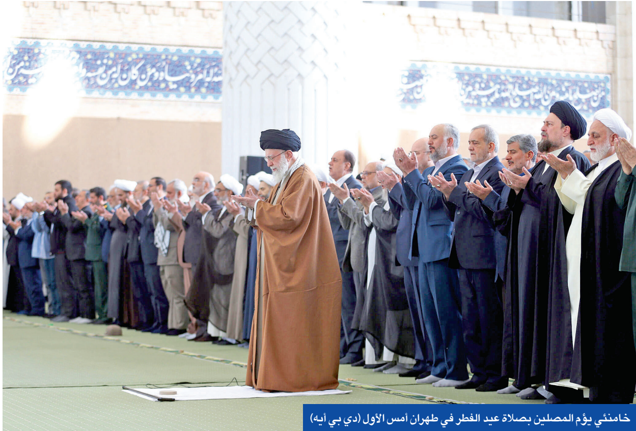
خامني في يوم المصلين بصلاة عيد الفطر في طهران أمس الأول (دي بي آيه)

اتهمت زعيمة اليمين الفرنسي المتطرف، مارين لوبن، أمس «النظام بإخراج القنبلة النووية، لمنعها من فوزها الوشيك في انتخابات الرئاسة في 2027، مؤكدة أنها ستواصل القتال ضد «السيادة القضاة، حتى إلغاء حكم حظرها من الترشح لمدة 5 سنوات. وفي ظل الهجمات الآتية من اليمين المخطف في كل حذب وصوب، بما في ذلك من الرئيس الأمريكي دونالد ترامب، ورئيسة الوزراء الإيطالية جورجيا ميلوني، دافع أحد أغنى القضاة في فرنسا عن الحكم الصادر في حق لوبن بتهمة اختلاس أموال عامة، مؤكداً أن «القرار ليس سياسياً خالص إليه 3 قضاة مستقلون ومحايدين».