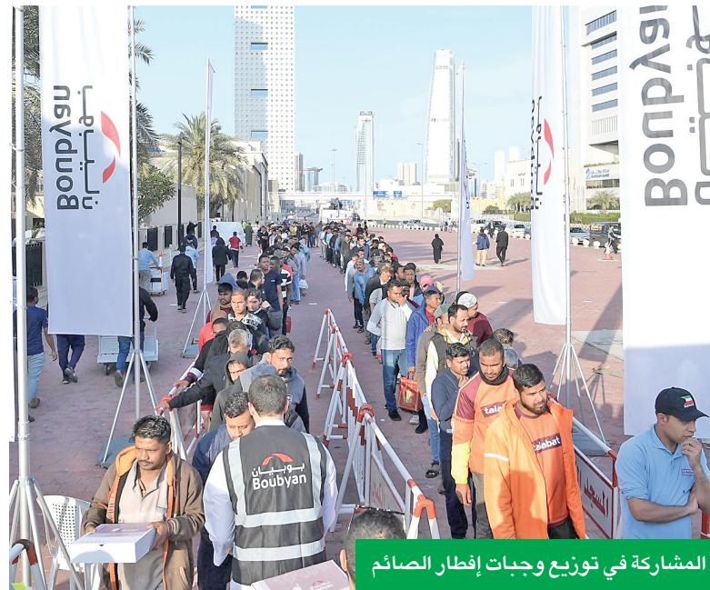
المشاركة في توزيع وجبات إفطار الصائم

اختتم بنك بوبيان برنامج فعالياته خلال شهر رمضان الفضيل لعام 2025، والذي ترجم معاني وقيم العطاء والمشاركة من خلال مبادرات متنوعة تركت أثراً ملموساً في المجتمع.