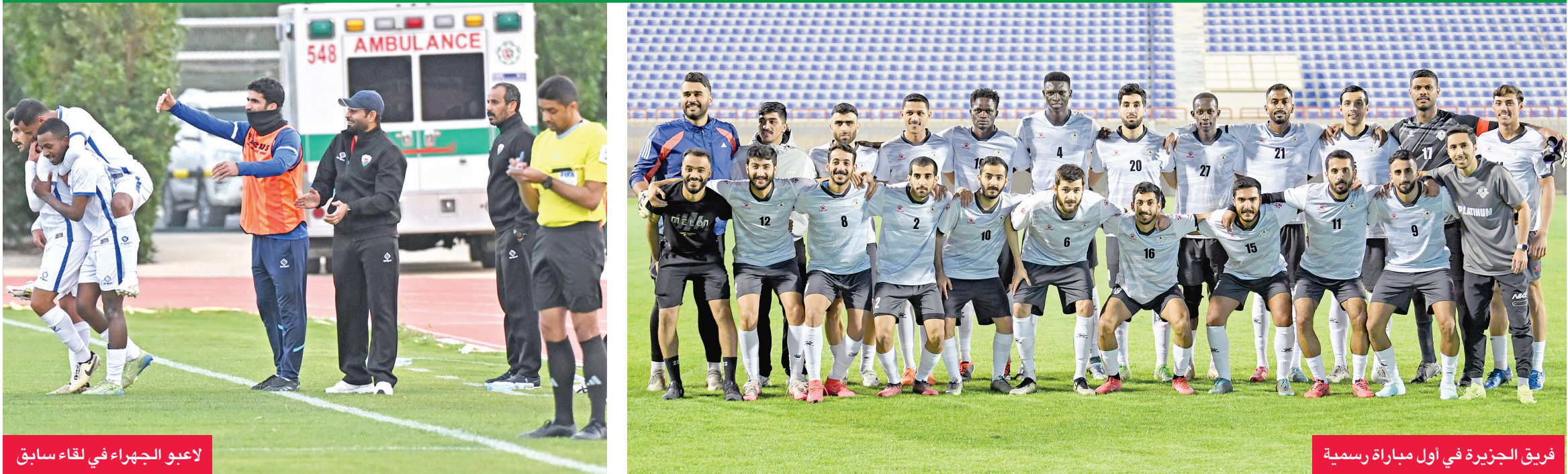
لاعبو الجھراء في لقاء سابق