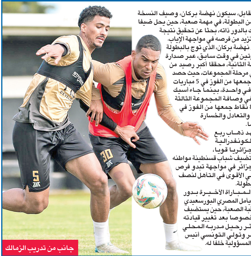
جانب من تدريب الزمالك

في المقابل، سيكون نهضة بركان، وصيف النسخة الأخيرة من البطولة، في مهمة صعبة، حين يحل ضيفاً على أسك بالدور ذاته، بحثاً عن تحقيق نتيجة إيجابية تزيد من فرصه في مواجهة الإياب. وتأهل نهضة بركان، الذي توج بالبطولة ذاتها مرتين في وقت سابق، عبر صدارة المجموعة الثانية، محققاً أكبر رصيد من النقاط في مرحلة المجموعات، حيث حصد 16 نقطة جمعها من الفوز في 5 مباريات وتعادل في واحدة، بينما جاء أسك ميموزا في وصافة المجموعة الثالثة برصيد 8 نقاط جمعها من الفوز في مباراتين والتعادل والخسارة في مثلهما.