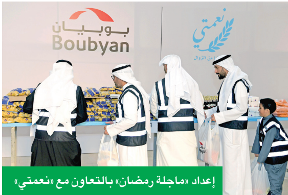
إعداد «ماجلة رمضان» بالتعاون مع «نعمتي»

وفّر «بوبيان» لعملائه العيادي داخل جميع فروعه المنتشرة في الكويت - باستثناء فرع المطار، أو من خلال أجهزة سحب الي مختارة، بالتزامن مع عيد الفطر، ليكون دوماً الأقرب إليهم.