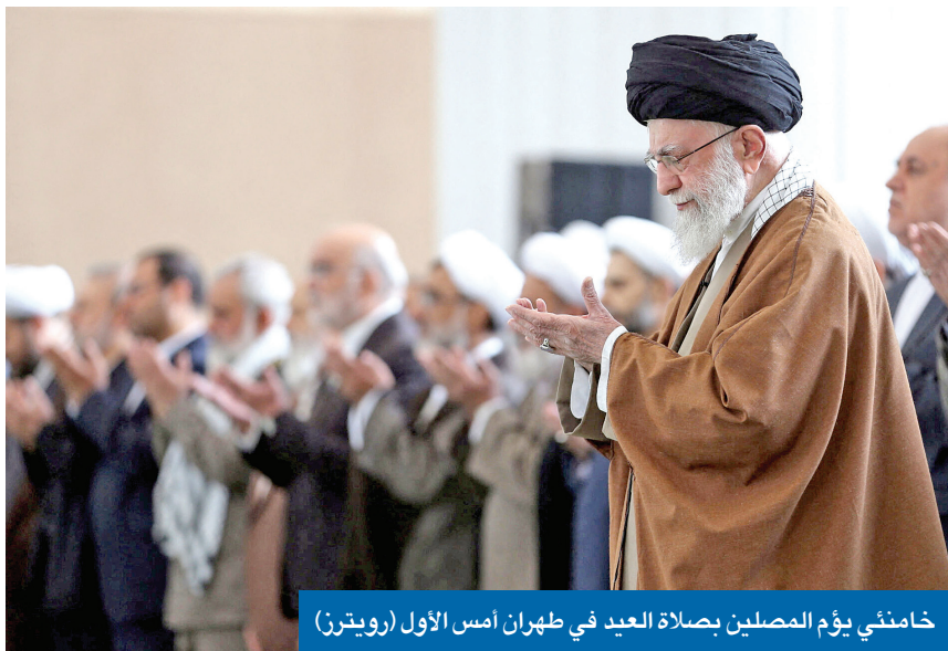
خامنئي يؤم المصلين بصلاة العيد في طهران أمس الأول

كشف مصدر في المجلس الأعلى للأمن القومي الإيراني لـ «الجريدة»، أن اجتماعاً غير رسمي وغير علني عُقد بين ممثلين عن الولايات المتحدة وإيران بهدف التحضير للقاءات رسمية بين الجانبين، موضحاً أنه عُقد في مسقط الجمعة الماضي، وشارك فيه 3 ممثلين عن كل جانب. وأضاف المصدر أن هذا النوع من اللقاءات كان مقترحاً من روسيا، لافتاً إلى أن الأميركيين أبلغوا الإيرانيين استعدادهم لإجراء بضع جولات من تلك اللقاءات عبر العراق، على أن تتحول هذه الاجتماعات إلى لقاءات رسمية ومباشرة وعلنية فيما بعد. وأوضح أن إجراء لقاء الجمعة جاء بطلب من الأميركيين بعد أن سلمت طهران إلى مسقط رسماً رسمياً ردها على رسالة ترامب، وأبدت استعدادها لإجراء مفاوضات مع الأميركيين، رغم إعلانها رفض الدخول في مباحثات مباشرة على <<02