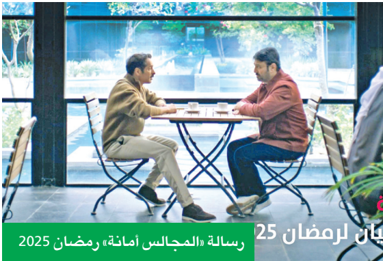
رسالة «المجالس أمانة» رمضان 2025