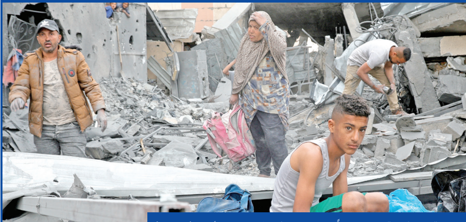
ضربة إسرائيلية دمرت عدداً من المنازل في خان يونس أمس

الإجمالية بلغت 50399 قتيلاً منذ 7 أكتوبر 2023. في المقابل، دعا القيادي في «حماس» سامي أبو زهري أنصار غزة حول العالم على حمل السلاح، ومحاربة البنية التحتية الرامية إلى تهجير سكانها، وطالبهم بأن يخرجوا عن صمتهم تجاه عمليات الذبح والتجويع، ولا يدخروا عبوة أو رصاصة أو سكيناً أو حجراً، لمواجهة المخطط الأمريكي - الصهيوني.