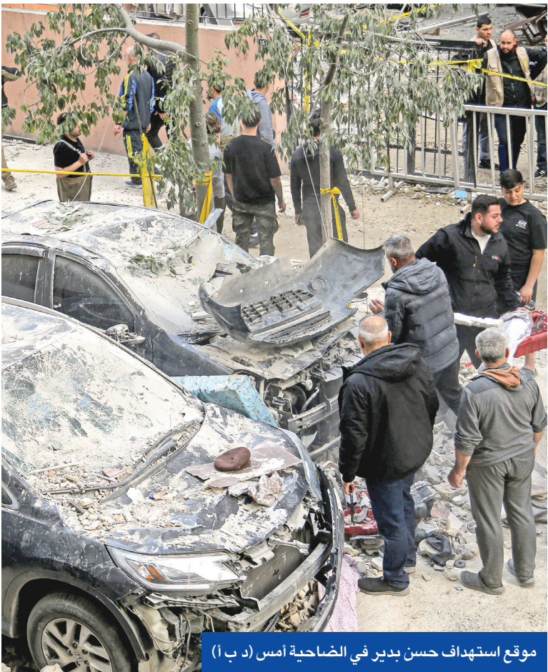
موقع استهداف حسن بدير في الضاحية أمس

باب واسع فتحته المملكة العربية السعودية لرئيس الحكومة اللبنانية نواف سلام. فهو الشخصية اللبنانية الوحيدة التي استضافها ولي العهد الأمير محمد بن سلمان لأداء صلاة العيد في الحرم المكي الشريف. وفي ذلك إشارات سياسية لافتة قصيرة ومتوسطة وبعيدة المدى، لا سيما أن الزيارة في شكلها ومضمونها حملت دعماً سعودياً كبيراً لسلام ولمسار حكومته في ضرورة إنجاز وتحقيق الإصلاحات التي يحتاجها لبنان للخروج من دوامة الأزمات، والوصول إلى تعزيز سيادة الدولة وقدرات مؤسساتها. منذ استقال رئيس الجمهورية جوزاف عون، إلى رعاية السعودية لاجتماع سوري - لبناني للبحث في تكريس الاستقرار على الحدود اللبنانية - السورية، وفتح مسار تفاوضي لمعالجة النقاط العالقة وترسيم الحدود، وصولاً إلى زيارة سلام على متن طائرة ملكية، يؤكد ذلك أن السعودية اختارت العودة إلى لبنان من الباب العريض، مع اهتمام واضح به وبسورية أيضاً انطلاقاً من الرؤية الاستراتيجية السعودية. وبحسب ما تشير مصادر متابعة للزيارة فإن