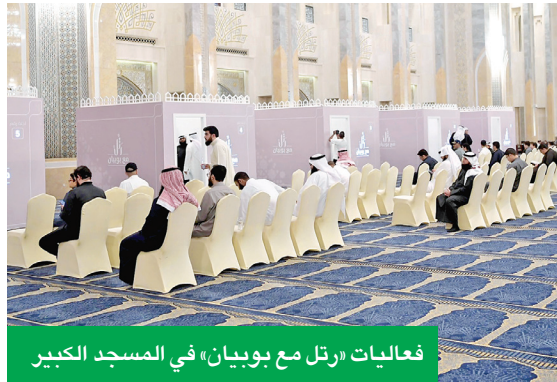
فعاليات «رتل مع بوبيان» في المسجد الكبير