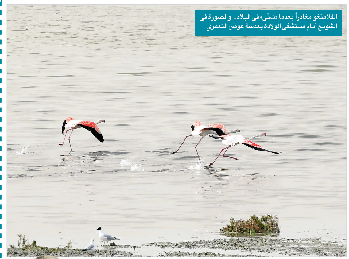
الفلamingو مغادراً بعدما «شئى» في البلاد... والصورة في الشويخ أمام مستشفى الولادة بعدسة عوض النمعري

القناني تصنع في جلها من البوليلستر الحراري PET ولجعله قابلاً للتحلل وجب أن يكون مضافاً إليه شيء كثير من الكيمويات التي تسبب نثار شظايا بلاستيكية أو تدم التخصبة بالمواصفات الميكانيكية المرتبطة بجودته. وهنا يكمن الدرس المستفاد بحقيقة من الأخبار المتناقلة العلمية أو غيرهما. وجب عدم الإنبهار مانئيت مشايبة بأننا والتفكير جلياً ما في وراء الخبر، ولعل البحث عن مانئيت مشابهة لذاك الياباني في خياب الصحافة العلمية وتكرار ما هو مشابه سيجعل القارئ وإعياً لما أعنيه تماماً.