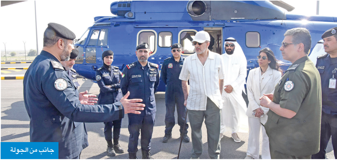
جانب من الجولة

وتؤكد هذه القرارات حرص الوزارة على تقدير جهود منتسبيها من أعضاء قوة الشرطة، وحثهم على بذل المزيد من الجهد والعطاء، وتعزيز كفاءة العمل الأمني في البلاد.