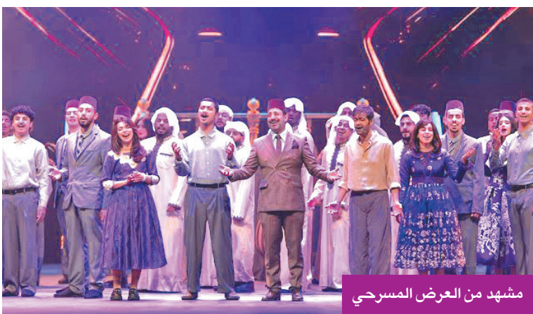
مشهد من العرض المسرحي