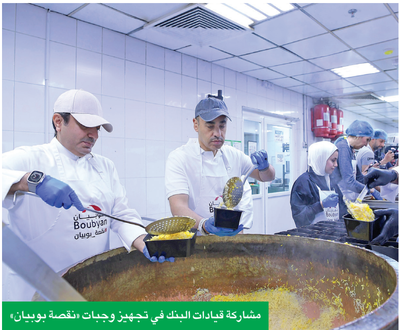
مشاركة قيادات البنك في تجهيز وجبات «نقصة بوبيان»