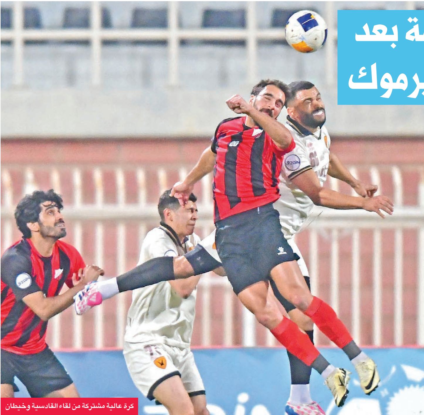
كرة عالية مشتركة من لقاء القادسية وخطان