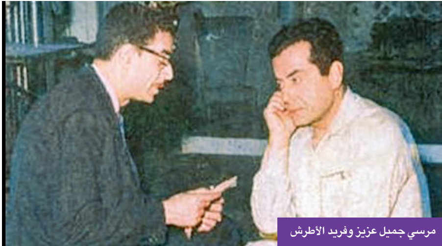
مرسي جميل عزيز وفريد الأطرش

«موال أدهم الشرقاوي» يشعل المنافسة بين العندليب ومحمد رشدي