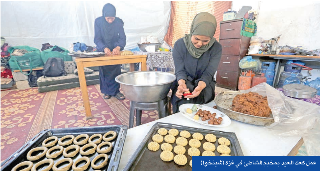
عمل كعك العيد بمخيم الشاطئ في غزة (شينخوا)

ومع تزايد التحركات المصرية والقطرية، بدعم أمريكي للتوصل إلى اتفاق جديد لوقف النار، أجرى المجلس الوزاري المصغر لحكومة بنيامين نتنياهو أمس جلسة مداوالات لحسم خطة توسيع العمليات، وبدء الاستيلاء على أرض لمقاومتها في المفاوضات الجارية في