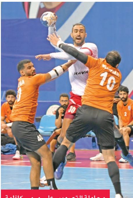
محاولة التصويب على مرمى كاظمة