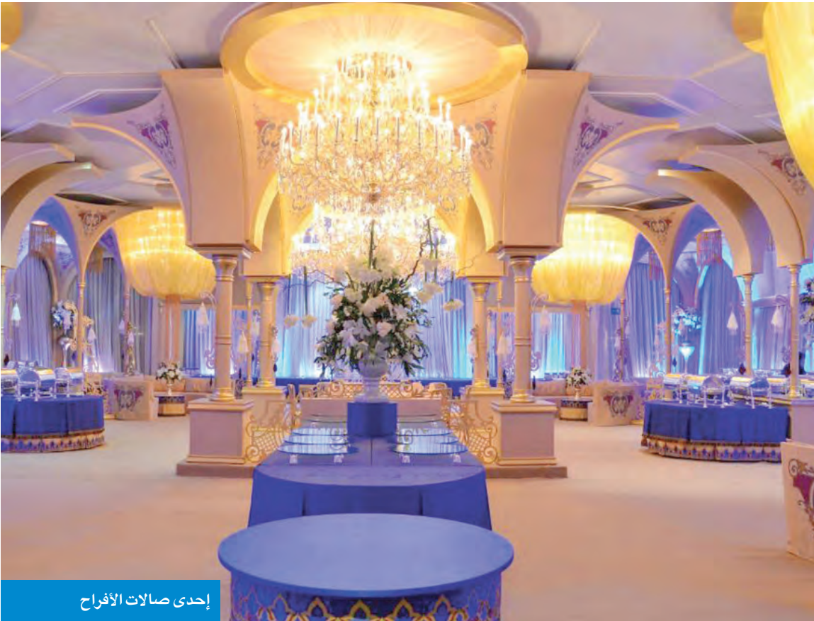
إحدى صالات الأفراح

قال رئيس مجلس إدارة جمعية النجاة الخيرية، فيصل الزامل، إن الجمعية نفذت خلال شهر رمضان العديد من المشاريع الخيرية ضمن حملاتها المختلفة، مشيرًا إلى أن أكثر من مليون شخص حول العالم استفادوا من هذه المبادرات في الشهر الكريم. وأوضح أن أبرز المبادرات كان تقديم مليون إفطار صائم، وتنفيذ حملة «تخيل» لحفر الآبار، وكذلك حملة «اشربوا بالخير» لسداد الأيتام، وتقديم الإغاثة للمحتاجين والأجانب، ودعم المشاريع الطبية والإنشائية، بهدف تحسين حياة المحتاجين، وتأمين سبل العيش الكريم لهم. وقدّم الزامل التفاعل الإيجابي من أهل الخير داخل الكويت، مشيرًا إلى أن العمل الخيري الكويتي لطالما تميز بروح العطاء والتضامن الإنساني.