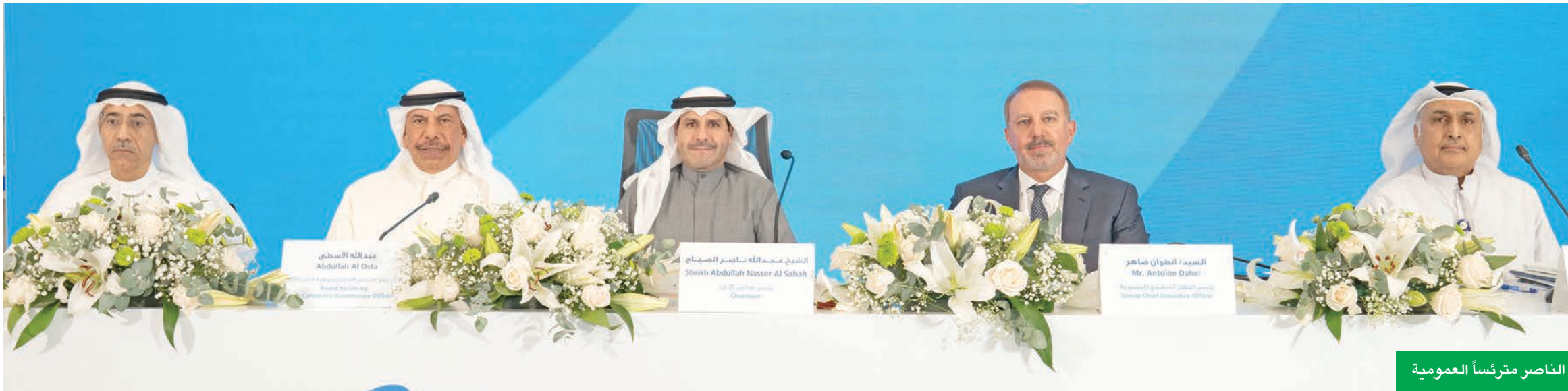
الناصر مترئساً العمومية

أساسياً لنجاحنا، وهو ما دفعنا لإطلاق العديد من برامج التطوير الوظيفي الديناميكية لموظفينا خلال عام 2024». وعلاوة على ذلك، أطلق البنك النسخة الجديدة لعام 2024 من برنامجه الريادي «رؤية» لتطوير المواهب، وعزّز نطاق برنامج Burgan Cares، لدعم الموظفين المهتمين بمواصلة دراساتهم العليا. كما دشّن برنامج «منارة بركان» الجديد، الذي يهدف إلى تقدير موظفيه ممن يتميزون بأداء استثنائي. وأثمرت جهودهم في هذا المجال حصول البنك على جائزة براندون هول 2024 الذهبية لتميزه في إدارة رأس المال البشري بمجال «التعلم والتطوير»، تحت فئة «أفضل استخدام للتعليم الاجتماعي/التعاوني».