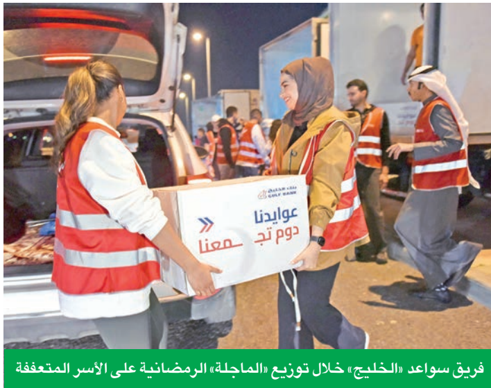
فريق سواعد «الخليج» خلال توزيع «المأجلة» الرمضانية على الأسر المتعففة