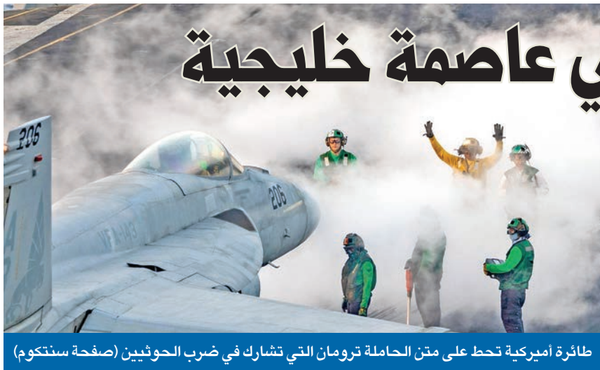
طائرة أميركية تحط على متن الحاملة ترومان التي تشارك في ضرب الحوثيين