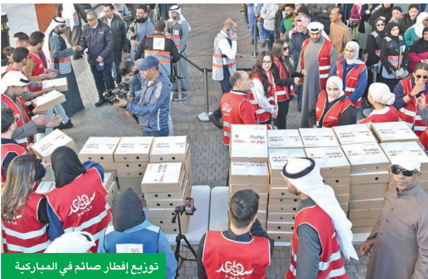
توزيع إفطار صائم في المباركية