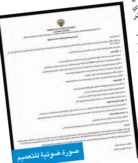
صورة ضوئية للتعميم

وحول المعاملات البنكية والمالية، أكد أهمية الالتزام بشروط الحسابات البنكية، واستخدامها بشكل قانوني، وعدم التأخر في