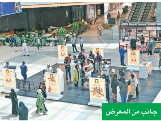
جانب من المعرض

لهم تعبيراً عن الفخر بإنجازاتهم في مختلف المجالات، حيث تم الاحتفاء بهم وسط الزوار لمشاركتهم الفخر بما حققوه من نجاحات. وحول اختيار موعد المعرض، فقد أوضحت إدارة الأفنيوز أنه تم اختيار توقيت نهاية شهر رمضان وبداية عيد الفطر لإقامة فعالية «قصة إلهام» لتكون الفرحة فرحتين، فرحة الأفنيوز والزوار في عيد الفطر بهؤلاء الملهمين وإنجازاتهم، فالعيد هو الوقت الذي يجتمع فيه الناس لمشاهدة أجواء الفرحة والاحتفال معاً. وشهد المعرض إقبالاً كبيراً