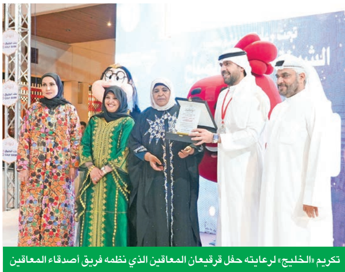
تكريم «الخليج» لرعايته حفل قرقيعان المعاقين الذي نظمه فريق أصدقاء المعاقين