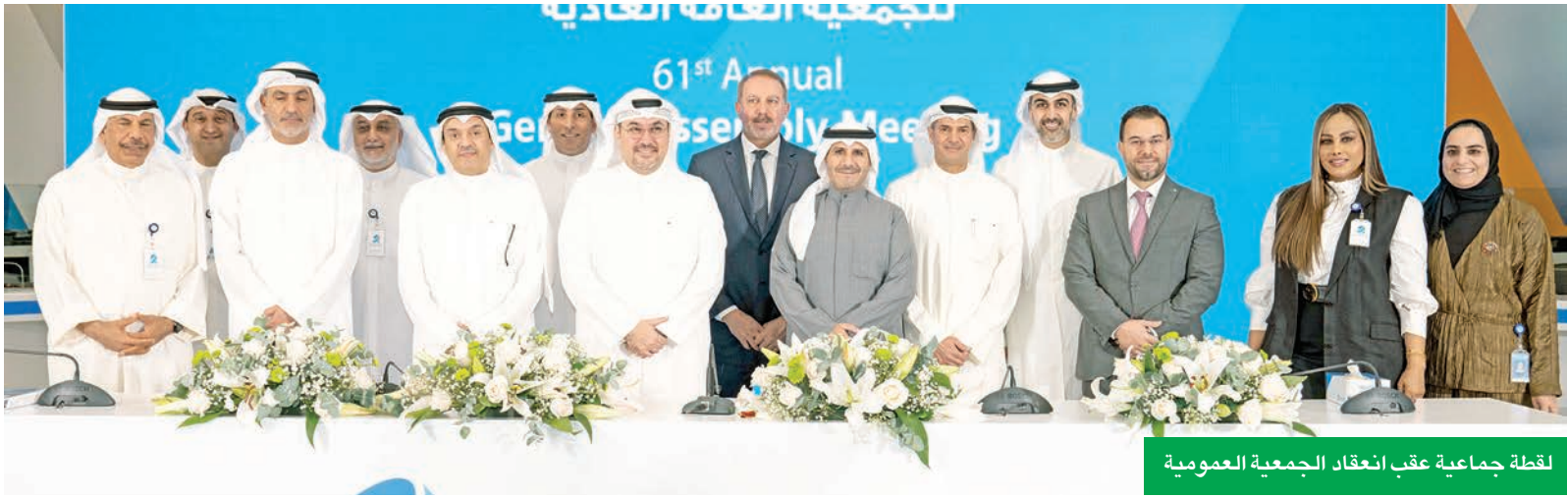
لقطة جماعية عقب انعقاد الجمعية العمومية

عقد بنك بركان، أمس، الاجتماع السنوي الـ 61 للجمعية العامة العادية والاجتماع الـ 38 للجمعية العامة غير العادية في المبنى الرئيسي للبنك، بنصاب بلغ 81.45 بالمئة.