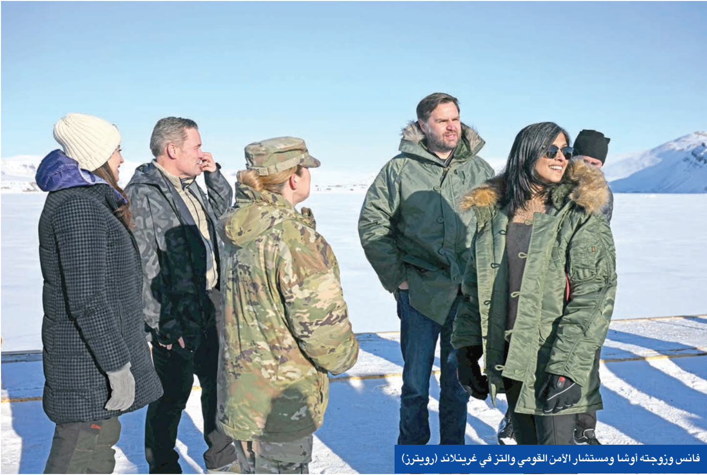
فانس وزوجته أوشا ومستشار الأمن القومي والتز في غرينلاند (رويترز)

وجه نائب الرئيس الأميركي جي دي فانس انتقادات لاذعة للدنمارك خلال زيارة إلى جزيرة غرينلاند القطبية، وصُفت بانها استفزازية، لكنه استبعد لجوء المنطقة الاستراتيجية، التي تتمتع بحكم شبه ذاتي تحت سيادة كوينهاغن. موقف فانس بدا متناقضاً مع إصرار الرئيس دونالد ترامب على الاستحواذ على الجزيرة «بأي وسيلة ممكنة». وخلال زيارته لبقاعة عسكرية أميركية في غرينلاند، قال فانس مساء أمس الأول: «لا نعتقد أن القوة العسكرية ستكون ضرورية على الإطلاق»، موضحاً: «نحن نؤمن بأن سكان غرينلاند سيخاطرون عبر تقرير