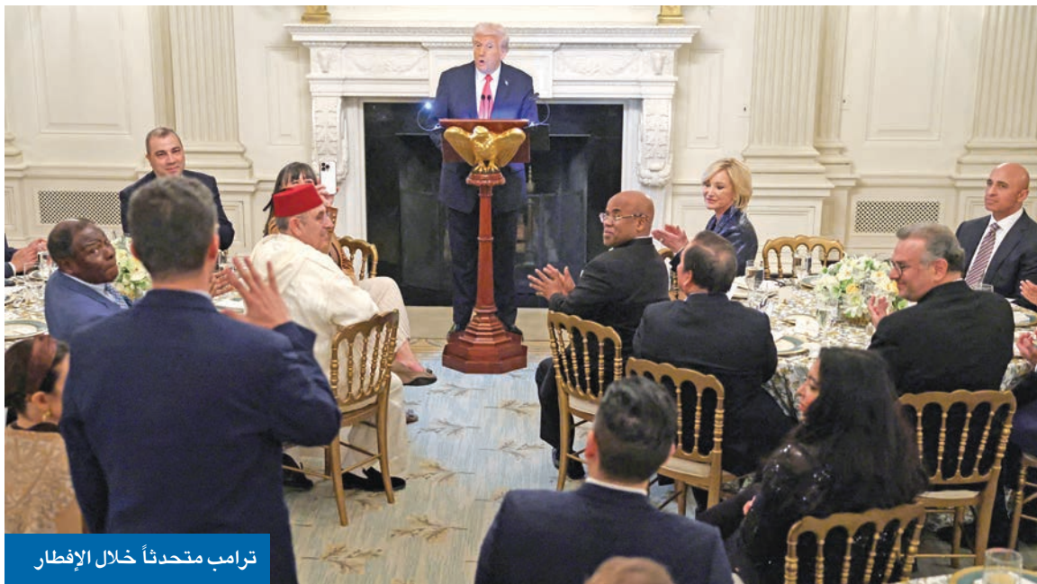
ترامب متحدثاً خلال الإفطار

في موقف أميركي بارز بعد تصريح وزير التجارة هوارد لوتنيك، المسبب للكويت، أشاد الرئيس الأميركي دونالد ترامب بالكويت وشعبها، وقال «الكويت بلد عظيم وشعب رائع». وخلال حفل إفطار في البيت الأبيض لعمدة مدينة هامترايك بولاية ميشيغان أمير غالب، الذي عينه سفيراً جديداً للولايات المتحدة لدى الكويت، قال ترامب مخاطباً غالب: «ستكون سفيرا المقبل إلى الكويت، وستحظى بوقت رائع فيها، فهم شعب رائع وبلد عظيم، تهانينا لك، أنت ستحبهم، وهم سيحبونك».