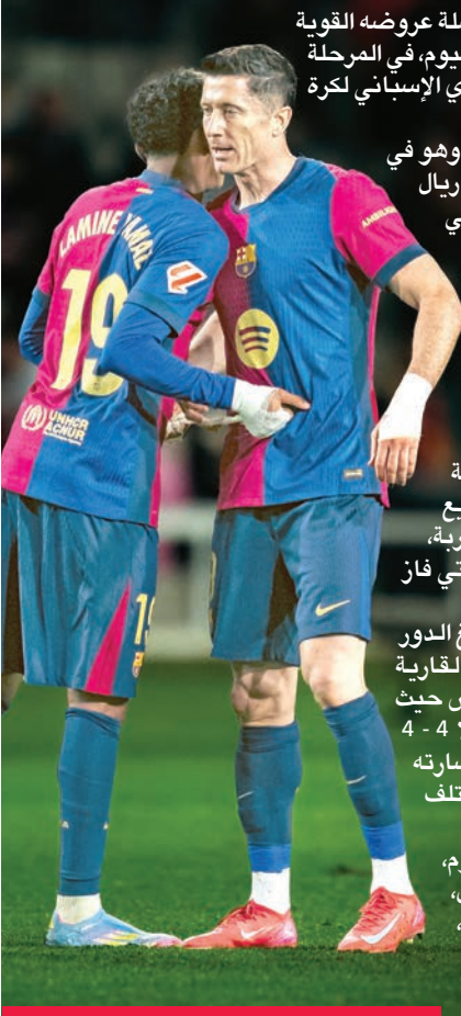
ليفاندوفسكي ولامين يامال نجما برشلونة

يسعى برشلونة إلى مواصلة عروضه القوية وتحقيق الفوز على جبرونا اليوم، في المرحلة التاسعة والعشرين من الدوري الإسباني لكرة القدم. ويدخل البلوغرانا المباراة وهو في الصدارة أمام غريمه التقليدي ريال مدريد، وتعتبر هذه المباراة هي الثانية من تسع في غضون 28 يوماً لبرشلونة، وقد تخطى الخميس ضيفه أوساسونا بثلاثة نظيفة في مباراة مؤجلة بسبب وفاة طبيبه كارليس مينارو غارسيا. وغيب لاعب وسط برشلونة داني أولمو، مدة ثلاثة أسابيع بسبب إصابته في عضلة المقربة، التي لحقت به في المباراة التي فاز فيها فريقه على أوساسونا. ويأمل برشلونة الذي بلغ الدور ربع النهائي في المسابقة القارية الأم وما زال ينافس في الكأس حيث يلقي أتلتيكو إياباً (تعادلاً 4 - 4 ذهاباً)، إطالة سلسلة عدم خسارته والتي بلغت 19 مباراة في مختلف المسابقات. وفي باقي مباريات اليوم، يلقي خيتافي مع فياريال، وأتلتيك بلباو مع أوساسونا، وفالنسيا مع ريال مايوركا، وريال بيتيس مع اشبيلية.