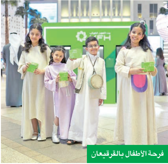
فرحة الأطفال بالقرقيعان