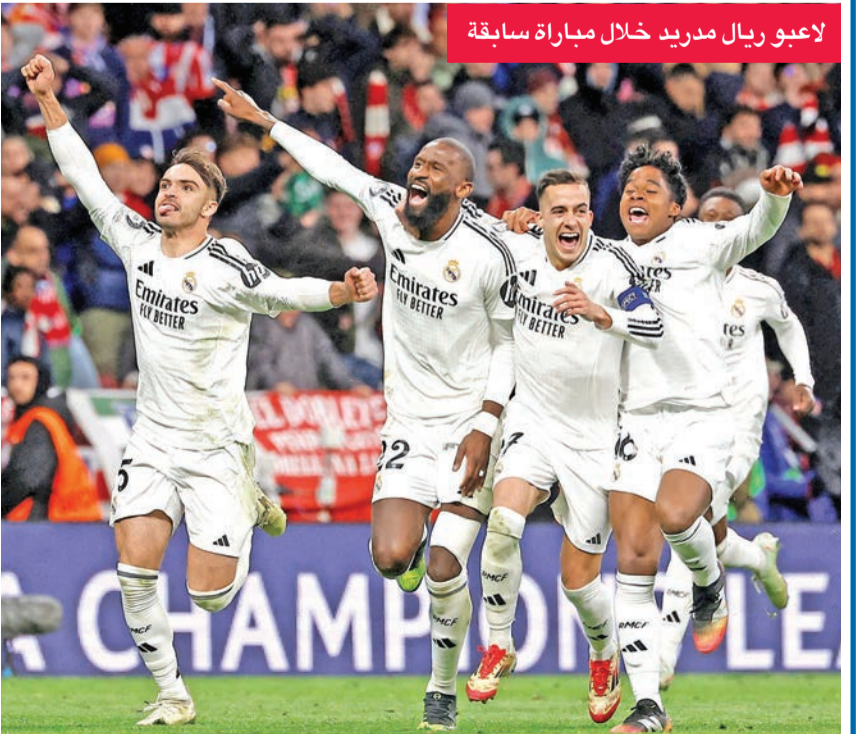
لاعبو ريال مدريد خلال مباراة سابقة

بعد تحقيقه 4 انتصارات في مختلف المسابقات، وأخرها الفوز على فياريال في الجولة الماضية من الليغا. ويقدم فريق المدرب أنشيلوتي مستويات رائعة هذا الموسم في ظل تالق العديد من نجوم