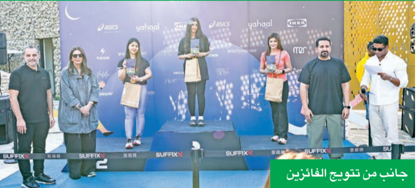
جانب من تنويع الفائزين

لهم ممارسة رياضة المشي أو الركض في أي وقت من اليوم. كما أضافت خاصية التتبع الإلكتروني المباشر طابعاً تنافسياً على التجربة، وأسهمت في تعزيز الروابط الاجتماعية بين المشاركين. وكجزء من الرعاية، نظمت «أسيكس» و«إنترسبورت» سباق خمسة كيلومترات، بقيادة فريق «فرننت رنر» التابع لأسيكس (ASICS FrontRunner)، وفريق «بروجيكت رن» التابع لإنترسبورت (INTERSPORT Project Run)، لتشجيع المشاركين على الاستثمار في التحدي ودعمهم لقطع مسافات أطول. كما قدمت العلامة التجارية جوائز لثلاثة رجال، وثلاث سيدات، ضمن فئة الشباب الذين تتراوح أعمارهم بين 20 و34 عاماً.