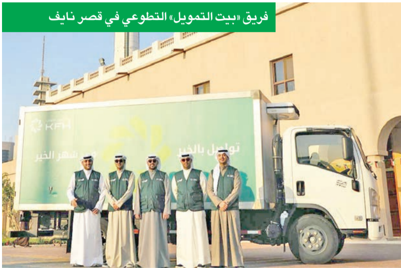
فريق «بيت التمويل» التطوعي في قصر نايف

وذكر الرويحي أن بيت التمويل الكويتي قدم خدمة الضيافة للمصلين في مساجد