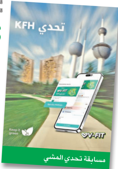
مسابقة تحدي المشي

تنفيذ جميع المبادرات من جانب الفريق التطوعي المكون من موظفي البنك الرويحي