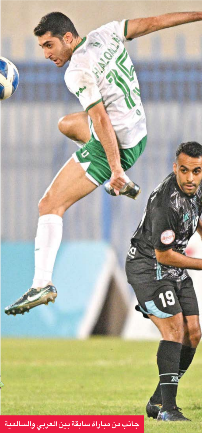
جانب من مباراة سابقة بين العربي والسالمية

التاسع برصيد 11 نقطة، المباراة سعيًا لتحقيق الفوز في ظل منافسته الشرسة مع النصر على البقاء، بعدما تحسنت نتائج الفريق تحت قيادة المدرب التونسي حاتم المؤيد، الذي خلف الروماني فلورين ماتروك. أما القادسية، الذي يحتل المركز الثالث برصيد 32 نقطة، ف يعاني من ضغط المباريات، حيث يواجه النصر لاحقاً يوم 31 مارس، ثم دهوك العراقي في نهائي دوري أبطال الخليج يوم 8 أبريل. ويسعى المدرب المونتينيغري زيلكو بيدروفيتش لإدارة الفريق بفعالية في ظل هذه التحديات لضمان الفوز اليوم والحفاظ على فرصه في المشاركة بإحدى البطولات الخارجية الموسم المقبل.