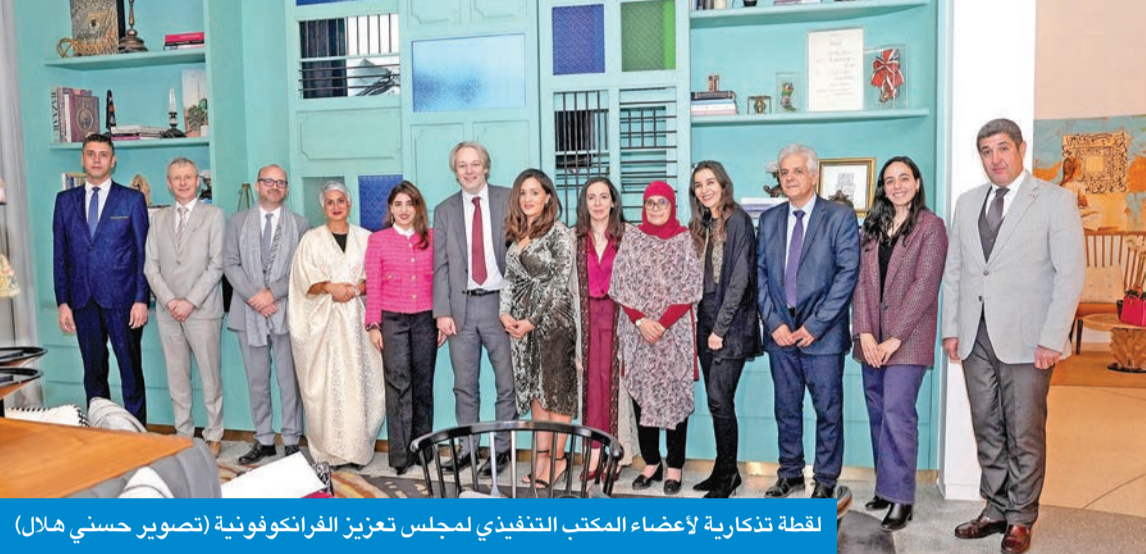
لقطة تذكارية لأعضاء المكتب التنفيذي لمجلس تعزيز الفرانكوفونية