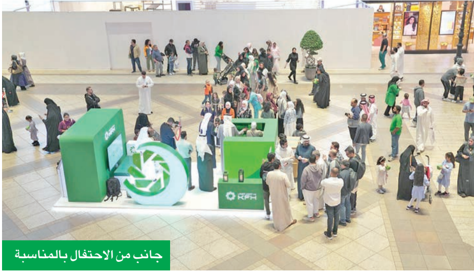
جانب من الاحتفال بالمناسبة