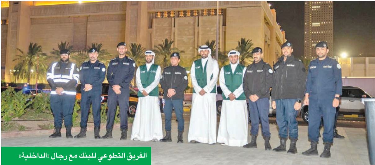
الفريق التطوعي للبنك مع رجال «الداخلية»