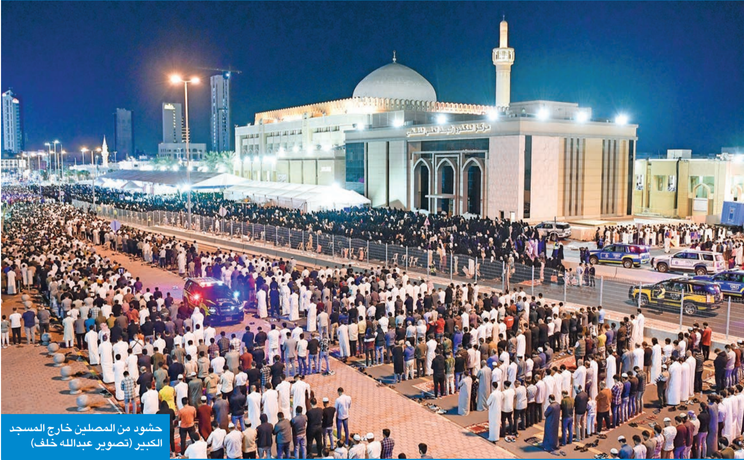
حشود من المصلين خارج المسجد الكبير