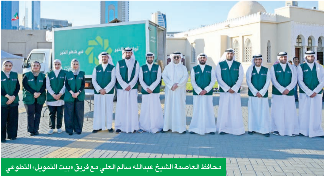
محافظ العاصمة الشيخ عبدالله سالم العلي مع فريق «بيت التمويل» التطوعي