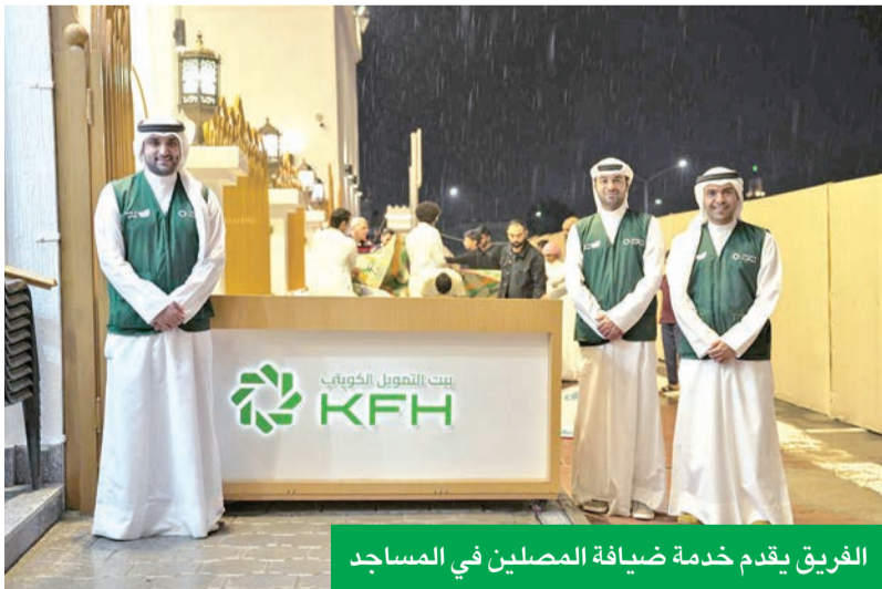
الفريق يقدم خدمة ضيافة المصلين في المساجد