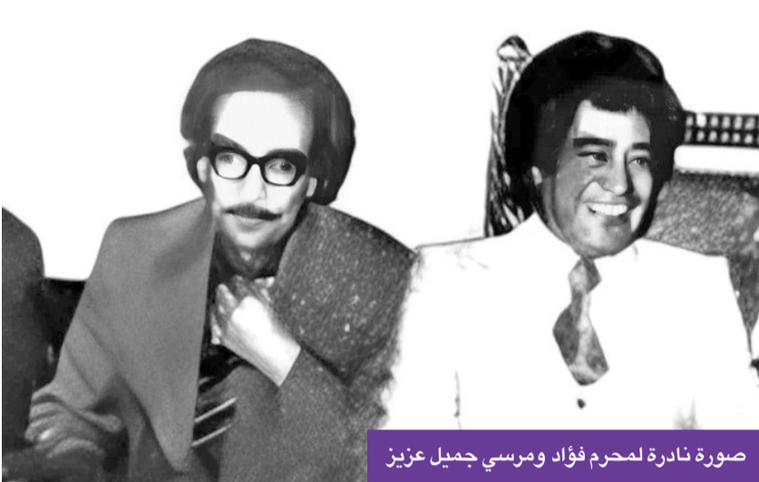
صورة نادرة لمحمد فؤاد ومرسي جميل عزيز

حصل عزيز على شهادة البكالوريا من مدرسة الزقازيق الثانوية عام 1940، والتحق بكلية الحقوق، وهناك أصبح رئيساً وعضواً لعدة جماعات أهمها الشعر، والآداب، وفنون التصوير، والموسيقى، والتمثيل، كما انضم لفريق الرحلات، لكنه قطع دراسته للقانون، وبدأ حياته المهنية تاجر فاكهة مثل والده.