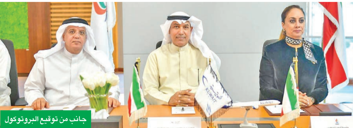
جانب من توقيع البروتوكول

جميع قطاعات الدولة عموماً، متقدماً بجزيل الشكر ووافر الامتنان لكل من الشركتين على جهودهم في إنجاح هذه الاتفاقية.