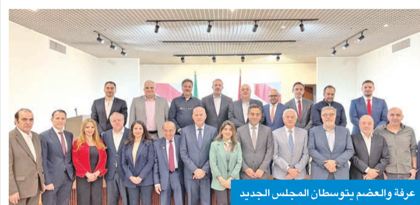
عرفة والعضم يتوسطان المجلس الجديد

أعلن مجلس الأعمال اللبناني في الكويت انتخاب مجلس إدارة جديد له خلال انتخابات فاز بنتيجتها 25 عضواً. وقد عقد المجلس الجديد اجتماعه الأول بمقر السفارة اللبنانية لدى البلاد لانتخاب اللجنة التنفيذية له، حيث أقرت الانتخابات فوز كل من علي حسن خليل رئيساً للمجلس، وشارل يونس نائباً للرئيس، وعكرم عادل درويش أميناً عاماً، وأديب ديب أميناً للصندوق، إضافة إلى فوز كل من هاني مرعي، ووليد شعبان وطارق يحيى لعضوية اللجنة. وجرت الانتخابات بإشراف اللجنة برئاسة المستشار القانوني الدكتور بلال الصنديد، وحضور القائم بأعمال السفارة أحمد عرفة، والقنصل ونائب رئيس البعثة ميا الحضم. وأعرب عرفة عن اعترازه وتقديره لسلالة الممنحين الذي قام به المجلس منذ تأسيسه في 2020، لاسمياً على مستوى تعزيز العلاقات الاقتصادية والتجارية بين لبنان والكويت.