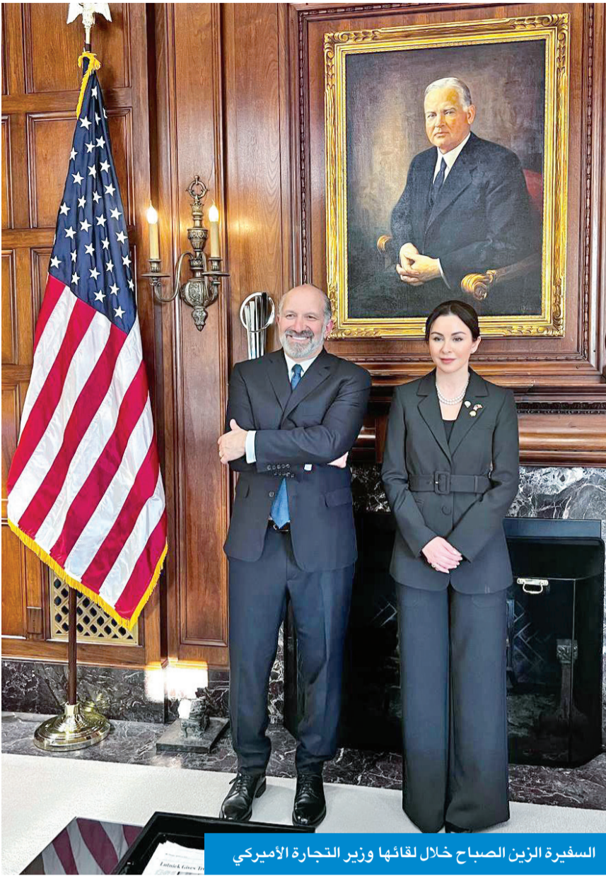
السفيرة الزين الصباح خلال لقائها وزير التجارة الأمريكي

المتحدة ممثلاً في الهيئة العامة للاستثمار والمؤسسة العامة للتأمينات الاجتماعية إلى جانب القطاع الخاص. وقالت إن المؤسسات الكويتية والقطاع الخاص الكويتي لديهم استثمارات كبيرة واستراتيجية في الأسواق الأميركية، وذلك يعكس ثقة الكويت العميقة في قوة ونمو الاقتصاد الأمريكي على المدى الطويل، فيما أكد الوزير لوتنيك أهمية هذه الاستثمارات في تعزيز الروابط الاقتصادية بين البلدين. واختتم الاجتماع بتوجيه الوزير الشكر للسفيرة الزين الصباح على النقاش المثمر، مؤكداً التزامه بمواصلة تعزيز وتوطيد العلاقات بين الولايات المتحدة والكويت، فيما أكدت السفيرة الزين الصباح من جانبها حرص الكويت على ضمان استمرار هذه الشراكة التاريخية وازدهارها لأجيال قادمة.