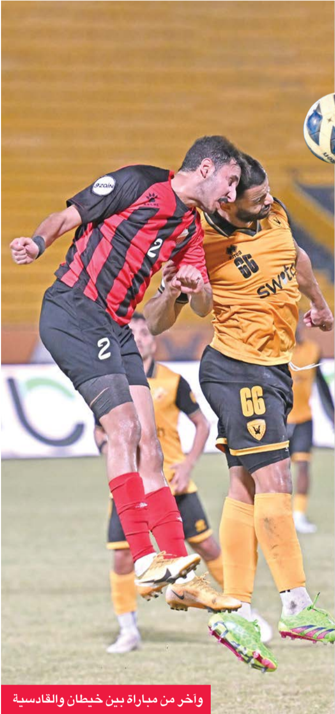
واخر من مباراة بين خيطان والقادسية