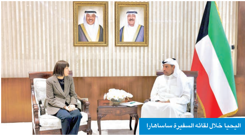
اليحيا خلال لقائه السفيرة ساساهارا

التقى وزير الخارجية، عبدالله اليحيا، أمس الأول، سفيرة الولايات المتحدة الأميركية لدى الكويت، كارين ساساهارا، في مكتبه بديوان عام وزارة الخارجية. وتم خلال اللقاء استعراض العلاقات الثنائية الوثيقة والتعاون الاستراتيجي القائم بين الكويت والولايات المتحدة، وبحث عدد من الموضوعات محل الاهتمام المشترك.