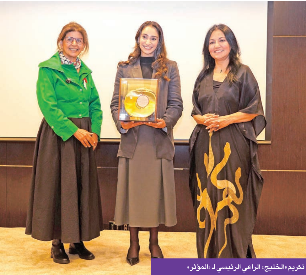
تكريم «الخليج» الراعي الرئيسي لـ «المؤثر»