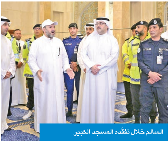
السالم خلال تفقده المسجد الكبير

تفقد محافظ العاصمة الشيخ عبدالله السالم، مساء أمس الأول، مسجد الدولة الكبير لمتابعة الاستعدادات الجارية لاستقبال المصلين في العشر الاواخر من شهر رمضان المبارك.