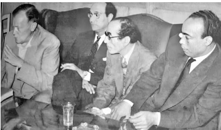
بيرم التونسي ومحمد عبد الوهاب ومعهما مأمون الشناوي ومحمد القصبجي

وفي عام 1940، التقى بيرم مع كوكب الشرق أم كلثوم، وكتب لها 33 أغنية تضمنتها أفلامها السينمائية وحفلاتها الغنائية، منها «الورد جميل»، الأمانات، أنا في انتظارك، هو صحيح الهوى غلاب. وغنى له الموسيقار محمد عبد الوهاب أغنيتين فقط هما «ملاحا عيشة الفلاح»، و«يلي زرعتوا البرتقان»، والبرتقان في اللهجة العامية المصرية هو «البرتقال»، وتقول كلمات الأغنية: «باللي زرعتوا البرتقان، بللا اجمعوه، أن الأوان بللا اجمعوه، يا محلا ربحته بين الجنان، يا محلا شكله والخذ باين، دا الفص منه يسوا خزاين، يا رب كتر البرتقان،