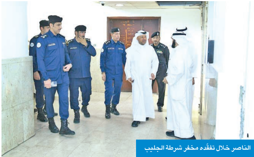
الناصر خلال تفقده مخفر شرطة الجليب

وبحث الحلول لتخفيف الازدحامات المرورية وخدمة اهالي المنطقة، لاسيما في شهر رمضان المبارك، وخاصة في العشر الاواخر وكثرة المصلين.