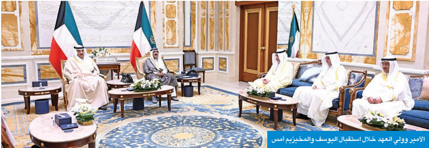
الأمير وولي العهد خلال استقبال اليوسف والمخيزيم أمس

بعد صدور المرسوم الأميري بتعيين صبيح المخيزيم، وزيراً للكهرباء والماء والطاقة المتجددة، استقبل سمو أمير البلاد الشيخ مشعل الأحمد بقرص بيان، أمس، بحضور سمو ولي العهد الشيخ صباح الخالد، رئيس مجلس الوزراء بالإتابة الشيخ فهد اليوسف، حيث قدم لسموه المخيزيم، الذي أدى اليمين الدستورية أمام سموه بمناسبة تعيينه في منصبه الجديد.