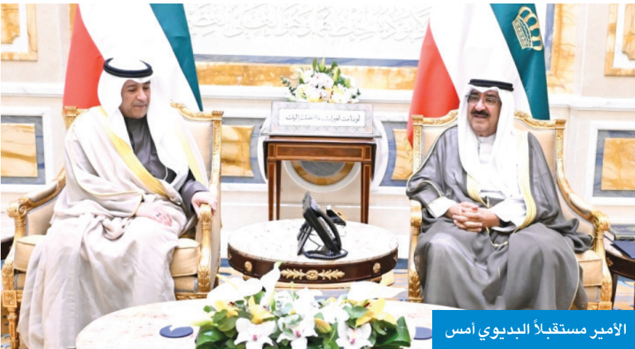
الأمير مستقبلاً البديوي أمس

وأكدت المصادر حرص المخيزيم على العمل بروح الفريق الواحد لتنفيذ الاستراتيجيات الهادفة إلى تحقيق التنمية المستدامة، مشدداً على ضرورة مواصلة تطوير الخدمات بما يتماشى مع رؤية الكويت المستقبلية.