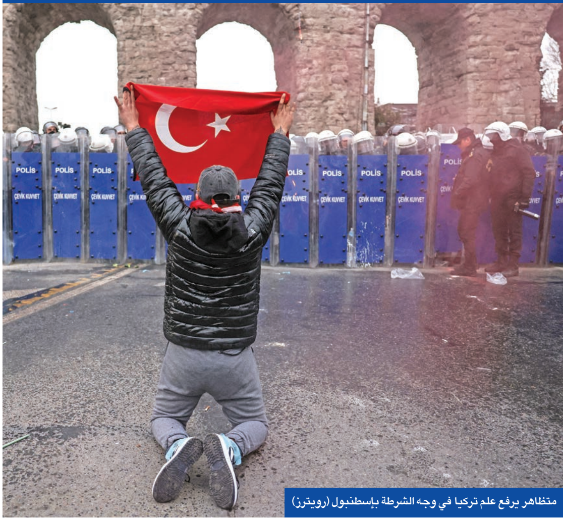
متظاهر يرفع علم تركيا في وجه الشرطة بإسطنبول

تجمعات يومية منذ توقيف إمام أوغلو الاربعاء الماضي بـ 7 نهم بينها الفساد ودعم منظمة إرهابية. ويواجه إمام أوغلو احتمال حرمانه من حقه في الترشح للانتخابات الرئاسية المقبلة بسبب قضية أخرى مرتبطة بسحب شهادته الجامعية. وتنتهي ولاية أردوغان الثانية في 2028. وينص الدستور التركي على ولايتين رئاسيتين كحد أقصى، لكن هناك جدلاً حول ما إذا كنت ولايته الأولى (2014 - 2019) تُحسب بعد أن عدل الدستور في 2017 للتحويل إلى نظام رئاسي. وقانونياً يحق لأردوغان (71 عاماً) الترشح في حال دعا البرلمان إلى انتخابات مبكرة. ويعتبر ترشيح امام اوغلو رسمياً باسم أكبر أحزاب المعارضة تحدياً كبيراً للسلطات التركية، حيث سيتم التشكيك بأي اقتراع قد يقاطعه الحزب الجموري أو قد يمنع فيه مرشحه من المشاركة.