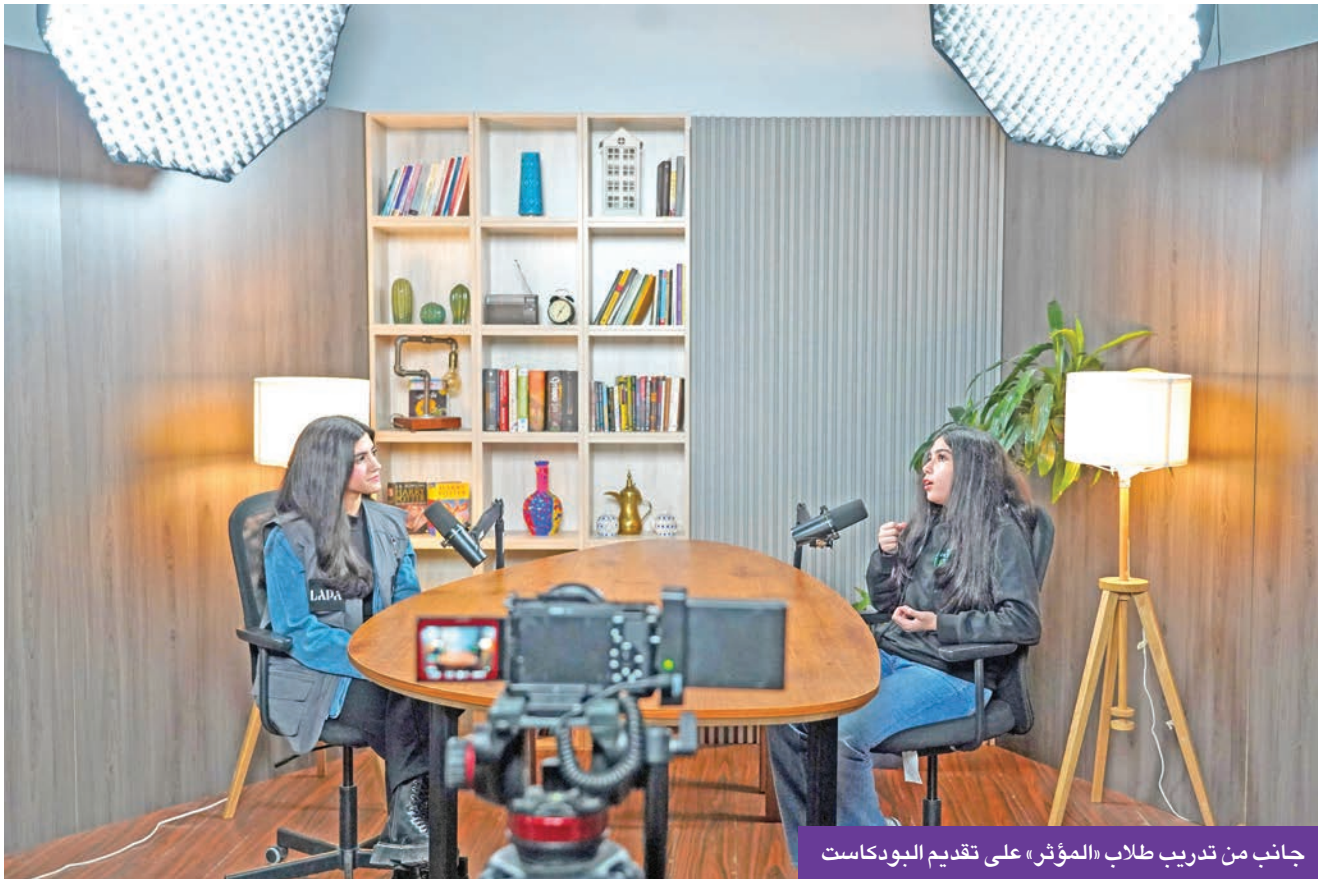
جانب من تدريب طلاب «المؤثر» على تقديم البودكاست