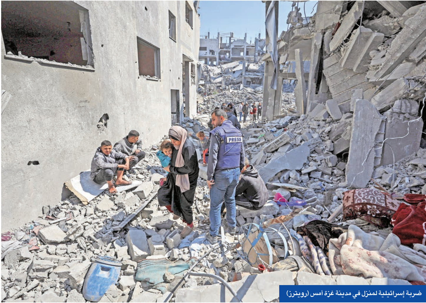
ضربة إسرائيلية لمنزل في مدينة غزة أمس

رغم الحراك المصري لإعادة وقف إطلاق النار في غزة إلى مساره، عكف رئيس الوزراء الإسرائيلي بنيامين نتنياهو وفريقه الأمني على التخطيط لشن هجوم بري واسع النطاق يهدف إلى احتلال أجزاء من الأراضي والسيطرة عليها ويسمح لهم أخيراً بهزيمة حركة حماس.