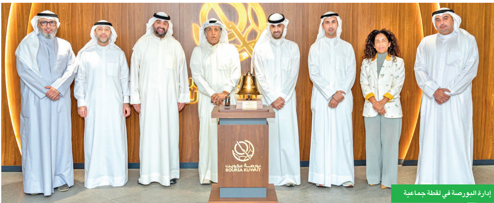
إدارة البورصة في لقطة جماعية