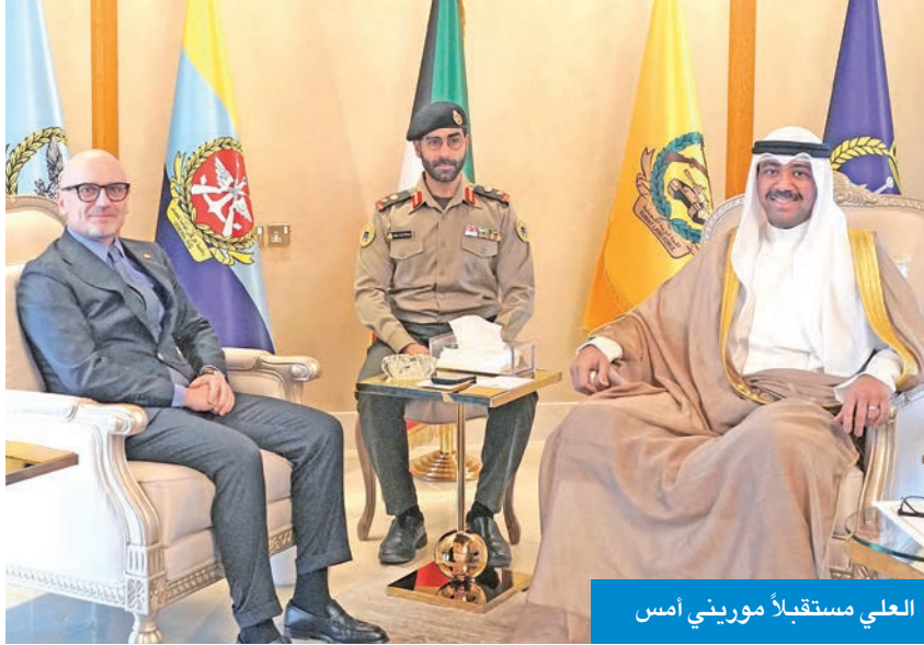
العلي مستقبلاً موريني أمس

استقبل وزير الدفاع وزير الداخلية بالإتابة، الشيخ عبدالله العلي، في مكتبه بوزارة الدفاع، صباح أمس، سفير إيطاليا لدى الكويت لورينزو موريني.