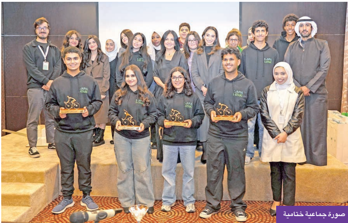
صورة جماعية ختامية

بقفزة كبرى في المحتوى والتدريب برعاية بنك الخليج