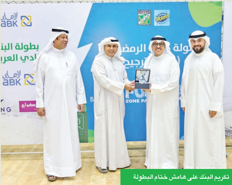
تكريم البنك على هامش ختام البطولة

الشرائح. وأكد آل بن علي، في نهاية تصريحه، أن البنك الأهلي الكويتي ملتزم بمسؤوليته الاجتماعية، التي تشكل جزءاً رئيسياً ضمن دوره كمؤسسة مصرفية رائدة في السوق الكويتي.