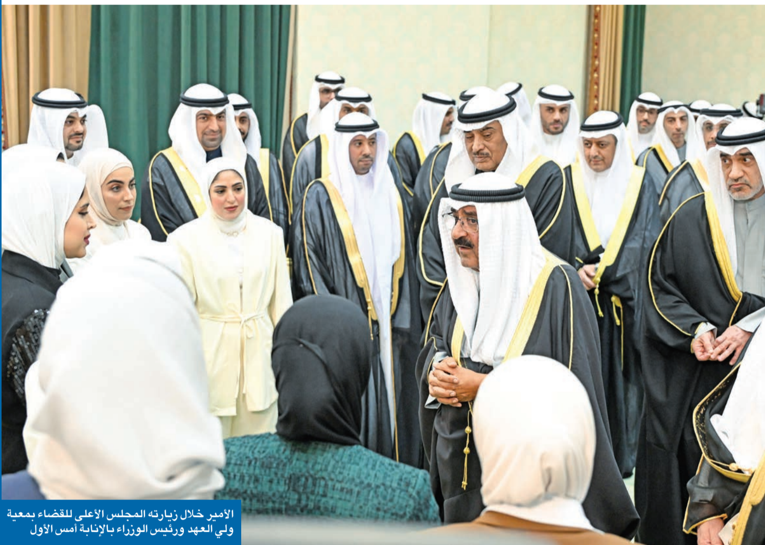
الأمير خلال زيارته المجلس الأعلى للقضاء بمعية ولي العهد ورئيس الوزراء بالإنابة أمس الأول

مبدأنا عدم التدخل في أحكام القضاء ودعم استقلاليتته وتنفيذ أحكامه على الكبير قبل الصغير