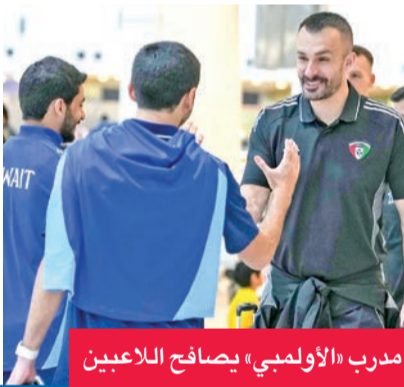
مدرب «الأولمبي» يصافح اللاعبين