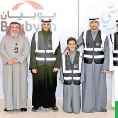
فريق بنك بوبيان

وأضاف أن شراكتنا مع مبادرة نعمتي باتت جزءاً أساسياً من جهود «بوبيان» في المسؤولية الاجتماعية وتطبيق المعايير البيئية والاجتماعية والحوكمة ESG. ومن خلال هذه المبادرات، نعمل على تقليل الفاقد الغذائي وتعزيز الاستهلاك، وهو ما يسهم في الحد من الانبعاثات الضارة وتحقيق معايير الاستدامة العالمية وتحقيق أهداف التنمية المستدامة،