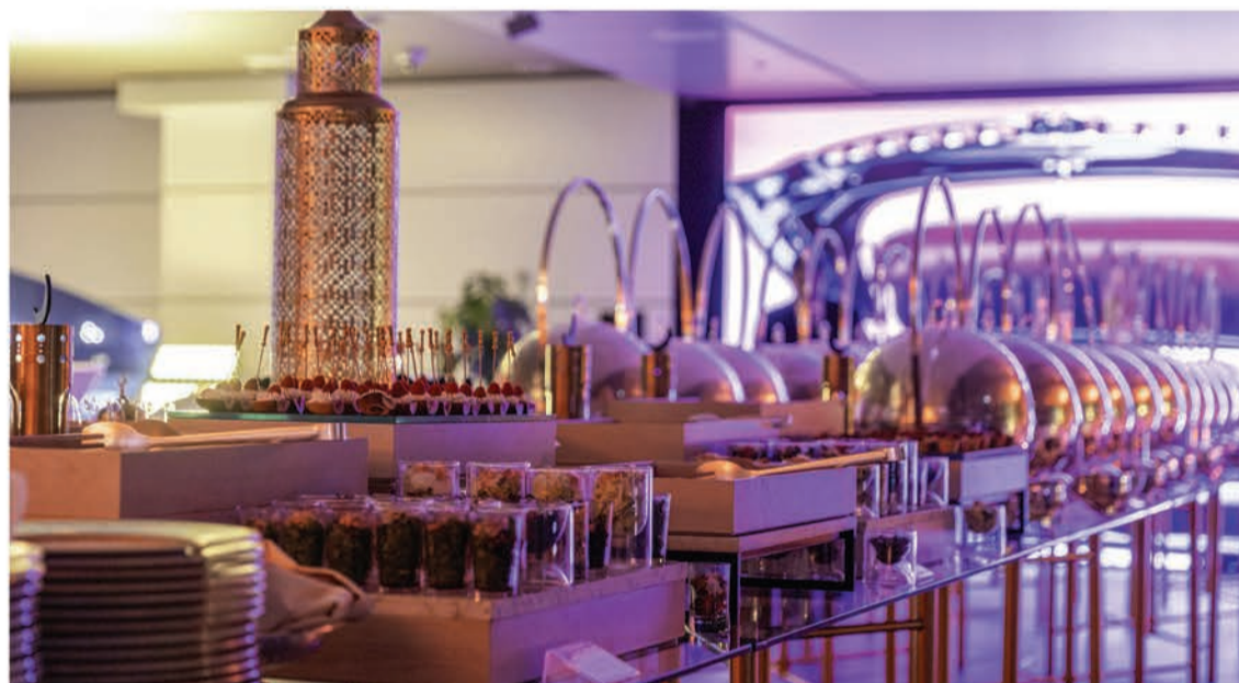
بوفيه فاخر مصحوب بتصميم حديث لأجواء رمضان