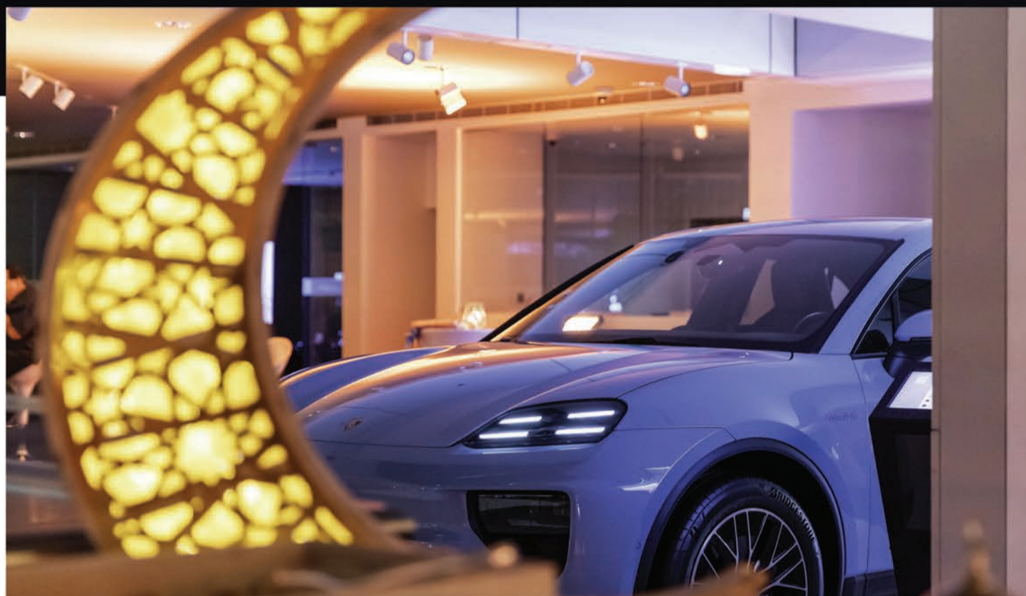
سيارة مكان الجديدة والكهربائية كلياً