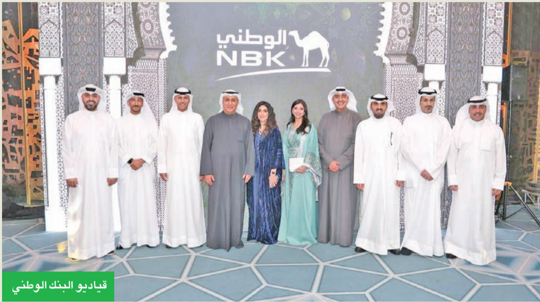
قياديو البنك الوطني

بالتعاون مع نادي المصارف وبحضور قيادات القطاع المصرفي