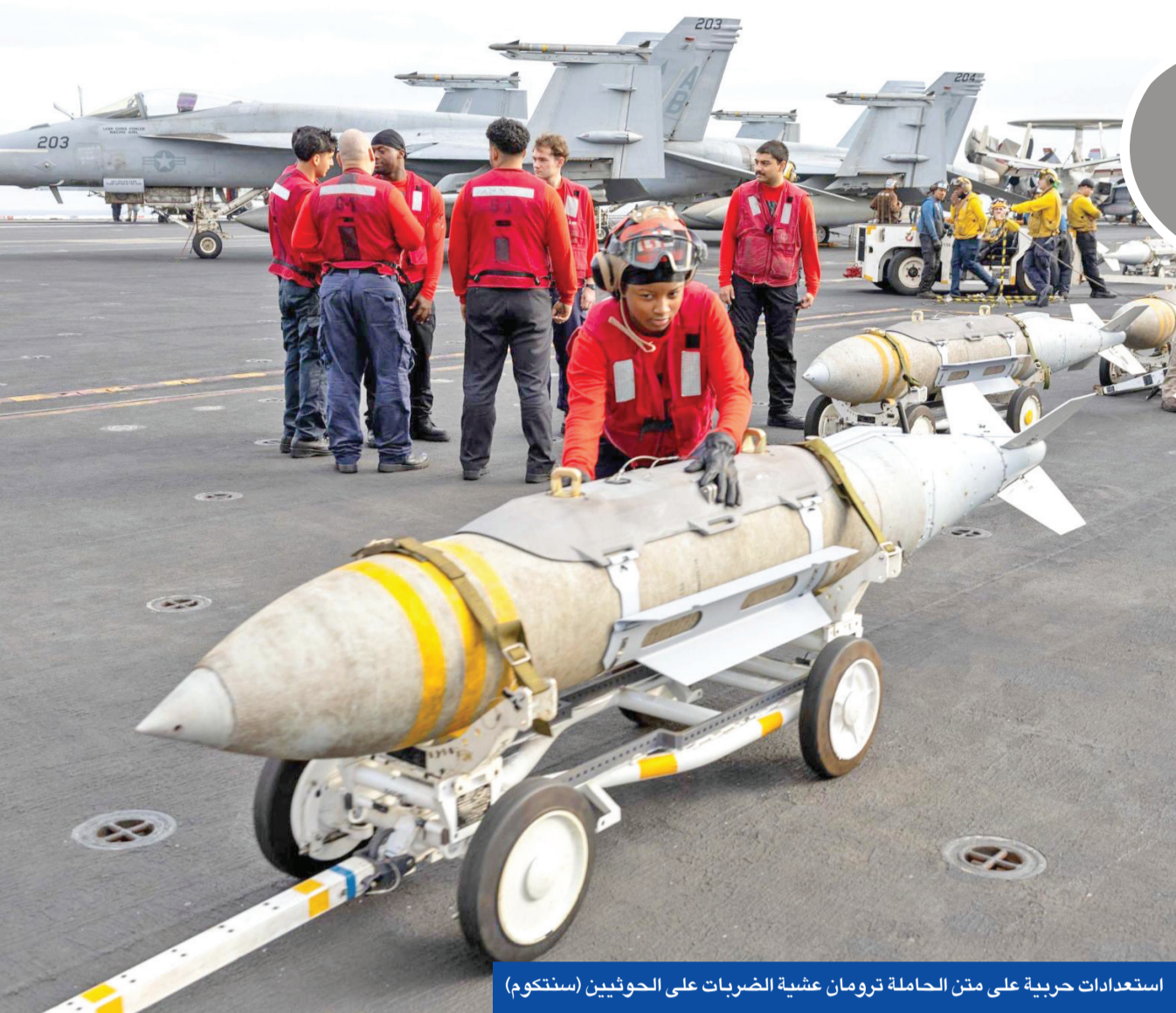
ستعدادات حربية على متن الحاملة ترومان عشية الضربات على الحوثيين

مديرة المخابرات الأميركية تدعو المتضررين من اضطراب التجارة في البحر الأحمر إلى تبني إجراءات ضد الحوثيين