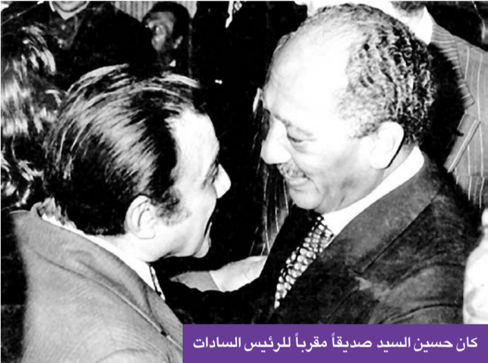
كان حسين السيد صديقاً مقرباً للرئيس السادات

وتابع موسيقار الأجيال: «وضعنا الخطوط العريضة للأغنية من ثلاثة فصول، الأول، شخصان يقفان وتمر بجوارهما فتاة جميلة تلفت نظرهما، والثاني، يقع أحدهما في حبها، والثالث، عندما يرسل لها خطابًا يشرح لها فيه عاطفته تجاهها، ووقتها تعرضت للنقد من قبل أحد الصحافيين