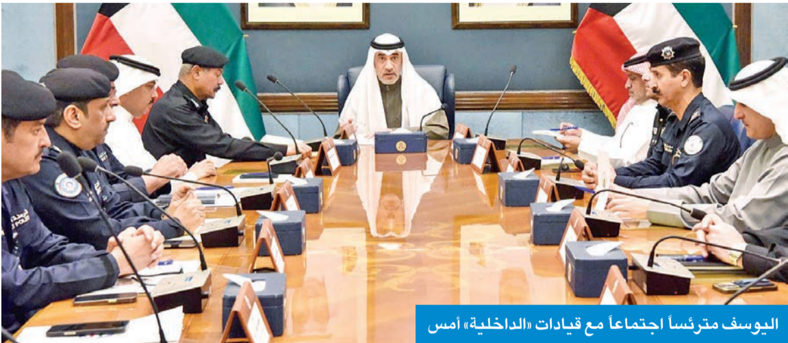
اليوسف مترأساً اجتماعاً مع قيادات «الداخلية» أمس

الأمنية والمروورية التي تهدف إلى تأمين المساجد، وتنظيم حركة المرور في المناطق الحساسة التي تشهد كثافة عالية خلال هذه الفترة.