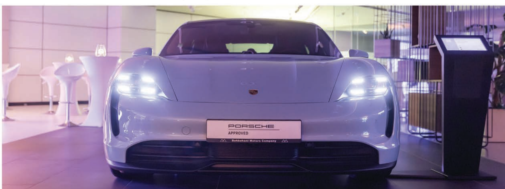
سيارة تاكان الجديدة والكهربائية كلياً تتألق في الحدث

لمعرفة المزيد عن الفعاليات القادمة، يمكنكم زيارة موقع مركز بورشه الكويت، أو متابعة حسابات بورشه الرسمية في الكويت عبر قنوات التواصل الاجتماعي للاطلاع على أحدث المستجدات والتحديثات.