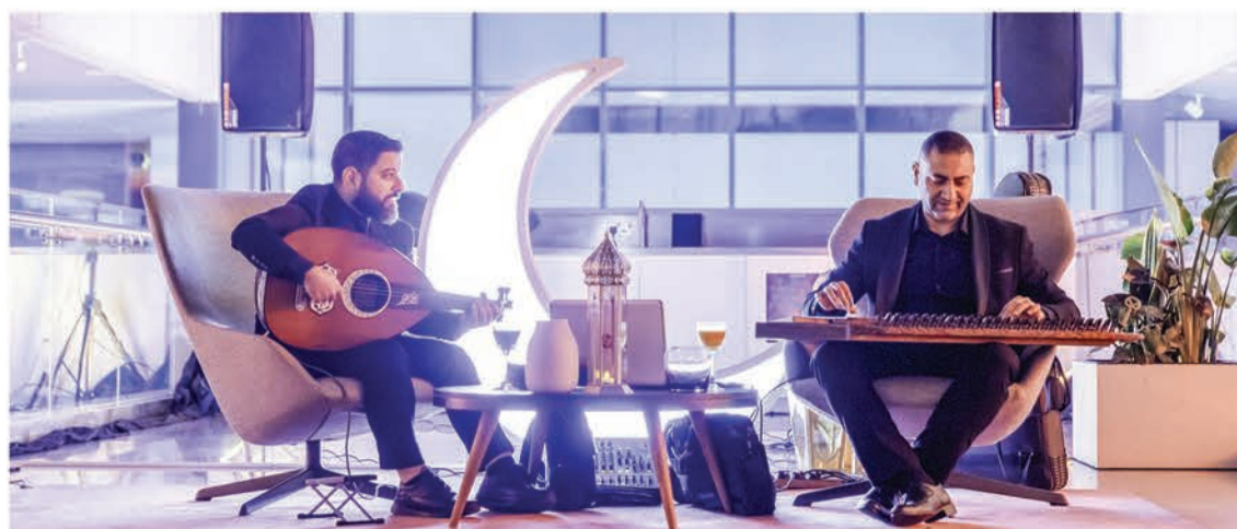
لحظة من الحزف الحي للفرقة الموسيقية التي منحت لمسة إضافية على الأجواء

وينظم المركز هذه الفعالية تعبيراً عن التزامه الدائم بتقديم تجارب استثنائية تتخطى حدود الابتكار في عالم السيارات، وتعكس روح التواصل والتميز التي تُثري علاقته بمجتمعه.