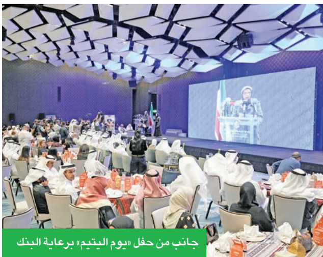
جانب من حفل «يوم الليتم» برعاية البنك

للهيئة العامة للمعاقين في المركز العلمي، والذي يهدف إلى متابعة حقوق ذوي الإعاقة والعمل على توعية المجتمع بها، إضافة إلى توفير فرص متساوية لهم في التعليم والمشاركة الفاعلة بالمجتمع. وتم تأسيس هذا الفريق بموجب قانون ذوي الإعاقة، مادة 8/2010، ويقوم بدور هام في تعزيز حماية لذوي الإعاقة، من خلال تنظيم حملات إعلامية وفعاليات توعوية، وكذلك دورات تدريبية لتحسين الأداء الحياتي والمجتمعي للأشخاص ذوي الإعاقة.