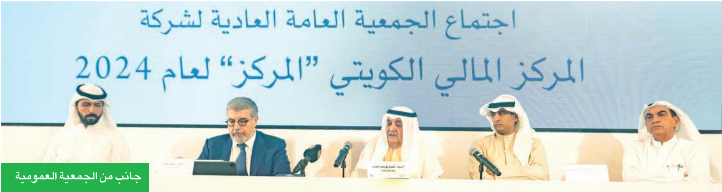
جانب من الجمعية العمومية

تشمل الدين الخاص واستثمارات أسهم الملكية الخاصة واستثمارات البنية التحتية. واستجابة لديناميكيات الأسواق المتغيرة، أطلقت المركز حلولاً استثمارية متقدمة تلبي الطلب المتزايد على الفرص المبتكرة والمتنوعة.