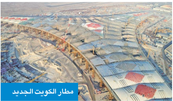
مطار الكويت الجديد