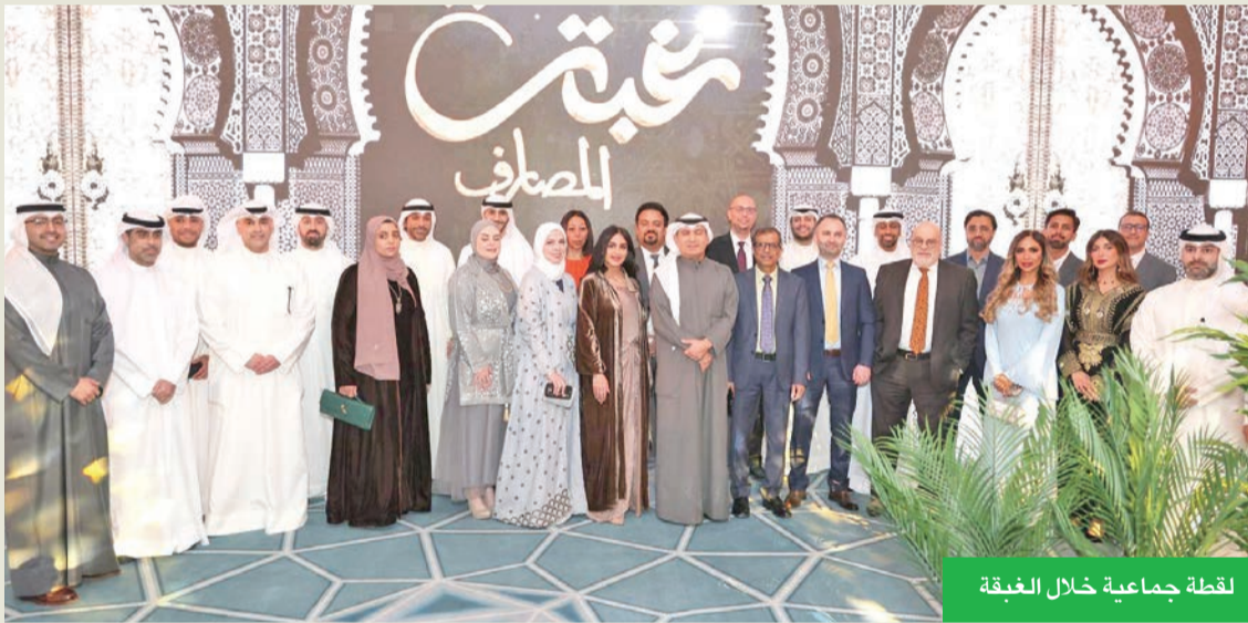
لقطة جماعية خلال الغبقة