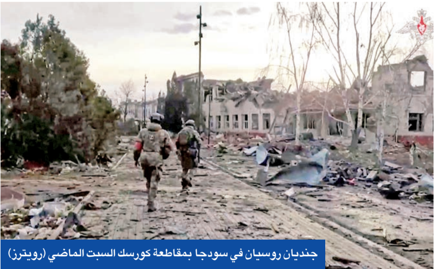
جندیان روسیان فی سودجا بمقاطعة كورسك السبب الماضي

«كس»، ان ماركرون وستارمر يلعبان لعبة غبية، ويريدان قديم المساعدة العسكرية نانازين الجدد في كيف، وهذا عني الحرب مع الناتو، وقال: «ستشيرنا ترامب، أيها الوجدان». وفي ظل إصرار إدارة ترامب