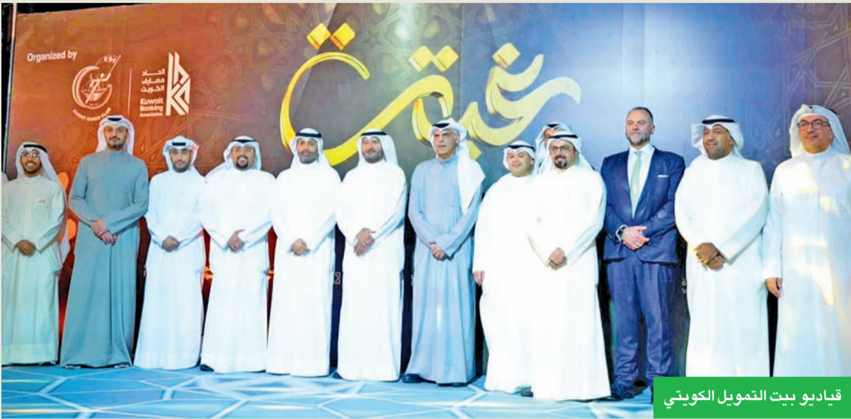
قياديو بيت التمويل الكويتي

كما أكد أهمية هذه الفعاليات الاجتماعية في توليد العلاقات بين العاملين في القطاع المصرفي، موضحاً أن تنمية روح التعاون تسهم في تحسين بيئة العمل وتعزيز تحقيق الأهداف المشتركة.