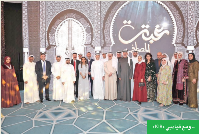
...ومع قياديي «KIB»

تنظم اتحاد مصارف الكويت، بالتعاون مع نادي المصارف، الغبقة الرمضانية السنوية يوم الثلاثاء 13 الجاري في فندق الفورسيزون، وسط حضور كبير من قيادات القطاع المصرفي. وشارك في الفعالية محافظ بنك الكويت المركزي ورئيس وأعضاء مجلس إدارة الاتحاد، رؤساء مجالس إدارات البنوك