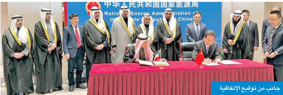
جانب من توقيع الاتفاقية

وأضاف أن هذا أكبر دليل على جديةنا في المضي قدماً على النهج الذي حدده سمو أمير البلاد في طريق تقوية علاقاتنا مع الصين في كل المجالات الحيوية، خاصة تدعيم أفاق التعاون الاقتصادي بين البلدين في ظل ما تشهده العلاقات الثنائية من تعاون وثيق في الجانب الاستثماري والأنشطة التجارية، وأثر ذلك على الاقتصاديين الكويتي والصيني، لافتاً إلى أن الأمور تسير بين الجانبين بفعالية وضخمة، حيث