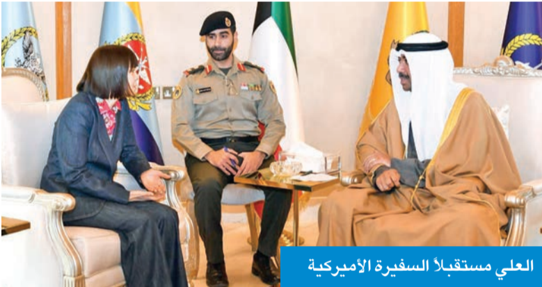
العلي مستقبلاً السفارة الأميركية

استقبل وزير الدفاع والوزير بالإنابة، الشيخ عبدالله العلي، في مكتبه صباح أمس، كل على حدة، سفيرة الولايات المتحدة الأميركية لدى البلاد، كارين ساساهارا، وسفيرة المملكة المتحدة، بليندا لويس.