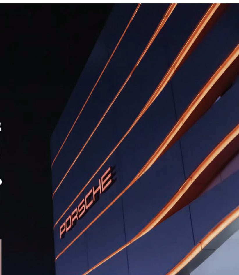
مركز بورشه الكويت، أكبر وجهة لبورشه في الشرق الأوسط وشمال إفريقيا