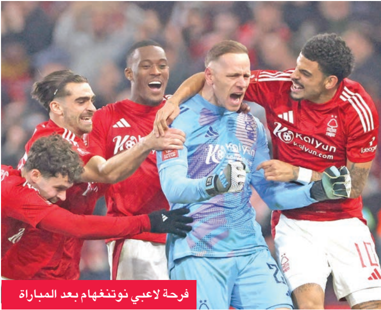
فرحة لاعبي نوتنغهام بعد المباراة

بلغ نوتنغهام فورست دور الثمانية ببطولة كأس الاتحاد الإنكليزي لكرة القدم، بعد فوزه على ضيفه إيسويتش تاون 5 - 4 بضربات الترجيح، بعد نهاية الوقتين الأصلي والإضافي للمباراة بالتعادل 1-1. وسبواحه نوتنغهام فورست، في الدور المقبل، فريق برايتون الذي نجح بدوره في بلوغ ربع النهائي بعد فوزه على نيوكاسل 2-1، ضمن منافسات دور الستة عشر. وجاء التأهل لدور الثمانية ليؤكد الصخرة التي يعيشتها الفريق تحت قيادة المدرب البرتغالي نونو سبريتو سانتو، حيث يحتل الفريق المركز الثالث برصيد 48 نقطة في ترتيب الدوري.