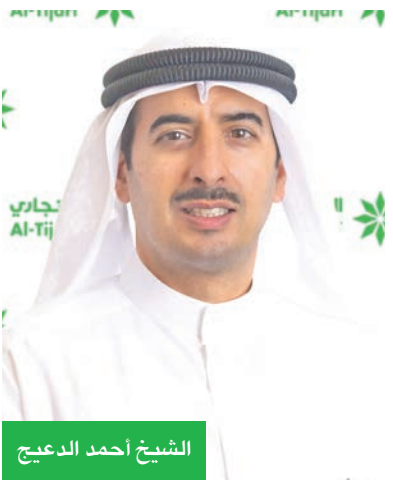
الشيخ أحمد الدعيج

يعكس نجاح البنك في تطبيق استراتيجيته والتحسين الملحوظ في جودة الأصول والربحية، على خلفية ارتفاع هوامش الفائدة والدخل من الرسوم والعمولات، إلى جانب الرسلة القوية والإحتياطيات والمخصصات الإضافية المرتفعة التي تمنح البنك قدرات كبيرة على استيعاب أي خسائر ائتمانية، ويشير رفع التصنيف أيضاً إلى المصداق القوية التي يتمتع بها البنك لجهة السيولة. على صعيد آخر، نجح البنك خلال العام في استكمال برنامج إصدار سندات مساندة ضمن الشريحة الثانية لرأس المال، بعد إصدار الشريحة الثانية بقيمة إجمالية بلغت 50 مليون دينار. إن المتحصلات من إصدار السندات تساهم في تعزيز قدرات البنك على تمويل المشاريع الكبرى.