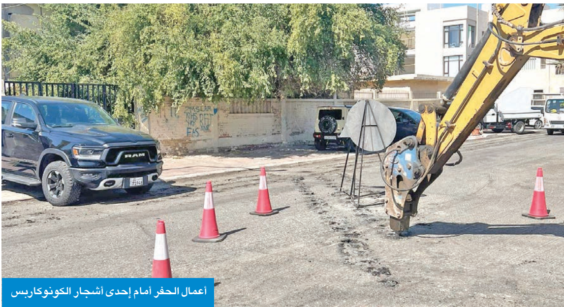
أعمال الحفر أمام إحدى أشجار الكونوكاربس