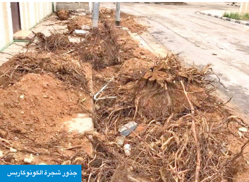
جذور شجرة الكونوكاربس

● دول الخليج تراجعت عن زراعتها بسبب أضرارها واستعاضت عنها بأشجار مفيدة