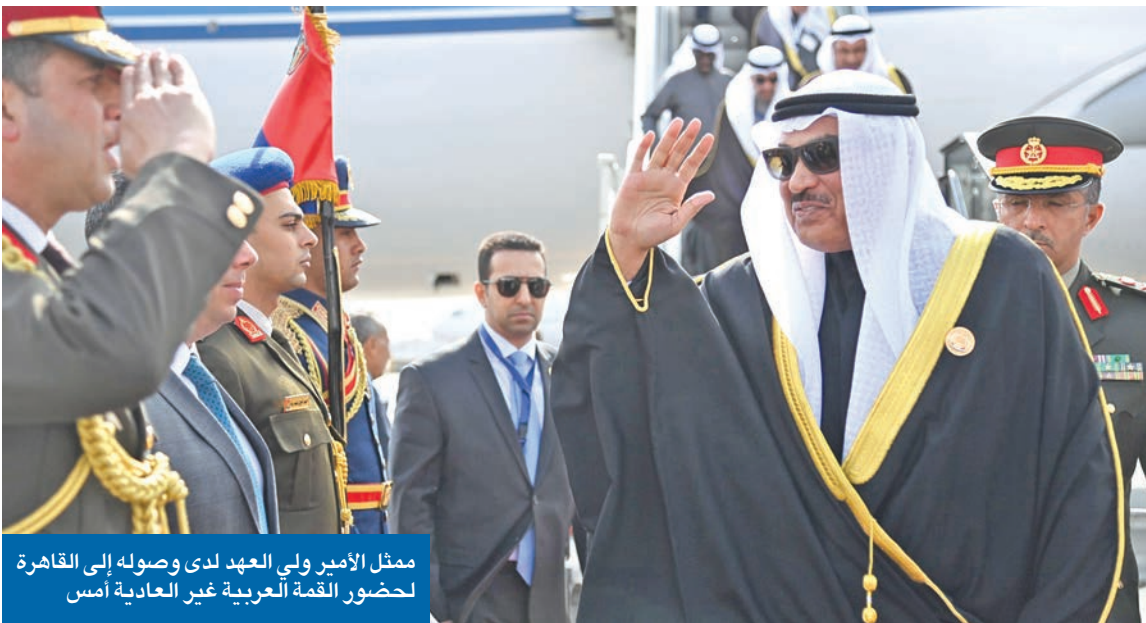
ممثل الأمير ولي العهد لدى وصوله إلى القاهرة لحضور القمة العربية غير العادية أمس

تبنت القمة العربية الطارئة غير العادية، التي عقدت في القاهرة أمس، بحضور ممثل سمو أمير البلاد الشيخ مشعل الأحمد، سمو ولي العهد الشيخ صباح الخالد، ورؤساء وممثلي الدول الأعضاء، الخطة المصرية لمستقبل غزة، والتي تتضمن مقترحات تفصيلية لإعادة إعمار القطاع الفلسطيني بعد أن دمرته الحرب الإسرائيلية تماماً.