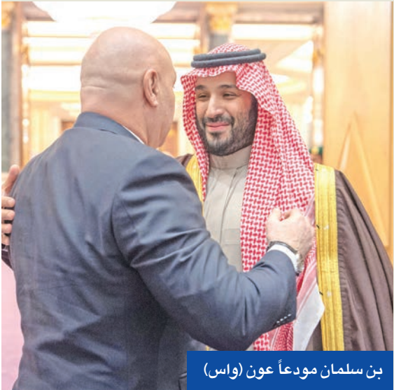
بن سلمان مودعاً عون

أكد بيان سعودي - لبناني مشترك، صدر في ختام زيارة الرئيس اللبناني جوزيف عون للسعودية، وحضر ولي العهد السعودي الأمير محمد بن سلمان، أهمية حصر السلاح بيد الدولة في لبنان، فيما اتفق الجانبان على دراسة سبل استعادة العلاقات بالكامل بين البلدين، بما في ذلك رفع الحظر عن التصدير من لبنان إلى المملكة، وعن سفر الرعايا السعوديين إلى بيروت.