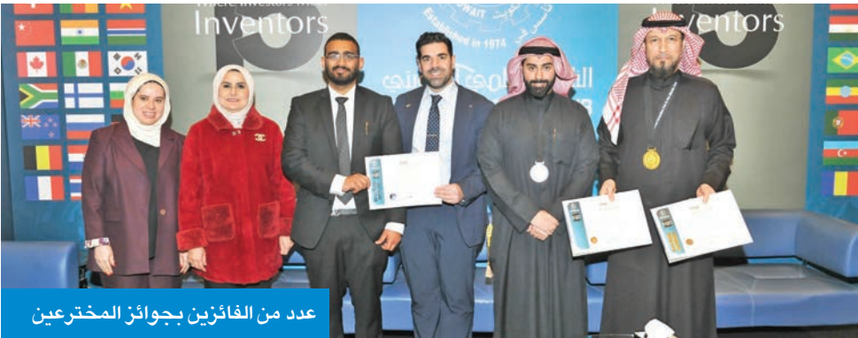
عدد من الفائزين بجوائز المخترعين

وقال إن الأمطار اليوم ستكون مصحوبة برياح شرقية إلى جنوبية شرقية خفيفة إلى معتدلة السرعة تشتت من الساعات الأولى من الصباح وتثير الغبار وتقل معها الرؤية الأفقية على بعض المناطق خاصة المكشوفة. وأوضح العلي أن الأمطار ستكون مصحوبة بنشاط في الرياح الجنوبية الشرقية تصل سرعتها إلى أكثر من 50 كيلومترا في الساعة تؤدي إلى انخفاض الرؤية الأفقية على بعض المناطق، خصوصاً المكشوفة، وارتفاع الأمواج البحرية لأكثر من 6 أقدام. وتوقع أن يبدأ التحسن التدريجي للطقس من ظهر السبت، داعياً المواطنين والمقيمين لمتابعة البشة الجوية من خلال موقع الإدارة، والتطبيق الرسمي الخاص بالهواتف الذكية، لمعرفة آخر تطورات الطقس، والإطلاع على التحذيرات الجوية في حال إصدارها.