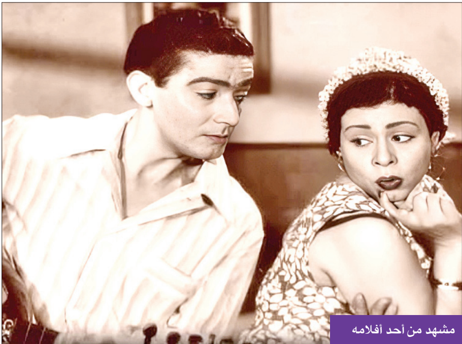
مشهد من أحد أفلامه

للمرشد، جيشنا وشعبنا كلنا شعارنا، إن دعا النداء نبذل الدماء، للوطن فداء».