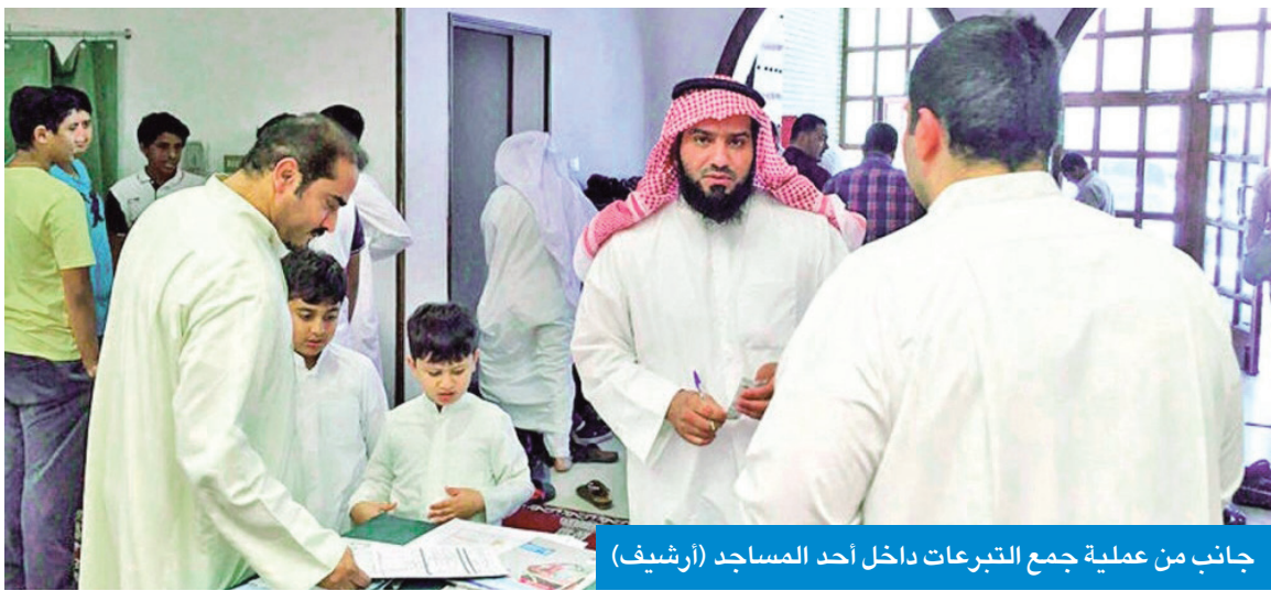
جانب من عملية جمع التبرعات داخل أحد المساجد

وأضافت المصادر، أنه «من بين الاشتراطات أيضاً عدم السماح بإقامة الخيام الرضائية داخل حدود المساجد، كما أن مسؤولية ولائم الإفطار تقع على القائمين على المشروع وبإشراف من إمام المسجد، ويمنع منعاً باتاً إيصال التيار الكهربائي الخاص بالمسجد بالخيام الرضائية المجاورة لأسوارها، حفاظاً على صحة وسلامة المصلين، حيث لا تخضع تلك الخيام إلى إشراف أو مسؤولية الوزارة».