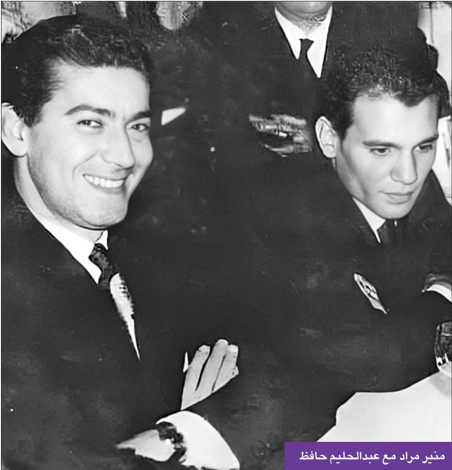
منير مراد مع عبدالحليم حافظ

الغيرة الزائدة تتسبب في انفصاله عن زوجته الفنانة سهير البابلي