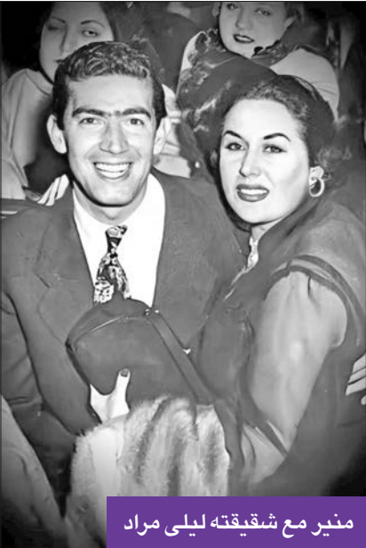
منير مراد مع شقيقته ليلى مراد

وتعد «بالاتحاد» من الألحان النادرة لمراد في مجال الأغاني الوطنية، وغنّتها ليلى مراد في بداية ثورة يوليو عام 1952، وتقول كلماتها «على الإله القوي الإعتماد، بالاتحاد والنظام والعمل، انهضي يا مصر يا خير البلاد، وانعمي بالمجد وامضي