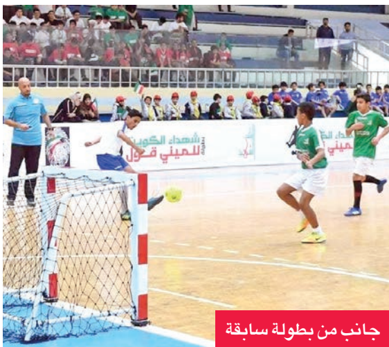
جانب من بطولة سابقة

بدون حارس مرمي، ويبلغ طول الملعب 30م وعرضه 15م، بينما يبلغ طول خط المرمى وارتفاعه متراً واحداً، ويسمح بإجراء عدد غير محدود من التغييرات.