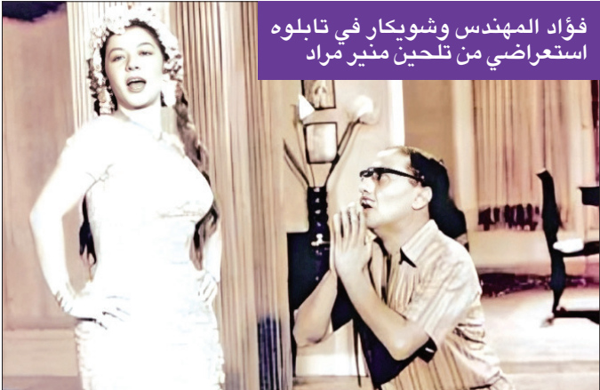
فؤاد المهندس وشويكار في تابلوه استعراضى من تلحين منير مراد

وتزوج مراد للمرة الثالثة من ميرفت حسني شريف، ويقال إنها أخت الفنان ناصر حسني من الأب، واستمر ذلك الزواج حتى وفاته إثر أزمة قلبية مفاجئة، في 17 أكتوبر 1981، وبعد سنوات من الإبداع المتصل، أثرى فيها مكتبة الموسيقى العربية بالأحانه المتفرّدة، والسابقة لعصرها، ولكنها لا تزال حاضرة في وجدان عشاق أعماله الفنية الخالدة.