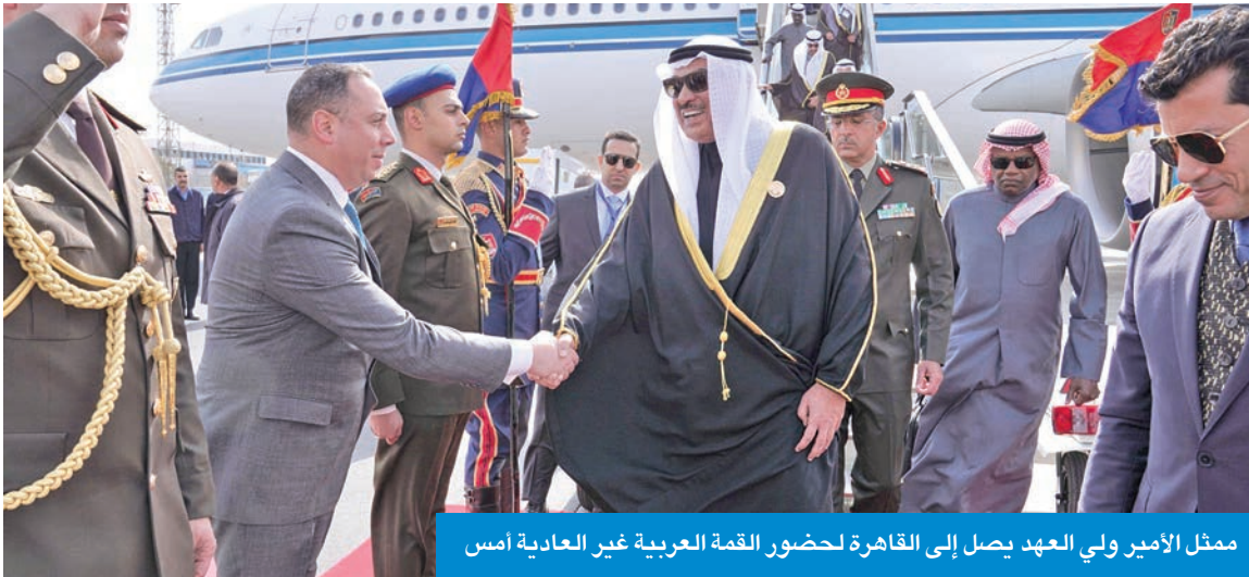
ممثل الأمير ولي العهد يصل إلى القاهرة لحضور القمة العربية غير العادية أمس

الكويت لدى مصر غانم الغانم ومساعد وزير الخارجية لشؤون الوطن العربي السفير أحمد البكر ومنذوب دولة الكويت الدائم لدى جامعة الدول العربية السفير طلال المطيري.