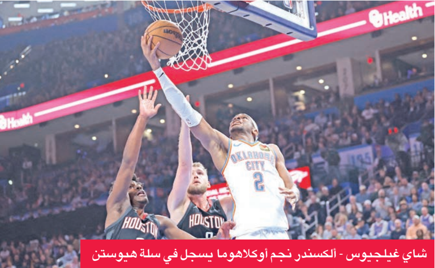
شاي غيلجيوس - الكسندر نجم أوكلاهوما يسجل في سلة هيوستن

وانتهى غيلجيوس-الكسندر، أفضل مسجل في الدوري، وأحد أبرز المرشحين لنيل جائزة أفضل لاعب في الموسم المنتظم، المباراة برصيد 51