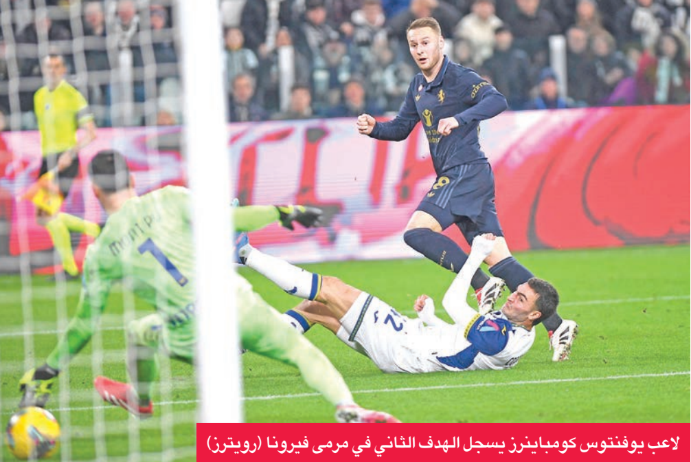
لاعب يوفنتوس كومباينرز يسجل الهدف الثاني في مرمى فيرونا

ويأتي الفوز على فيرونا، الذي لم يسبق له أن حقق أي انتصار، على «بيانكونيري» في تورينو على صعيد الدوري في تاريخ مواجهتهما، وفاز مرة واحدة في معقل منافسه ضمن كل المسابقات (ربع نهائي الكأس 1-0 في أبريل 1963)، قبل مواجهة شاقاة الأحد في تورينو ضد أتلانتا الثالث الذي يتقدم عليه بفارق ثلاث نقاط، على أن يلتقي بعدها فيورنتينا السابع في فلورنسا. ولم يكن الفوز على فيرونا سهلا،