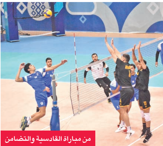
من مباراة القادسية والتضامن

وفي المقابل، يدرّج مدرب الأخضر التونسي هيثم الحمادي أن مهمته ستكون صعبة، لذا سيعمل جاهداً على تأمين دفاعاته بشكل جيد، والتركيز على المباريات، خصوصاً من منتصف الشبكة والخط الخلفي، معتمداً على الدومينيكاني أيفيس سانتوس والتشيكوي فينجر.