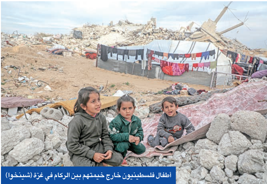
أطفال فلسطينيون خارج خيمتهم بين الركام في غزة

وتتضمن الورقة المصرية عملية إعمار غزة على مرحلتين الأولى لسنتين