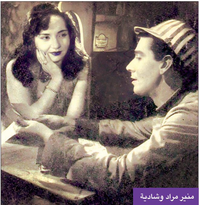
منير مراد وشادية