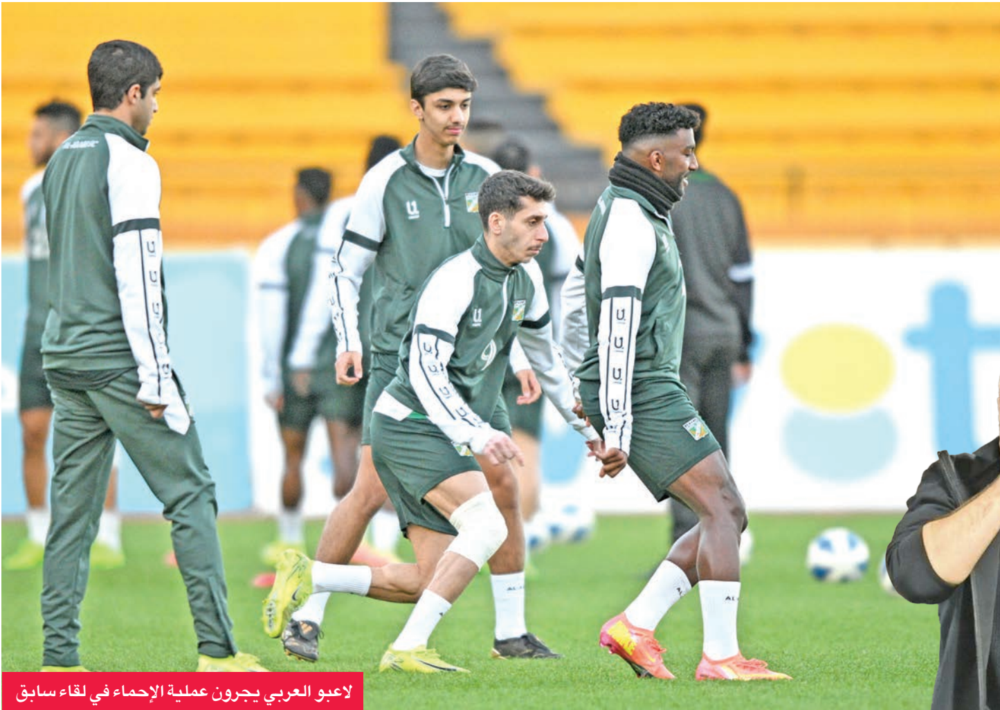
لاعبو العربي يجرون عملية الإحماء في لقاء سابق

يلتقي العربي مع السيب العماني الساعة 9:30 من مساء اليوم على استاد جابر المبارك في ذهاب ربع نهائي دوري التحدي الآسيوي.