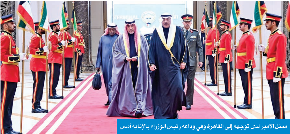
ممثل الأمير لدى توجهه إلى القاهرة وفي وداعه رئيس الوزراء بالإنباء أمس