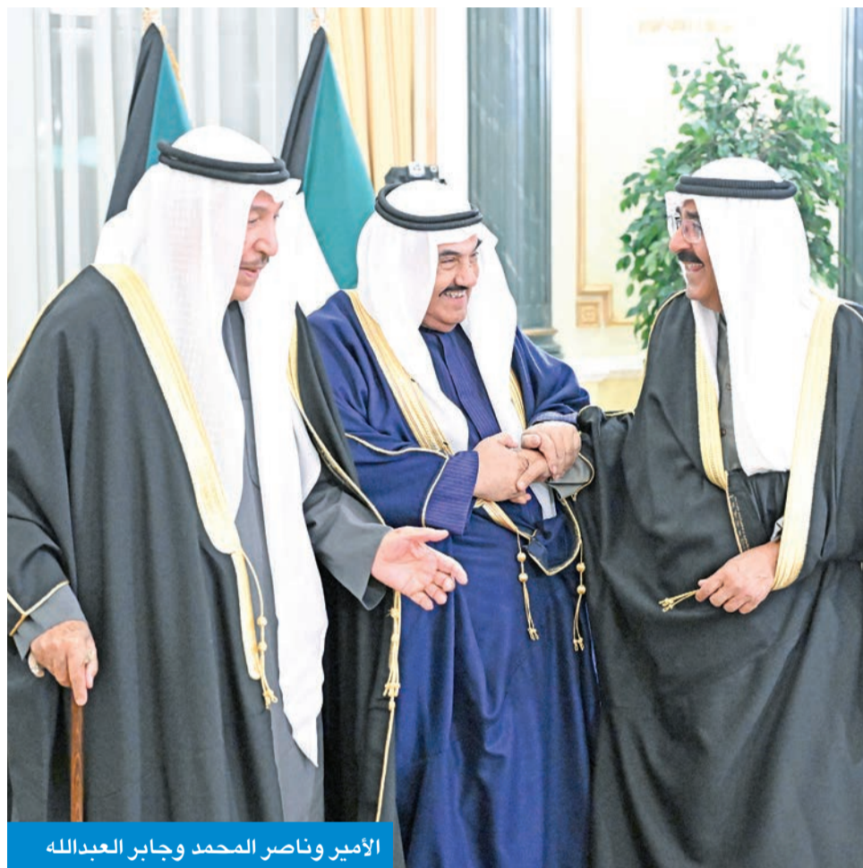
الأمير وناصر المحمد وجابر العبدالله

استقبل سمو ولي العهد الشيخ صباح الخالد، بقصر بيان، صباح أمس، رئيس مجلس الوزراء بالإنابة وزير الداخلية، الشيخ فهد اليوسف.