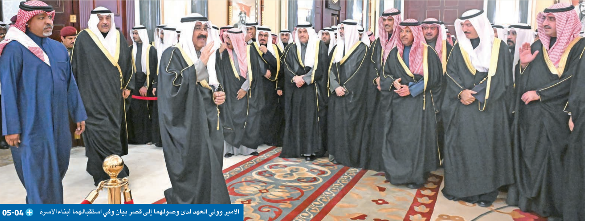
الأمير وولي العهد لدى وصولهما إلى قصر بيان وفي استقبالهما أبناء الأسرة 05-04 +