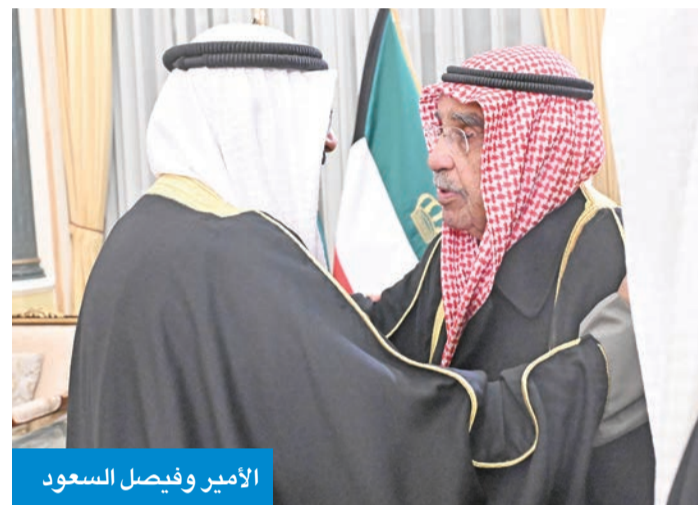
الأمير وفيصل السعود

بمناسبة حلول شهر رمضان المبارك، استقبل سمو أمير البلاد الشيخ مشعل الأحمد، وسمو ولي العهد الشيخ صباح الخالد، وأسرته آل صباح الكرام في ديوان الأسرة بقصر بيان، مساء أمس الأول، جموع المهنتيين بهذا الشهر الفضيل من مواطنين ومقيمين. وقد جسد ذلك روح الأسرة الواحدة في المجتمع الكويتي السني جبل على المحبة والمودة وروح الإخاء، مع دعاء من الجميع بأن تعود هذه المناسبة الفضية على الكويت بالخير واليمن والبركات.