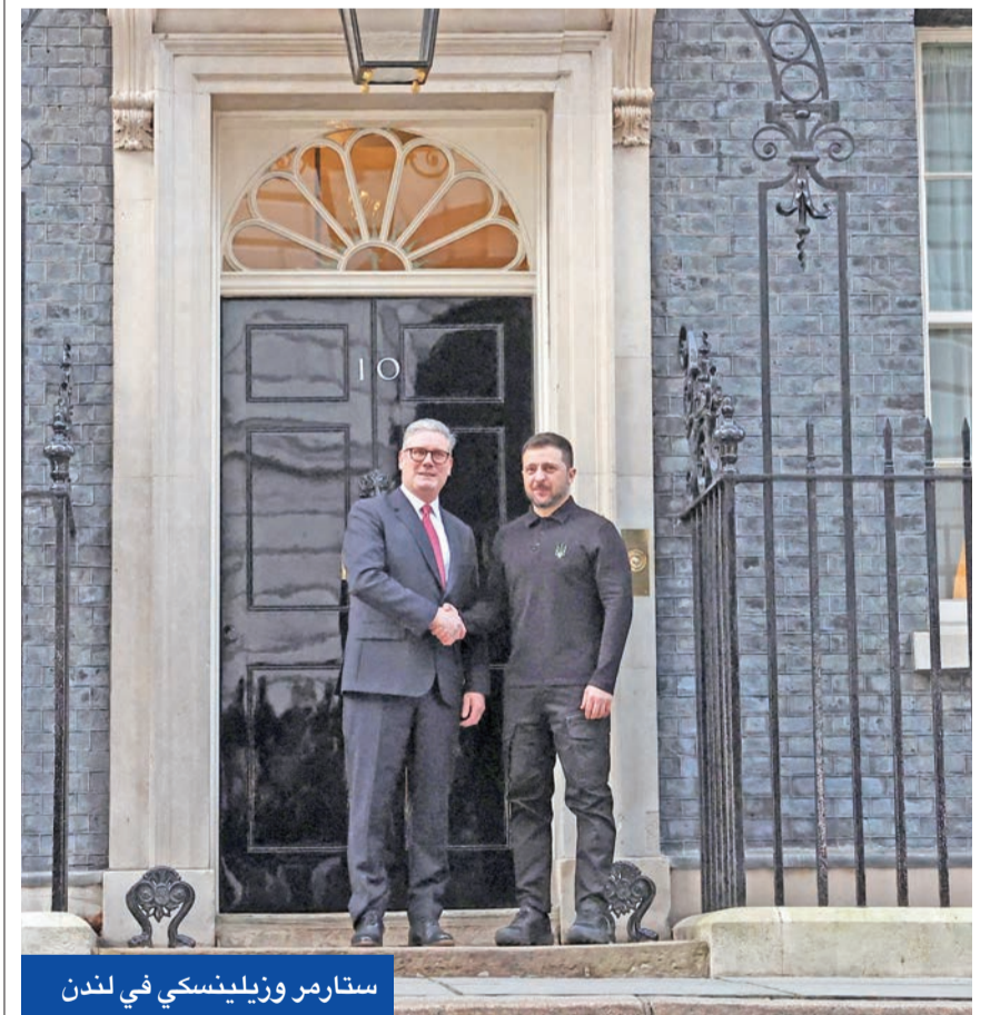
ستارم وزيلينسكي في لندن

بعد المشادة العنيفة بين الرئيس الأميركي دونالد ترامب ونظيره الأوكراني فولوديمير زيلينسكي في البيت الأبيض، بحثت خطة بريطانية، فرنسية لتقدمها إلى ترامب الذي يسعى بقوة إلى إنهاء الحرب في أوكرانيا، في اندفاعه بيري حلفاء واشنطن أنها ستسبب بالشروط الحالية لمصلحة الرئيس الروسي فلاديمير بوتين وروسيا على حساب كيبف. وقال رئيس الوزراء البريطاني كير ستارم أمس، غداة استقالته زيلينسكي، إن لندن وباريس تعملان على صياغة اتفاق سلام مع أوكرانيا لتقديمه لترامب، ووصف ذلك بأنه خطوة في الاتجاه الصحيح. رغم ذلك، شدد ستارم على أن أي وقف لإطلاق النار يجب أن تضمنه الولايات المتحدة لمنع موسكو من خرق الاتفاق أو غزو أوكرانيا مرة أخرى، موضحا أن اقتراح نشر قوة حفظ سلام أوروبية سيحتاج إلى مظلة أمنية من الجيش الأميركي.