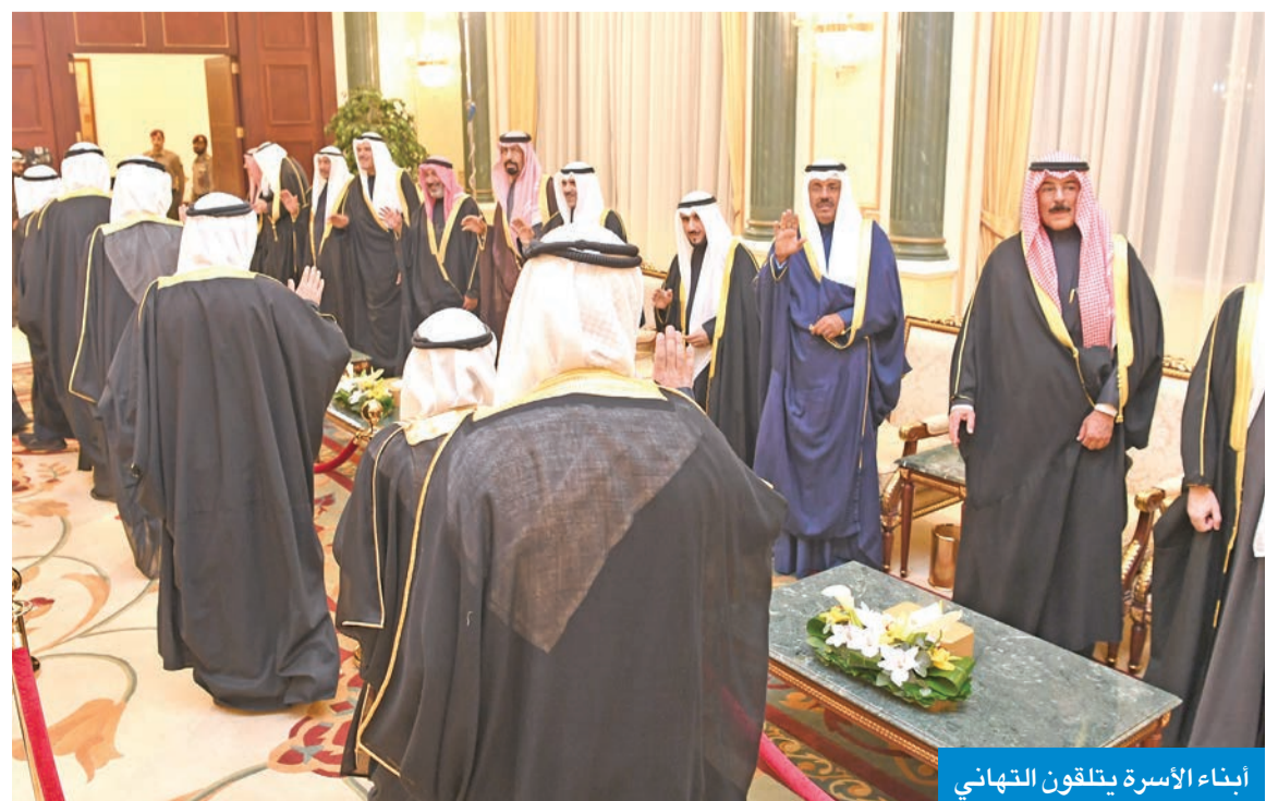
أبناء الأسرة يتلفون التهانى