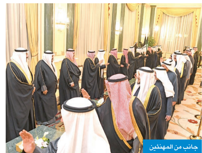
جانب من المهنتيين