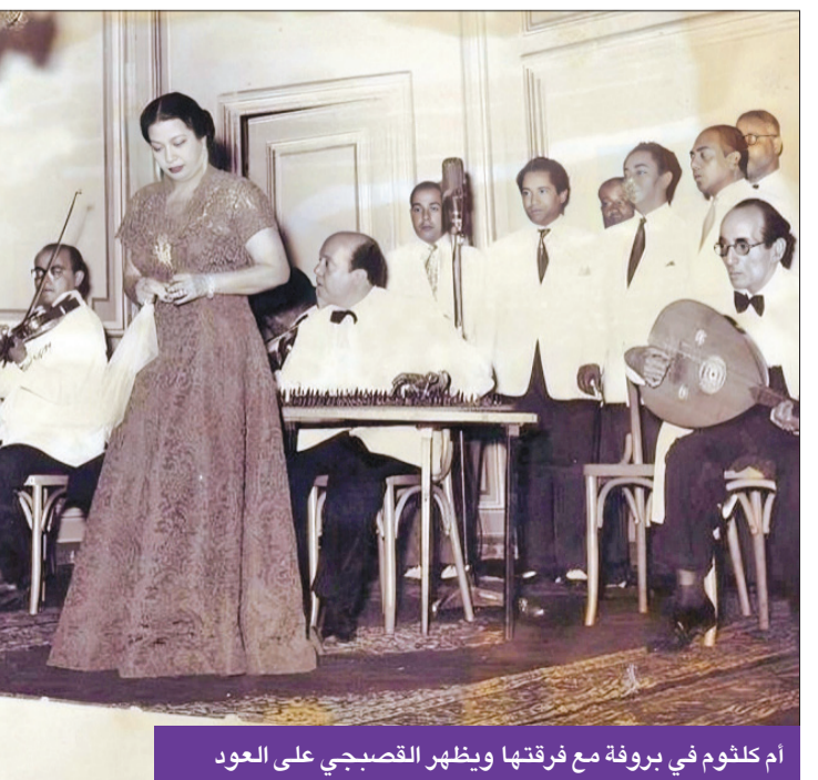
أم كلثوم في بروفة مع فرقته ويظهر القصبجي على العود