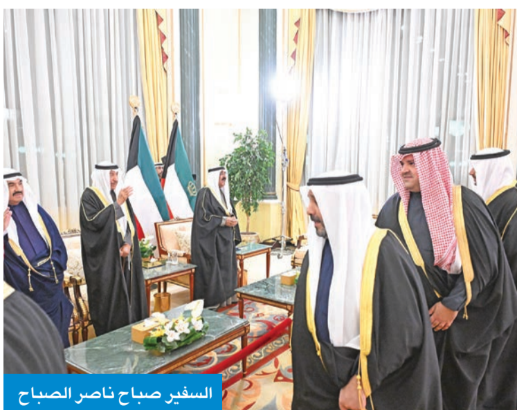
السفير صباح ناصر الصباح