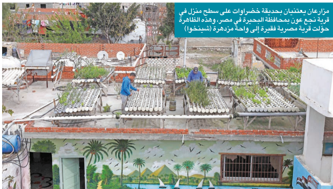
مزارعان يعتنيان بحديقة خضراوات على سطح منزل في قرية نزع عون بمحافظة البحيرة في مصر، وهذه الظاهرة حوّلت قرية مصرية فقيرة إلى واحة مزدهرة

ماذا عساي أن أقول في وداك يا أمين؟ كنت صديقاً وحبيباً وأخاً، لن أنسى مرافقتك وصديقي المرحوم جورج مجاعص أيام الذهاب إلى السباحة في البحر وفي عز الشتاء.