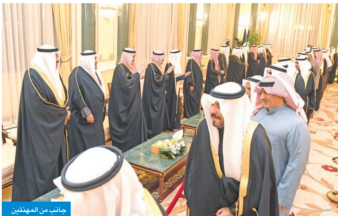
جانب من المهنتيين