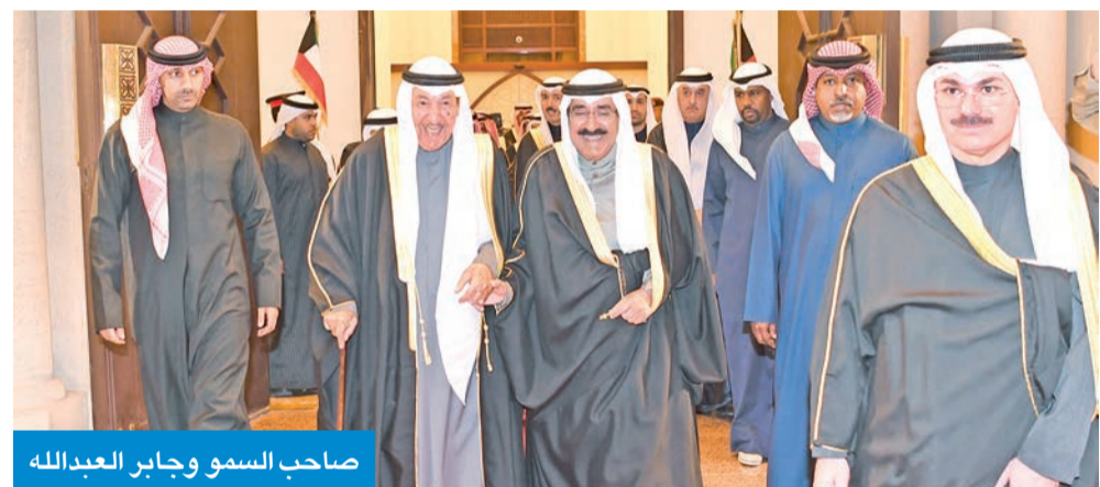
صاحب السمو وجابر العبدالله

بمناسبة حلول شهر رمضان المبارك، استقبل سمو أمير البلاد الشيخ مشعل الأحمد، وسمو ولي العهد الشيخ صباح الخالد، وأسرته آل صباح الكرام في ديوان الأسرة بقصر بيان، مساء أمس الأول، جموع المهنتيين بهذا الشهر الفضيل من مواطنين ومقيمين. وقد جسد ذلك روح الأسرة الواحدة في المجتمع الكويتي السني جبل على المحبة والمودة وروح الإخاء، مع دعاء من الجميع بأن تعود هذه المناسبة الفضية على الكويت بالخير واليمن والبركات.