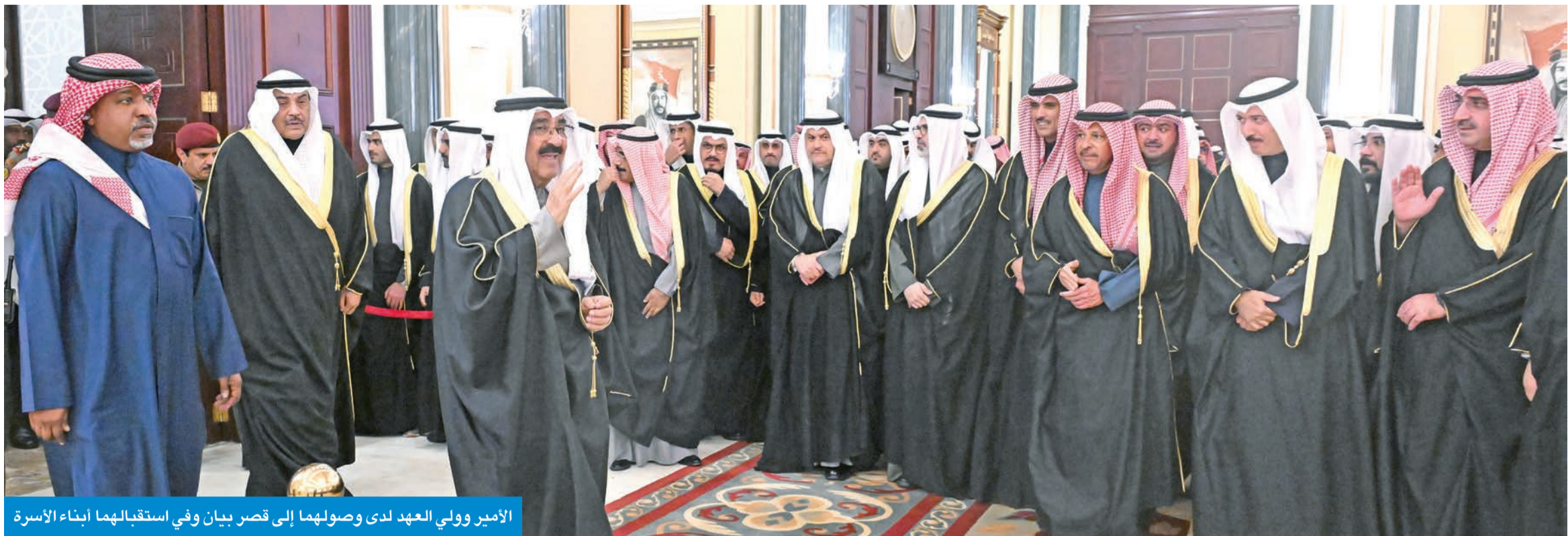
الأمير وولي العهد لدى وصولهما إلى قصر بيان وفي استقبالهما أبناء الأسرة