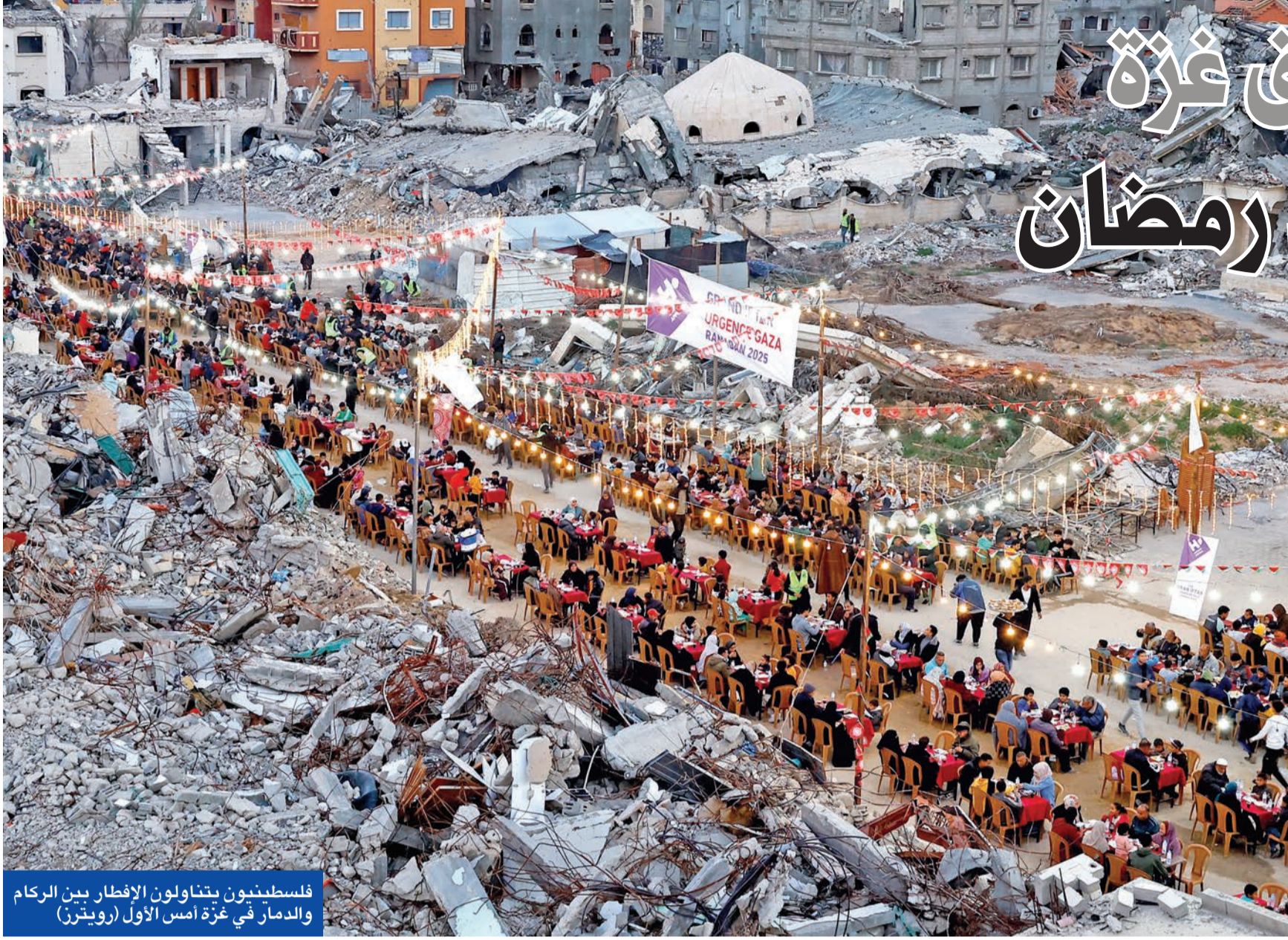
فلسطينيون يتناولون الإفطار بين الركام والدمار في غزة أمس الأول

في خطوة تزامنت مع ثاني أيام شهر رمضان المبارك، أعلنت إسرائيل أمس، وقف دخول البضائع والإمدادات إلى غزة مع انتهاء المرحلة الأولى من اتفاق وقف إطلاق النار في القطاع، الأمر الذي سيستبب في تفاقم الأزمة الإنسانية التي يعيشها الغزيون بعد حرب مدمرة خاضتها إسرائيل ضد القطاع الفلسطيني لأكثر من عام، قتلت خلالها أكثر من 45 ألف فلسطيني، ودمرت القطاع المكتظ بالسكان بالكامل.