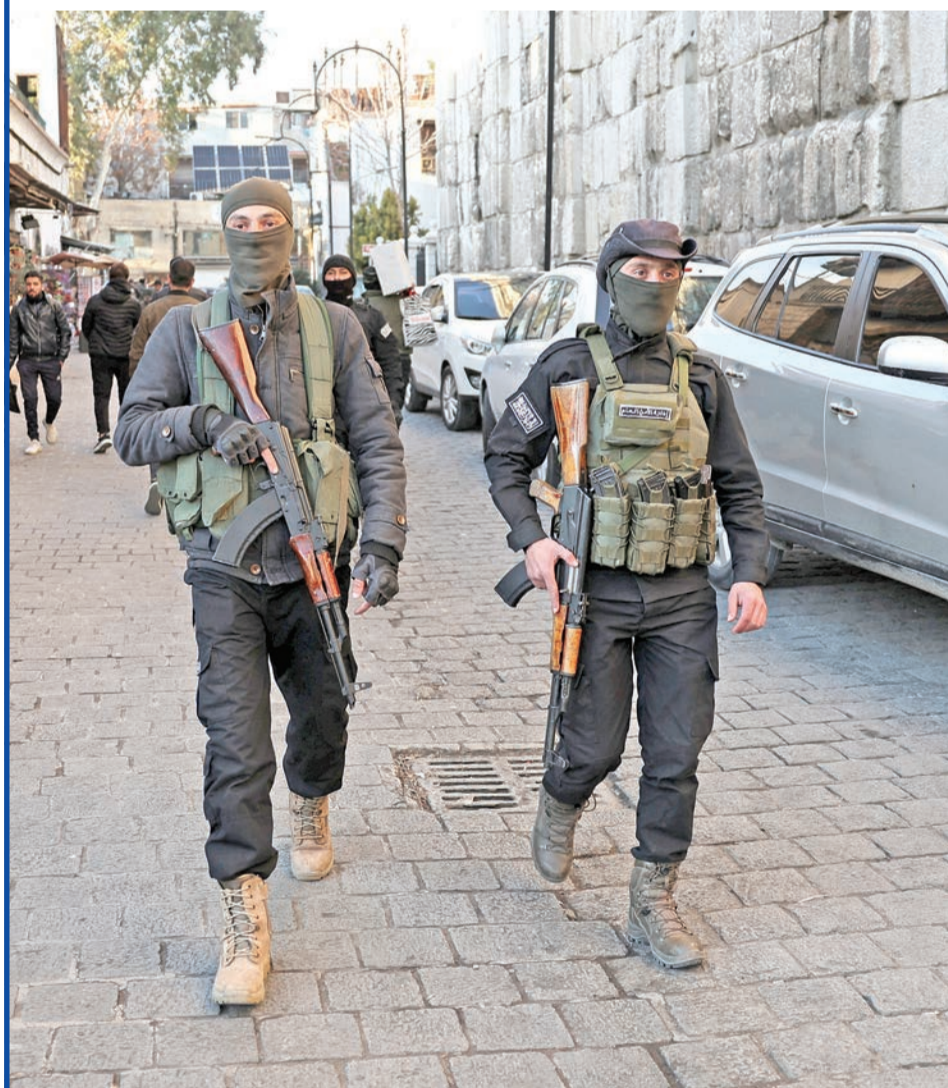
رجلا أمن سوريان في أحد شوارع دمشق

سادت حالة من الهدوء الحذر والثقل مدينة جرمانا السورية في ريف دمشق، وسط استمرار المساعي لنزع فتيل الأزمة وإعادة الأوضاع إلى الهدوء، بعد مواجهات مسلحة بين مسلحين ينتمون إلى الأقلية الدرزية ورجال أمن ينتمون إلى الإدارة الجديدة.