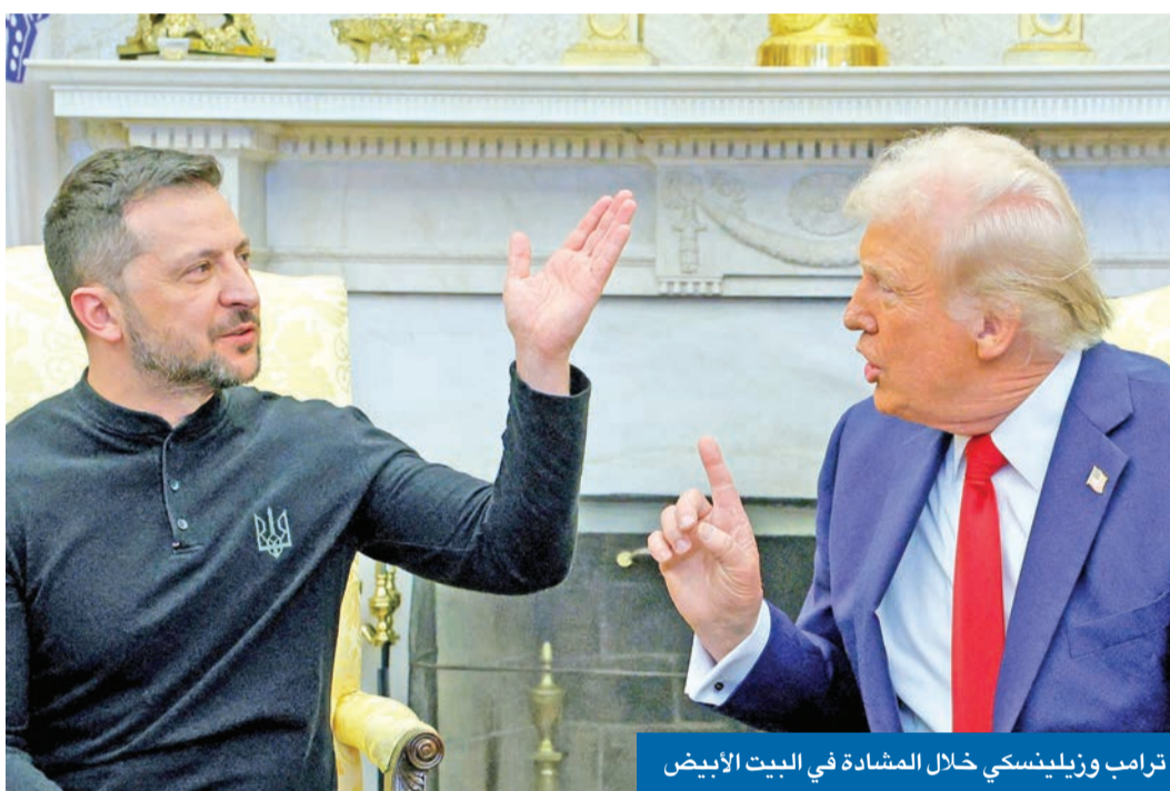
ترامب وزيلينسكي خلال المشادة في البيت الأبيض