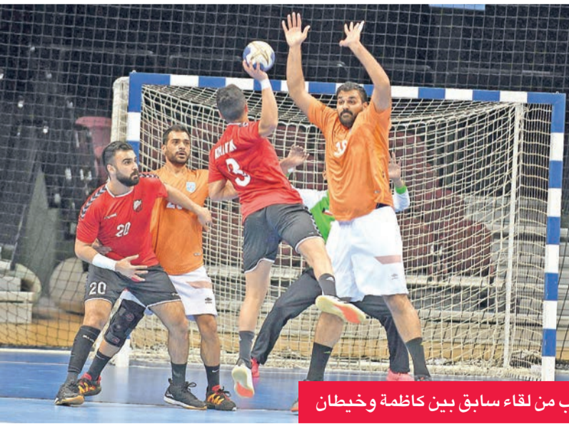
جانب من لقاء سابق بين كاظمة وخيطان