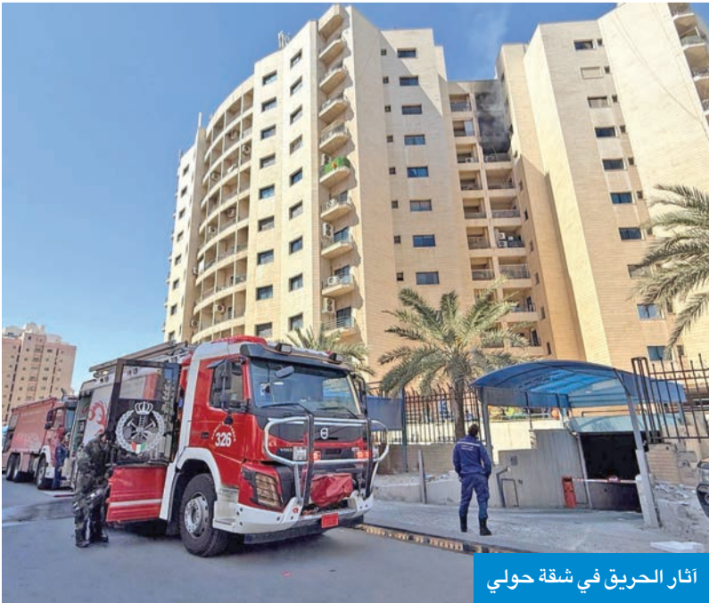
آثار الحريق في شقة حولي

وفي تفاصيل الحادث الآخر قالت إدارة العلاقات العامة والإعلام في قوة الإطفاء العام إن مركزي إطفاء حولي والسالمية تعاملاً مساء أمس الأول مع حادث حريق شقة في عمارة بمنطقة حولي، وأضافت أن مراكز الإطفاء انتقلت إلى موقع الحريق بعد تلقي غرفة العمليات بلاغاً بالحادث.