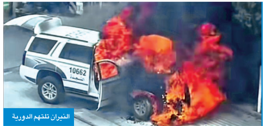
النيران تلتهم الدورية

أصيب 8 أشخاص بحروق واختناق وإجهاد حراري جراء حريقين اندلعا صباح أمس ومساء أمس الأول في منزل بمنطقة مشرف وشقة في حولي، كما أسفر الحادثان عن خسائر مادية لحقت بالموقعين. وفي تفاصيل الحادث الأول قالت إدارة العلاقات العامة والإعلام بقوة الإطفاء العام إن إدارة العمليات بقوة الإطفاء العام تلقت بلاغاً يفيد باندلاع حريق في منزل بمنطقة مشرف، مشيرة إلى أنه فور تلقي البلاغ تم توجيه مركزي إطفاء مشرف والبلاغ إلى موقع الحادث. وأضافت الإدارة أن رجال الإطفاء فور وصولهم شرعوا في إخلاء المنزل ومكافحة الحريق والسيطرة عليه، مشيرة إلى أن الحادث أسفر عن وقوع 7 إصابات من سكان المنزل تم تسليمهم إلى فني الطوارئ الطبية.