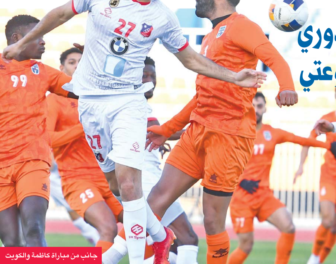
جانب من مباراة كاظمة والكويت

إن الأصل في إقامة بطولة الخليج والفكرة العامة منها منذ بداية نشأتها هي تطوير المنظومة الكروية في دول المنطقة سواء على المستوى الفني أو البني التحتية الرياضية، وهو بالتأكيد ما يسعى الاتحاد الخليجي لاستمراره والمحافظة عليه، ولذلك اظن أن التركيز على تزامن بطولات للمراحل السنية أو الصغار من النشء مع البطولة الأساسية والاستفادة من الزخم الجماهيري والاهتمام الإعلامي سيكون مردوده أفضل وأكبر من بطولة قد تنجح مرة وتفشل مرات، وإن كان ولا بد فلا مانع من أن تقام خلال أيام فترة بطولة «خليجي» وتستغل أيام الراحة بين الجولات لإقامة مبارياتها التي تعتبر ترفيحية للجماهير.