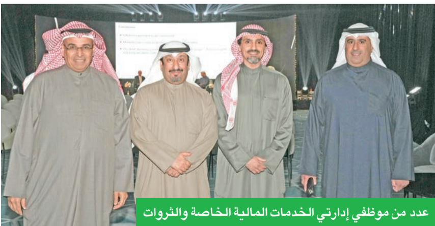
عدد من موظفي إدارتي الخدمات المالية الخاصة والثروات