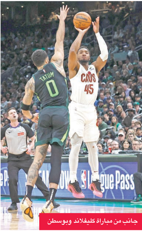
جانب من مباراة كليفلاند وبوسطن

سجل دونوفان ميتشل 41 نقطة، وقاد فريقه كليفلاند كافالييرز إلى قلب تأخره الكبير أمام بوسطن سلتيكس، حامل اللقب، وحسم قمة المنطقة الشرقية في دوري كرة السلة الأمريكي للمحترفين 123-116 أمس الأول (الجمعة). وحصد كليفلاند فوزه التاسع توالياً، رافعا رصيده إلى 49 فوزاً و10 خسارات، في صدارة المنطقة الشرقية والترتيب العام للدوري، فيما فني سلتيكس (42-18) بخسارته الثانية توالياً. وأضاف للفائز دارجوس غارلاند 20 نقطة، وإيفان موبلي 17 نقطة و12 متابع، علماً بأن ثلاثية من الأخير منحت كليفلاند أول تقدّم له في المباراة، قبل 8:43 دقائق من نهاية الوقت. وبسلة من نجم سلتيكس، جايلن براون، صاحب 37 نقطة في المباراة، تعادلت الأرقام 114 - 114 قبل 3:15 دقائق من نهاية الوقت، لكن ميتشل ردّ بسلتين خاطفتين، ليحسم فوز فريقه. ولم تكن 46 نقطة و16 متابع و9 تمريرات حاسمة من النجم جايسون تايتوم كافية لتجنب بوسطن الخسارة على أرضه رغم بدايته القوية. (أ ف ب)