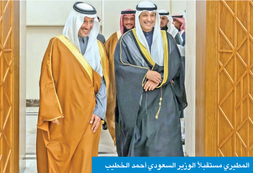
المطيري مستقبلاً الوزير السعودي أحمد الخطيب

● وضع استراتيجيات موحدة تسهم في جعل منطقة الخليج وجهة سياحية متكاملة