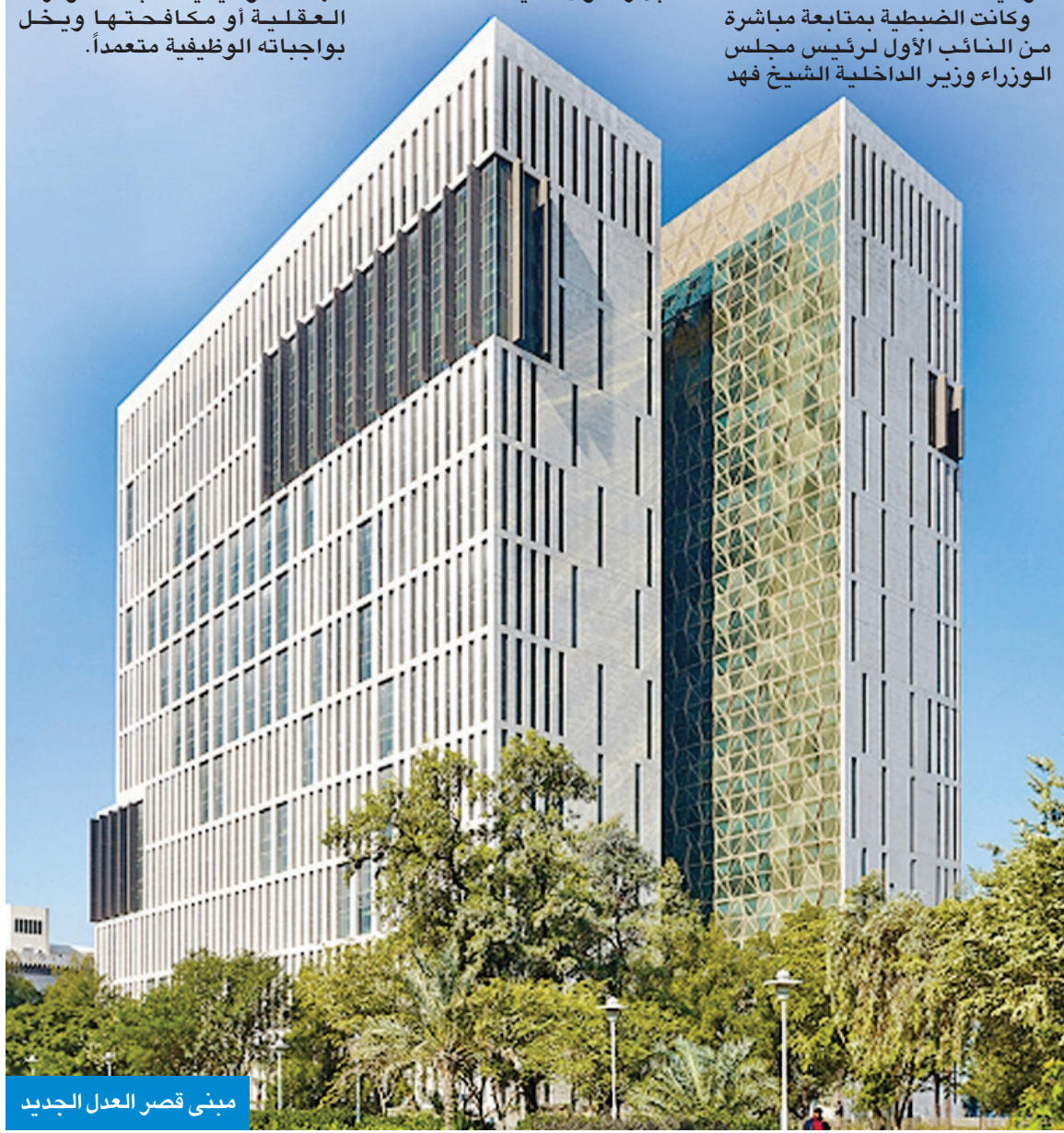
مبنى قصر العدل الجديد

وكانت الضبطية بمتابعة مباشرة من النائب الأول لرئيس مجلس الوزراء وزير الداخلية الشيخ فهد