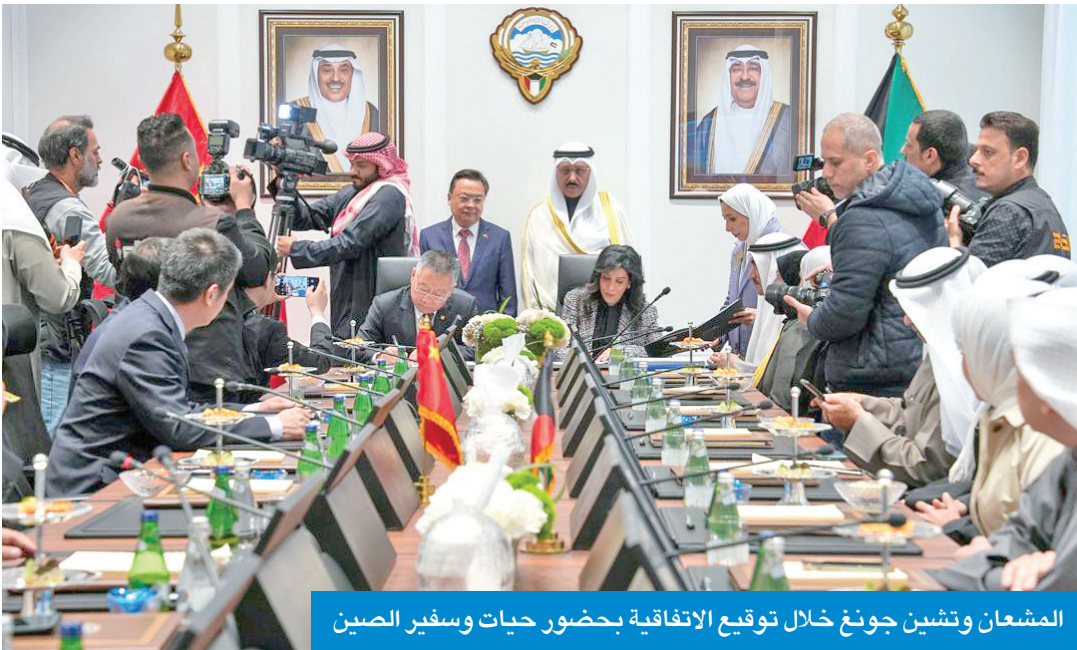
المشعان وتشين جونغ خلال توقيع الاتفاقية بحضور حيات وسفير الصين

وأضاف أن هذا انعكس على معدلات الإنتاج والتصدير للخارج، ومن ثم زيادة نسبة مساهمة الصناعة في الدخل القومي، موضحاً أن الصين ستستمر في إرسال وفود فنية رفيعة المستوى لزيارة البلاد، لبحث جميع التفاصيل المتعلقة بالمشاريع التنموية العملاقة. يذكر أن الوزيرة المشعان وقعت العقد ممثلة عن حكومة الكويت، وقام بتمثيل الجانب الصيني نائب رئيس مجلس إدارة الشركة الصينية الحكومية للميناء والمواصلات المحدودة التابعة لوزارة النقل الصينية تشين جونغ، والوفد الرفيع الصيني الحكومي المرافق له، بحضور السفير حيات، وكيل وزارة الأشغال العامة عبد الرشيد، وسفير جمهورية الصين لدى الكويت تشانغ جيانوي، ورئيس المكتب التجاري الصيني هوو هانغ ميين، وأعضاء السفارة الصينية لدى البلاد. الصين، فيما يتعلق بتوسيع العلاقات الثنائية في جميع المجالات، ومشاركة الصين قولاً وفعلًا في تحقيق الرغبة السامية لصاحب السمو الأمير في تحويل الكويت إلى مركز مالي وتجاري عالمي. وذكر أن الوزيرة المشعان لمست عن كذب خلال الاجتماع الذي عقد قبيل توقيع العقد بين الجانبين مدى الاهتمام البالغ في مشاركة كبار المسؤولين في تحويل الكويت إلى مركز مالي وتجاري عالمي. وذكر أن الوزيرة المشعان لمست عن كذب خلال الاجتماع الذي عقد قبيل توقيع العقد بين الجانبين مدى الاهتمام البالغ في مشاركة كبار المسؤولين في تحويل الكويت إلى مركز مالي وتجاري عالمي. وذكر أن الوزيرة المشعان لمست عن كذب خلال الاجتماع الذي عقد قبيل توقيع العقد بين الجانبين مدى الاهتمام البالغ في مشاركة كبار المسؤولين في تحويل الكويت إلى مركز مالي وتجاري عالمي.