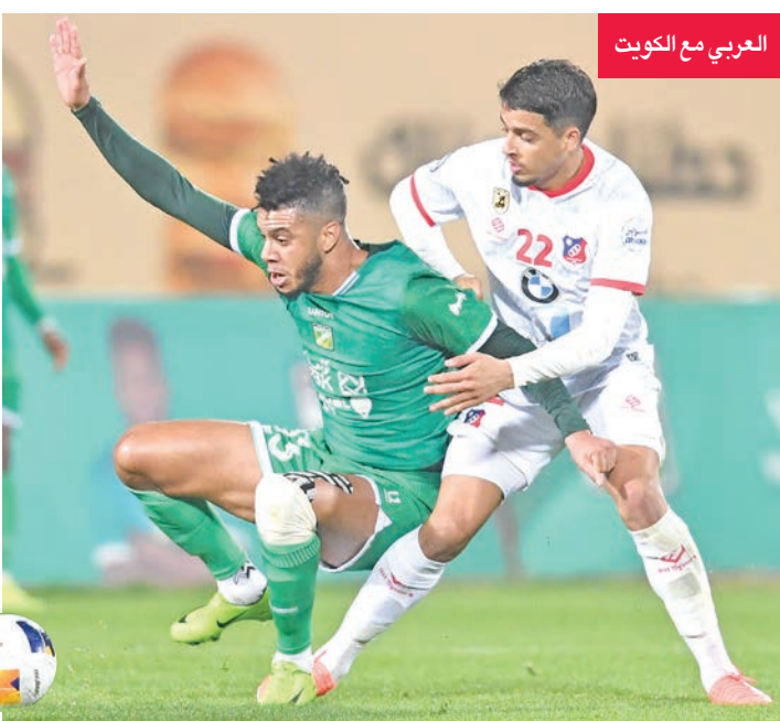
العربي مع الكويت