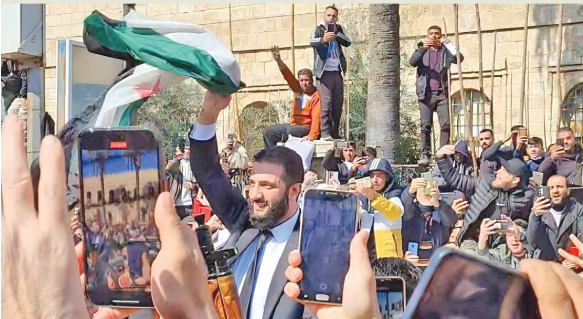
الشرع لدى وصوله إلى ساحة الشيخ ضاهر التاريخية وسط اللاذقية أمس

صعبة، فحصل موظفين في قطاعات تعاني من شح الموارد لإعادة هيكلة مؤسسات الدولة ومحاربة الترهل الوظيفي، لكن الواقع يظهر أن الآف العاملين في القطاع العام، بخاصة في المؤسسات شبه المتقاعد بسبب الحرب والعقوبات الدولية، باتوا أمام خيارين: قبول فقدان وظائفهم بشكل دائم أو الخروج بظواهرات ضد هذه القرارات. إلى ذلك، بدأ فريق تقني تركي يضم 25 شخصاً أعماله لإعادة تأهيل وتطوير مطار دمشق الدولي، وتدريب الموظفين على استخدام أجهزة جديدة أرسلتها تركيا.