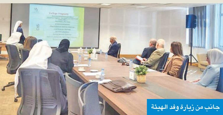
جانب من زيارة وفد الهيئة

الكلية نظمت ملتقى «تمكين الشباب لتنمية مستدامة لمخرجات سوق العمل»