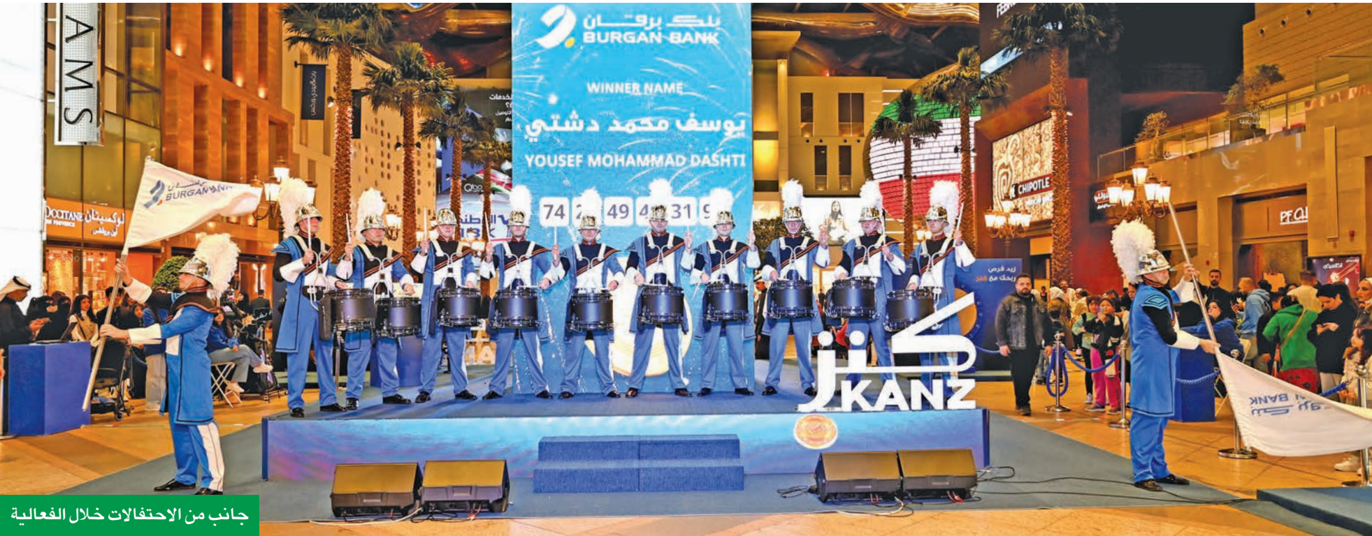
جانب من الاحتفالات خلال الفعالية

يعتبر حساب كنز من بين الحسابات المميزة لدى بنك برقان نظراً للفرص العديدة التي يوفرها لعملائه طوال العام للفوز بجوائز نقدية، سواء كانت شهرية أو نصف سنوية أو سنوية، ففي كل شهر، يفوز 20 عميلاً بجائزة نقدية قيمتها 2000 دينار لكل منهم، بينما يحصل فائز واحد بالسحب نصف السنوي على جائزة نقدية بقيمة 500.000 دينار، ويحصل الفائز المحظوظ في السحب السنوي على جائزة بـ 1.500.000 دينار. وللمشاركة في السحوبات المقبلة، يمكن للعملاء الحاليين والمحتملين زيارة أي فرع قريب أو تطبيق البنك أو موقعه الإلكتروني، وفتح حساب كنز بإيداع 200 دينار كحد أدنى، حيث إن كل 25 ديناراً تمنح صاحبها فرصة واحدة للفوز، وتزداد الفرص بوحدة من السحوبات التي تستمر على مدار العام، كلما زاد رصيد الإدخال. وتجدر الإشارة إلى أن جميع السحوبات تتم إلكترونياً بإشراف وزارة التجارة والصناعة ومراقبي الحسابات الخارجيين، وبما يتوافق مع معايير وتشريعات بنك الكويت المركزي.