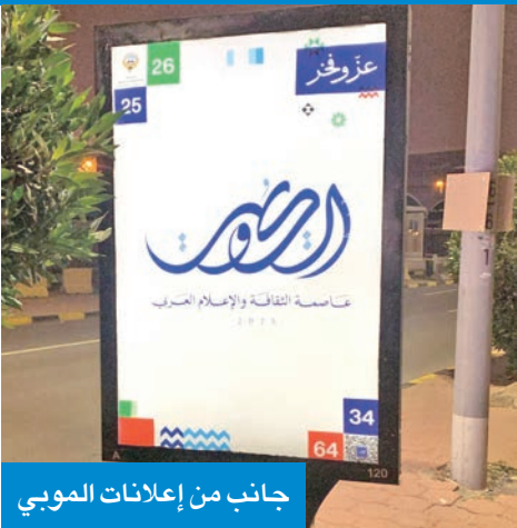
جانب من إعلانات الموبي

تعمق الانتماء الوطني وتجسد ثوابت الولاء، ومن منطلق التعاون والشفرة بين كل جهات ومؤسسات الدولة، وعلى رأسها وزارة الإعلام، قامت إدارة العلاقات العامة في بلدية الكويت، بالتعاون مع اللجنة الدائمة للاحتفال بالأعياد والمناسبات الوطنية، بدشين أعمال تركيب 138 إعلاناً في المحافظات تحمل عنوان «الكويت... عاصمة الثقافة والإعلام العربي» إسهاماً منها بمشاركة الجهات الحكومية في دعم الاحتفالات الوطنية.