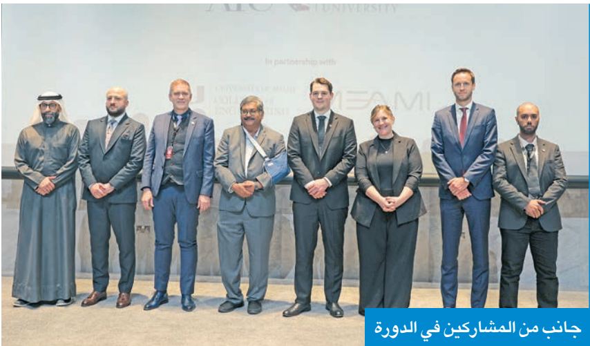
جانب من المشاركين في الدورة

البقاعين: الكلية تسعى للتميز وتوفير بيئة محفزة للطلاب لمواجهة التحديات