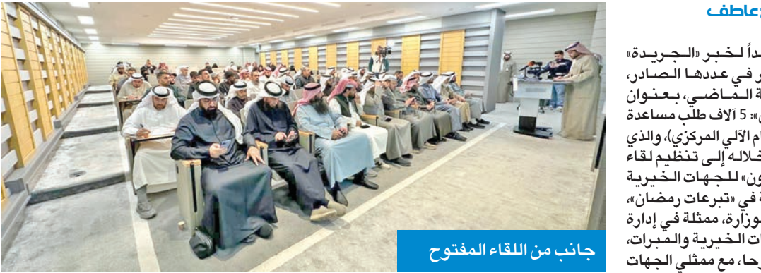
جانب من اللقاء المفتوح

والمبرات، وتعزيز الشفافية في جمع التبرعات وصرفها، لضمان وصول المساعدات إلى مستحقيها وفق معايير العدالة والمصداقية وتحليل المخالفات السابقة ومعالجتها، لتلافي الأخطاء التي حدثت في المواسم الماضية والارتقاء بأداء الجمعيات وتبادل الخبرات بين الجمعيات والمبرات الخيرية، ولارتقاء بجودة المشاريع وتحقيق أعلى مستويات الكفاءة والاستدامة». وأوضح العتيبي أن الاتحاد سيقوم بدور حلقة الوصل بين الجمعيات والشؤون، من خلال توفير الدعم الفني والاستشاري لضمان امتثال الجمعيات والمبرات الخيرية للضوابط، بما يضمن تنفيذ المشاريع وفق أفضل المعايير.