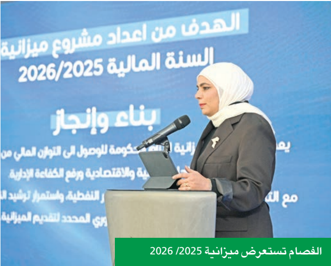
الفصام تستعرض ميزانية 2026/2025

قالت وزيرة المالية وزيرة الدولة للشؤون الاقتصادية والاستثمار، م. ثورة الفصام، إن قانون الدين العام في مراحله الأخيرة، وهو أداة تمويلية تساعد الدولة في توفير السيولة، لتمد تركيزها وتوجيهها بشكل رئيسي للاستثمار في مشاريع البنية التحتية. وأكدت الفصام، خلال مؤتمر وزارة المالية الخاص بالميزانية العامة للسنة المالية 2026/2025، العمل بتوجيهات سمو رئيس الوزراء الشيخ أحمد العبدالله، وقرارات مجلس الوزراء التي تعكس التوجهات الاستراتيجية للدولة وسياساتها العامة وتطلعاتها المستقبلية لتحقيق أهدافها التنموية والاقتصادية والاجتماعية.