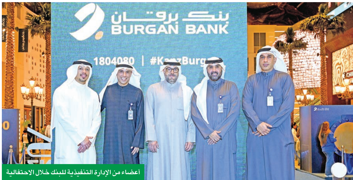
أعضاء من الإدارة التنفيذية للبنك خلال الاحتفالية

بفضل ولاء عملائنا وثقتهم الممتدة استطعنا أن نواصل نمونا والمضي قدماً في مواكبة احتياجاتهم المتنامية