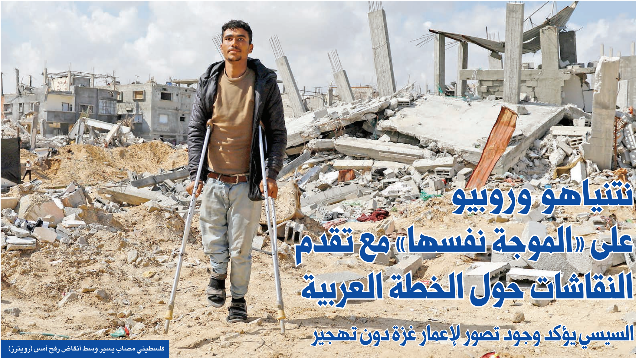
فلسطيني مصاب يسير وسط انقاض رفح أمس

أعلن وزير الداخلية النمساوي غيرهارد كارنر، أمس، أن هجوم الطعن، الذي أدى إلى مقتل فتى وإصابة خمسة آخرين في جنوب البلاد، أمس الأول، مرتبط بتنظيم «داعش». وأشار الوزير النمساوي، في مدينة فيلاخ، حيث وقع الهجوم، إلى أن المشتبه به، وهو طالب لجوء سوري يبلغ 23 عاماً، اعتنق فترة قصيرة. وألقي القبض على المهاجم فوراً، وتبين أنه يحمل أوراق إقامة نظامية، لكنه لم يكن معروفاً لدى الشرطة. وذكرت السلطات أن عامل توصيل سوري كان شاهداً على الاعتداء تصدى للمهاجم وقام بدفعه بسيارته نفعه من إصابة المزيد من المارة.