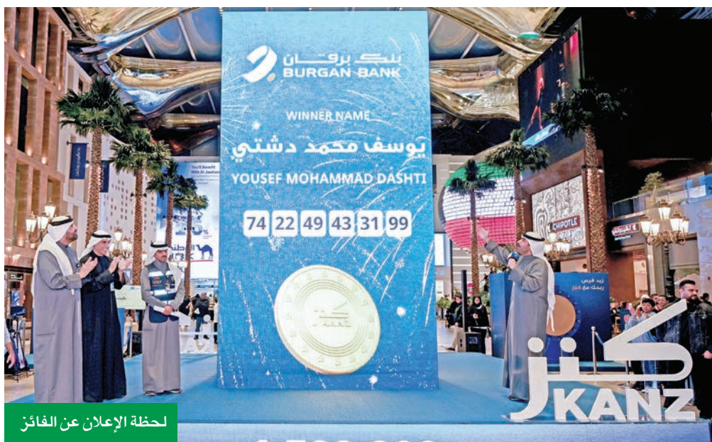
لحظة الإعلان عن الفائز