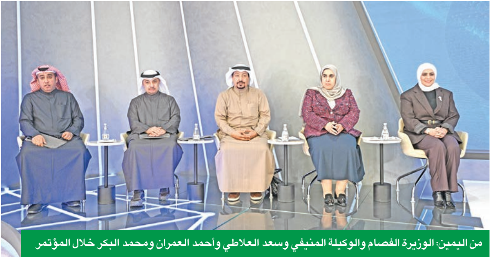
من اليمين: الوزيرة الفصام والوكيلة المنيفي وسعد العلاطي وأحمد العمران ومحمد البكر خلال المؤتمر