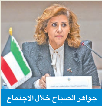
جواهر الصباح خلال الاجتماع

«اللجنة الوطنية» ناقشت تقارير التمييز ضد المرأة ومناهضة التعذيب والاتجار بالبشر