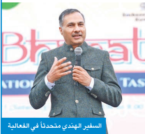
السفير الهندي متحدثاً في الفعالية

وذكر أن «الناس في الكويت لديهم انجذاب قوي جداً للثقافة الهندية سواء كانت أفلاماً أو رقصاً وموسيقى أو مطبخاً وما إلى ذلك، وهذا نتيجة لتبادل الأفكار والتجارة والتقاليد على مر القرون بين البلدين». وأعرب عن أمله «أن تعزز الروابط الثقافية القوية بين البلدين من خلال تنظيم أنواع مختلفة من الفعاليات التي تحكي هذا الرابط القوي بين بلدينا وشعبينا».