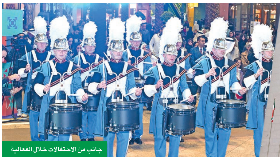
جانب من الاحتفالات خلال الفعالية