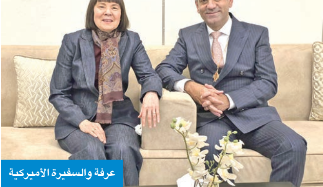
عرة والسفيرة الأميركية

بالشكر لأب بطرس غريب «على هذه الفتحة الكريمة التي تجسد أرقى معاني الوفاء لأعلى درجات العطاء»، لافتاً إلى أن «هذا التكريم المستحق هو نجمة إضافية مضيئة في فضاء القيم الإنسانية الرفيعة وسواء المبادئ الأصلية... تلك التي تؤمن بها الكنيسة والأديان السماوية جامعة». وتوجه الصنديد بالشكر إلى «دولة الكويت التي فتحت لنا الأبواب منذ بدايات طموحاتنا، وشرعت الأحضان لتستقبل فيما بعد ممثلاً جديراً لبندنا الحبيب، الكويت، التي تشارك أهلها الاحتفال بأعيادها الوطنية، نعزّز باهلها كما يعزّزون بك ممثلاً للبنان ومثالاً عن كل اللبنانيين، فالمدج والخلود للبنان والكويت».