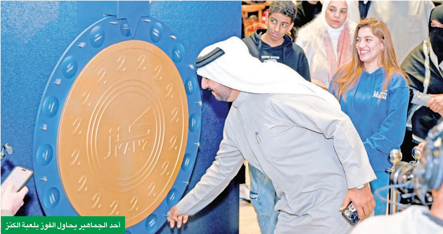
أحد الجماهير يحاول الفوز بلعبة الكنز