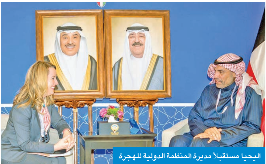
الحيا مستقبلاً مديرة المنظمة الدولية للهجرة

التقى نظراءه في السودان وألبانيا ولاتفيا وليختنشتاين ومبعوث أميركا لليمن