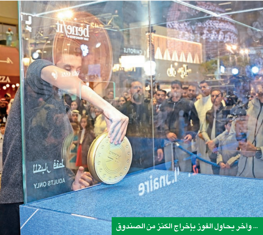
... وآخر يحاول الفوز بإخراج الكنز من الصندوق