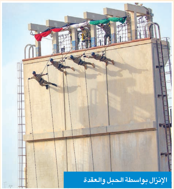
الإنزال بواسطة الحبل والعقدة

وأكد الرفاعي أهمية مشاركة زملاء السلاح من الجيش والشرطة مع إخوانهم في الحرس الوطني لتبادل الخبرات وتحقيق التكامل