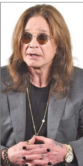
جانب من الأمسية الموسيقية