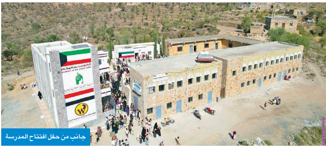
جانب من حفل افتتاح المدرسة

توفر بيئة تعليمية آمنة لأكثر من 1016 طالباً