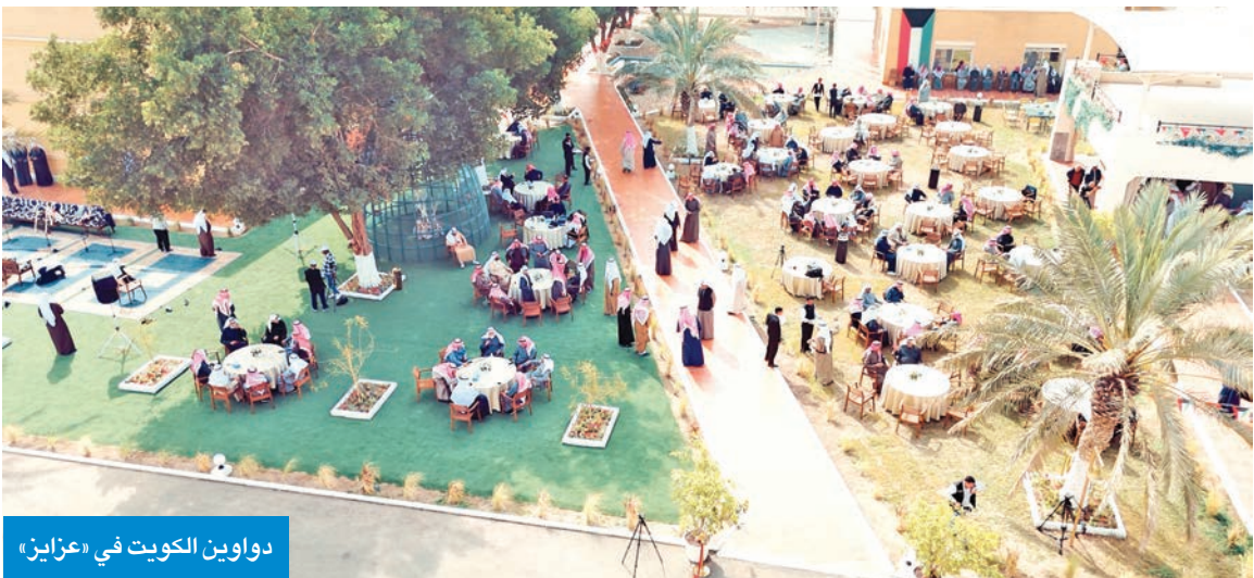
دواوين الكويت في «عزائز»

الموسيقية التي غردت بنكهة فريدة لأيام فبراير، شهر الأعياد الوطنية، بمزيج من الأغاني الشعبية وفنون العرضة والسامري والشبيلات التراثية التي أعادت الأيام الخوالي.