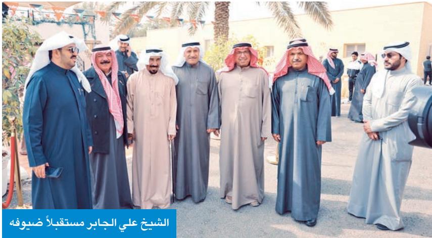
الشيخ علي الجابر مستقبلاً ضيوفه