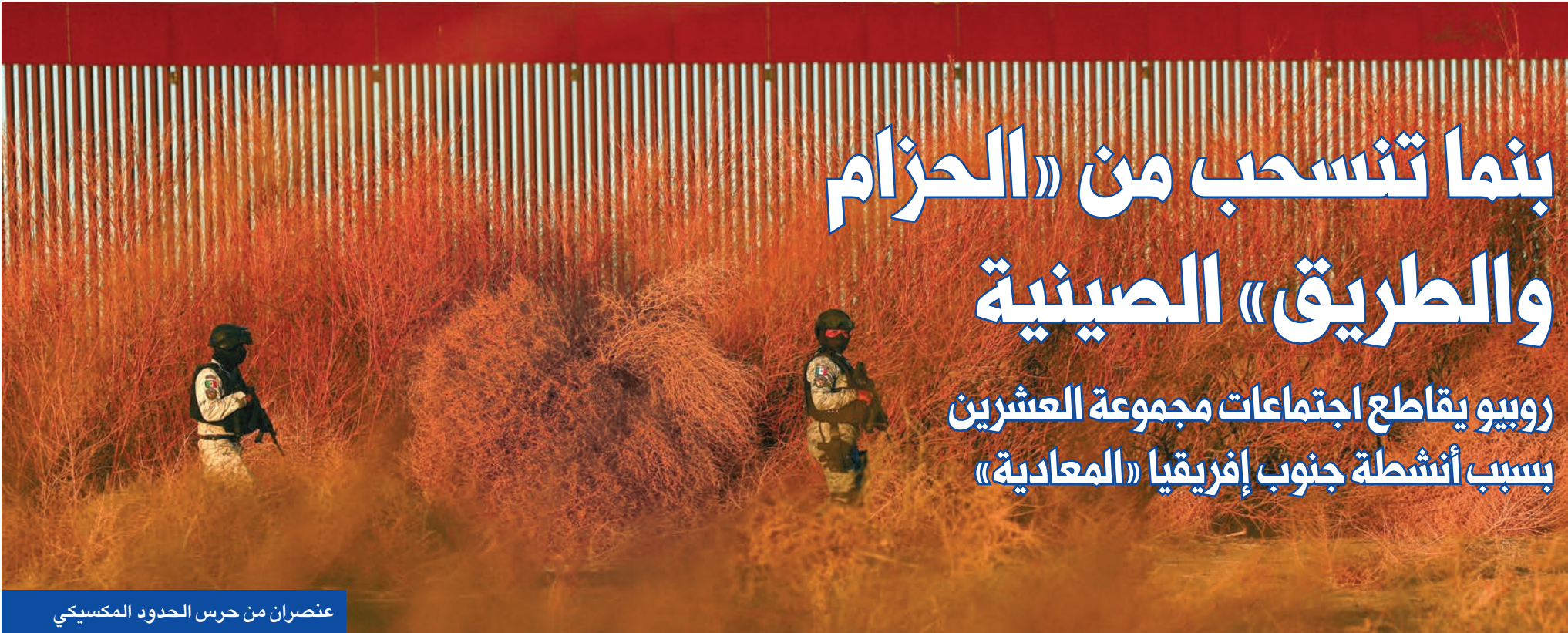
عنصران من حرس الحدود المكسيكي

على جانب آخر من الحدود، أفادت مصادر ميدانية، أمس، بوقوع اشتباكات عنيفة بين «إدارة العمليات» السورية ومقاتلين موالين للنظام السوري السابق مدعومين من حزب الله في خارج منطقة الهرمل اللبنانية، وهي منطقة ينشط فيها المقاتلون على جانبي الحدود. وقالت قناة الميادين المالية لإيران وحزب الله أن الاشتباكات امتدت إلى الحدود اللبنانية، وأن «الأهالي أسروا 2 من مسلحي هيئة تحرير الشام».