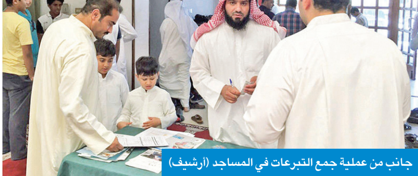
جانب من عملية جمع التبرعات في المساجد

بإيرادات التبرعات يشمل الـ «كي-نت» المحصل، من الأجهزة الإلكترونية المخصصة من الوزارة، وشيكات، والأون لاين المرخص من الوزارة والاستقطاعات البنكية التابعة لشركات الاتصال المرخصة، إضافة إلى ميزان مراجعة لفترة المشروع، وتزويد الوزارة بتقرير إداري مفصل يوضح ما تم إنجازه، على أن يدرج المشروع في التقرير الإداري والمالي السنوي للجمعية.