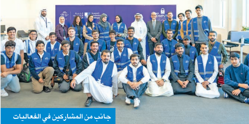
جانب من المشاركين في الفعاليات

بودي: تعزيز التعاون مع مركز صباح الأحمد للموهبة