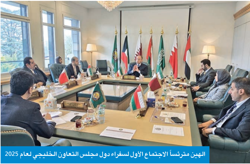
الهيئ مترأساً الاجتماع الأول لسفراء دول مجلس التعاون الخليجي لعام 2025

أكد المندوب الدائم للكويت لدى الأمم المتحدة والمنظمات الدولية الأخرى، السفير ناصر الهين، أمس، أهمية الاستقرار في نهج التعاون الخليجي المشترك لتعزيز السلام والأمن الدولي.