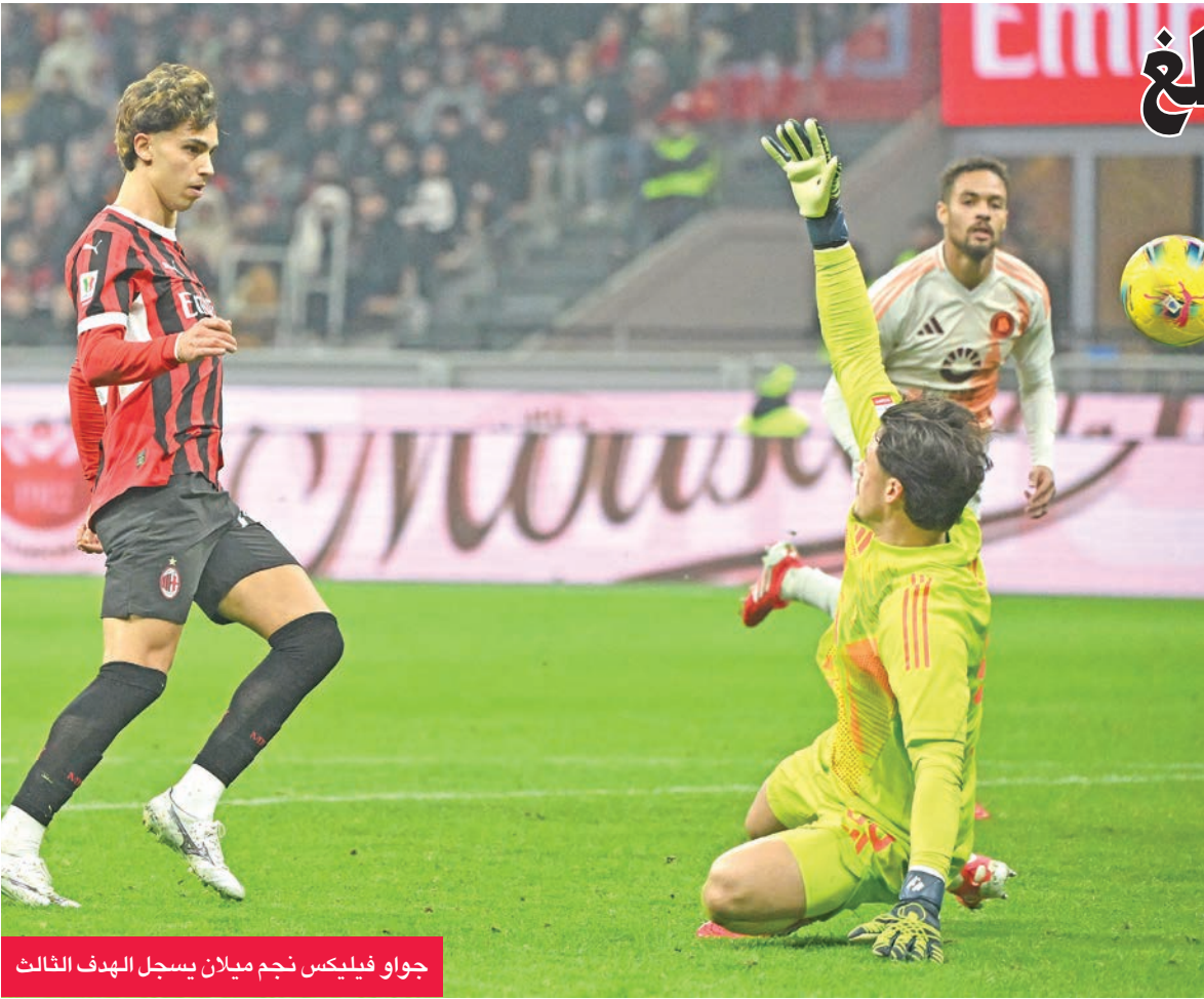
جواو فيليكس نجم ميلان يسجل الهدف الثالث