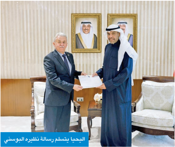
اليحيا يتسلم رسالة نظيره البوسني

التقى اليحيا، في مكتبه بالوزارة أمس، سفيرة كندا لدى دولة الكويت علياء مواني. وتم خلال اللقاء استعراض العلاقات الثنائية الوثيقة بين البلدين وبحث أطر تعزيزها وتنميتها في مختلف المجالات.