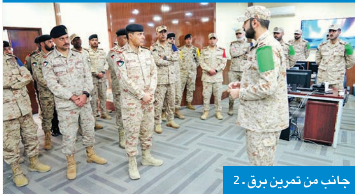
جانب من تمرين برق 2

الإشارة اللواء الركن سعود الظفيري، اختتمت أمس فعاليات تمرين برق/ 2، الذي عُقد من 2 إلى 6 الجاري. ويهدف التمرين إلى تعزيز القدرة على إنشاء وتفعيل الجاهزية الفنية، وتضمن عدة مراحل، مثل: إنشاء الشبكات، وإداسة الاتصال، وسير مجريات الأحداث.