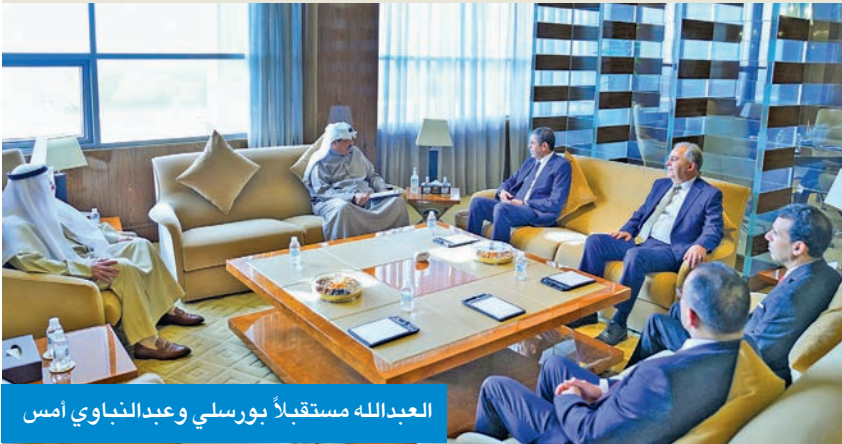
العبدالله مستقبلاً بورسلي وعبدالناوي أمس

استقبل رئيس مجلس الوزراء، سمو الشيخ أحمد العبدالله، بحضور رئيس المجلس الأعلى للقضاء المستشار د. عادل بورسلي، في قصر بيان أمس، الرئيس الأول لمحكمة النقض الرئيس المنتخب للمجلس الأعلى للسلطة القضائية بالمغرب المستشار محمد عبدالناوي والوفد المرافق له، وذلك بمناسبة زيارته للبلاد. حضر المقابلة سفير المغرب لدى الكويت علي بن عيسى.