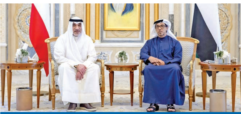
نائب رئيس الإمارات مستقبلاً اليوسف بقصر الوطن في أبوظبي أمس

بحث نائب رئيس دولة الإمارات الشيخ منصور بن زايد مع النائب الأول لرئيس مجلس الوزراء وزير الداخلية الشيخ فهد اليوسف، خلال زيارته لأبوظبي أمس، العلاقات الأخوية بين الكويت والإمارات، وسبل تعزيزها في جميع المجالات، إلى جانب استعراضهما عدداً من المواضيع المشتركة.