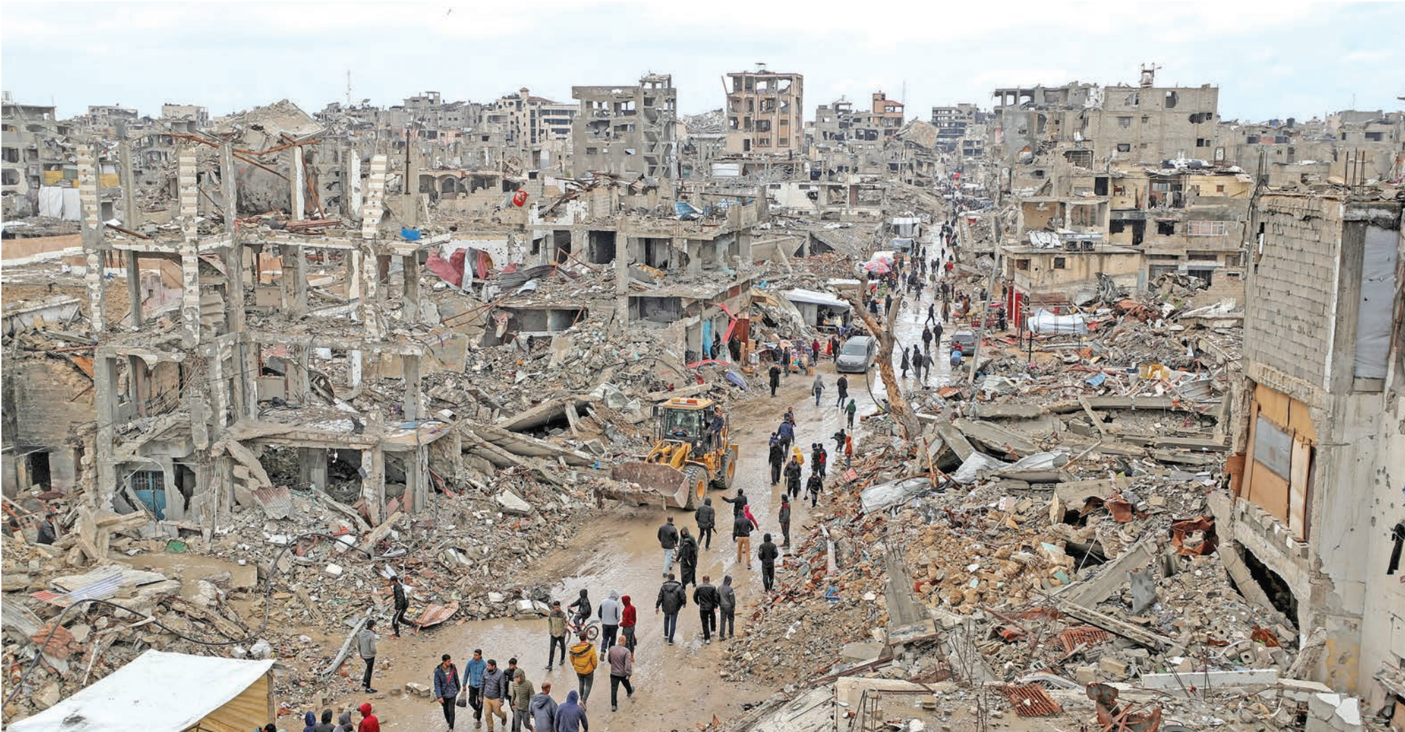
يوم ممطر في غزة أمس

حكمت محكمة عسكرية إسرائيلية بالسجن 7 أشهر على جندي عمل حارساً في معسكر الاحتجاز «سدي تيمان»، إلى جانب تخفيض رتبته إلى أدنى رتبة عسكرية بعد إدانته بإساءة معاملة معتقلين فلسطينيين، بحسب بيان للجيش أمس. وأوضح الجيش الإسرائيلي أنه «تمت إدانة المتهم على خلفية عدة حوادث ضرب فيها المعتقلين بقبضتي يديه، كما تم استخدام سلاحه بينما كانوا مكبلي الأيدي ومعصوبي الأعين». وبحسب البيان اعترف الجندي بتعذيب معتقلين فلسطينيين.