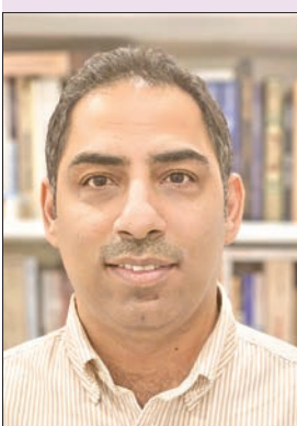
عبد الوهاب الحمادي

ترشيحها كنص أدبي بديع مُمنع على مستويات فنية عديدة. يُذكر أن الحمادي وصلت روايته (لا تقصص رؤياك) للقائمة الطويلة بالجائزة العالمية للرواية العربية (البوكر)، كذلك فازت روايته (ولا غالب) بجائزة الدولة التشجيعية.