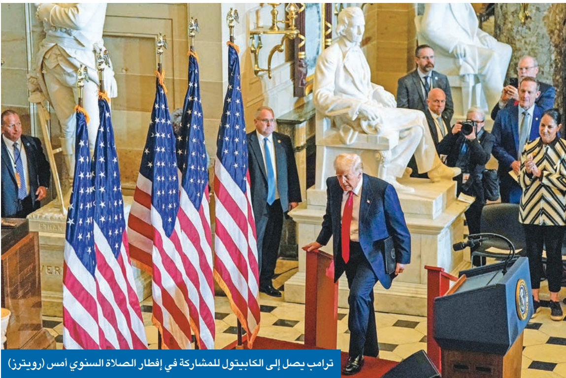
ترامب يصل إلى الكابيتول للمشاركة في إفطار الصلاة السنوي أمس

تل أبيب تتلقف المقترح المثير للجدل وتعدّد خطة لتهجير «طوعي» للفلسطينيين