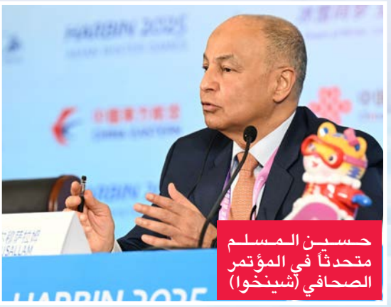
حسين المسلم متحدثاً في المؤتمر الصحافي

وركن رئيس المجلس الأولمبي الآسيوي راجا راندير سينغ في