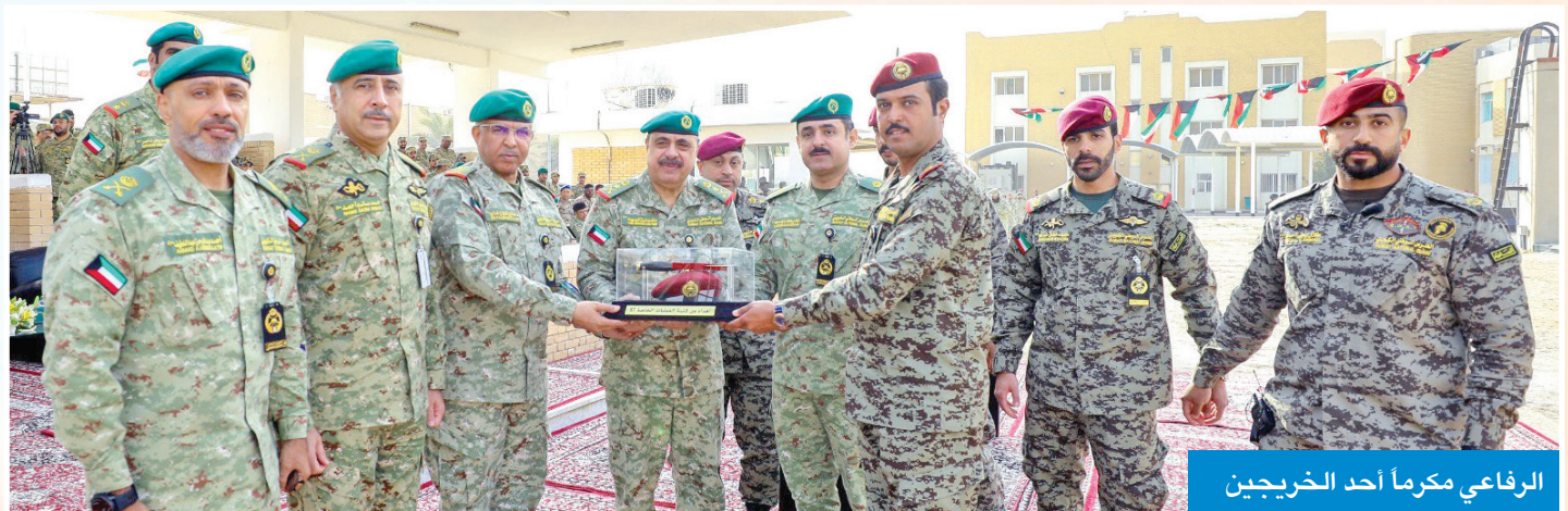
الرفاعي مكرمًا أحد الخريجين

بحضور الملحقين العسكريين ومشاركة من الجيش والشرطة