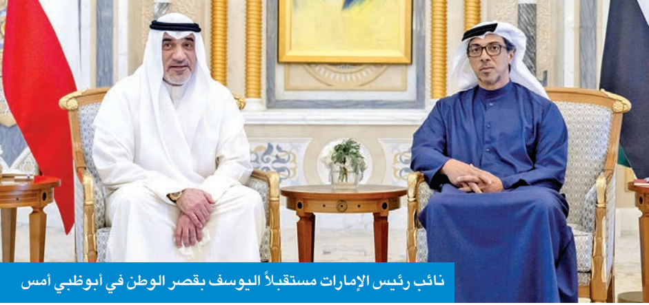
نائب رئيس الإمارات مستقبلاً اليوسف بقصر الوطن في أبوظبي أمس

أحدث المعايير والتقنيات الأمنية. من جانب آخر، التقى النائب الأول، مساء أمس الأول، أعضاء سفارة الكويت لدى سلطنة عمان الشقيقة، وذلك في إطار زيارته الرسمية للسلطنة.