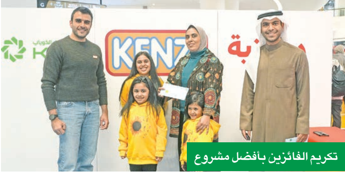
تكريم الفائزين بأفضل مشروع

في إطار المسؤولية الاجتماعية، والحرص على ترسيخ مفاهيم الادخار والتخطيط المالي المبكر للأطفال بطريقة عملية وتفاعلية وميسرة، شارك بيت التمويل الكويتي (بيتك) في برنامج مبتكر يهدف إلى نشر الثقافة المالية وتعزيز مفهوم الادخار المخصص للأطفال، بالتعاون مع «كنزي ماركت». وأقيم البرنامج التثقيفي على مدار يومين في العاصمة مول، مستهدفاً العملاء الأطفال، وقد منح هذا التعاون مع «كنزي ماركت» الفرصة للأطفال لتنمية ثقافتهم المالية وتعزيز مفهوم الادخار لديهم، ورفع مستوى النضج في أهمية وفوائد الادخار، ليتم تطوير مداركهم ليكونوا أفضل تعاملًا مع مسؤولياتهم المالية مستقبلاً. وتأتي مشاركة برنامج «بيتني» بدعم هذه المبادرة إيماناً من بيت التمويل