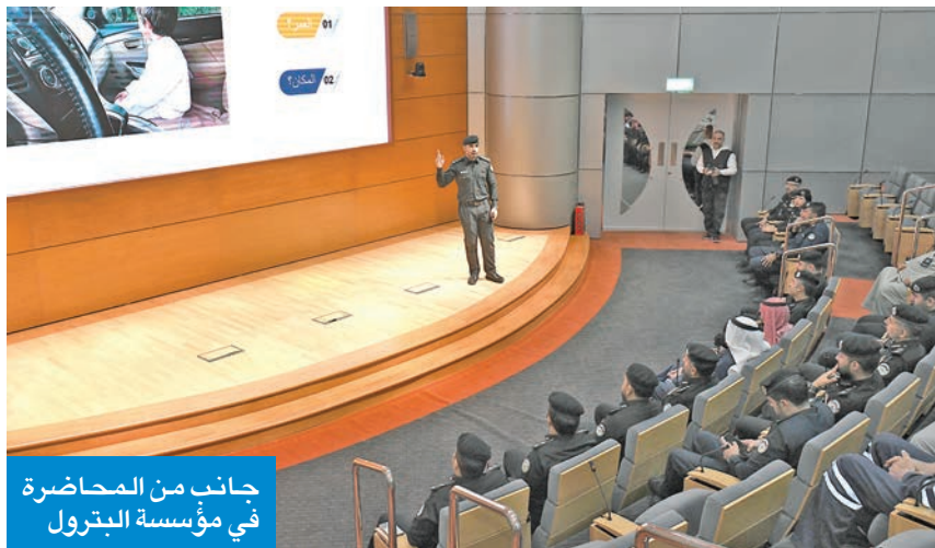
جانب من المحاضرة في مؤسسة البترول

نظمت لجنة أسبوع المرور الخليجي الموحد الـ 38، التابعة لوزارة الداخلية، أمس، محاضرة توعية لمنتسبي مؤسسة البترول الكويتية، بعنوان «قيادة بدون هاتف» لتعريفهم بأبرز التعديلات في قانون المرور الجديد، ولزيادة الوعي والثقافة المرورية.