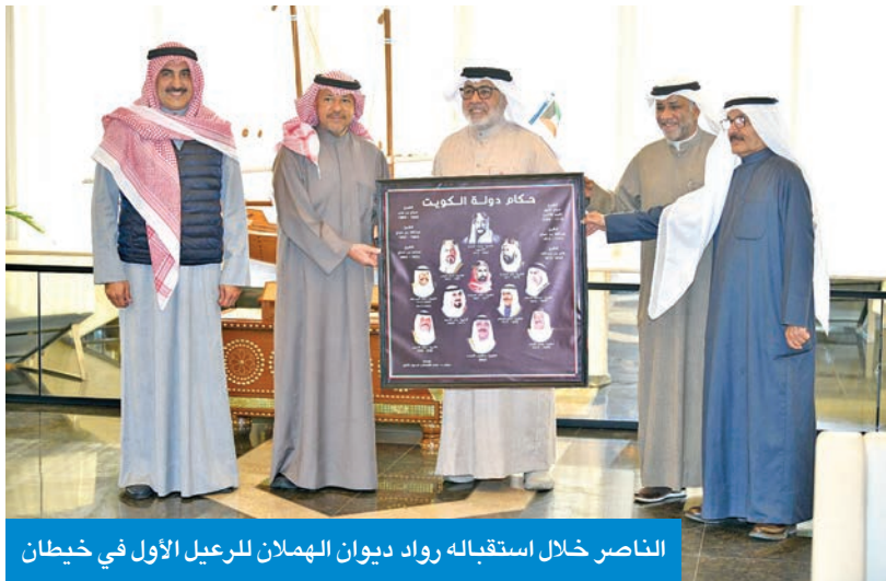
الناصر خلال استقباله رواد ديوان الهملان للرعيل الأول في خيطان

وأكد الناصر، أثناء اللقاء، أن المحافظة لن تالو جهداً في دعم تطلعات أهالي محافظة الفروانية، مشيداً بأهمية دور ديوان الرعيل الأول كونه جزءاً من التراث الكويتي، وهو ملتقى ومنتدى ومتنفس لكبار السن، لتعزيز الجوانب الاجتماعية بين أفراد المجتمع في تعريف ضيوف الكويت بالعادات والتقاليد الكويتية وتبادل الثقافات بين الشعوب، وتوطيد أواصر المحبة والترابط فيما بينهم.