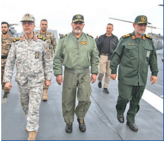
باقري وسلامي على متن بارجة حاملة المِسيّرات بمياه الخليج

وأفادت وكالة إرنا بأن البارجة يبلغ طولها 240 متراً وارتفاعها 21 متراً، ومزودة بطائرات عمودية وصواريخ ومسيرات ومصعد لتناقل الطائرات العمودية، وتسنّج 60 مسيرة و30 قطعة قاذفة للصواريخ الكروز سطح - سطح، ومنصة منفصلة للصواريخ المضادة للسفن. وفي حين أكدت الوكالة الإيرانية الرسمية أن البارجة