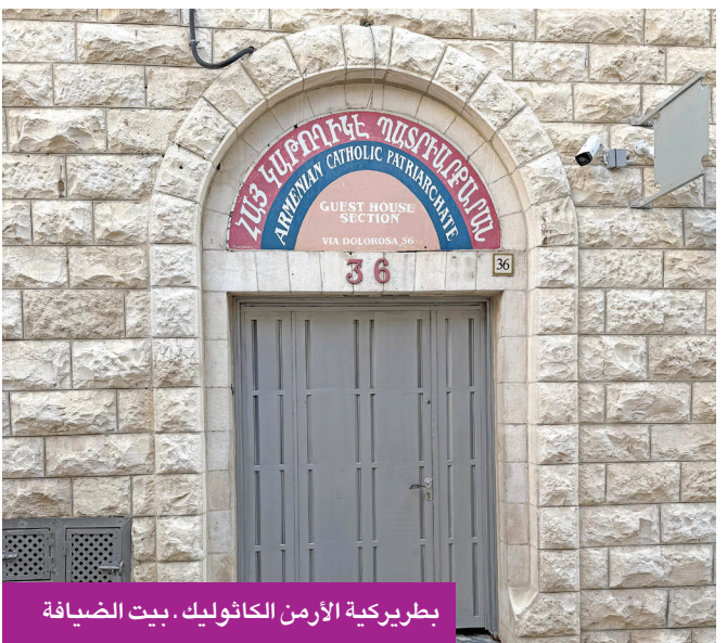
بطريركية الأرمن الكاثوليك، بيت الضيافة