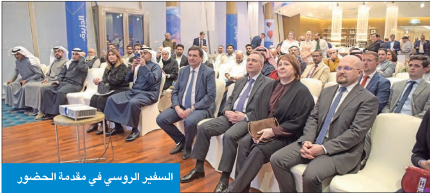
السفير الروسي في مقدمة الحضور

وحول التعاون الأمني بين البلدين وزيارة وفد أمني روسي للكويت الأسبوع الماضي، وإجراء تدريبات مع القوات الخاصة الكويتية، قال جيلتوف إن «وزارة الداخلية الكويتية، بشكل دوري، تنظم مسابقة الأمنية للقوات الخاصة، واسم المسابقة (سوابت)، وهي عبارة عن مسابقة بين الفرق الأمنية من مختلف للدول، حيث شارك فيها العام الماضي 26 فريقا أمنيا، بمن فيهم فريق روسي». وأضاف: «توصلنا إلى تفاهم مع الجانب الكويتي لإقامة تدريبات أمنية مشتركة مع القوات الخاصة بشكل دوري».