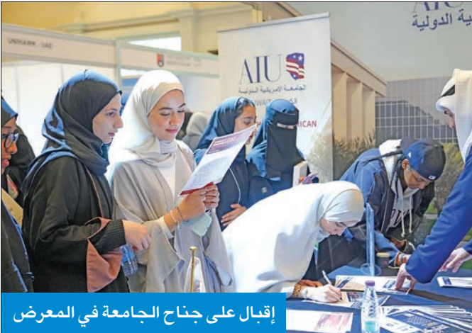
إقبال على جناح الجامعة في المعرض

جذبت اهتماماً واسعاً من الطلاب المحتملين وأولياء الأمور والأكاديميين