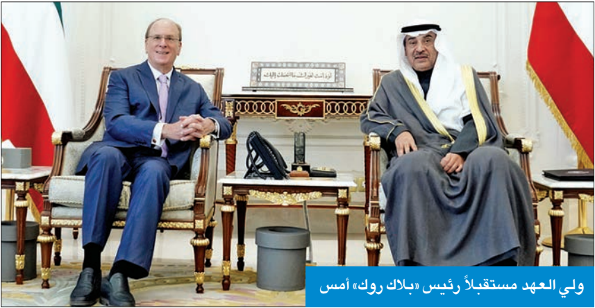
ولي العهد مستقبلاً رئيس «بلاك روك» أمس

في مجال آخر، بعث سمو ولي العهد ببرقية تعزية إلى الرئيس الألماني، د. فرانك فالتر شتاينماير، ضمنها سموه خالص تعازيه وصادق مواساته بوفاة رئيس المانيا الأسبق، هورست كولر، متمنيا سموه لأسرة الفقيد وذويه جميل الصبر.