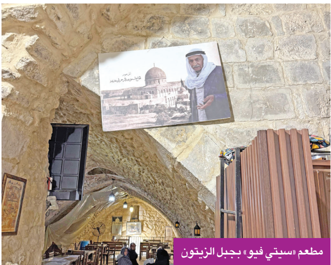
مطعم «سيقي فيو» بجبل الزيتون