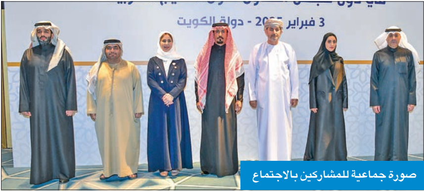
صورة جماعية للمشاركين بالاجتماع

«استمرار التنسيق لتعزيز الصورة المشرفة لدول المجلس»