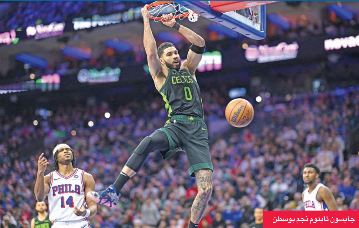
جايسون تايتوم نجم بوسطن

قلب بوسطن سلتيكس حامل اللقب الموسم الماضي تخلفه بفارق 26 نقطة أمام فيلادلفيا سفنتي سيكسرز ليخرج فائزاً 118-110 بفصل 35 نقطة لنجمه جايسون تايتوم ضمن دوري كرة السلة الأميركي للمحترفين. في المباراة الأولى، أضاف جايلن براون 21 نقطة و10 متابعات واللاتفي كريستابس بورزينغيس 18 نقطة لبوسطن، أما أفضل مسجل في صفوف سيكسرز فكان هادافه تايريز ماكسي الذي نجح في تخطي حاجز الـ 30 نقطة للمباراة الخامسة توالياً مع 34 نقطة. وفي أول مباراة بعد الخبر القنبلية بانتقال نجمه دونتشيتش إلى لوس انجلوس ليكرز في صفقة شهدت انتقال نجم ليكرز أنتوني ديفيس في الاتجاه المعاكس، مني الألاس مافريكس بخسارة قاسية أمام كليفلاند كافالييرز متصدر ترتيب المنطقة الشرقية والدوري 101-144. وبالإضافة إلى دونتشيتش الغائب أصلاً عن صفوف مافريكس منذ عيد الميلاد لإصابة في ريلة الساق،