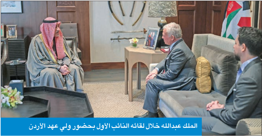
الملك عبدالله خلال لقائه النائب الأول بحضور ولي عهد الأردن

وأضافت «الداخلية» أن الاجتماع تناول سبل تعزيز التعاون الثنائي في مجالات مكافحة الجريمة والأدلة الجنائية، وتبادل الخبرات والتجارب في المجالات الأمنية، بالإضافة إلى عدد من القضايا ذات الاهتمام المشترك. وأشارت إلى أنه في ختام الاجتماع اتفق الجانبان على دعوة الأجهزة المختصة إلى تبادل الزيارات الثنائية وإعداد البرامج التنفيذية للاتفاقية الأمنية بين البلدين الشقيقين، والتي دخلت حيز التنفيذ مؤخرا، لتعزيز التعاون الأمني، بما يسهم في تطوير السياسات الأمنية لمواجهة مختلف التحديات بكفاءة وفعالية.