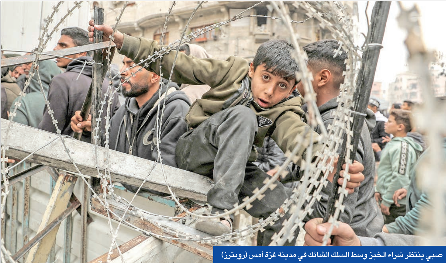
صبي ينتظر شراء الخبز وسط السلك الشائك في مدينة غزة أمس

في ظل توجه الأنظار إلى الاجتماع الأول بين الرئيس الأميركي دونالد ترامب ورئيس الوزراء الإسرائيلي بنيامين نتنياهو، وانعكاسه على اتفاق وقف إطلاق النار مع حركة حماس، بقيت الضفة الغربية للأسبوع الثاني تحت نيران عملية «الصور الحديدي».