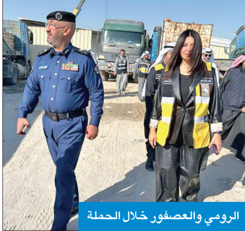
الرومي والعصفور خلال الحملة

الهندسية، حيث حررت محاضر ضبط مخالفة بناءً ضد قسائم قامت بمخالفة القرار الوزاري 206 لسنة 2009، مضيفة أن المخالفات تمثلت في استغلال العقار لغرض المرحص له، والبناء من مواد خفيفة غير مصرح بها من قبل البلدية. وأشارت إلى أن الفرق تعمل على التأكد من عدم وجود أي تعديلات على أملاك الدولة، مع التوجيه بتشديد الرقابة وعمل جولات دورية لتلافي وجود مخالفات وعواقب في المنطقة.