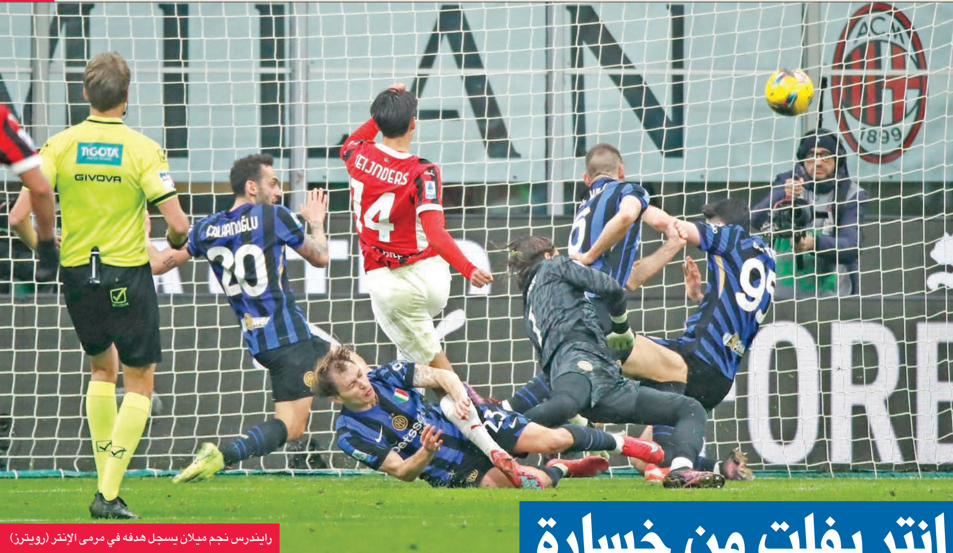
رايندرس نجم ميلان يسجل هدفه في مرمى الإنتر

ذكر الإسباني ميكيل أرتيتا، المدير الفني لأرسنال، عقب الفوز الكبير على مانشستر سيتي (1-5)، أنه «يوم عظيم» بالنسبة لفريقه «بسبب النتيجة، وطريقة» التفوق، وبالنظر «لحجم» منافسه. وأكد أرتيتا، في تصريحات نقلها الموقع الرسمي للنادي اللندني، عقب المباراة التي أقيمت على ملعب الإمارات، «من أجل الفوز على السيتي بالطريقة التي تفوقنا بها، فهناك الكثير من الأمور التي يجب أن تسير لصالحك. لعبنا بشراسة كبيرة، وبشجاعة سواء مع أو بدون الكرة، بالإضافة إلى الضغط العالي». وتابع: «سجلنا هدفاً، وكان يجب أن ندعمه باخر من فرصة واضحة، ولكن بعد ذلك، جودة لاعبي السيتي تجبرك أحياناً على التراجع للخلف، والدفاع، والمعاناة والاستمتاع أيضاً بمثل هذه الأوقات. الحظ وقف بجانبنا خلال بعض أوقات المباراة، ثم جاءت فرصتنا لتسجيل المزيد. الطريقة التي أنهينا بها الأهداف كانت استثنائية».