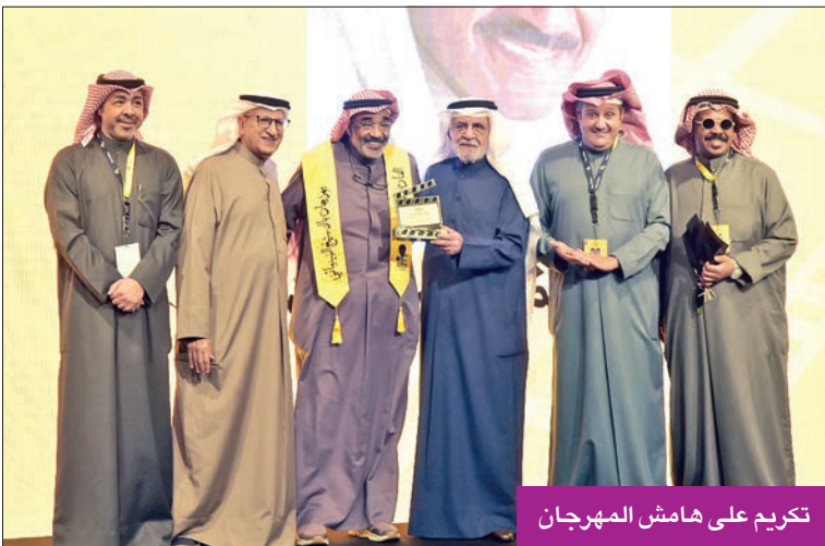
تكريم على هامش المهرجان