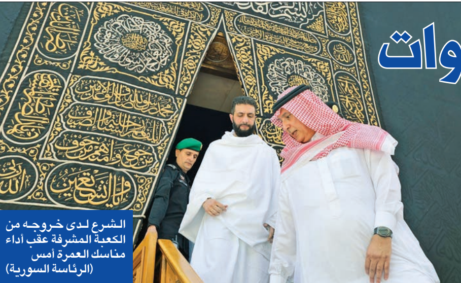
الشرع لدى خروجه من الكعبة المشرفة عقب أداء مناسك العمرة أمس

وختم منشوره بالقول: «نعتقد أن العلاقات التركية السورية التي عادت إلى طبيعتها بعد استعادة دمشق لحريتها ستتعزز وتكتسب بُعداً جديداً مع الزيارة».