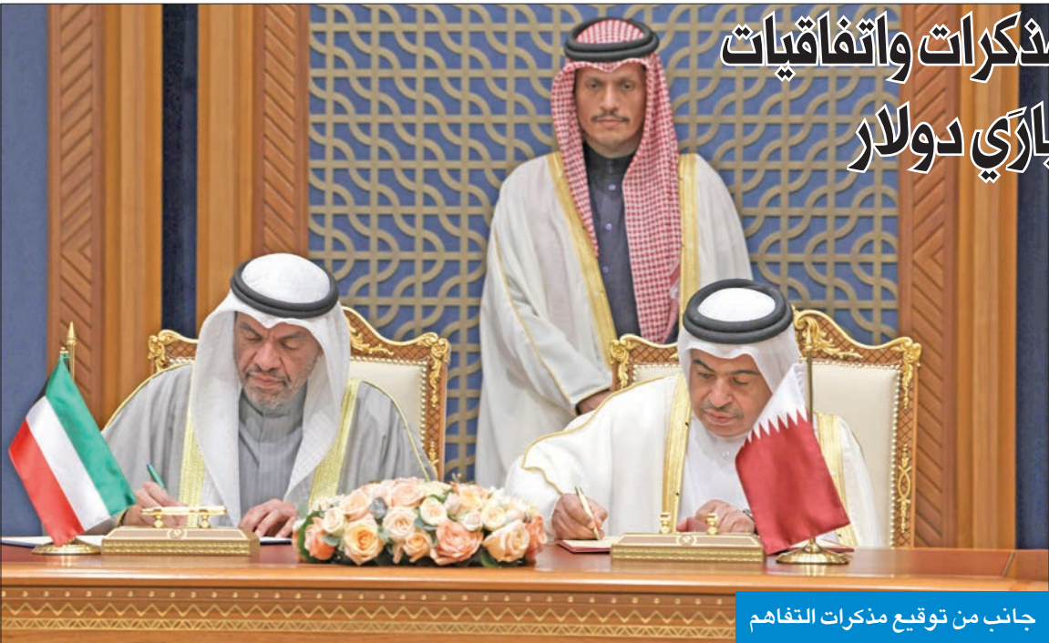
جانب من توقيع مذكرات التفاهم

● وزير الخارجية: الاستثمارات بين البلدين تجاوزت ملياري دولار