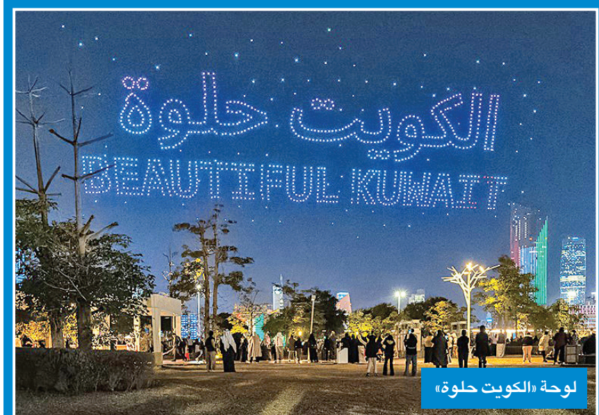
لوحة «الكويت حلوة»