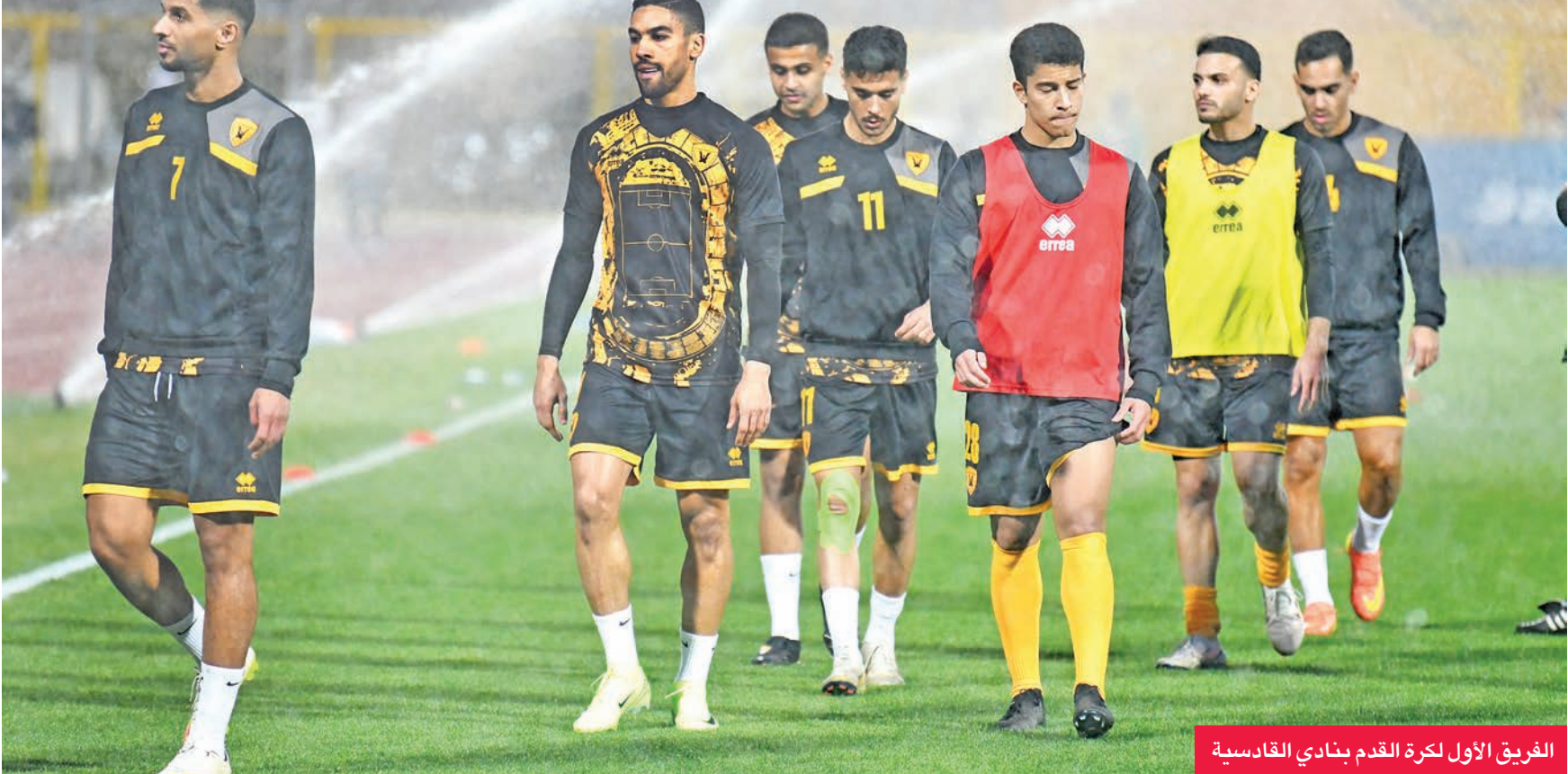
الفريق الأول لكرة القدم بنادي القادسية