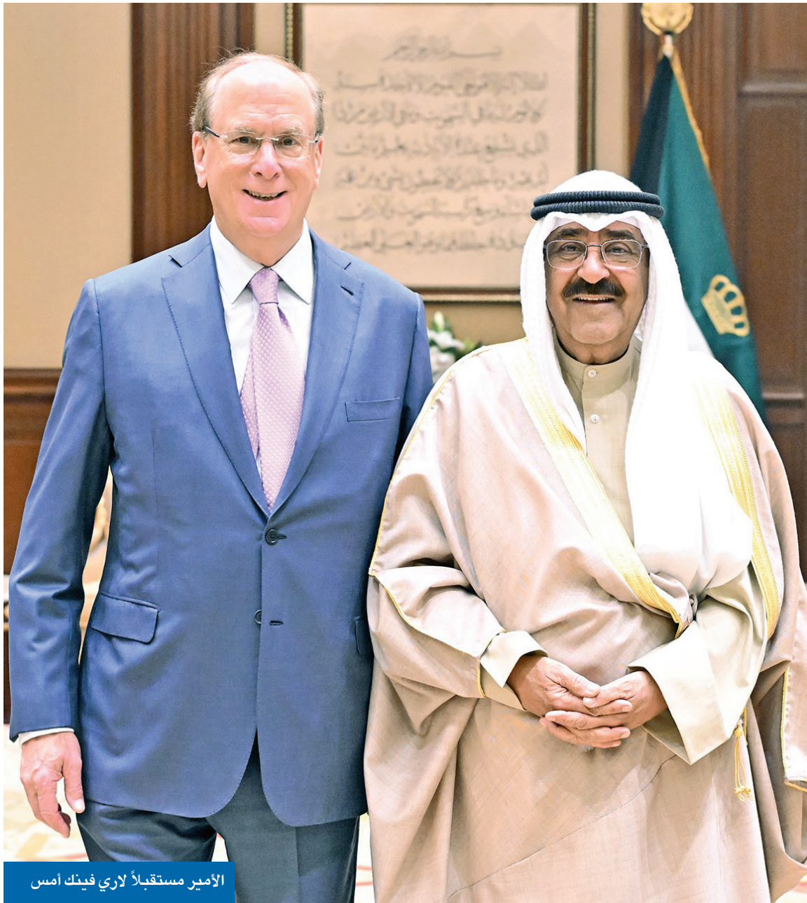
الأمير مستقبلاً لاري فينك أمس