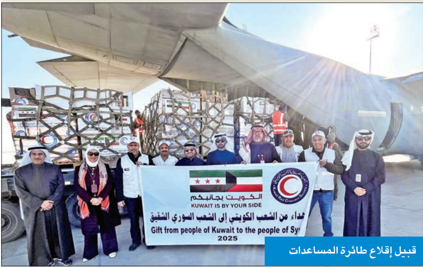
قبيل إقلاع طائرة المساعدات

الجوي لتقديم العون الإنسانية السورية للوقوف على آخر مستجدات الاحتياجات وسبل توزيعها لتخفيف من الظروف الإنسانية هناك، مشددا على أنها بالمعجمات الخيرية الكويتية تعمل عبر الجسر