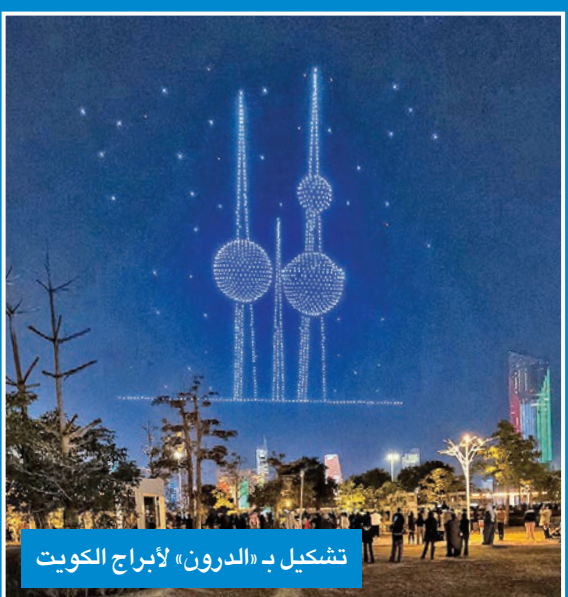
تشكيل بـ «الدرون» لأبراج الكويت