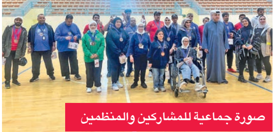
صورة جماعية للمشاركين والمنظمين