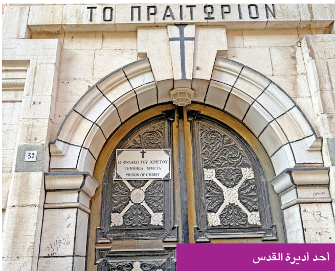
أحد أديرة القدس

العقبات في البلدة القديمة تلعب دوراً مهماً في تنظيم الحركة داخل الأحياء والأسواق، حيث توفر طرقاً مختصرة تربط بين الأماكن المختلفة. كما أن لها طابعاً تاريخياً وعمرانياً يعكس التراث الثقافي للمدينة، وهي جزء لا يتجزأ من هوية البلدة القديمة، مما يضفي عليها جواً فريداً ومميزاً.