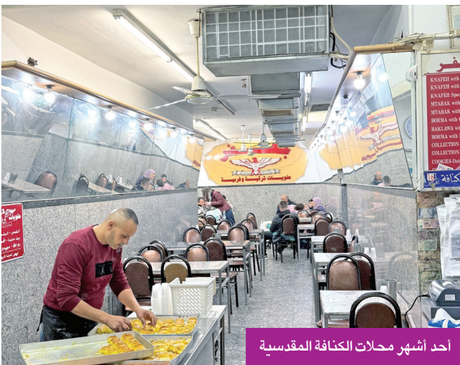
أحد أشهر محلات الكفافة المقدسية

عدنا إلى البلدة القديمة ومشينا كالعادة نحو كنيسة القيامة وهي واحدة من أقدس المواقع المسيحية، حيث يعتقد أنها تحتوي على مكان صلب السيد المسيح عليه السلام ودفنه وقيامته، شاهدنا أعمال الترميم بالصلاة على النبي، فالعارة بأخزون نصيبهم دون أن يدفعوا فلساً واحداً وبالفعل قدم لنا كبسا من الفلافل ولم حنّا بالقرب من باب الأسباط تعود للعصر الصليبي، وتعتبر مكان ولادة السيدة مريم العذراء.