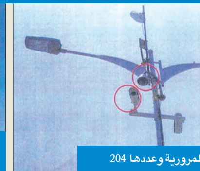
كاميرات المراقبة المرورية وعددها 204