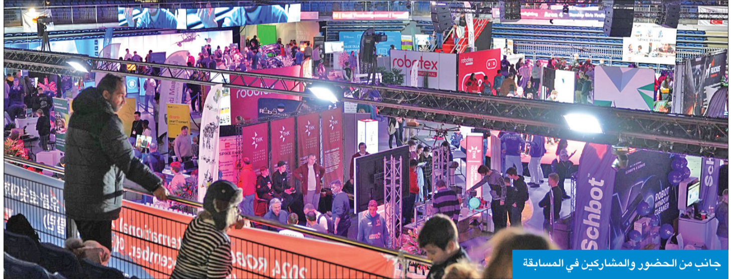
جانب من الحضور والمشاركين في المسابقة