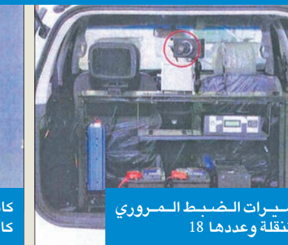
كاميرات الضبط المروري المتحركة وعددها 18