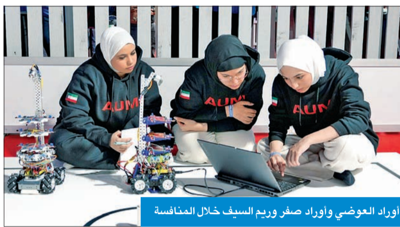
أورد العوضي وأورد صفر ورسم السيف خلال المنافسة

أحرز طلبة جامعة الشرق الأوسط الأمريكية المركز الأول في مسابقة Robotex International 2024، التي أقيمت في تالين - إستونيا.