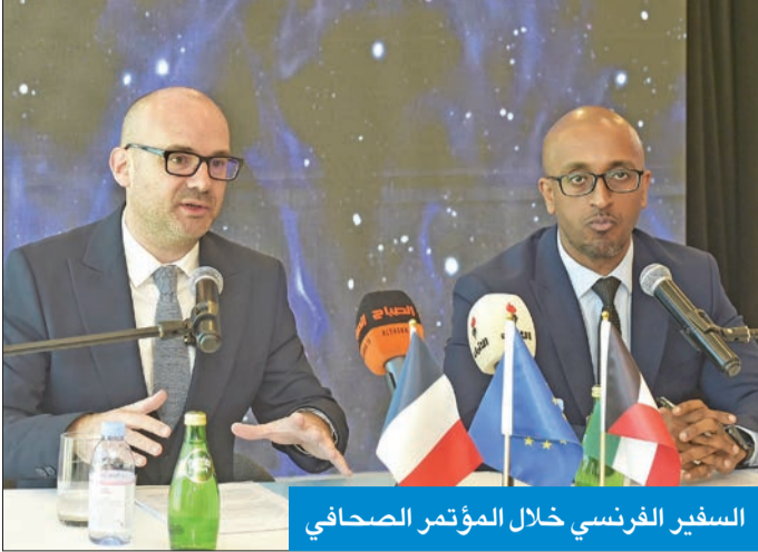
السفير الفرنسي خلال المؤتمر الصحفي

● غوفان: نحن من السفارات القليلة التي تصدر تأشيرات للمربين والعمالة المنزلية ● تأشيرة إقامة طويلة الأمد D-visa للكوييتيين أصحاب الممتلكات في فرنسا