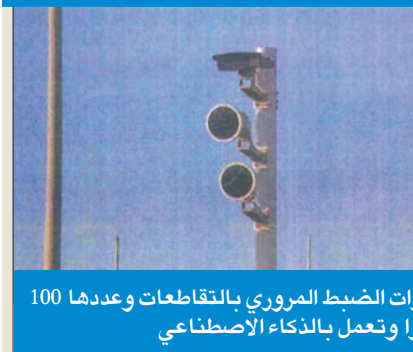
كاميرات الضبط المروري بالقاطعات وعددها 100 كاميرا وتعمل بالذكاء الاصطناعي

قال العميد الصباحان إن القانون الجديد للمرور لا يقتصر على مجرد تغليظ عقوبات مواد قديمة، لكنه أضاف أيضاً مواد جديدة، مثل العقوبات البديلة، مبيناً أن العقوبة الأصلية قد يكون فيها حبس أو غرامة عالية، وهنا بيد القاضي أن يحكم على المخالف بعقوبة بديلة أو اثنتين أو حتى ثلاث في وقت واحد، مثل الحكم على المخالف بخدمة المجتمع مدة لا تزيد على سنة، بواقع ثماني ساعات في اليوم من دون مقابل، وإلحاقه بدورات مع إصلاح الضرر والتلفيات التي تسبب فيها، ودفع قيمته.