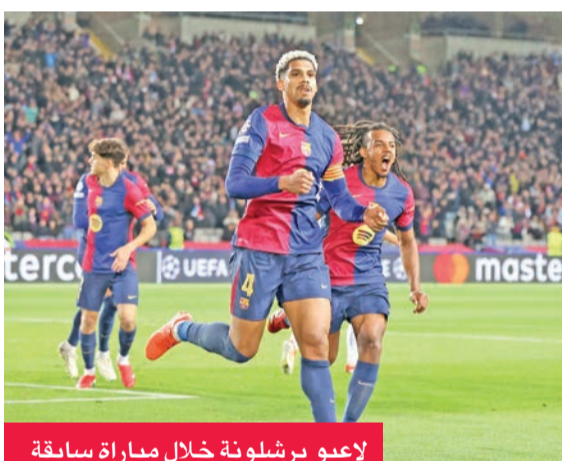
لاعبو برشلونة خلال مباراة سابقة

يتطلع برشلونة لمواصلة انتصاراته في الدوري، عندما يستضيف ديبورتيفو ألافيس اليوم في الجولة الثانية والعشرين من الدوري الإسباني لكرة القدم. ورغم تعادله أمام أتلانتا الإيطالي 2-2 الأربعاء في الجولة الأخيرة من مرحلة الدوري بدوري أبطال أوروبا فإن برشلونة كان ضد ضمن التاهل لدور الـ 16 بالبطولة بعد احتلاله المركز الثاني. ومن شأن هذا أن يمنح برشلونة المزيد من الثقة في مبارياته بالدوري، حيث يسعى الفريق للعودة للصدارة التي فقدتها بنهاية العام الماضي بعد سلسلة من النتائج السلبية. ويتواجد برشلونة في المركز الثالث بجدول الترتيب برصيد 42 نقطة. ويرغب هانسي فليك، المدير الفني لبرشلونة، أن يحقق انتصاره الثاني على التوالي بالدوري بعد فوزه على فالنسيا