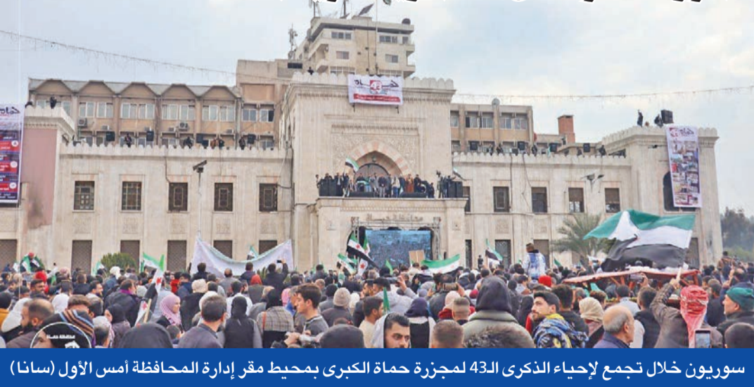
سوريون خلال تجمع لإحياء الذكرى الـ43 لمجزرة حماة الكبرى بمحيط مقر إدارة المحافظة أمس الأول (سانا)

«الإدارة» تحقق في تجاوزات... ومقتل 10 بقرية علوية بحماة