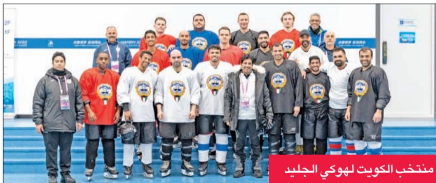
منتخب الكويت لهوكي الجليد

منغوليا وتابلند على التوالي في ذات اليوم، علماً بأنه وصل أمس (السبت)، وسيدشن تدريباته الرسمية اليوم وغداً، ممتنعاً التوفيق للفريق في مشاركته الدولية الأولى.