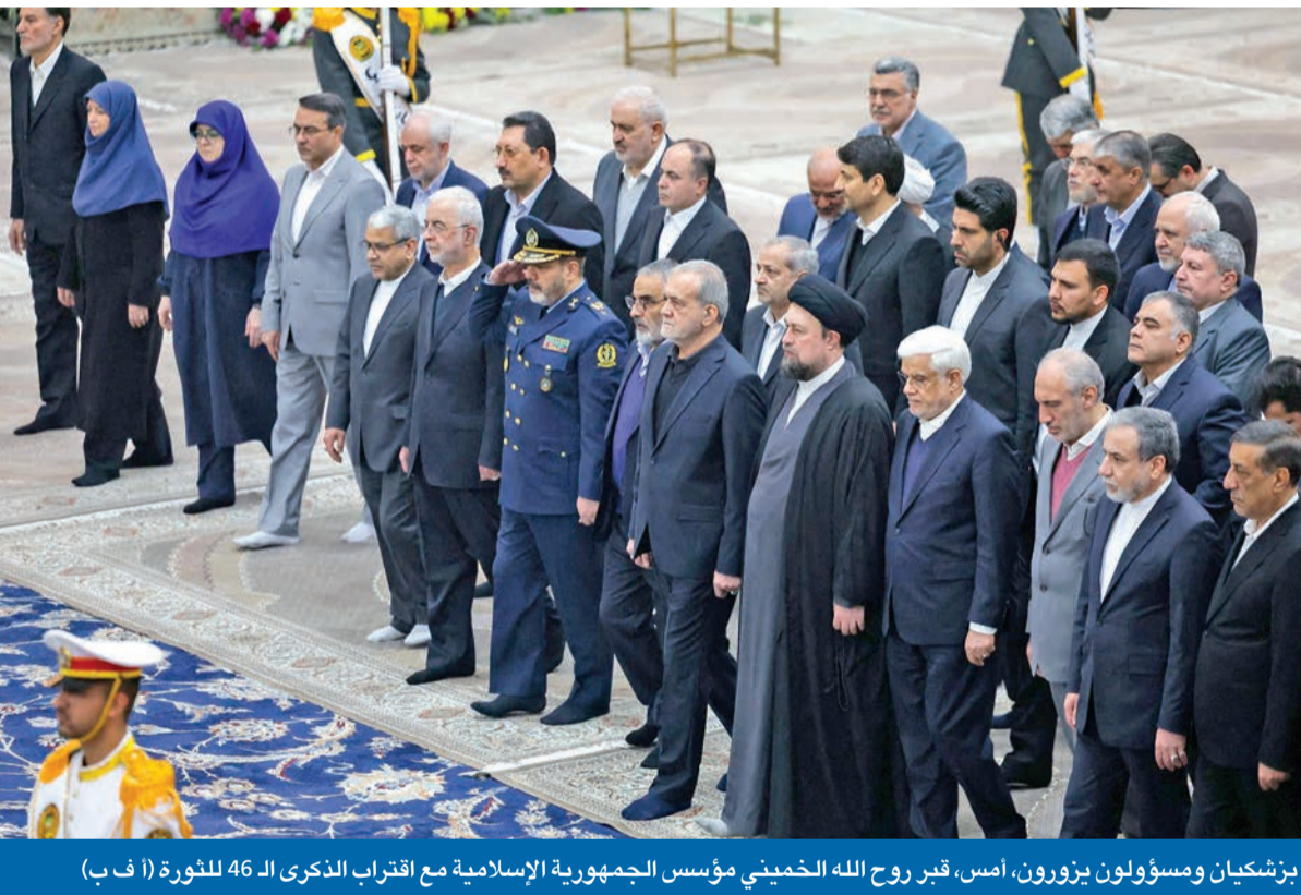
بزشكيان ومسؤولون يزورون، أمس، قبر روح الله الخميني مؤسس الجمهورية الإسلامية مع اقتراب الذكرى الـ 46 للثورة (أ ف ب)

مصالح العرب وأنقرة ستصطدم في سورية... وأنصار إيران في ركود مقصود طهران عملت لتجنب حلفائها العراقيين مصير نظرائهم اللبنانيين والسوريين إسرائيل ستستأنف عملياتها ضد غزة وتوسعها في الضفة بعد استكمال صفقة التبادل