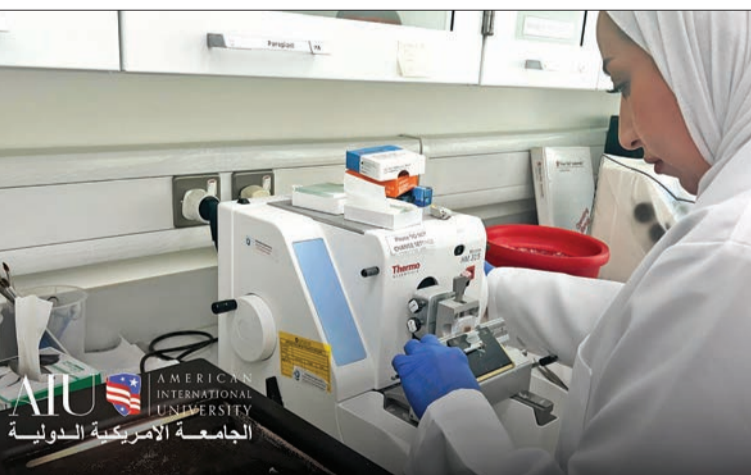
الجامعة الأمريكية الدولية

● البحيري والقصار قَدِّمًا دراسة عن مستويات الإيستمين -1 بالدورة الدموية العبيد: الجامعة ستستمر في دعم الطلبة ليكونوا مؤثرين محلياً ودولياً