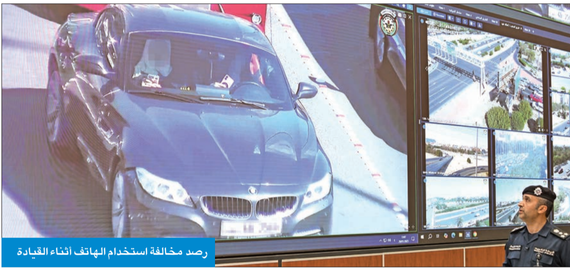
رصد مخالفة استخدام الهاتف أثناء القيادة

رصد ما يفوق 61 ألف مخالفة في الربع الأخير من 2024 بدون أي تدخل بشري، غير أن المخالفة لا تنزل مباشرة حيث تدخل في مرحلة تدقيق ومراجعة قبل توثيقها للتأكد من ارتكاب الشخص هذه المخالفة، ونزولها عبر تطبيق «سهل». كم عدد كاميرات الذكاء الاصطناعي؟ 252 كاميرا تعمل بالذكاء الاصطناعي تم تركيبها على الطرق السريعة والدائرية والرئيسية، والقاطعات ذات كثافة المركبات، وهذه تشمل كذلك الكاميرات التي تتركب على الجسور العلوية لرصد استخدام الهاتف باليد أثناء القيادة وعدم ربط حزام الأمان للقائد ومجاوره الأممي.