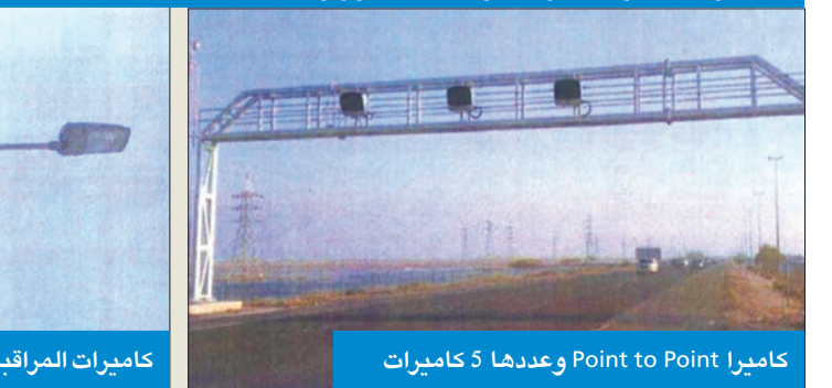
كاميرا Point to Point وعددها 5 كاميرات