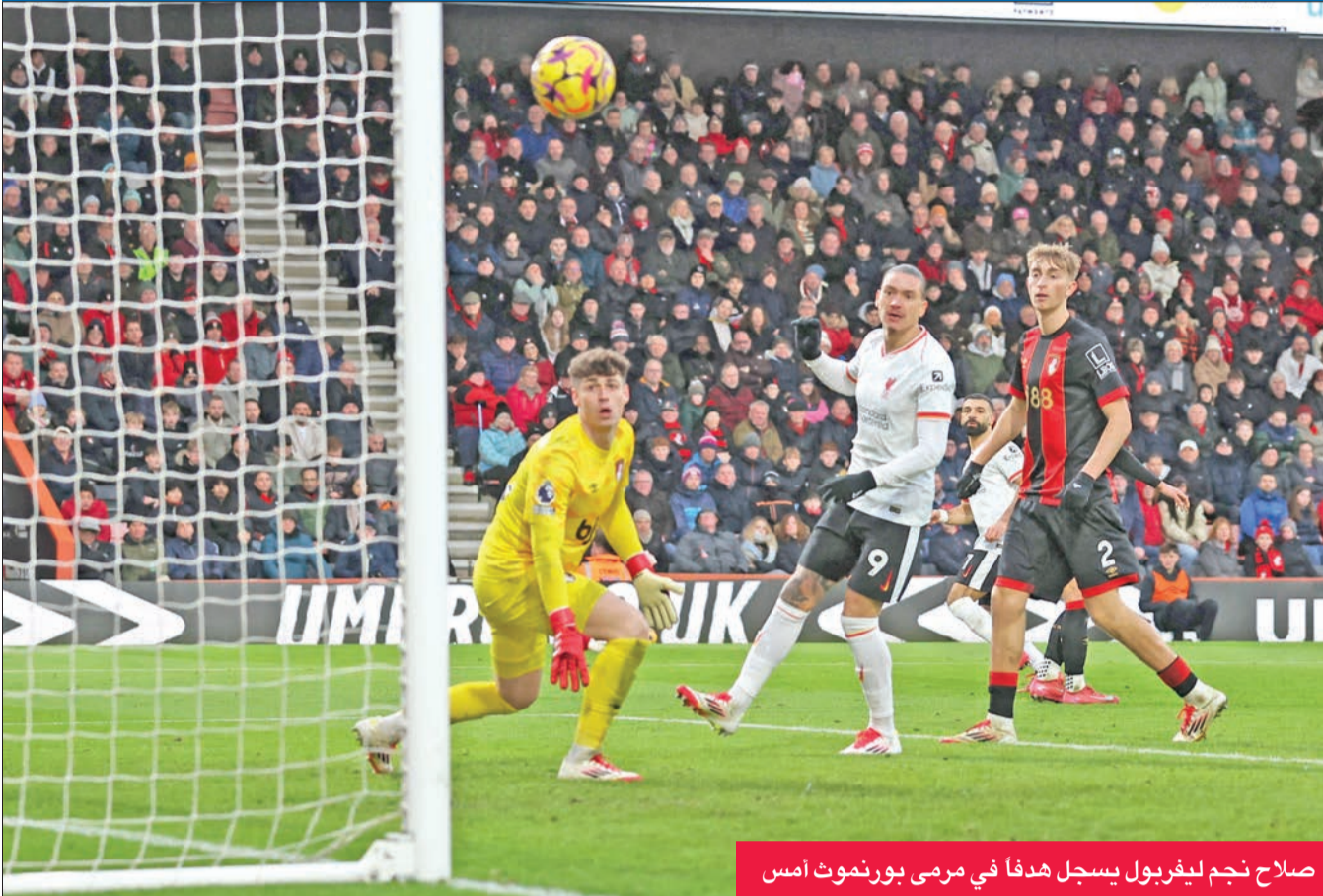
صلاح نجم ليفربول يسجل هدفا في مرمرى بورنموث أمس

سجل محمد صلاح هدفين في مباراة ليفربول مع بورنموث، مما أسدلت الستار على فوز ليفربول بمرتين على بورنموث بنتيجة 2-0. صلاح سجل هدفه الأول في المباراة في الدقيقة 12، وفولهام على نيوكاسل 1-2.