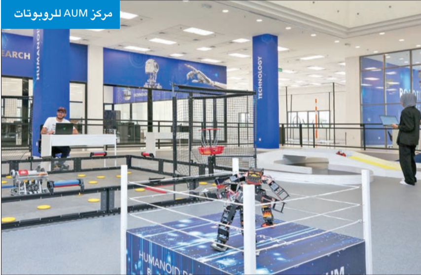
مركز AUM للروبوتات

شارك في هذه الفئة 26 فريقاً من عدة دول؛ منها الكويت وبولندا وتركيا وإستونيا وإيطاليا والهند واليونان. وبعد مرحلة التصفيات، تاهلت 4 فرق من الكويت، وقبرص،