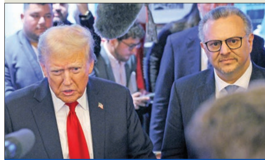
ترامب ونسبته اللغاني مسعد بولس الذي عينه مستشاراً للشؤون العربية خلال الحملة الانتخابية

بلدة عيتا الشعب في قضاء بنت جبيل، ووادي قلمون، وهي نقطة استراتيجية تقع جنوب غرب بلدة ريميش في قضاء بنت جبيل، وجبل بلاط، عند أطراف مروحين في قضاء صور الذي يكشف الساحل الجنوبي من صور إلى الناقورة وعمق القطاع الغربي حتى طبرحرفا والجيبين، ومنطقة لبونة علما التي تكشف القطاع الغربي ساحلاً (غرباً وشمالاً) وبلدات قرى شرق صور الجنوبية وبلونة الناقورة، التي تكشف الساحل والمنطقة البحرية حتى صور غرباً، وقرى قضاء صور الحدودية شرقاً، وتعتبر نقطة استراتيجية برية وبحرية في آن، فضلاً عن أنها تشر على مقر قيادة «يونيفيل» من الجهة الجنوبية، بضاف الى ذلك تلال شبعاء وفخروشوا؛ وهما النقطتان الاستراتيجيتان اللتان تطلان على كامل منطقة العرقوب والباقع الغربي شمالاً، وحاصبيا ومرجعيون غرباً، وجبل الشيخ والأراضي السورية غرباً.