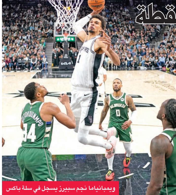
ويمبانياما نجم سبيرز يسجل في سلة باكس