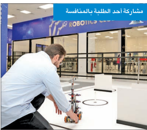
مشاركة أحد الطلبة بالمنافسة

وعلاوة على ذلك، ينظم المركز مسابقات داخلية بين الأعضاء المشاركين لخلق بيئة تنافسية وإعداد الطلبة لتمثيل «AUM» في مسابقات الروبوتات المحلية والإقليمية والدولية وتعد المشاركة في مسابقات الروبوتات فرصة مهمة لتزويد الطلبة بفرصة التفاعل مع نظرائهم من جميع أنحاء العالم وتبادل المهارات والخبرات. ومنذ تأسيس المركز، فازت طلبة AUM بالعديد من الجوائز المحلية والعالمية.