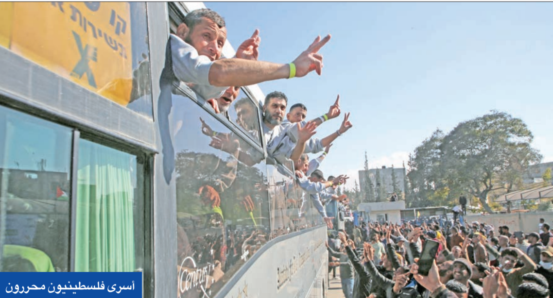
أسرى فلسطينيون محررون

«اجتماع القاهرة» يدعو لإعمار شامل للقطاع... و«حماس» تستعرض كل كئائبها في «رابع تبادل»