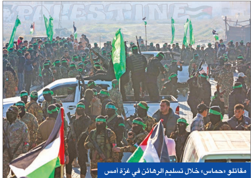
مقاتلو «حماس» خلال تسليم الرهائن في غزة أمس

ظهرت وحدات المشاة والقصف والدروع، مما يُظهر احتفاظ الحركة بوحدها العسكرية المتنوعة.