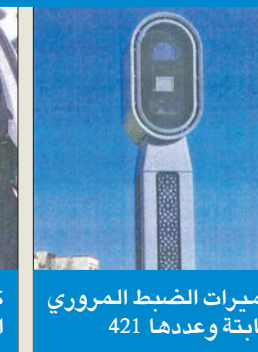
كاميرات الضبط المروري الثابتة وعددها 421