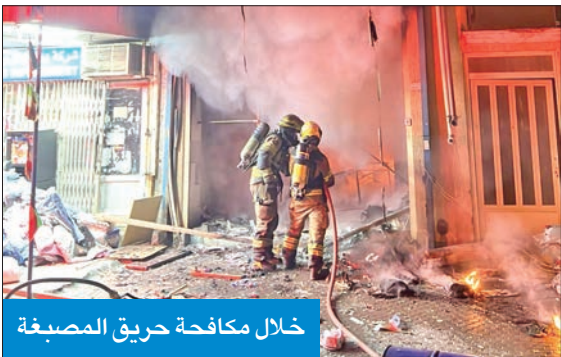
خلال مكافحة حريق المصبغة