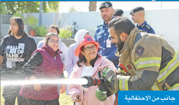
جانب من الاحتفالية

احتفلت قوة الإطفاء العام، بالتعاون مع شركة إيكويت للبترولوكيماويات صباح امس، باليوم العالمي لذوي الاحتياجات الخاصة، والذي يوافق الثالث من ديسمبر، انطلاقاً من مبدأ المشاركة المجتمعية وأهمية فئة ذوي الاحتياجات الخاصة. وفندت إدارة العلاقات العامة والإعلام بـ «الإطفاء» بالتنسيق مع قطاع مكافحة زيارة لمركز الخرافي لانشطة الأطفال المعاقين تزامناً مع هذا الحدث، وحرصاً على التواصل والتفاعل مع هذه الفئة المهمة والمميزة من المجتمع، ومشاركتهم أفراحهم، وتقديم الدعم المعنوي لهم، حيث تخلل هذه الزيارات برامج ومشاركات اجتماعية وتوعوية وترفيهية.