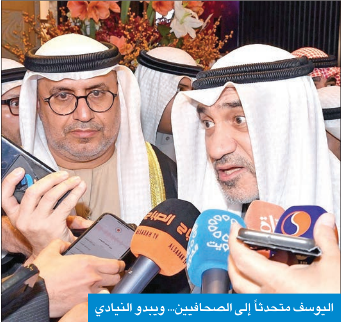
اليوسف يتحدث إلى الصحفيين... ويبدو النياي