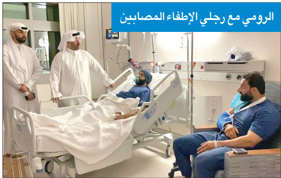
الرومي مع رجلي الإطفاء المصابين

وفصوله الى مواقع أخرى دون وقوع إصابات تذكر.