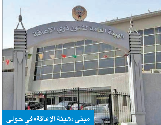
مبنى «هيئة الإعاقة» في حولي

يأتي اليوم العالمي للأشخاص ذوي الإعاقة هذا العام، والذي يصادف 3 ديسمبر سنوياً، في ظل أزمة تهدد مستقبل الخدمات التعليمية المقدمة لهذه الفئة العزيزة على قلوب الجميع، إذ تواجه أكثر من 39 حضانة ومركزاً متخصصاً ومؤسسة تعليمية صعوبات كبيرة في استمرار تقديم خدماتها بسبب تأخر قيادات الهيئة العامة لشؤون ذوي الإعاقة في صرف الدفعات المالية المستحقة لهذه الجهات، رغم إنجاز جميع الإجراءات اللازمة لصرفها من القطاع المعني في الهيئة.