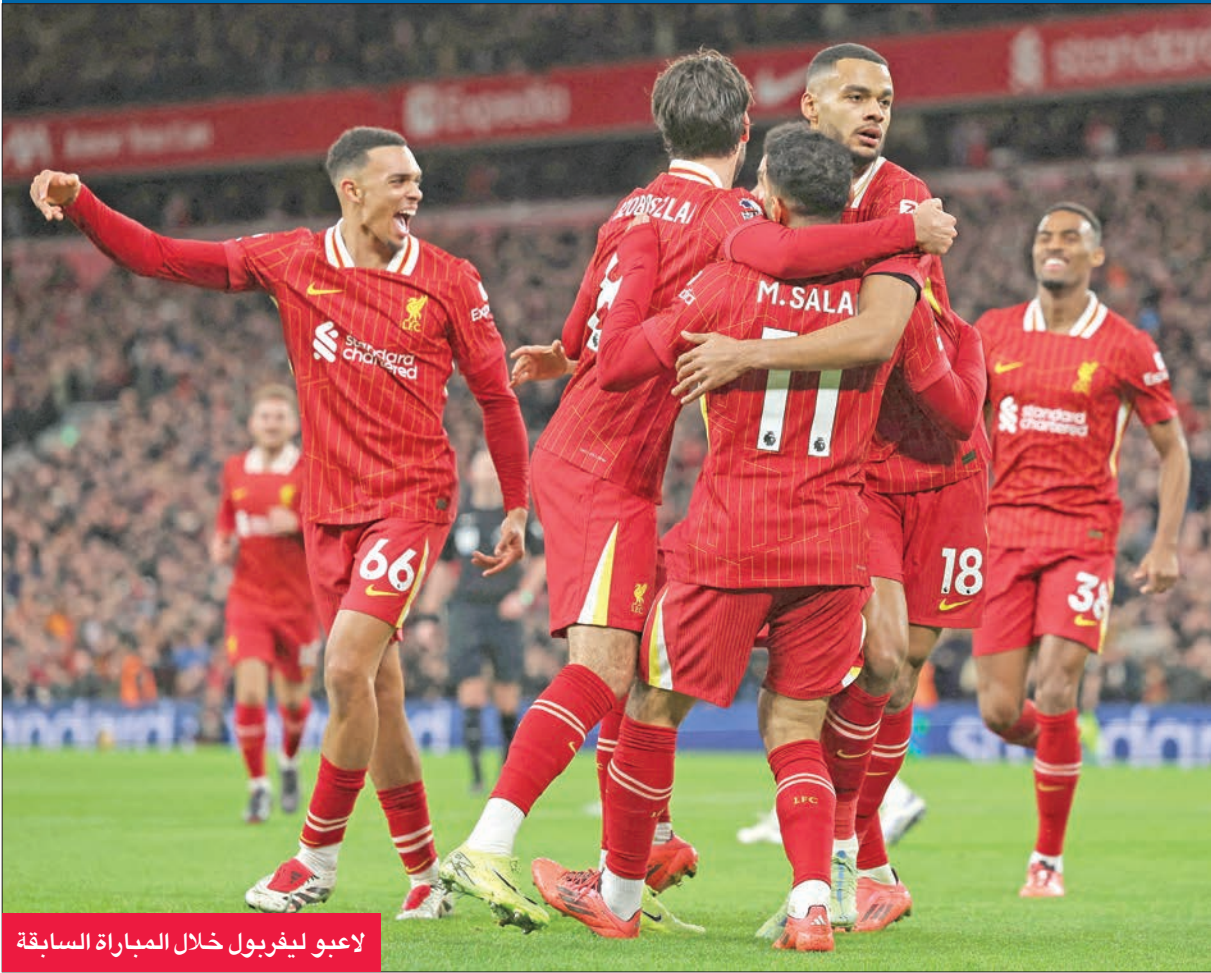
لاعبو ليفربول خلال المباراة السابقة

بعد الفوز على وست هام 5 - 2 «لقد عدنا إلى أفضل مستوياتنا. نبدو سريعين وديناميكيين. نحن جميعاً نستمتع بطريقة لعبنا حالياً». بسدوره، يحل تشلسي ضيفاً على ساوثامبتون مستهدفاً الفوز الرابع توالياً في الدوري وكوفرنس ليغ ضمن سلسلة اللاهزيمة التي وصلت إلى ست مباريات. ويستضيف مانشستر سيتي، حامل اللقب في المواسم الأربعة الأخيرة، فريق نوتينغهام فورست على ملعب (الاتحاد)، حيث يهدف الفريق السماوي، الذي تراجع للمركز الخامس برصيد 23 نقطة، للتخلص من حالة الانهيار التي يعاني منها في الفترة الأخيرة، بعدما تلقى 6 هزائم وتعادلاً في لقاء وحيد، خلال مبارياته السبع الأخيرة بمختلف البطولات.