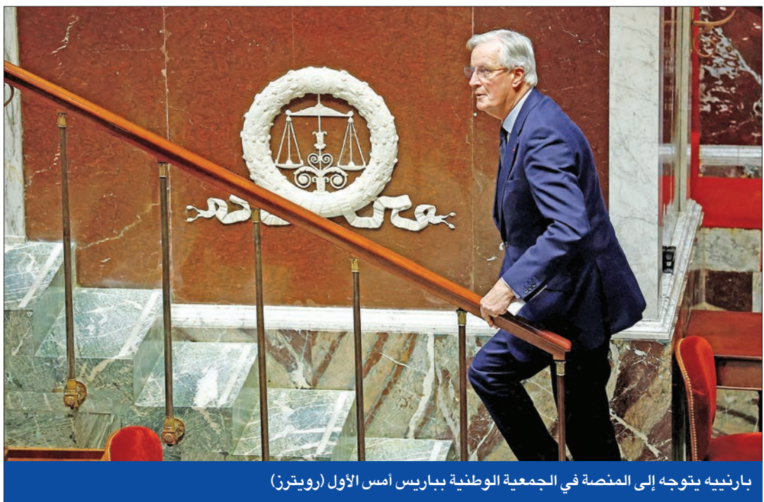
بارنيه يتوجه إلى المنصة في الجمعية الوطنية بباريس أمس الأول

من جانبه، حذر وزير القوات المسلحة، سيباستيان ليكورو، من «عواقب» إسقاط الحكومة على الجيوش، مشيراً إلى أنه «بالنسبة لجنودنا، فإن هذا يعني استحالة زيادة رواتبهم» ووقف تجنيد 700 جندي إضافي». لكن المعارضة انتقدت هذا الخطاب بشدة، حيث استكترت النخبة لور لافاليت «الابتزاز الذي يتعرض له الفرنسيون من قبل آتال وشريكه بارنيه»، محملة «تحالف القوى الليبرالية مسؤولية هذه الفوضى السياسية». ومع استحالة إجراء انتخابات برلمانية مبكرة جديدة قبل يوليو، سيواجه ماكرون مزيداً من الضغوط السياسية، لكنه يعتمد