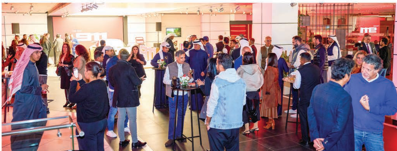
جانب من الحضور

فعالية استثنائية بضيافة فاخرة شهد الحدث حضور نخبة من عشاق سيارات بورشه، وممثلي الإعلام، والعلماء المميزين، وكبار الشخصيات الذين