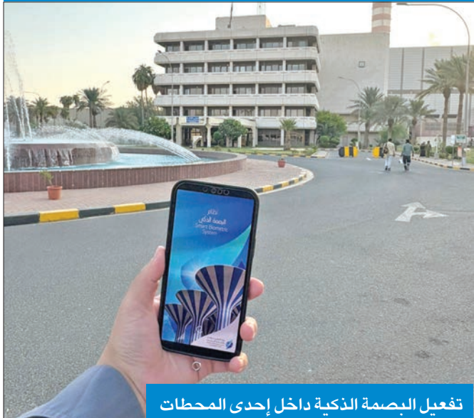
تفعيل البصمة الذكية داخل إحدى المحطات

أن تلك الأجهزة تعمل بكفاءة في كل المواقع، إلا أن التطبيق يُعد إضافة لتسهيل عمل الموظفين، وتخفيف الاندحامات على أجهزة البصمة. ولفتت إلى أن «الكهرباء» تحرص دائماً على مواكبة التطور التكنولوجي الحديث والنظم والتقنيات في كل ما يخدم ويسهل أعمالها، شاكراً جهود القائمين على ذلك التطبيق الكبير الذي بذلوه لخدمة تلك المحطات والقطاعات المختلفة لعدة أيام متواصلة من أجل أن يتم تفعيل التطبيق داخل تلك المواقع لمواصلة الأعمال كافة دون انقطاع مع إقرار البصمة الثالثة.