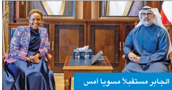
الجابر مستقبلاً مسويا أمس

سبل تعزيز هذه العلاقات في مختلف المجالات، لا سيما مجال العمل الإنساني.