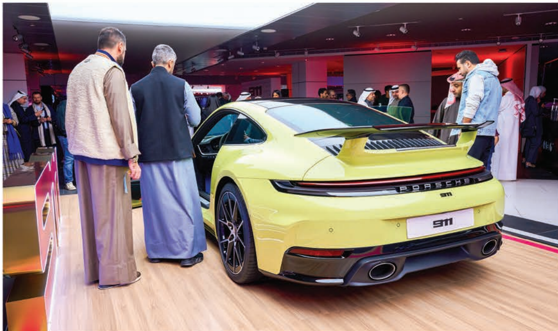
تصميم مبتكر ورياضي للجانب الخلفي للسيارة