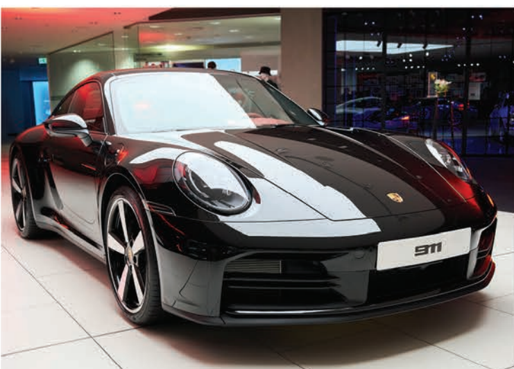
بورشه 911 كاريرا باللون الأسود

دعوة لاكتشاف السيارة عن قرب يدعو مركز بورشه الكويت عشاق السيارات الرياضية لزيارة صالة العرض بمنطقة الشويخ لاستكشاف المزايا والتصميمات المبتكرة لسيارة 911 كاريرا الجديدة. تجربة فريدة بانتظار الجميع لاستكشاف مستقبل الأداء والفعالية مع بورشه.