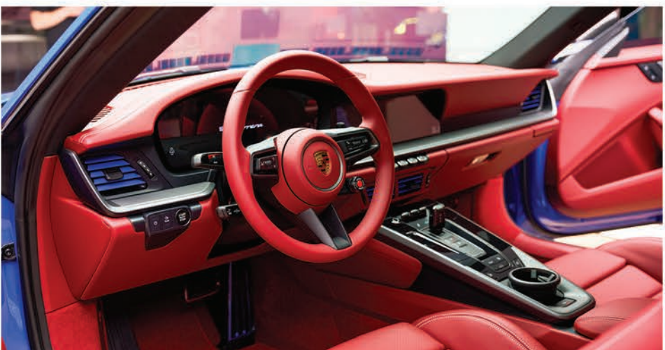
صورة للمقصورة الداخلية للسيارة