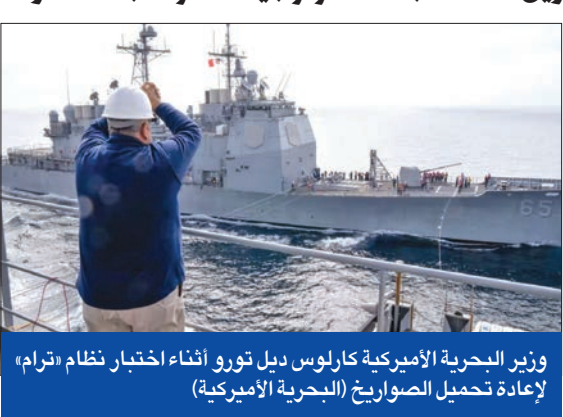
وزير البحرية الأمريكية كارلوس ديل تورو أثناء اختبار نظام «ترام» لإعادة تحميل الصواريخ

جميع العناصر وما هي الضغوط التي واجهتها. بهدف تحسين التصميمات، ونسب نظام إعادة التحميل البطيء صداماً للبحرية الأميركية في البحر الأحمر، حيث اضطرت سفنها المنتشرة هناك للدفاع عن سفن الشحن من هجمات المتطرفين الحوثيين للإبحار عبر قناة السويس نحو الموانئ في اليونان أو إسبانيا لإعادة التحميل، وانسحبت من القتال فترات طويلة. وقال القائد الأعلى السابق لقوات حلف شمال الأطلسي، الأميرال المتقاعد، جيمس ستافريدس، إنه «كان ينبغي علينا أن نظور هذه القدرة منذ عقود»، مضيفاً أنه «بعد إطلاق حملة كبيرة من صواريخ توماهوك كان علي سحب سفني الحربية من الخط لإعادة تسليحها». ولا تعيد البحرية الأميركية تحميل منصات الإطلاق إلا من أرض صلبة أو في موانئ بحمية لأنظمة عملية حساسة. ولا تمتلك الولايات المتحدة سوى 11 حاملة طائرات تعمل بالطاقة النووية و9 سفن هجومية برمائية أصغر