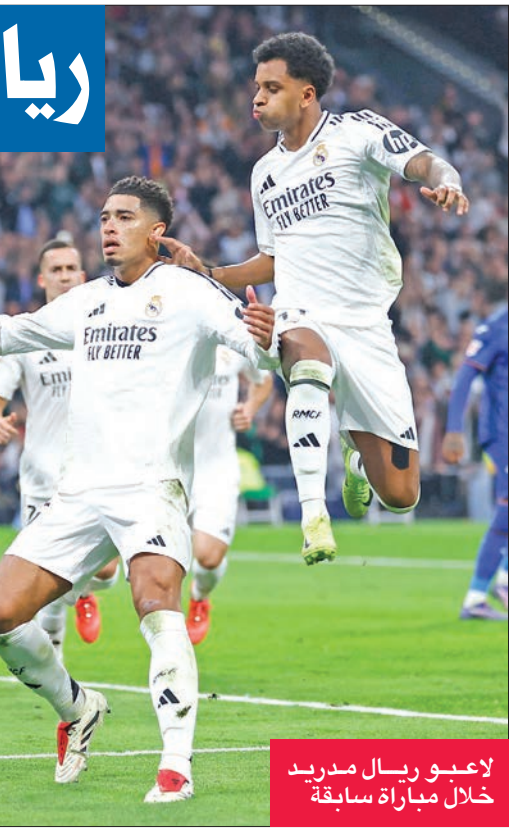
لاعبو ريال مدريد خلال مباراة سابقة

بخوض ريال مدريد حامل اللقب اختباراً شاقاً اليوم في الباسك ضد أثليتيك بلباو، وذلك في مباراة مقدمة من المرحلة 19. على ملعب «سان ماميس» في إقليم الباسك، سيكون ريال مدريد أمام مهمة أصعب بكثير من برشلونة إذ يحل ضيفاً على بلباو الذي يحتل المركز الرابع بعد خروجه منتصراً من المرحلتين الماضيتين ضمن سلسلة من تسع مباريات متتالية من دون هزيمة في الدوري ومسابقة «يوروبا ليغ»، وتحديداً منذ خسارته أمام جيرونا 1 - 2 في 6 أكتوبر ضمن المرحلة التاسعة بعد لقاء أضاع خلاله ركلتي جزاء واهتزت فيه شبكاه بهدف قاتل في الوقت بدل الضائع. واستعد ريال توازنه الأحد بفوزه على جاره خيتافي 2 - 0، وذلك بعد سقوطه في منتصف الأسبوع على أرض ليفربول الإنكليزي 2 - 0 في