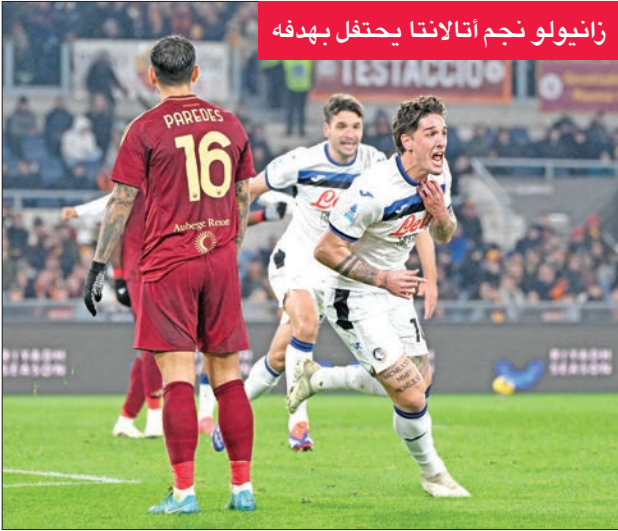
زانيولو نجم أتالانتا يحتفل بهدفة

مهاجم روما السابق نيكولو زانيولو الهدف الثاني بكرة راسية مانحاً فريقه فوزه الثامن توالياً في مختلف المسابقات.