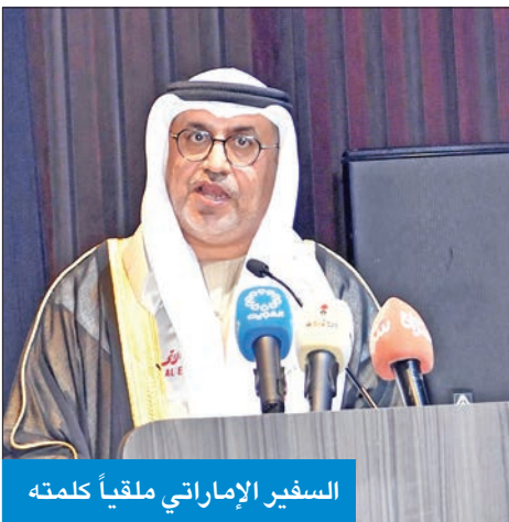
السفير الإماراتي ملقياً كلمته

الصادر عن المحكمة الدستورية ببن أن منح الجنسية أمر سيادي، ولا اعتقد أن هناك أي درجة من درجات التقاضي قادرة على النظر فيها، وأتمنى أن يدرك الجميع ذلك. ولفت إلى أن أكثر من محام تطرق إلى هذا الأمر، وطالبوا ببسط سلطة القضاء على الجناسي، ولكن القضاء حسم الأمر باعتبار الجنسية قراراً سيادياً، وليست قراراً يستطيع أي محام التدخل فيه، وعند التوجه للقضاء سيبلغ الجهات التي رفعت القضية أنه ليس لها اختصاص بنظر هذه القضايا، وهي قضايا الجنسية.