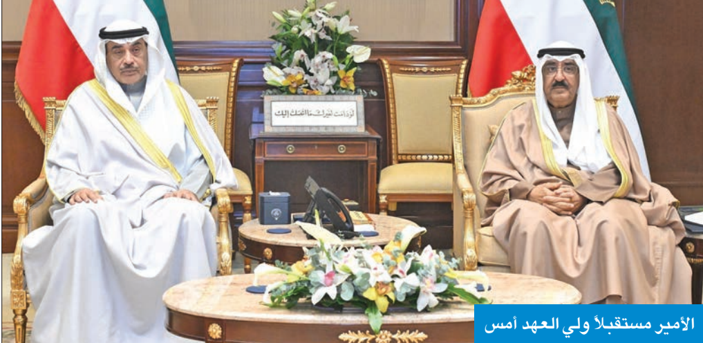
الأمير مستقبلاً ولي العهد أمس

استقبل سمو أمير البلاد الشيخ مشعل الأحمد، بقصر بيان صباح أمس، سمو ولي العهد الشيخ صباح الخالد، ثم رئيس مجلس الوزراء سمو الشيخ أحمد العبدالله. وفي مجال آخر، بعث سمو الأمير بترقية تهنئة إلى رئيس المجلس الأوروبي، أنطونيو كوستا، عبر فيها سموه عن خالص التهنئة بمناسبة توليه مهام رئاسة المجلس. وأشاد سموه بالتعاون القائم والعلاقات المتميزة بين الكويت والاتحاد الأوروبي، مؤكداً الحرص