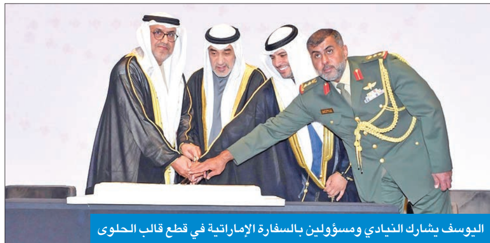
اليوسف يشارك النياي ومسؤولين بالسفارة الإماراتية في قطع قالب الحلوى

توجيهات من سمو أمير البلاد الشيخ مشعل الأحمد، وتابع: «وفيما يخص القطاع الخاص لا أستطيع الجواب، ولكن سيستمررن في تقاضي نفس الرواتب التي كن يتقاضينها ونفس الامتيازات، وبالنسبة للتأمينات الاجتماعية، طبعاً ستستمر لمن يعيش على أرض الكويت، حيث إن هناك أشخاصاً فقدوا جناسيهم ولكن هم غادروا الكويت، وفن يغادر الكويت لماذا علينا أن نصرف عليه من التامينات؟» وأوضح أنه «لم يتم فتح باب التظلمات من سحب الجناسي حتى الآن، ولكن سيتم ذلك.» وذكر «حتى بعد فتح باب التظلمات، فإن الحكم