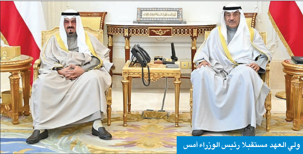
ولي العهد مستقبلاً رئيس الوزراء أمس

سموه هنا رئيس المجلس الأوروبي بتوليه مهامه