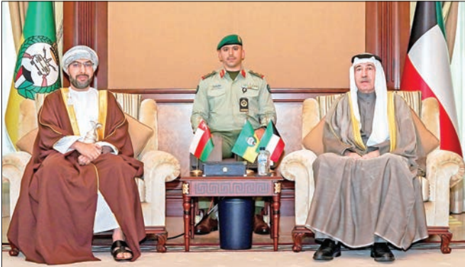
رئيس الحرس الوطني مستقبلاً السفير العماني

استقبل رئيس الحرس الوطني، الشيخ مبارك الحمود، أمس، في ديوانه بالرئاسة العامة للحرس، سفير سلطنة عُمان لدى الكويت، د. صالح الخروصي، حيث قدم له التهنئة، لحصوله على ثقة القيادة السياسية وتعيينه رئيساً للحرس الوطني. وتقدم رئيس الحرس بالشكر والتقدير لسفير سلطنة عُمان الشقيقة على تهنئته، مشيداً بالروابط التاريخية والعلاقات المتميزة بين البلدين.