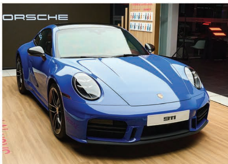
سيارة 911 كاريرا تتألق بلون أزرق لوغانو

تتميز طرازات 911 كاريرا الجديدة أيضاً بتصميماتها الخارجية العصرية، التي تنسجم بالأناقة وتدعم كفاءة الأداء. تشمل أبرز العناصر التي تميز هذه التصميمات: ● عجلات ذات تصميم حصري مع أضلاع من الكربون لتقليل معامل السحب، بالإضافة إلى عرض أكبر للإطارات الخلفية لتحسين ديناميكية السيارة. كما تم تحديث المصدات لتعزيز الأداء والهيكل العام. ● دمج جميع وظائف الإضاءة في المصابيح الأمامية بنظام LED Matrix المتطور، ولأول مرة يتم تصميم المصابيح بتصميم أنحف، مع شريط إضاءة خلفي كامل