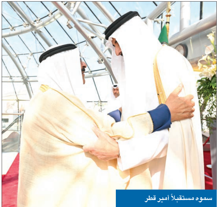
سموه مستقبلاً أمير قطر