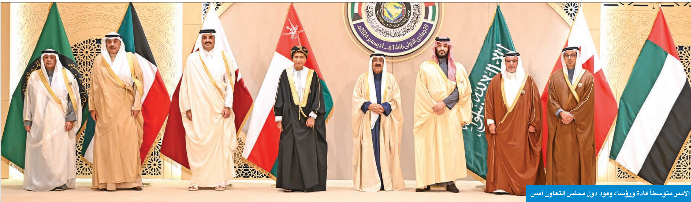
الأمير متوسلاً قادة ورؤساء وفود دول مجلس التعاون امس

إلى تحقيق التكامل الاقتصادي الخليجي، من خلال توحيد السياسات، وتنويع مصادر الدخل غير التقليدية، وتسهيل حركة التجارة والاستثمار، ودعم الصناعات المحلية، وتوسيع قواعد الابتكار وريادة الأعمال خاصة في المجالات المستحدثة، مثل مجالات الذكاء الاصطناعي، وذلك لتعزيز تنافسية اقتصاد بلداننا على الساحتين الإقليمية والدولية. وتنطلق مسيرة عملنا نحو خلق اقتصاد خليجي متكامل مرن قادر على تلبية تطلعات شبابنا، من منطلقات أساسية أهمها التعليم، وصقل مواهبهم وشدهمهم نحو المساهمة في تحقيق الاقتصاد الخليجي المتكامل الذي ننشده، وبلوغ طموحاتنا باستدامة نماء ورخاء شعوبنا، من خلال ضمان جودة عناصرها البشرية،