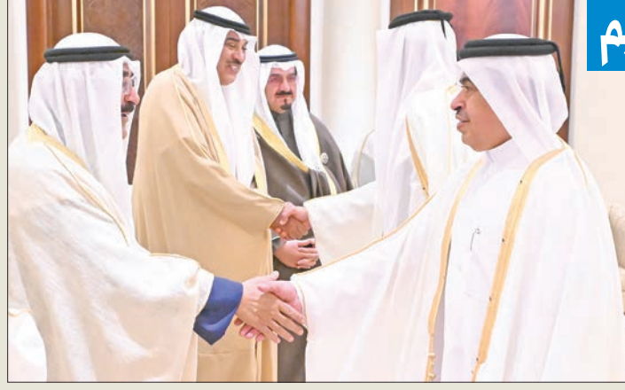
قطر حاضرة برئاسة الأمير تميم