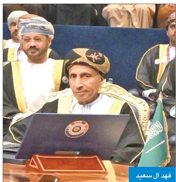
فهد آل سعيد

إخواني أصحاب السمو،، تشييد البوادر الإيجابية البناءة التي عبرت عنها الجمهورية الإسلامية الإيرانية الصديقة نحو مجلس التعاون لدول الخليج العربية، ونتطلع إلى أن تنعكس على الملفات العالقة بين الجمهورية الإسلامية الإيرانية الصديقة ودول المجلس كافة، والارتقاء بمجالات التعاون إلى آفاق أوسع، في ظل ميثاق الأمم المتحدة ومواثيق القانون الدولي، ومبادئ حسن الجوار، واحترام الدول وعدم التدخل في شؤونها الداخلية.