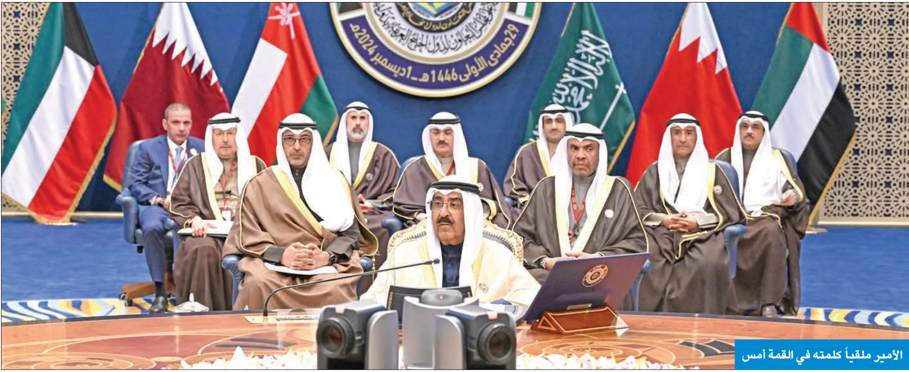
الأمير مملقياً كلمته في القمة أمس

عبر 154 بنداً، حدد المجلس الأعلى لدول مجلس التعاون الخليجي في بيانه الختامي أمس موقفه من كل التطورات الإقليمية والدولية، وفي مقدمتها العمل الخليجي المشترك، وحماية البيئة والتغير المناخي والعمل العسكري والأمني المشترك، والأوضاع في كل من غزة وقضية فلسطين والاحتلال الإيراني للجزر الثلاث التابعة للإمارات العربية المتحدة، وحقل الدرة، ومكافحة الإرهاب والتطرف، والعلاقة مع إيران، إلى جانب تطورات اليمن والمغرب وأفغانستان والصومال، فضلاً عن الأزمة الروسية - الأوكرانية، والشراكة الاستراتيجية مع الدول والمجموعات الأخرى. وفيما يلي أبرز مضامين البيان الختامي للقمة: