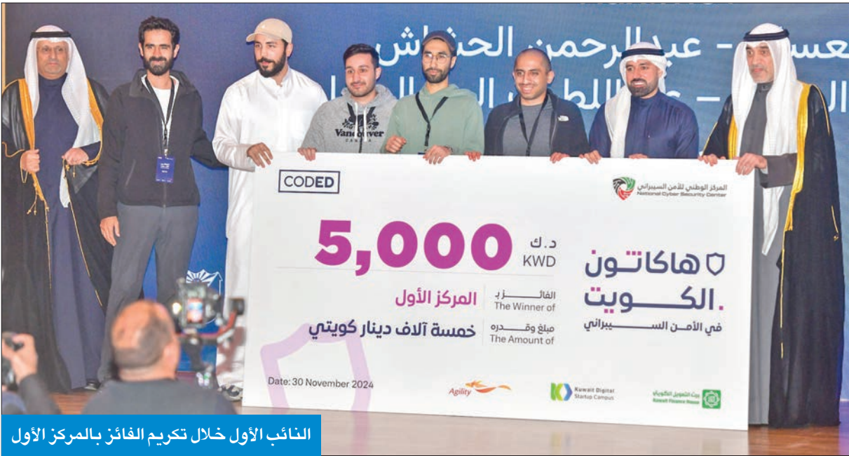
النائب الأول خلال تكريم الفائز بالمركز الأول