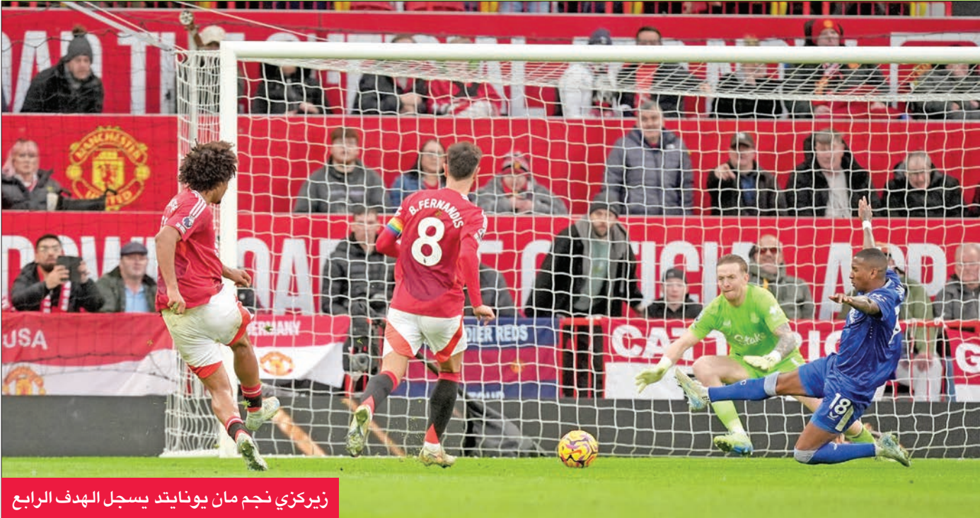
زيركزي نجم مان يونايتد يسجل الهدف الرابع

وارتفع رصيد تشلسي، الذي حقق فوزه السابع في البطولة هذا الموسم مقابل 4 تعادلات وهزيمتين، إلى 25 نقطة.