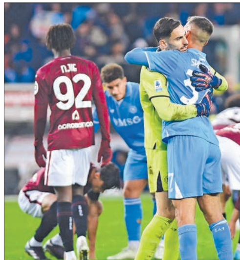
فرحة لاعبي نابولي بعد الفوز على تورينو

ضمن نابولي الخروج من المرحلة الرابعة عشرة من الدوري الإيطالي لكرة القدم في الصدارة، وذلك بعد عودته من ملعب تورينو بالفوز -صفر- أمس. ويبدو أن فريق المدرب أنتونيو كونتي وضع خلفه هزيمته المذلة في المرحلة الحادية عشرة على أرضه أمام أتلانتا برباعية نظيفة، إذ اتبعها بتعادل على أرض إنتر 1-1، ثم فوز على روما 1- صفر، وأمس على تورينو خارج الديار.