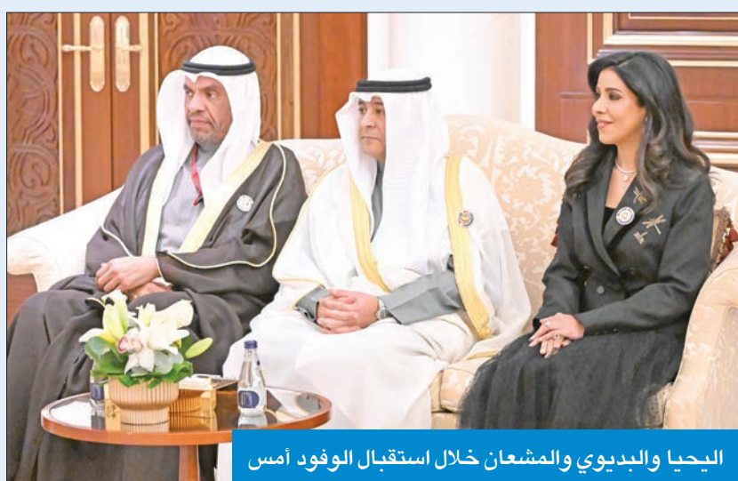
الحيا والبديوي والمشعان خلال استقبال الوفود أمس

التنمية الشاملة وتعزيز القرارات الاقتصادية لدولنا وإطلاق برامج إستراتيجية مشتركة تهدف إلى تعزيز الأمن الغذائي والمائي، في إطار رؤية مستدامة تسعى لتأمين الموارد الأساسية لمستقبل شعوبنا وتعزيز التعاون في مجالات التكنولوجيا والابتكار لدعم مسيرة التحول الرقمي وتحقيق الريادة في الاقتصاد الرقمي.