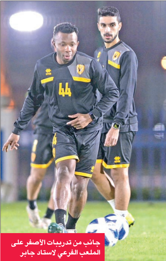
جانب من تدريبات الأصفر على الملعب الفرعي لاستاد جابر