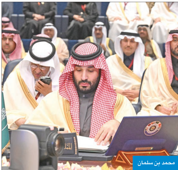
محمد بن سلمان

● دولنا قادرة من خلال تلاحمها على تحقيق رخاء شعوبنا وصون استقرارها وتحقيق أمنها