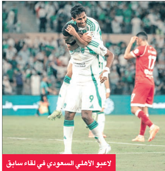
لاعبو الأهلي السعودي في لقاء سابق

يتطلع الأهلي السعودي للاحتفاظ بصدارة ترتيب دوري أبطال آسيا للنخبة في كرة القدم اليوم، عندما يستضيف استقلال طهران الإيراني ضمن منافسات الجولة السادسة وسط مطاردة سعودية عبر الهلال والنصر، في حين يدور صراع على البطاقات المؤهلة الى الدور ثمن النهائي. ويظهر الأهلي في المسابقة القارية بصورة مختلفة عن الدوري المحلي، حيث يحتل المركز السادس بفارق 13 نقطة عن الاتحاد المتصدر، في حين أنه لم يخسر بعد في 5 مباريات قارية كان آخرها الفوز على العين الإماراتي حامل اللقب 2 - 1 الأسبوع الماضي. ويتبوأ الأهلي صدارة ترتيب دوري الأبطال برصيد 15 نقطة بفارق نقطتين عن الهلال والنصر. ويدرك الفريق أن مهمته لن تكون سهلة أمام الاستقلال الذي سبقاقتل من أجل الاحتفاظ بأماله في التأهل، حيث يحتل المركز السابع برصيد 4 نقاط. ويستضيف النصر اليوم أيضاً نظيره السد القطري في مواجهة قوية، حيث يسعى الأخير لضمان عبوره الى الدور المقبل.