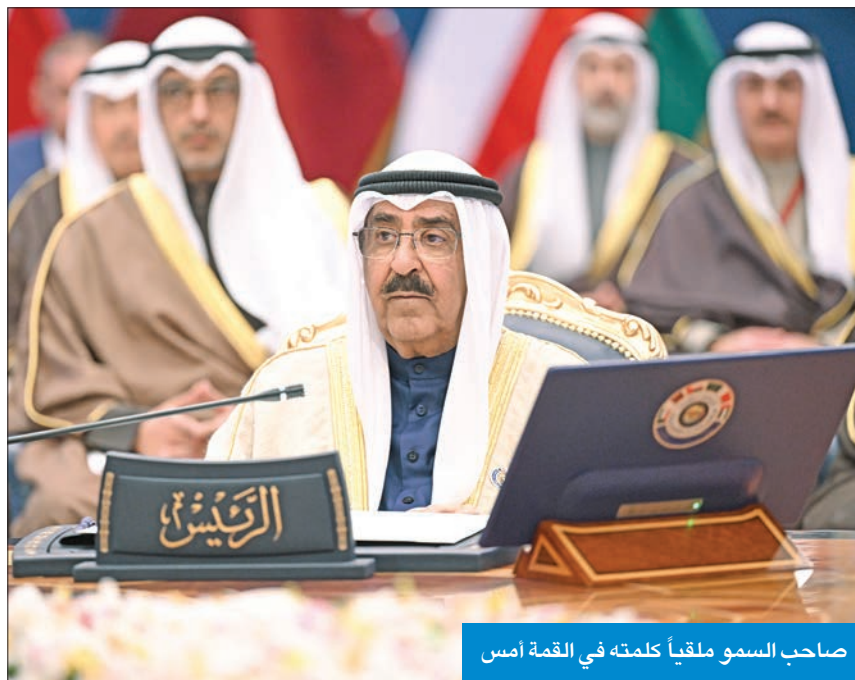
صاحب السمو ملكيا كلمته في القمة أمس

جميعا لما فيه الخير والصالح، وأن يديم على دولنا وشعوبنا نعم الأمن والأمان والاستقرار والأزدهار. والسلام عليكم ورحمة الله وبركاته.