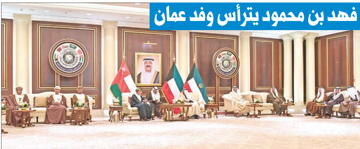
فهد بن محمود يترأس وفد عمان