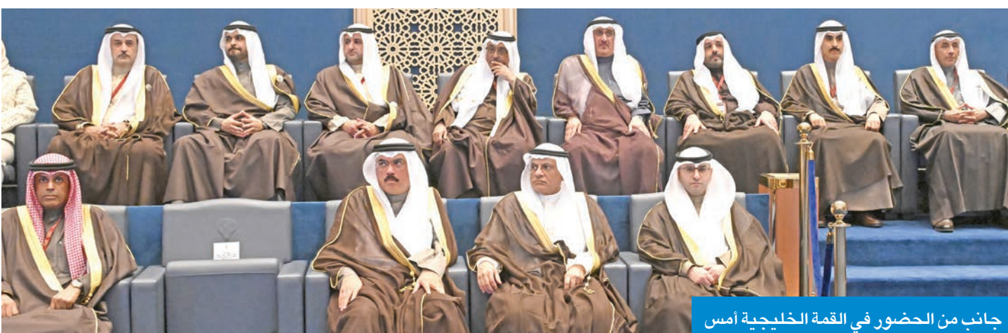
جانب من الحضور في القمة الخليجية أمس

أبدى قادة دول مجلس التعاون حرصهم على الاستمرار في تمكين المرأة الخليجية في كل المجالات، وتعزيز الدور الأساسي للشباب في دول المجلس، وأهمية دور الجامعات ومراكز الأبحاث والمفكرين وقادة الرأي في الحفاظ على الهوية والموروث الخليجي والثقافة العربية الأصيلة ومنظومة القيم الإسلامية السامية، ومبادئ الحوكمة الرشيدة، مؤكداً دور مؤسسات المجلس في تحقيق هذه الأهداف.