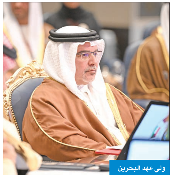
ولي عهد البحرين

العمل الخليجي المشترك نحو شعوبنا وتحقيق تطلعاتها إلى مستقبل مشرق، ننعم فيه بالرفعة والنماء والرخاء.. وأسأل الله العلي القدير أن يوفقنا