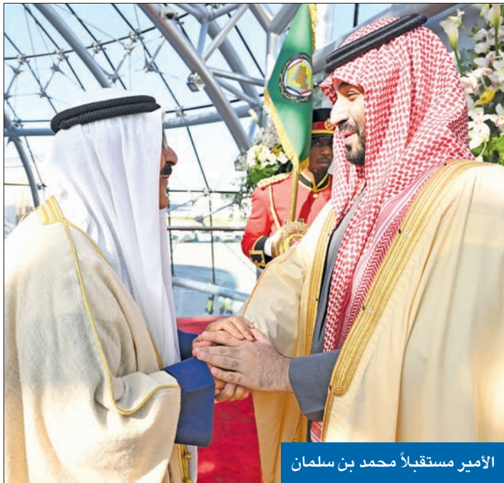
الأمير مستقبلاً محمد بن سلمان

نجدد دعوتنا للعراق إلى تصحيح الوضع القانوني لاتفاقية تنظيم الملاحة البحرية في خور عبدالله واستكمال ترسيم الحدود البحرية مع الكويت