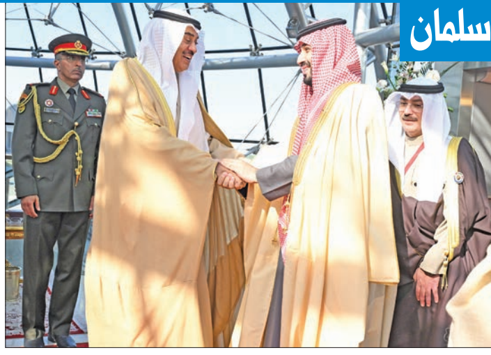
الوفد السعودي بقيادة محمد بن سلمان