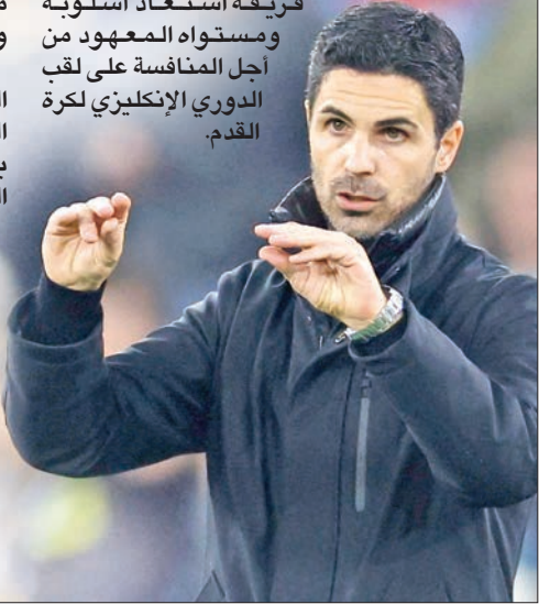
(د ب أ)

قال الإسباني ميكيل أرتيتا، المدير الفني لفريق أرسنال، إن فريقه حقق الفوز بطريقة «جنونية» على حساب وست هام 2-5، لكنه أكد ثقته بأن فريقه استعاد أسلوبه ومستواه المعهود من أجل المنافسة على لقب الدوري الإنكليزي لكرة القدم.