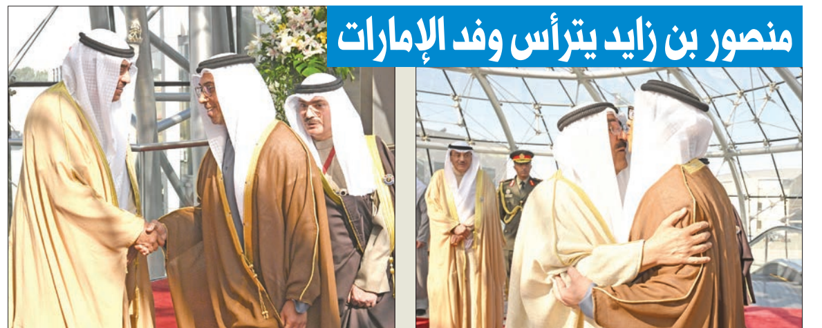
منصور بن زايد يترأس وفد الإمارات