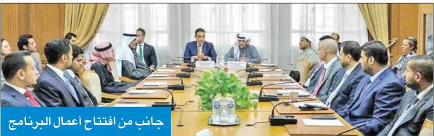
جانب من افتتاح أعمال البرنامج

برنامج تعريفى لدبلوماسيين كويتيين حول قطاعات الجامعة