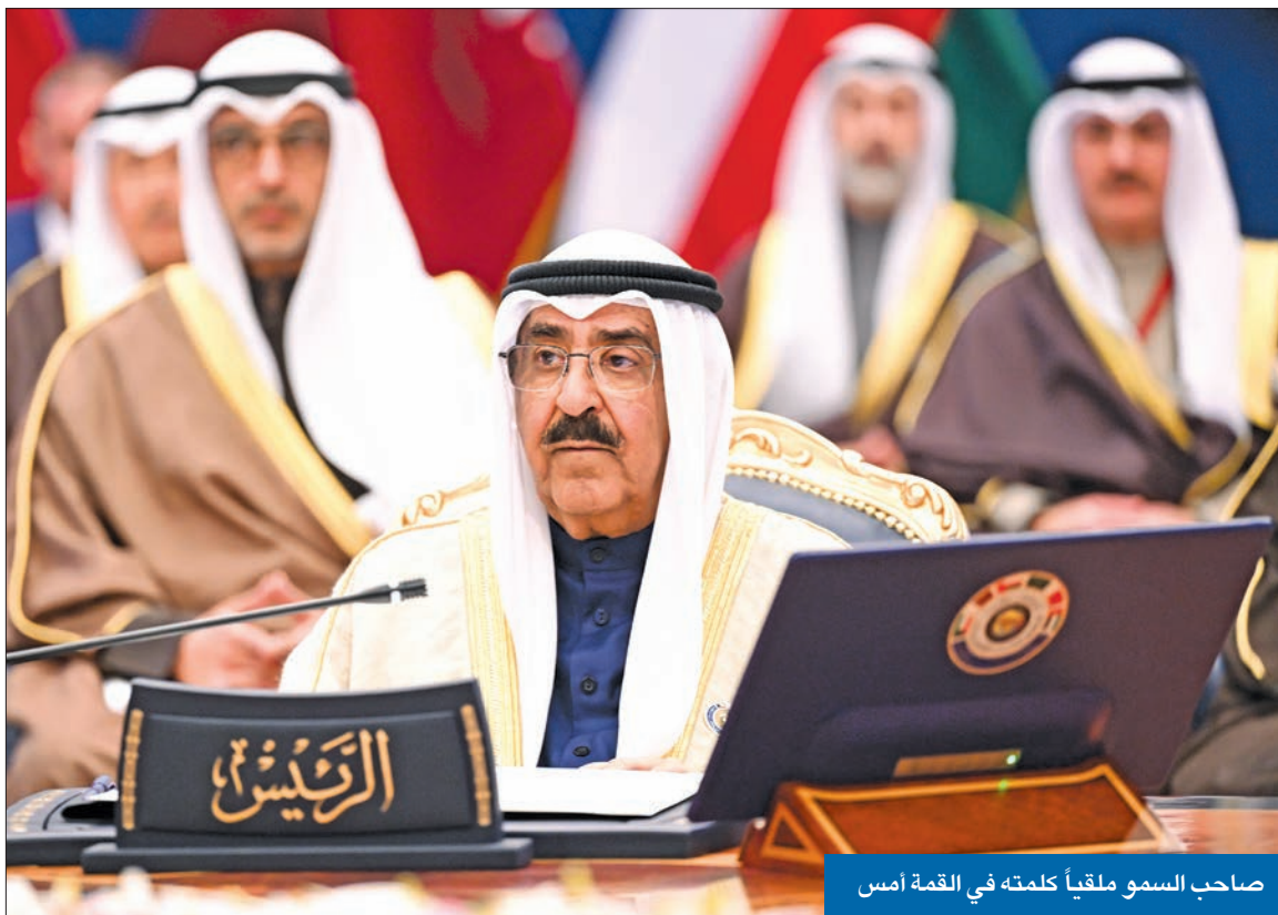
صاحب السمو ملقياً كلمته في القمة أمس