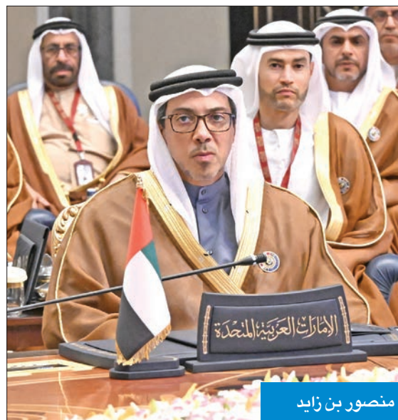
منصور بن زايد

وفيما يلي نص كلمة سمو أمير البلاد: «بسم الله الرحمن الرحيم الحمد لله رب العالمين، والصلاة والسلام على أشرف المرسلين سيدنا محمد، وعلى آله وصحبه أجمعين.