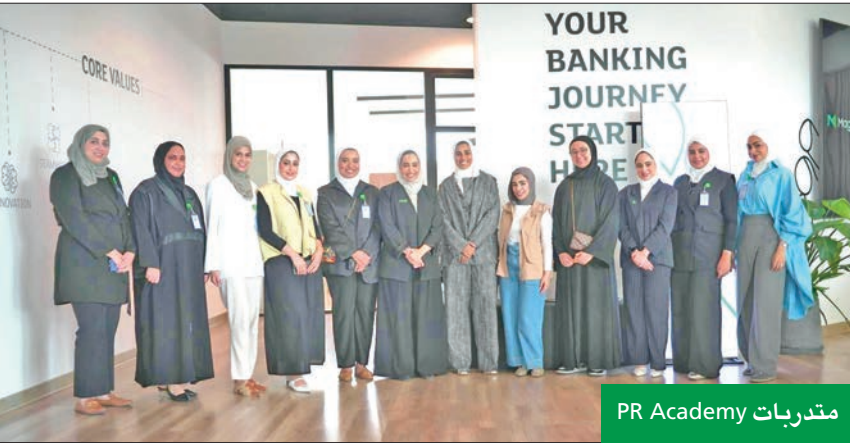
متدربات PR Academy

واختتم البنك برنامج تدريب الطلبة الميداني التابع للهيئة العامة للقوى العاملة، ضمن جهود «بيتك» المستمرة في دعم الأنشطة المتعلقة بتنمية وتطوير العنصر الوطني ودعم قدرات الشباب الكويتي، إذ يأتي البرنامج بشكل سنوي ما يؤكد استدامة برامجه لتوطين وتطوير العنصر البشري الكويتي من شباب الخريجين ومن أصحاب الخبرات، والارتقاء بقدراتهم الوظيفية، وتعزيز دورهم في كل الأنشطة والخدمات والبرامج.