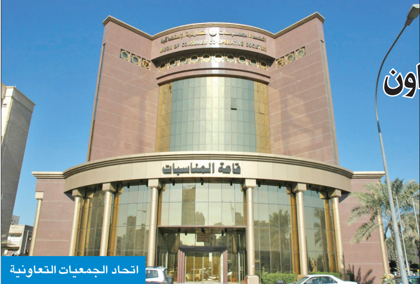
اتحاد الجمعيات التعاونية

مدة الاتفاقية، فسُرِدَ إلى بيت الزكاة.» يُذكر أن الاتفاقية تأتي تنفيذاً لتوجيهات مجلس الوزراء الهادفة إلى توطيد العمل الخيري، وتوجيه ريعه داخلياً، لخدمة شرائح عدة ومتنوعة في المجتمع.