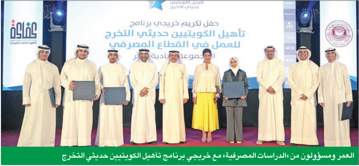
العمر ومسؤولون من «الدراسات المصرفية» مع خريجي برنامج تأهيل الكويتيين حديثي التخرج