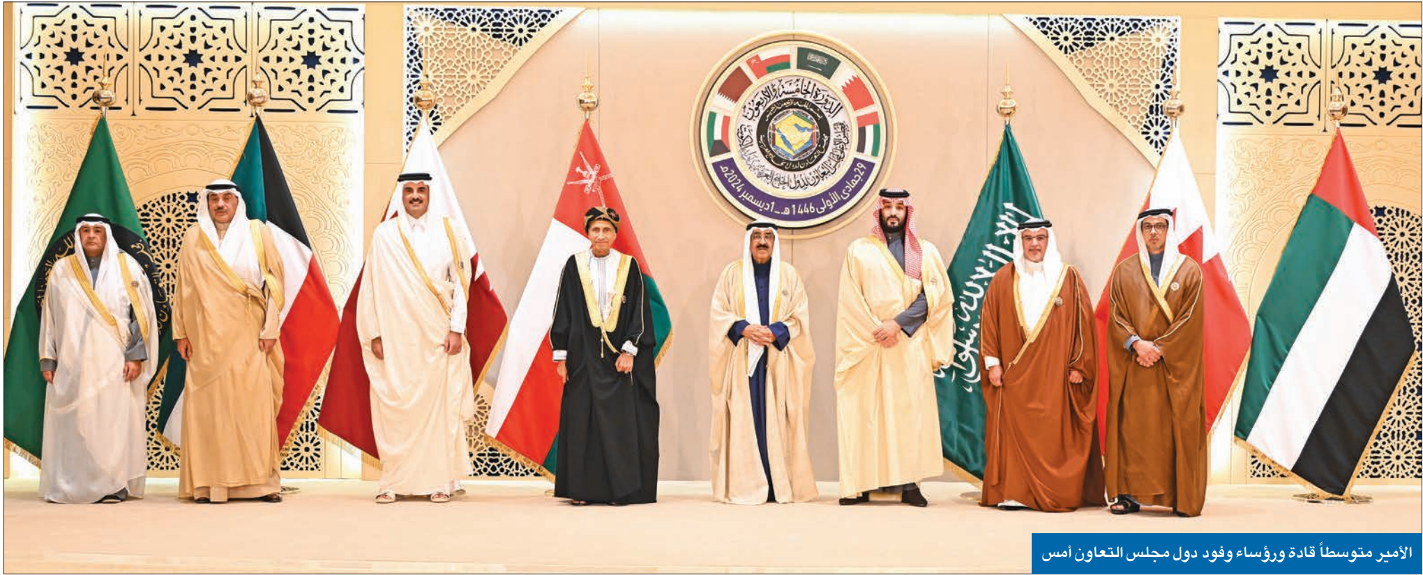
الأمير متوسطاً قادة ورؤساء وفود دول مجلس التعاون أمس

سموه في افتتاح القمة الـ 45 لمجلس التعاون: هدفنا الازدهار في محيط يعمه الاستقرار