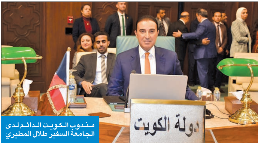
مندوب الكويت الدائم لدى الجامعة السفير طلال المطيري

وممثلي الدول الأجنبية والمنظمات العربية والدولية، وممثلي الأزهر الشريف والكنيسة القبطية.