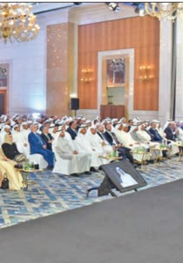
اللقاء السنوي للموظفين

بالموظف، أوضح العمر أنه تم تحسين مزايا تغطية التأمين الصحي للموظفين وعائلاتهم، فيما قام «فريق السعادة» بتنظيم أنشطة رياضية واجتماعية وترفيهية خاصة بالموظفين. ولفت إلى أن «بيتك» يواصل جهوده في تقدير الموظفين المميزين، مبيناً أن عدد المكرمين خلال 2024 بلغ 180 موظفاً حتى الآن ضمن برنامج «قدها» الحائز تقديراً عالمياً من «براندون هول»، مما يدل على تقدير البنك لجهود موظفيه بافضل الممارسات العالمية. وعلى صعيد متصل، تضع الموارد البشرية والتحول للمجموعة دائماً عائلته الموظف أولوية، حيث تم تكريم المتفوقين من أبناء الموظفين في الثانوية العامة، وأيضاً جرى تنظيم فعاليات خاصة لأبنائهم مثل مبادرة «العربية لغتي»، وذلك للعام الثالث على التوالي، بمشاركة نحو 140 طفلاً من أبناء الموظفين.