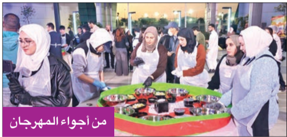
من أجواء المهرجان

والطلاب في جامعة الخليج للعلوم والتكنولوجيا، جذب العديد من الضيوف والمطاعم الكورية، لافتة إلى أن «هذا المهرجان السابع له أهمية