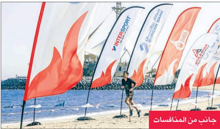
جانب من المنافسات