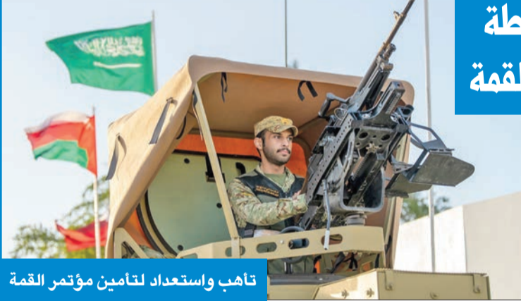
تاهب واستعداد لتأمين مؤتمر القمة

قال قائد قوة الواجب (خليج) التابعة للحرس الوطني، العميد سعد مبارك، إن القوة أتمت كل الاستعدادات لتأمين وفود القمة الـ 45 للمجلس الأعلى لمجلس التعاون لدول الخليج العربية التي ستعقد اليوم. وأضاف مبارك بنصريح لـ «كونا» أن قوة الواجب قد أتمت وضع خطة محكمة لتأمين مجمع الفنادق وتوفير الحماية لكل الوفود المشاركة في القمة، والحرس على الظهور بصورة مشرفة أمام الأشقاء من الدول الخليجية في بلدهم الثاني. من جانبه، قال مساعد «خليج» التابعة للحرس، العقيد الركن مطر بدر، بنصريح مماثل، إن الحرس يقوم بغرض السيطرة على المواقع المسؤول عنها في محيط الفنادق من خلال تسهيل حركة دخول وخروج الوفود، ووضع أجهزة التفتيش للأفراد والأمتعة والآليات. وأكد التزام قوة الواجب وجاهزيتها بتأمين المنطقة طوال الأيام المصاحبة لاستضافة