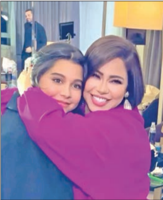
شيرين وابنتها في كواليس الحفل

ويعد هذا الحفل الأول للنجمة المصرية في المنطقة، بعد طرح ألبومها الجديد عبر مختلف المنصات، ورافق شيرين خلال الحفل فريق عمل البومها الأخير، بما في ذلك الموزع توما، والشاعر عزيز الشافعي، والملحن مدين، والشاعر تامر حسين، والشاعر بهاء الدين محمد، وقدمت شيرين خلال الأمسية مجموعة من أغانيها الشهيرة التي حققت نجاحات كبيرة، ضمن فعالية سباق ROAD RUSH، وبدأت شيرين الحفل بأغنياتها المفضلة، مثل حبيبي نسا، صبري