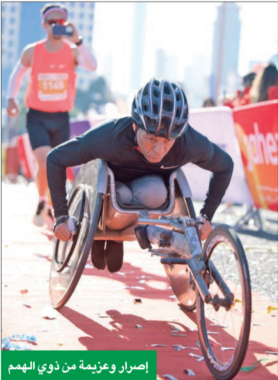
إصرار وعزيمة من ذوي الهمم