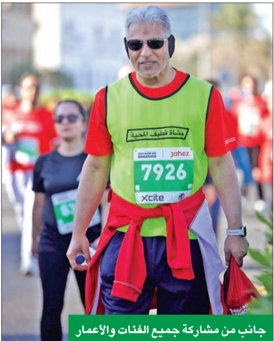
جانب من مشاركة جميع الفئات والأعمار