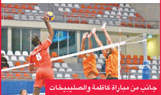
جانب من مباراة كاظمة والصليبيخات

حقق فريق كاظمة للكرة الطائرة فوزاً مستحقاً على الصليبيخات بنتيجة 3 - صفر في المباراة التي جمعت الفريقين أمس الأول على صالة الاتحاد بمجمع الشيخ سعد عبدالله الرياضي، في ختام الجولة الخامسة من بطولة الاتحاد للعبة، والتي شهدت أيضاً فوز الشباب على اليرموك بنفس النتيجة 3 - 0.