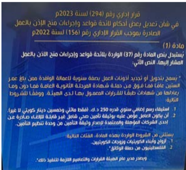
صورة ضوئية للقرار رقم (294)

إلى ذلك، قضى القرار أيضاً باستبدال نص المادة 14 من القرار الوزاري رقم 9 / 2016 بشأن ضوابط عمل أصحاب