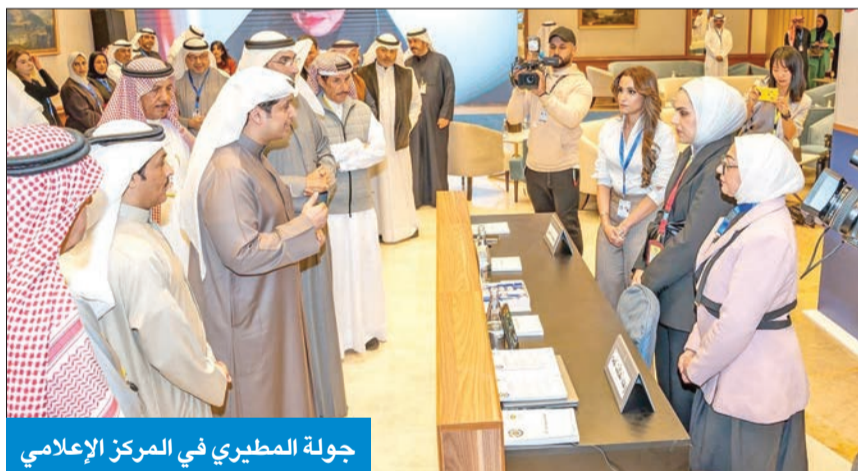
جولة المطيري في المركز الإعلامي