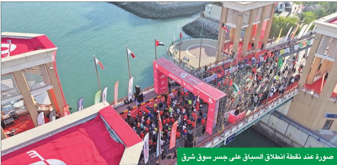
صورة عند نقطة انطلاق السباق على جسر سوق شرق