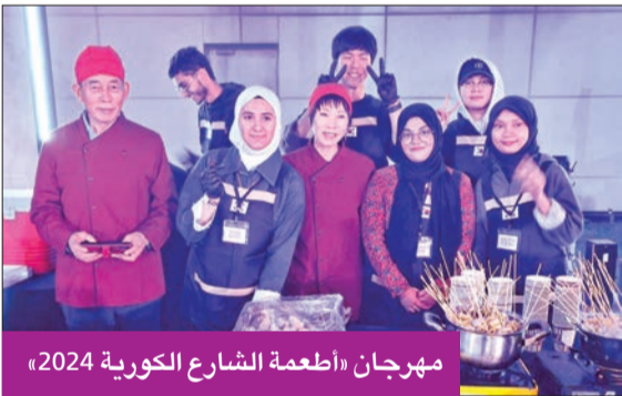
مهرجان «أطعمة الشارع الكورية 2024»

للفنون (لابا)، من خلال ورشة التدريب الإعلامي، إلى تطوير مهارات التواصل الجماهيري، وإلقاء الخطابات لدى المتدربين.