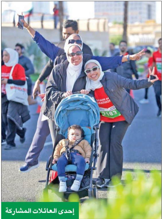
إحدى العائلات المشاركة