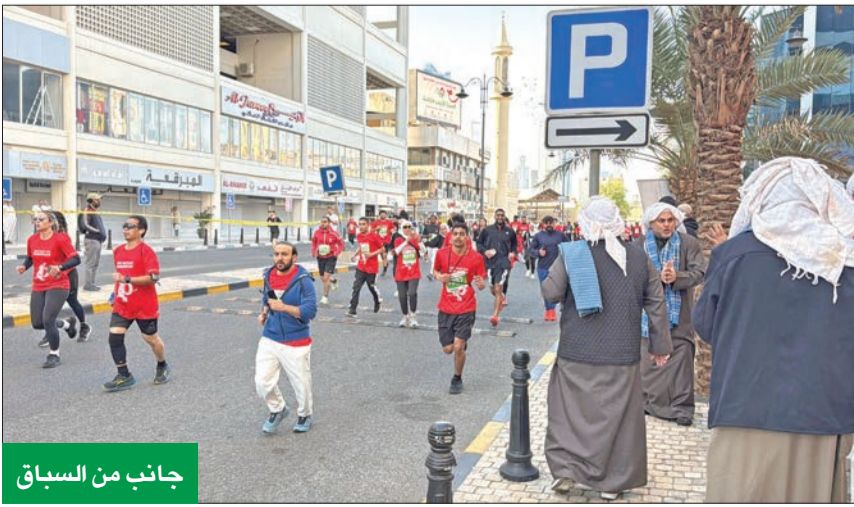
جانب من السباق