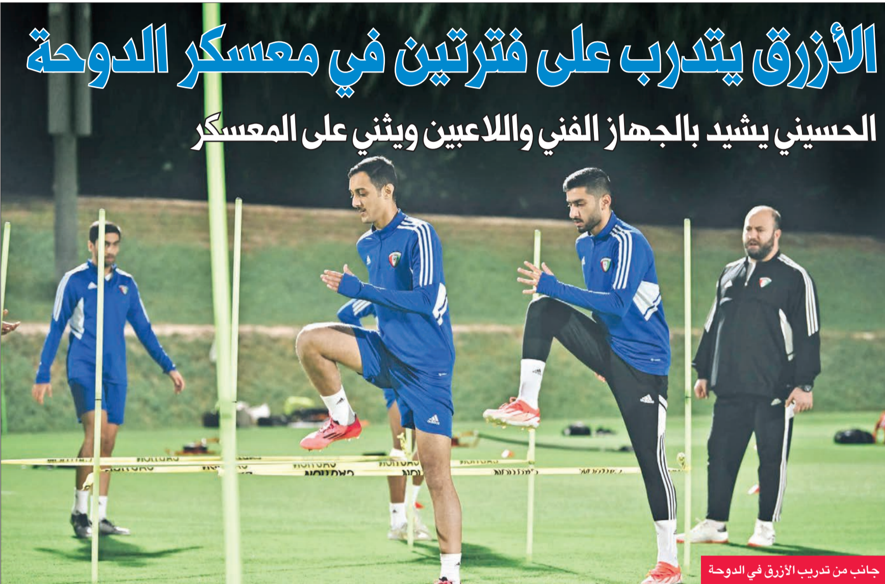
جانب من تدريب الأزرق في الدوحة

عندما يضع مترجم المنتخب مدربه في موقف لا يحسد عليه أمام وسائل الإعلام بسبب ترجمته الخاطئة وفهمه المرتبك للأسئلة الموجهة للمدرب في المؤتمرات الصحافية وهو ما حصل بعد نهاية مباراة منتخبنا الوطني الأخيرة أمام شقيقه الأردني ضمن تصفيات كأس العالم 2026 فهذا يضعنا أمام سؤال مهم حول كفاءة هذا المترجم وقدرته على إيصال المعلومات بالشكل الصحيح والمطلوب للاعبين خلال التدريبات والمحاضرات، وما إذا كان هو أصلاً قد تمكن من فهمها أم لا!