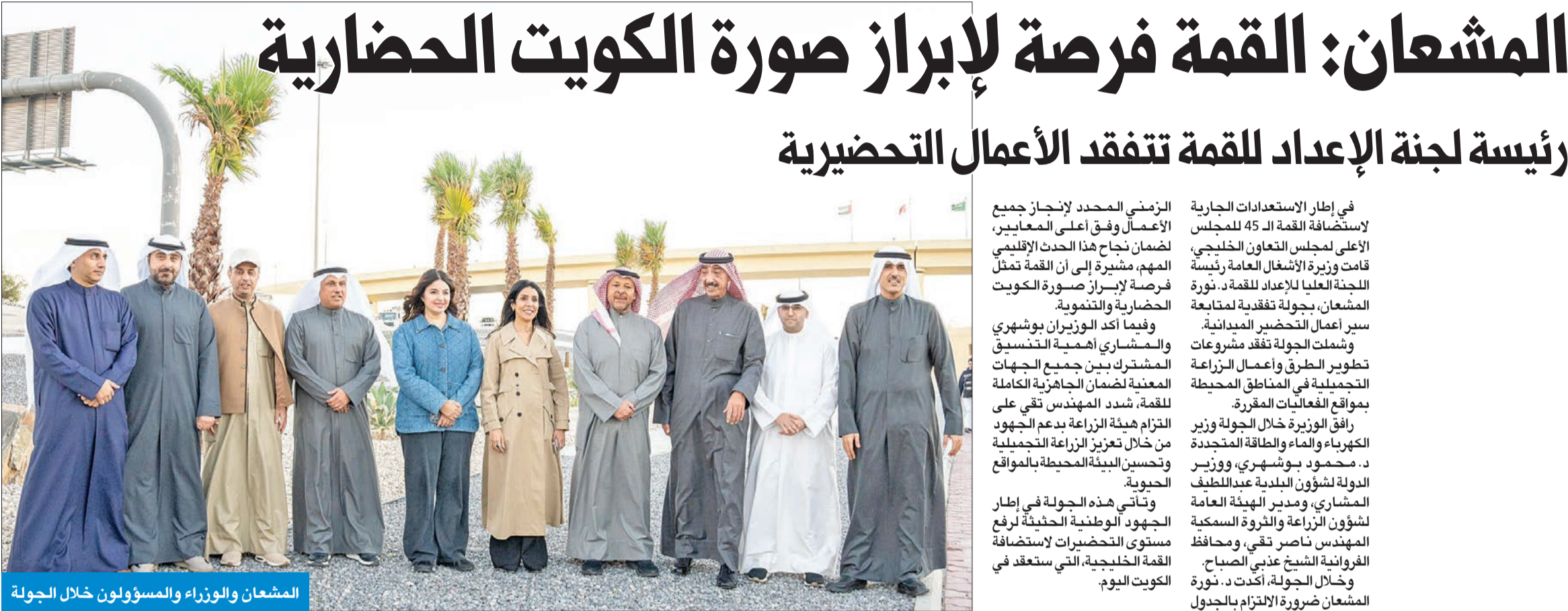
المشعان والوزراء والمسؤولون خلال الجولة