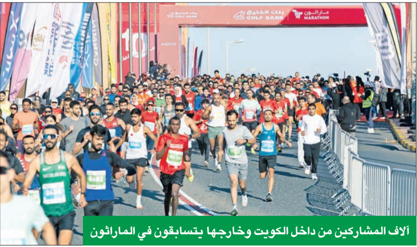
آلاف المشاركين من داخل الكويت وخارجها يتسابقون في الماراثون