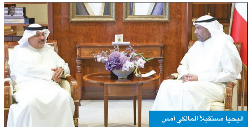
اليحيا مستقبلا المالكي امس

التقى وزير الخارجية عبدالله الجحيا، في ديوان الوزارة امس، سفير مملكة البحرين لدى الكويت صلاح المالكي، حيث تم خلال اللقاء استعراض العلاقات الوثيقة التي تربط البلدين الشقيقين.