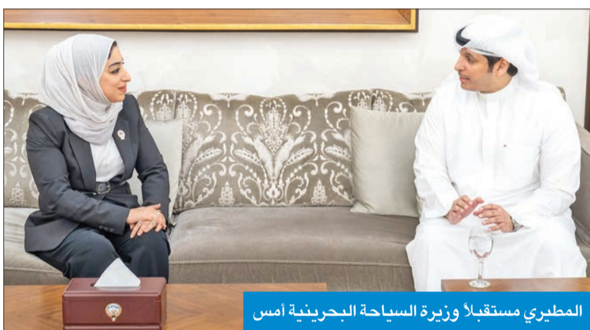
المطيري مستقبلا وزيرة السياحة البحرينية امس

أكد وزير الإعلام والثقافة عبدالرحمن المطيري وجود تعاون دائم ومستمر مع وزارة السياحة البحرينية لتطوير قطاع السياحة الحيوي والمهم في البلدين خدمة لمصالحهما. وقال المطيري، في تصريح له امس، عقب استقباله وزيرة السياحة البحرينية، رئيسة مجلس إدارة هيئة البحرين للسياحة والمعارض، فاطمة الصبرفي، إن العلاقات الكويتية البحرينية التاريخية راسخة ومستمرة في ظل قيادتي البلدين، مضيفا «إنها علاقات تكاملية وأخوية تفيض بالمحبة والأخوة والتعاون والعمل المشترك بين القيادتين الحكيمتين والشعبين الشقيقين».