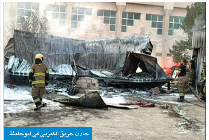
حادث حريق الكيربي في أبو حليفة

على حريق أخشاب وكيربي في منطقة أبو حليفة، مشيرة إلى أن رجال الإطفاء كافحوا الحريق وسيطروا عليه دون وقوع إصابات تذكر.