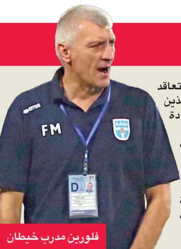
فلورين مدرب خيطان

إلى ذلك، يختم خيطان تدريباته اليوم استعدادا لمواجهة الفحيحيل، المقرر لها غدا الجمعة، في الجولة الأولى من منافسات دوري زين الممتاز.