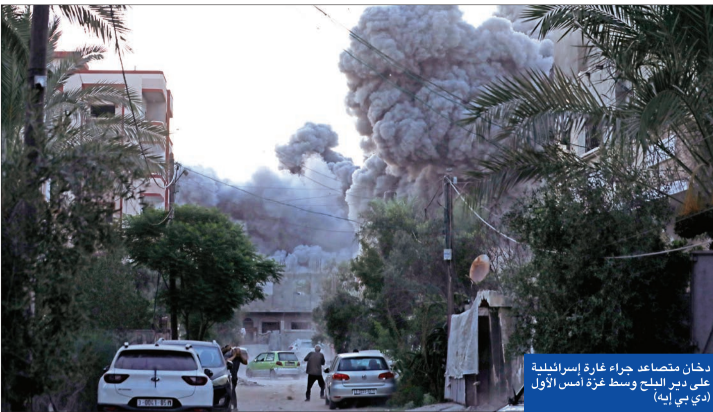
دخان متصاعد جراء غارة إسرائيلية على دير البلح وسط غزة أمس الأول

مصر تحت إيران على ضبط النفس وتطالب أوروبا بمعالجة أسباب التصعيد الحقيقية