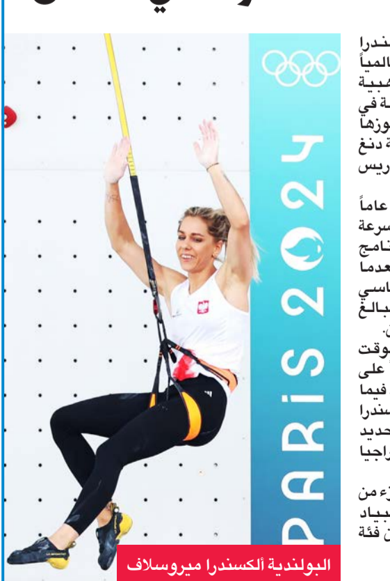
البولندية الكسندرا ميروسلاف

أحرزت إسبانيا الذهبية الأولى لسباق ماراثون المشي للمتابع في باريس. وقطع الغارو مارتين وماريا بيريس مسافة السباق الجديد في الألعاب الأولمبية والبالغة مسافته 42.195 كلم على غرار سباق الماراثون، بزمن ساعتين و50 دقيقة و31 ثانية متقدمين على الاكوادوريين براين دانيال بينتادو وغليندا موربخون (2:51:22 ساعة) والستراليين ريديان كولي وجيمينا مونتاغ (2:51:38 ساعة). ونظم السباق للمرة الأولى في تاريخ الألعاب الأولمبية ليحل محل سباق 50 كلم للرجال. يتقاسم عداء وعداءة أربع مراحل خلاله. الأولى لمسافة 11.45 كلم ومرحلتان للمسافة 10 كلم، والأخيرة 10.745 كلم. وسيطر العداءان الإسبانيان على السباق منذ البداية بفضل المستوى المتجانس لمارتين وبيريس وتقنياتها الرائعة.