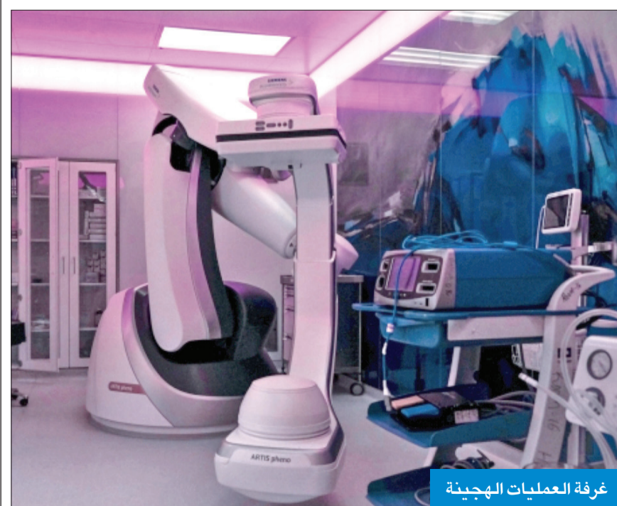
غرفة العمليات الهجينة

افتتح مستشفى جابر غرفة العمليات الهجينة الثانية، والمجهزة بأحدث الأجهزة للأشعة التداخلية، ما يسمح بإجراء العمليات الجراحية المتعددة، والتدخلات باستخدام الأشعة في أن واحد.