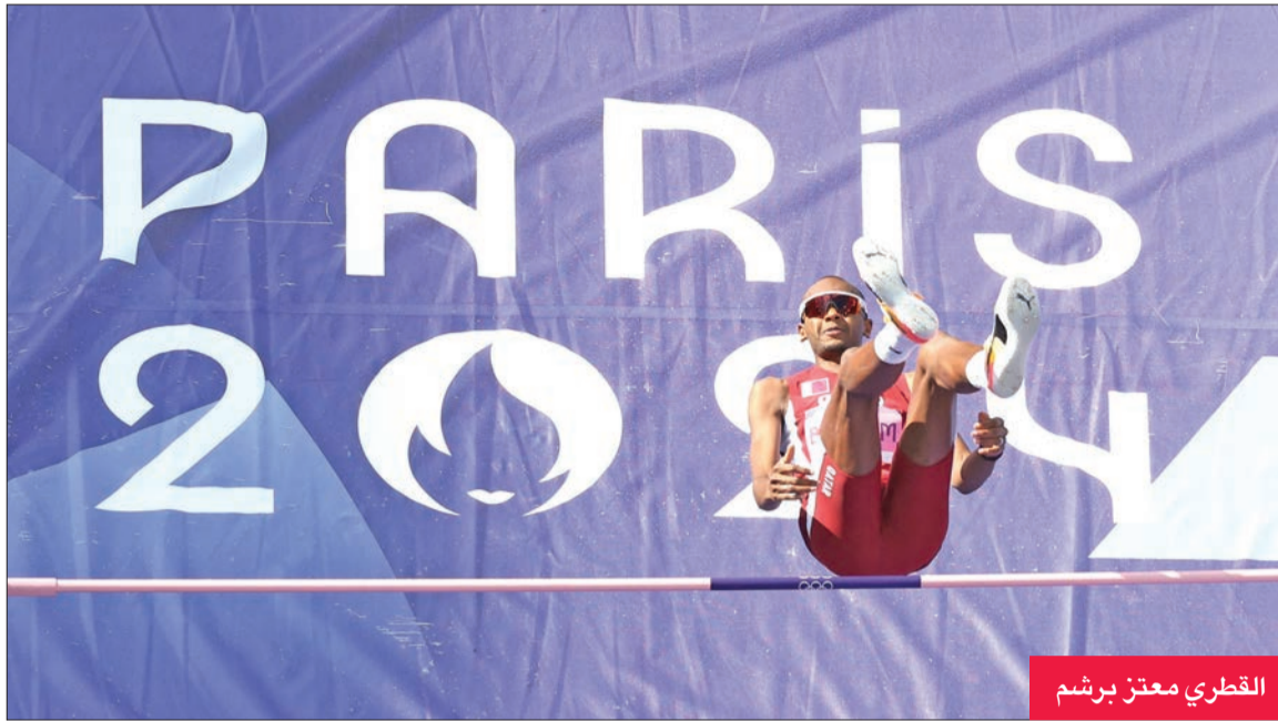
القطري معتز برشم

تأهل الإيطالي جيانماركو تامبيري، الفائز بذهبية أولمبياد طوكيو 2020، والقطري معتز برشم، أمس الأربعاء، إلى نهائي مسابقة الوثب العالي في أولمبياد باريس.