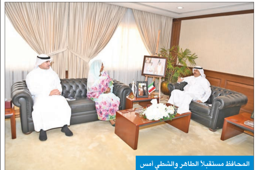
المحافظ مستقبلاً الطاهر والشطي أمس

استقبل محافظ حولي علي الأصغر، في مكتبه بديوان المحافظة، صباح أمس، ممثلة الأمين العام للأمم المتحدة، المنسقة المقيمة لدى الكويت، السفيرة غادة الطاهر، ورئيس المكتب ناصر الشطي.