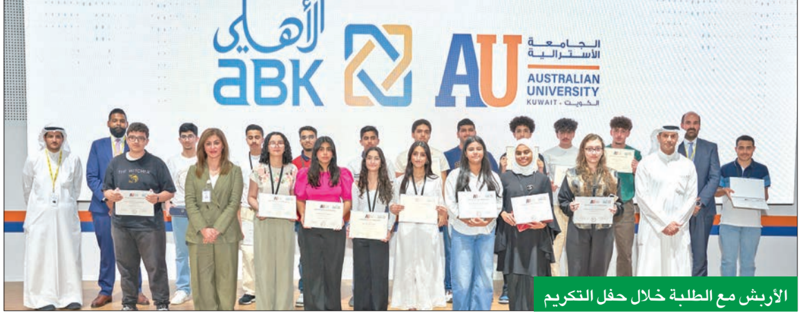
الأربيش مع الطلبة خلال حفل التكريم

وأقيم البرنامج على مدار أسبوعين بمقر الجامعة الأسترالية في الكويت بمشاركة واسعة من أبناء الموظفين وأقاربهم، لمنحهم الفرصة للتعرف على أبرز التطورات في عالم البرمجة والتحول الرقمي، والذي يشكل أهمية كبيرة في جميع القطاعات اليوم. وقد أقيمت على هامشه العديد من ورش العمل، ما ساهم في حصول المدربين على مجموعة واسعة من المعلومات الضرورية حول التطور التكنولوجي بالقطاع