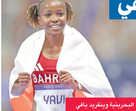
البحرينية وينفريد يافي

طوكيو قبل ثلاث أعوام الأوغندية بيروت شيموناتي. وقالت يافي «هذا الأمر أشبه بحلم تحقق. إنه أمر خاص. إنها (الميدالية الذهبية) تعني الكثير بالنسبة لي وللبلاد أيضاً، وهي الذهبية الثالثة للبحرين في تاريخ مشاركاتها في الألعاب الأولمبية والثانية في سباق 3 آلاف م مواع بعد روث جيببت في ريو دي جانيرو عام 2016، بعدما افتتحت مريم جمال الرصيد الذهبي للدولة الخليجية في الأولمبياد في لندن 2012 عندما ظفرت بالمركز الأول في سباق 1500م.