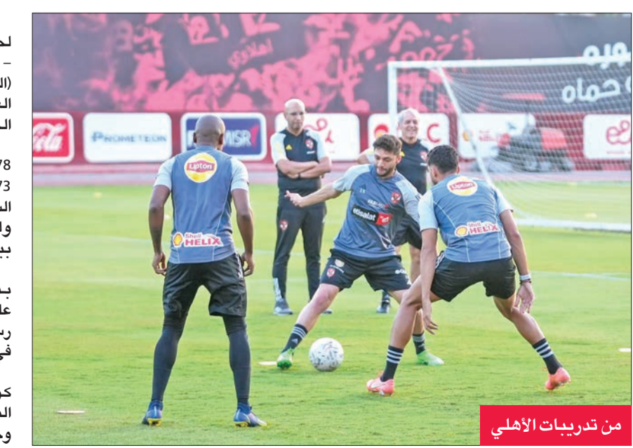
من تدريبات الأهلي

يحتاج فريق الأهلي إلى نقطة واحدة فقط لحسم لقب الدوري الممتاز للموسم الحالي 2023 - 2024، عندما يواجه في التاسعة مساء اليوم (الخميس)، مضيفه فريق سموحة على ملعب برج العرب بمدينة الإسكندرية، في اللقاء المؤجل من الجولة 24 من عمر المسابقة المحلية. ويحتل الأهلي حالياً صدارة الترتيب برصيد 78 نقطة، بينما يمتلك فريق بيراميدز «الوصيف» 73 نقطة، وأقصى عدد من النقاط يصل له الفريق السماوي هو 78 في حال الفوز بأخر مواجهتين، ولكن الأحمر يتفوق في المواجهات المباشرة وفي مباراة أخرى مؤجلة من الجولة الثالثة والعشرين، يخوض فريق الزمالك، صاحب المركز الرابع برصيد 52 نقطة، مواجهة صعبة على الفريق السكندري أو التعادل للظفر باللقب رسمياً للموسم الثاني على التوالي ورقم 44 في تاريخه. وحت الجهاز الفني للأهلي، بقيادة مارسيل كولر، اللاعبين على بذل قصارى جهدهم في المباراة، والسعي لتحقيق الفوز وليس التعادل وحصد اللقب، مؤكداً أن فريق سموحة خصم قوي