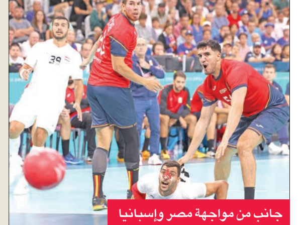
جانب من مواجهة مصر وإسبانيا

فرطت مصر في تأهلها للدور نصف النهائي لمسابقة كرة اليد في دورة الألعاب الأولمبية للمرة الثانية تواليًا عندما خسرت أمام إسبانيا 28-29 بعد التمديد (الوقت الأصلي 25-25) الأربعاء في ربع نهائي نسخة باريس. ووقف المشاور الرائع للفرعاعة في ربع النهائي