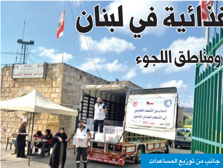
جانب من توزيع المساعدات

وبدأت «الهلل الأحمر»، أمس، المرحلة الجديدة من توزيع المساعدات التي تقدمها للبنانيين واللاجئين السوريين والفلسطينيين في لبنان. وإلى جانب مساهماتها الإغاثية، تستمر «الهلل الأحمر» في مشروعها الدائم وهو «مشروع الرغيف»، المعمول به منذ سنوات، والذي تستفيد منه آلاف الأسر اللبنانية، إلى جانب اللاجئين السوريين والفلسطينيين.