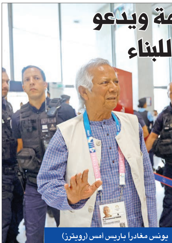
يونس مغداراً باريس أمس

وكان يونس، المعروف بإخراج ملايين الأشخاص من الفقر، بفضل مصرفه الرائد للتمويل الأصغر، على خلاف مع حسينة التي اتهمت به «انتهاك دم الفقراء». وقد غادر إلى الخارج في مطلع 2024، بعد الحكم عليه بالسجن 6 أشهر، وأطلق سراحه بكفالة في انتظار الاستئناف، وأعلن حماميه، أمس، تبرئته في الاستئناف.