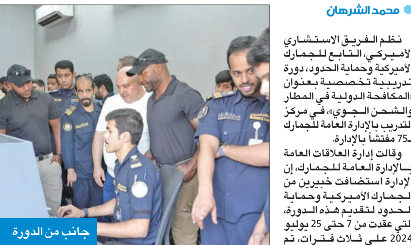
جانب من الدورة

نظم الفريق الاستشاري الأميركي، التابع للجمارك الأميركية وحماية الحدود، دورة تدريبية تخصصية بعنوان «مكافحة الدولية في المطار والشحن الجوي»، في مركز التدريب بالإدارة العامة للجمارك لـ 75 مفتشاً بالإدارة. وقالت إدارة العلاقات العامة بالإدارة العامة للجمارك، إن الإدارة استضافت خبيرين من الجمارك الأميركية وحماية الحدود لتقديم هذه الدورة، التي عقدت من 7 حتى 25 يوليو 2024 على ثلاث فترات، تم خلالها تدريب ثلاث مجموعات على التدريب النظري والعملية. وأكدت الإدارة العامة للجمارك أهمية مثل هذه الدورات، لتبادل الخبرات ومشاركة أهم طرق التفتيش بين الجانبين الأميركي والكويتي، حيث كان الهدف من