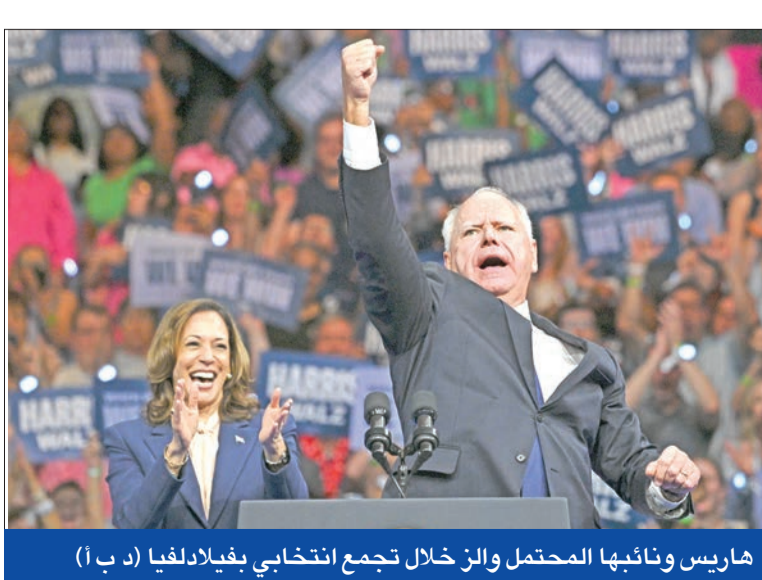
هاريس ونائبها المحتمل والز خلال تجمع انتخابي في بنغلادش