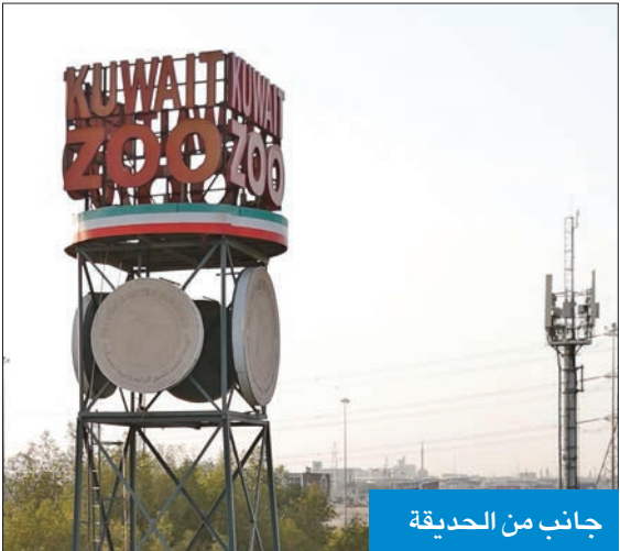
جانب من الحديقة

الصغيرة، ويستغله أحد المستثمرين، كبديل صغير مشروع حديد لحديقة الحيوان إن وجد، مبنية أنه لا توجد أي دراسة لإنشاء حديقة جديدة، أو حديقة حيوان بديلة لحديقة العمرية.