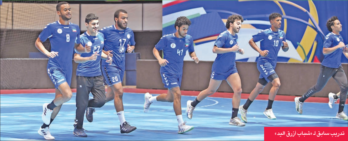
تدريب سابق لـ «شباب أزرق اليد»

في 12:00 ظهرأ الصين تايبيه مع كوريا الجنوبية وفي 2:45 دقيقة بعد الظهر قطر مع اليابان «المجموعة الرابعة» وفي 3:30 هونغ كونغ مع البحرين «المجموعة الأولى» وفي 7:00 مساء الهند مع عمان «المجموعة الثالثة».