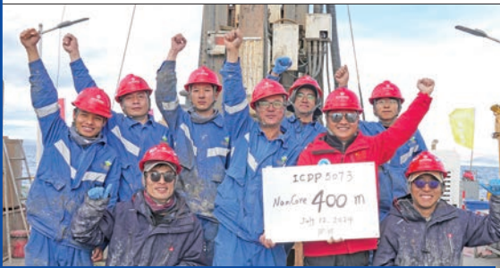
بعثة علمية صينية تحتفل بجمع عينات من قلب بحيرة نام كو في شيتسانغ أمس الأول

وقدمت وزارة الخارجية الصينية احتجاجاً لواشنطن، أوضحت فيه أن شيتسانغ جزء لا يتجزأ من الصين منذ العصور القديمة، مشيرة إلى أنها اليوم تنعم باستقرار وتناغم على الصعيد الاجتماعي بجانب تمتعها بآداء اقتصادي سليم، فضلاً عن حماية رفاة سكانها.