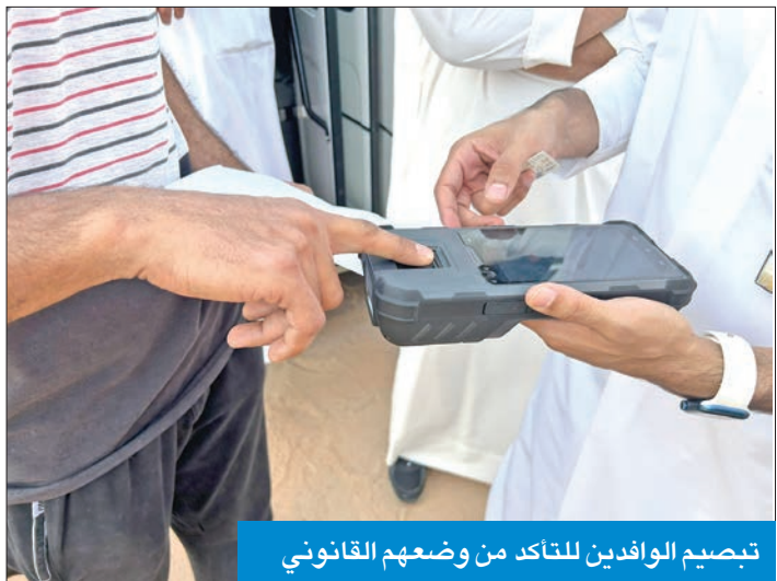
تبصيم الوافدين للتأكد من وضعهم القانوني