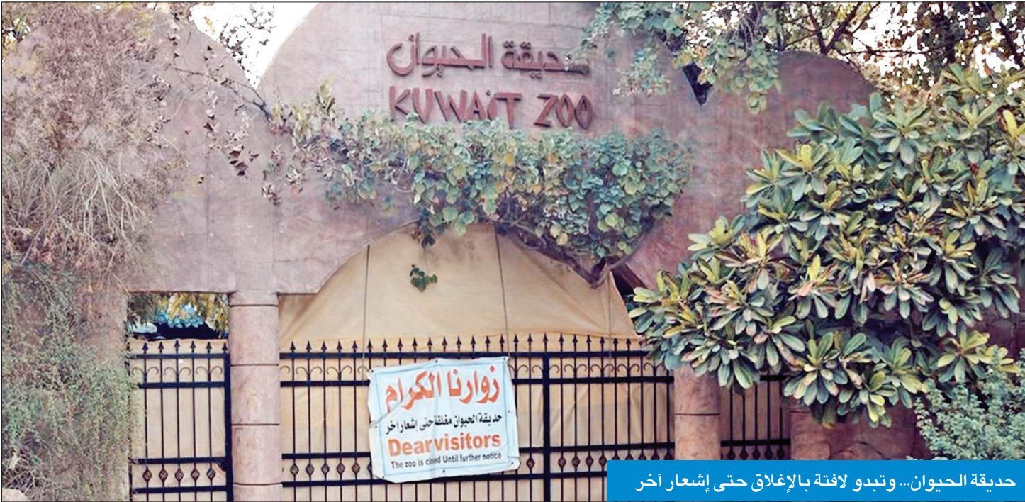
حديقة الحيوان... وتبدو لافتة بالإغلاق حتى إشعار آخر