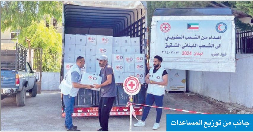
جانب من توزيع المساعدات

واصلت جمعية الهلال الأحمر الكويتية، أمس الأول، توزيع المساعدات لأبناء الجنوب اللبناني المتضررين بسبب المواجهات العسكرية مع الاحتلال الإسرائيلي منذ أكتوبر الماضي.