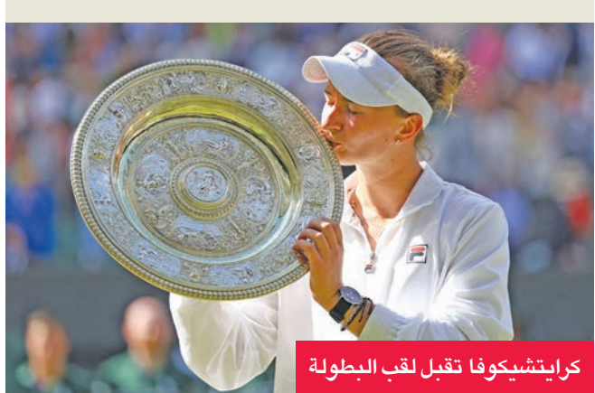
كرايتشيكوفا تقبل لقب البطولة

أحرزت التشيكية باربورا كرايتشيكوفا لقب بطولة ويمبلدون، ثالثة البطولات الأربع الكبرى في كرة المضرب، بفوزها أمس، على الإيطالية جازمين باولينجي، محرزة ثاني ألقابها الكبرى. وحسّمت كرايتشيكوفا، المصنفة 32 عالمياً، المباراة أمام باولينجي السابعة 2-6، 6-2، 4-6، لتضيف لقب البطولة العشبية إلى رولان غاروس 2021. وسترتقي المصنفة ثانية عالمياً سابقاً إلى المركز العاشر بعد إنجازها في نادي عموم إنكلترا. في المقابل، خسرت باولينجي (28 عاماً) ثاني نهائي كبير توالياً، بعد رولان غاروس حيث سقطت بنتيجة قاسية أمام الأولى عالمياً البولندية