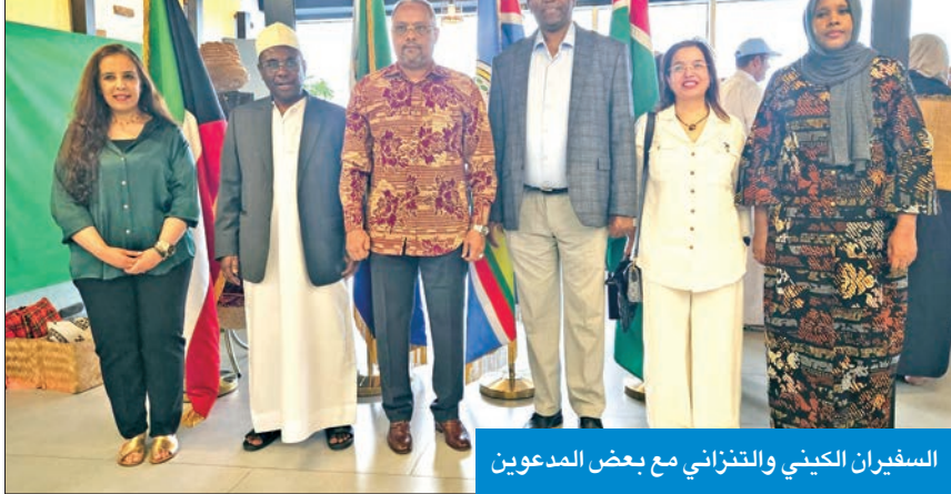
السفيران الكيني والتنزاني مع بعض المدعوين

برفح، كما انتشل الدفاع المدني جثث عشرات الضحايا من مناطق الشجاعية وأحياء مدينة غزة التي تشهد اشتباكات ضارية بين عناصر حركتي «حماس» والقوات الإسرائيلية المتوغلة بها. وعقب تداول الأنباء عن الضربة التي استكتمها العديد من الدول العربية والإسلامية، ندبت عائلات الإسرائيليين المحتجزين لدى «حماس» بطريقة تعامل تنتهاها مع محادثات وقف إطلاق النار بعد أن اتهم مسؤولون مشاركون بالمفاوضات رئيس الوزراء بعرقلتها عبر طرح مطالب جديدة تتضمن إيجاد آلية تنفيذ لمنع مسلحي الحركة الفلسطينية من العودة إلى شمال غزة. وفي وقت أرجع مراقبون ارتكاب المذبحة إلى رغبة تنبهاه في تفخيخ اتفاق الهدنة، الذي يضغط بايدن لإبرامه، لأنه قد يشكل تهديداً على مستقبله، صرح مصدر رفيع المستوى بأن مصر أبلغت الأطراف المعنية بخطورة التصعيد الإسرائيلي واستهداف المدنيين، محذرة من أن مجزرة المواسي ستضع تعقيدات على سبل التوصل إلى اتفاق. وبيّنا أكد الرئيس المصري عبدالفتاح السيسي موقفه القائل بشأن حتمية مجزرة المواسي بموازاة تصعيد عسكري إسرائيلي في عموم مناطق القطاع المنكوب، إذ قُتل 17 شخصاً في قصف استهدفهم خلال أداء الصلاة بجوار مسجد مدمر في مخيم الشاطئ