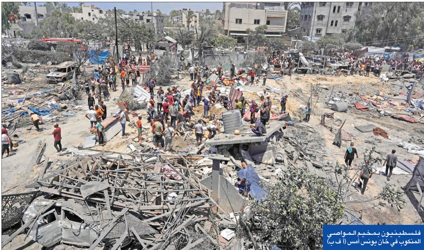
فلسطينيون بمخيم المawasi المنكوب في خان يونس أمس

«حماس» تكذب الاحتلال... والرئاسة تحمّل واشنطن المسؤولية... وننتياهو يفنخ المفاوضات بمطالب جديدة