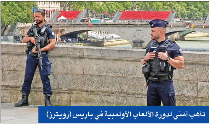
تأهب أمني لدورة الألعاب الأولمبية في باريس

وفيما أكد النائب الأوروبي، الأمين العام للحزب الاشتراكي، بيير جوفيه، أن أوليفييه فور هو الوحيد القادر على توسيع الجبهة الشعبية الجديدة،