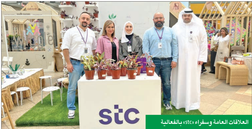
العلاقات العامة وسفراء «stc» بالغالية

ومستدام، التزامنا بالتنمية المستدامة ركيزة أساسية في قيمنا المؤسسية، حيث نؤمن بأننا من خلال الجهود الجماعية يمكننا تحقيق تأثير كبير لمجتمعنا. وتحفيز التغيير الدائم للأجيال القادمة» من جهتها، قالت الرئيسة التنفيذية للمطوع، «يسعدنا مشاركة stc كراع رئيسي لسوق بلوم، حيث يتوافق التزامهم بالاستدامة والمشاركة المجتمعية تماماً مع مهمتنا المتمثلة في تعزيز نمط حياة يعطي الأولوية للوعي البيئي. تجسد هذه الشراكة قوة التعاون بين قطاع الشركات والمبادرات المجتمعية لإحداث فرق حقيقي» وأكدت أهمية هذا النوع من الفعاليات والنشاطات التي تشجع المبادرات في مجالات الإنذامة المختلفة على تطوير مشاريعهم، وزيادة وعي المستهلك الكويتي بتوفر المواد الاستهلاكية المستدامة في الكويت.