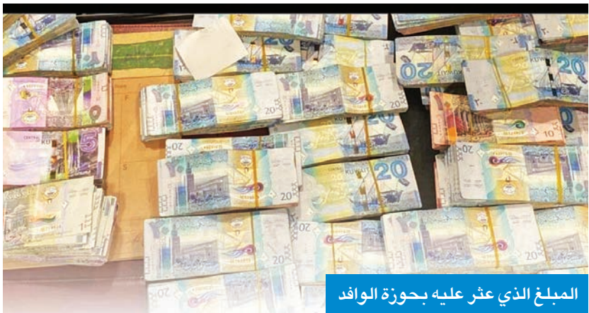
المبلغ الذي عثر عليه بحوزة الوافد

وأضاف المصدر أن أفراد الدورية تمكنوا من ضبطه والسيطرة عليه، وبتفتيش الكيس الذي بحوزته، عُثر على مبلغ مالي كبير قُتل الوافد في تبرير وجوده معه ومصدره، مشيراً إلى أن رجال الأمن أحوالوا الوافد إلى جهات الاختصاص، لتحديد هوية المبلغ ومصدره.