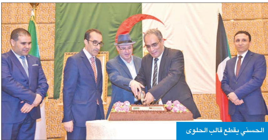
الحسني يقطع قالب الحلوى

أقامت السفارة الجزائرية لدى البلاد حفل استقبال بمناسبة عيد استقلال الجزائر، بمشاركة أعضاء السفارة والسفير المعين لدى الكويت عبدالقادر الحسني، الذي سيقدم نسخة من أوراق اعتماده لوزير الخارجية عبدالله الجببا صباح اليوم. وأكدت السفارة، في بيان، «أن العلاقات الكويتية - الجزائرية تاريخية وعميقة»، لافتة إلى «الدور الكويتي المهم في مساندة الثورة