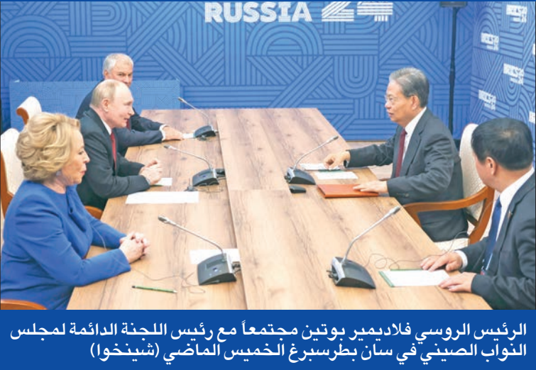
الرئيس الروسي فلاديمير بوتين مجتمعاً مع رئيس اللجنة الدائمة لمجلس النواب الصيني في سان بطرسبرغ الخميس الماضي (شينخوا)