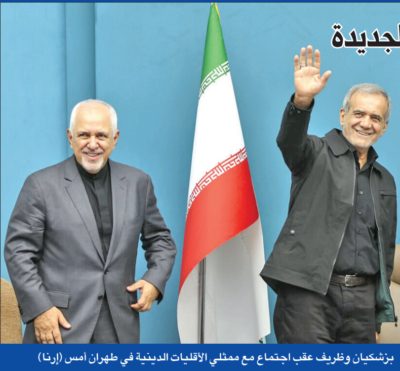
بزشكيان وظريف عقب اجتماع مع ممثلي الأقليات الدينية في طهران أمس (إرنا)

الرئيس الإيراني يلتقي العسكريين ويعيّن ظريف رئيساً للفترة الانتقالية للحكومة الجديدة