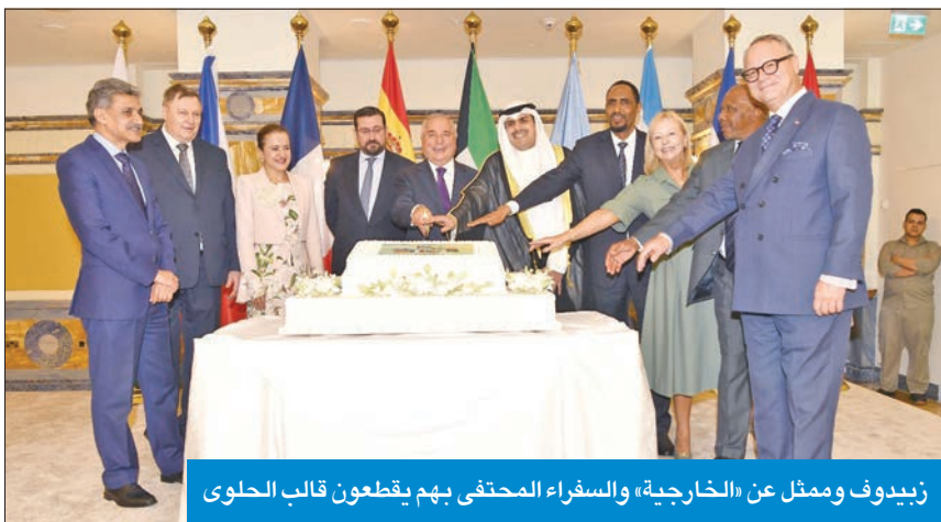
زيدوف وممثل عن «الخارجية»، والسفراء المحفّتي بهم يقطعون قالب الحلوى

علاقاتنا الثنائية خلال السنوات الماضية. تحمل علاقاتنا السياسية والاقتصادية إمكانات كبيرة لتعاون أوثق».