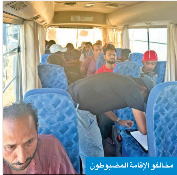
مخالفو الإقامة المضبوطون

أصدرت وزارة الداخلية، ممثلة في الإدارة العامة لخفر السواحل، قراراً يلزم جميع القطع البحرية الموضحة بالقرار الوزاري 410 لسنة 2024 أيا كان شكلها أو هيئتها، سواء كانت متوقفة أم متحركة بوضع جهاز التعريف الذاتي «AIS». وقالت الإدارة العامة لخفر السواحل إن جهاز التعريف الذاتي عبارة عن جهاز لتعريف السفن عند الإبحار بذاتها وبموقعها وسرعته لإبحار سهل وأمن. وأضافت أنه يمكن شراء جهاز التعريف الذاتي من الجهات المعتمدة من قبل الهيئة العامة للاتصالات، مشيرة إلى أنه يجب على مرتادي البحر وضع الجهاز عن طريق التسجيل، وأخذ تصريح من الهيئة عبر الموقع الإلكتروني التابعاً للخطوات التالية: أولاً: يجب على المستخدم إنشاء حساب في الموقع الإلكتروني للهيئة العامة للاتصالات مع تقديم جميع المستندات المطلوبة. ثانياً: بعد الموافقة من قبل الهيئة سيتم إرسال رقم المعاملة للمستخدم عن طريق الهاتف لتتبع الإجراءات في الموقع الإلكتروني. ثالثاً: بعد الانتهاء من الإجراءات والموافقة النهائية، على المستخدم سداد الرسوم في موقع الهيئة «برج الحمراء». رابعاً: سيتم إصدار ترخيص شراء جهاز التعريف الذاتي بعد السداد خلال يومي عمل في موقع الهيئة «برج التحرير». ونوهت الإدارة العامة لخفر السواحل على المستخدمين أن يتم تشغيل جهاز التعريف الذاتي «AIS» عند الإبحار، وفي حال إطفائه لأي غرض لا يعرض المستخدم للمخالفة بما يعادل «500» دينار. وقالت «خفر السواحل» إنها تتبنى لمرتادي البحر إبحاراً آمناً مع الالتزام بالقوانين والنظم البحرية، مشيرة إلى أن الإدارة العامة لخفر السواحل اتخذت هذا القرار، حرصاً على حماية المرتادين، وحفاظاً على أمنهم وسلامتهم.