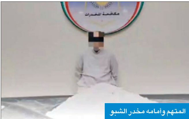
المتهم وأمامه مخدر الشبو

وذكر أنهم عثروا داخل تجاويف سرية بالأقفاص الخشبية على 25 كيلو غراماً من مخدر الشبو، مشيراً إلى أن المتهم اعترف بتهريبها إلى البلاد بقصد الاتجار، وتبلغ قيمتها السوقية 250 ألف دينار، لافتاً إلى أن رجال المباحث أحوالو المتهم إلى النيابة العامة لاستكمال التحقيق معه.