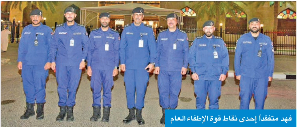
فهد متفقد إحدى نقاط قوة الإطفاء العام

الإطفاء العام إن إدارة العمليات تلقت بلاغاً ظهر أمس يفيد باندلاع حريق في عدد من الشاليهات بمنطقة الضجيج، مشيرة إلى أنه فور تلقي البلاغ، تم توجيه مراكز إطفاء الفروانية والعارضة الحرفي وصحان إلى الموقع بقيادة اللواء فهد، ونائبه لقطاع مكافحة بالتكليف، العميد أحمد هاب.