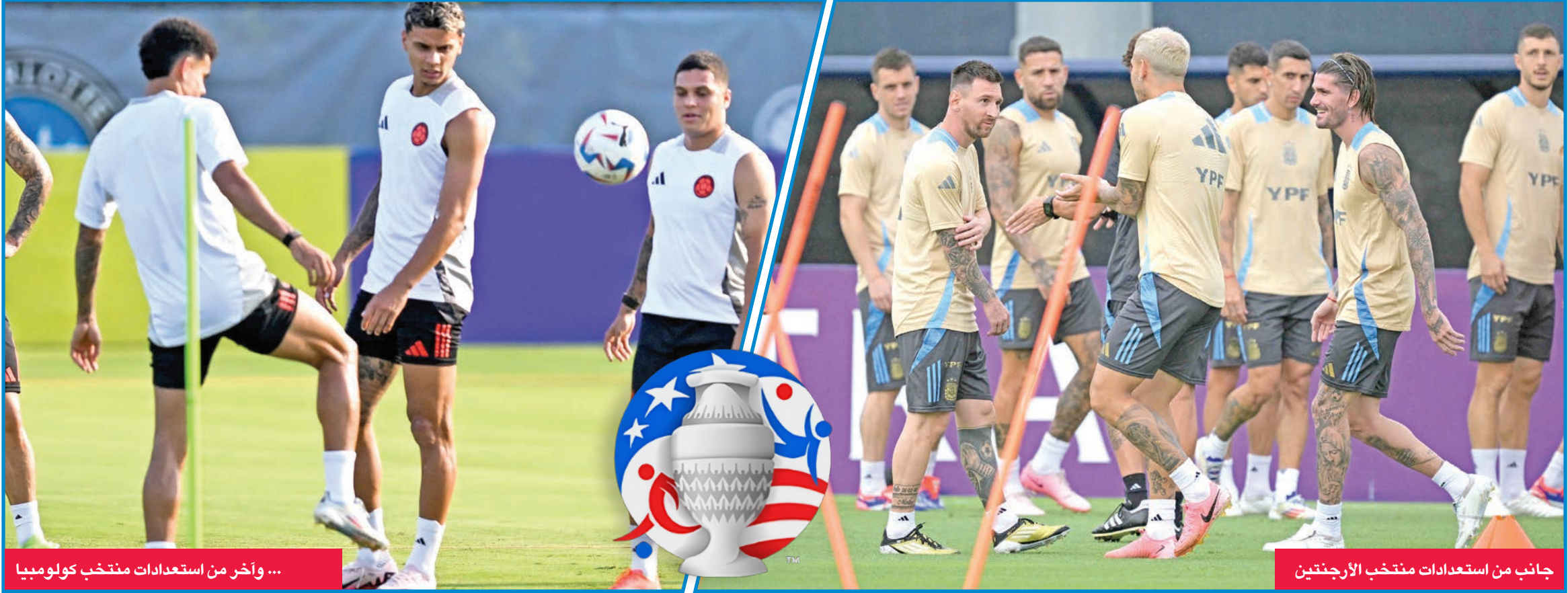
... وآخر من استعدادات منتخب كولومبيا