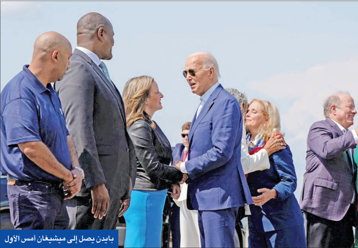
بايدن يصل إلى ميشيغان أمس الأول

الرئيس الأمريكي «على ما يرام»... وأوباما وكلينتون لإجباره على الانسحاب بعد تجميد التبرعات