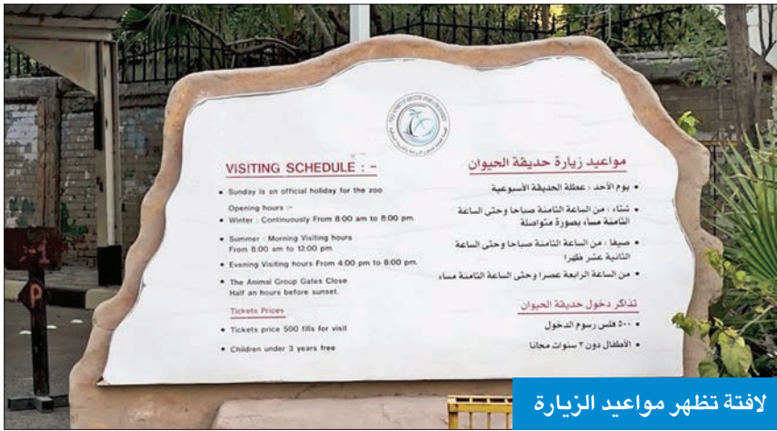
لافتة تظهر مواعيد الزيارة

نهايتها جاءت بعد تأكيد مديرها في 2020 تهالك أغلب مرافقها وحاجتها لصيانة بـ 232.073 ديناراً