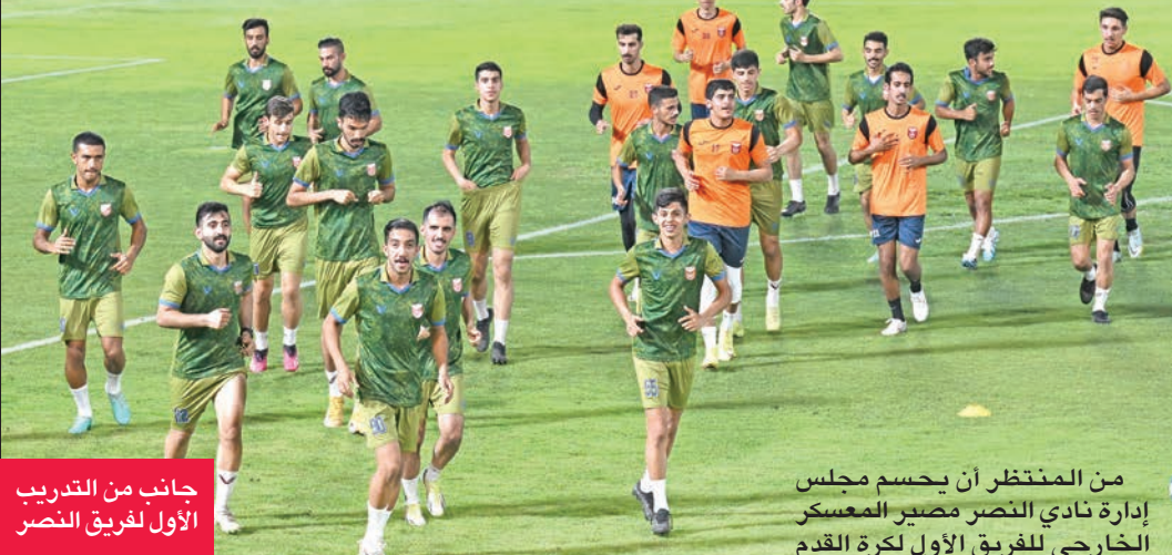
جانب من التدريب الأول لفريق النصر